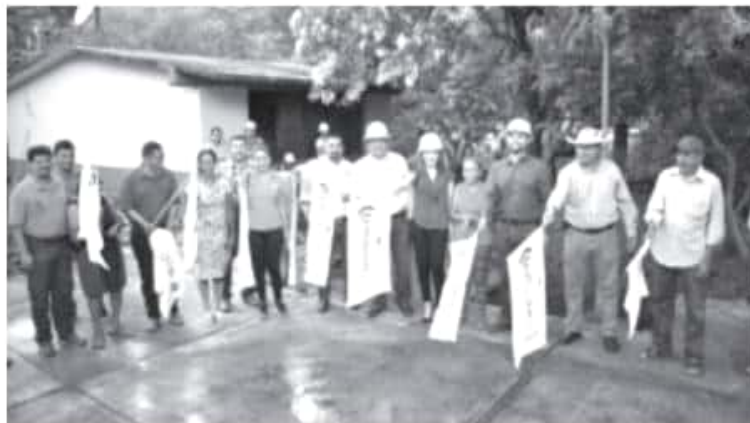
Celebro que a esta localidad rural que estaba incomunicada, hoy tenga esta nueva carretera, así como las obras y más acciones que estamos gestionando para que mejoren las condiciones de vida de la población.

Destacó que gracias a la infraestructura carretera El Ranchito que se encuentra enclavada en la sierra, ahora la población se podrá trasladar con mayor facilidad, ya que por años padecieron dificultades cuando se presentaban casos de emergencia.