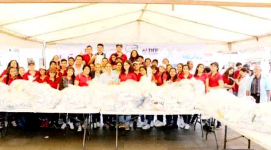
LOS REYES, MICH.- Con éxito se llevó a cabo la decimoquinta colecta de medicamentos del Cobaem Los Reyes.