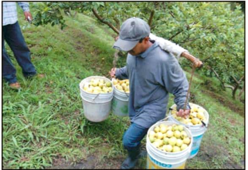
SE REDUCIRÍA CASI EN UNA TERCERA PARTE EL RECURSO DE LA FEDERACIÓN PARA EL DESARROLLO EL CAMPO.

Respecto a Michoacán, aseveró que se podrá en riesgo la agricultura comercial, ya que el nuevo presupuesto dismantela el tema de la comercialización, la sanidad e inocuidad y a la concurrencia con los estado les dan cero; a la productividad pesquera 70% menos; mientras que al fomento a la agricultura como investigación, innovación y desarrollo, menos del 96% y dismantelan las consejerías agropecuarias en el mundo.