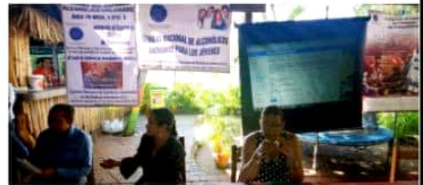
CD. LÁZARO CÁRDENAS, MICH.- La Central Mexicana de Servicios Generales de Alcohólicos Anónimos, A.C., realizará en la cuarta semana de septiembre, la SNAAJ.