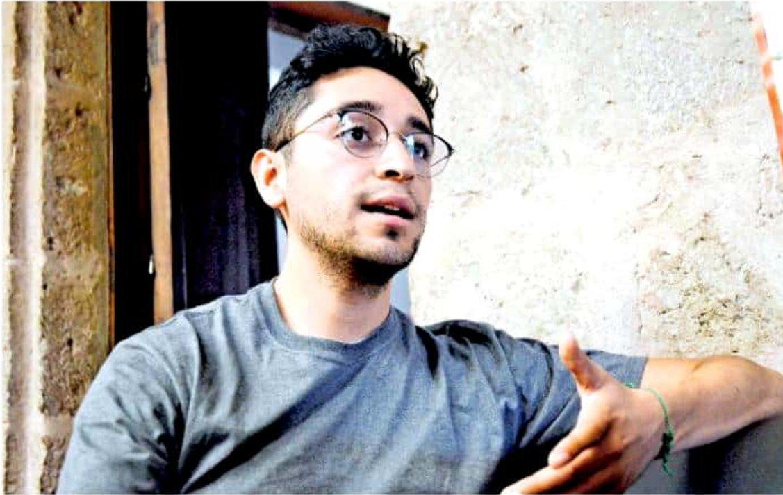
Morales Hernández actualmente está cursando una maestría en el Conservatorio de Maastricht, en los Países Bajos. /CARMEN HERNÁNDEZ