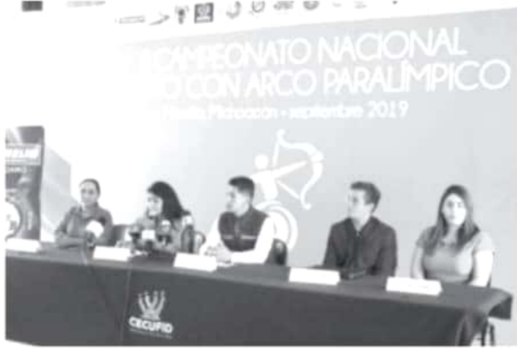
El evento cuenta con el aval de la Federación Mexicana de tiro con arco, afiliada a la World Archery y al Comité Olímpico Mexicano, además de la Asociación Michoacana de la disciplina.

-Nuestro Estado ratifica estatus como destino ideal de eventos nacionales e internacionales, y se estrena como sede del máximo certamen de tiro con arco paralímpico en México, en el que participarán 50 arqueros de todo el país