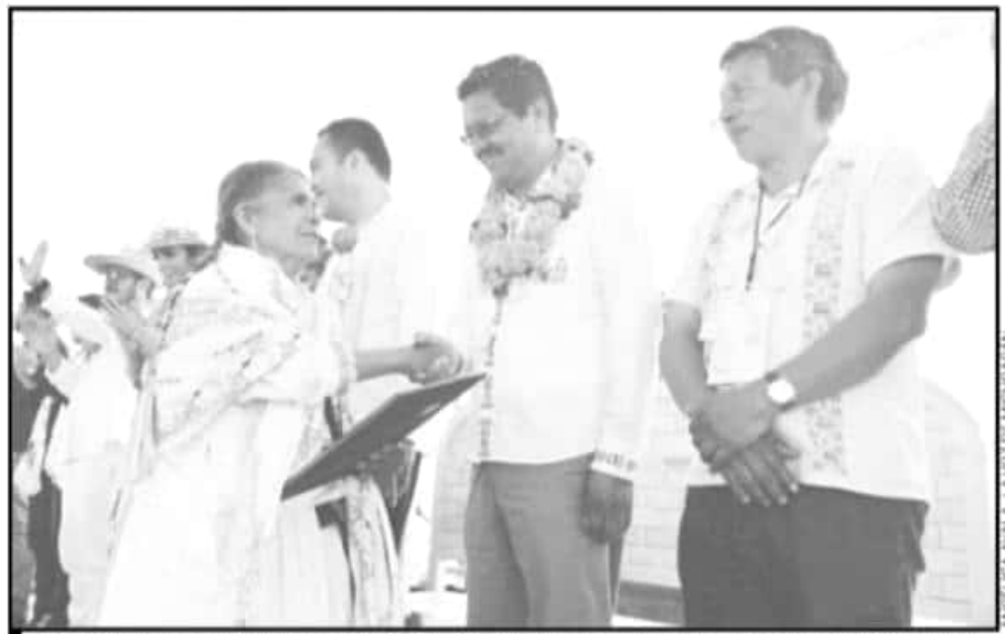
EN SANTA CLARA DEL COBRE SE ENTREGARON RECONOCIMIENTOS A LOS ARTESANOS MICHOACANOS, EN SU DÍA.