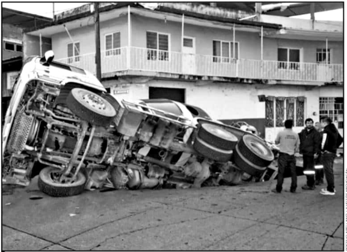
LA MAÑANA DEL VIERNES, UN CAMIÓN REVOLVEDORA FUE, LITERALMENTE, TRAGADO POR UN SOCAVÓN EN LA GLORIETA A MELCHOR OCAMPO, DE URUAPAN.

la temporada de precipitaciones pluviales, suman en Uruapan, del mes de mayo a la fecha, 95 hundimientos cuyas dimensiones van de los 2 o 3 metros longitud hasta los 10 metros con profundidades que han llegado a más de 30 metros con afectaciones, hasta ahora a más de una decena de propiedades de manera parcial o total.