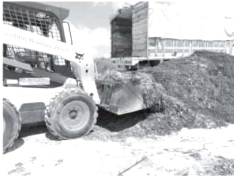
Las pruebas en laboratorio dieron positivo que si se puede obtener energía a partir del sargazo, ahora falta hacerlo en la práctica y si da positivo, el siguiente paso será a nivel industrial.

H. Zitácuaro Michoacán, 18 de septiembre de 2019.- Por: Guadalupe Solache Rebollo. Con el objetivo de producir biocombustible, así como energía eléctrica y calorífica para toda la Riviera Maya, en la planta de biogás que se encuentra en la comunidad de Camémbaro, a partir de hoy comenzaron pruebas con sargazo, proveniente de Tulum. Por el momento estas acciones comenzaron con 15 toneladas de este material que llegó la tarde de este martes.