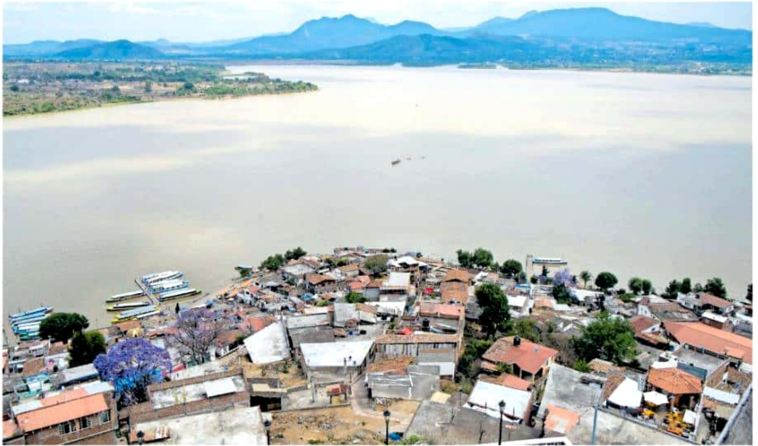
Durante los años 2016 y 2018 no se destinó un solo peso al saneamiento y recuperación del agua en la cuenca del lago