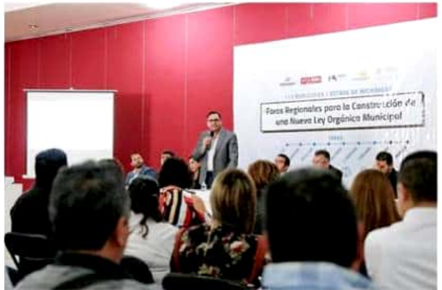
La realización del séptimo foro regional "Hacia la construcción de una nueva Ley Orgánica Municipal", realizado en Zitácuaro, fue todo un éxito.