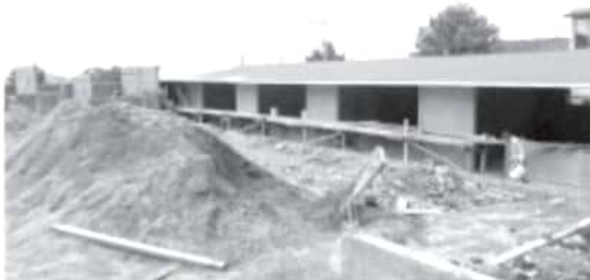
Existe gran alegría por los alumnos de dicha institución educativa, así como por los padres de familia, ya que pronto tendrán unas instalaciones dignas.

Agradeció a todas las personas que están haciendo posible que la tenencia de Ziráhuato cuente con su escuela primaria en buen estado, ya que ésta en especial se ubica en el centro del poblado y además era la que tiene mayor capacidad de atender a los niños y niñas.