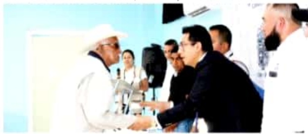
LOS REYES, MICH.- Exbraceros reyesenses recibieron su orden de pago para un apoyo económico.

Recordó que el Programa Bracero funcionó entre 1950 y 1964, por lo que muchos de quienes formaron parte de él ya fallecieron, lo que no implica que el apoyo se pierda, pues lo pueden cobrar sus hijos o hermanos; solo deben ponerse de acuerdo para nombrar un representante ante notario público y realizar los trámites. A quienes no aparecieron en la lista, los invitó a acudir a su oficina para volver a meter los documentos a la espera de una respuesta favorable.