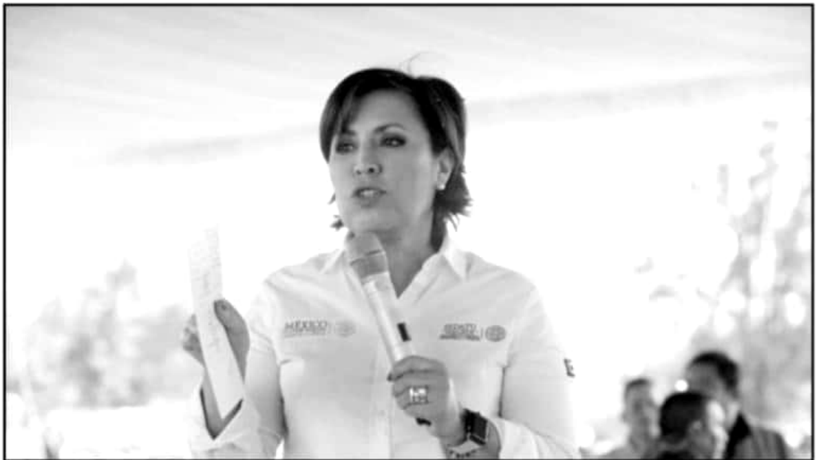
HACE UNOS MESES, ROSARIO ROBLES FUE SOMETIDA A PROCESO POR DESVÍO DE RECURSOS. ES, HASTA EL MOMENTO, LA ÚNICA FUNCIONARIA DETENIDA

Finalmente, hizo mención de que la "Estafa Maestra" requirió de un trabajo de 12 meses por parte de un equipo especializado de periodistas, mientras que la plataforma "Diorama", que alberga bases de datos de diferentes entes de gobierno y aún está en fase "beta", permitirá realizar los mismos hallazgos aproximadamente en cinco minutos.