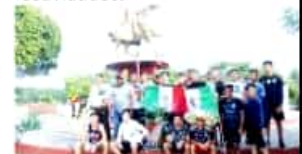
CD. LÁZARO CÁRDENAS, MICH.- La comunidad de Acalpican de Morelos se dice preparada para celebrar este próximo 30 de septiembre, las tradicionales fiestas por el 254 aniversario del natalicio de José María Morelos y Pavón.

Para el 30 de septiembre se contempla la realización de un acto protocolario de cierre de actividades, el cual arrancará con el tradicional desfile, en el que participarán al menos 50 planteles educativos de la región, y se tendrá la presencia de autoridades municipales y militares y posteriormente la presentación de un grupo musical para el cierre de estas festividades.