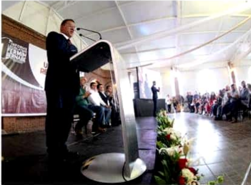
El diputado Fermín Bernabé Bahena, se comprometió a coadyuvar desde el Congreso local, en la pacificación de Michoacán.