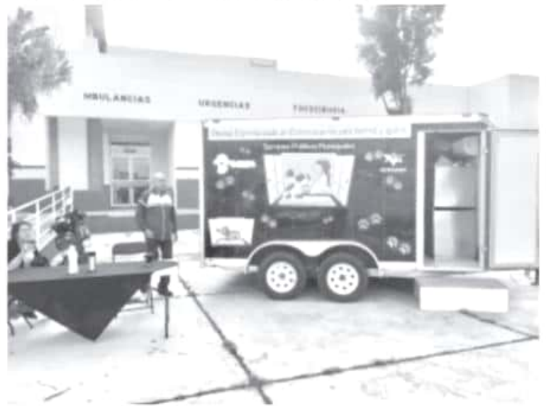
Los ciudadanos deben estar atentos a los lugares a los que llegará la unidad móvil, ahí pueden acudir, sacar cita y se esteriliza a su mascota sin ningún costo.

"La campaña la vamos a terminar el 31 de octubre y después arrancaremos otra segunda etapa con un calendario en donde vamos a considerar lugares que no hemos visitado y también vamos a considerar algunas tenencias", dijo Mancilla García