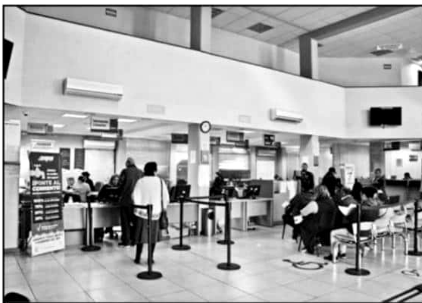
DE APROBARSE EL AUMENTO, SERÍAN LOS USUARIOS LOS QUE 'CARGARÍAN' CON LA NÓMINA DEL SINDICATO DEL OOPAS.

como cuota fija de uso doméstico: Nivel 1 62.30 pesos; Nivel 2, 114.50; Nivel 3, 176.00; Nivel 4, 392.50; Comercial, 887.50; Industrial, 968.00; Oficial, 1,435.50; y Asistencial, 891.50 pesos.