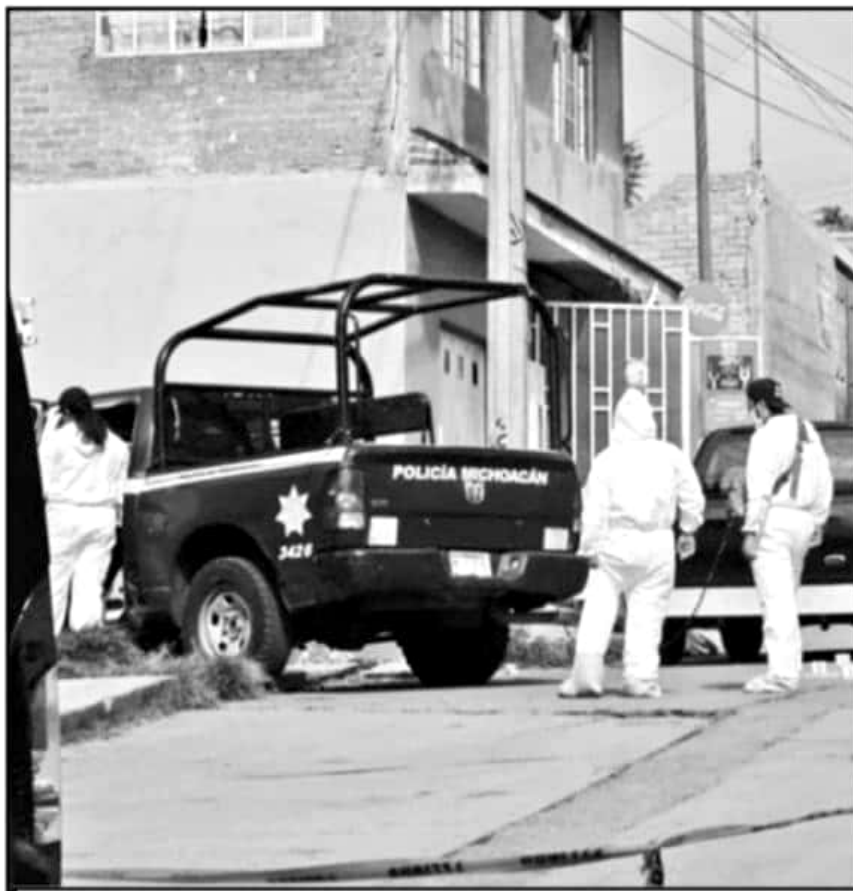
AGENTES ESTATALES HAN SEÑALADO QUE NO SE CUENTA CON LAS GARANTÍAS SUFICIENTES EN SU DESEMPEÑO.

No son sólo los estatales, a mitad de este 2019, una joven mujer, elemento de la Policía de Morelia, también fue abatida por