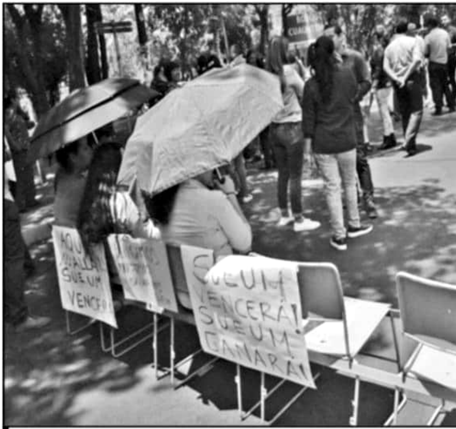
SINDICATOS DE LA UMSNH SE RESISTEN AL AJUSTE AL SISTEMA DE PENSIONES. REQUISITO PARA APOYO FEDERAL.

Expuso que la intención es que puedan tenerse avances, "ya hubo con las presentaciones, una propuesta del rector