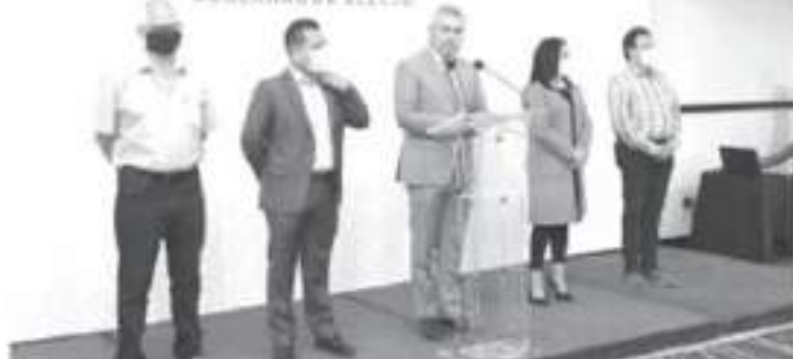
Bedolla dijo que ya se proyectaron posibles ubicaciones para traer las oficinas del IMSS a Morelia, dando se generarían alrededor de 2 mil 600 empleos en una primera etapa.

Morelia, Mich., a 19 de julio del 2021 -En menos de un mes, el gobernador electo de