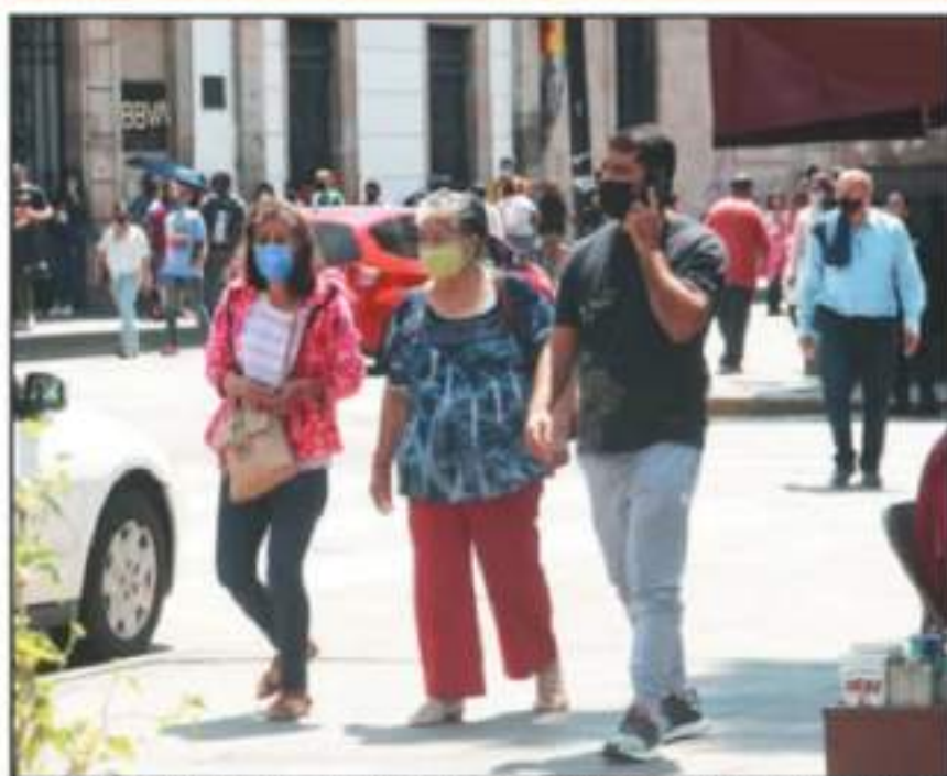
YA SEA POR CUESTIONES DE TRABAJO, FAMILIARES Y HASTA DE TURISMO, MUCHA GENTE PRESENTA FUERTE MENDACIA

ridades es que las vacaciones, y con ello el arribo de turistas, sirvan como vector para propagar la enfermedad en más regiones del estado e incluso llevar la enfermedad del coronavirus a otras entidades.