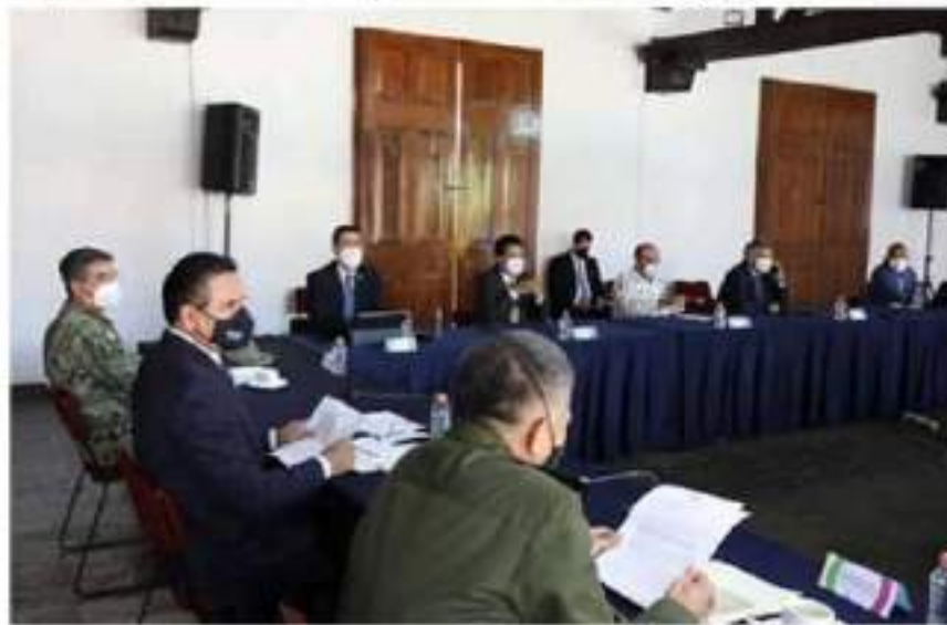
Estrategias coordinadas fortalecen combate a la delincuencia; "Hay que entrarle todos parejo": Gobernador.