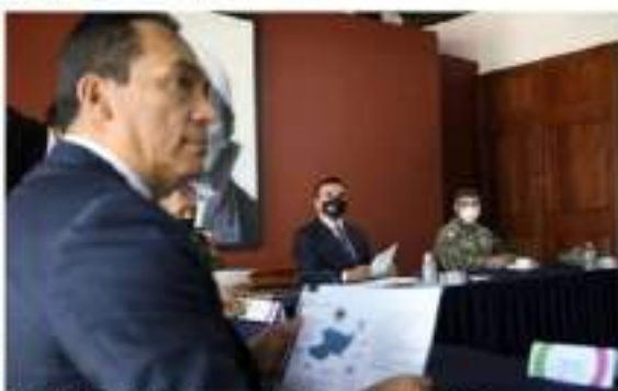
MORELIA, MICH.- En la reunión de evaluación del Grupo de Inteligencia Operativa de la Mesa de Coordinación para la Construcción de la Paz, el gobernador Silvano Aureoles pidió estrechar la coordinación interinstitucional para abatir índices de criminalidad.