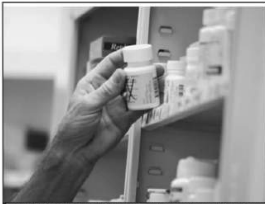
AUTORIDADES DE SALUD DEL ESTADO ARGUMENTARON QUE EL ABASTECIMIENTO GENERAL RONDA EN UNAS POR CIENTO