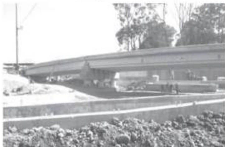
Por la obra las ventas bajaron más del 50%, actualmente se encuentran por los suelos, a la par muchos locales han cerrado sus puertas.

H. Zitácuaro Michoacán, 20 de julio de 2021 - Por: Guadalupe Solísche Rebollo. El 31 de agosto del año pasado comenzaron los trabajos de la obra de modernización de la avenida Revolución Sur, en el tramo de Leandro Valle a la desviación a la salida a Toluca. La obra estaba planeada a terminarse en 10 meses