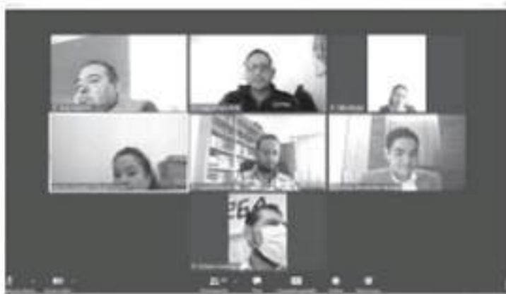
Diputados buscan incorporar nuevas fechas para la implementación del programa borrón y cuenta nueva para el pago de derechos de control vehicular y adquisición de licencias permanentes.

De lo anterior, los legisladores coincidieron al señalar que al cierre de esta legislatura, sería oportuno brindar la posibilidad de un periodo de gracia para el pago de adeudos en los cobros por derechos de control vehicular, estableciendo así que del 1 de agosto al 30 de septiembre de este año, se concluyan los adeudos en materia de refrendo y tarjeta de circulación que se hayan generado, en tanto que para el pago de derechos por licencia de vigencia permanente con clasificación de automovilista, se habilitaría desde el 16 de agosto hasta el 31 de agosto de este año, siempre y cuando se pague dentro del periodo establecido.