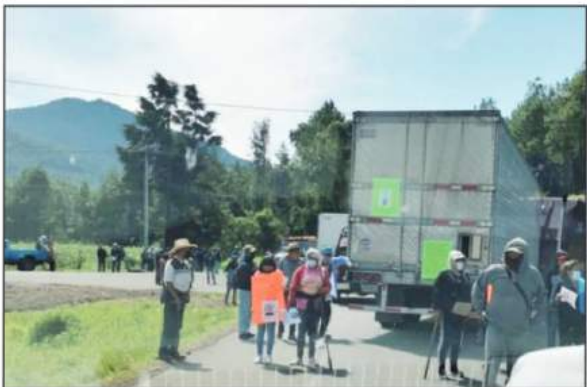
DEBIDO A LOS BLOQUEOS, LOS TRANSPORTISTAS DE PASAJEROS AFIRMAN QUE NO HADRA CORRIDAS MIENTRAS NO SE GARANTICE EL LIBRE TRÁNSITO.

De acuerdo a reportes emitidos sobre el tema por las autoridades de la Secretaría de Seguridad Pública (SSP), destacadas a las acciones de la Policía Michoacana, y del servicio de emergencia #112, los bloqueos que se mantuvieron hasta la tarde de ayer martes estaban localizados sobre la carretera federal Carapan-Playa Azul, en el tramo Paracho-Uruapan, a la altura de la desviación a Puraquecuar, en tanto un segundo se reportó sobre la carretera estatal Uruapan-Los Reyes, en el tramo San Lorenzo-Zacán, a la altura