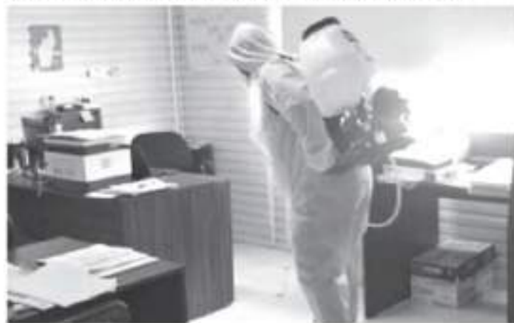
Dentro de los trabajos preventivos, se realizan trabajos de desinfección en oficinas administrativas y lugares donde se presentan mayor aglomeración de personas; asimismo, sitios de uso común.

Cabe destacar que en los inmuebles se mantiene la colocación de filtros sanitarios, la aplicación de gel antibacterial, el uso de cubrebocas, así como la difusión de las recomendaciones y medidas sanitarias a seguir para evitar contraer la enfermedad.