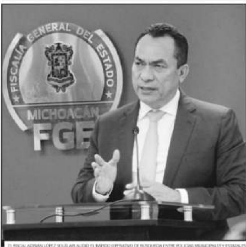
EL FISCAL ADRIÁN LÓPEZ SOLÍS ASESORÓ EL EQUIPO OPERATIVO DE BÚSQUEDA ENTRE POLICÍAS MUNICIPALES Y ESTATALES.