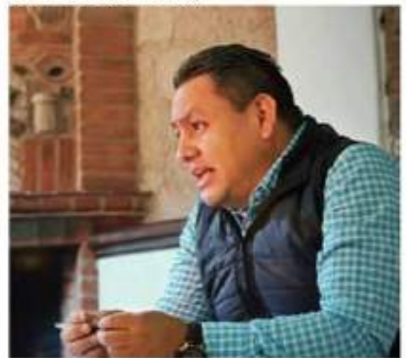
En los próximos días iniciará giras del reencuentro con la militancia: Manríquez.