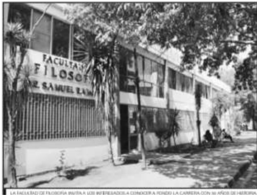
LA FACULTAD DE FILOSOFÍA INVITA A LOS INTERESADOS A CONOCER A FONDO LA CARRERA CON 50 AÑOS DE HISTORIA.