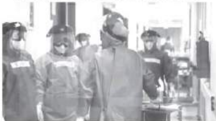
Nuestra entidad registra una letalidad por COVID-19 del 8.85 por ciento. Sólo en lo que va del mes de julio se han presentado 41 defunciones por este virus.

-Registra Michoacán una letalidad del 8.85% ante el COVID-19