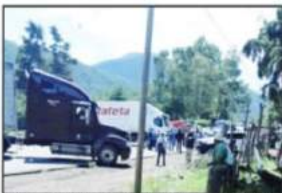
LOS PROTESTANTES BLOQUEARON CARRETERA CON UN FULGOR SECUESTRADOS.