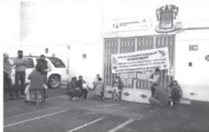
Un grupo tomó la Administración de Rentas, otro grupo, el denominado Poder de Base, se apostó en la autopista Zitácuaro-Lengua de Vaca y permitió el libre peaje a los vehículos.

Agregó que los afectados por esta falta de pago son más de 32 mil maestros que tienen plaza estatal. En los siguientes días se contemplan otras acciones más, pero se decidirán por parte de los Secretarías Generales, podrían ser toma de oficinas, carreteras y marchas.