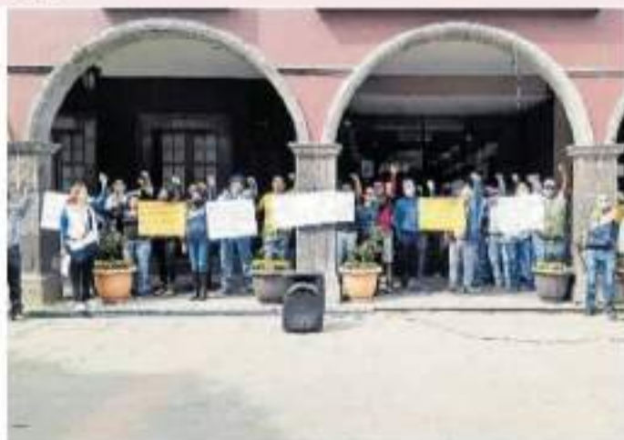
Maestros de la CNTE se movilaron en Zamora.