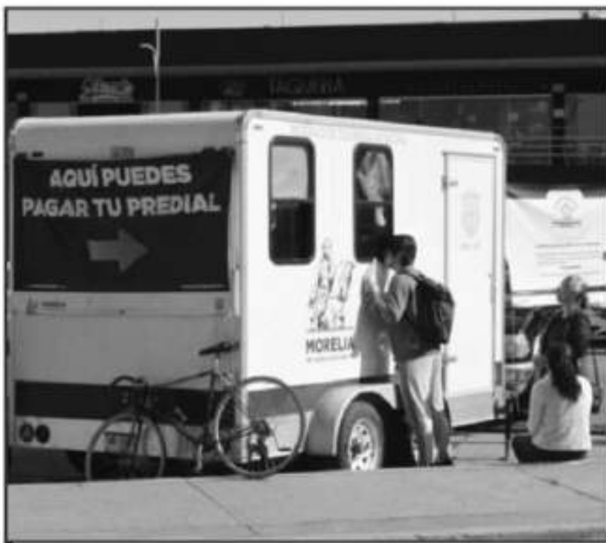
ANO CON AÑO LAS AUTORIDADES MUNICIPALES TRAZAN CAMPAÑAS DE DESCUENTOS PARA REDUCIR LA MOROSIDAD

contribuyentes cumplidos vienen y pagan de manera recurrente, los morosos se quedan en ese estado de morosidad y el porcentaje de morosos y cumplidos se mantiene de forma similar. ¿Qué quiere decir esto? Que hace falta mejorar la conciencia ciudadana de la ciudadanía, de tal forma que el porcentaje de morosos disminuya".