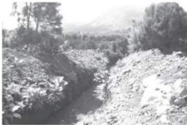
Este zanjón si ha logrado darles algo de seguridad, pero todos tienen miedo, en la lluvia de hace dos semanas cuando llovió mucho si hubo zonas a donde se metió agua.

- El año pasado construyeron una enorme zanja para el agua que baja del cerro cuando llueve