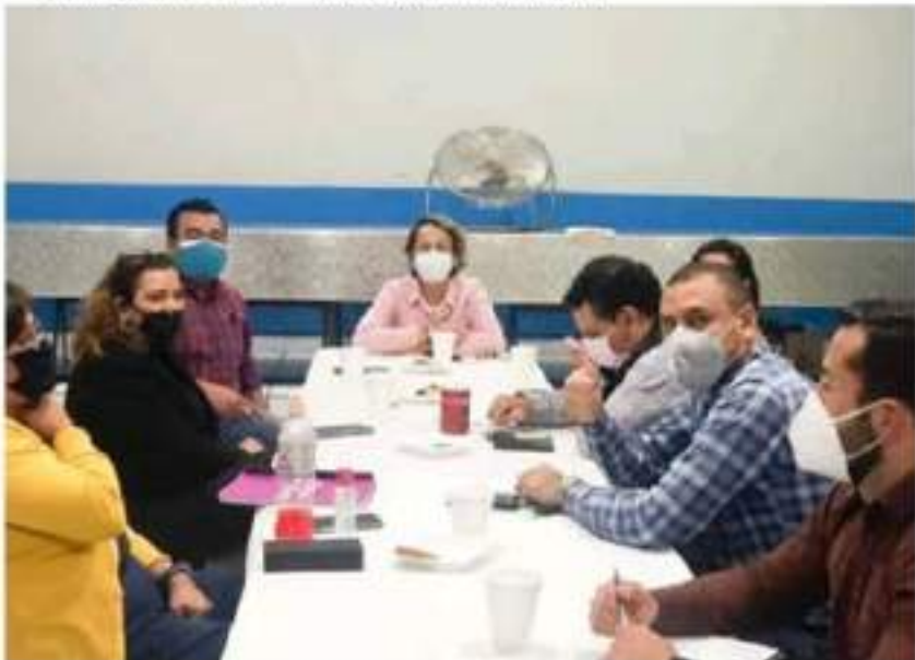
El poder político, no es compatible con la impartición de justicia: Fxm.

Cabe hacer mención, que no es la primera vez que el TEEM falta a la imparcialidad, se anexa link de otro caso donde se impulsaron intereses difusos. https://www.quadratin.com.mx/politica/teem-falta-de-certeza-juridica-no-sabe-ni-que-vota-tepjl/ .