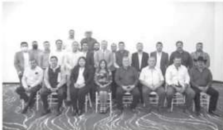
Alfredo Ramírez sostuvo un encuentro con 23 presidentes municipales electos emanados de todos los partidos políticos, a quienes reiteró que su gobierno será plural e incluyente.

Finalmente, el gobernador electo informó a los futuros ediles sobre las gestiones que ya realiza ante instancias federales como la Secretaría del Bienestar, SCT, IMSS, y el Gabinete de Seguridad, con el propósito de reconstruir la relación de Michoacán con el gobierno federal e impulsar el desarrollo del estado.