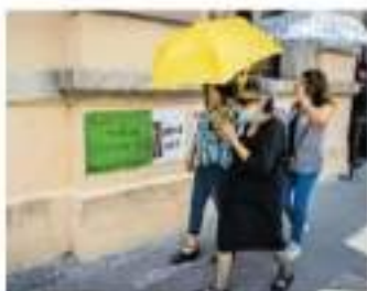
La propuesta fue elaborada por 23 colectivos michoacanos. / LUZ VERDE

En Veracruz, desde el martes 20 de julio, e Hidalgo a partir del 30 de junio, ya tienen luz verde. En el segundo estado la iniciativa fue presentada el 28 de junio y aprobada dos días después.