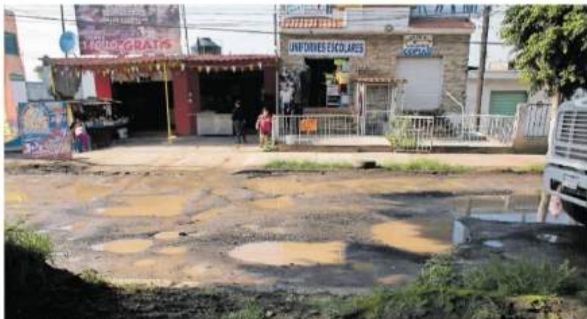
De las más de 8 mil calles que hay en Morelia, el 20 por ciento se encuentran dañadas.

La iniciativa ciudadana para despenalizar el aborto en Michoacán continúa detenida en el Congreso, a pesar de haber sido entregada desde el pasado 15 de febrero a los legisladores. Pág. 7