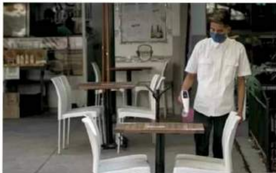
Peores cifras. En Puebla, por cada trabajador formal hay 11 en la precariedad.