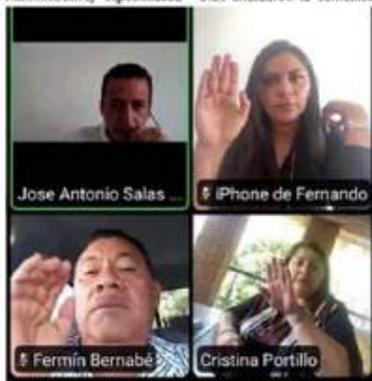
Integrantes de las Comisiones de Gobernación y de Justicia, avalaron el dictamen que instruye la convocatoria que habrá de ser votada en sesión

La invitación es a asistir a esta capacitación ofrecida gratuitamente por la empresa Agroup y la Asociación Agrícola Local de Coahuayana de Hidalgo, Productores de Plátano.