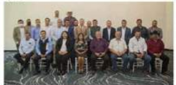
El gobernador electo se reunió con presidentes municipales electos, emanados de distintos partidos políticos.