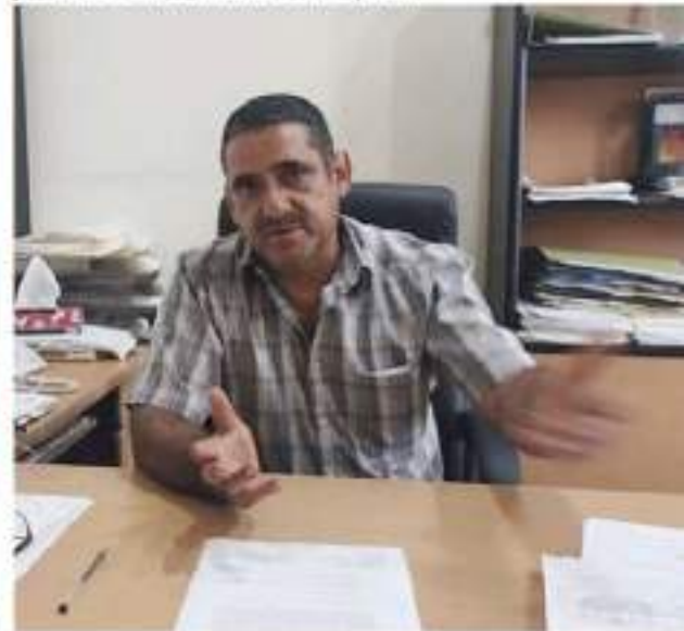
APATZINGÁN, MICH.- Aunque la especie no ha sido confirmada médicamente por autoridades de la Secretaría de Salud.