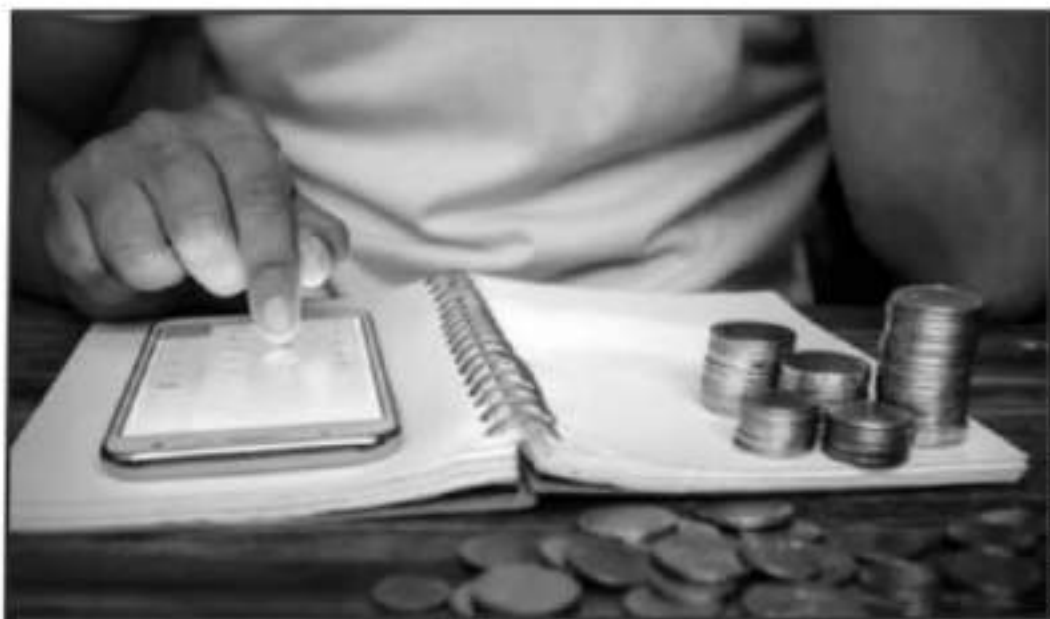
EMPRESAS BANCARIAS HAN IDEADO MECANISMOS PARA REALIZAR AHORROS EN "COCHINITOS VIRTUALES" Y DESDE TU TELÉFONO.