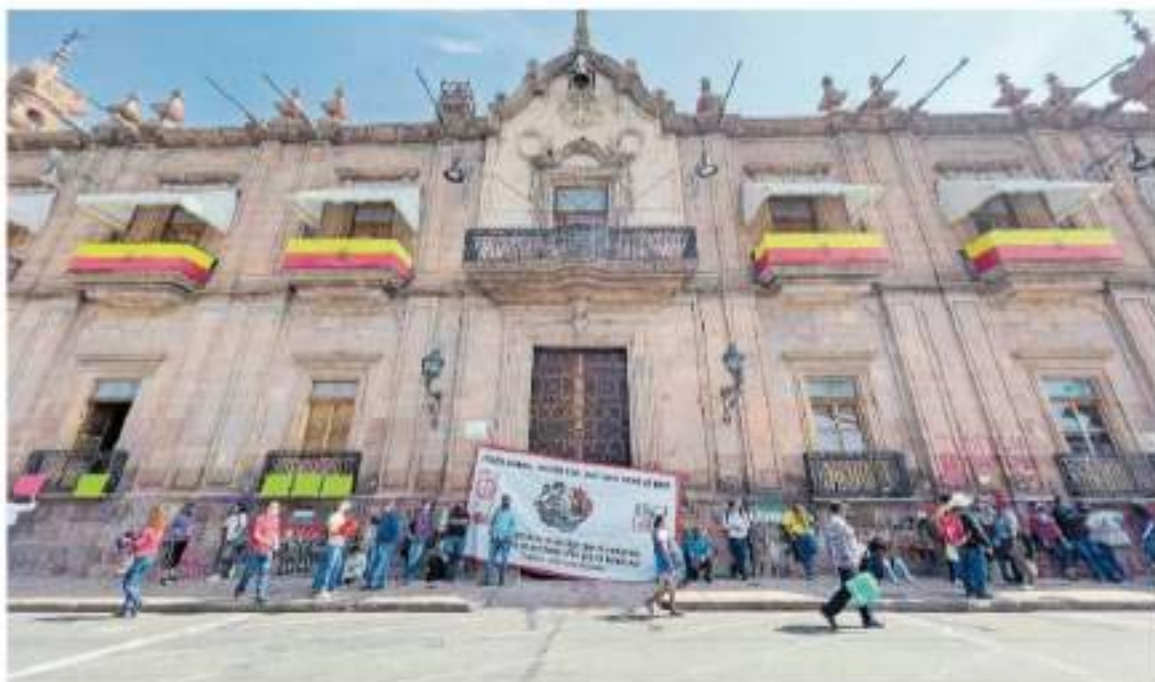
Agrupados al Poder de Base cerraron la circulación para realizar un mitin frente a Palacio de Gobierno. / SUMAN TI