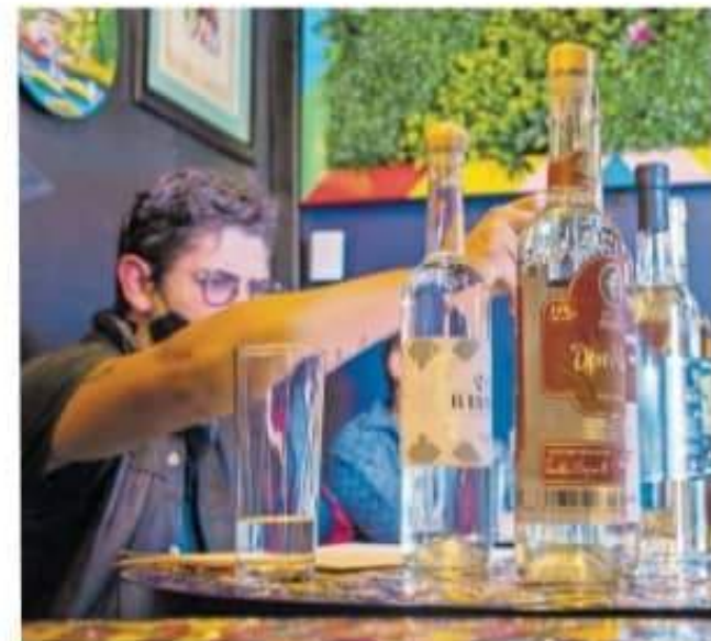
Hay planes para participar en la Semana de México en Praga