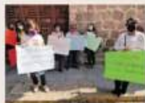
Protesta de vecinos en Palacio Municipal.