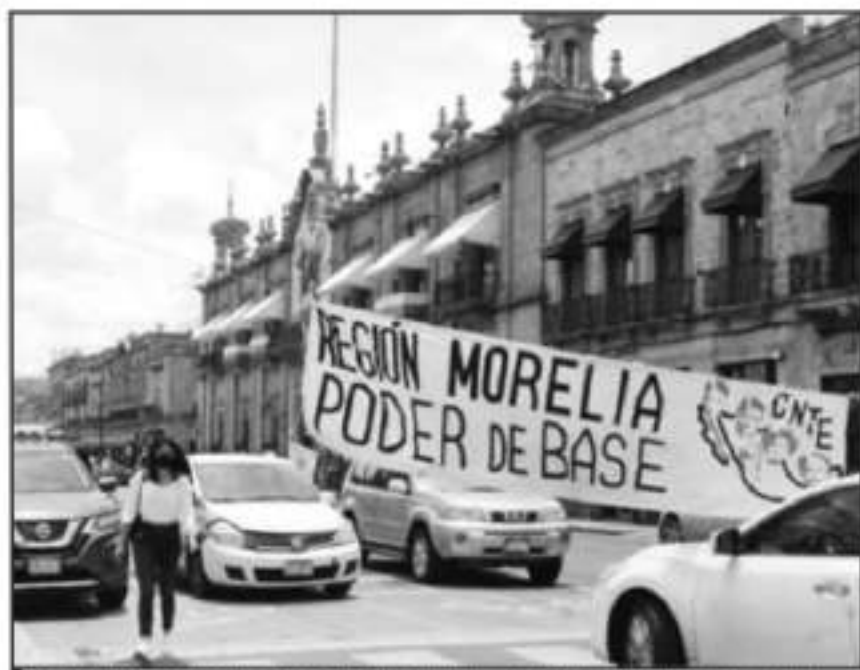
SE CANCELARON LOS BLOQUEOS EN LA CIUDAD DE MORELIA, PERO MANTENDRÁN TAMA DE LAS VÍAS DEL TREN

"Cuidemos de nuestra salud durante este receso escolar y re-