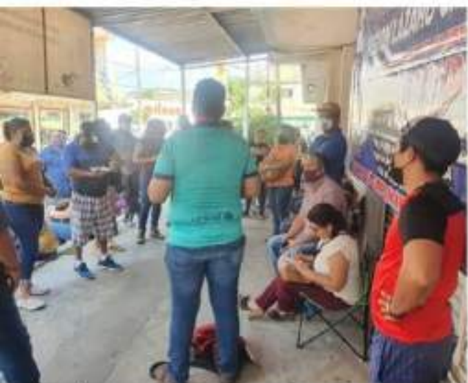
CD. LÁZARO CÁRDENAS, MICH.- La CNTE mantuvo la toma de oficinas recaudadoras del estado, incluyendo la de Lázaro Cárdenas, así como de vías férreas en el municipio de Uruapan.

En tanto, Poder de Base realizará un mitin en las afueras de Palacio de Gobierno y a nivel local, Coordinación Regional informó de una concentración masiva en el Palacio Municipal, "sin descartar acciones más contundentes que nos permitan lograr el pago a los más de 32,000 maestros", dijeron.