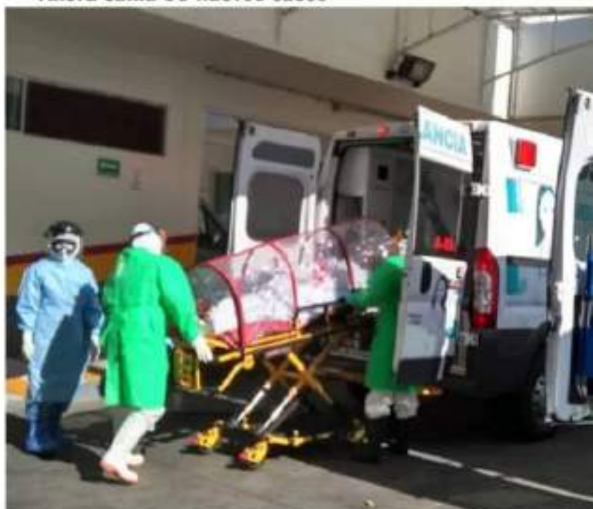
CD. LÁZARO CÁRDENAS, MICH.- Este martes, Lázaro Cárdenas sumó 38 nuevos casos de coronavirus.

Eduardo CHÁVEZ CD. LÁZARO CÁRDENAS, MICH.-