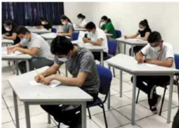
Covid-19. El uso de cubrebocas es obligatorio y la limpieza constante de las escuelas.

Dentro de las escuelas las deben instalarse dos filtros sanitarios, uno a la entrada y otro en la sala