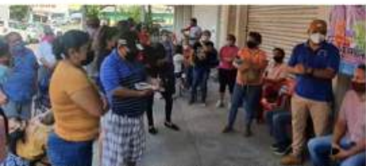
CD. LÁZARO CÁRDENAS, MICH.- La CNTE señaló que el gobierno del estado no cuenta con recursos económicos para solventar los adeudos con el magisterio.

Para este miércoles, al término de la actividad programa (bloqueo a Morelia) se celebrará una Asamblea Estatal Representativa con la estructura del CES, Coordinaciones Regionales y secretarías generales, para valorar la situación y continuar con el plan de acción.