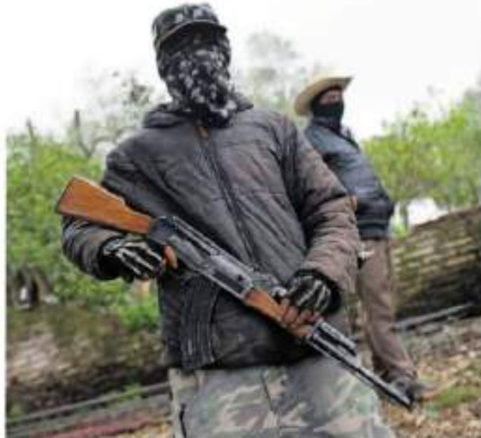
En las colonias El Barril, Buenos Aires y La Burrera se percibe más la inseguridad.

Las ocasiones anteriores donde un infante sufrió un nudo o impacto de bala era más un daño colateral. Este, por sus características, fue intencional, afirma el académico. De acuerdo al registro de hechos de 2020 a la fecha no es frecuente, es un hecho inédito que no había ocurrido así. "el mes pasado yo lo reportaba con baja importante porque mayo tuvo 59 y junio 48, pero también hacía notar que esto era una situación que no hacía una tendencia, pues ahora en julio tenemos 37 homicidios dolosos y 19 heridos, entre ellos estos menores", añadió.