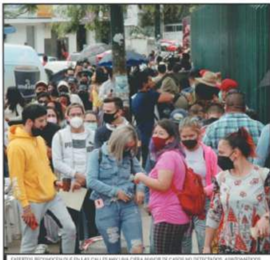
EXPERTOS RECONOCEN QUE EN LAS CALLES HAY UNA CIFRA MAYOR DE CASOS NO DETECTADOS, ASINTOMÁTICOS.

Todos los indicadores de riesgo para Bandera Roja están dados en la capital michoacana, salvo la ocupación hospitalaria,