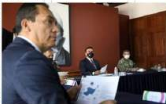
MORELIA, MICH.- En la reunión de evaluación del Grupo de Inteligencia Operativa de la Mesa de Coordinación para la Construcción de la Paz, el gobernador Silvano Aureoles pidió estrechar la coordinación interinstitucional para abatir índices de criminalidad.