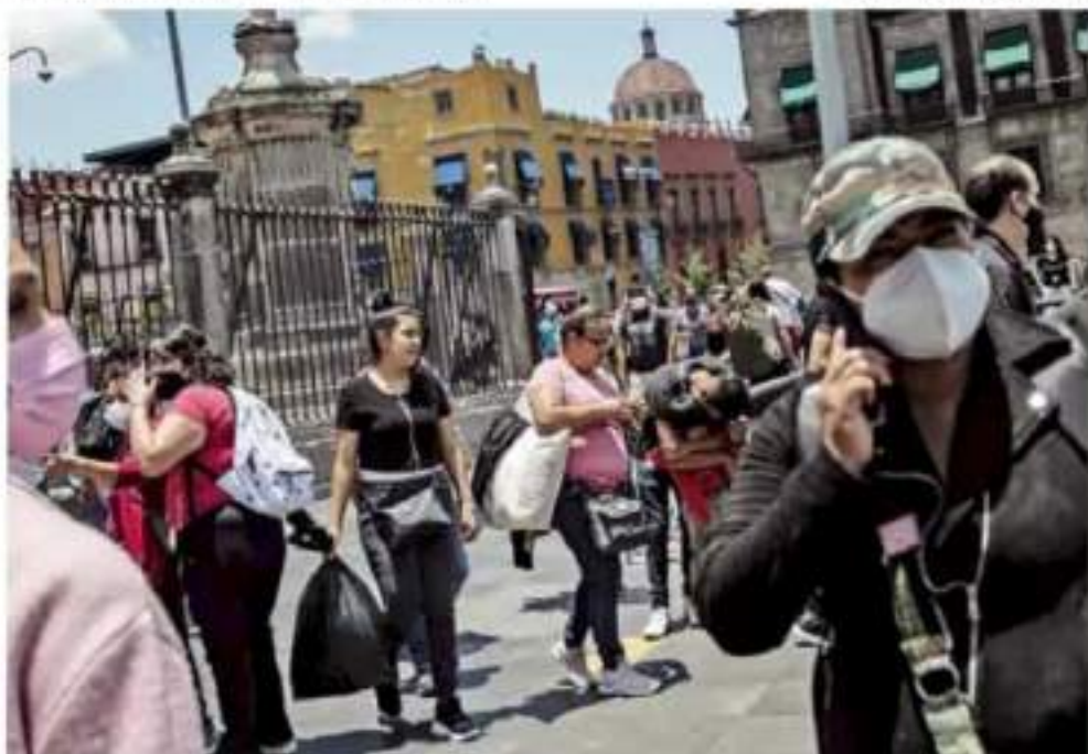
Coronavirus. Los casos estimados activos que han presentado síntomas en los últimos 14 días llegaron a 85 mil 990.

Por lo tanto, "no debe extrañar que haya espacios públicos que permanezcan abiertos aun cuando haya crecimiento de la epidemia", como en el caso de Quintana Roo, concluyó López-Gatell.