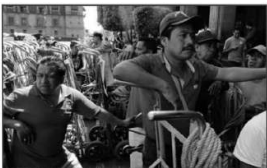
LA FALTA DE UN TRABAJO BIEN REMUNERADO Y CON PRESTACIONES ES UN TEMA OLVIDADO EN TODO EL PAÍS.

Sobre el caso Michoacán, el colectivo agrega que el 34.6% de la