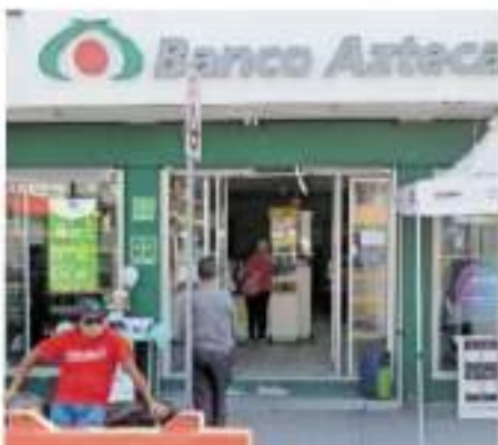
Los trabajadores de la institución financiera realizaron paro de labores. JUAN AGUIAR

El investigador social indicó que aun con la llegada de más de mil 500 efectivos no ha cesado esta situación de violencia e inseguridad, es guardada por la falta de conocimiento de los sectores poblacionales. "Ellos los militares no son de aquí, estamos hablando de que no conocen las colonias ni las tienen identificadas. Su forma de acción es en otros espacios como en las avenidas principales, la Guardia Nacional va en una trayectoria y la delincuencia en otra, no se encuentran". En consecuencia, dijo que se requiere una política que conozca las colonias, los barrios y las familias, además de que el Ejército, la Marina y la Guardia dejen de ser impasivos.