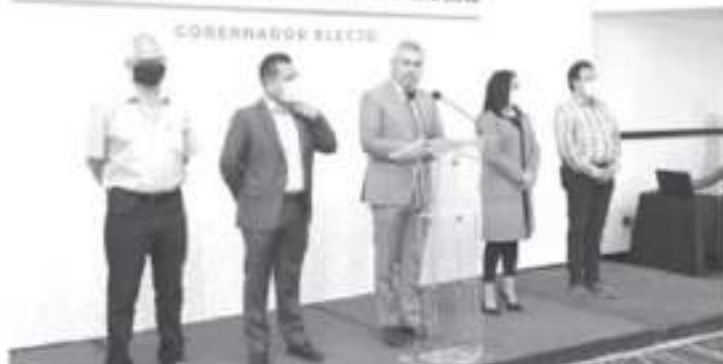
Bedolla dijo que ya se proyectaron posibles ubicaciones para traer las oficinas del IMSS a Morelia, dando se generarían alrededor de 2 mil 600 empleos en una primera etapa.

Morelia, Mich., a 19 de julio del 2021 -En menos de un mes, el gobernador electo de