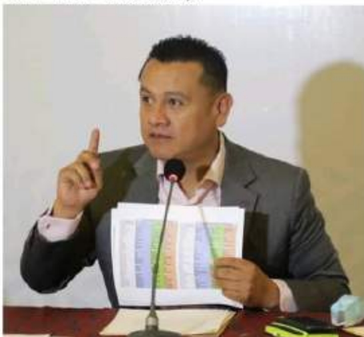
MORELIA, MICH.- El Tribunal Electoral del Poder Judicial de la Federación resolvió que es improcedente la impugnación que promovió el "Equipo por Michoacán", que buscaba revertir resultado de la elección de gobernador, informó Carlos Torres Piña, vocero del "Equipo de Transición".

Tribunal Electoral del Poder Judicial de la Federación, en la Sala Regional de Toluca, también declaró improcedente una impugnación que promovió el "Equipo por Michoacán" contra los resultados de la elección en el Distrito federal 01, "resolución que reafirma la legitimidad del triunfo de Morena, porque fueron las michoacanas y michoacanos quienes decidieron en las urnas iniciar la transformación del estado", concluyó.