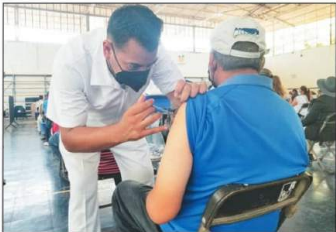
MAÑANA INICIA VACUNACIÓN DE SEGUNDA DOSIS PARA 40-49 AÑOS DE EDAD, MUJERES EMBARAZADAS Y PERSONAS REZAGADAS DE OTROS GRUPOS ETARIOS.

Detalló que la aplicación del inyectante se realizará en una primera etapa el próximo jueves 22 y viernes 23 de este mes a partir de las 8 de la mañana para luego dar paso a un receso durante el sábado 24 y domingo 25 con el fin de reiniciar la vacunación el lunes 26 y martes 27. "En caso de que no se logre atender a las aproximadamente 25 mil personas en estos días, se procederá a prolongar