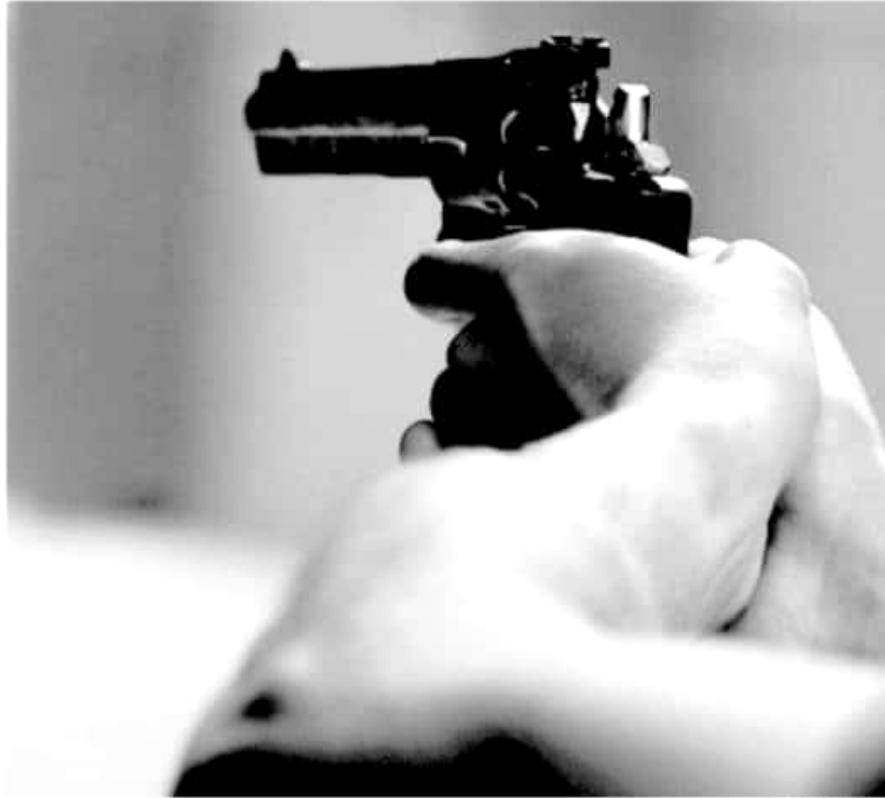
El combate a la impunidad y la generación de empleos permitirán atacar de fondo la incidencia delictiva en la entidad, advierte el Observatorio Ciudadano.

En lo que respecta a la cantidad de delitos, dijo, este aspecto se habrá de ver reflejado en el próximo reporte elaborado por el Sistema Nacional de Seguridad Pública.