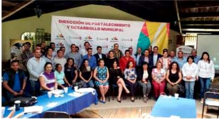
Son ya 43 municipios de la entidad que cuentan con un IMPLAN. El gran ausente hasta el momento es el de Lázaro Cárdenas.

La idea dijo por último, es tener un tecnológico bien posicionado, que el ITLAC esté en todos los foros posibles, y que de entrada encontró una ventaja muy grande en el sentido de que la mayoría de los docentes trabajó o trabajan en la industria o el sector empresarial, lo que es una ventaja que se debe de aprovechar muy bien.