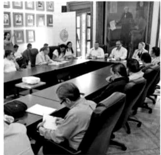
ZAMORA, MICH.- El aprovechamiento de los residuos sólidos urbanos y orgánicos en la generación de material ecológico para la construcción de viviendas, podría ser una realidad en el Estado.

Dicha propuesta será presentada ante los cabildos para su valoración y, de ser aprobada iniciarían los trabajos de gestión de recursos para su instalación.