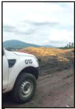
BUSCA LA PROAM EL MANEJO ADECUADO DE RESIDUOS SÓLIDOS.

Con esta acción se pretende aprovechar las más de 500 toneladas de residuos de mango que se generan diariamente durante los meses de junio julio y agosto en el Valle de Zamora, evitando así la contaminación de los mantos freáticos y la proliferación de fauna nociva.