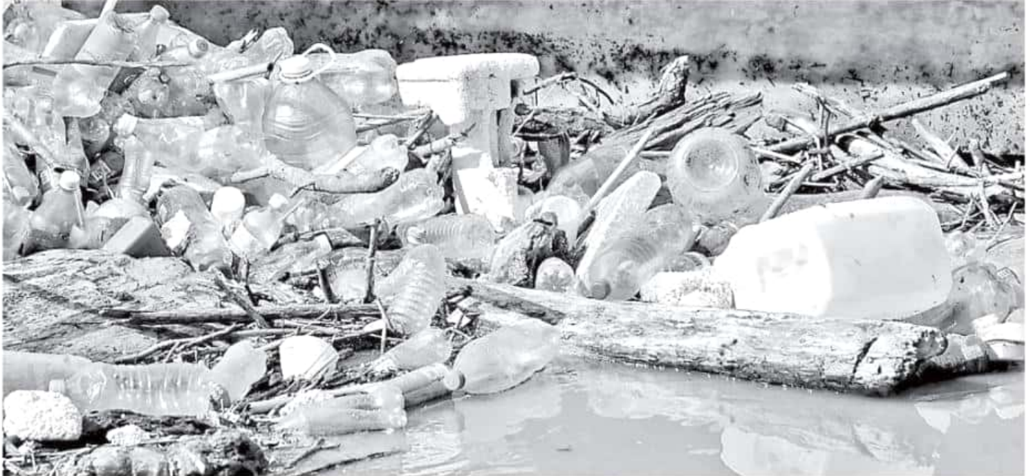
Algunos regidores entrevistados han manifestado disposición para replicar la reglamentación en el uso de desechables de plástico y unicel. FERNANDO MALDONADO

estatal, espera se vaya sumando mayor información sobre las alternativas, "ya que generalmente los productos biodegradables se van al extranjero y no a los negocios locales para que se empiecen a utilizar y familiarizando con los negocios y sus comensales."