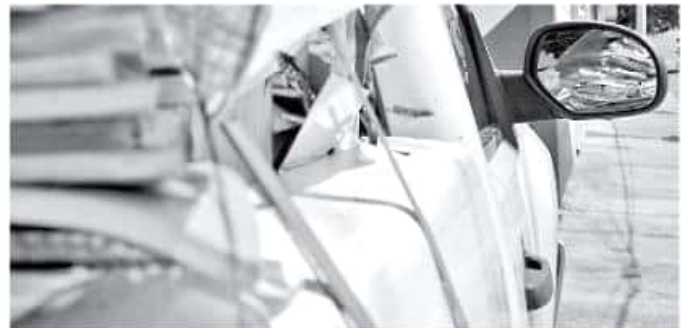
Reciben todo tipo de papel que se desecha al término de un ciclo escolar, con la meta de recaudar 70 toneladas. FERNANDO MALDONADO

Para sumarse a la campaña de "Magia en los corazones" y abonar a cambiar la vida de algunos niños que padecen cáncer, los donativos de papel pueden llevarse a Juan Escutia 660, colonia Chapultepec Sur, en un horario de 9:00 a 17:00 horas. Como comunidad educativa también pueden organizar una colecta masiva que puede ser recaudada por los integrantes de la asociación, y para ello se puede solicitar información al 3 56 64 98