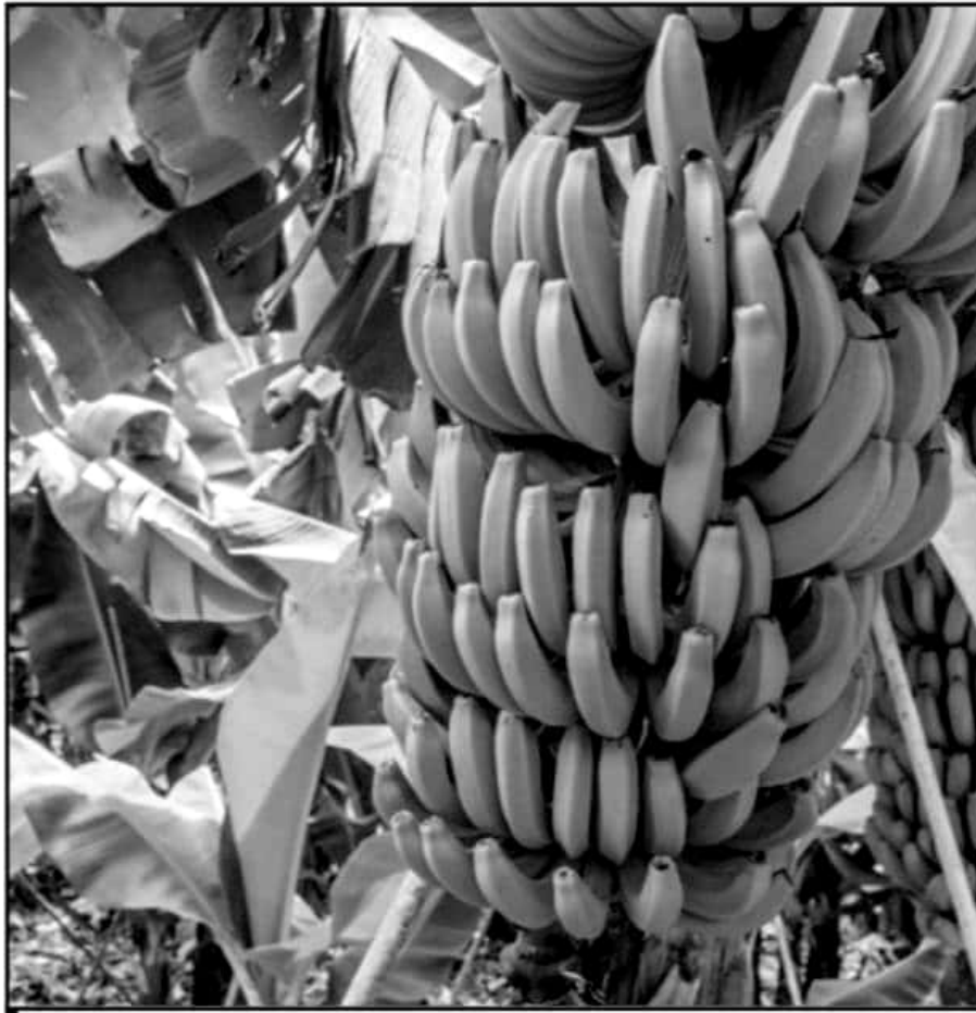
LA TESIS DETALLA EL ORIGEN DE LA VARIEDAD DE ESPECIES DE PLÁTANO. LEGADO DE DON VASCO DE QUIROGA.

por la investigación en Ziracuretiro, las primeras cinco variedades de plátano conocidas como castillón, guineo, morado, enano y tabasco, fueron introducidas por el protector de los pueblos originarios, así mismo desde Michoacán se llevaron al resto de la Nueva España, para después dar pie a otras muchas variedades.