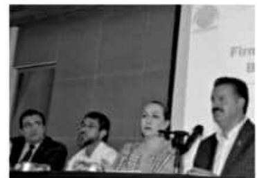
MORELIA, MICH.- La Secretaría de Medio Ambiente Cambio Climático y Desarrollo Territorial (Semaccdet) y la Dirección de Patrimonio, firmaron el convenio para reforestar, planear, preservar y supervisar el área natural protegida.