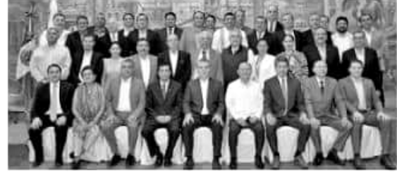
MORELIA, MICH.- El Colegio de Educación Profesional Técnica del Estado de Michoacán, Conalep, será sede de la Trigésima Sexta Reunión Nacional de Directores Generales de subsistemas estatales.

A la fecha, se han celebrado 35 de estas reuniones, la última en marzo del presente año en Jalisco, como parte del programa de trabajo de Conalep que trazó las guías para una educación integral y el fortalecimiento del sistema académico a través de la innovación, así como ampliar la cobertura, elevar la calidad y la igualdad en la Educación Media Superior.