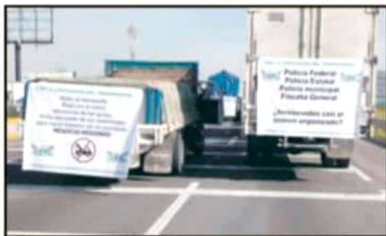
TRANSPORTISTAS HAN COLOCADO LONAS A MANERA DE PROTESTA.