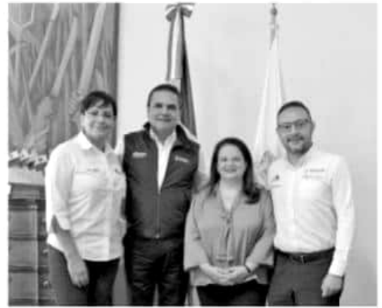
MORELIA, MICH.- La comisionada nacional de Protección Social en Salud, Ivonne Cisneros Luján, reconoció el esfuerzo del Gobierno del Estado, que encabeza Silvano Aureoles Conejo.

Agregó además, la certificación del 90 por ciento de los servicios de salud, así como el abasto de medicamentos en el Estado, el pago puntual del personal que labora en la Secretaría y la capacitación de médicos encargados de la consulta a la población.