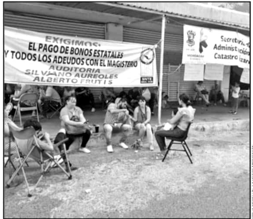
DESDE HACE TRES DÍAS MAESTROS TIENEN TOMADAS LAS OFICINAS DE RENTAS EN EL PUERTO DE LÁZARO CÁRDENAS.

Comentaron que el encargado de la política interna de Michoacán dijo que el gobierno estatal está