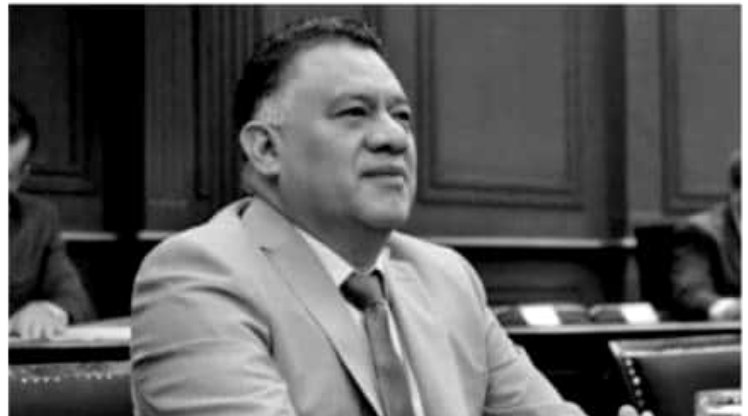
MORELIA, MICH.- Las políticas exteriores y migratorias que está construyendo el Gobierno Federal, ponen en evidencia el compromiso que mantiene el presidente Andrés Manuel López Obrador con el desarrollo y fortalecimiento de las relaciones internacionales que se tienen proyectadas para México.

Subrayó que los avances en la relación con Estados Unidos se traducen en la disposición de negociación mostrada por el presidente Donald Trump, quien además de reconocer la voluntad política del titular del Ejecutivo Federal, solicitó una reunión directa para dialogar respecto a los progresos y proyecciones del T-MEC. "La capacidad mostrada por nuestro presidente de la República al construir nuevas y mejores alianzas con Estados Unidos y Canadá, transmiten calma para transitar al desarrollo que demanda el pueblo mexicano", enfatizó.