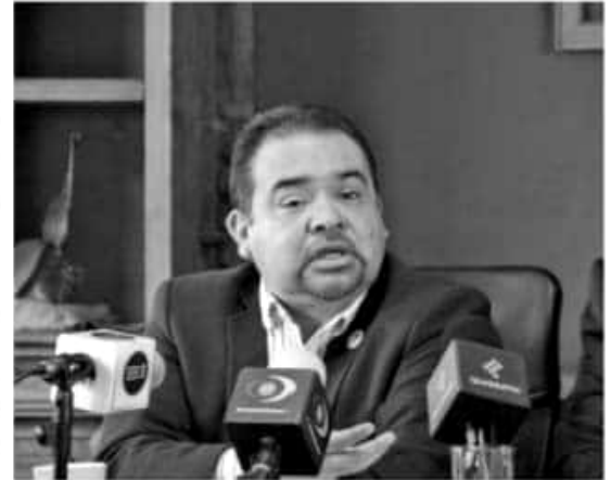
MORELIA, MICH.- Michoacán ya no puede permitirse daños colaterales como el cierre de empresas y la pérdida de empleos por los colapsos en el Sector Educativo.

"No podemos apostar por la espera o la esperanza para que la Federación reaccione, no podemos exponer al Estado y a los michoacanos a que más empresas sigan cerrando y se pongan en riesgo más empleos, por lo que las determinaciones que se tomen, por más duras que resulten no pueden ser postergadas", puntualizó.