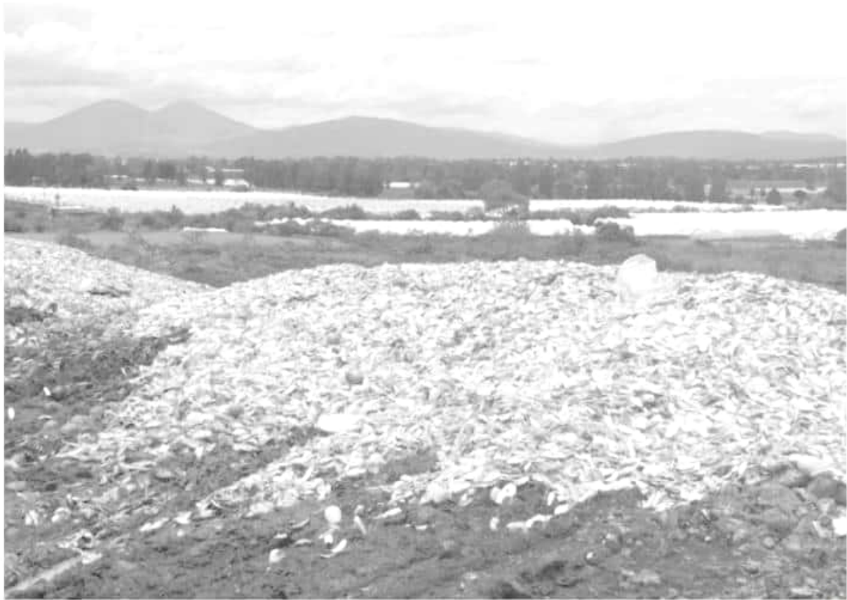
Al menos 50 mil toneladas de desechos orgánicos de mango y otros productos contaminan el medio ambiente en los municipios de Zamora y Jacona.

Actualmente, 34 centros Prefeco, subsistema creado por decreto presidencial emitido por el general Lázaro Cárdenas del Río y que consta de 98 escuelas radicadas en 20 entidades del país, están interesados en participar en la intervención del ANP Piedra del Indio, en tanto que escuelas radicadas en otros estados, como es el caso de Hidalgo, prevén replicar este esquema de colaboración en sus entidades.