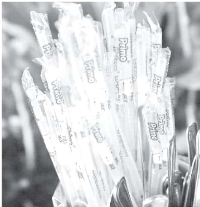
Canirac ha buscado poner su granito de arena para la protección de la naturaleza con la reinstalación de la campaña "Sin popote es mejor". LAZARO MORALES

Desde su opinión, mencionó que en el caso del precedente que se sentó en el municipio de Pátzcuaro está teniendo buena aceptación, pero fue reiterativa en el sentido de que tanto para el resto de demarcaciones en que se busca implementar, y en el caso de acoplarlo a la norma