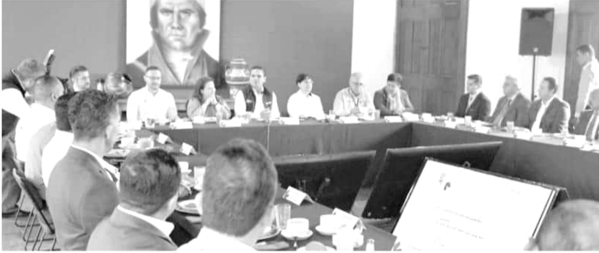
La comisionada nacional de Protección Social en Salud, Ivonne Cisneros Luján, tras reunirse con el gobernador Silvano Aureoles, reconoció que en Michoacán se han tomado acciones para reducir los rezagos en el sector.