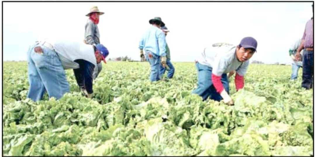
ADAPTARSE A NUEVAS TECNOLOGÍAS ES PRIMORDIAL PARA PODER MANTENER EL RITMO AL QUE CRECE LA DEMANDA DE ALIMENTOS EN MÉXICO Y EL MUNDO.