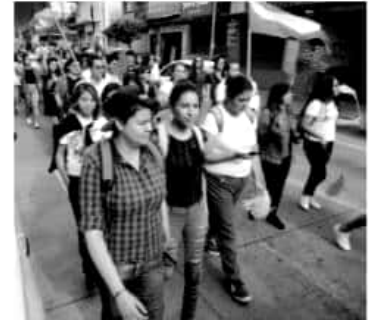
URUAPAN, MICH.- Con cientos de participantes en la marcha, iniciaron las actividades alusivas al Día Internacional del Orgullo LGBTTTIQ+ bajo el lema "Amor es Amor"