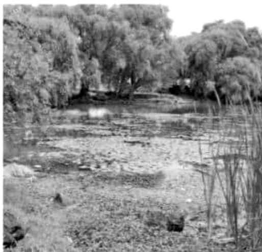
MORELIA, MICH.- El Gobierno de Michoacán, a través de la Secretaría de Medio Ambiente, Cambio Climático y Desarrollo Territorial (Semaccdet), llevará a cabo este sábado 22 de junio, a partir de las 9 horas.

"La conservación de nuestras áreas verdes es una cuestión de salud pública, ya que un medio ambiente sano nos provee del aire limpio, agua, suelos, biodiversidad, entre otros elementos indispensables para la