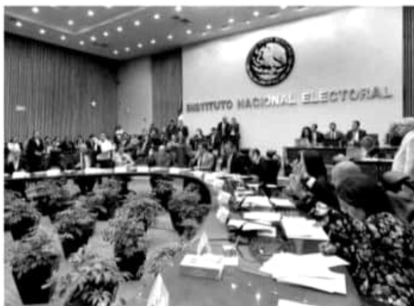
Aspecto de una sesión en el INE.

INE se mantenga como un espacio libre de discriminación.