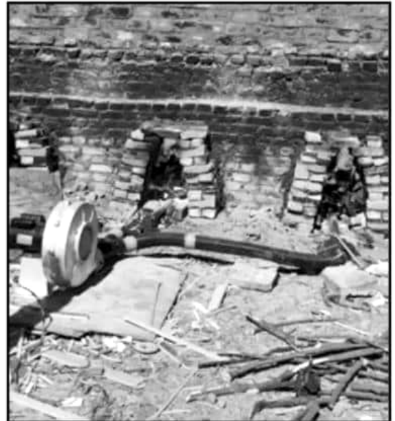
GOBIERNO DEL ESTADO YA EXPLORA VARIAS OPCIONES PARA LA PRODUCCIÓN.

Como parte de las acciones desplegadas, durante la semana recién concluida se realizaron pruebas con dicha tecnología en los hornos de ladrillo ubicados