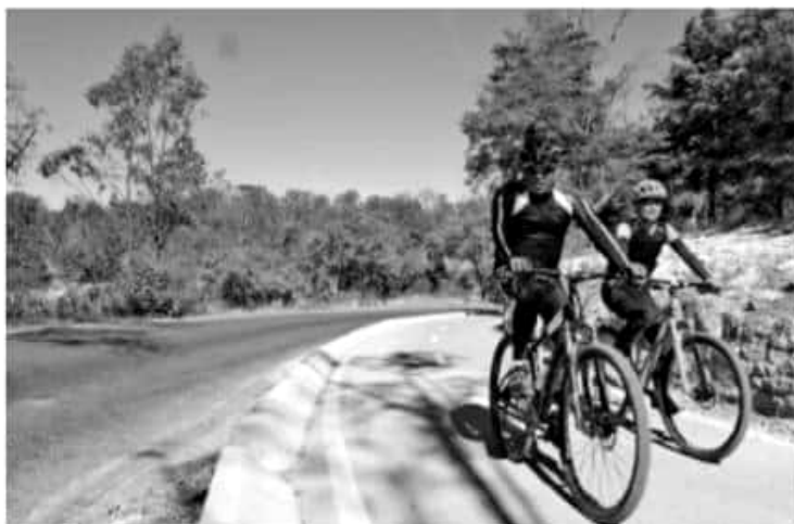
MORELIA, MICH.- A la fecha, la SCOP construye la segunda etapa de la ciclo pista Morelia-Pátzcuaro, del kilómetro 9+800 al 19+000.

Además de los beneficios en la salud física y mental de las personas, el ciclismo permite reducir la emisión de gases contaminantes originados por los vehículos automotores, y así, abonar al cuidado y respeto de nuestro hogar, de la Madre Tierra.