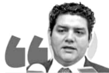
ANTONIO MADRIZ PRESIDENTE DE LA COMISIÓN DE EDUCACIÓN

Por ello, insistió en que los directivos de las escuelas y las dependencias gubernamentales deberán agilizar todos los procesos que permitan no volver a retrasar el pago a docentes y generar mayor malestar social que afecte a la entidad.