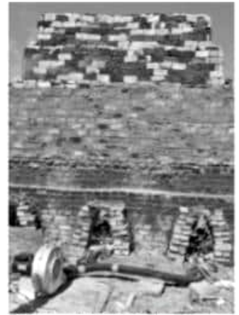
MORELIA, MICH.- En Morelia, se iniciaron pruebas en una ladrillera de la colonia Los Pirules.

MORELIA, MICH.- La Administración Estatal, que encabeza el Gobernador Silvano Aureoles Conejo, a través de la Procuraduría de Protección al Ambiente (ProAm), retomó e intensificó la gestión y el uso de tecnología sustentable.