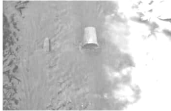
CAMBIO | GRECIA PONCE

El no haber aprobado un incremento del 4 por ciento impide el desarrollo de infraestructura hidráulica.