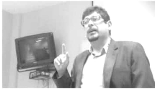
El presidente de la organización Mexicanos Primero, Erick Avilés Martínez.

Aunque no han sido aún visibilizados los efectos de las berries ahí existen focos rojos por idéntica causa que la del llamado oro verde . «Esto ya lo vemos con el cambio climático que afecta a Michoacán. Es claro: este año será uno de los más secos. Las lluvias han sido escasas e irregulares en los últimos años».