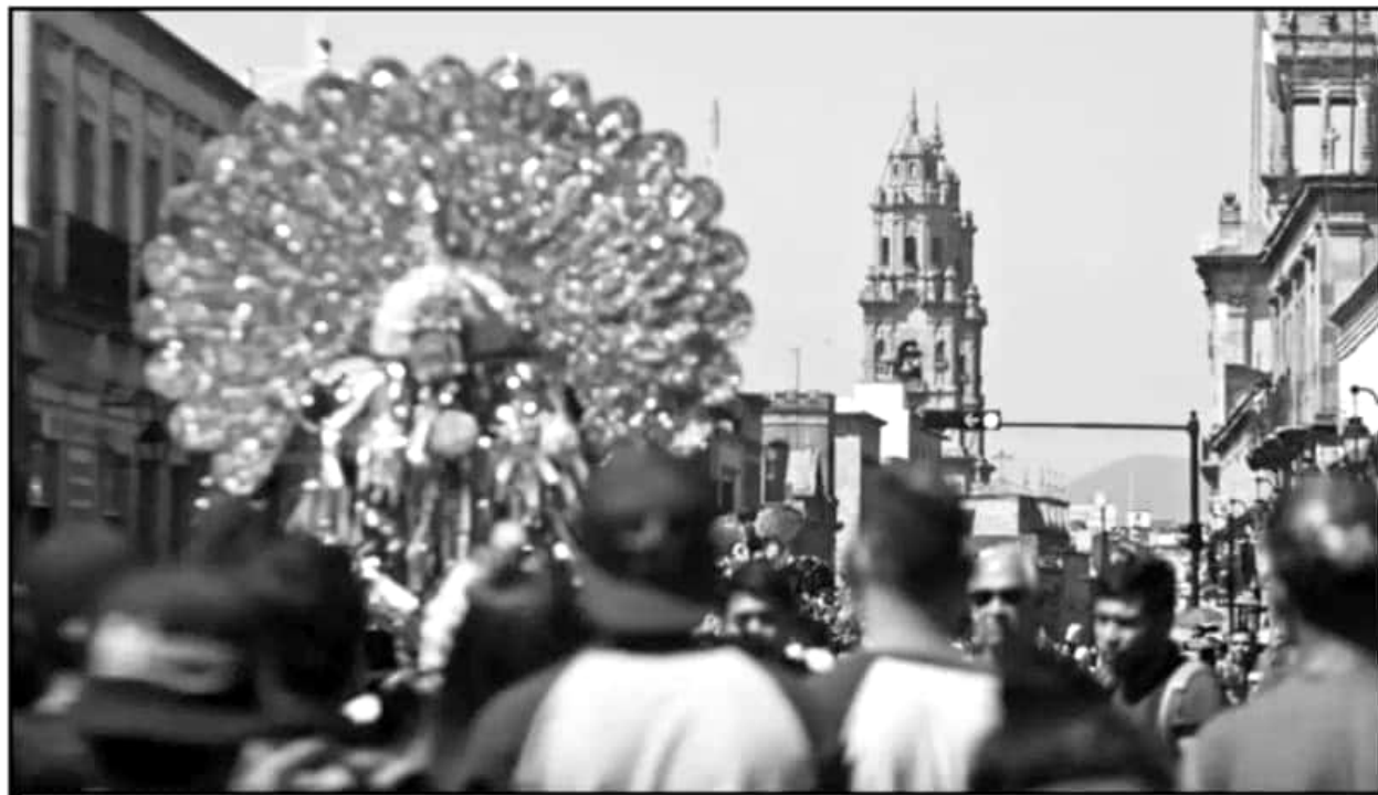
LOS TORITOS DE PETATE SON MUY POPULARES, SIN EMBARGO, SON COMUNES LOS CASOS DE VIOLENCIA POR EL CONSUMO DE ALCOHOL O HASTA DROGAS ENTRE ASISTENTES.