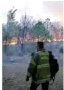
Del miércoles al domingo se registraron 36 siniestros en cerros y lotes baldíos del municipio. CRISTIAN RUIZ

Recalcó que el gobierno local no dio ni dará permiso alguno para cambio de uso de suelo o permisos de construcción de fraccionamientos en las zonas forestales de Morelia, por lo que Protección Civil, Bomberos municipales y las comisiones Forestal de Michoacán (Cofom) y Nacional Forestal (Conafor) mantienen la vigilancia y la coordinación. CRISTIAN RUIZ