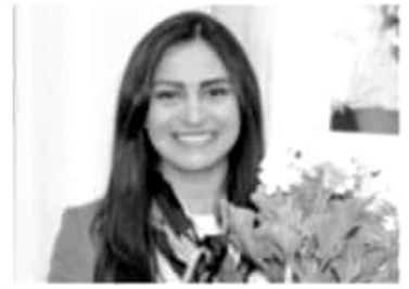
MORELIA, MICH.- La diputada por el Distrito de Pátzcuaro recordó que en Michoacán las autoridades reportan una pérdida anual superior a las 60 mil hectáreas boscosas.

"La pérdida de superficie forestal afecta directamente las posibilidades de captación natural del agua de lluvia y por ende del abastecimiento de nuestros manantiales, realidad sobre la que todos debemos de hacer conciencia para actuar en consecuencia", subrayó.