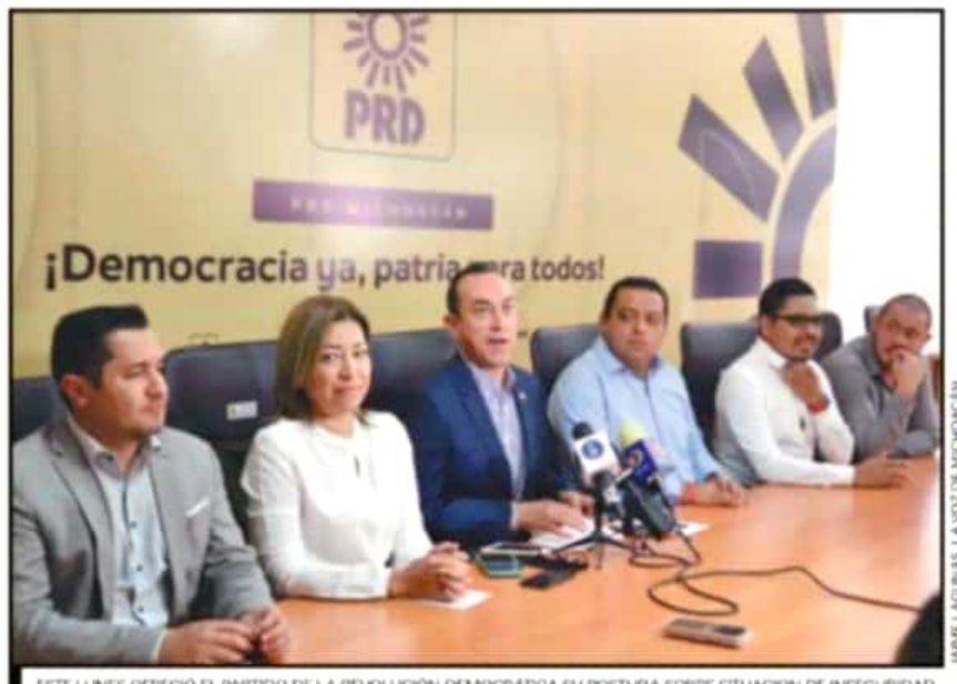
ESTE LUNES OFRECIÓ EL PARTIDO DE LA REVOLUCIÓN DEMOCRÁTICA SU POSTURA SOBRE SITUACIÓN DE INSEGURIDAD