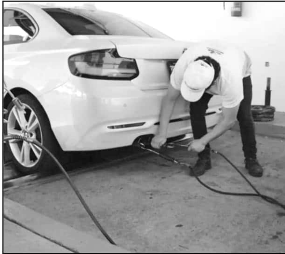
LOS DETRACTORES DE LA MEDIDA, COMO EL SECTOR TRANSPORTISTA, HAN CUESTIONADO LA CAPACIDAD DE LOS VERIFICADORES

La primera fase de la verificación, la cual incluye a 56 mil vehículos con terminación 5 y 6, ha logrado verificar poco más de 10 mil automóviles, lo que implicaría que más de 40 mil sería susceptibles a ser multados a partir de la próxima semana. Cabe destacar que el padrón de vehículos a verificar sólo en Morelia, es de cerca de 600 mil vehículos, de los cuales, no se ha al-