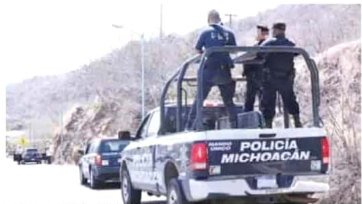
El alcalde reiteró la urgencia de combatir los delitos del fuero común. CRISTIAN RUIZ

Por ello, dijo, es de vital importancia sostener una