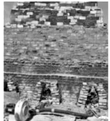
MORELIA, MICH.- El objetivo es garantizar que tanto el Estado como los municipios, concuerden con los esfuerzos mundiales para reducir la pobreza, mejorar el medio ambiente y elevar el nivel de vida de todos los habitantes de nuestro planeta.

Para unificar criterios y esfuerzos en pro del manejo sustentable de los recursos naturales y de la reducción de materiales contaminantes, el Instituto de Planeación de Michoacán (IPLAEM), promueve la alineación de objetivos de las dependencias y organismos del Gobierno Estatal y de los 113 municipios de Michoacán, con la Agenda 2030 y los 17 Objetivos de Desarrollo Sostenible (ODS) de la Organización de las Naciones Unidas (ONU). De esta manera, en el marco de los procesos de planeación estratégica, se trabaja en colaboración con las áreas de planeación de dependencias y ayuntamientos en la determinación de objetivos que coincidan con los ODS y sus 169 líneas de acción. La institución destacó que el objetivo es garantizar que tanto el Estado como los municipios, concuerden con los esfuerzos mundiales para reducir la pobreza, mejorar el medio ambiente y elevar el nivel de vida de todos los habitantes de nuestro planeta, propósitos que se resaltan en el marco de la celebración del Décimo aniversario del Día Internacional de la Madre Tierra, y en los que se trabaja de manera transversal para alcanzar los objetivos marcados.