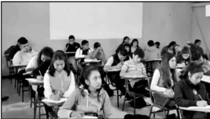
LOS JÓVENES SON MÁS SUSCEPTIBLES A CAER EN LAS GARRAS DEL CRIMEN ORGANIZADO, POR LO QUE URGEN MEDIDAS

“En seis meses ya van a estar operando todos los programas. Esto va a ir mejorando mucho considerablemente en la medida que se vayan