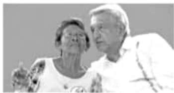
El líder perredista hizo énfasis en el memorándum de AMLO.

Todo depende del avance de las mesas, lo que se está buscando de fondo es eficientar el recurso, dependerá de un censo que se va a levantar en el estado y se buscará que no haya maestros que aparezcan en nómina y no en plantilla"