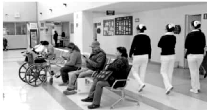
Por instrucciones del Presidente, cualquier persona que no tenga ningún tipo de seguridad social podrá acceder al servicio médico.