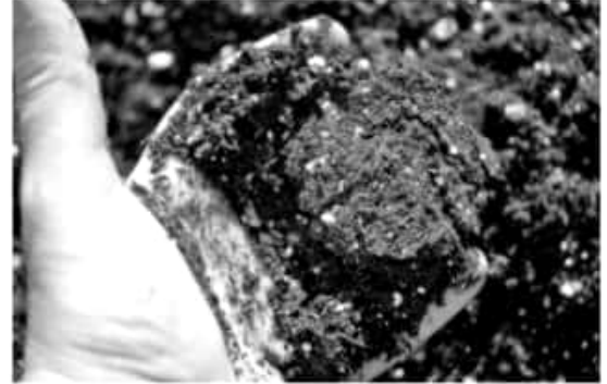
MORELIA, MICH.- El Gobierno de Silvano Aureoles Conejo ha invertido alrededor de 49 millones de pesos apoyando e incentivando a más de 40 mil productores de granos, con fertilizantes orgánicos, mejoradores y análisis de suelos.

Destacó que una vez que se realiza el diagnóstico de fertilidad, se determina un plan de manejo adecuado, pudiendo ser la aplicación de mejoradores de suelo, incorporar materia orgánica, biofertilizante o aplicación de fertilizantes químicos para potenciar la presencia de otras fuentes de nutrición vegetal.