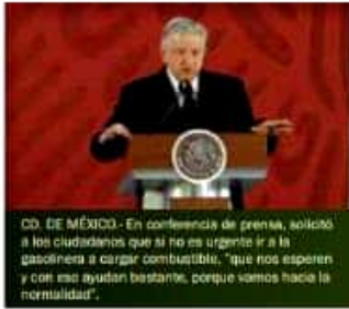
CD. DE MÉXICO.- En conferencia de prensa, solicitó a los ciudadanos que si no es urgente ir a la gasolinera a cargar combustible, "que nos esperen y con eso ayudan bastante, porque vamos hacia la normalidad".