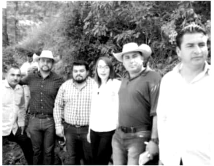
MORELIA, MICH.- El impulso de acciones legislativas que brinden a las instituciones y a los ciudadanos las herramientas necesarias para fortalecer su desarrollo y bienestar, es una prioridad afirmó Octavio Ocampo Córdova al inaugurar la línea de conducción de agua en la presa de la tenencia El Olivo en el municipio de Tuzantla.

Finalmente la población de El Olivo hicieron un reconocimiento al diputado local, quien siempre ha pugnado y emprendido acciones en beneficio de esta localidad y del municipio de Tuzantla, por lo que le manifestaron todo su respaldo para seguir construyendo juntos.