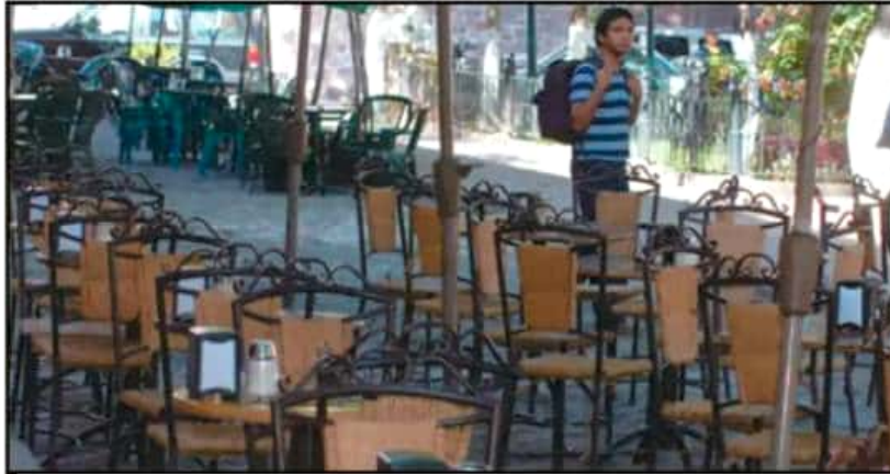
LAS MULTAS A LAS FUNERARIAS SUSPENDIDAS NO HAN SIDO FLUJADAS Y DEPENDERÁ DE LA GRAVEDAD DE LA FALLA

en muchas ocasiones, largas distancias para llegar al centro de trabajo, por lo que suelen llegar tarde o simplemente no pueden llegar. En este punto, recordar que, si bien está la opción del transporte público, sólo el setenta por ciento está operando.