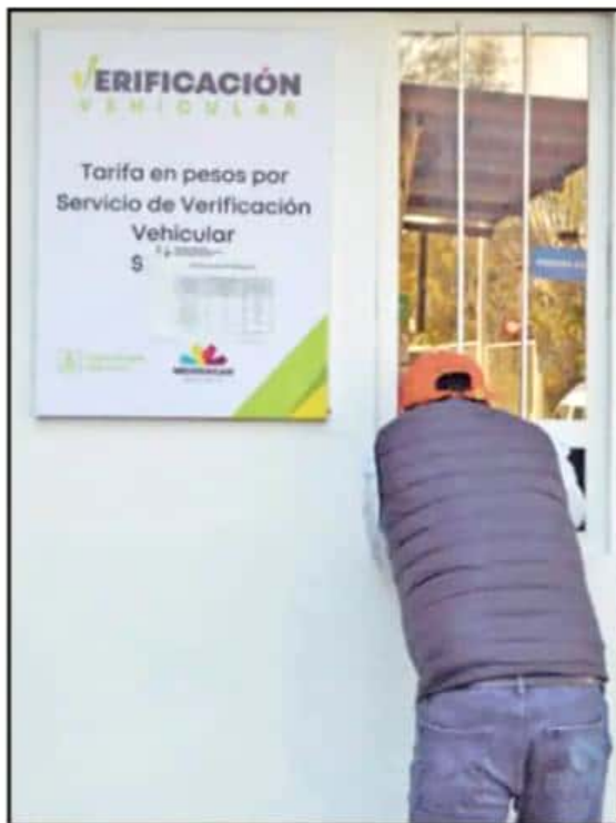
LUCE DIFÍCIL QUE NUEVE VERIFICENTROS PUEDAN CERTIFICAR EN SOLAMENTE UN AÑO MÁS DE MEDIO MILLÓN DE UNIDADES. PERO ANUNCIARON MULTAS.

ARTE: ALEXIA CHACÓN, LA VOZ DE MICHOACÁN