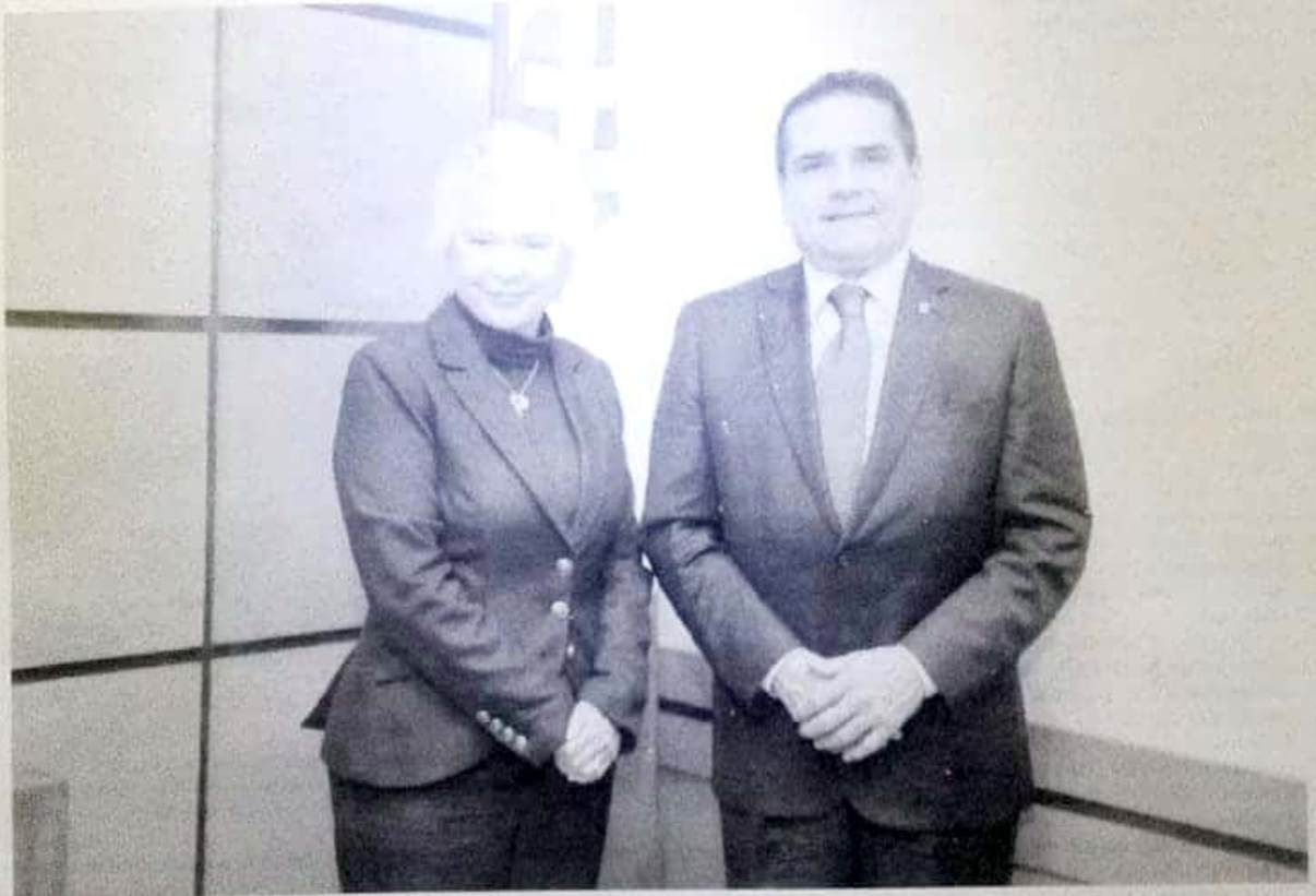
El gobernador Silvano Aureoles con la secretaria de Gobernación, Olga Cordero.

«El presidente presume, hoy o ayer, que se robaron menos combustible desde la expropiación petrolera; ¡muchas felicidades!. El tema puede ser para ellos un éxito, pero para la población es una desgracia porque están paralizanddo la actividad económica. No tienen idea del nivel de pérdidas que tiene el sector económico y las