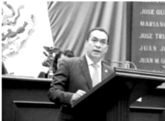
MORELIA, MICH.- En materia de seguridad resulta riesgoso experimentar con modelos como la Guardia Nacional, para lo que México debería primero voltear y observar la experiencia vivida de otros países.

Para el legislador, la confección del modelo de Guardia Nacional requiere un estudio profundo en materia legal para evitar experiencias como la que han vivido países como Colombia con la Policía Nacional, Chile con los Carabineros, la Gendarmería argentina, o la Guardia Nacional de Venezuela, en donde los índices de violación a los derechos humanos se dispararon y los problemas de fondo que se pretendían atender no han encontrado