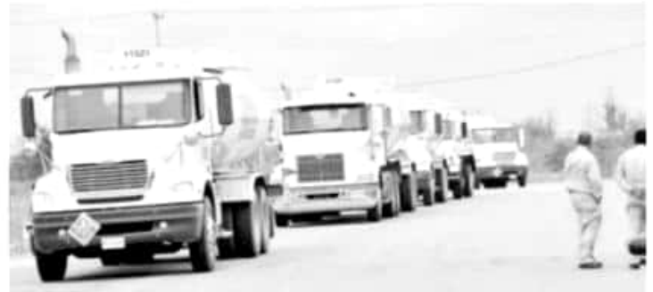
MORELIA, MICH.- Mauricio Prieto manifestó que el número de litros permitirá abastecer las más de 90 gasolineras de Morelia

"Aprovecho este medio para agradecerle a todos los trabajadores de la terminal de almacenamiento y distribución ubicada en el municipio de Tarimbaro el esfuerzo que están haciendo, para eficientizar la llegada del combustible a las estaciones", remarcó el también exdiputado del PRD. Cabe destacar que esta mañana, el Gobernador Silvano Aureoles, sostuvo una reunión con la titular de la Secretaría de Gobernación, Olga Sánchez Cordero, con quien abordó el tema del desabasto de combustible en la entidad.