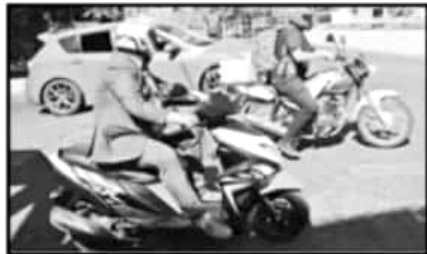
FALTA SEGURIDAD E INFRAESTRUCTURA PARA OTROS MEDIOS DE TRANSPORTE QUE NO SEAN AUTOMÓVILES.