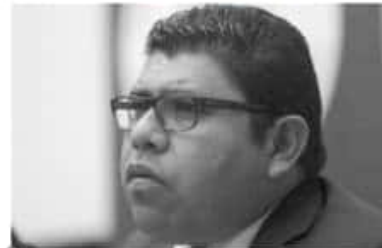
El magistrado expresó que la capacitación al personal y a los gobiernos es necesaria para poder implementar el programa.

pero que por el momento está a prueba debido a que se tiene que presionar a la capacitación del personal que lo operará y sobre todo la preparación a las autoridades estatales y municipales para que el programa sea un éxito. Agregó que no habrá contratación de personal este año y serán los recursos humanos los que operarán la plataforma por lo que habrá una redistribución en las áreas.