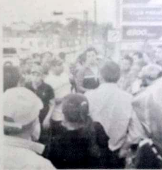
Un grupo de ciudadanos en Morelia.

En la mañana, el alcalde de Protección Civil Municipal, Rogelio