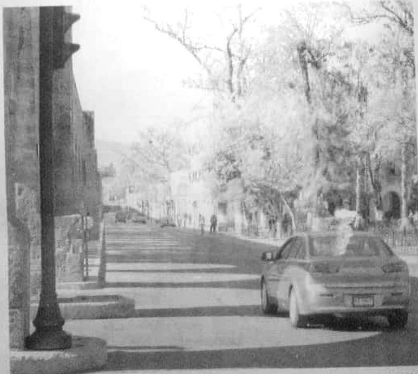
Morelia, con poco tráfico vehicular.

Ante dicho panorama, productores y empacadores se encuentran preparados para abastecer la demanda generada antes, durante y después de la edi-