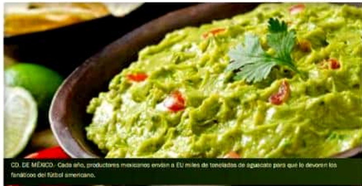
CD. DE MÉXICO.- Cada año, productores mexicanos envían a EU miles de toneladas de aguacate para que lo devoren los fanáticos del fútbol americano.