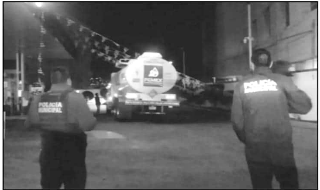
POCO A POCO ARRIBAN LAS PIPAS. TANTO LAS QUE LLEGAN CADA DÍA, COMO LAS QUE SE MANDARÁN PARA AMINORAR UN POCO EL DESABASTO.