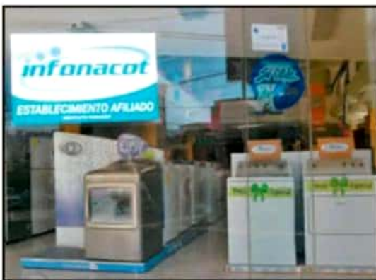
EN EL 2018 UN MILLÓN 99 MIL 497 TRABAJADORES FORMALES EJERCIERON SU DERECHO AL CRÉDITO EN INFONACOT, COMUNICÓ LA DEPENDENCIA.

Y es que más allá de que los proveedores de los alimentos tardan mucho en llegar para poder entregar en pedido de las unidades económicas, el problema radica en la operación interna al considerar que los empleados tienen que recorrer,