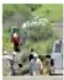
Una toma aérea de un pozo clandestino en el Istmo de Tehuacan, Morena-PT.

"El huachicoleo en sí es una actividad fuera de la ley que se generó por la corrupción dentro de Petróleos Mexicanos. Ahora es una real decisión de hacer perdidos millones de pesos"