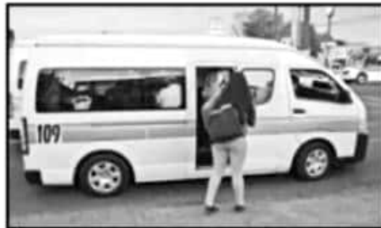
EL TRANSPORTE PÚBLICO NO ES LO SUFICIENTEMENTE EFICIENTE PARA LA DEBIDA MOVILIDAD CIUDADANA.