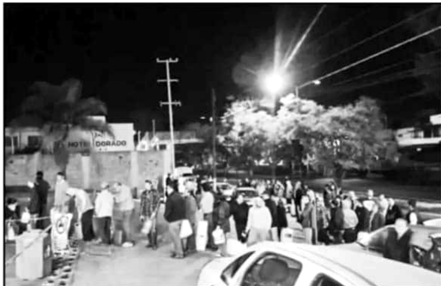
POR EL DESABASTO, MUCHA GENTE DE PLANO SE QUEDÓ A PIE. POR LO QUE AHORA SE FORMAN CON SUS GARRAFONES.

"En el caso de las intervenciones de la avenida Ventura Puentes si se logró generar algo de prioridad ciclista con la ubicación de los cajones verdes de salida, pero todo esto debe estar acompañado de una campaña de información para que la ciudadanía sepa para qué sirve esa área verde, que es un área de protección del ciclista y de preferencia al momento de arrancar cuando lo indique el semáforo", añadió el activista.