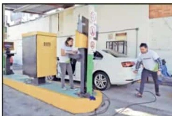
EN TOTAL HAY NUEVE VERIFICENTROS EN EL ESTADO, SIETE DE ELLOS EN LA CAPITAL MICHOACANA, QUE ES DONDE CIRCULAN MÁS AUTOMOTORES.