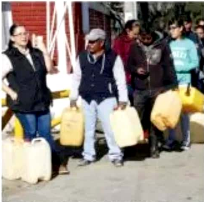
Un grupo de personas que se abastecen de gasolina en un punto de venta en un estado del país.

"Tienen que resistir todas las presiones que se van a hacer y lo más a lo grande que sea posible enfrentando con serenidad y serenidad, sin caer en pánico"