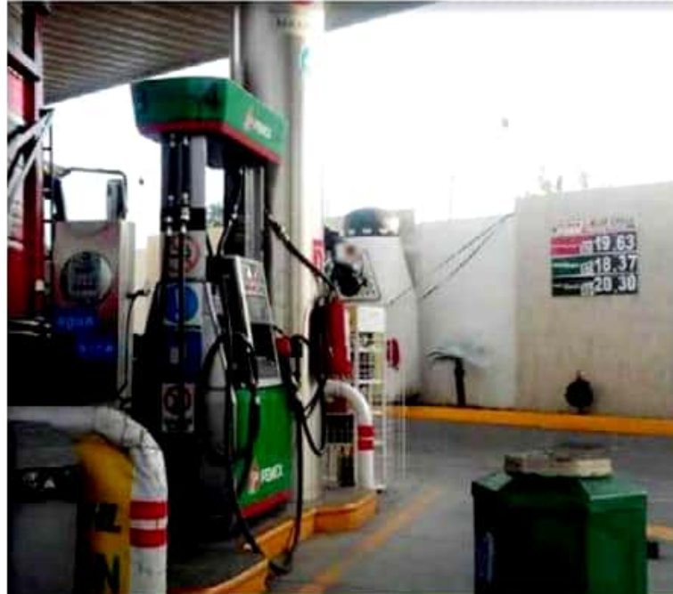
URUAPAN, MICH.- En este Municipio, en el transcurso de esta semana, poco a poco esta situación ha empezado a afectar en diferentes gasolineras, de las cuales el 90 por ciento hasta el día de hoy están cerradas por falta de combustible.

En este sentido, miles de ciudadanos están rodeando la periferia de Municipio para poder abastecerse de gasolina, donde hasta el momento se reporta que solo hay combustible en las gasolineras de PEMEX, Chocolatera y viaducto de Jicalán, esta última se espera que en pocas horas de este miércoles cierre por desabastecimiento, por lo cual es de esperar que, si las gasolineras del Municipio cierran en su totalidad, será un gran conflicto para los automovilistas que ocupan de este combustible para transportarse de un lugar a otro.