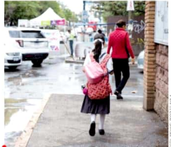
Los planteles que se ubican en el primer cuadro de la ciudad tienen el mayor número de inasistencias de estudiantes.

"Estamos llegando a niveles muy críticos, la gente pasa toda la noche formada en las estaciones de gasolina; hay conatos de discusiones, enfrentamientos".