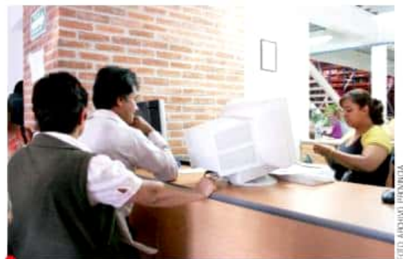
Los registros extemporáneos de nacimientos fue el procedimiento más común el año pasado.

Añadió que en lo que va de la administración estatal se han realizado 105 campañas.