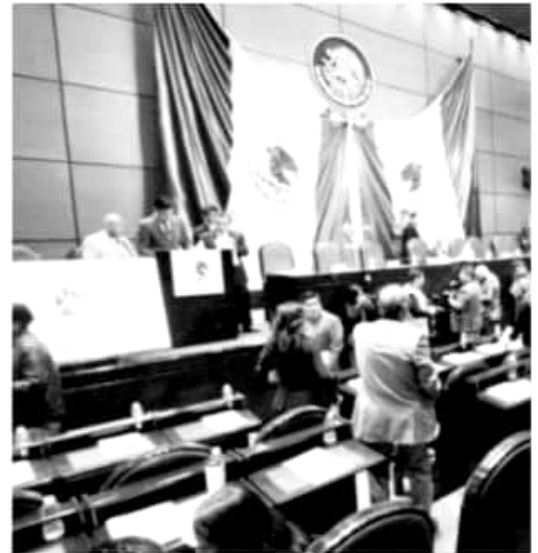
MÉXICO, D.F.- La bancada morenista en la Cámara de Diputados presentó ante la Comisión Permanente del Congreso de la Unión reformas a la Ley Federal para Prevenir y Sancionar los Delitos cometidos en materia de hidrocarburos.

el decomiso de activos, la revocación del permiso respectivo, la suspensión del derecho a solicitar un nuevo permiso para la realización de la actividad permitida objeto de la sanción hasta por un plazo de 15 años y, en su caso, la disolución y la liquidación de la sociedad". La propuesta incluye la nueva obligación a los sujetos regulados a usar sistemas de "geo posicionamiento" en todas las unidades vehiculares utilizadas para el desarrollo de actividades en materia de hidrocarburos, para que la autoridad pueda contar con instrumentos materiales y jurídicos "para la adecuada supervisión y control de las actividades de distribución y transporte de hidrocarburos y petrolíferos". En la exposición de motivos de estas enmiendas se establece que "no bastaría encontrar a una persona transportando o poseyendo hidrocarburos, para afirmar que está cometiendo algún delito en esta materia, pues resultaría necesario demostrar que lo está haciendo "sin derecho y sin consentimiento... de quien pueda disponer de los citados derivados del petróleo, de conformidad con la ley. Por ello, lo que se propone es establecer que es una obligación previa para quien realice operaciones (de distribución por ejemplo) cumplir con las condiciones de ley".