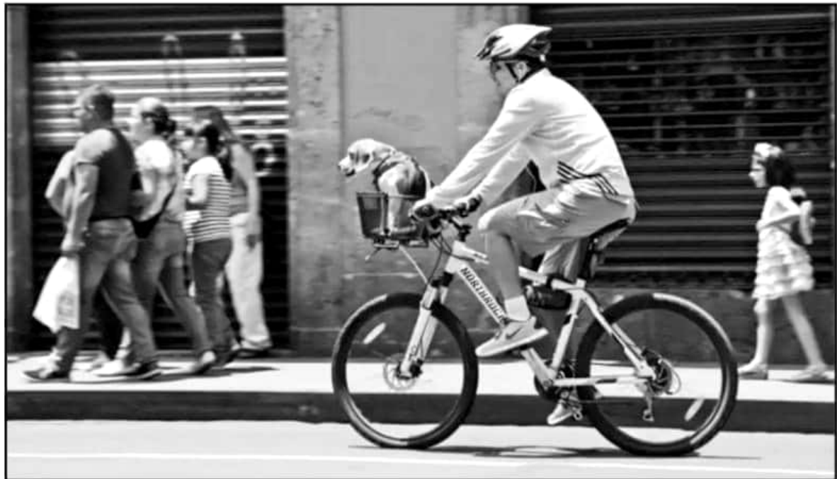
CICLOVIAS SEGURAS Y EFICIENTES SIGUEN SIENDO UN PENDIENTE DEL AYUNTAMIENTO, PUES ANTERIORES ADMINISTRACIONES LO HICIERON PERO MUY A MEDIAS.

Después de que se rebasaron los diez días de problemas de abastecimiento de combustibles en Morelia, comenzaron a observarse vialidades principales que ahora estaban casi libres de tráfico. Si