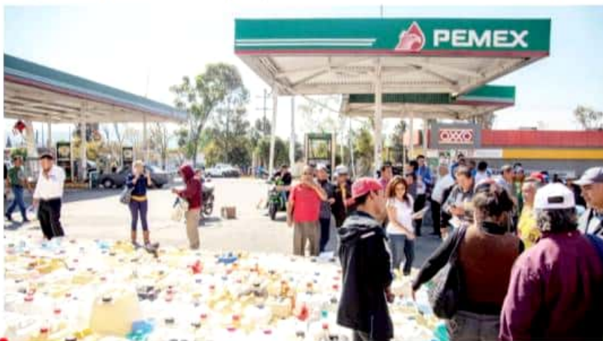
La crisis por el hidrocarburo ha provocado largas filas de automotores y de bidones que llevan los ciudadanos para suministrarse.

Informaron que hasta el momento solo han recibido la circular SEE/001/2019 de la Secretaría de Educación en la cual se señala que los directivos deberán brindar las facilidades de asistencia y puntualidad a los alumnos, personal docente y administrativo de las escuelas que por dificultades con el suministro de gasolina se vean imposibilitados de llegar a los planteles.