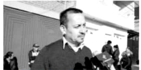
MORELIA, MICH.- Ciudadanos morelianos han dejado de ir a trabajar por esperar a que la gasolina llegue a las estaciones de servicio.

La gente se desespera. La respuesta es la solución y ella misma calma.