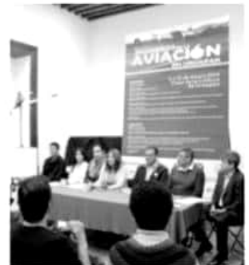
URUAPAN, MICH.- El próximo 11 y 12 de enero en la Casa de la Cultura, se llevará a cabo el décimo tercer Encuentro Uruapan Visto por los Uruapenses, que llevará por tema "Pioneros de la Aviación en Uruapan".

A las 19:15 horas se hablará de Francisco Sarabia y de Emilio Carranza, que son otros dos personajes de la aviación de Uruapan. Las actividades del primer día cerrarán a las 20 horas con la intervención musical del Mariachi de la Casa del Niño.