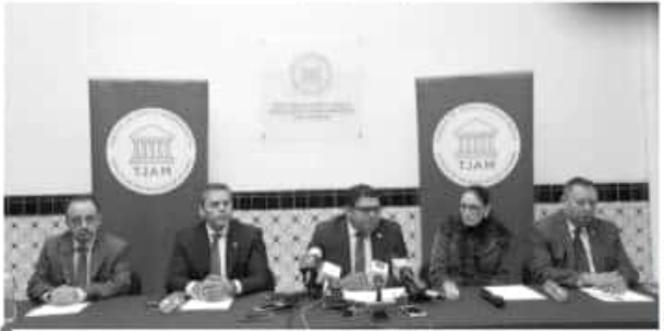
Los funcionarios ofrecieron toda la disposición a los michoacanos para que acudan a esta instancia en caso de ser víctimas de abusos por parte de las autoridades.