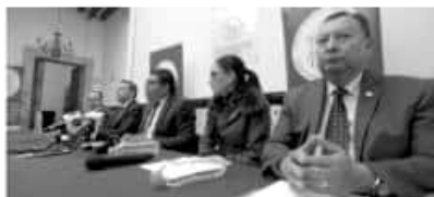
Con información del área de Comunicación Social del Tribunal, los aspirantes dieron la documentación correspondiente 75 minutos antes de las 16:00 horas.