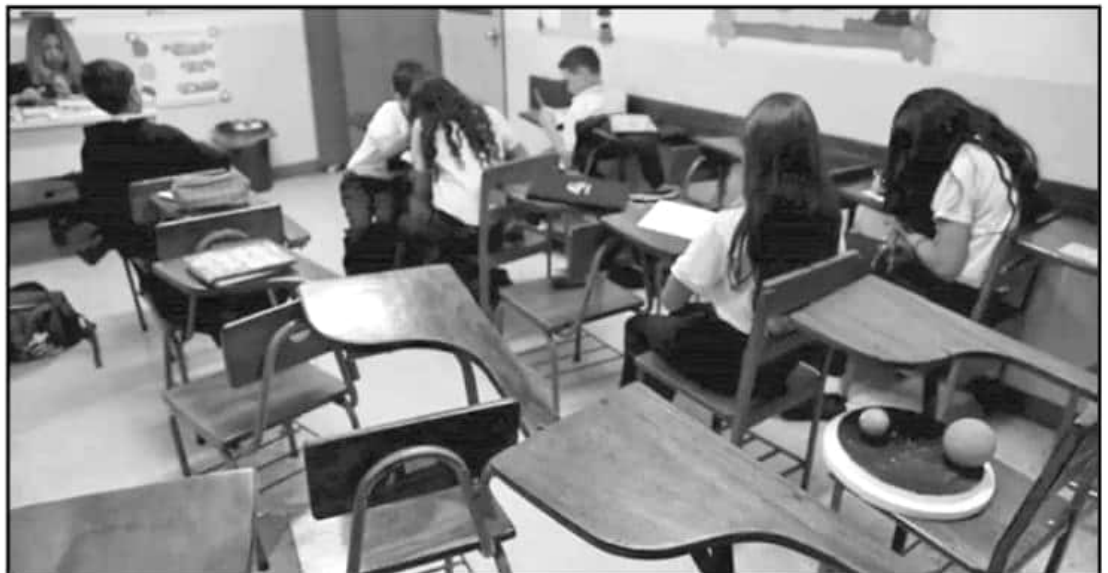
EL GOBIERNO DEL ESTADO Y LA SUBSECRETARÍA DE EDUCACIÓN BÁSICA REALIZAN BALANCES PARA CONOCER QUÉ TANTO HA AFECTADO EL DESABASTO.

25 DÍAS más contemplan que pueda seguir la crisis