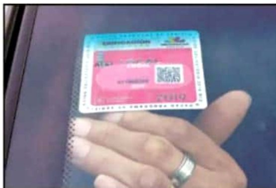
EL HOLOGRAMA L ES ÚNICAMENTE PARA LA CIUDAD DE MORELIA, PERO LOS CENTROS TAMBIÉN EXPEDIRÁN CERTIFICADOS HOMOLOGADOS PARA OTRAS ENTIDADES.

En Michoacán, se estima un total de 433 automóviles por cada mil habitantes, cifra que se acentúa en los principales núcleos urbanos como en el caso de Morelia. Sólo en esta ciudad, se estima que circulan casi medio millón de automóviles todos los días de los mismos ciudadanos, a los cuales se deben agregar otros 200 mil automóviles que circulan por tránsito de otros estados, municipios o por negocios.