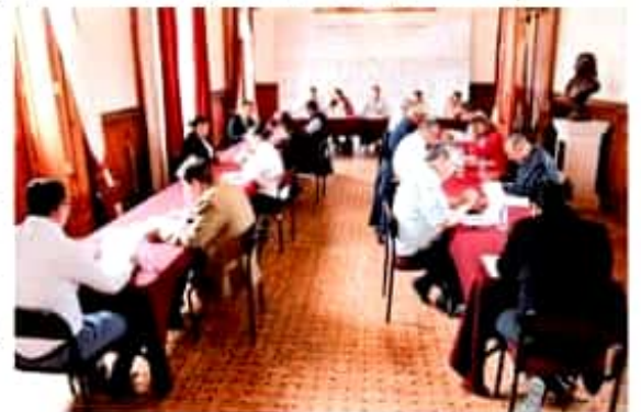
Señal los días 4 y 5 de Julio cuando comparezcan ante la Comisión Inspectora de la Auditoría Superior de Michoacán del Congreso, los aspirantes a ser el nuevo titular de la ASM que ayer presentaron examen de conocimientos.

La legisladora celebró este avance y refirió que en Michoacán se requiere fortalecer el municipalismo, para garantizar la armonía y el desarrollo del estado, por lo que resulta apremiante que Michoacán cuente con los mecanismos e instrumentos jurídicos para resolver desde el Congreso del Estado los conflictos por límites territoriales.