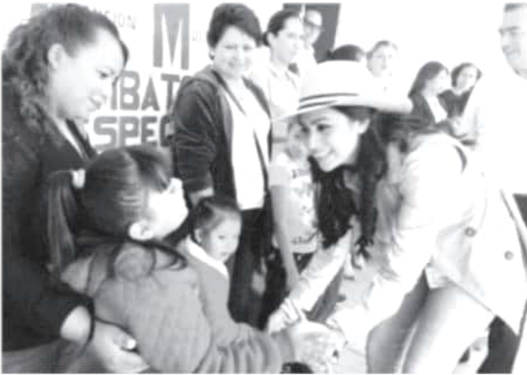
Apostar por la dádiva no es salida para la solución de fondo de este asunto, por lo que resulta de gravedad que el Estado Mexicano renuncie a su responsabilidad como generador de Políticas Públicas que solucionen de raíz los problemas.

-Uno de cada ocho niños menores de cinco años padece desnutrición crónica