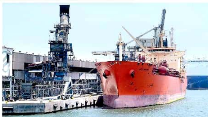
Buscan reforzar gestiones ante desaparición de la ZEE, para que implementen el programa de los municipios colindantes con EU y atraer inversión.

En tanto, la presidenta municipal refirió que la consulta puede reforzar las gestiones que el Cabildo de Lázaro Cárdenas, así como el Congreso del Estado, realiza a través de exhortos para que el gobierno, ante la eventual desaparición de la Zona Económica Especial, declare una Zona Li-