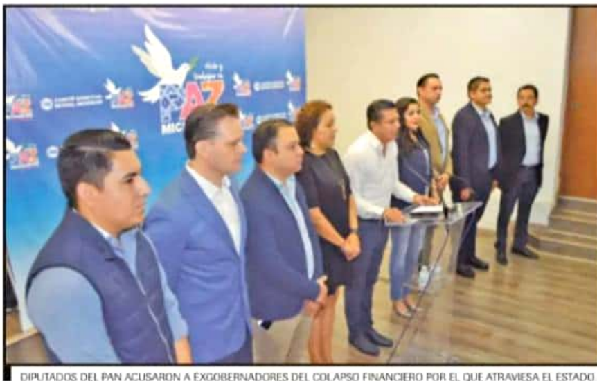
DIPUTADOS DEL PAN ACUSARON A EXGOBERNADORES DEL COLAPSO FINANCIERO POR EL QUE ATRAVIESA EL ESTADO.

Recriminó al presidente López Obrador que esté retardando la federalización de la nómina educativa, la cual anunció desde el pasado 5 de abril en Zacapu con bombo y platillo para ganar el aplauso caliente, el grito y la euforia con auténtico populismo. “Ya nos quitó la Zona Eco-