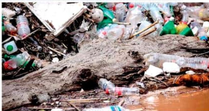
Ciudadanos señalan que es un pequeño paso que se da en el cuidado del planeta, en beneficio de las especies y el ecosistema local. FERNANDO MALDONADO

En un sondeo de opinión, los ciudadanos han tomado la medida con agrado: "Es muy bueno que se sancione la utilización