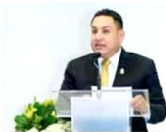
El presidente municipal de Uruapan dijo que si se cambia el nombre al PRD, estaría en duda su militancia.

"Muchos dicen que el PRD ha muerto; nosotros decimos que desde aquí vamos a reconstruirlo, vamos a trabajar y a empujar para que no le cambien el nombre, porque al momento que se le cambie el nombre de Partido de la Revolución Democrática, nosotros dejaremos de pertenecer", advirtió el uruapense en entrevista con medios de comunicación.