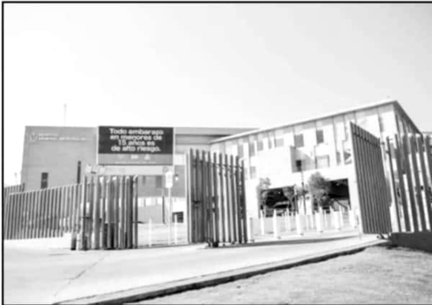
LA FALTA DE ATENCIÓN O DE CALIDAD EN LA MISMA EN EL IMSS ES DE LAS QUEJAS MÁS INSISTENTES ANTE LA CEDH.