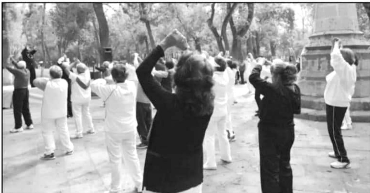
CONTINUAMENTE. LA DELEGACIÓN DEL IMSS MICHOACÁN REALIZA JORNADAS DE ACTIVACIÓN FÍSICA PARA LOS DERECHOHABIENTES DE LA TERCERA EDAD.

Si bien las autoridades delegacionales dijeron que aún se encuentran en el proceso de conformar estadísticas sobre la forma en que las actividades del Centro de Servicios Sociales del IMSS impactan en la salud de los pacientes, también añadieron que