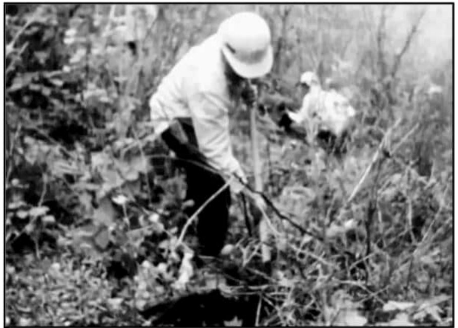
LA BRIGADA CONTRA INCENDIOS, SECCIÓN LA MAJADA, ES QUIEN COORDINA LAS ACCIONES DE REFORESTACIÓN.

A la fecha se ha trabajado en la reforestación que inició el pasado martes 18 y concluirá este jueves 26 de los presentes, donde se han implementado 260 jornales desarrollados por empleados y trabajadores de la empresa referida, además de 14 brigadistas de la Conanp y entre 40 y 50 voluntarios, informó a este