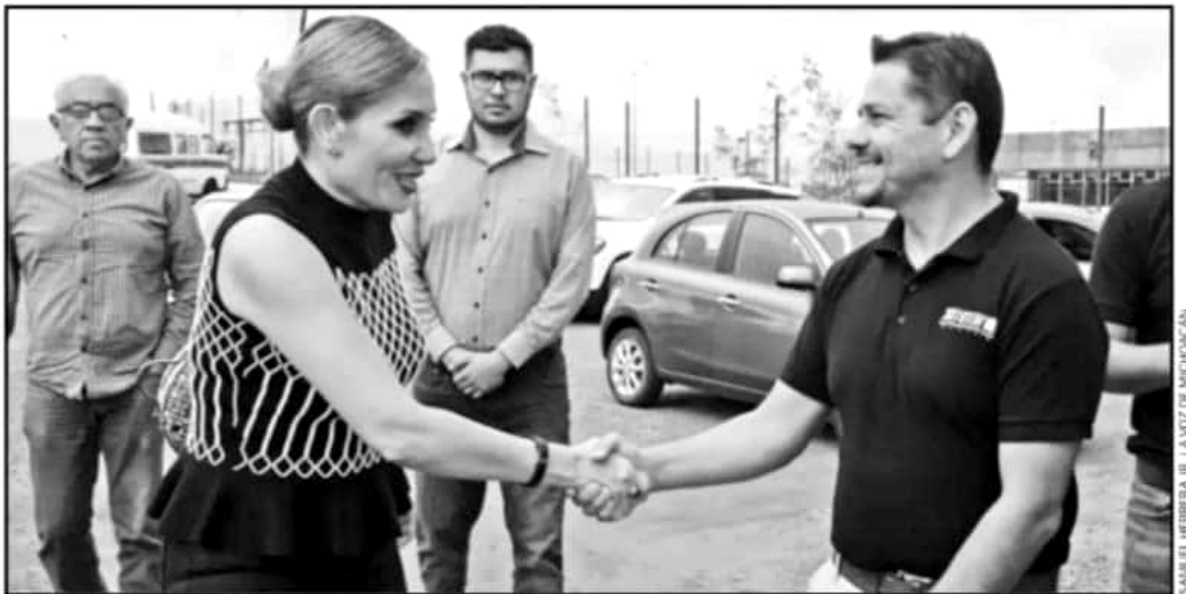
LA RECTORA (A LA IZQUIERDA) DESTACÓ QUE EL FIN DE LA TOMA SE DIO GRACIAS A LA MEDIACIÓN DE LA SEE CON EL LIDER DE LOS PARISTAS (DERECHA).