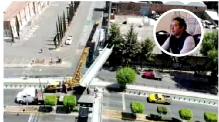
Se pausará el retiro de los puentes peatonales en la ciudad.

"No buscamos el retiro de los puentes peatonales, sino la instalación de soluciones alternativas, que privilegien el tránsito para las personas sobre la circulación de automotores, en los sitios donde es viable sustituir las estructuras por otras medidas", ex-