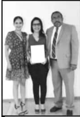
LA FIRMA FORTALECE LAS ACCIONES DEL INSTITUTO MICHOACANO.

Es importante hacer de conocimiento a la ciudadanía que el IMAIP está tejiendo redes con diversas instituciones de vanguardia y además se está posicionando a nivel nacional, tanto, que fue uno de los cuatro órganos garantes del país seleccionados para realizar en conjunto con tan prestigiada institución española acciones en beneficio de las y los michoacanos,