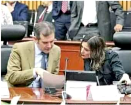
Se impusieron tres sanciones por más de 80 mil pesos cada una. | CUARTOSURCO

Por lo que invitó a Morena a atender las solicitudes de in-