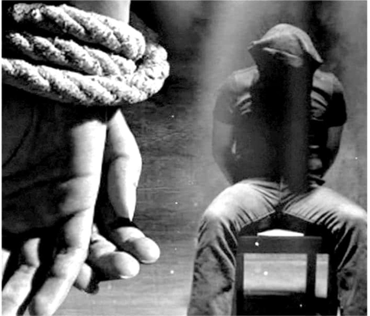
Las regiones de Zamora y Uruapan han sido golpeadas por grupos criminales dedicados al secuestro, reconoció el mandatario estatal, Silvano Aureoles Conejo.

Cabe hacer mención que desde el inicio de la estrategia de combate, no se ha informado respecto al número de tomas detectadas en la zona.