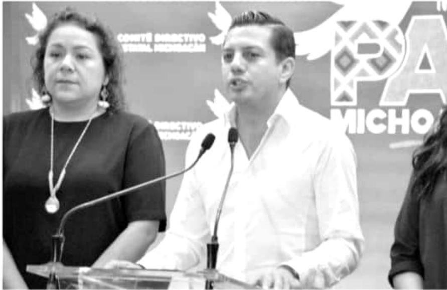
Rueda de prensa de Óscar Escobar Ledesma, dirigente estatal del PAN.

En rueda de prensa, el dirigente estatal de Acción Nacional, Óscar Escobar Ledesma, acompañado por legisladores locales, e integrantes de la recién nombrada Comisión Política del instituto político, refirió que ante la posibilidad