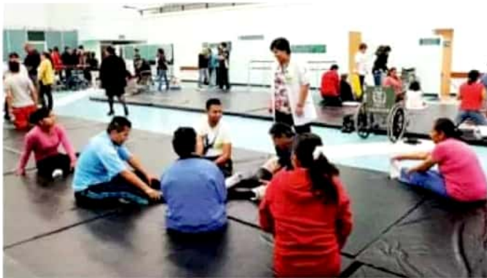
Las personas que padecen el dolor en la espalda baja deben acudir a terapia por varios meses.

En este sentido, hizo un llamado a la población a adquirir