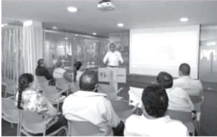
Los integrantes de la organización producen anualmente 53 toneladas de trucha, que comercializan en el municipio de Hidalgo y zonas aledañas, incluso en Morelia y Querétaro.

En ese sentido, en Espacio Emprendedor los productores recibieron orientación y apoyo para la evaluación y el diagnóstico de la empresa, y la integración de su modelo de negocios, así como para la creación de la identidad corporativa, y con ella, poder elaborar su empaque, el código de barras y la