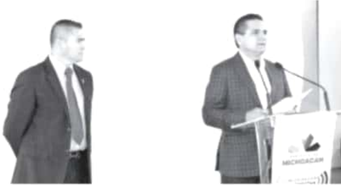
Ante esta problemática que se vive a nivel nacional, en Michoacán no se dejará de lado ninguna denuncia, independientemente del periodo que se presentó.