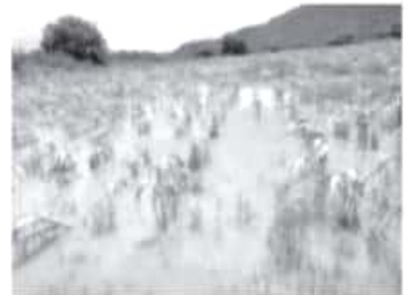
Una vez que el productor notifica del daño, la dependencia envía a una persona que conozca del tema a revisar, tomar coordenadas del sitio y a recabar evidencias.

Debido a que la temporada de lluvias ha comenzado, el funcionario recomendó a productores realizar acciones de prevención en lugares estratégicos de sus huertas o parcelas, como: limpieza de zanjas y vigilancia de ríos.