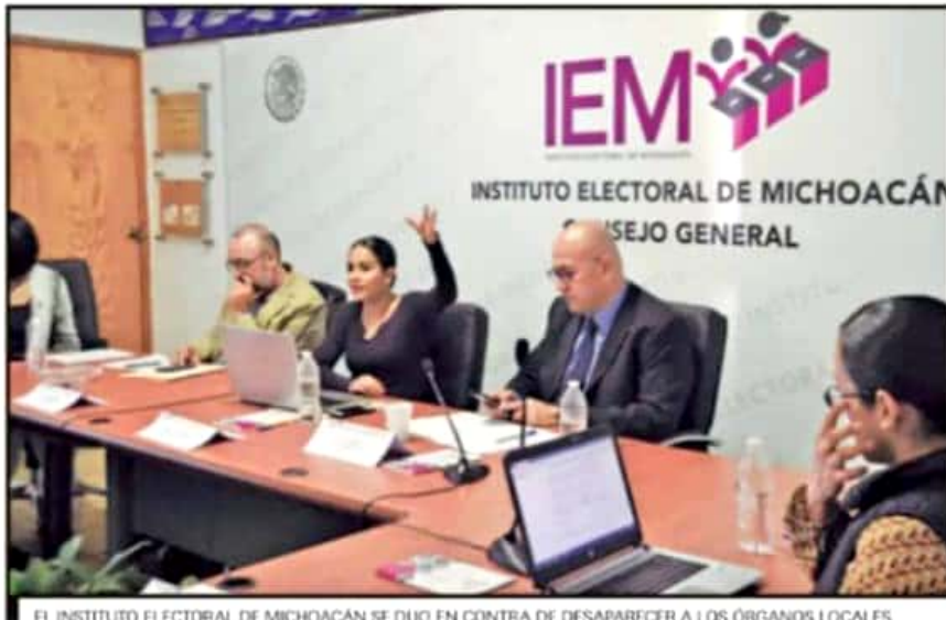
EL INSTITUTO ELECTORAL DE MICHOACÁN SE DIJO EN CONTRA DE DESAPARECER A LOS ÓRGANOS LOCALES.