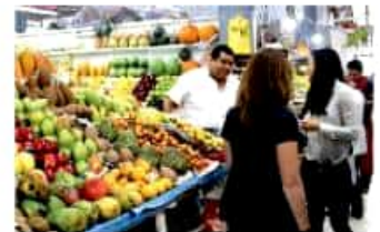
En tiendas de autoservicio clientes deberán llevar su bolsa. CUARTOSURCO

Mucha gente se pregunta por qué suceden cosas como las inundaciones y la contaminación, pero nosotros tenemos la culpa por no cuidar el medio ambiente"