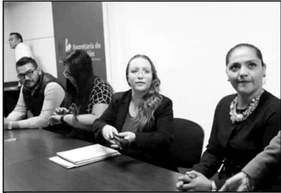
LA DIRECTORA DEL SUBSISTEMA DESMINTIÓ AL SINDICATO, QUE HA HABLADO DE LA INTENCIÓN DE CERRAR PLANTELES.

Indicó que incluso la mitad del aparato administrativo está en manos de cuadros partidarios del gremio, tema que se ha buscado regular con la reingeniería y ordena-