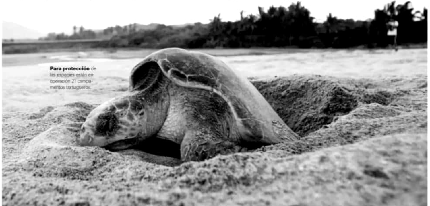
Para protección de las especies están en operación 21 campamentos tortugueros.