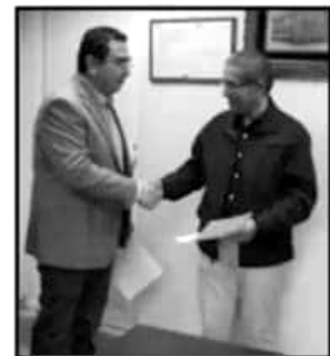
EL RECTOR DE LA UNIVERSIDAD MICHOACANA NOMBRÓ DIRECTORES.