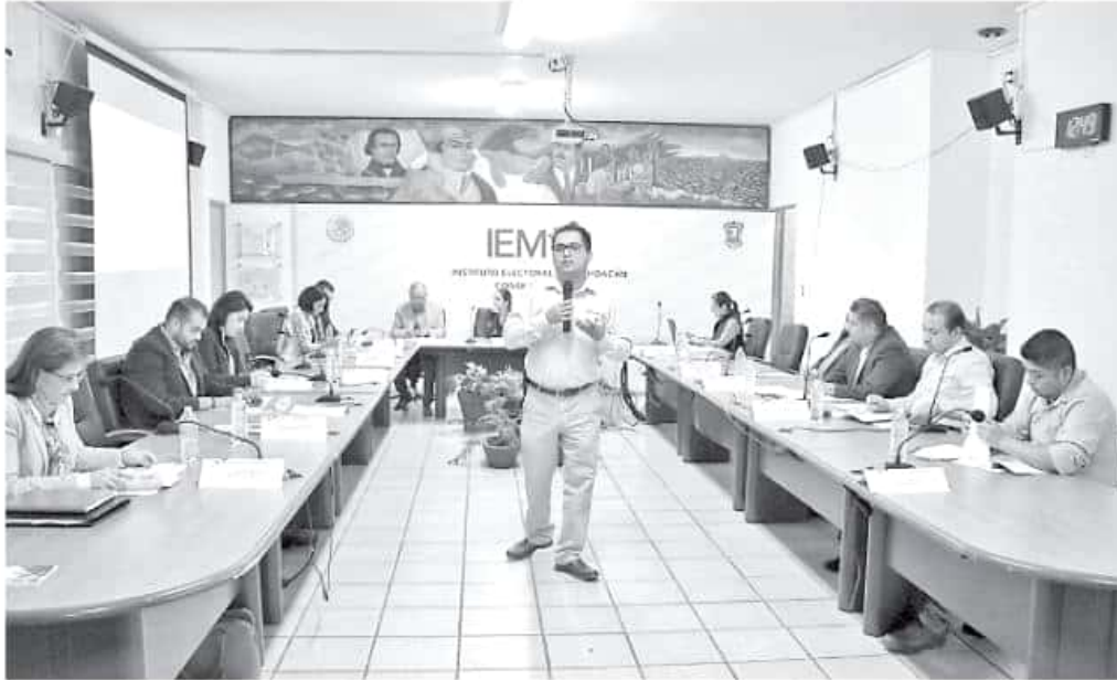
De no atenderse los requerimientos, los dos serían sancionados administrativa y económicamente. FERNANDO MALDONADO

El IMAIP dio como plazo el mes de julio a ambos partidos políticos para que atiendan todo lo relacionado con la actualización de sus plataformas para la consulta pública