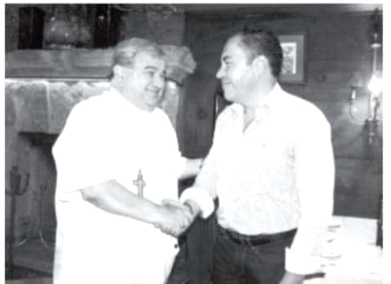
En el encuentro el encargado de la política interna y el prelado católico acordaron seguir en la construcción de una agenda en común que permita la reconstrucción del tejido social.

En ese sentido, el encargado de las políticas internas de Michoacán y el jerarca religioso, al frente del Arzobispado de Morelia, coincidieron en que la suma de esfuerzos y voluntades será tarea primordial para recuperar los valores y formar mejores ciudadanos.