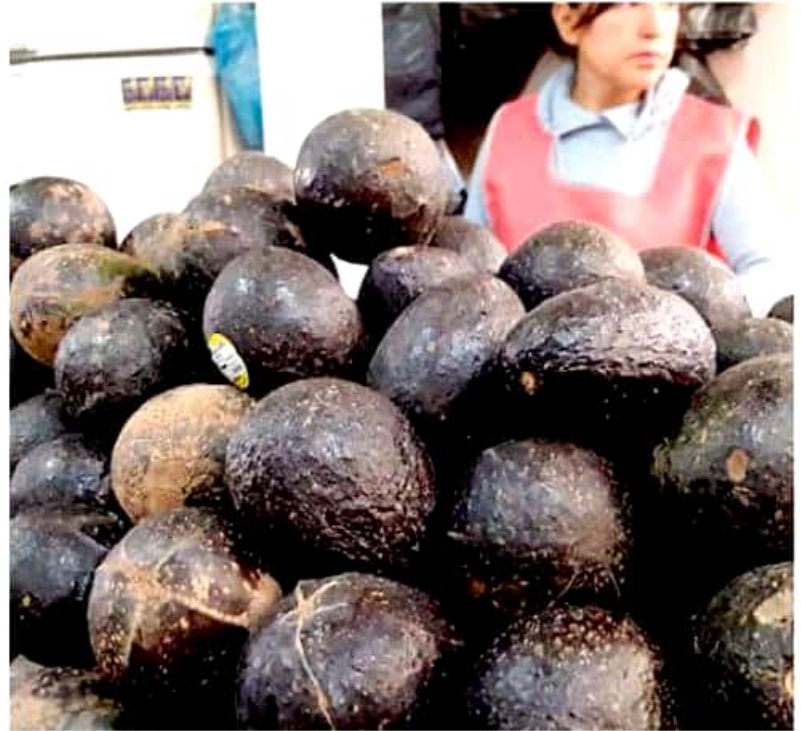
En mercados públicos predomina aguacate de segunda y hasta de tercera calidad. SILVIA HERNÁNDEZ

También refirieron que las ventas están bajas; en el último mes se redujeron de entre 50 y 70%. Los precios en esa plaza municipal oscilan alrededor de 50 pesos el de menor tamaño, 65 y 68 pesos el mediano (ya maltratado) y de mejor calidad en 80 pesos, proveniente de Uruapan.