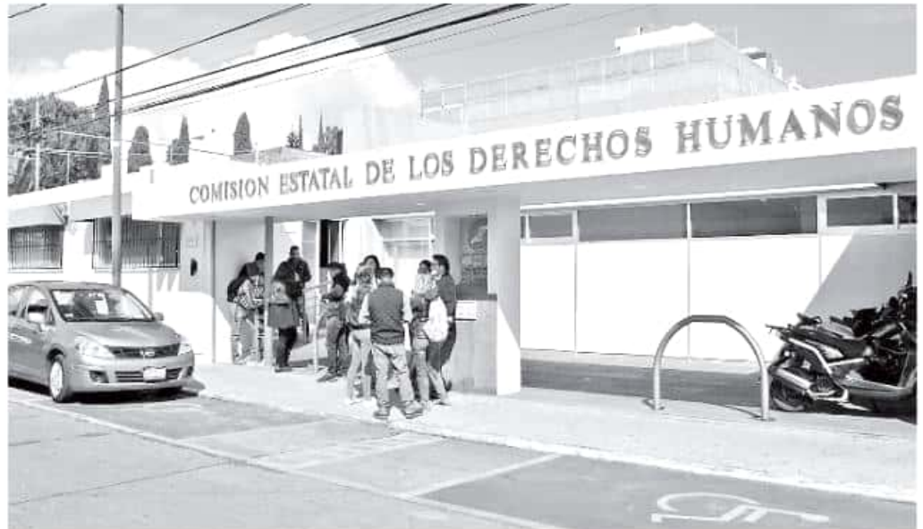
Si bien este año la Comisión no ha recibido ninguna denuncia, están documentadas en la Fiscalía General estatal múltiples demandas en los últimos años.

Por su parte y al cuestionar al presidente de la Comisión de Educación, Anto-