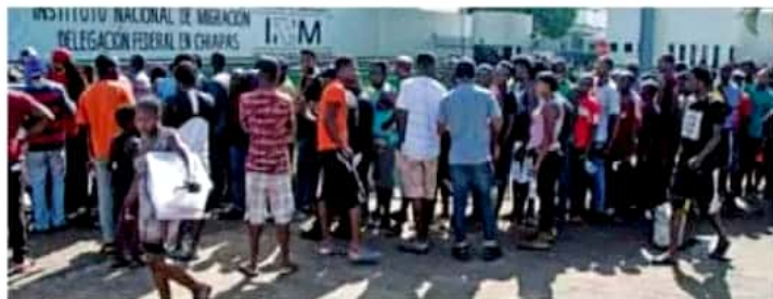
Alededor de 50 migrantes de Haití y África, quienes denunciaron maltrato y pidieron atención médica y alimentos, intentaron fugarse nuevamente de la Feria Mesoamericana, espacio acondicionado para albergar a los extranjeros detenidos por el Instituto Nacional de Migración (INM). De acuerdo con medios de comunicación nacionales, el intento de fuga de los haitianos y africanos, que fue controlado por policías federales y guardias de seguridad privada, sería el tercero en este mes en las instalaciones acondicionadas como extensión de la Estación Migratoria Siglo XXI del municipio de Tapachula.

La comunidad de la Universidad Vasco de Quiroga felicita en su