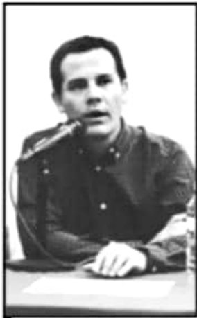
ORGANIZADORES DAN DETALLES.