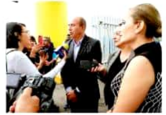
Tras retomar actividades académicas abordarán todos los temas