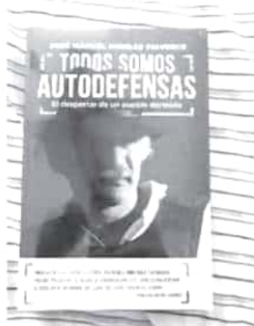
Esta actividad es organizada por la Asociación Civil «Vincular para Educar A.C.» y se realizará en el Auditorio de la Secundaria Técnica 49, a las 11:00 de la mañana.

Según la sinopsis de la obra, en 2004 Michoacán se resquebrajó. Ese año, los cárteles, insatisfechos con las ganancias obtenidas con el tráfico de drogas, diversificaron sus actividades e incursionaron en la extorsión, el secuestro, el pillaje y, en el colmo del sadismo, la violación y la tortura. Después de una década de violencia desatada, los habitantes de la zona reaccionaron. Empobrecidos por los embates del crimen, olvidados por las autoridades, furiosos y hartos, decidieron tomar la justicia en sus manos. José Manuel Míreles Valverde es una figura central en este panorama. Fundador de las autodefensas en la Tierra Caliente, luchó durante más de un año contra los cárteles, pero fue apresado en junio de 2014 durante un operativo federal duramente criticado. Entonces debió emprender otras batallas: la jurídica -por salir de prisión- y la moral -para no doblegar su espíritu-. Y triunfó. Míreles ha convertido esa digna rabia en la crónica completa de las autodefensas michoacanas. En este libro, que se remonta a la herencia purépecha y la pelea que los terracalienteños dieron durante la Revolución mexicana y la Guerra Cristera, el médico y comandante narra a detalle la génesis del movimiento de autodefensas, así como la adrenalina de los combates y las negociaciones frustrantes con el gobierno, que culminaron en una traición histórica.