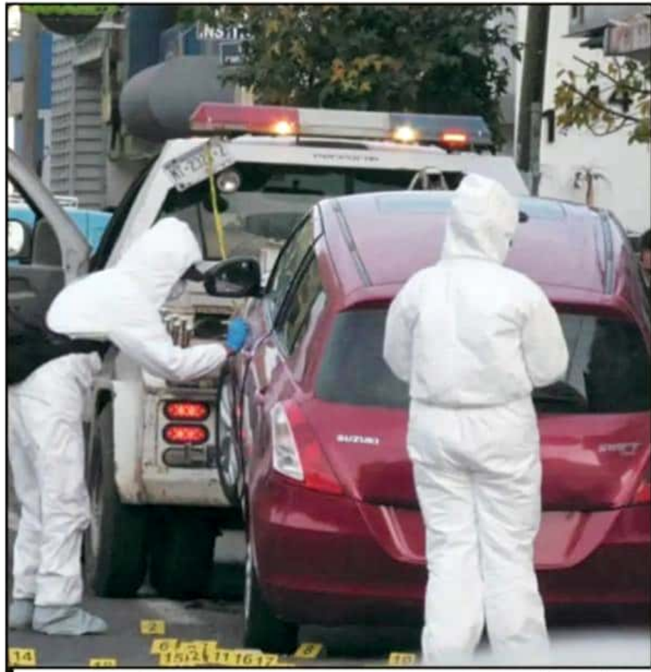
EL DELITO DE HOMICIDIO ALCANZÓ SU MÁXIMO HISTÓRICO DE NUEVE EL MES DE MAYO, CON 23 CASOS EN MORELIA

desestabilidad, porque no se sabe cuál es el problema y qué está pasando”, señaló. En los últimos meses también han aumentado el número de homicidios en la capital y su Zona Metropolitana, así como la violencia ejercida en estas ejecuciones, al encontrarse cadáveres abatidos con arma de fuego, descuartizados, decapitados y con los párpados desollados. El caso más reciente