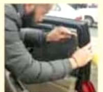
Agentes de tránsito realizan una inspección de autos polarizados.

Asimismo, exhortaron a la población a evitar circular con el parabrisas roto o estrellado, mismo que distorsiona la visibilidad al interior o exterior del vehículo. MIMORELIA