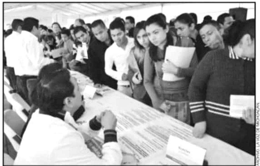
EL PROGRAMA DE JÓVENES SOLIDARIOS BUSCA PROMOVER EL EMPRENDIMIENTO DE NEGOCIOS EN MORELIA.