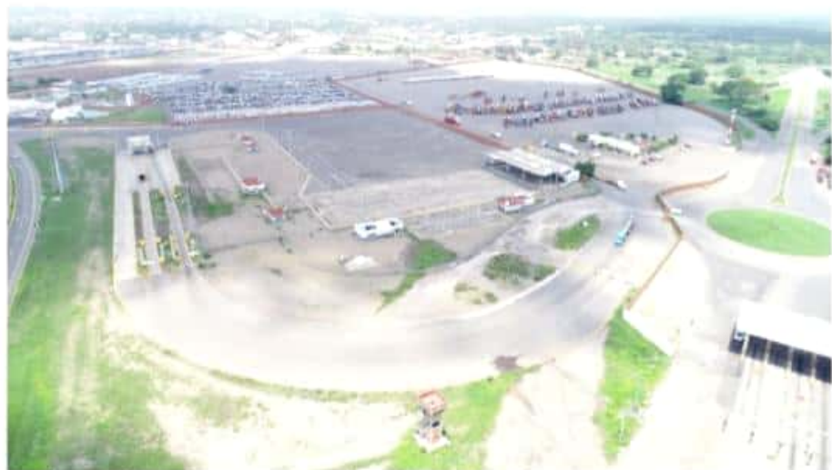
CD. LÁZARO CÁRDENAS, MICH.- El Puerto Lázaro Cárdenas presentó un crecimiento del 33% en atención al autotransporte al mes de agosto en su ASLA, con un total de 38 mil 176 unidades

En la actualidad, el comercio exterior presenta grandes retos, para ello, el Puerto Lázaro Cárdenas ofrece grandes oportunidades con soluciones innovadoras e integrales para las necesidades del mercado.