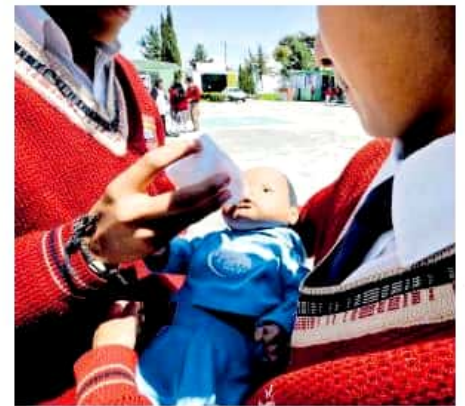
La mayor incidencia de este tipo de problemática se da en las ciudades grandes

De los 240 mil adolescentes que el IMSS atiende en el estado, mil 600 están bajo alguna etapa de embarazo; en 2012, la cifra era de 2 mil