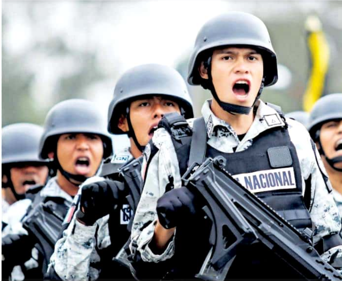
Hasta ahora van 160 elementos de la Guardia Nacional desplegados en Uruapan y otros 32 en Buenavista Tomatlán