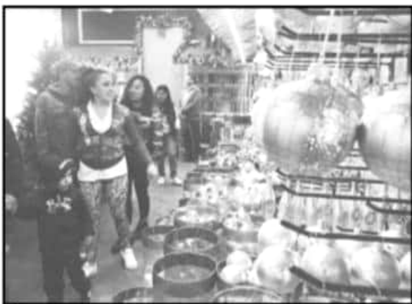
ARTESANOS DE LA ESFERA ESPERAN COMERCIALIZAR 38 MILLONES DE PIEZAS.