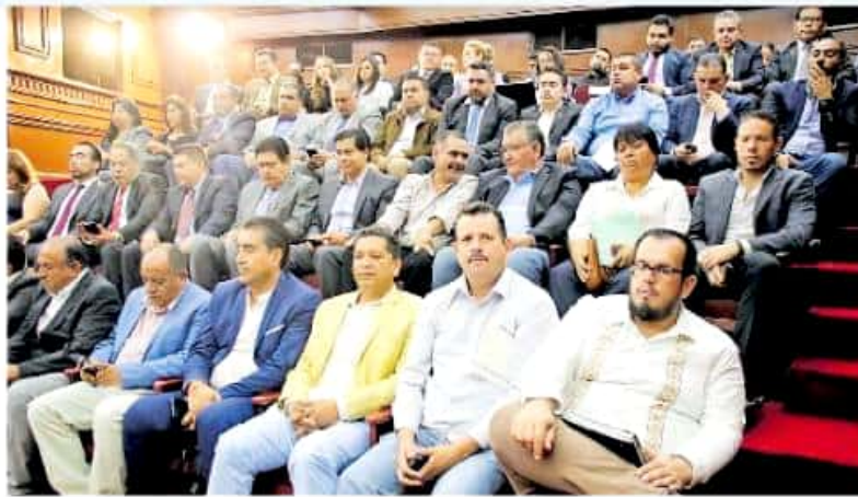
Presidentes municipales de demarcaciones con altos índices de violencia se mantienen reacios a firmar el convenio de coordinación de seguridad con el estado.

"Yo espero que en próximos días podamos ver algún pronunciamiento respecto de los municipios que se van a adherir (...)