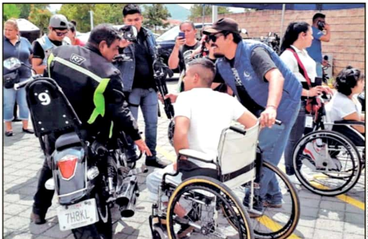
FAMILIARES Y PACIENTES DEL CRIT MICHOACÁN CONVIVIERON CON LOS MOTOCICLISTAS, QUIENES LES COMPARTIERON SUS EXPERIENCIAS DE VIDA.

Finalmente, Núñez Perea anuncia que la Rodada sin Límites está por concluir con su retorno a la Ciudad de México, donde buscarán romper una marca mundial. "Terminaremos en la Villa Olímpica, en el sur de la Ciudad de México. Vamos a tener un festival de inclusión y vamos a romper un récord mundial formando la palabra "inclusión" con al menos mil motocicletas ese día", concluye.