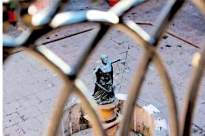
Fue el martes cuando se confirmó la destitución del docente que fue señalado a través de un video como acosador de estudiantes nicolaitas

Y es que dijo que el que saliera a la luz la denuncia hecha a través de un perfil de Facebook hizo que la comisión volteara los ojos a la problemática y se proyecte el inicio de una revisión en diferentes áreas como Medicina, Ingenierías y otras facultades.