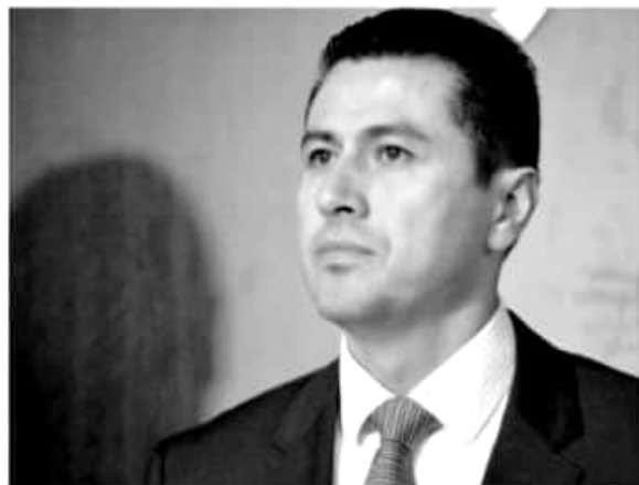
(CAMBIO | AGC)

Añadió que por el momento no hay reporte de municipios con problemas para efectuar las celebraciones michoacanas, sin embargo se mantendrán alerta ante cualquier eventualidad que pudiera poner en riesgo el desarrollo de las mismas.