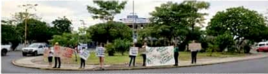
Integrantes de Ambientalistas de Corazón, durante la movilización que realizaron ayer aquí.