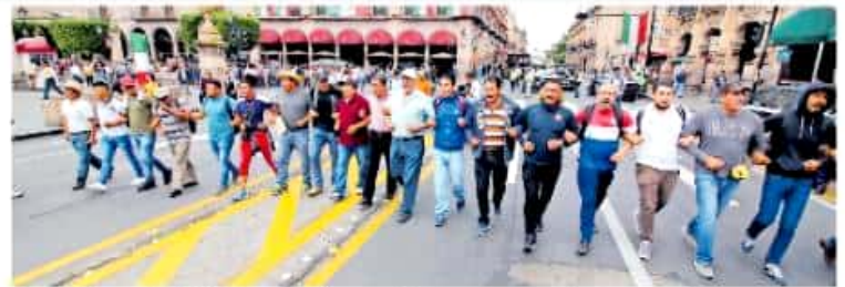
Agremiados a la CNTE intentaron llegar al Congreso pese al fuerte operativo

Desde temprana hora representantes de los más de 400 trabajadores de la Junta de Caminos arribaron a ese punto para exigir al go-