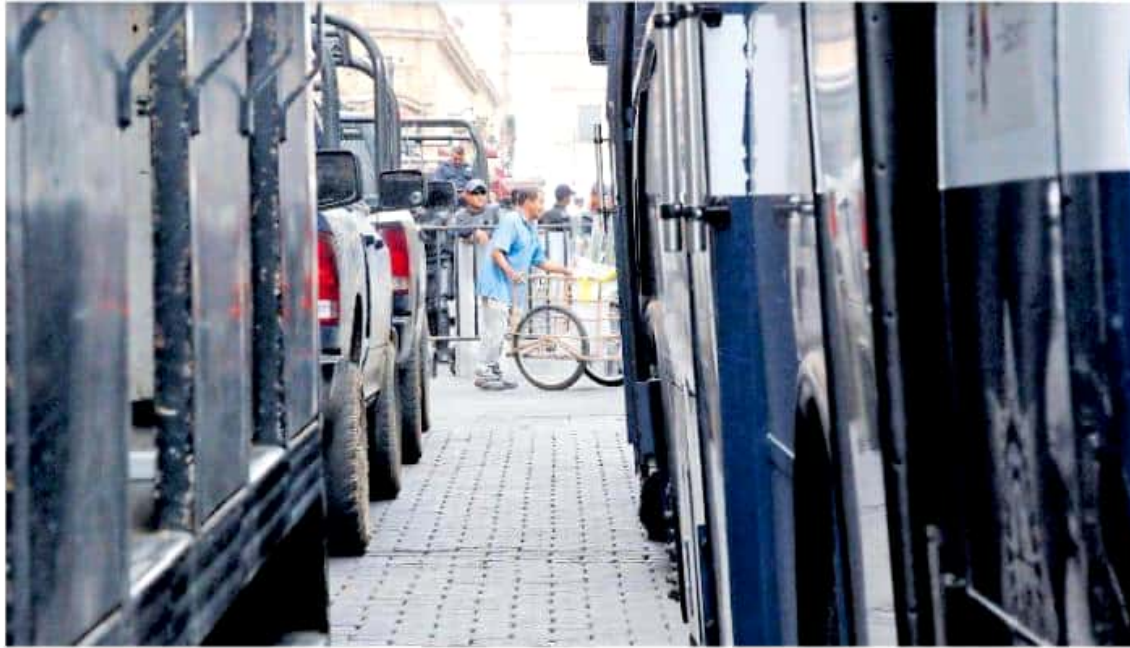
El Centro Histórico se convirtió en un búnker de seguridad con al menos 750 elementos de varias corporaciones.