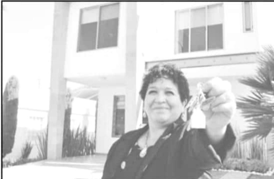
CON EL FIN DE DAR VIVIENDA DIGNA A FAMILIAS MORELIANAS, RAÚL MORÓN OTORGÓ SUBSIDIOS EN COLONIAS.

la República, por lo que se comenzarán las acciones pertinentes para que un mayor número de morelianos logre tener acceso a una vivienda digna, y de esta manera combatir uno de