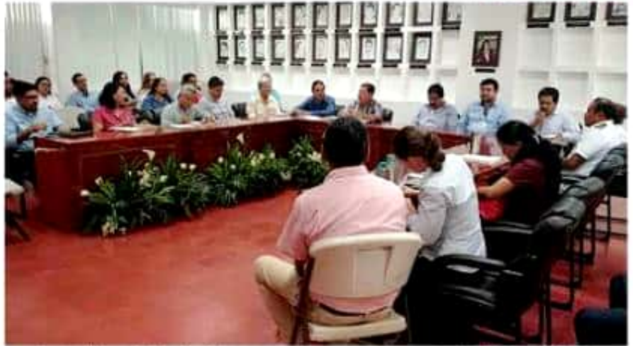
Aspecto de la reunión donde se dieron a conocer los avances de la organización del SEE-ORIENTA 2020.

Las partes, tendrán reunión de seguimiento el viernes 22 de noviembre.