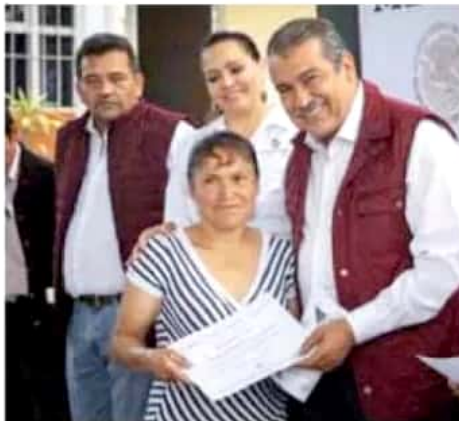
Habitantes de al menos cuatro colonias se vieron beneficiados.

Informó que los certificados entregados para el subsidio de viviendas permitirán tener un pie de casa, que incluye dos recámaras, un baño, cocina y un área de comedor o sala, por lo que pidió a la ciudadanía beneficiada vigilar que los recursos