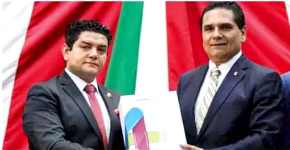
Este miércoles, el gobernador del estado entregó su Cuarto Informe de Labores al Poder Legislativo.

En materia de fortalecimiento de la infraestructura educativa, Aureoles señaló que en estos cuatro años se logró sustituir 350 aulas construidas de madera y cartón por escuelas nuevas. Además, dijo que en el mismo periodo se han mejorado en la entidad 54 de 63 indicadores educativos, pues en 2015 la entidad estaba en el último lugar nacional y hoy ocupa el sitio 14 en Matemá-