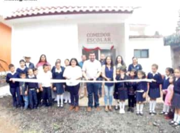
TINGÜINDÍN, MICH.- El alcalde Salvador Garcia Palafox inauguró un comedor escolar en El Moral.