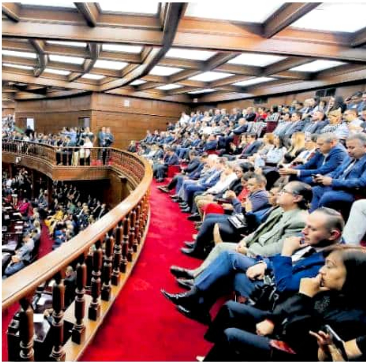
Frente a los legisladores, en el tema educativo destacó principalmente su intención de solicitar la federalización de la nómina del rubro. / FERNANDO MALDONADO