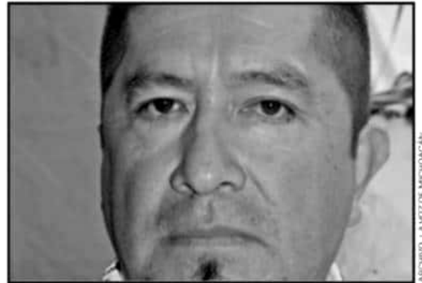
EL LÍDER DE LA CNTE EN URUAPAN SEÑALÓ QUE SE SUMARÁN A LAS ACTIVIDADES DE PROTESTA POR LA DESAPARICIÓN DE LOS NORMALISTAS.