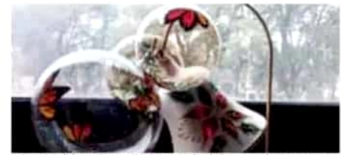
La Feria de la Esfera se ha consolidado tras 20 años de llevarse a cabo.

Asimismo, dijo que cada año a la Feria de la Esfera