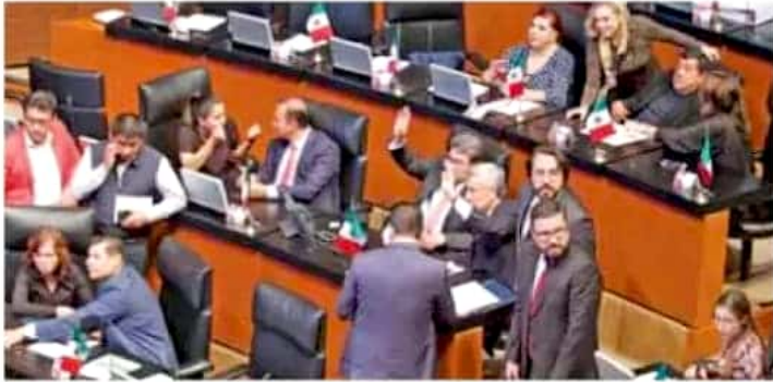
Desde que empezó la discusión, en cada uno de los escaños de los 24 senadores del Partido Acción Nacional (PAN) se colocaron cartulinas con la leyenda: "Educación sin mafia". | CUARTOSURCO