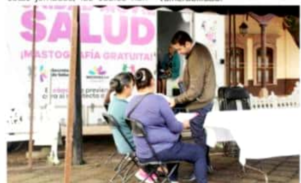
TINGÜINDÍN, MICH.- Con éxito se efectuó aquí una jornada de mastografías.

Finalmente, la regidora invitó a las mujeres de este municipio a estar atentas e informadas de los diversos programas que el Ayuntamiento ofrece, para así, poder crear ese vínculo con la actual administración que tiene el compromiso elevar la calidad de vida de todas las familias del municipio en especial las que se encuentran en estado de vulnerabilidad.