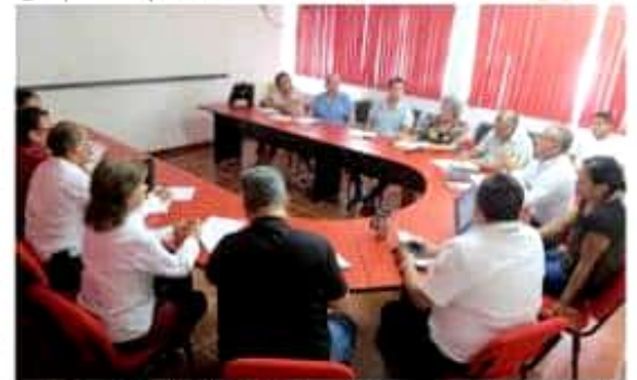
La Jurisdicción Sanitaria 08 y la SEE suscribieron un convenio para establecer acciones conjuntas en las diferentes escuelas del municipio, tendientes a mejorar cuestiones de salud bucal o de algunos padecimientos.