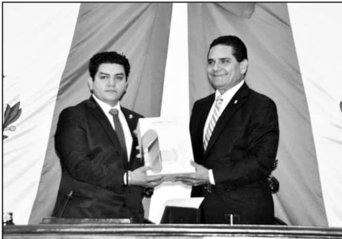
CONFORME AL PROTOCOLO, EL GOBERNADOR SILVANO AUREOLES HIZO ENTREGA DE SU CUARTO INFORME AL PRESIDENTE DE LA MESA DIRECTIVA DEL CONGRESO LOCAL.