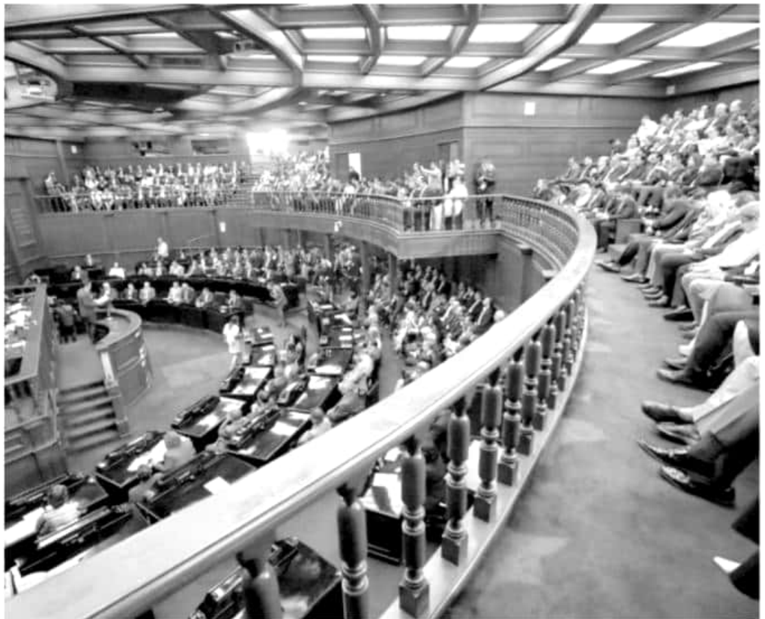
El mandatario estatal detalló avances en Seguridad, educación combate a la pobreza y salud.