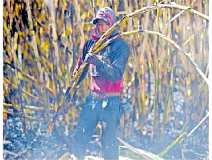
En Michoacán operan los ingenios "Lázaro Cárdenas", "Pedernales" y "Santa Clara", en Taretan, Pedernales y Tocumbo-Los Reyes.

La producción de caña de azúcar en la entidad enfrenta una disminución de 4.6% en el