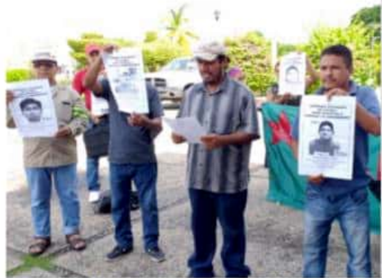
CD. LÁZARO CÁRDENAS, MICH.- La OIPEZ se solidarizó con la represión que agrupaciones como el Frente Nacional de Lucha por el Socialismo enfrentan por parte del gobierno de Chiapas