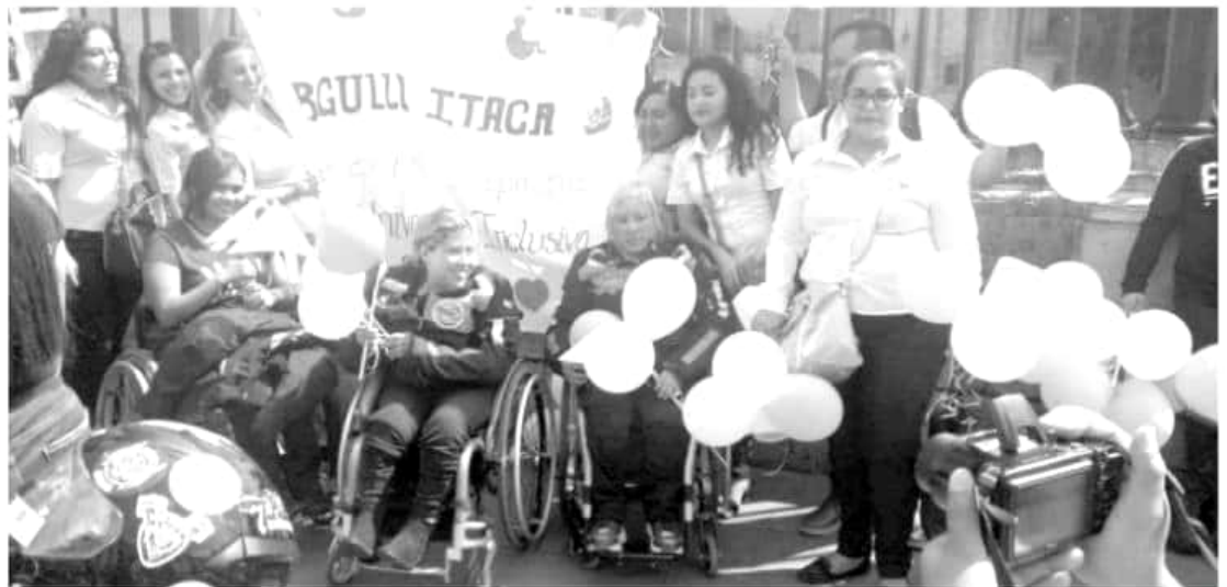
A bordo de una motocicleta modificada y después de un intenso adiestramiento de seis meses 13 personas con discapacidad viajan libres, sin obstáculos.

para en nada la sensación de sentir el aire en la cara que aun cuando conducen por tres horas seguridad en cansancio no toma importancia.