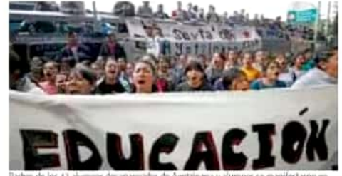
Padres de los 43 alumnos desaparecidos de Ayotzinapa y alumnos se manifestaron en las instalaciones de la Fiscalía General de la República para exigir justicia.

Al conmemorarse cinco años de la desaparición de los