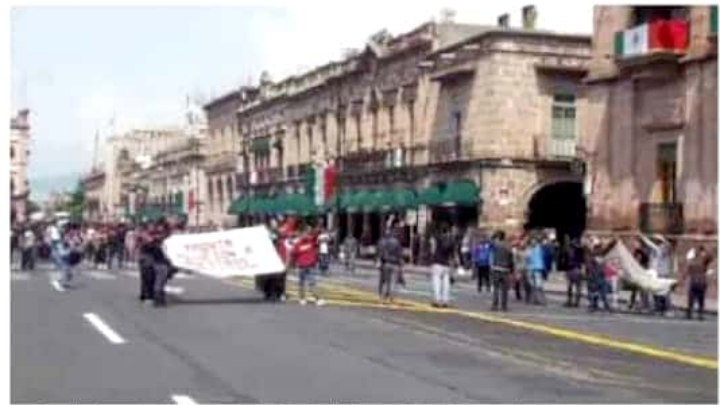
La entrega de plazas automáticas es una de las exigencias de los normalistas michoacanos. | HEBER MORALES

Sin embargo, dijo que no es un proceso sencillo, porque se tiene que revisar la información para que la entrega de las plazas a los normalistas sea transparente. Además, indicó