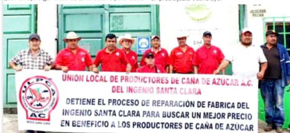
SANTA CLARA, MPIO. DE TOCUMBO, MICH.- En plena etapa de reparaciones en fábrica, productores cañeros bloquearon los accesos al Ingenio Santa Clara.

En el caso del nacional, existe el Sistema Nacional para la Información e Integración de Mercados (Sniim), sistema en el que se basa el pago a productores y que detectaron reportaba un menor costo al que se registraba en las centrales de abastos. Recordó que en enero de este mismo año se realizó el bloqueo de las bodegas de azúcar en el mismo ingenio ante el bajo precio del azúcar, situación que mejoró, pero aseguró que el panorama que enfrentan los productores para la próxima zafra 2019-2020 no es el esperado, situación que detono el bloqueo de los ingenios. Finalmente, reiteró que el bloqueo al personal obrero, con lo que se estaría paralizando el periodo de reparación de fábrica en el ingenio seguirá hasta que se llegue a un acuerdo. "Personal administrativo, de confianza y de campo siguen con sus actividades normales, solo se detiene la reparación, sabemos que no es lo correcto, pero es nuestra manera de manifestarnos para poder tener un precio justo", concluyó.