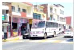
ZAMORA, MICH.- Transportistas locales exigen de la SCT ponga freno a la invasión de rutas urbanas por parte de unidades foráneas.

Al reconocer que pese a que son 300 pesos lo que se cobra, para cubrir gastos de la anestesia y viáticos de los médicos que las realizan, son bajos, pues en las veterinarias tiene un costo de 1,000 hasta los 3,000 pesos según el tamaño del animal.