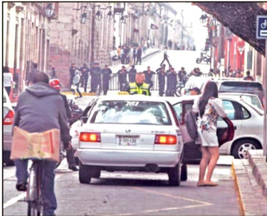
A MUCHOS LOS AGARRÓ POR SORPRESA EL CIERRE DE CALLES CUANDO IBAN A SUS ACTIVIDADES NORMALES.

En prácticamente todos los accesos se repitió la misma escena: ciudadanos que se hicieron de palabras con los uniformados por no poder acceder. Con el paso de las horas, los uniformados fueron endureciendo los accesos al grado de que el ingreso al Centro Histórico quedó condicionado por la