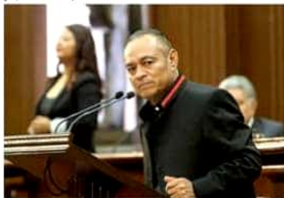
El diputado del GPPT, señaló durante la entrega del 4to informe de gobierno de Silvano Aureoles, que el Congreso del Estado hará su tarea para el bienestar de las y los michoacanos.