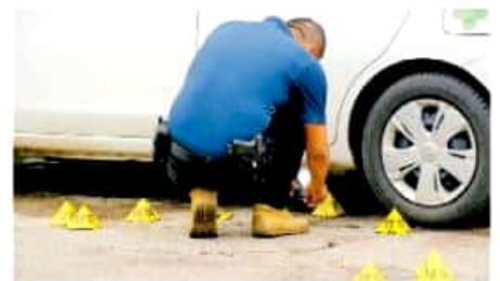
Existen varias líneas de investigación en ataque al bar California Grill.

Cuestionado por cuanto al panorama financiero que vislumbran para el próximo año en el estado, el también diputado local con licencia precisó que el monto necesario es por alrededor de 415 millones de pesos, que incluyen el incremento a la estructura de mando, a la estructura orgánica funcional y el incremento de áreas por la creación de tres fiscalías nuevas, la homologación sala-