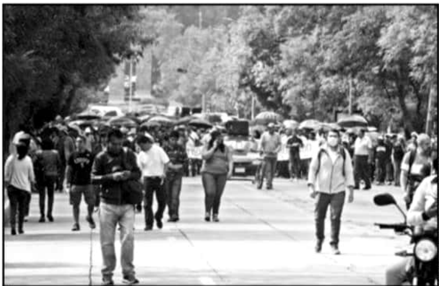
MAESTROS DE LA CNTE MARCHARON EN EL MARCO DEL CUARTO INFORME DEL GOBERNADOR SILVANO AUREOLES.