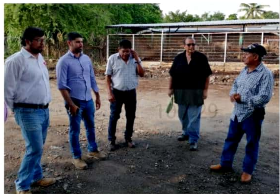
APATZINGÁN, MICH.- Autoridades municipales y transportistas tomaron acuerdos que permitirán brindar un buen servicio a la ciudadanía durante las ya próximas fiestas octubrinas.

La Florida, posteriormente se desviará el tráfico por Melchor Ocampo y la salida de los vehículos será por la calle Benito Juárez, con lo que se evitarán embotellamientos en la vía directa a la Expo Feria. De igual manera, se acordó que la entrada y salida que se encuentra a un costado de la Coca Cola, servirá para que los vehículos que queden en el estacionamiento del lado derecho del Recinto Ferial, salgan sin ningún problema. Asimismo y aunque se realizarán otras reuniones entre autoridades y el transporte público, se determinó que las tarifas serán las mismas, es decir, 40, 50, 60 y 70 pesos, para los taxis, dependiendo de la distancia de las colonias, dado que la tarifa por dicho servicio no ha incrementado.