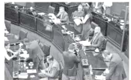
Ya se les exhortó para que den celeridad a los trabajos de revisión y análisis.

Anticipó que la bancada a su cargo pretende cerrar el primer periodo legislativo con un total de cien iniciativas presentadas ante el Pleno de la LXXIV Legislatura, ya que "tenemos claro que el reto