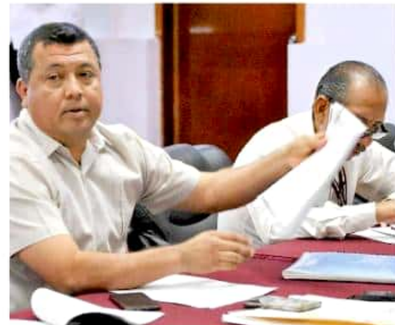
En sólo tres meses, 538 mil pesos fueron otorgados a funcionarios locales.