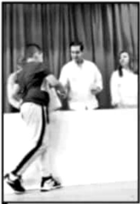
FEDERACIÓN, ESTADO, MUNICIPIOS Y MIGRANTES BECARON A JÓVENES.