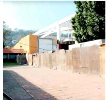
En 2016 se programó una inversión de más de 91 millones de pesos para este lugar. MARIANA LUJÁN

10% SE elevaría la ocupación de alojamiento cada año si se termina