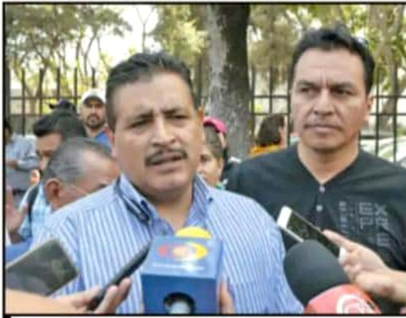
VÍCTOR ZAVALA, LÍDER DE LA CNTE, SEÑALÓ QUE EXISTE LA POSIBILIDAD DE INICIAR LOS TRABAJOS PARA EL RELEVO SECCIONAL EN EL ESTADO.

Explicó que la definición se tendrá que realizar en un pleno sec-