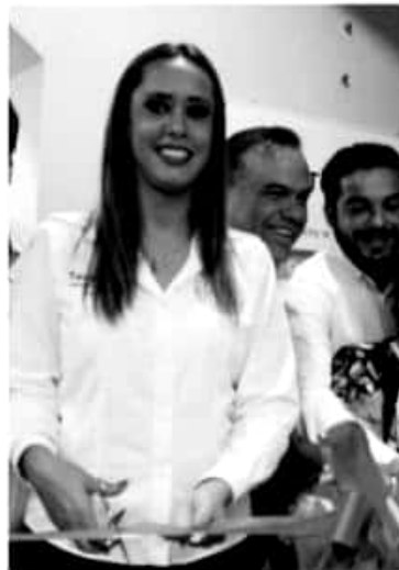
La diputada María Teresa Mora.

En contraparte, el reporte expone a Tabasco, Durango, Morelos, Tlaxcala, Chihuahua, Campeche y Estado de México, liderando la lista de los estados con mayor crecimiento de homicidios dolosos durante el mes de abril, comparado con el mismo mes del 2018.