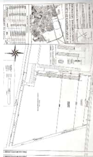
Un error en las colindancias, probable causa de la disputa. GEORGINA GASCA

Hoy la presente administración municipal tuvo conocimiento del hecho y se ve obligada a buscar alternativas para subsanar el ilícito ante la doble venta de solicitud de un predio que se presume se debió a error de dimensiones y colindancias que traslaparon el citado predio.