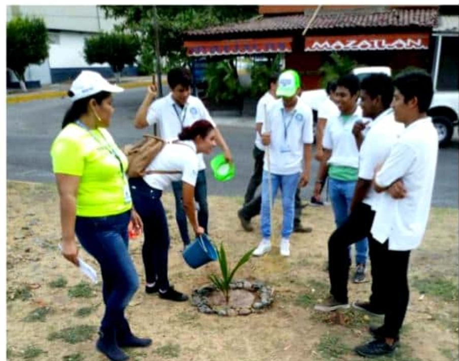
CD. LÁZARO CÁRDENAS, MICH.- Se realizó una campaña de reforestación en el camellón de la avenida Rector Hidalgo.

La funcionaria, al tiempo de exhortar a la población en el cuidado de la flora de la región, extendió la invitación para que participen en la próxima campaña de reforestación que el próximo lunes tres de junio se llevará a cabo en el Boulevard Costero, a partir de las ocho de la mañana.