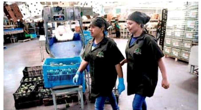
Hacia el vecino país del norte se va 87% de la producción exportable.

Anotó Medina Niño la existencia de estrategias para fomentar la producción en el sector agropecuario, donde el aguacate no es la excepción, pero también existen