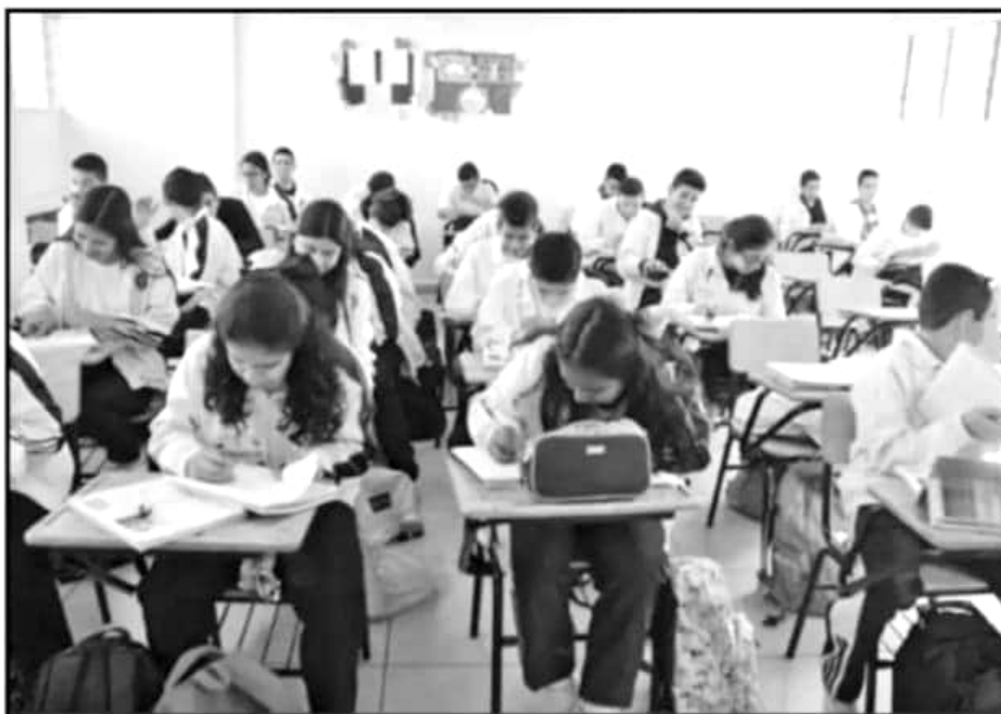
SE PREVÉ QUE PARA JULIO SEAN ENTREGADOS TODOS LOS LIBROS Y LOS NIÑOS INICIEN CON ELLOS EL CICLO ESCOLAR.

En este sentido, la Federación señaló que el pasado lunes 20 de