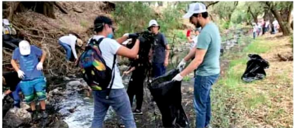
Se recolectó basura, se realizó la poda del tramo y se retiró maleza del cauce.