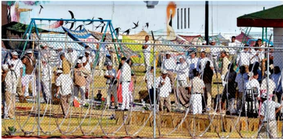
Para el caso de la prisión de Zamora, ya se hizo lo conducente para evitar cuestiones como sobrepoblación. LAZARO MORALES