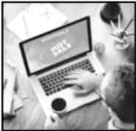
LAS VENTAS EN INTERNET VAN COBRANDO AUGE PAULATINAMENTE.

"Todo esto en su conjunto permite que haya más participantes no sólo comprando, sino también ofreciendo producto, pues en los últimos años se han sumado competidores bastante relevantes", apuntó el directivo.