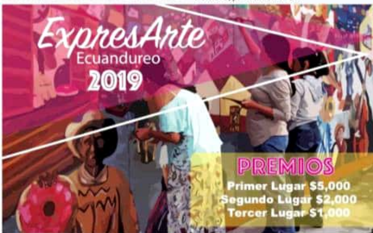
ECUANDUREO, MICH.- Con una invitación a colectivos locales y foráneos, autoridades municipales anunciaron el concurso de murales y arte urbano "Expresarte Ecuandureo 2019".