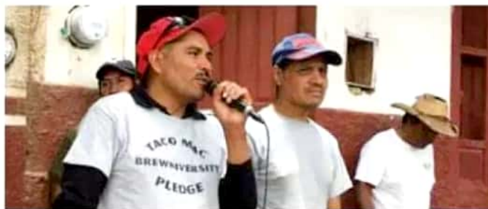
La participación de sus habitantes transcurrió en completa calma.

Aunque se instalaron cuatro centros de votación en diferentes zonas de la tenencia, la mayoría de los habitantes decidió participar en la asamblea comunal, que en cada renovación de la autoridad auxiliar se lleva a cabo en la plaza principal, donde los habitantes son quienes deciden los perfiles, sin intervención de las autoridades del Ayuntamiento de Morelia. El proceso de renovación por usos y costumbres se