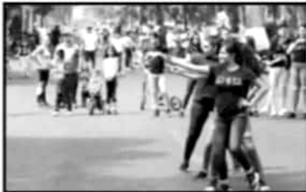
ESTETIPO DE ACTIVIDADES AYUDAN TAMBIÉN A LA RECUPERACIÓN DE ESPACIOS PÚBLICOS Y DEL TEJIDO SOCIAL.

Señaló que se trata de un programa en el cual participan otras dependencias municipales como el Instituto Municipal del Deporte, Protección Civil y la Secretaría de Seguridad Pública Municipal a través de la Dirección de Tránsito y Vialidad Municipal, así como el DIF Muni-