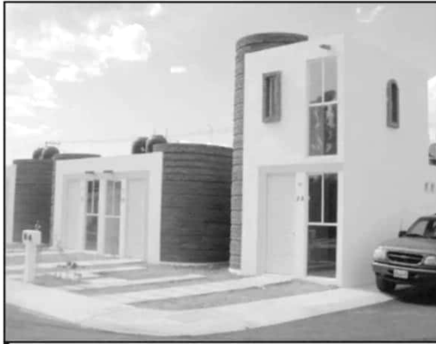
PROFECO RECOMIENDA REVISAR A FONDO LAS VENTAJAS QUE TIENE UNA CASA ANTES DE COMPRARLA.

Cuando la adquisición se piensa hacer por medio de un crédito, se debe tener conocimiento del tipo de préstamo que se contratará, "hacer una proyección del monto a pagar, que incluya la tasa de interés, las comisiones y los cargos", así como las "erogaciones que se pueden generar con independencia del precio de la venta, tales como gastos de escritura, im-