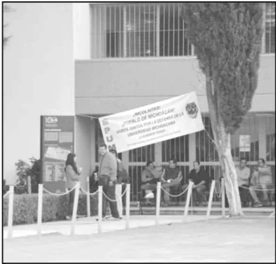
ESTA CONTROVERSIA EN EL SPUM SE DE AL MISMO TIEMPO QUE DEBE REVISARSE LA REFORMA A JUBILACIONES.