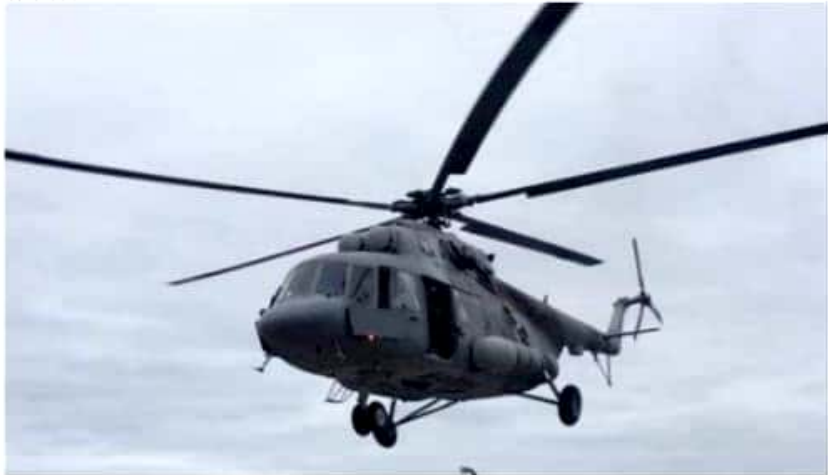
CD. LÁZARO CÁRDENAS, MICH.- Los cinco marinos fallecidos en el accidente aéreo radicaban en Lázaro Cárdenas, junto con sus familias.