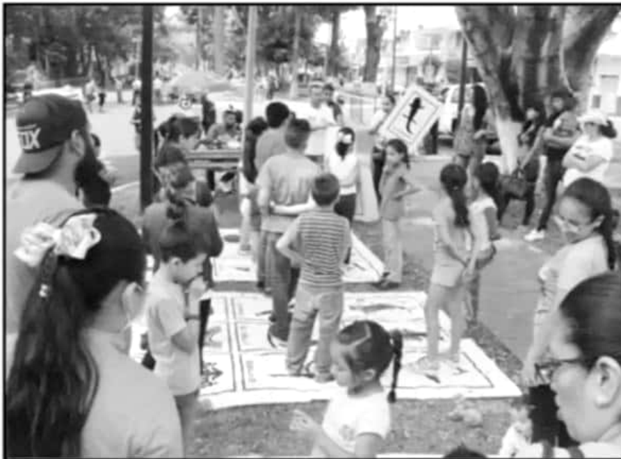
CIENTOS DE FAMILIAS ASISTEN A LAS ACTIVIDADES QUE ORGANIZA EL AYUNTAMIENTO PARA FOMENTAR LA CONVIVENCIA.