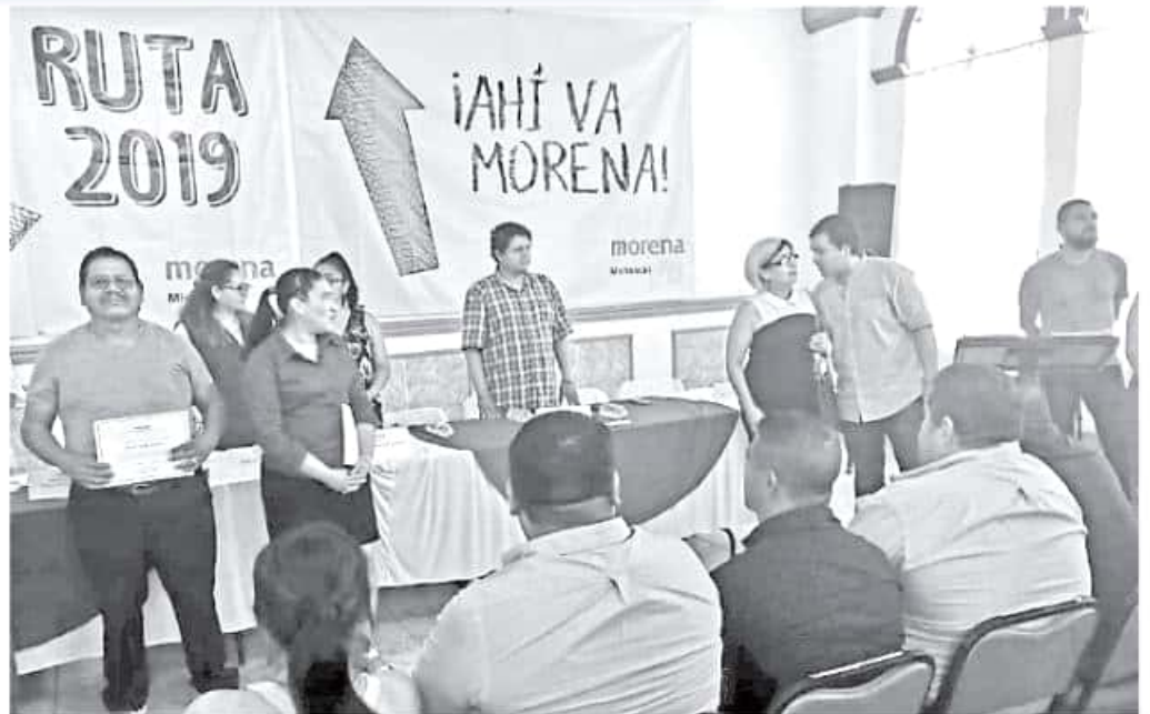
No estamos atacando al partido, queremos fortalecerlo erradicando hábitos insanos.