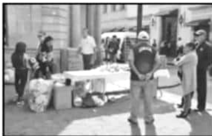
OTRA DE LAS QUEJAS CONSTANTES ES CONTRA LOS INSPECTORES DEL AYUNTAMIENTO EN EL TEMA DEL AMBULANTAJE.

A nivel estatal, después de las corporaciones policiacas, en Michoacán son las dependencias de servicios de salud y las educativas las que más quejas por violaciones a derechos humanos presentan año con año ante la CEDH.