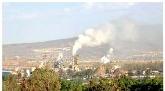
Las partículas viajan de manera circular de sur a oriente, hasta el norte, es decir hacia el área de Tarímbaro. LAZARO MORALES

Torres Mandujano enfatizó que el aire ha elevado al ambiente partículas orgánicas, metales y polvos, entre los que mencionó dióxido de azufre, carbono y nitrógeno, además de componentes propios de