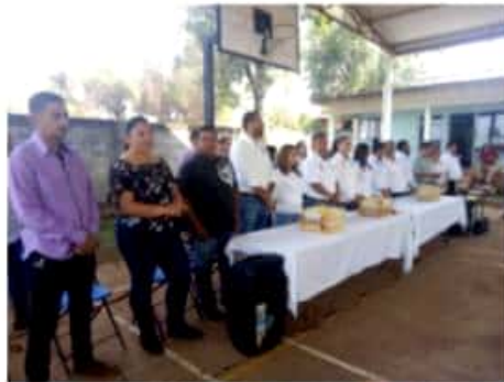
EL PINO, MPIO. DE TARETAN, MICH.- Los regidores, así como los miembros del cabildo, asistieron a la entrega de la obra del aula en la comunidad de El Pino, donde después de varias administraciones se construyó, beneficiando a 65 alumnos.

El aula de 6 x 8 metros, beneficia a 65 alumnos, la cual fue hecha con recursos del FAIS y del municipio, con una inversión de 521 mil 414 pesos. Después del acto oficial el presidente, junto con la comitiva y los niños de la escuela primaria "Francisco J. Mújica", realizaron el corte del simbólico listón del aula y los pequeños agradecieron a las autoridades municipales por haber realizado esta obra, que tanta falta les hacía.