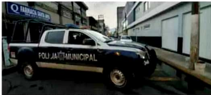
Fueron dos atentados en contra de policías en esta población. | RED 113

El tiroteo ocurrió en la calle Ferrocarril, cerca de las instalaciones de la Universidad Michoacana de San Nicolás de Hidalgo, en la colonia Centro; ahí, tres policías municipales resultaron gravemente heri-