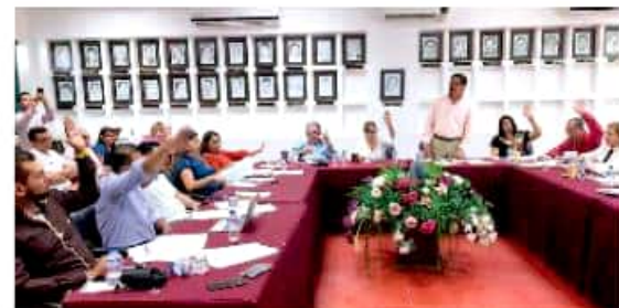
El dinero se debe recuperar de inmediato para satisfacer el bienestar social de los porteños.

No voy a dejar de ejercer mi derecho a la libertad de expresión, al señalar a los malos funcionarios"