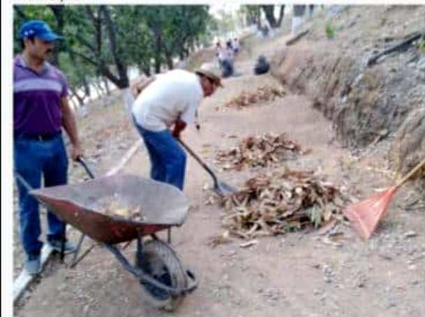
CD. LÁZARO CÁRDENAS, MICH.- Este fin de semana se llevó a cabo una campaña de limpieza en el parque "Erandeni", donde a su vez se instalaron seis luminarias.