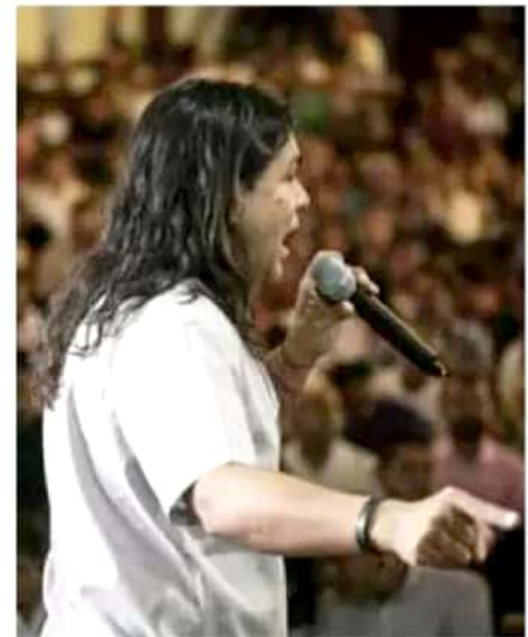
Morena culminó una serie de foros distritales federales denominados "Ruta de la Unidad".

Para ello, convocó a los seguidores del movimiento guinda a movilizarse: "De aquí a noviembre tienen la obligación de desplegarse por el estado y transmitir ese mismo mensaje; que nadie se preocupe, esto no es una cuestión de jerarquías, cargos, puestos; tampoco es un trampolín político para