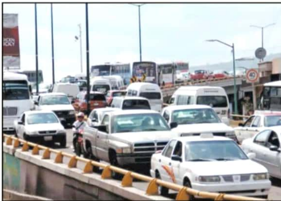
LA FALTA DE PLANEACIÓN VUELVE CADA VEZ MÁS CAÓTICO EL TRÁNSITO EN LA CIUDAD Y ZONA METROPOLITANA.

agencia establecida en la capital michoacana tiene metas de venta que no son dadas a conocer a las autoridades ambientales pero que rebasan las decenas de vehículos mensuales cada una.