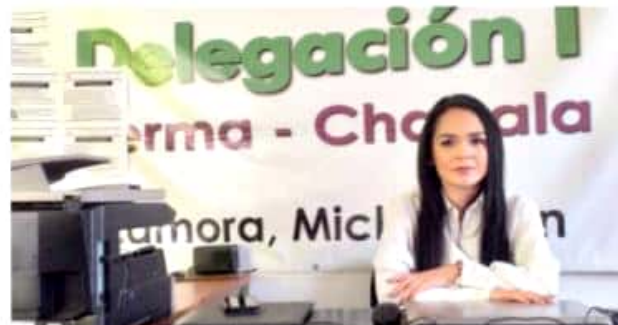
ZAMORA, MICH.- De acuerdo a la Compesca, en El Valle de Zamora existen una vigorosa actividad en la acuicultura lo que ha permitido que esta zona conserve el liderazgo estatal en la producción de bagre.

La producción del pescado dijo, es redituable, pues una granja bien cuidada logra rendimientos de más del 60 por ciento, por lo que se busca que más personas se muestren interesadas en esta actividad.