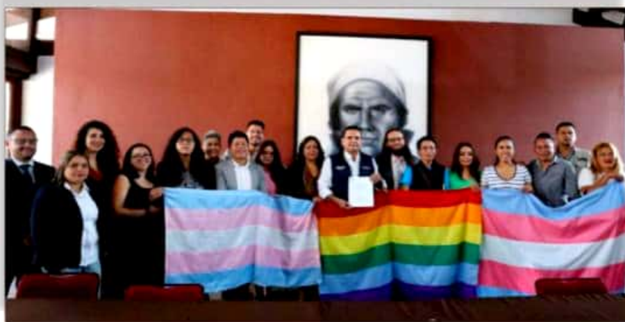
El Gobernador Silvano Aureoles se reunió con la comunidad LGBTTTIAQ+.