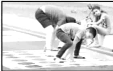
CHICOS Y GRANDES SE DIVIERTEN Y REALIZAN ACTIVACIÓN FÍSICA A TRAVÉS DE DIVERSOS JUEGOS.