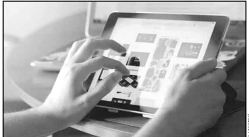
LA CONDUSEF PIDE A CONSUMIDORES TENER MESURA EN LOS GASTOS DURANTE LOS DÍAS DEL HOT SALE.

De los encuestados que no compran online, la mayoría (72%) no lo hace porque prefiere ir a la tienda física, mientras que 14% dice no estar familiarizado, 9% siente desconfianza y por último