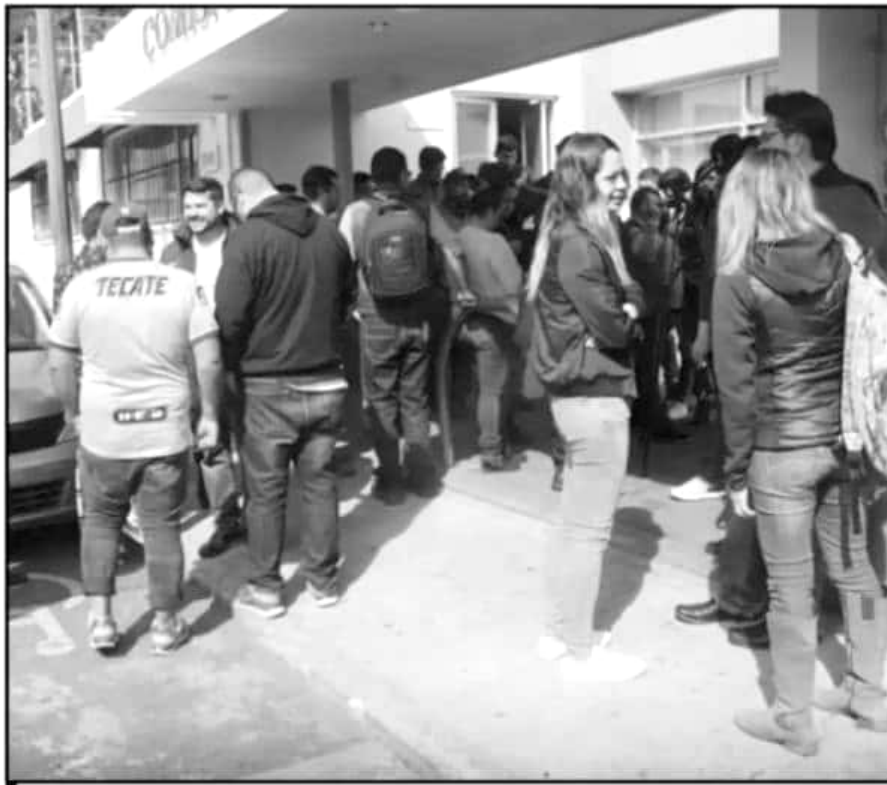
LA COMISIÓN ESTATAL DE DERECHOS HUMANOS HA GANADO CONFIANZA ENTRE LA CIUDADANÍA, QUE CADA VEZ ACUDE MÁS.