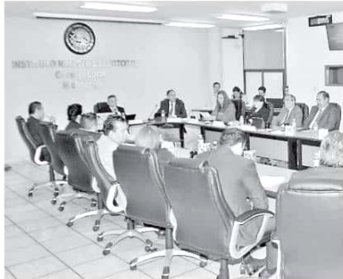
Entre otras funciones, son los que se encargan de generar las impresiones y distribución de las boletas comiciales en cada entidad.

En primer lugar: el registro y seguimiento de las candidaturas a gubernatura, diputaciones locales y ayuntamientos, sobre todo porque son los organismos locales quienes se encargan de la recepción de do-