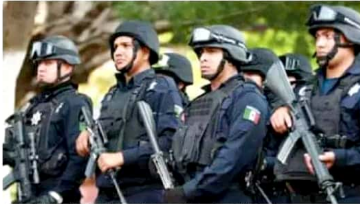
Militares, policías federales, ministeriales y estatales se suman a las tareas de seguridad.

Tras los ataques a policías, este lunes se puso en marcha en ese municipio la segunda fase del Plan de Seguridad