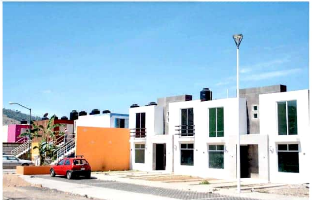
La nueva administración se impuso la misión de disminuir el rezago habitacional, sobre todo en las regiones de mayor marginación en el país.

"Realmente para no impulsar las nuevas reglas muchas veces omiten los datos, hemos sido muy congruentes en pedirles viviendas dignas, pero que si no sea un abuso por parte de estas instituciones", matizó al señalar que ni en Michoacán, ni a nivel nacional, se conocen realmente los parámetros de la situación.