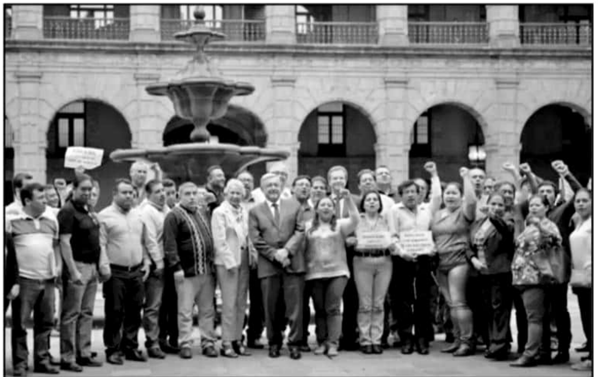
ESTE LUNES, DIRIGENTES DE LA CNTE EN EL PAÍS SE REUNIERON CON EL PRESIDENTE ANDRÉS MANUEL LÓPEZ OBRADOR, PARA ABORDAR SUS PENDIENTES.

Sin embargo, reconoció los desacuerdos del magisterio, y dijo que para superarlos inicia-