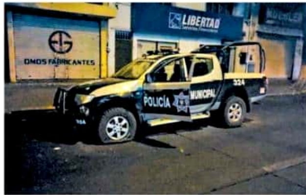
Individuos armados, a bordo de camionetas rotuladas con las iniciales CJNG, enfrentaron a policías el pasado domingo en Zamora