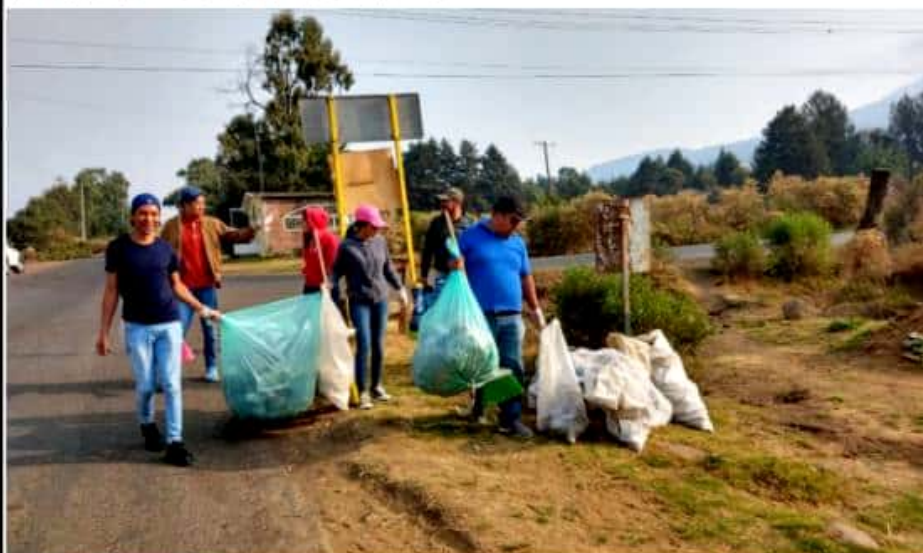
CORUPO, MICH.- Jóvenes de esta comunidad se dieron a la tarea de hacer limpieza comunitaria.

La intención dijo la joven estudiante, es además de contar con una localidad limpia, contribuir a fomentar una cultura del reciclaje, que reduzca el uso de materiales desechables en la comunidad, así como buscar alternativas para que estos sean reutilizados; el trabajo realizado hoy comentó, es una primera acción de varias que tenemos programadas en el municipio con la participación de los habitantes.