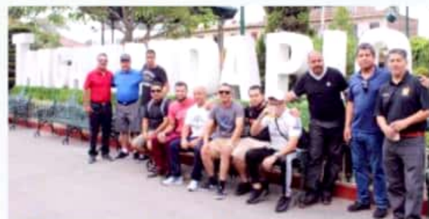
SANTIAGO TANGAMANDAPIO, MICH.- El grupo de migrantes que arribaron para participar en diferentes actividades, fue despedido por autoridades municipales.

Además de la develación de la placa conmemorativa por los 30 años de la visita de los paisanos, el alcalde agradeció el esfuerzo que hacen todos ellos por lograr estar en su tierra, quien aseguró que esta placa plasma la historia del pueblo.