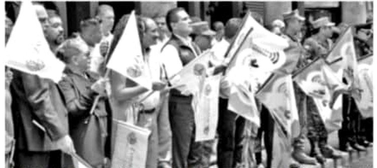
ZAMORA, MICH.- Silvano Aureoles Conejo, durante el banderazo de arranque de la segunda fase del Plan Integral de Seguridad en el municipio de Zamora.

"Gracias por venir a fortalecernos en momentos difíciles en donde la sociedad requiere su apoyo", manifestó.