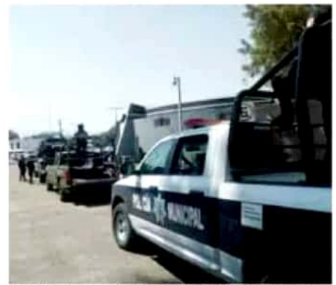
El edil dijo que hay certeza de que la Guardia Nacional llegará pronto.