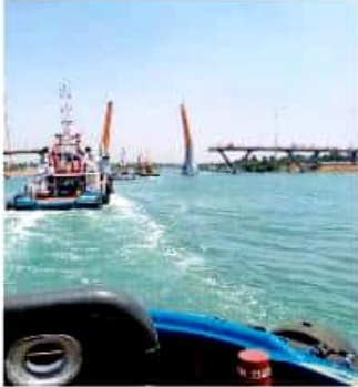
Los inconformes señalan que hay grandes daños. / GEORGINA GASCA