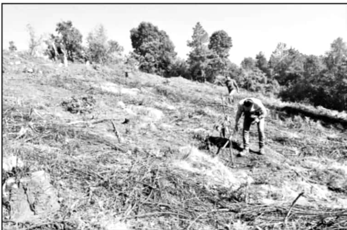
ÁREAS COMO EL COMBATE A INCENDIOS Y DE REFORESTACIÓN EN EL ESTADO QUEDARÍAN VULNERABLES ANTE EL DESPIDO DE PERSONAL DE LA SEMARNAT.

Para la mitad de este año, los trabajadores refieren que esperan un total de 7 mil recortes de personal a nivel nacional, de los cuales, aún no se notifica cuántos aterrizarían en la capital michoacana, correspondiente a una de las entidades con la mayor cantidad de problemas en la preserva-