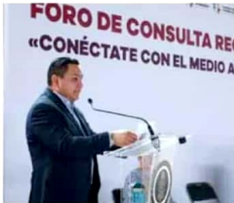
El alcalde de Uruapan participó en el 2º Foro de Consulta Regional que se llevó a cabo en el Cecfor de esta ciudad.

El foro se realizó en el Centro de Educación y Capacitación Forestal No. 1 (Cecfor) "Dr. Manuel Martínez Solórzano", en donde el alcalde recaló que el gobierno municipal no se ha quedado de brazos cruzados ante los efectos del cambio climático y el deterioro ambiental, por lo que refirió que se hacen ajustes al marco legal para prohibir el uso de bolsas de plástico y de envases PET en este municipio, en donde también se otorgarán incentivos a