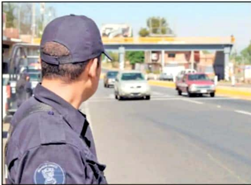
EN LOS ÚLTIMOS DÍAS, LA SEGURIDAD PÚBLICA EN EL ESTADO SE HA VISTO DIEZMADA POR LOS EMBATES DELICTIVOS.

Al respecto, el gobernador Silvano Aureoles ha sido enfático que el objetivo es el despliegue permanente de elementos de las diferentes corporaciones que permita equiparar la cantidad de población con la necesidad de seguridad pública. Por lo anterior,