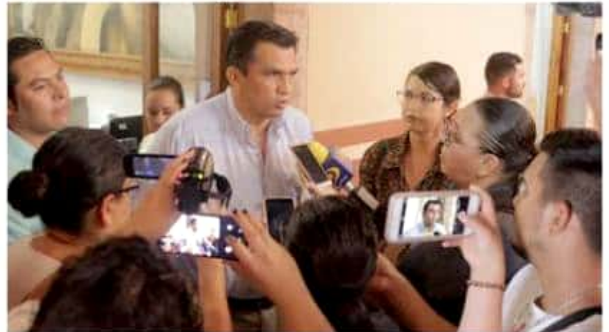
Es inaceptable que el presidente López Obrador no atienda un municipio gobernado por su partido: Javier Estrada.

la seguridad en todo el país y vemos que ha fracasado", indicó.