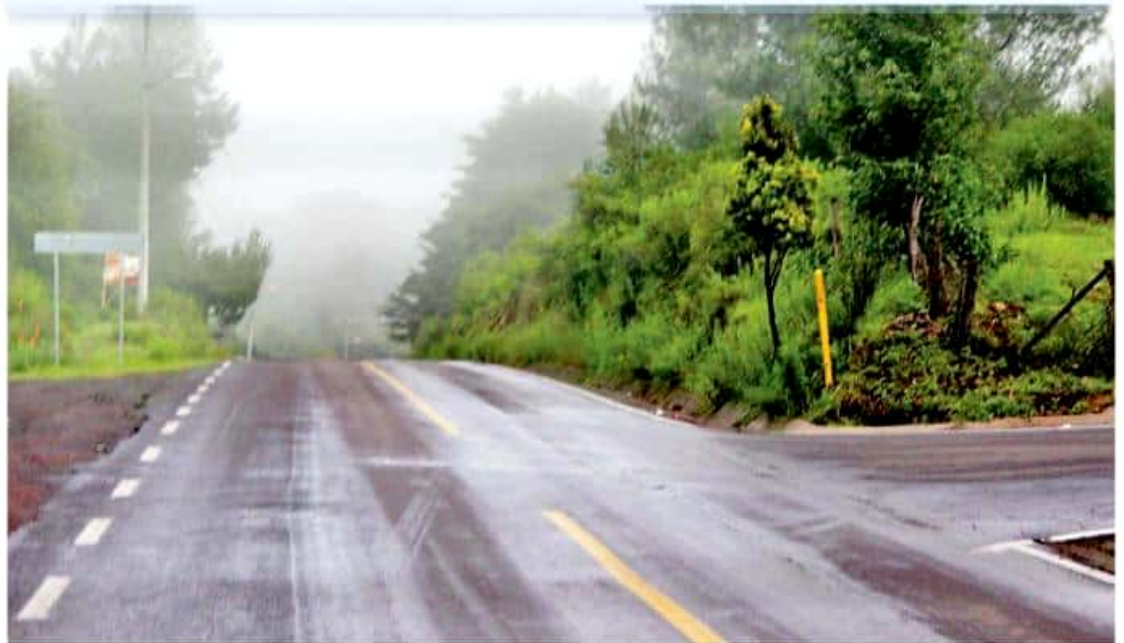
Uno de los planes es la conservación rutinaria de los tres mil kilómetros de jurisdicción estatal, pero si se pretende ejecutar con base en las normas establecidas por la SCT, el costo se elevaría demasiado.