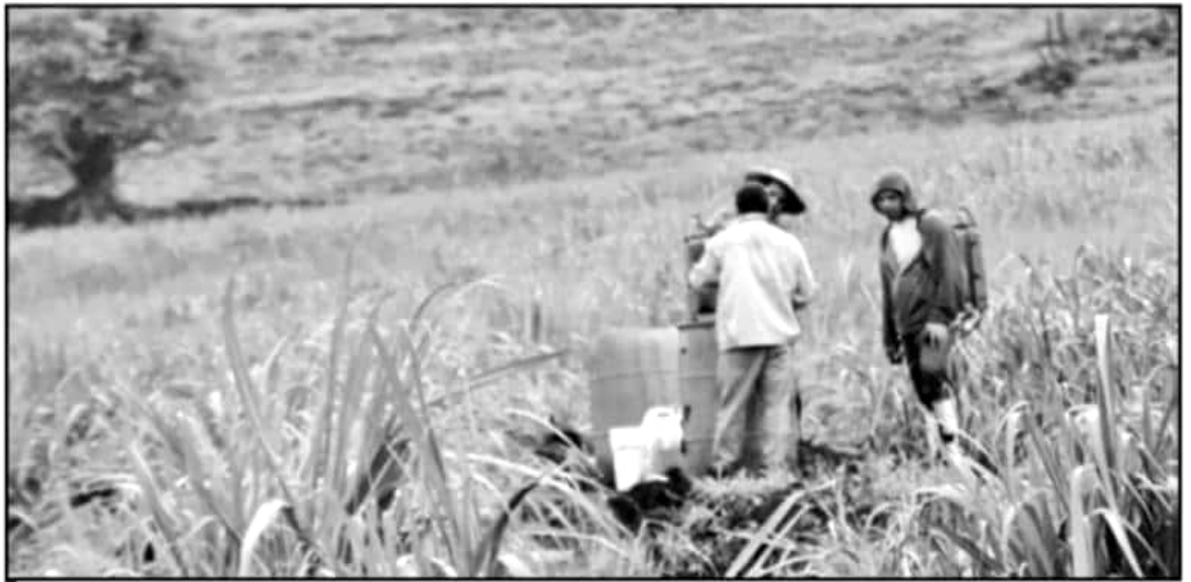
LA PRODUCCIÓN AGRÍCOLA PADECE LOS EFECTOS DEL CAMBIO CLIMÁTICO, NO SÓLO CON FENÓMENOS NATURALES, SINO TAMBIÉN CON PLAGAS

evento a realizarse en el CIAC de la Universidad Michoacana, fungirá como espacio sede para el evento donde científicos, autoridades y profesionistas dedicados a la protección vegetal, estudiantes, productores e industria entre otros, compartirán conocimientos actuales sobre los insectos, ácaros y otros artrópodos cuyo comportamiento como plagas afecta a los cultivos, al ser humano y a los animales domésticos.