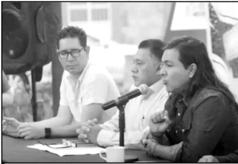
EL DIRIGENTE ESTATAL DE MORENA DIJO QUE LOS DOCUMENTOS ENCONTRADOS NO SON UNA PRUEBA CONTUNDENTE.

De acuerdo con los reportes, el tema trascendió a mediados de la semana pasada pues hacía referencia a los pagos de viáticos de una congresista a China, así como 10 días de hospedaje en ese país asiático, por un monto de al menos 40 mil pesos. A ellos se sumaba el caso de un reembolso por 13 mil pesos por compra de juguetes repartidos con motivo de Día del Niño. A la postre, algunas voces consideraron que había un uso de recursos en acciones ajenas a su quehacer legislativo, una intención de promoción personal y