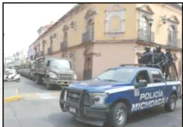
LA POLICÍA MICHOCÁN ENVIÓ UN DESTACAMENTO ARMADO A LA CIUDAD.