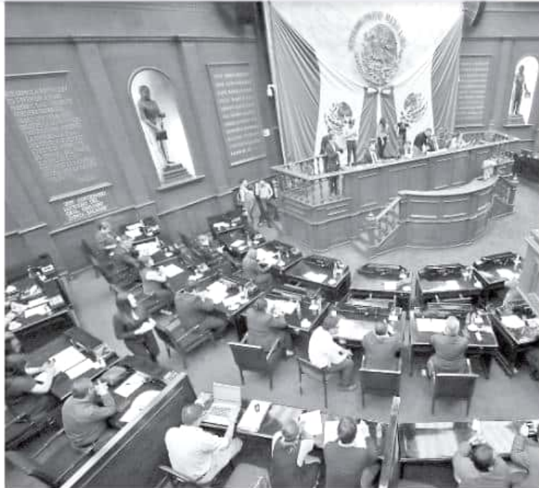
La filtración de los oficios en varios medios de comunicación fue una cuestión de golpeteo político en contra de Morena.

da claridad lo que en otros momentos nos ha recordado el presidente Andrés Manuel López Obrador, preferimos quedarnos sin diputados a solapar prácticas de un México que tratamos de superar", sentenció.