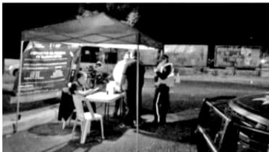
URUAPAN, MICH.-En apego a la normativa local, la Secretaría de Seguridad Pública Municipal, a través de la Dirección de Tránsito y Vialidad, emprende el operativo alcoholímetro a fin de evitar accidentes en el municipio.

Cabe señalar que el 90 por ciento de los incidentes que se registran en la ciudad durante los fines de semana, se deriva por conducir bajo los influjos del alcohol.