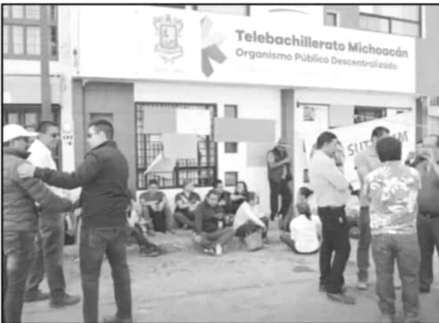
EL VIERNES PASADO TOMARON EL TEBAM POR DESCONTAR PAGO A MAESTROS QUE FALTARON A CLASES.

Exclusivamente en horario de 10:00 a 18:00 horas, de lunes a viernes. Para realizar el cobro, presentarse con identificación en original y copia.