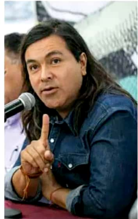
El líder morenista respondió a declaraciones del titular del Ejecutivo.

"Si nuestros presidentes municipales lo están pensando, no tiene que ver con que no quieran mejorar la seguridad, hay muchos factores que se tienen que analizar; no es tan fácil, sobre todo por el tema económico", adujo.