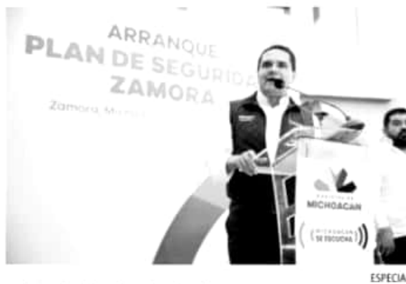
El gobernador del estado, Silvano Aureoles.

En este marco, Silvano Aureoles ofreció sus condolencias a los familiares de los policías caídos y comprometió dar segui-