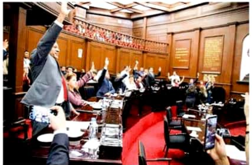
Grupo parlamentario de Morena en una sesión de la 74 Legislatura local.

Remarcó que las y los diputados de extracción morenista mantendrán un firme compromiso para corresponderle a quienes depositaron en éstos su voto de confianza en la pasada jornada comicial. "Morena será siempre una plataforma para atender las problemáticas sociales que hoy en día enfrenta Michoacán", finalizó.