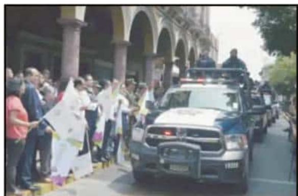
CON UN 'DESFILE' QUE FUE CRITICADO EN REDES SOCIALES, INICIÓ EL OPERATIVO.