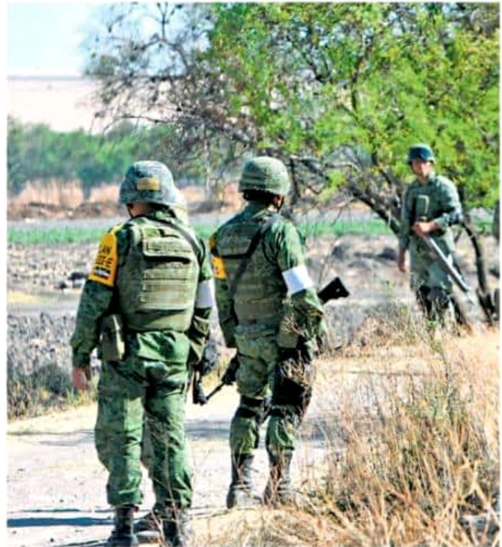
Más vigilancia estatal y federal enviarán a los límites entre Guanajuato y Michoacán. MARTÍN MARTÍNEZ

Para las autoridades de inteligencia militar y de seguridad nacional, el municipio de Zamora comenzó a ser campo de guerra desde 2014, cuando el cártel de Los Viagras, originario de Tierra Caliente, se vio desplazado de su territorio "natural" por el Ejército y las fuerzas federales, una