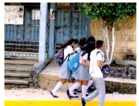
El Imced y la Universidad Vizcaya de las Américas se han sumado al proyecto.

Estamos en una crisis muy fuerte de deserción escolar y eso a la Secretaría de Educación en el Estado le preocupa