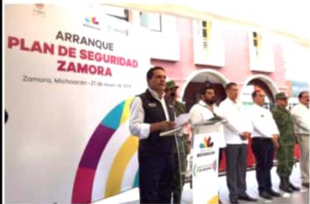
ZAMORA, MICH.- En el marco de la puesta en marcha del Plan de Seguridad Zamora, el gobernador advirtió a grupos delictivos que a Michoacán se le debe respetar, por ello este tipo de acciones para garantizar la seguridad de los habitantes.

Posterior a la puesta en marcha del plan, en rueda de prensa, el gobernador dijo que el tema de la Guardia Nacional ya se trabaja, y que Michoacán como Zamora, serán de los primeros beneficiarios; mientras tanto trabajarán en conocer el móvil de los grupos delictivos, quienes pelean por apoderarse de los territorios y las rutas, por controlar giros negros y los cobros de piso.