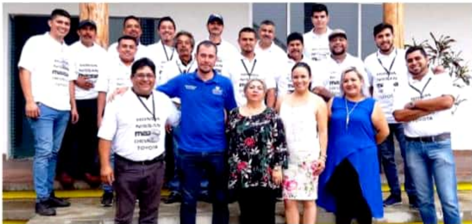
LOS REYES, MICH.- La Casa de la Cultura de Los Reyes fue sede de un curso de capacitación a mecánicos automotrices de la región.