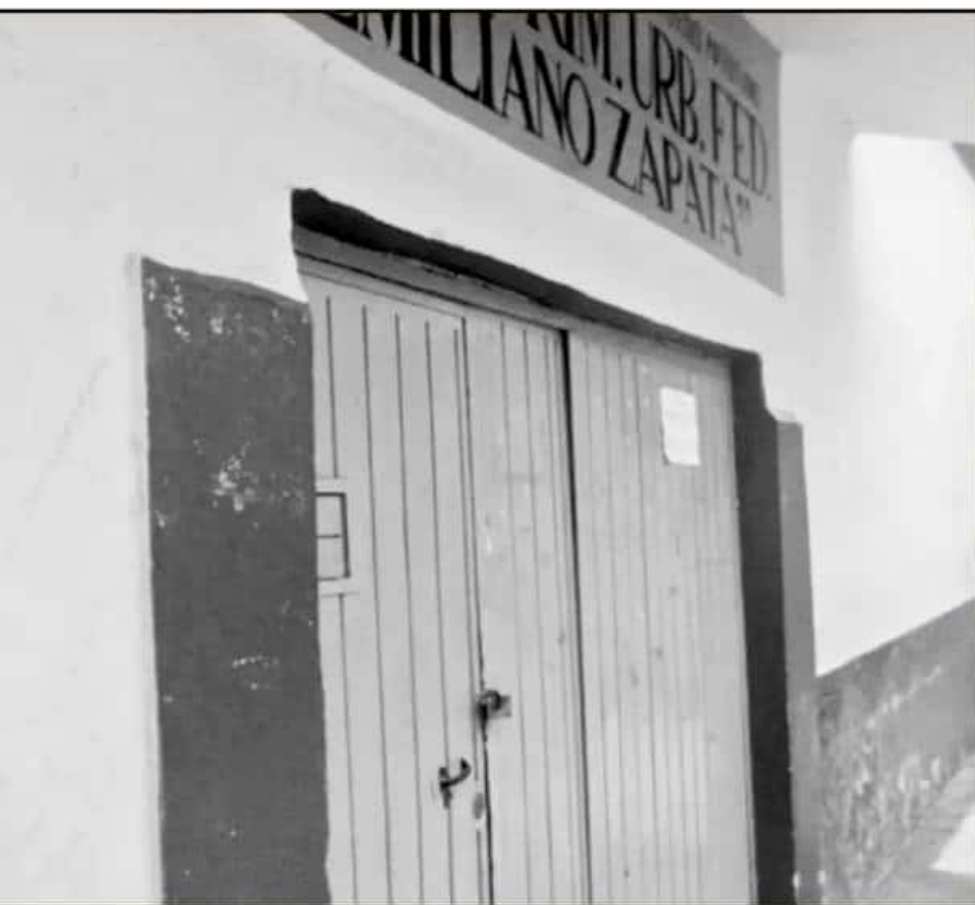
LA COORDINACIÓN DEL ESTADO ANUNCIÓ QUE HABRÍA CLASES, LA REALIDAD FUE OTRA. PADRES Y MAESTROS DECIDIERON CERRAR ESCUELAS.