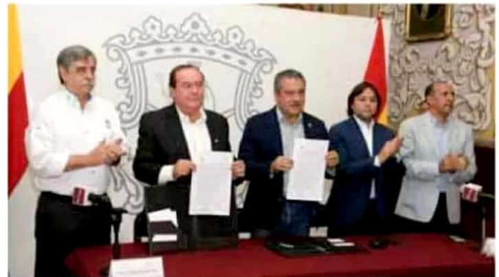
El edil refrendó su confianza en las empresas morelianas que se dedican a la construcción.

Por ello, dijo que es importante poder conjuntar esfuerzos para tener un fondo de recursos destinado a contingencias que puedan ocurrir en la ciudad, ya sea por inunda-