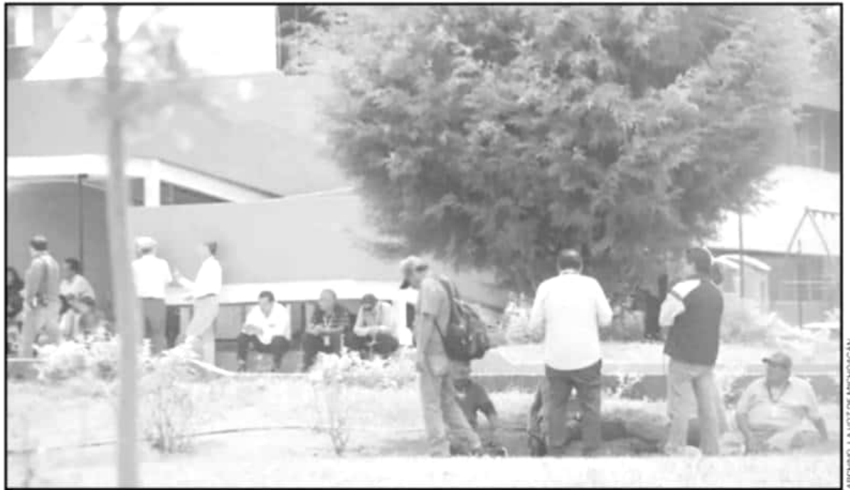
UNA DE LAS FORMAS DE PROTESTA DE LA DIII-6 ANTERIORMENTE. TAMBIÉN HA SIDO LA TOMA DE LAS INSTALACIONES DE LA SECRETARÍA DE EDUCACIÓN

esté contento, "hay una burla, mientras ellos gastan en las bicicletas, no gastan en los autos necesarios para las diligencias".