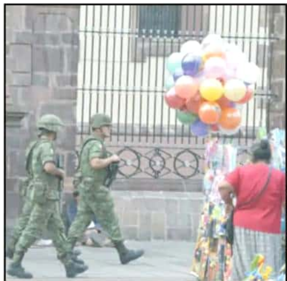
PERSONAL DE LA SEDENA YA PATRULLA EL CENTRO HISTÓRICO DE ZAMORA.