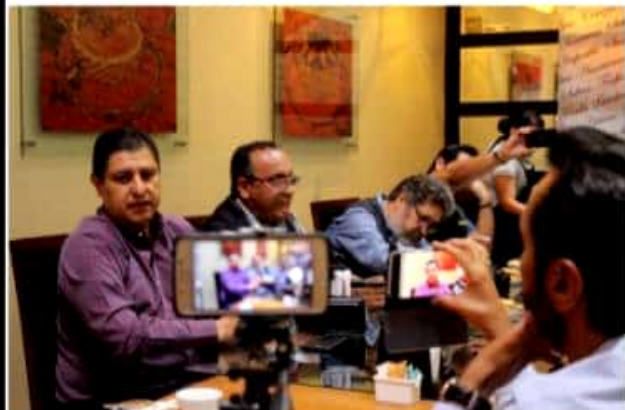
URUAPAN, MICH.- El diputado federal, Ignacio Campos Equihua, dio a conocer que se abrirá un Centro de Negocios en China, a partir del 4 de junio, a fin de mejorar la economía de la población tanto emprendedora como de la micro a la grande empresa.

"Esto va de la mano, por ello es importante empezar por algo, por ello en la inauguración del Centro de Negocios, también participan empresarios y artesanos de dulces regionales, productos deshidratados y aguacateros, Uruapan, Morelia e incluso Veracruz, para que conozcan de forma directa cómo podrán beneficiarse", concluyó.