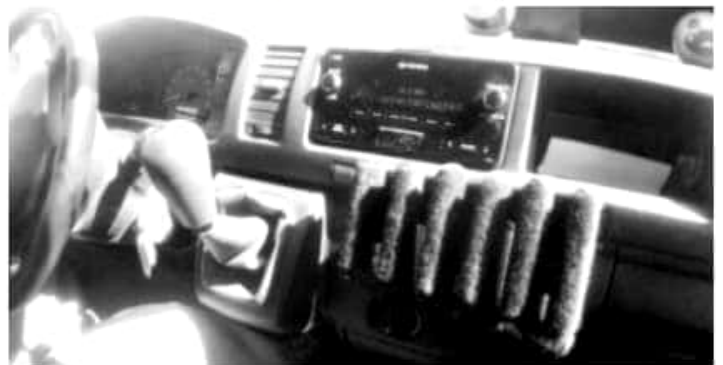
MORELIA, MICH.- Recomienda que a los vehículos se les haga una conversión a gas natural.

En cuanto a la seguridad del equipo y de quienes viajan al interior de un vehículo con gas natural, el operador asegura que estos sistemas traen válvulas, "si pasa algo automáticamente se cierra, trae unos seguros pegados al chasis, también donde nos cargan traen válvulas de emergencia, cualquier cosa se cierra", explica. El conductor del colectivo dice que hacen falta más gaseras en la ciudad, ya están abriendo la de San Rafael, "se hacen unas filas muy largas, abriendo la de San Rafael, se va a despejar mucho", cuenta. Las filas para cargar el gas natural se ven largas. "ahí en la de Mantales está un Oxxo, desde esa tienda hasta subir al gas son como unos 45 minutos, se da uno su tiempo, y en la DG1, una que está allá arriba donde está la entrada a la Lucio cabañas, también se tarda uno lo mismo, unos 40 o 45 minutos". Solamente hay dos en Morelia, y la que están construyendo en la San Rafael señala el transportista, quien asegura que estaría mucho mejor que hubiera cuatro en total en la ciudad dos en cada lado, con eso tendrían suficiente.