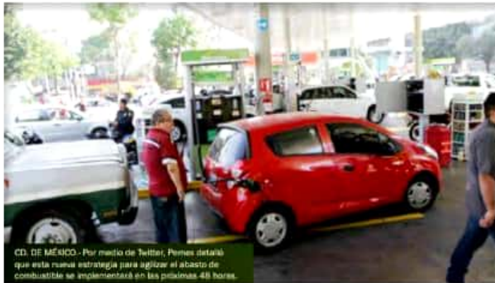
CD. DE MÉXICO. Por medio de Twitter, Pemex detalló que esta nueva estrategia para agilizar el abasto de combustible se implementará en las próximas 48 horas.