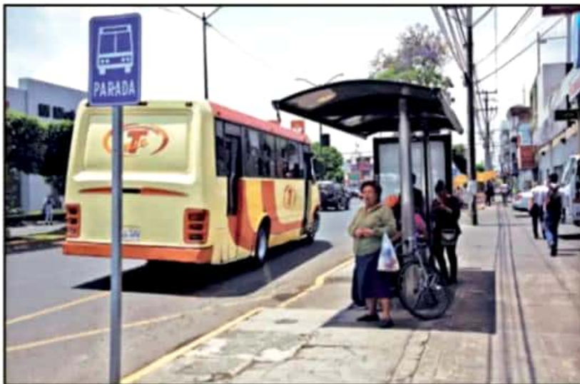
SE ESPERA QUE PUNTO QUEDE LISTO EL PLAN PARA TENER NUEVAS UNIDADES DE TRANSPORTE PÚBLICO QUE USEN GAS

de gas natural para incidir en el aumento del uso de este combustible. Actualmente Morelia cuenta con sólo 3 estaciones de ese combustible.