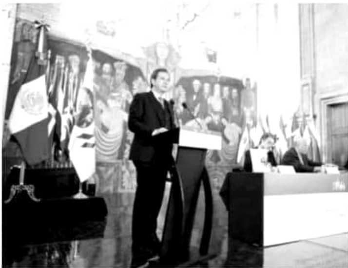
CDMX.- El sistema educativo se transformará con base en los pilares fundamentales de equidad y calidad para superar los retos que enfrenta el país en las materias social, económica y productiva