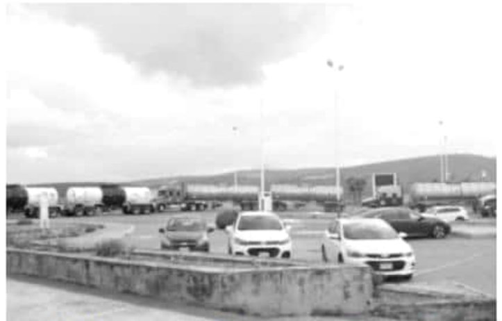
MORELIA, MICH.- En los próximos tres o cuatro días, el abasto de combustible debería normalizarse, por lo menos, en un 80 por ciento.

y hasta el momento no ha podido regularizarse esta situación, a pesar de que en los últimos tres días han llegado más de 3 millones de litros a la Terminal de Almacenamiento y Distribución de Tarímbaro. De acuerdo con Prieto Gómez, este viernes fue el día que más combustible ha llegado en los últimos cinco días, con aproximadamente un millón de litros para las 90 gasolineras de la zona conurbada, de las cuales 76 son de Morelia. "Incluso en estos momentos sigue llegando gasolina premium, magna y diésel", agregó. Por ello, reiteró el llamado a toda la ciudadanía para que no continúe haciendo más compras de pánico y que de ser necesario, acudan a las gasolineras sin bidones o recipientes, "ya que eso en este momento genera el desabasto en cada una de las estaciones de combustible". "Si tu necesidad es real, acude con tu automóvil a las estaciones de servicio para abastecer de gasolina tu vehículo, ya que la estación te brindará el producto que la gasolinera pueda proveer en ese momento. Confío que a la brevedad estas situación se normalice", concluyó.