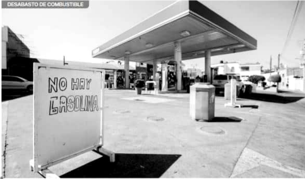
Mauricio Prieto consideró que la cantidad diaria de hidrocarburo que se asigna a la capital debe ser suficiente para atender la demanda