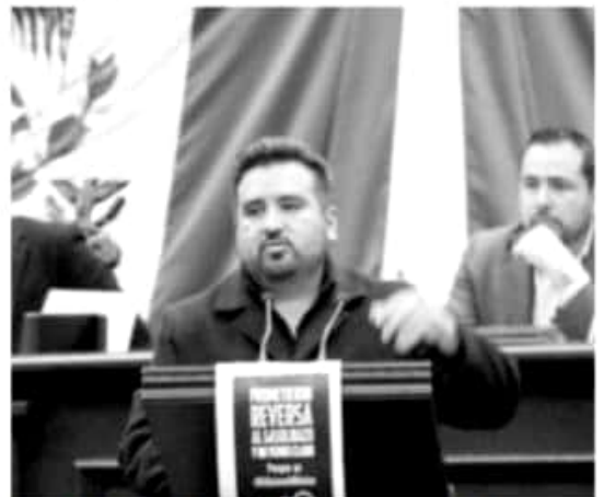
MORELIA, MICH.- En México es urgente y necesaria que exista certeza sobre la estrategia instrumentada en contra del llamado "huachicoleo", para que la misma no se trate de una ficción

El diputado local mencionó que es una realidad, ya que dentro de los objetivos de gestión que proyectó como alcalde, el interés máximo es apoyar las acciones que motiven la sana convivencia, el deporte, actividades artísticas, cívicas y culturales.