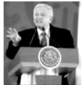
MÉXICO, D.F.- El presidente Andrés Manuel López Obrador durante su conferencia mañanera en Palacio Nacional.