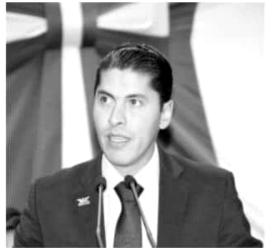
MORELIA, MICH.- Los ciudadanos y las ciudadanas libres de Michoacán tendrán una voz firme dentro de la Junta de Coordinación Política (JUCOPO) del Congreso del Estado

Estas tres posiciones son fundamentales para poder combatir la corrupción y también erradicar la impunidad que tanto han afectado de forma histórica a los michoacanos y a las michoacanas, y han afectado el desarrollo de la entidad.