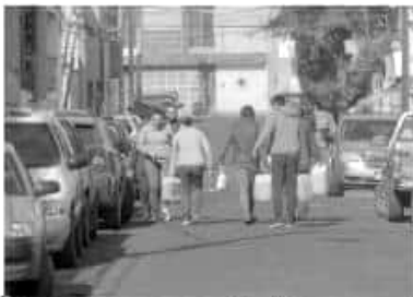
Morelianos apoyan el combate al 'huachicol', pero reconocen que debe haber "peces gordos" cateados.

si no es realmente necesario, ya que en la entidad se ha acentuado la venta irregular de gasolinas. "Hay gente que se firma con boques, que llevan boques a sus familias para hacer fila, y si siquiera tienen automóvil, están haciendo su agosto, llenando en las gasolineras 400 automotores y 300 boques", reflexió Prieto Gómez.