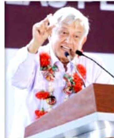
CD. DE MÉXICO. López Obrador dijo que tras ser constituida la Guardia Nacional, las Fuerzas Armadas tendrán formación especial en respeto a derechos humanos.

Esta mañana, Petróleos Mexicanos (Pemex) indicó que la estrategia del Gobierno mexicano para acabar con el robo de combustibles, también conocido como 'huachicoleo', es efectiva y no dará marcha atrás.