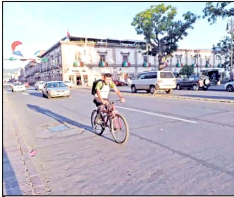
DERIVADO DEL DESABASTO DE GASOLINA, CADA VEZ SON MÁS LAS PERSONAS QUE SE TRANSPORTAN EN BICICLETA.

Desde hace ya varios años, autoridades ambientales san llamado a la población a evitar en la medida de lo posible el uso de las fogatas debido al impacto ecológico y de salud que tiene en la urbe.