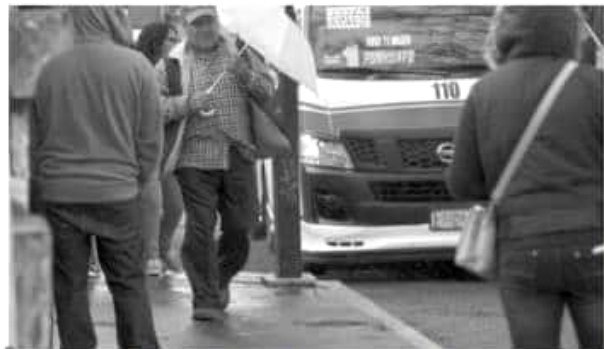
Piden a los ciudadanos mantenerse informados por los medios oficiales de los pronósticos del tiempo, procurar salir solo lo necesario, usar ropa de abrigo y cubrir boca y nariz.

La entrada de aire húmedo y la presencia del frente frío número 25 ocasionará tormentas en gran parte de la geografía michoacana, ante ello la Secretaría de Gobierno (Segob), a través de la Coordinación Estatal de Protección Civil, hacen un llamado a la ciudadanía a tomar precauciones ante el temporal. De acuerdo con los pronósticos del Servicio Meteorológico Nacional (SMN), existe un potencial de lluvia en algunas zonas de la entidad, que si bien serán aisladas, resulta prudente advertir sobre la posibilidad de que afecte al estado. En este mismo sentido, el sistema frontal número 25 y la masa de aire frío que lo impulsa provocará