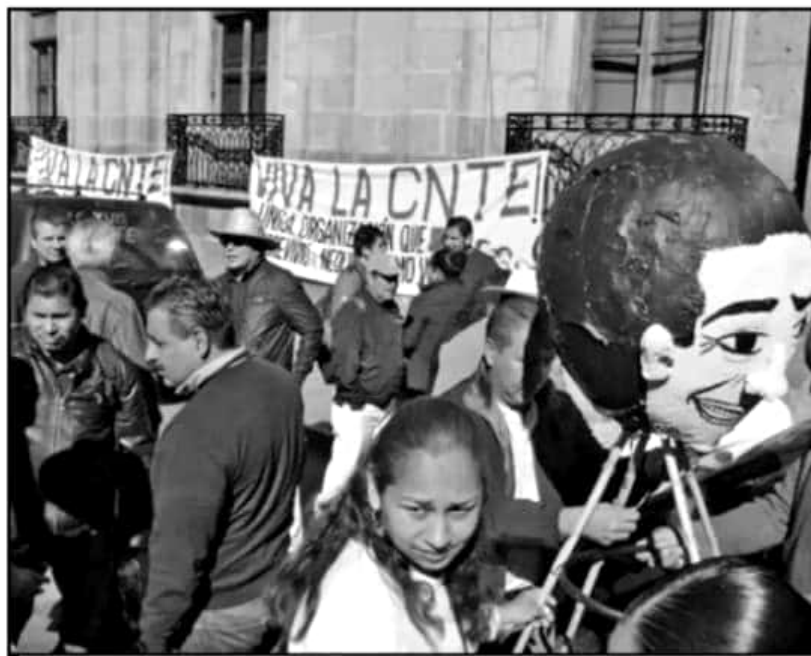
INTEGRANTES DE LA CNTE SEÑALAN QUE AÚN HAY ADEUDOS, DESDE FEBRERO PASADO, POR LO QUE TOMARÁN MEDIDAS.

trega de los servicios educativos, como plantea el gobierno estatal, en su caso entrar a un programa especial como están otros estados para este pago", dijo.