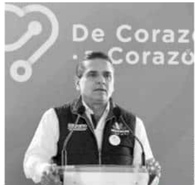
Silvano Aureoles señaló que lo que se roban los 'ordenadores' equivale a un año del presupuesto de Michoacán.

Aureoles Conejo refirió que desde hace más de 20 años se han robado el combustible, "es espeluznante, y es algo que nos