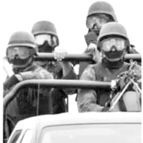
CIUDAD DE MÉXICO.- El secretario de Marina, José Rafael Ojeda, señaló "los militares obedecemos órdenes y si la Guardia Nacional pasa a un mando civil, lo vamos a obedecer; ¡claro que vamos a obedecer!".

marco de referencia constitucional para transitar al diseño de un cuerpo de seguridad ubicado en el ámbito civil, pero con niveles de disciplina, régimen de servicio, ascenso, prestaciones, ingreso, educación, capacitación profesional y doctrina homologados a los que se aplican actualmente en el ámbito de la Fuerza Armada", precisó. Reiteró que con la iniciativa se pretende optimizar el aprovechamiento de recursos con los que cuenta el Estado mexicano a través de las capacidades de la Sedena, la Semar y la Policía Federal.