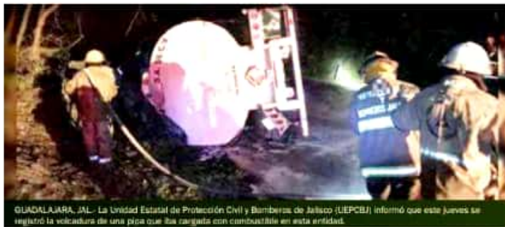
GUADALAJARA, JAL.- La Unidad Estatal de Protección Civil y Bomberos de Jalisco (UEPCBJ) informó que este jueves se registró la volcadura de una pipa que iba cargada con combustible en esta entidad.