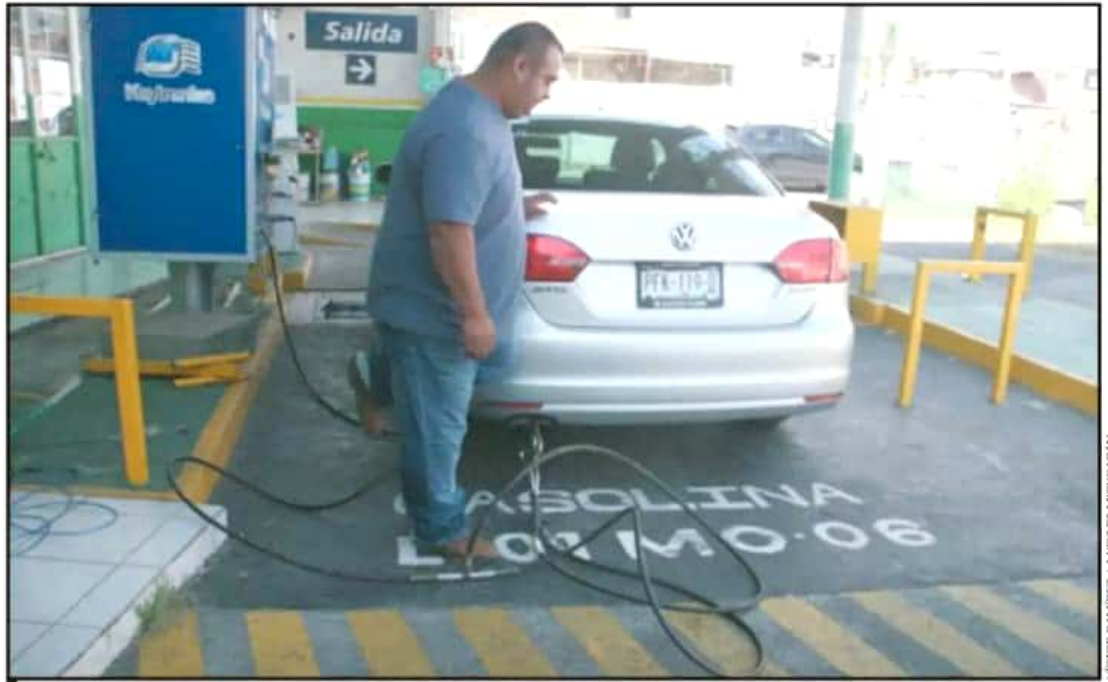
ESTE AÑO SE HA VUELTO OBLIGATORIA LA VERIFICACIÓN VEHICULAR, SOBRE TODO EN LAS CIUDADES, CON LO QUE SE PREFIENDE REDUCIR EL IMPACTO AMBIENTAL.

Se estima que de cada 10 vehículos que reprobó las pruebas de contaminantes, 6 son automóviles particulares, 2 son de transporte público y 2 son coches de transporte de mercancías y de servicios particulares.