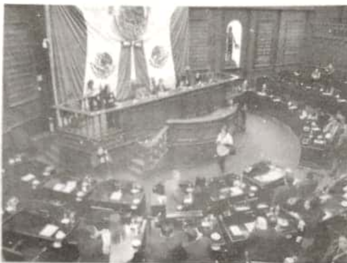
Los diputados del Congreso del Estado regresarán del asueto de Semana Santa con la apremiante tarea de designar al nuevo alcalde de Nahuatzen, tras el asesinato del edil.