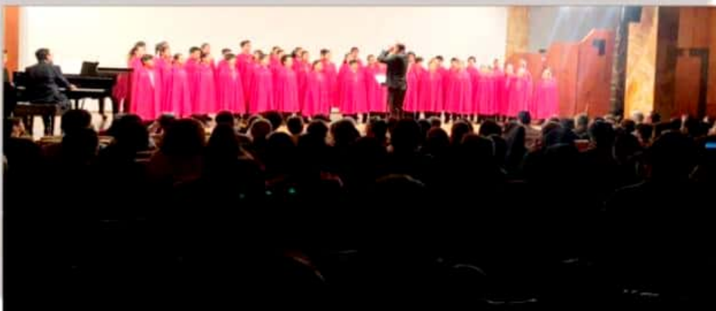
Los Niños Cantores de Morelia triunfaron este domingo en el Palacio de Bellas Artes.

pasan de maletas. ¡Y aunque me gruñá mi perro El Cachuchas y me haga señas con el dedo medio de su manilla derecha , ¡lépero que no fuera! Él sabe bien que su equipo está ¡pal perro! y vale pa puras vergüenzas . O se componen pa la otra temporada, o meta que de plano nos cambiamos con los güillos de Coapa . "¡Que la boca se te haga chicharrón! ", ¡jijo del maíz! Ya me tienes hasta la maa...nita . ¡Toma por uchepo!" y ¡ cuaz! ! Nomás vi estrellitas del sartenazo que me dio la Coty en mi cabecita, que no sé cómo sabe que estoy escribiendo, ¡Hasta calentito! siento en la pata del guamazo que me dio. ¿En la pata? , ¿qué tiene que ver mi pata con mi muceta? . "¡Perro, ¡jue de tu perruna! ", ve a echar tu porquería a otro lado. ¡Ni que fuera tu árbol particular! ", le tuve que gritar al Cachuchas que el muy gandalla también se desquitó echándome su agua de riñón . ¡ puerconio que no fuera! ! Pero ya mejor ni le buigo porque estoy oyendo que a mi tía