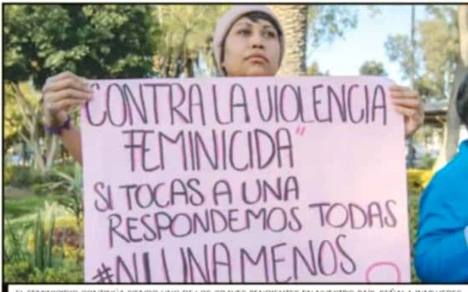
EL FEMINICIDIO CONTINÚA SIENDO UNO DE LOS GRAVES PENDIENTES EN NUESTRO PAÍS, SEÑALA INMUJERES