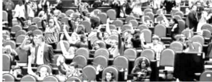
LOS legisladores de la Cámara de Diputados discutirán mañana el predictamen de la Ley de Austeridad Republicana, cuyos apartados sobre los bonos en los tres poderes de la Unión fueron modificados.

Los legisladores de la Cámara de Diputados discutirán hoy el predictamen de la Ley de Austeridad Republicana, cuyos apartados sobre los bonos en los tres poderes de la Unión fueron modificados.