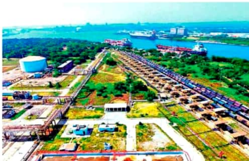
ArceMittal busca un acuerdo con el IMSS que le dé facilidades y no le impacte en el pago de cuotas obrero-patronales.