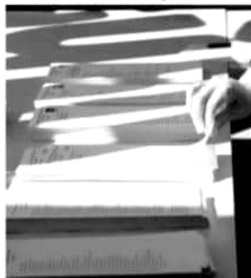
SEGUN sondeos, el PSOE lograría entre 116 y 121 escaños y el Partido Popular (PP, conservador) tendría entre 69 y 73, mientras que Vox tendría 36-38, en un Parlamento de 350 diputados.

Casi 37 millones de personas estaban llamados a votar en las decimoterceras elecciones generales de la actual etapa democrática en España, entre ellas por primera vez 1.15 millones de jóvenes y otras 100 mil personas con discapacidad intelectual, enfermedad mental o deterioro cognitivo.