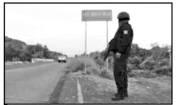
BUENAVISTA Y APATZINGÁN, DE LOS MUNICIPIOS CON MÁS DESPLAZADOS.