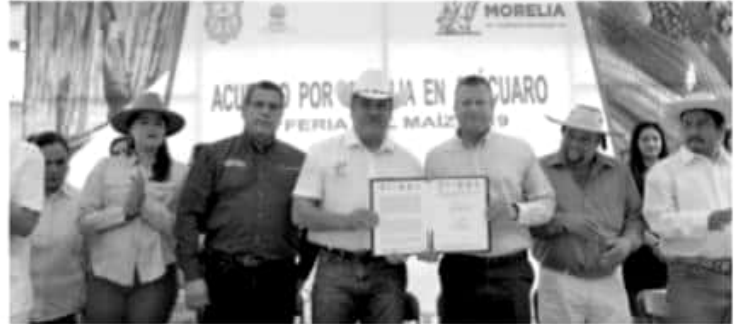
MORELIA, MICH.- Se pretende identificar las diversas fuentes de contaminación que se encuentren dentro de la demarcación del municipio.

su disposición para trabajar en coordinación con el Gobierno Estatal en temas ambientales y en favor del bienestar social.