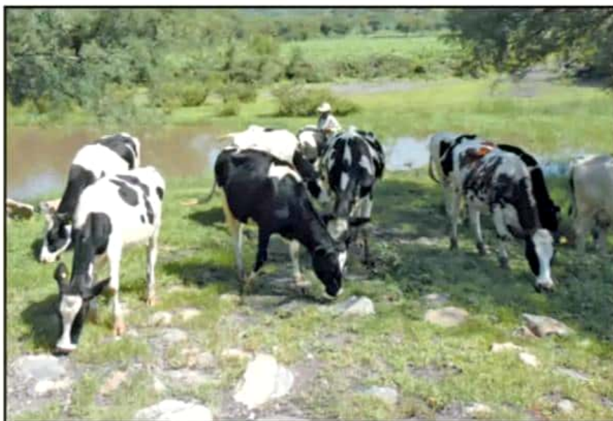
LA IDEA ES VIGILAR EL CAMINO QUE SIGUE EL GANADO, INCLUYENDO LOS SENDEROS HACIA LOS AGOSTADEROS.

entre productores independientes se ha planteado ya establecer guardias armadas en puntos estratégicos e implementar retenes para revisar el traslado de ganado.