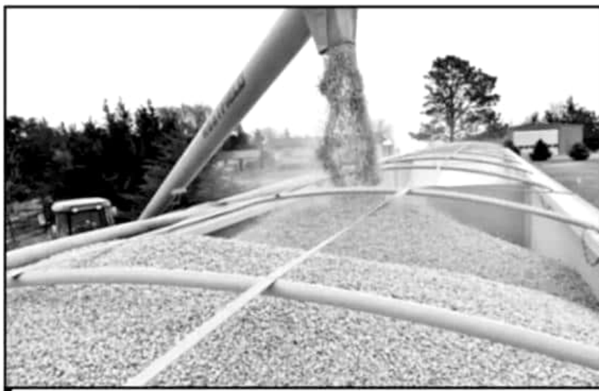
CONFÍAN LOS PRODUCTORES MEXICANOS EN QUE INCREMENTO DE PRODUCCIÓN BAJARÁ LAS IMPORTACIONES

La insistencia de imponer una cuota compensatoria ha venido de Florida desde que comenzaron las negociaciones para modernizar el acuerdo comercial de Norteamérica, pues es uno de los mayores productores de fresas, superado sólo por California, apuntó en entrevista con Notimex.