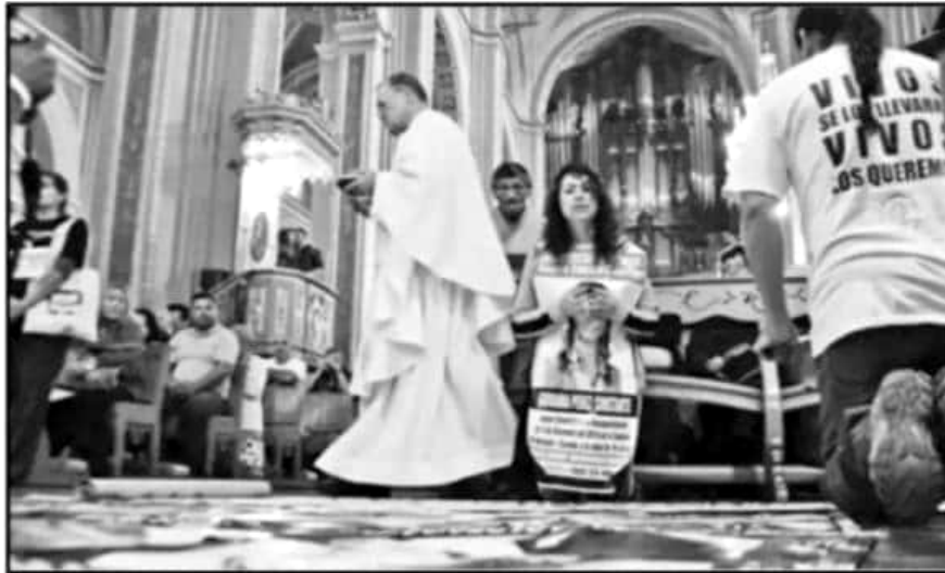
LA MISA FUE EMOTIVA; LAS PERSONAS LLEVARON IMÁGENES DE SUS FAMILIARES PARA REZAR POR SU APARICIÓN CON VIDA.

sus familiares desaparecidos. Después se ubicaron a la vista de las cámaras, mostrando fotos enmarcadas con los rostros de estas personas cuya búsqueda continúa. Algunos de los miembros de la caravana han tenido estos elementos durante tanto tiempo, que han optado por llevarlos colgando como una casaca o en forma de bolso o de playera.