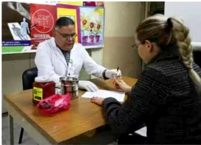
El examen consiste en una punción en el dedo y los resultados tardan entre 15 y 20 minutos.

El VIH no se contagia por contacto. Se puede dar la mano, abrazar o besar a alguien con VIH, compartir artículos domésticos, un escrito