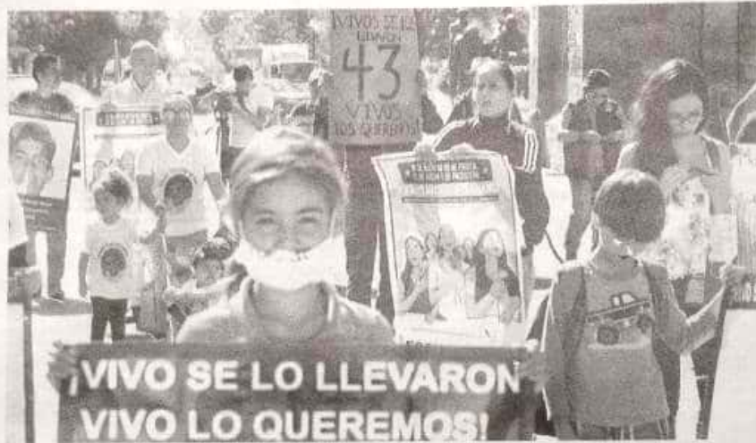
Marcha de las madres de los 43 normalistas desaparecidos.

Dijo que la entidad federativa con mayor número de reportes de personas desaparecidas es Tamaulipas, seguida del Es-