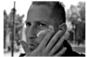
MORELIA, MICH.- Durante esta temporada de calor, la Secretaría de Salud de Michoacán (SSM), recomienda a la población la aplicación diaria de bloqueador solar.

Asimismo, señaló que hay protectores resistentes al agua; sin embargo, aunque no se haya expuesto al agua o al sudor, hay que estarlo reaplicando, no obstante, sugiere evitar la exposición solar entre las 10 de la mañana y las 4 de la tarde. La prolongada exposición a la radiación solar puede traer consecuencias, desde quemaduras leves y hasta la aparición de tumores o cáncer, siendo las personas con piel clara -porque tienen poca cantidad de melanina-, las más susceptibles.