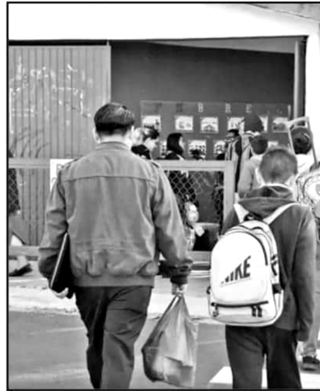
LOS MECANISMOS DE PRESIÓN DE LA CNTE BUSCAN MAXIMIZAR EL DESCONTENTO

"Las cúpulas de la Sección XVIII de la CNTE ha incidido enormemente contra el derecho a aprender de los michoacanos mediante la realización de diversas acciones de mo-