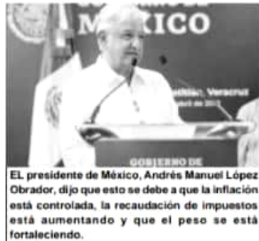
EL presidente de México, Andrés Manuel López Obrador, dijo que esto se debe a que la inflación está controlada, la recaudación de impuestos está aumentando y que el peso se está fortaleciendo.

Destacó que en ese contexto uno de los datos más importantes es que la gente mantiene su entusiasmo y está esperanzada y en que si llevemos a cabo entre todos desde abajo un verdadero cambio.