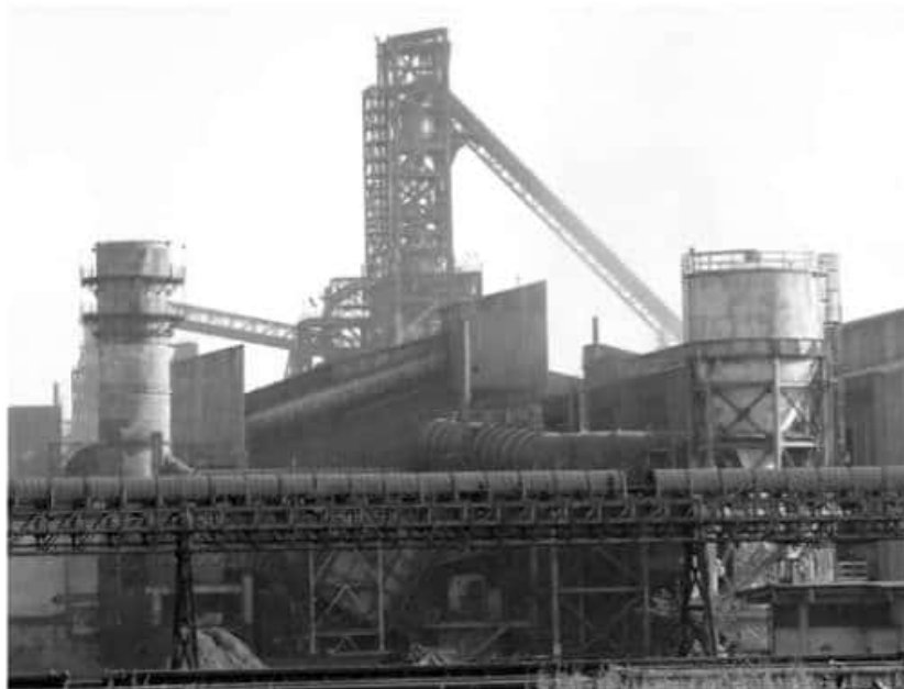
La acerera anunció la construcción de la planta laminadora, la cual con su plan de crecimiento iniciaba ya los trabajos de inversión por mil millones de dólares.

"Sabemos que por ejemplo Mittal está haciendo inversiones para lo que es su Zona Económica: sin embargo, destacó que hay potencial entre Guerrero y Michoacán para la industria agropecuaria, agrícola, maderera, ganadera, y asentar industrias de otro giro, no forzosamente la industria metal-mecánica.