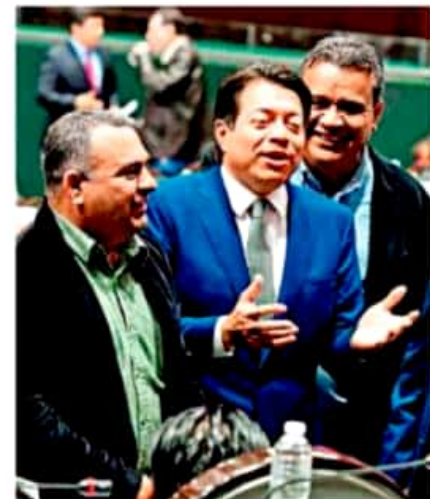
Mario Delgado dice que buscarán aprobar la Ley Federal de Austeridad Republicana.