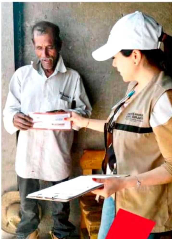
Los chalecos tenían el nombre del entonces "presidente electo"