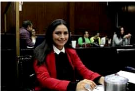
Araceli Saucedo Reyes, coordinadora del Grupo Parlamentario del Partido de la Revolución Democrática en la LXXIV Legislatura del Congreso del Estado.

"El Congreso aprobará en tiempo y con apego a la ley el dictamen de la Cuenta Pública Estatal 2017; en el caso de las observaciones, éstas seguirán su cauce legal".