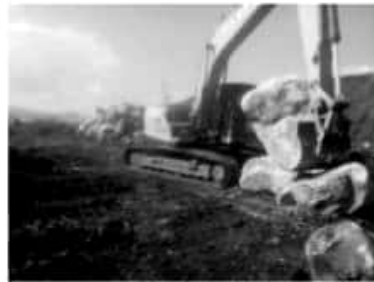
MORELIA, MICH.- Con el apoyo de maquinaria pesada, se rehabilitó más de un kilómetro y medio de caminos rurales, conocidos también como saca cosechas.

Finalmente, dijo que más de 20 localidades se vieron beneficiadas con estas obras, entre ellas destacan: Melchor Ocampo, El Olivo, La Soledad Grande, Taracatío, El Salitre, El Huacas, Francisco Villa, El Agua Grande, Las Presitas y Los Otates, sólo por mencionar algunas.