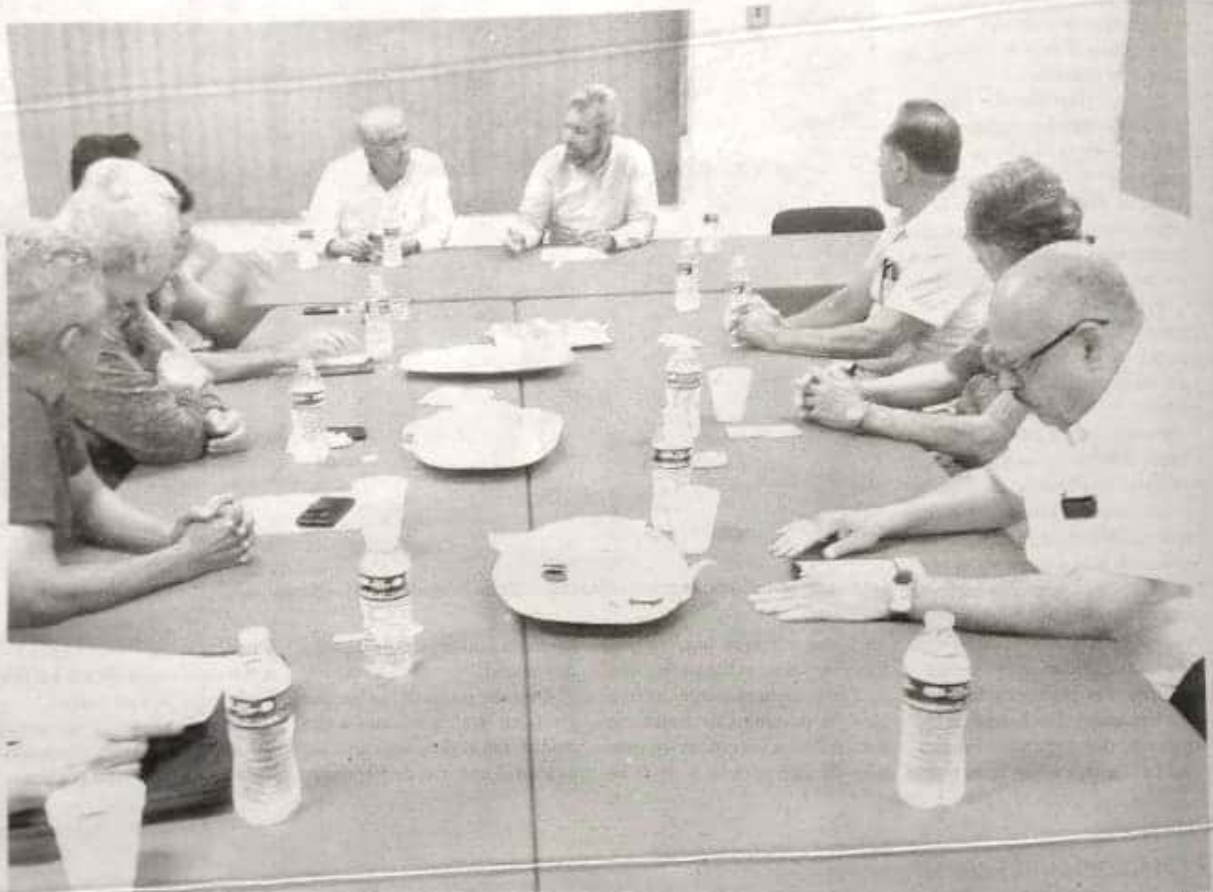
Este domingo, el diputado morenista Alfredo Ramírez Bedolla se reunió con integrantes del Consejo Coordinador Empresarial de Lázaro Cárdenas.

Al mismo tiempo, el gobierno del estado trabaja en la conformación de una propuesta para que la ZEE Lázaro Cárdenas - La Unión se mantenga.