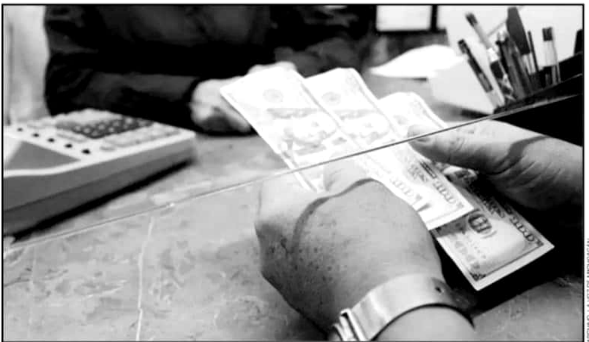
MICHOACÁN SE CONSOLIDA COMO ESTADO RECEPTOR DE REMESAS QUE ENVÍAN PAISANOS DESDE ESTADOS UNIDOS, ACUERDO A UN INFORME DEL CEMLA.

lado de 12 meses) ascendió a 33 mil 761 millones de dólares.