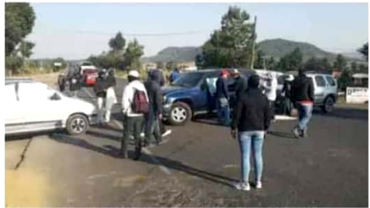
Este lunes se manifestarán policías en varias zonas del estado, para pedir solución a sus demandas.