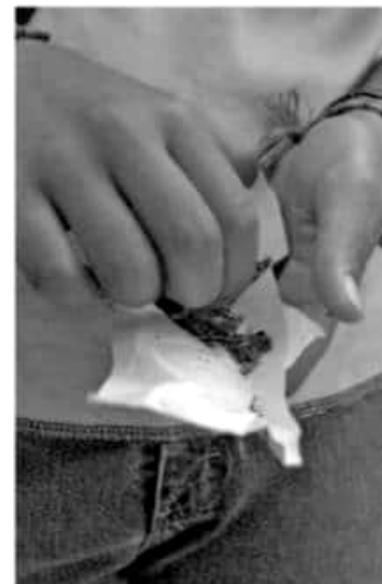
Debe considerarse la relevancia de su uso médico.

Consideró que es necesario esperar a que el tema se resuelva primero a nivel federal, pero "estamos conscientes de que se tienen que dar pasos diferentes".