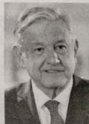
Andrés Manuel López Obrador.