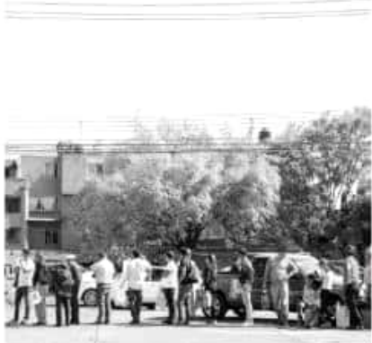
● Se informó que se condicionaba la venta de combustible si se pagaba en efectivo y había preferencia si el consumidor compraba aceite.

Además de los casos donde se debió interponer la queja ante la Profeco, Sheffield Padilla expuso que se identificaron alrededor de 23 estaciones de servicio con fallas graves, como la discrepancia en el precio anunciado por la empresa en su acceso, en las bombas, en