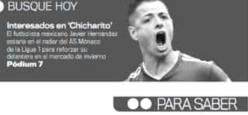
Interesados en 'Chicharito' El futbolista mexicano, Javier Hernández, está en el radar del AS Monaco de la Liga 1 para reforzar su delantera en el mercado de invierno. Podium 7