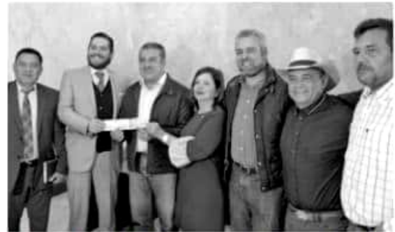
MORELIA, MICH.- Los diputados representantes de los distritos morelianos entregaron de forma oficial el apoyo gestionado a través de la Junta de Coordinación Política (JUCOPU) para el municipio de Morelia.