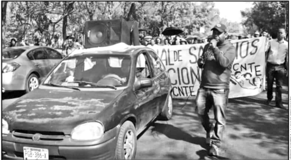
ESTE AÑO HA INICIADO CON PROBLEMAS PARA HACER EL PAGO A LOS MAESTROS DEL ESTADO, LO QUE HA DESENCADENADO UNA SERIE DE PROTESTAS

Evitó entrar en controversias con el gobierno del estado o con