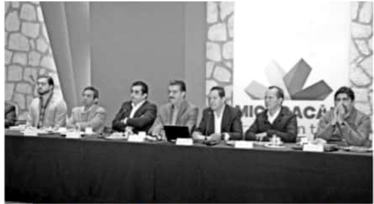
MORELIA, MICH.- La multiplicación de recursos será un elemento clave para potencializar las acciones de apoyo a la ciudadanía en materia de desarrollo económico.