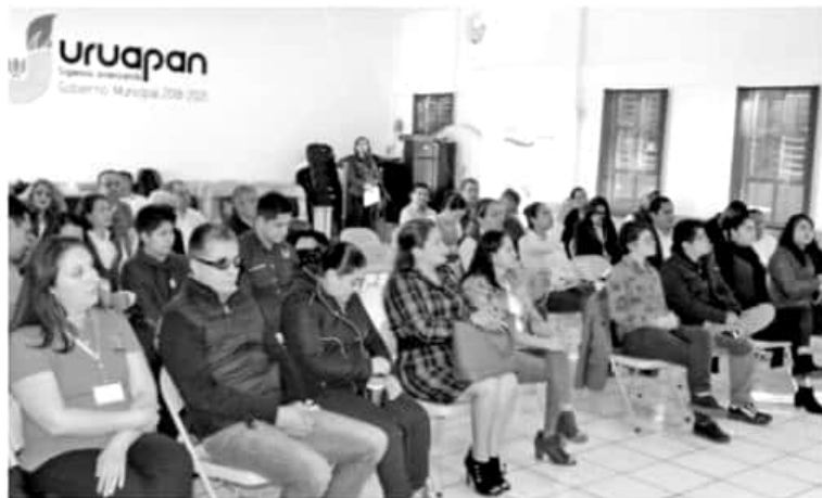
URUAPAN, MICH.- Sensibilizar tanto a funcionarios municipales como a los distintos sectores para sentar las bases de una Nueva Perspectiva, fue el objetivo del taller "Bases para el Acompañamiento de Personas Trans"

sexual, y en México, hay discriminación según las encuestas, donde la percepción que arroja es de resistencia de convivencia al aceptar a este grupo de personas.