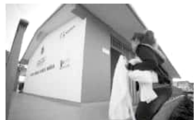
● El instituto cuenta con más de 30 especialidades para la capacitación para el trabajo, desde cursos de alta demanda.