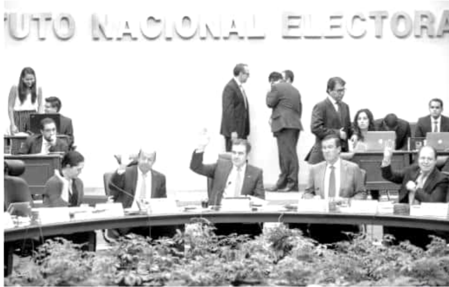
Aspecto de una sesión del INE.