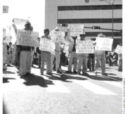
Trabajadores han expuesto su inconformidad por la extinción del organismo público descentralizado.