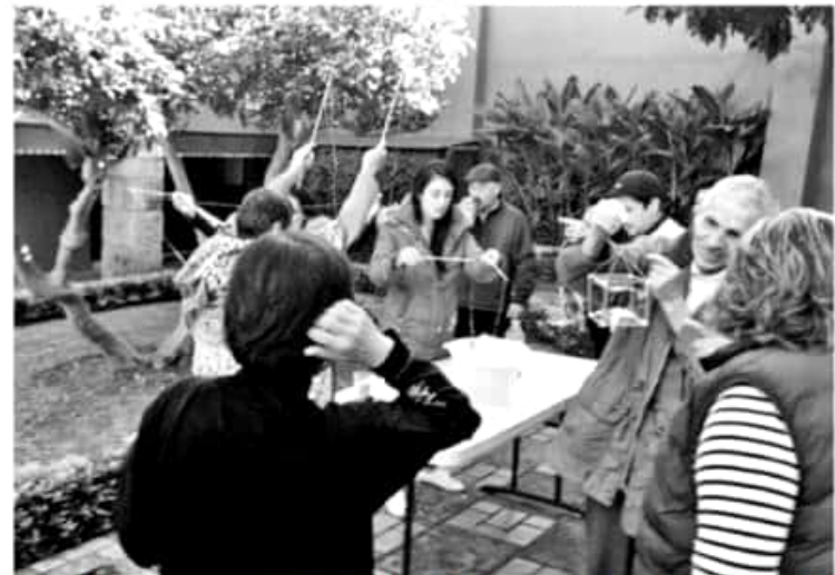
MORELIA, MICH.- Con una sencilla entrega de constancias, concluyó el primer ejercicio que realiza el Gobierno del Estado para acercar a la comunidad artística, cultural y docente de Michoacán,

Por otra parte, Montañez Espinosa comentó que este mismo día, concluyó también, en Zamora, la gira de presentaciones que realizaron los Payasos Científicos procedentes de Oaxaca, quienes trabajan justamente en la presentación escénica con la divulgación científica a partir de sus conocimientos en técnicas de neuro-pedagogía y "clown".