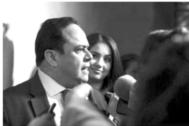
El presidente del instituto advirtió que se llegará a las últimas consecuencias, ante la exposición de datos personales de 2 millones 373 mil 764 pacientes en el país.

"El Inai va a llegar a las últimas consecuencias, como ha llegado en todos los asuntos. Hemos impuesto multas a bancos, empresas, no recuerdo a cuántas, pero el asunto no quedará ahí".