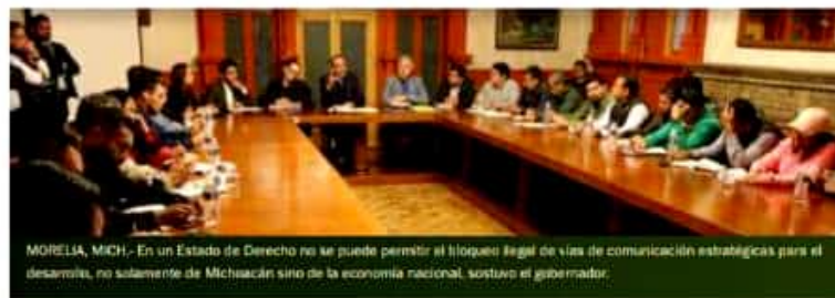
MORELIA, MICH.- En un Estado de Derecho no se puede permitir el bloqueo ilegal de vías de comunicación estratégicas para el desarrollo, no solamente de Michoacán sino de la economía nacional, sostuvo el gobernador.

"El estado tiene serias dificultades por una deuda que no hicimos nosotros: la heredamos. Ustedes, los profesores, tienen toda la razón que se les pague puntual sus salarios y bonos, pero el Gobierno del Estado no tiene la solvencia y en eso estamos trabajando", expresó.