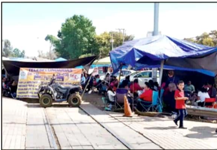
LOS MAESTROS TOMARON LAS VÍAS DEL TREN COMO MEDIDA DE PRESIÓN PARA QUE EL GOBIERNO LES PAGUE.

en el puerto sin poder subir a los trenes