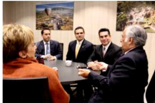
MADRID, ESPAÑA.- El turismo en Michoacán se posiciona como una actividad económica que genera más empleos y riqueza para las comunidades.

El titular del Ejecutivo estatal reiteró la disposición de su Gobierno para trabajar de manera conjunta con las autoridades federales y de otras entidades del país, en el objetivo de seguir fortaleciendo el turismo en México y Michoacán.