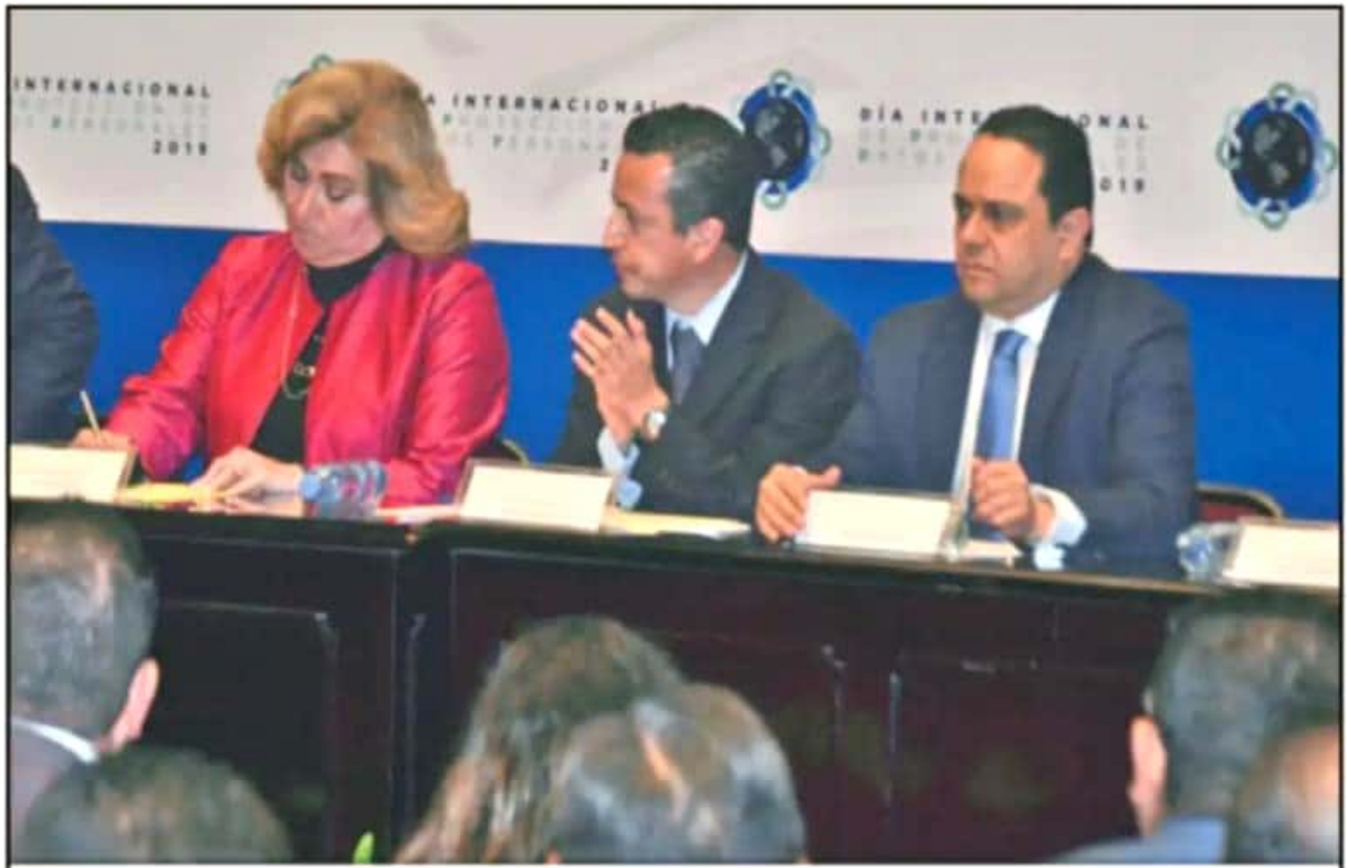
TANTO AUTORIDADES FEDERALES COMO ESTATALES CONMEMORARON EN MORELIA EL DÍA INTERNACIONAL DE PROTECCIÓN DE DATOS PERSONALES.

"Nada que ver. Las conferencias mananeras del presidente de la República con la prensa y medios de comunicación de ninguna manera sustituyen, o de ninguna manera satisfacen la necesidad y el derecho a la infor-