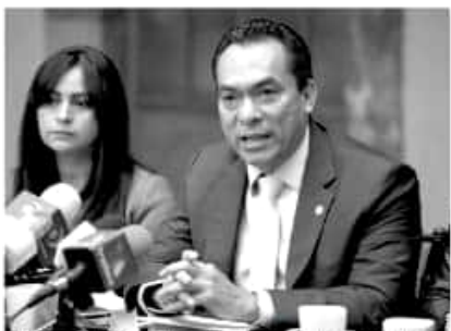
El asambleísta del sol azteca busca llevar las rendidas de la Fiscalía General del Estado.

Detalló al personal que en tanto el gobierno de Michoacán no concrete la extinción de la Junta de Caminos conforme lo estipula la Ley de Entidades Forales —mediante ley o de-