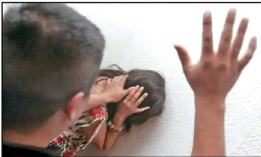
MEDIANTE EL BUZÓN NARANJA, LA SECOEM BUSCA ACERCAR A LAS MUJERES MECANISMOS DE DENUNCIA.

bernador del Estado, Silvano Aureoles Conejo, de trabajar para eliminar toda forma de discriminación, exclusión y desigualdad al interior de la Administración Pública Estatal. Esto, a fin de que las y los servidores públicos conozcan y cumplan las disposiciones normativas que rige el artículo 12 de la Ley Orgánica de la Administración Pública, la Ley para la Igualdad entre Mujeres y Hombres del Estado de Michoacán y el Acuerdo firmado el 12 de mayo del 2016.