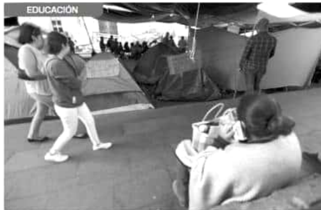
● El recurso se destinará para solventar adeudos en salarios, bonos y prestaciones de docentes con clave estatal, que actualmente se encuentran en plénum frente a Palacio de Gobierno como protesta.