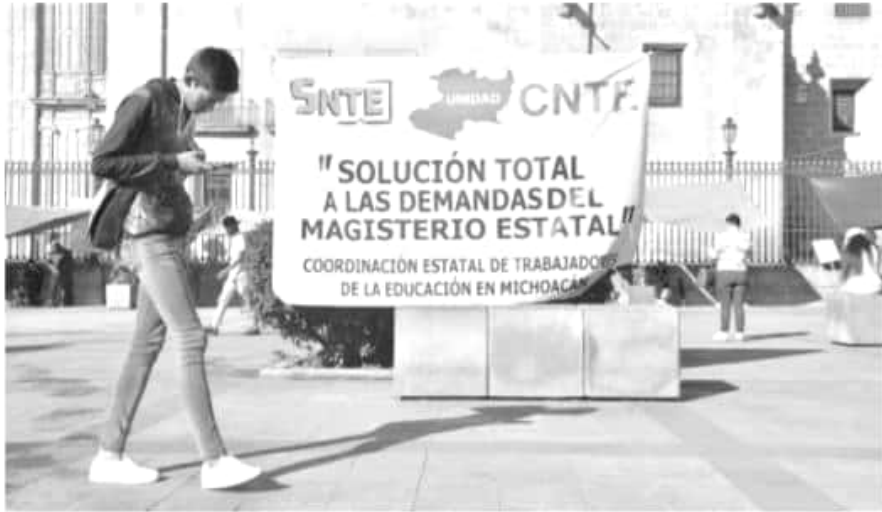
Sigue el plantón en el Centro; abajo, imágenes de los pagos.

«Insisto: no está acabada la guerra. Es una batalla, nada más una batalla. Si bajamos los brazos ahorita será peor».