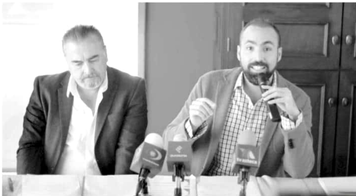
CAMBIO | ACG

► “En Michoacán es más fácil ganar la lotería que resolver un delito”