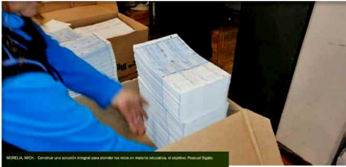
MORELIA, MICH.- Construir una solución integral para atender los retos en materia educativa, el objetivo: Pascual Sigala.