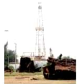
El ejercicio forma parte de la cultura de prevención de Pemex.

El Observatorio Ciudadano de Michoacán, subrayó que octubre fue el mes con más carpetas de investigación por la comisión de homicidios dolosos.