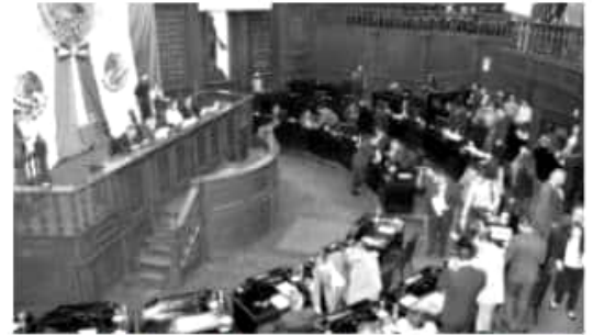
MORELIA, MICH.- El Pleno del Congreso del Estado de Michoacán, aprobó 20 leyes de ingresos para el ejercicio fiscal 2019.

Comisiones de Programación, Presupuesto y Cuenta Pública y de Hacienda y Deuda Pública, quienes elaboraron los proyectos de dictamen, insistieron en que las adecuaciones propuestas por ellos, fueron pensadas en función de la capacidad económica de los contribuyentes y usuarios de los servicios públicos, pero además, atendiendo a las necesidades y requerimientos de gasto de los municipios, respetando y preservando los principios fundamentales de proporcionalidad y equidad tributaria.