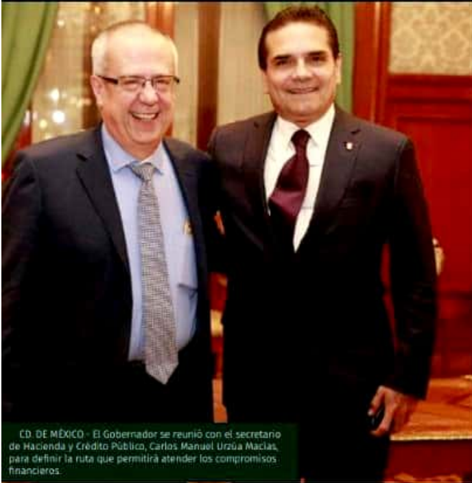
CD. DE MÉXICO.- El Gobernador se reunió con el secretario de Hacienda y Crédito Público, Carlos Manuel Urzúa Macías, para definir la ruta que permitirá atender los compromisos financieros.

El Gobernador aseguró que en los siguientes días darán continuidad al trabajo conjunto, cuyos resultados estará informando con puntualidad a la población michoacana, para que no existan vacíos ni se genere incertidumbre.