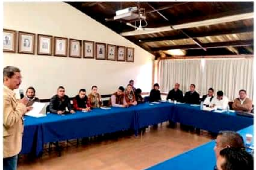
La dependencia estatal brinda curso informativo sobre el tema a representantes de 36 municipios.

ro, Carácuaro, Charapan, Charo, Cherán, Cojumatlán, Copándaro, Hidalgo, Huanacareo, Huetamo, Huiramba, Jacona, Juárez, La Huacana, Madero, Maravatío, Nuevo Urecho, Ocampo, Pajacuarán, Panindícuaro, Pátzcuaro, Penjamillo, Puruándiro, Queréndaro, Tacámbaro, Tancitaro, Tanguato, Tarímbaro, Tiquicheo, Tlalpujahua, Tzitzio, Uruapan, Vista Hermosa, Zacapu y Ziracuaretiro.