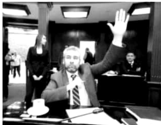
MORELIA, MICH.- Reivindicar al magisterio como un factor de transformación, y reafirmar el derecho de niñas, niños y jóvenes a la educación como el interés supremo de la nación