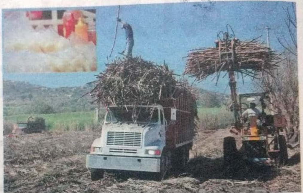
Campesinos de Puruarán, Taretan, Los Reyes y Pedernales han cambiado sus cultivos por otros más rentables, como zarzamora.

Expuso que los campesinos de las regiones de Puruarán, Taretan, Los Reyes y Pedernales, que tradicionalmente sembraban caña de azúcar, han cambiado sus cultivos por otros más rentables, como es la zarzamora, que deja divisas por la exportación.