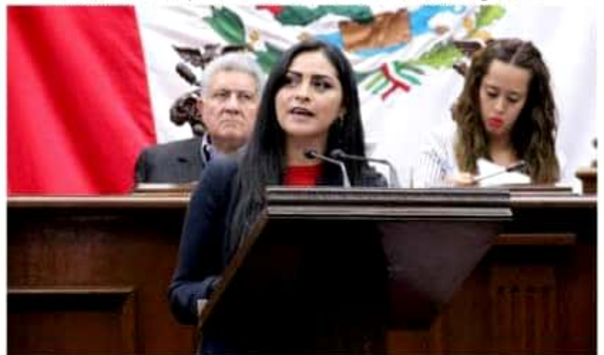
Muchos niños están en riesgo de reproducir en su vida adulta el ambiente de crisis en el que ahora viven, afirmó la diputada Araceli Saucedo Reyes.

De acuerdo con Araceli Saucedo Reyes el mayor número de víctimas de la violencia son varones y los agraviados indirectos que sobreviven son niños y esposas que quedan en la miseria y en el abandono. ➔ 12