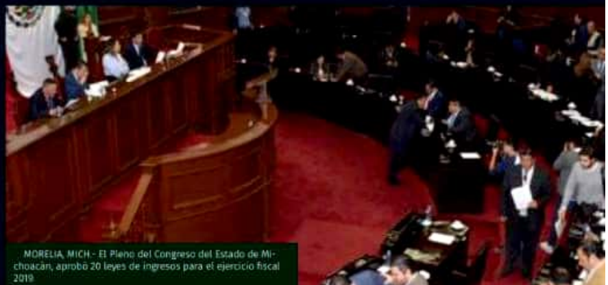
MORELIA, MICH.- El Pleno del Congreso del Estado de Michoacán, aprobó 20 leyes de ingresos para el ejercicio fiscal 2019.

buyentes y usuarios de los servicios públicos, pero además, atendiendo a las necesidades y requerimientos de gasto de los municipios, respetando y preservando los principios fundamentales de proporcionalidad y equidad tributaria.