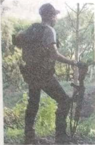
"Aislados solo dejaremos a los ciudadanos a la merced de grupos criminales".