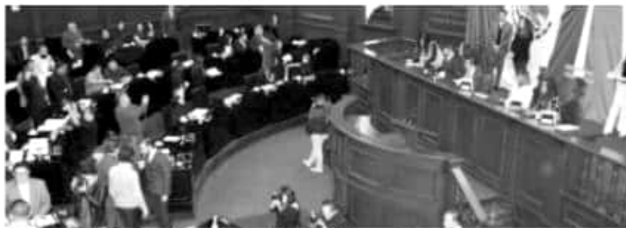
MORELIA, MICH.- Los diputados de la 74 Legislatura, reiteraron que permanecerán atentos a que se dé cumplimiento a lo que mandatan estas reformas.

ción de todos los michoacanos, especialmente de aquellos sectores más vulnerables.