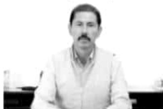
MORELIA, MICH.- Cedemun, convoca a autoridades municipales al Curso-Informativo "Estrategias de Participación e Integración Social"