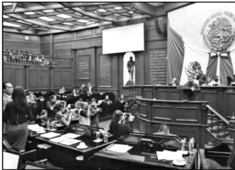
DURANTE LA SESIÓN DEL PLENO, DIPUTADOS HICIERON USO DE LA TRIBUNA PARA PRESENTAR VARIAS INICIATIVAS.