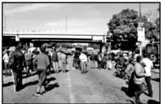
COMO SUCEDIÓ ESTA SEMANA, PROFESORES DEL LLAMADO MAGISTERIO DEMOCRÁTICO AMENAZAN CON VOLVER UN CAOS VIAL LA CIUDAD.