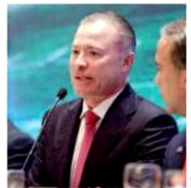
Quirino Ordaz confió en los buenos oficios del gobierno federal para apoyar al campo.

"Ahí es donde hay que apretar mucho, seguir enfocando las baterías y yo estoy cierto que, con los programas sociales, el apoyo que se le va a dar a esta actividad, vamos a superar estos rezagos que tenemos para que la población pase a un mejor nivel de vida", subrayó el mandatario sinaloense.