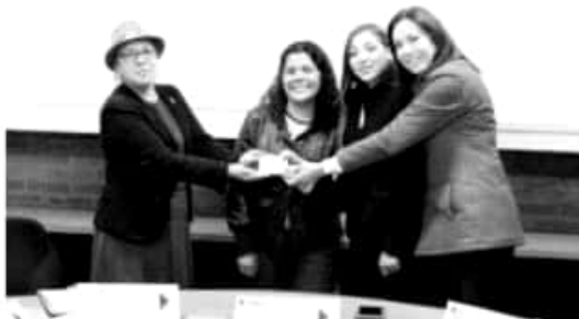
MORELIA, MICH.- La Universidad Latina de América (UNLA) entregó material radiofónico para la difusión de los derechos de las víctimas, a la Comisión Ejecutiva Estatal de Atención a Víctimas (CEEAV).

La campaña radiofónica de la CEEAV será incluida en la barra programática de Radio UNLA y mediante alianzas se gestionará su transmisión a través de otras emisoras estatales.