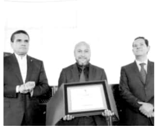
MORELIA, MICH.- Hombres y mujeres de negocios de la entidad y del país, reconocieron el apoyo de la administración del Gobernador Silvano Aureoles Conejo.

Aureoles Conejo aprovechó el espacio para compartir con las y los asistentes, temas de interés público que ha estado empujando su gobierno por el desarrollo y bienestar de la entidad, tal es el caso de la educación y la seguridad.