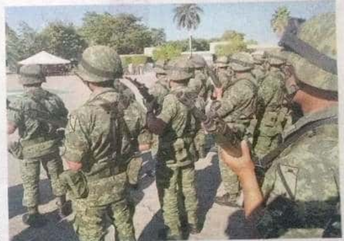
Entre los puntos que les expusieron a los gobernadores estuvo el plan de seguridad que se implementará en las 266 regiones del país.

Explicó que entre los puntos que les expusieron a los gobernadores estuvo el plan