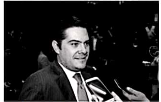
MORELIA, MICH.- El alza en los precios en la gasolina y el intermitente desabasto ha originado uno de los episodios más complejos para el País, y sobre todo, para el Estado de Michoacán.

Hoy, más allá de especulaciones, es claro que esta situación está afectando directamente el bolsillo de los mexicanos. Los michoacanos, desafortunadamente, somos los más afectados, registrando los precios de la gasolina más altos en todo el país, subrayó. En ese punto, el legislador reiteró que resulta indispensable solicitar al Gobierno Federal, un planteamiento y estrategia urgente que frene los aumentos que han sufrido los precios de las gasolinas y el diésel, en perjuicio de la economía de los consumidores y empresas michoacanas.