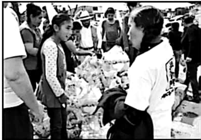
COMO YA ES COSTUMBRE, HUBO PLAYERAS Y BOTELLAS DE AGUA PARA MUCHOS.

tatal le fi- des- a del nto- tatal a co- zado a in- batir en el fun-