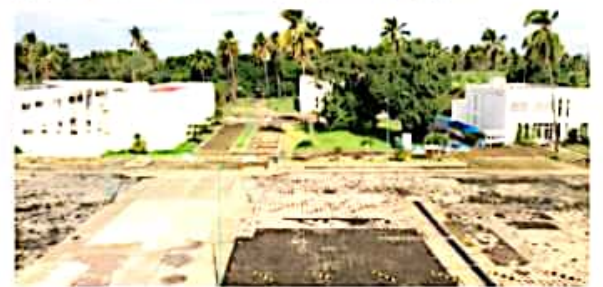
CD. LÁZARO CÁRDENAS, MICH.- Por segunda ocasión, a este municipio porteño arribará la Expo Orienta de la Umanh, a través de la Unidad Profesional.