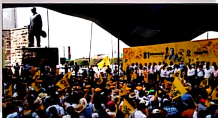
México no debe ser país de una sola visión: SAC