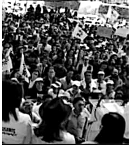
EN EL MONUMENTO PARA ARROPAR A LOS LÍDERES.