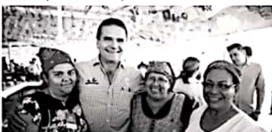
MORELIA, MICH.- Un domingo familiar se vivió en el tercer día del Festival de la Gastronomía Michoacana, donde el gobernador Silvano Aureoles Conejo, convivió y degustó los platillos típicos.

En esta gran fiesta, la Secretaría de Turismo del Estado reconoció y premió el Mejor Platillo de temporada de Cuaresma a cargo de Amparo Cervantes, de la Región Pátzcuaro,