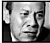
Ángel Ávila , LÍDER NACIONAL DEL PRD

amos convencer al gobernador : nos acompañe a los recorri- : seis estados de la República cciones el 2 de junio”