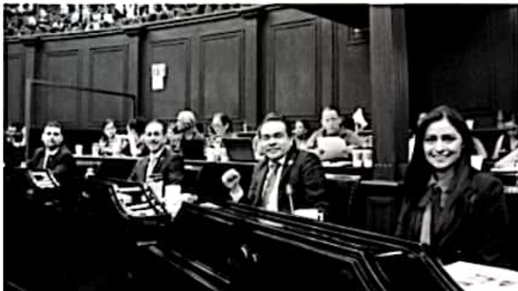
MORELIA, MICH.- En Michoacán es necesario fortalecer la implementación de la justicia especializada en materia infantil y mejorar las condiciones de vida de los menores y garantizar sus derechos desde la Legislación Local.

De conseguir la aprobación de su iniciativa, el también presidente de la Comisión de Gobernación enfatizó que se atacarán los intereses políticos que giran en torno a la definición de los contralores Municipales y se potenciará la participación ciudadana en el trabajo que se lleva a cabo al interior de los Ayuntamientos michoacanos.