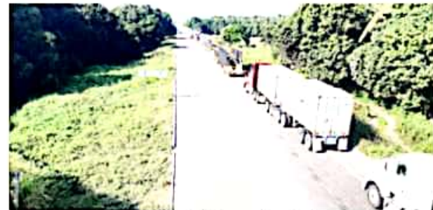
CD. LÁZARO CÁRDENAS, MICH.- Empresarios del transporte de carga exigen la instalación de una base de operaciones en la comunidad de Las Cañas, sobre la autopista Siglo XXI, que brinde mayor seguridad a los usuarios toda vez que siguen los asaltos y hasta incendios de unidades.

Dijo que Las Cañas es un punto intermedio de los tramos donde más asaltos se cometen al transporte y a particulares. "La Base de Operaciones daría servicios de vigilancia hacia Lázaro Cárdenas y hacia Uruapan, lo que creemos que sería un freno a la delincuencia que afecta al transporte de carga y de particulares", dijo por último el representante de los empresarios del puerto.