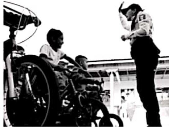
URUAPAN, MICH.- a Secretaría de Seguridad Pública Municipal (SSPM), a través del programa Educación Vial, ha llegado a más de 2 mil 500 personas