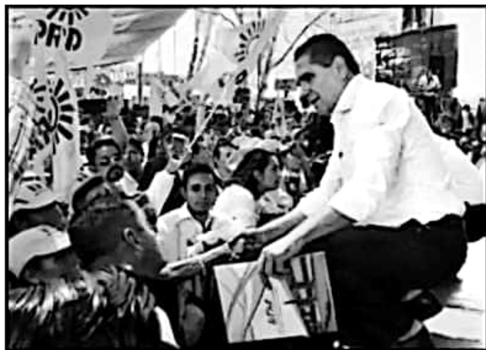
EL GOBERNADOR SILVANO AUREOLES SALUDÓ A LOS MILITANTES DE SU PARTIDO.