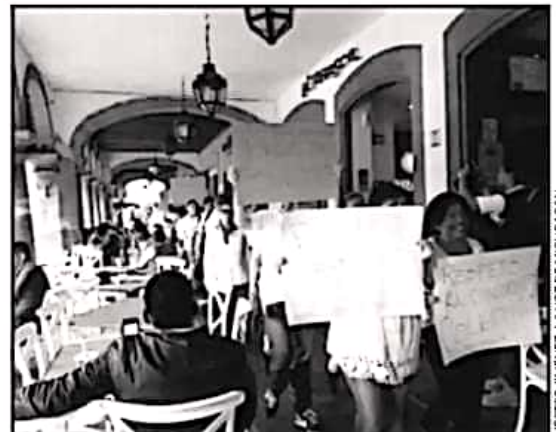
TRABAJADORES DEL HOTEL VIRREY DE MENDOZA, EN EL CENTRO, SE MANIFESTARON EN CONTRA DE QUE SE ADUEÑEN DE SUS PROPINAS Y MALOS TRAITOS.