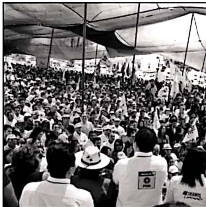
A INVITACIÓN DE SUS DIRIGENTES, CIENTOS DE MILITANTES SE DIERON CITA EN EL M

del PRD, “las circunstancias obligan a renovarnos”, subrayó Aureoles Conejo, quien llamó a no olvidar que el Sol Azteca ha sido la oposición histórica al autoritarismo, la única que hizo posible la transición democrática en México, y la verdadera izquierda, la izquierda responsable en este país.