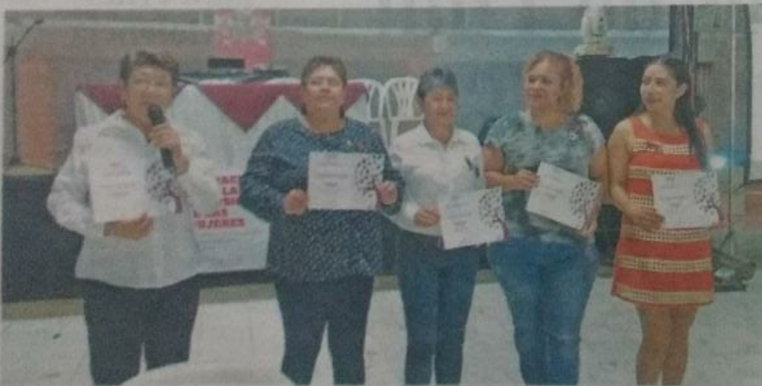
Realizaron una conferencia sobre perspectiva de género y participación política.