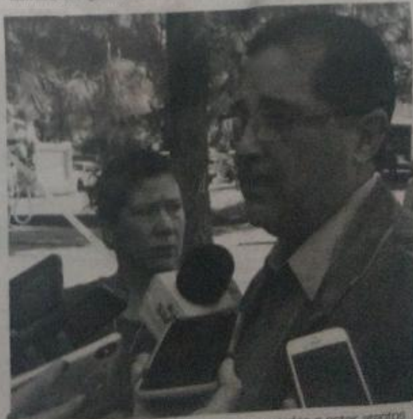
El líder del sindicato llamó a los agremiados a estar atentos en caso de tener que realizar acciones de presión.

"En el caso del Registro Civil llegamos al grado de estar imprimiendo las actas de nacimiento en hojas blancas porque no había hojas valoradas, esa parte apenas se corrigió y hasta el gobierno del estado tuvo que publicar una circular en la que decía que tenía el mismo valor el acta de hoja blanca que en hoja valorada, pero de todos modos la gente a quien reclama es a nosotros que estamos al frente", agregó el líder sindical.