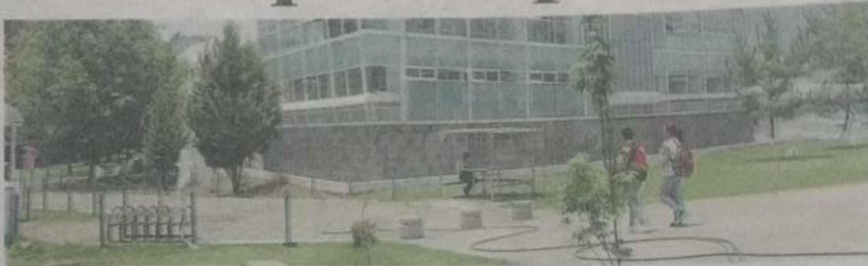
El Presidente electo, Andrés Manuel López Obrador, se comprometió a no sólo mantener el aporte actual, sino incrementar- lo. Mariana Luna Magaña

En el seno de la ANUIES se acordó solicitar el incremento al gobierno federal para el próximo año