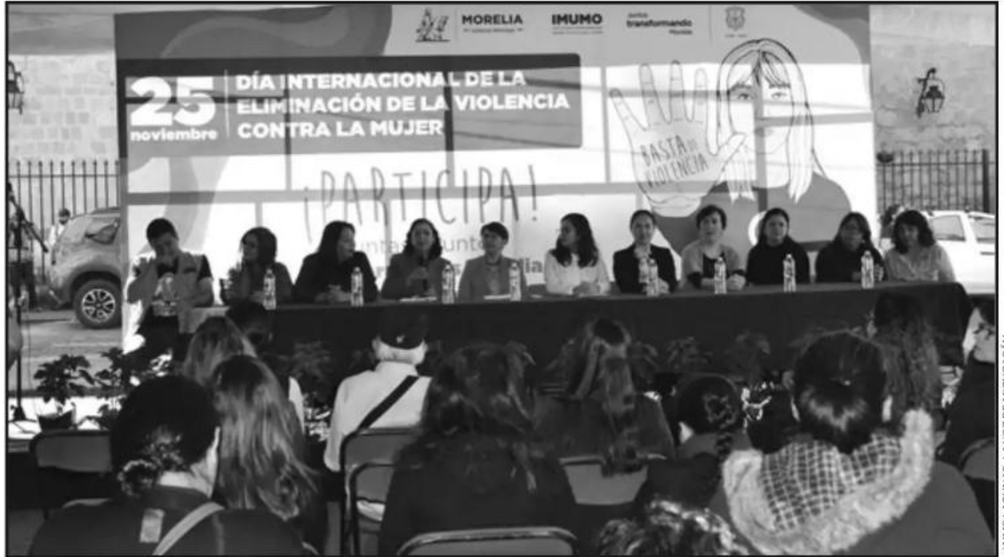
EL AYUNTAMIENTO, MEDIANTE EL INSITUTO DE LA MUJER MORELIANA, ORGANIZÓ UN EVENTO CONMEMORATIVO EN LA CERRADA DE SAN AGUSTÍN.

De acuerdo con la comisionada, los principales casos de llamados de auxilio por violencia familiar se han dado en la zona norte de Morelia fuera del anillo periférico de la ciudad, así como en las colonias La Soledad, Ciudad Industrial, Guadalupe, Villas del