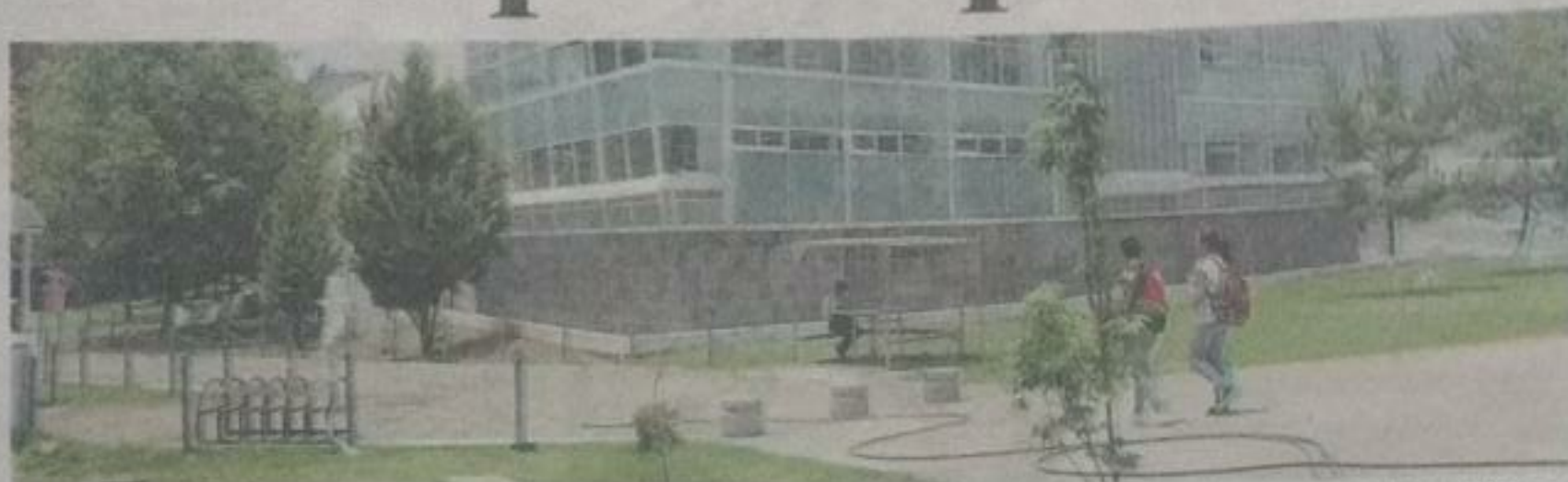
El Presidente electo, Andrés Manuel López Obrador, se comprometió a no sólo mantener el aporte actual, sino incrementar- lo. Mariana Luna Magaña

En el seno de la ANUIES se acordó solicitar el incremento al gobierno federal para el próximo año