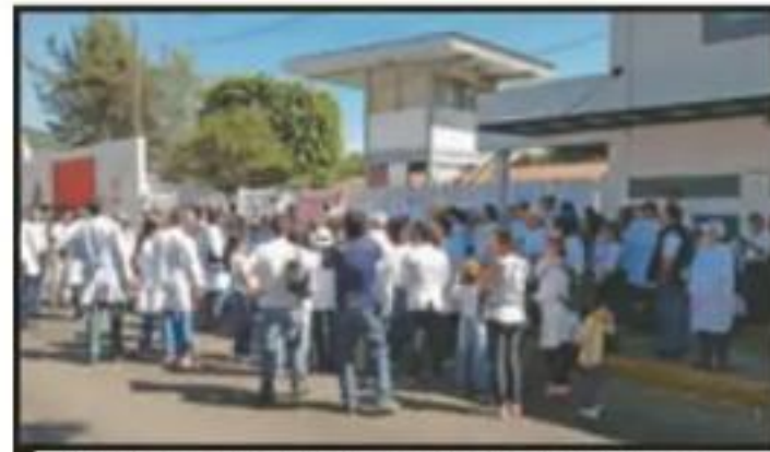
CON PANCARTA EN MANO DEMANDAN VIGILANCIA.