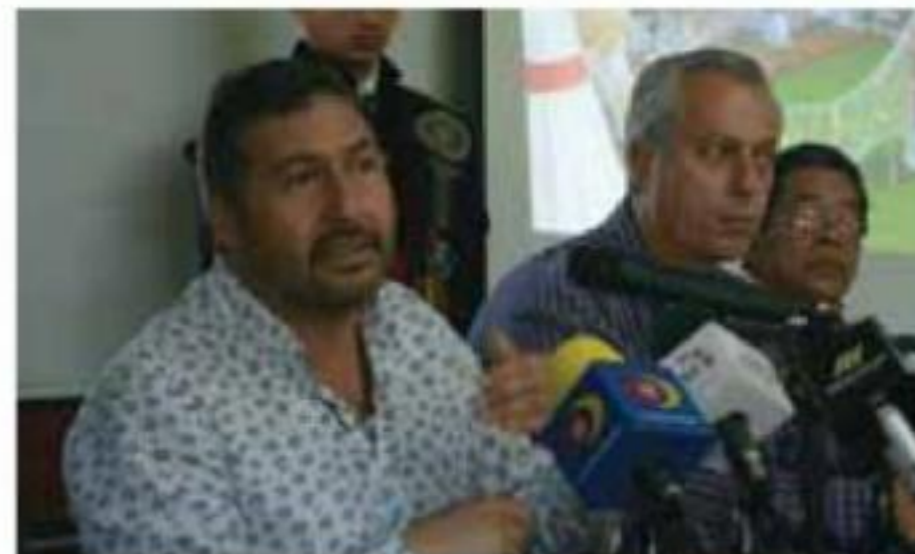
Tres alcaldes morenistas, encabezados por el de Buenavista, firmarán el convenio de seguridad con el estado.

Sin embargo, destacó que la mayoría de los alcaldes