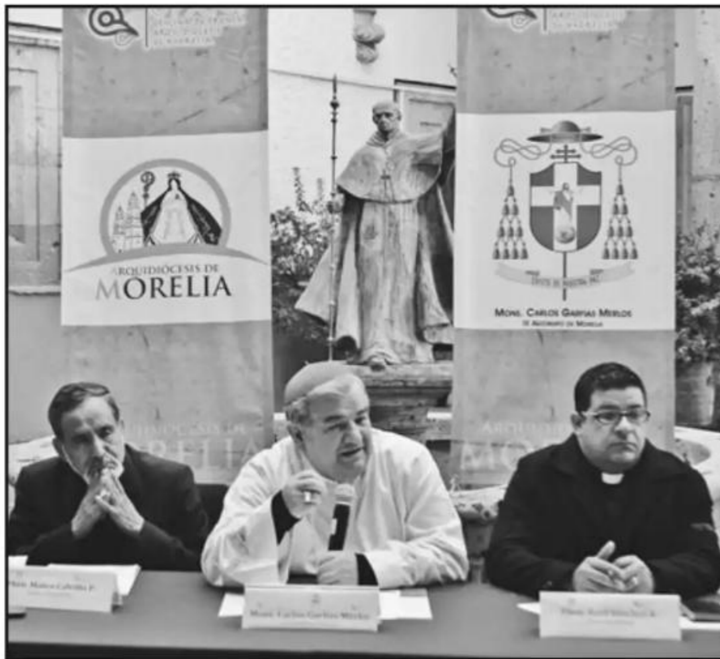
LA IGLESIA CATÓLICA PROPONE OTRAS VÍAS PARA DAR ATENCIÓN A LAS VÍCTIMAS DE LA VIOLENCIA INTRAFAMILIAR.