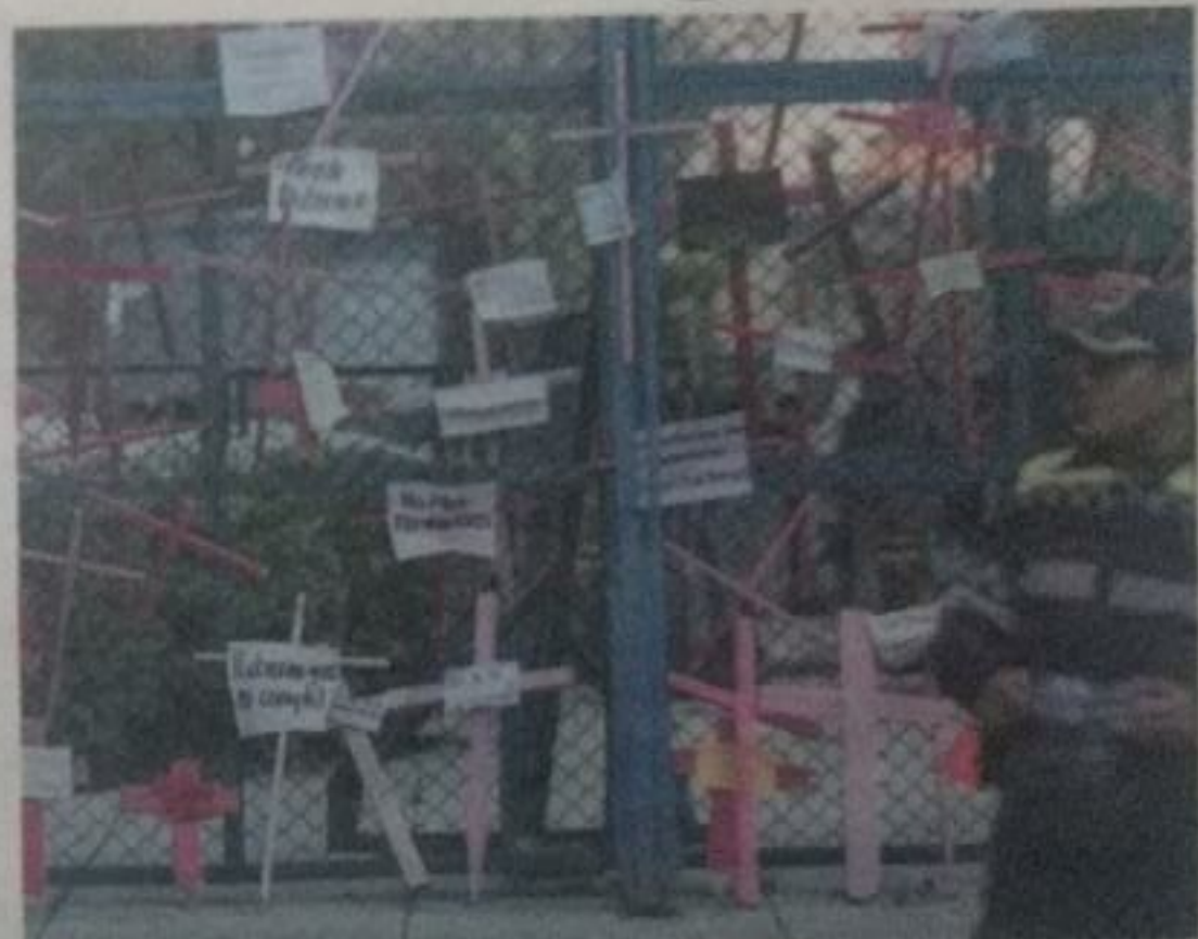
Factores como la cultura machista, la educación, la falta de empleo, las adicciones y la pobreza motivan los agravios contra el sector femenino.

Sin embargo resaltó que hay diversos factores que causan la violencia contra la mujeres, tales como la cultura machista, la educación familiar y social, falsas ideológicas, la falta de empleo y oportunidades, la comprensión que se tiene del valor y la dignidad del hombre y de la mujer, el alcohol, las drogas y la pobreza, además de ser una violación a los derechos humanos, es “una consecuencia de la discriminación que sufre, tanto en leyes como en la práctica y la persistencia de desigualdades por razón de género. (J)