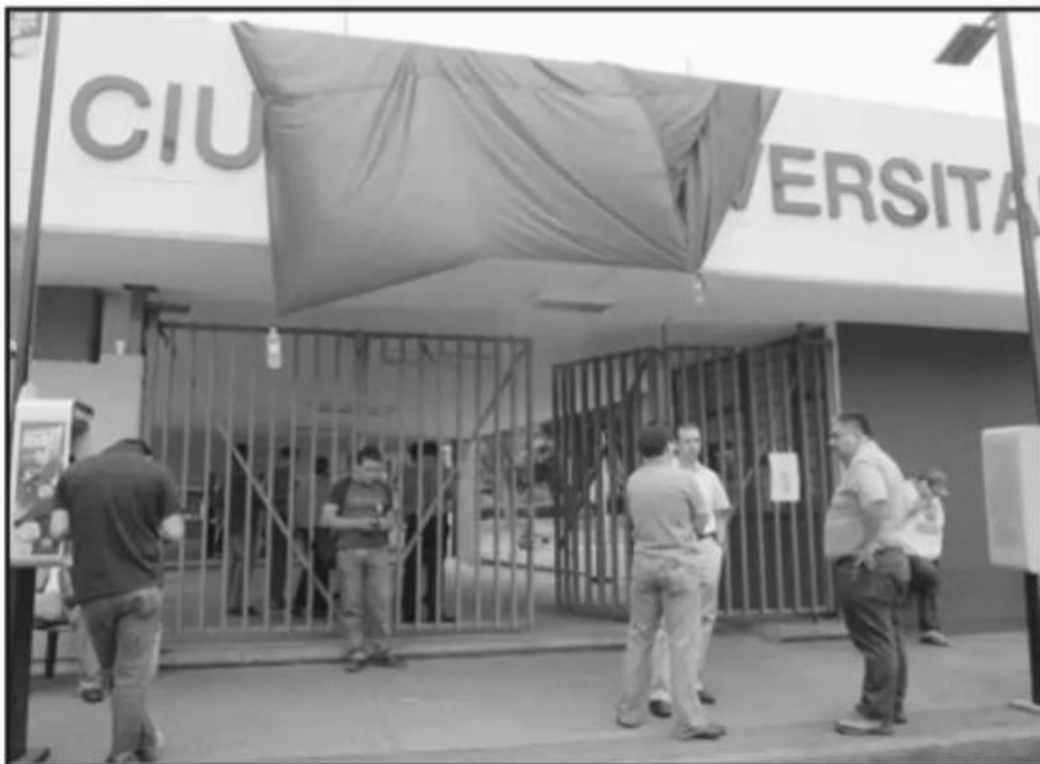
DE NO OBTENER RECURSOS PARA ADEUDOS, LAS BANDERAS ROJINEGRAS VOLVERÁN A PENDER EN LA UNIVERSIDAD.

“Lo que sabemos es que el rector realiza las gestiones, de acuerdo con el escrito que nos envió, donde informa sobre los recursos para pagar, nada más”, reiteró el sindicalista.