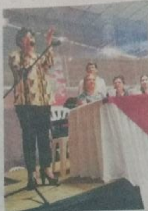
El evento fue para recordar la lucha por el respeto a los derechos de este sector.

De acuerdo con las estadísticas, siete mujeres son asesinadas diariamente, "es más fácil morir asesinada que enfermarse de cáncer o Sida, en tanto que 63 de cada 100 mujeres, entre 15 y 45 años de edad, han experimentado al menos un acto de violencia". (G)