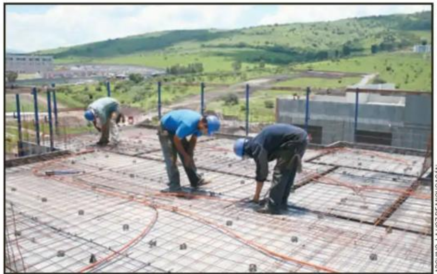
LA PRECARIEDAD LABORAL SE AGUDIZÓ MÁS EN LA ÚLTIMA DÉCADA Y NO SE VE UN PANORAMA FAVORECEDOR.

Ese comportamiento del sexenio se refleja en buena medida la instrumentación