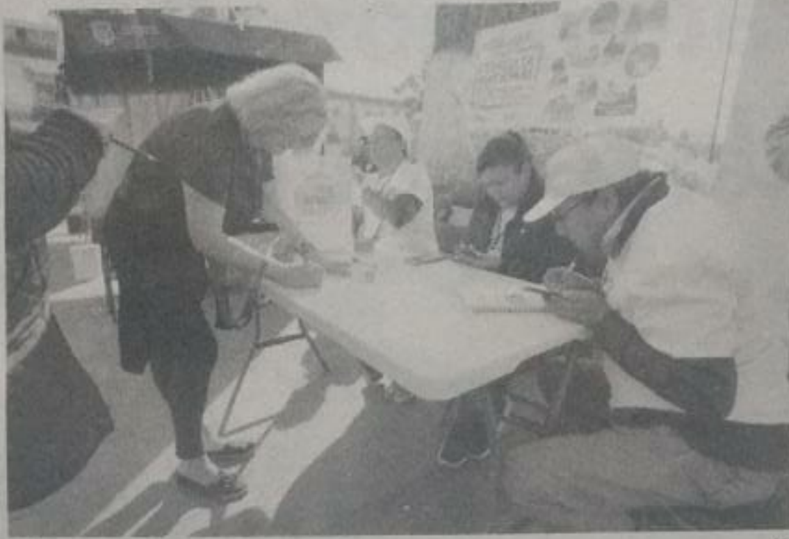
Aspecto de la segunda consulta ciudadana.

Inicia hoy la última semana de la actual administración federal y con ella las últimas horas para que las 10 universidades públicas estatales en situación de crisis financiera, en las cuales se incluye la Uni-