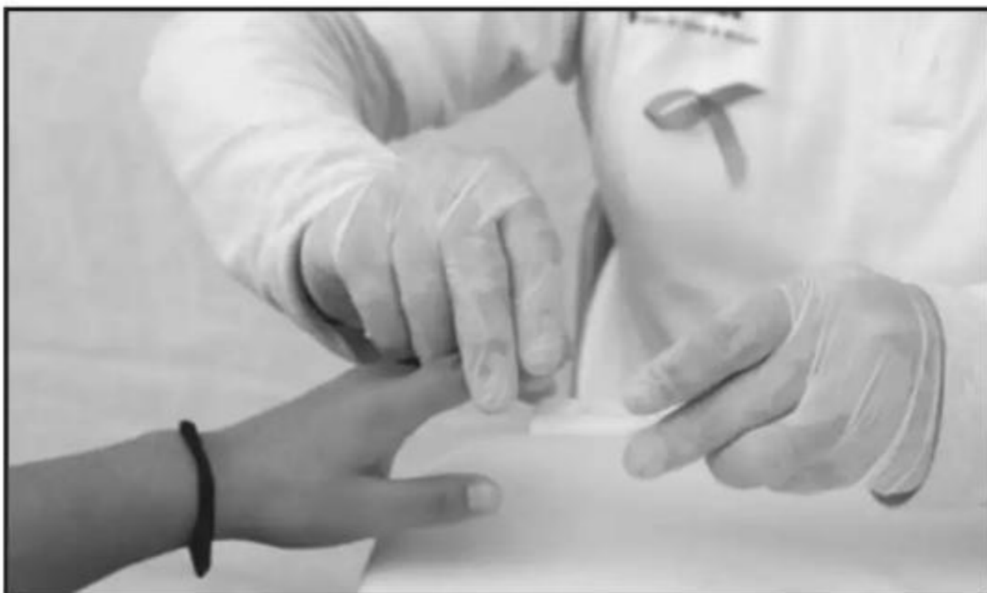
LAS PRUEBAS QUE REALIZA LA SSM SON INSTANTÁNEAS, GRATUITAS Y TOTALMENTE CONFIDENCIALES. DETALLAN.