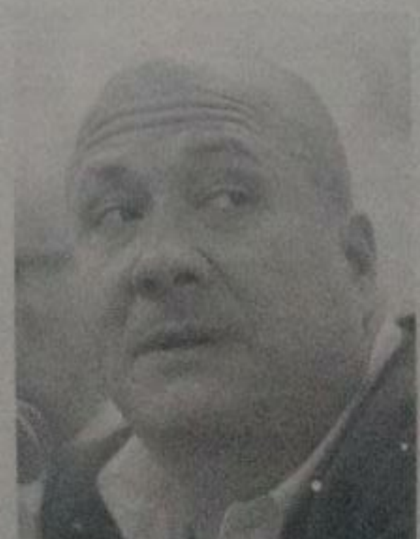
Enrique Alfaro Ramírez.