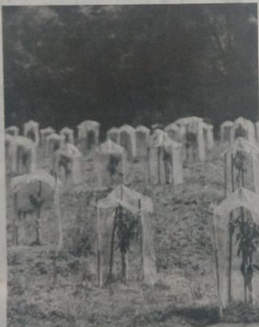
Ario de Rosales, Uruapan, Ziracuaretiro, Salvador Escalante y Zitácuaro son los municipios que presentan más huertas sin permisos.

Insistió en que la Profepa trabaja de acuerdo con su competencia y si no participa en operativos de Proam es porque la normatividad federal no permite el desmantelamiento, pero sí se han levantado denuncias penales.