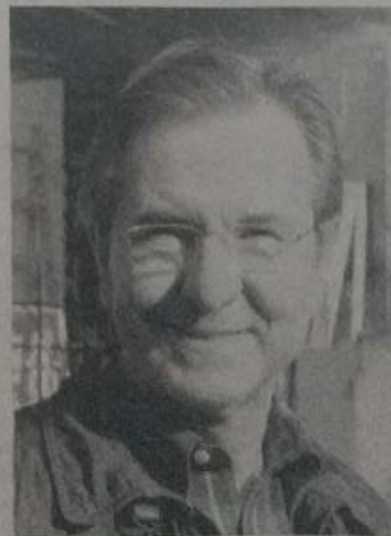
Esteban Moctezuma Barragán.