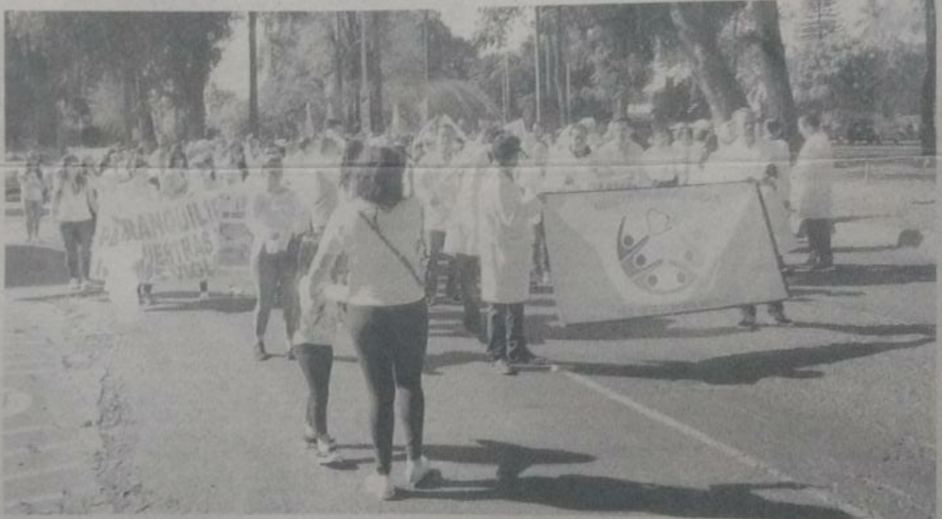
Movilización de galenos, en Uruapan.

Pero ahora, de los asaltos y robos se ha pasado al secuestro exprés, indicaron. Los médicos que fueron víctimas de este tipo de