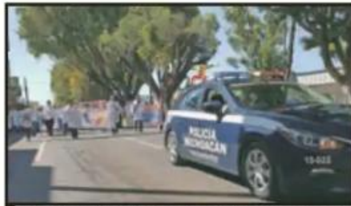
POR LAS CALLES PRINCIPALES, GALENOS PROTESTARON.

"Se realizarán otras acciones de protección para prevenir secuestros, asaltos y robos pero ello