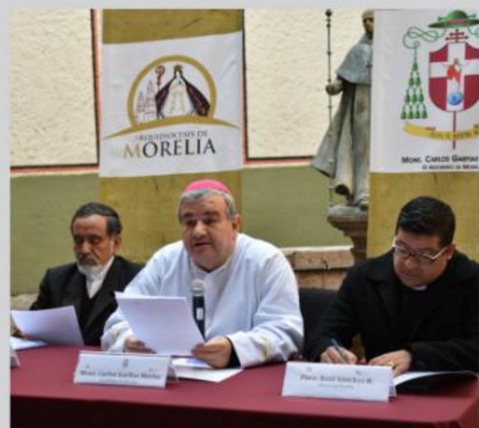
MORELIA, MICH.- El Arzobispo de Morelia, Carlos Garfias, durante rueda de prensa. (Foto: ACG medios).

Insistió en que la iglesia busca la mejor forma de acompañamiento en el campo de la vida matrimonial, y reiteró que: "No lo hay, el camino que tenemos nosotros es que pueda demostrarse que no se pudo realizar el matrimonio y no tuvo validez y se declare nulo, la mujer por violencia no se puede decretar la separación, y el mismo caso es para los hombres, una vez que se ha realizado el matrimonio, no hay más que encontrarse causas que fue nulo el matrimonio", refirió.