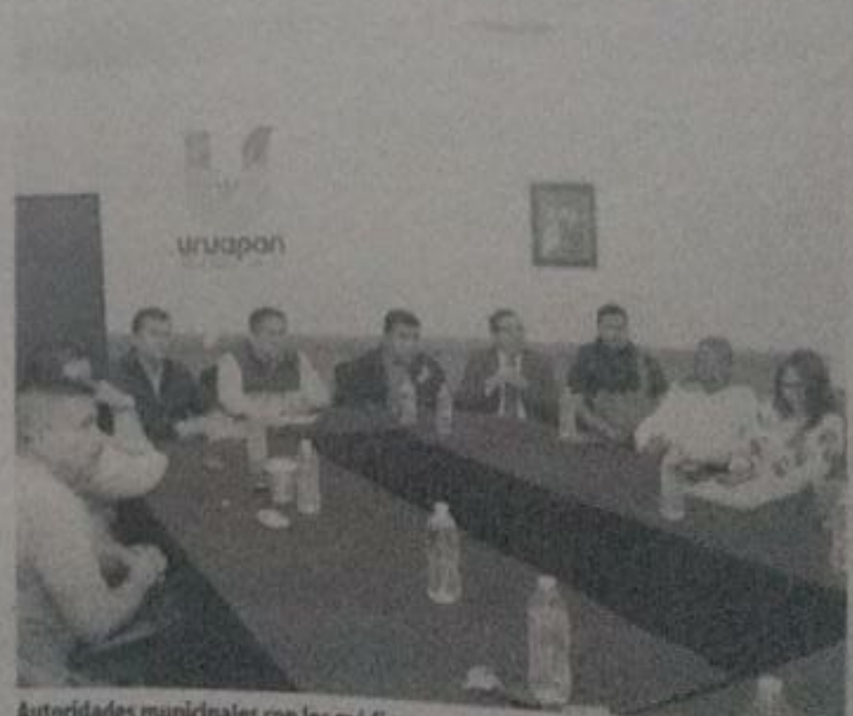
Autoridades municipales con los médicos.