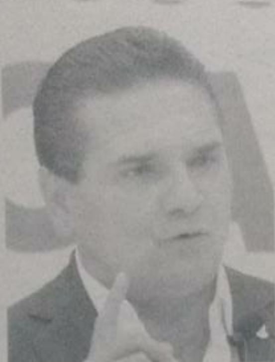
Silvano Aureoles Conejo.