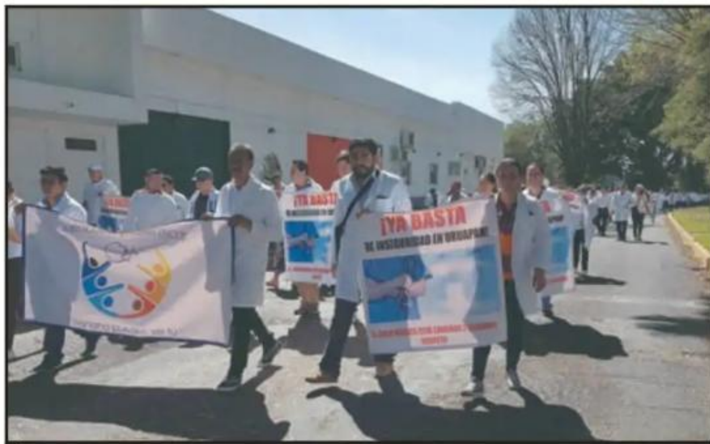
LOS GALENOS ASEGURAN QUE SUS LABORES SEVEN AFECTADAS POR EL INCREMENTO DE VIOLENCIA EN URUAPAN.

se mantiene en reserva para una mayor efectividad de los operativos", señaló uno de los participantes en la marcha y asistente a una reunión durante el fin de semana con el alcalde Víctor Manuel Manríquez y mandos de las policías local y estatal así como de la Fiscalía Regional.