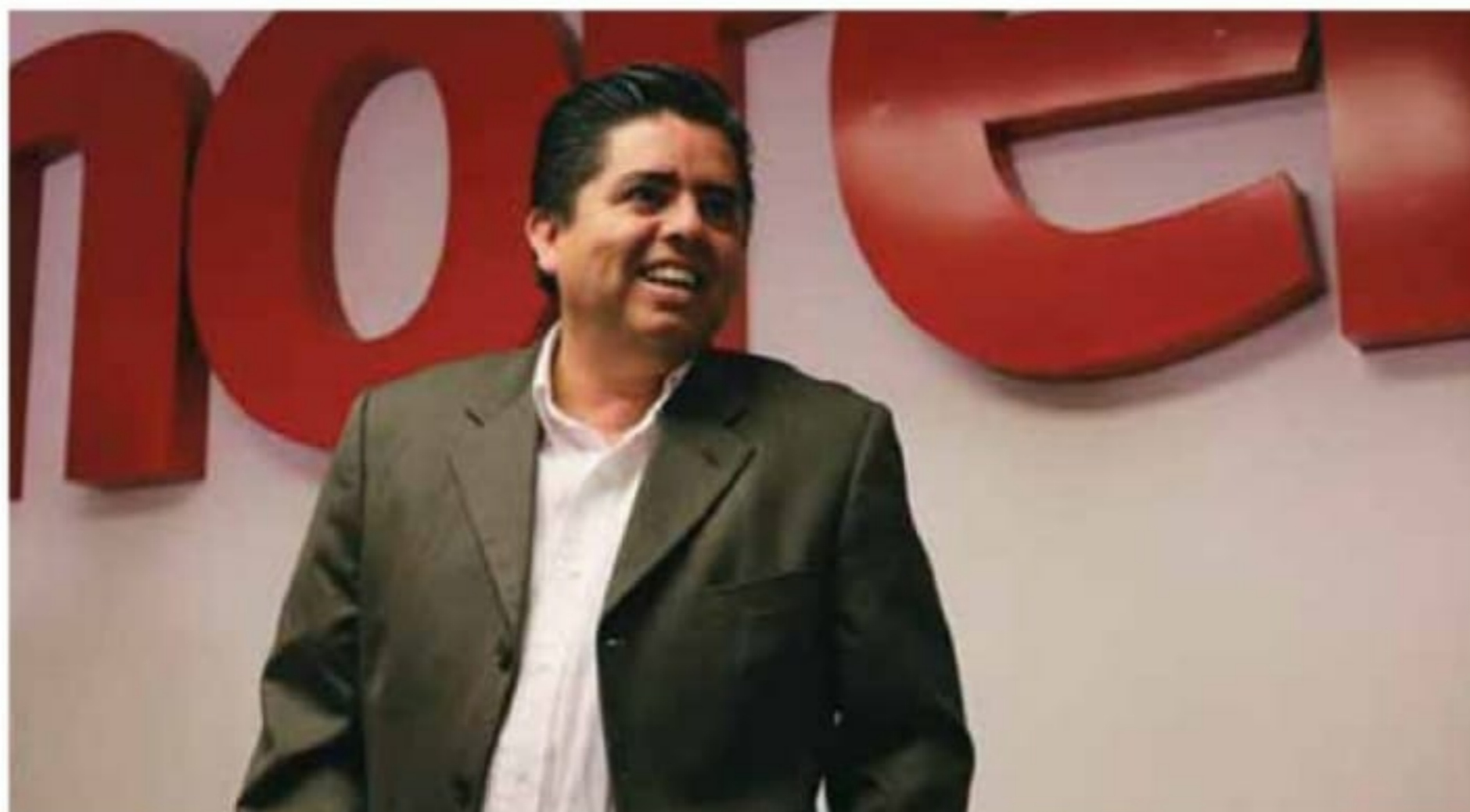
El presidente de Morena dijo que se valoran los perfiles de los trabajadores de las diferentes delegaciones en la entidad.

En ese sentido, el morenista agregó que también se analiza la posibilidad de desocupar algunos inmuebles arrendados en la entidad por las dependencias federales.