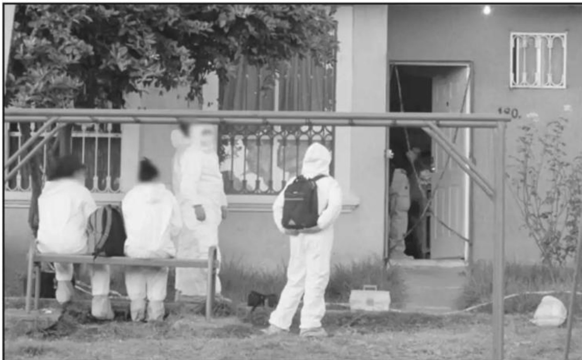
EL ALCALDE ADMITIÓ LA PROBLEMÁTICA AL SER CUESTIONADO SOBRE EL RECIENTE ASESINATO DE UNA MUJER EN VILLAS DE LA LOMA, AL PONIENTE DE LA CIUDAD.

En ese sentido, es de destacar que servidoras públicas y activistas se han manifestado con anterioridad para que los casos de