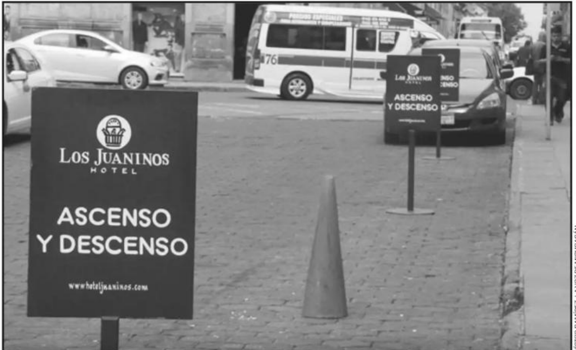
LOS HOTELES HAN SIDO LOS QUE MÁS OPOSICIÓN HAN MOSTRADO A RESPETAR LA DISPOSICIÓN MUNICIPAL, QUE BUSCA MEJORAR LA MOVILIDAD URBANA.

Cuestionado respecto a la recepción que dio la ciudadanía a este operativo en tanto que durante años se permitió bloquear vialidades con diversos objetos, Ramos Ramos reconoció que se tuvo una respuesta mixta, pues si bien algunos ciudadanos procedieron al retiro de los elementos, también hubo una actitud de “necesidad” de parte de algunos representantes hoteleros: “Hay necesidad de algunos comerciantes, sobre todo en el ramo hotelero, son los que se resisten a cumplir la norma del reglamento. En ese sentido, es por eso que tenemos que desarrollar la siguiente fase que ya es la aplicación de multas y audiencia con el