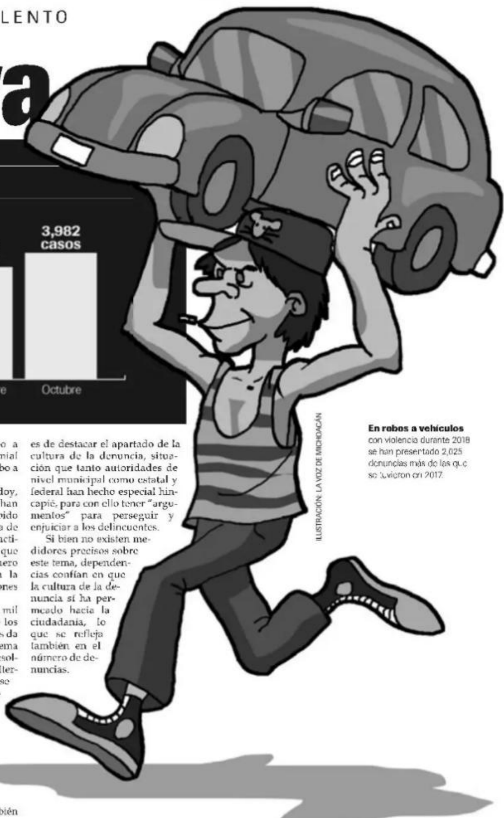
ILUSTRACIÓN: LA VOZ DE MICHOACÁN

En robos a vehículos con violencia durante 2018 se han presentado 2,025 denuncias más de las que se tuvieron en 2017.