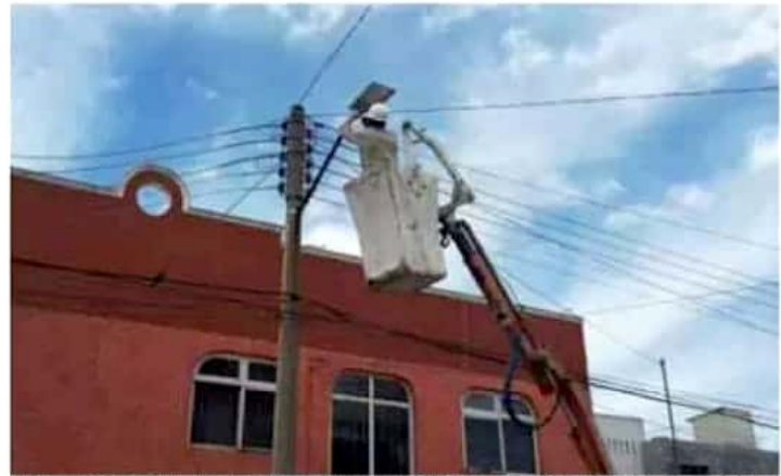
Desde temprana hora del lunes los trabajadores del Ayuntamiento iniciaron con la renovación del alumbrado público.

El alcalde de Morelia, Raúl Morón Orozco, compartió ante los funcionarios y empresarios presentes que este