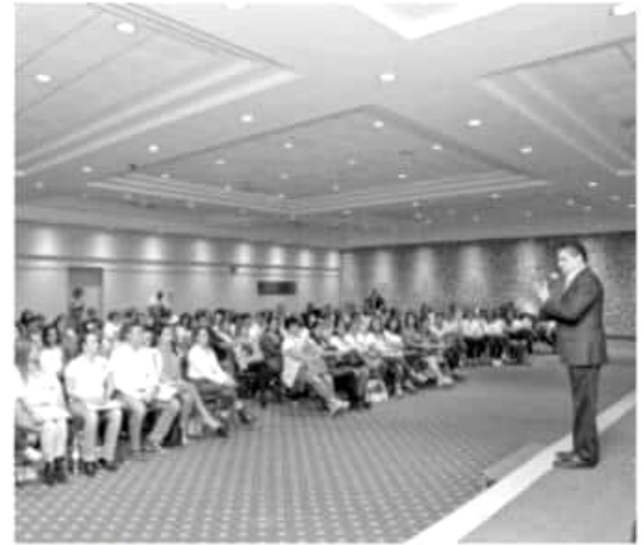
MORELIA, MICH.- El gobernador Constitucional Silvano Aureoles Conejo se reunió esta tarde con responsables de diversas estancias infantiles de la Entidad.

"Revisando los casos, estoy seguro que van a salir alternativas para que ustedes puedan continuar con esa labor, de verdad que me duele mucho lo que están ustedes viviendo y voy a revisar todas las opciones que tengamos para apoyarles", reiteró.