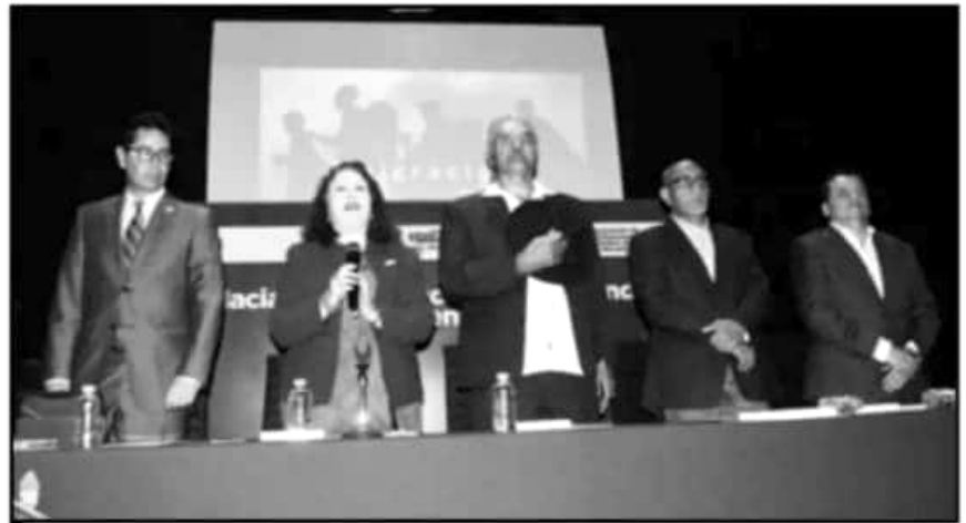
EL COLEGIO DE SAN NICOLÁS ALBERGÓ EL FORO "HACIA LA CONSTRUCCIÓN DE UNA AGENDA MIGRATORIA EN MÉXICO".

Concluyó al mencionar que la firmeza de las sentencias expedidas por los tribunales electorales locales autónomos contribuyó al funcionamiento político y democrático.