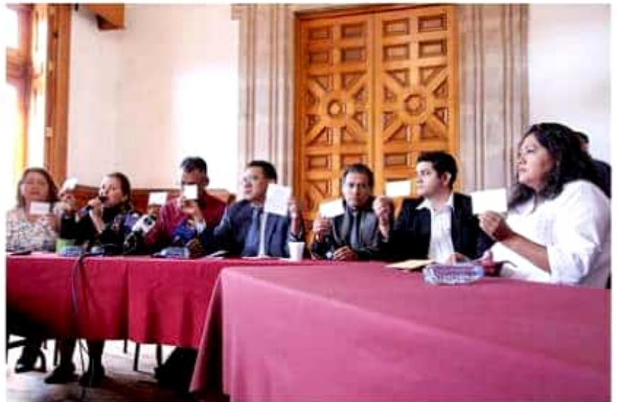
El grupo parlamentario de Morena en el Congreso local, exigió transparentar el nombramiento de Adrián López Solís, como Fiscal General del estado, para evitar que se siga hablando del Fiscal Carnal.

Bajo estos argumentos, el Grupo Parlamentario de Morena se dijo listo para transparentar el proceso que definió al Fiscal General de Michoacán, con base en pruebas que comprometerían la legitimidad del mismo.