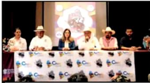
EN RUEDA DE PRENSA DIERON A CONOCER LOS DETALLES DE LA FIESTA.

El edil de Charo, destacó que del 2 al 5 tendrá lugar el evento, iniciando con un desfile de apertura en donde participarán 4 toros (Cobra, Rey, Tucán y