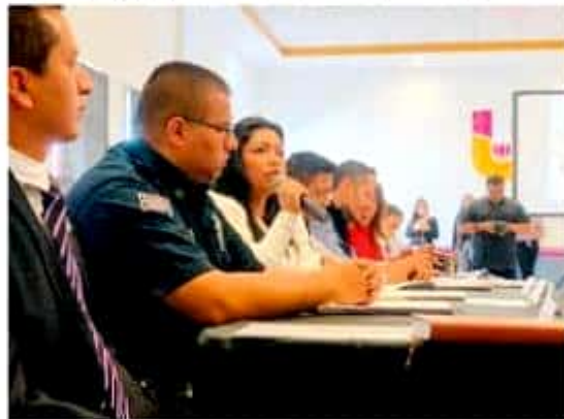
La legisladora del PT acudió a la instalación del Sistema Municipal de Uruapan para prevenir, erradicar y sancionar la violencia de género.

La legisladora petista ha sido una de las mujeres más críticas hacia el tema de la violencia de género, por lo que señaló que exigirán al nuevo Fiscal General, resultados en esta materia a en un corto plazo.