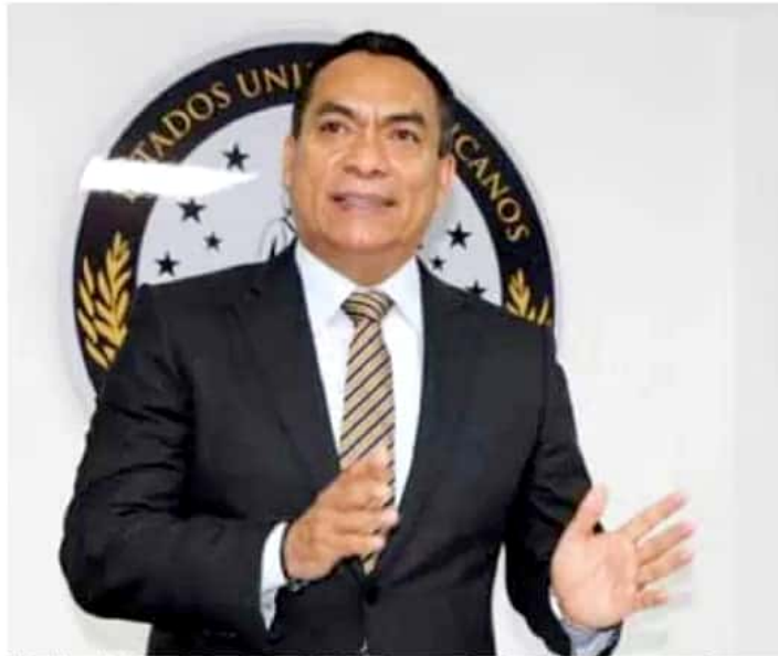
El fiscal destacó la importancia de que las autoridades de justicia se ganen la confianza de los ciudadanos.

"Que se quite esa imagen de autoritarismo y malos tratos que revictimizan a las personas que han sido sujetos pasivos de un delito y todavía llegan a la institución y los hacen esperar mucho o son víctimas de actos de corrupción; no desconozco lo que puede aún estar sucediendo ahora; tuve una reunión con los fiscales regionales y especializados para que se transmita a todas las áreas la determinación que tomamos de manera contundente de mejorar nuestra actitud para darle el mejor