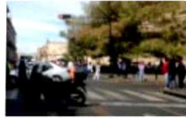
MORELIA, MICH.- Estudiantes de la Casa Nicolaita y la Casa Rosa Luxemburgo de la Umsnh, demandan que sean pagados los recursos que la Rectoría les adeuda.

todas las casas y todas las casa han sufrido este impago", acotó la vocera. Cabe señalar que la Rectoría ha asegurado que ya se comenzó a saldar los adeudos con las más de 30 casas de estudiantes en la universidad, las cuales remarcar, reciben 130 millones de pesos anuales. De este mismo modo, ayer en Morelia también protestó el Sindicato Independiente de Empleados del Municipio de Morelia, el cual continúa con el paro de labores y cierre de oficinas en todas las dependencias municipales. Asimismo, ayer también protestó Antorcha Campesina, que al ver el municipio cerrado, envió una delegación de manifestantes frente a Palacio de Gobierno, pese a que ya previamente estaba cerrada por la protesta de los universitarios.