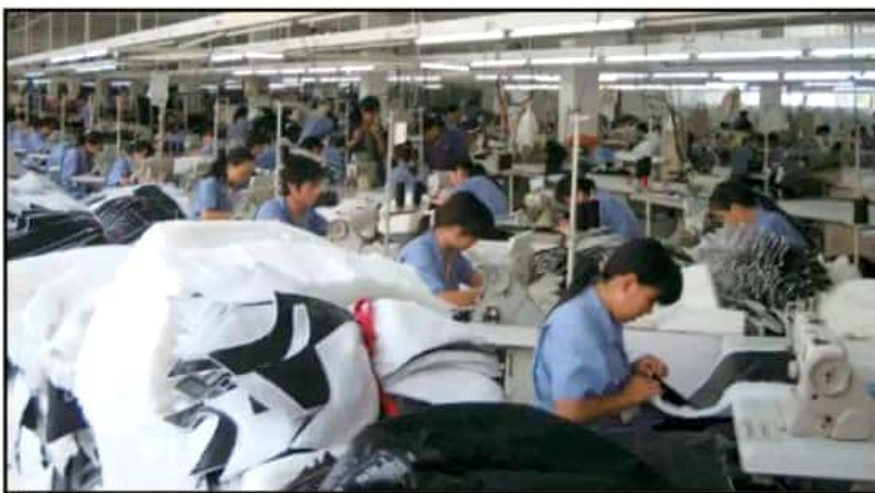
A MÉXICO LLEGAN MILLONES DE PRODUCTOS ASIÁTICOS CON PRECIOS SUBVALUADOS QUE DAÑAN A LAS EMPRESAS.

prima y el 6% de las confecciones de importación tampoco.