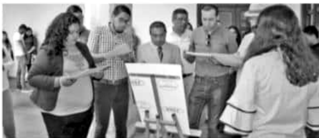
URUAPAN, MICH.- La Universidad Interamericana para el Desarrollo (UNID) sede Uruapan realizó el concurso-exposición de fotografía "Vive el Arte".

□ Gobierno Municipal refrenda coordinación con universidades para generar espacios de expresión a jóvenes