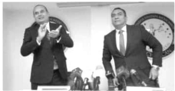
La ceremonia de posesión de Adrián López Solís como fiscal general.