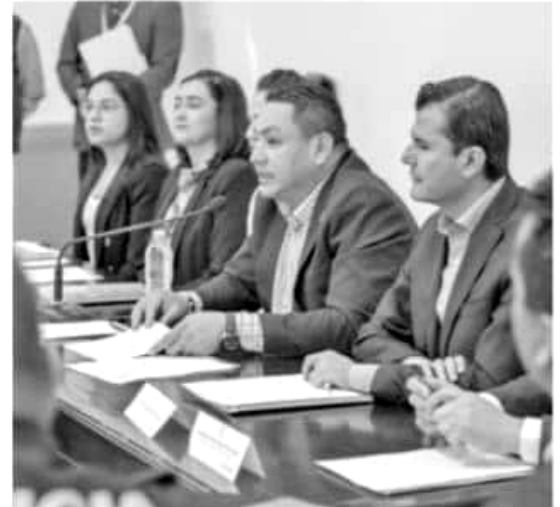
URUAPAN, MICH.- Afín de redoblar esfuerzos en el combate al maltrato en contra de las mujeres, fue instalado el Sistema Municipal para Prevenir, Atender, Sancionar y Erradicar la Violencia contra las Mujeres por razones de Género