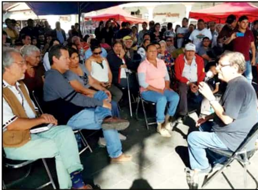
EL FUNCIONARIO FEDERAL DEL FCE, PACO IGNACIO TAIBO II ACUDIÓ A LA FERIA DEL LIBRO DE URUAPAN

una política de precios que impediría llegarán a los lectores”.