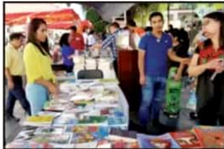
SE REALIZÓ LA TERCER FERIA ALTERNATIVA Y AUTOGESTIVA DEL LIBRO EN LA PERLA DEL CUPATITZIO.

Al frente de un staff que involucra un librería móvil de Educal, señaló que, en esencia, esta gira se centra en ofrecer libros a precios accesibles que van de los 8 o 10 pesos a los 50 pesos, destacando que para seguir avanzando, ha puesto en marcha el movimiento para unificar la Dirección de Publicaciones de Cultura y a la Red de librerías de Educal. “Es un proceso lento porque nos hemos encontrado con obstáculos, burocracia y errores, por ejemplo, una bodega llena de libros en Tlaxcala que se hicieron por encargo de funcionarios con