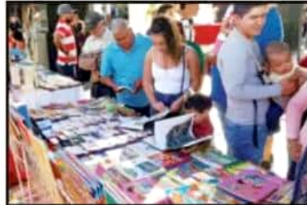
EN ESTA FERIA DE URUAPAN SE OFERTARON UNA GRAN CANTIDAD DE LIBROS A PRECIOS ACCESIBLES.