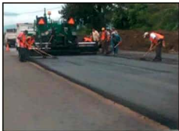
LAS PRIORIDADES DEL GOBIERNO FEDERAL SERÁ LA CONSERVACIÓN Y EL MANTENIMIENTO DE LA INFRAESTRUCTURA CARRETERA QUE ESTÁ DETERIORADA.

"En los primeros 100 días del Gobierno del presidente López Obrador tendremos comprometido el 76 por ciento del presupuesto asignado a este programa".