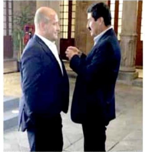
AMLO presidió su primera reunión de gobernadores tras tomar protesta como jefe del Ejecutivo nacional el pasado sábado. | @JAVIER_CORRAL

A la reunión no asistieron los mandatarios de Jalisco, Aristóteles Sandoval, y de Morelos, Cuauhtémoc Blanco.