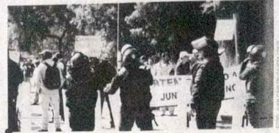
Docentes del Telebachillerato Comunitario y de Telesecundarias consideraron que el mandatario estatal desatiende al sector al abandonar el acuerdo de 1992.

Consideraron que los anteriores diputados actuaron de manera autoritaria cuando se pretendió aprobar algunas reformas sin consultar a la comunidad universitaria.