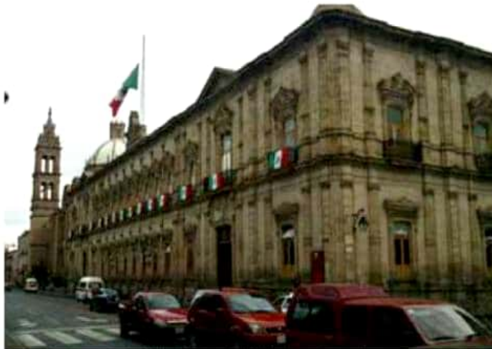
Este mes inicia el proceso de traslado de las oficinas centrales del IMSS a Michoacán.