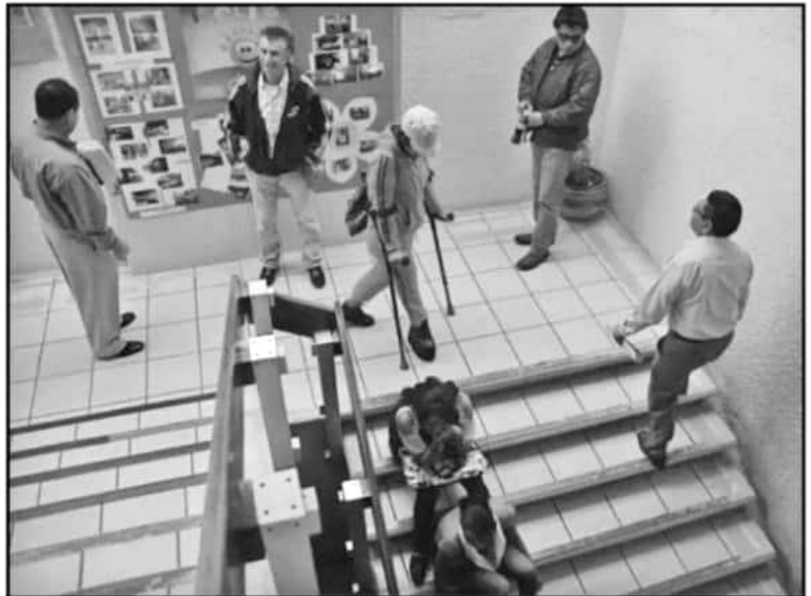
MUCHOS EDIFICIOS PÚBLICOS CARECEN DE ACCESOS, RAMPAS E INFRAESTRUCTURA PARA SILLAS DE RUEDAS O MULETAS.

"Ahorita ya es más complicado de lo normal porque hay muchos baches y algunos establecimientos a los que me gustaría ir no tienen rampas ni accesos, los baños son muy pe-