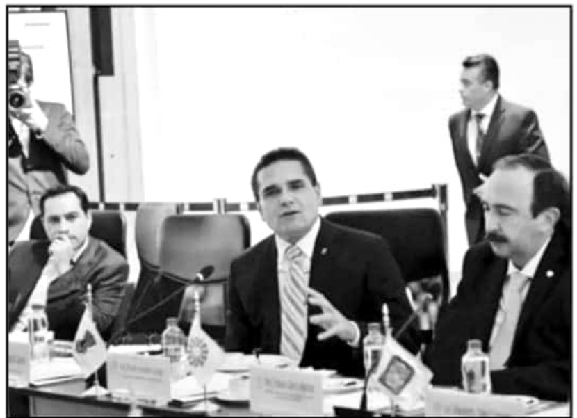
AL MARGEN DE LA LEY, NADA; POR ENCIMA DE LA LEY, NADIE. LE RECORDÓ EL MICHOCANO A LÓPEZ OBRADOR.

procuración de justicia, en las que el conocimiento experto y el manejo preciso de la estrategia son factores que aseguran el éxito", subrayó.