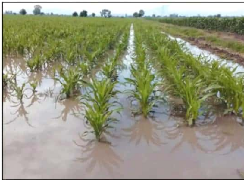
LAS MAYORES AFECTACIONES DE CULTIVO SE REGISTRARON EN VENUSTIANO CARRANZA, PAJACUARÁN Y BRISEÑAS.