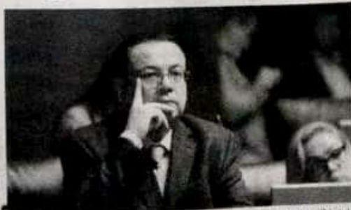
Antes de que concluya diciembre, el director del Seguro Social despachará en la sede provisional de la dependencia en Morelia, la cual abrirá sus puertas la segunda quincena de diciembre.

Al quedar instalada la Comisión Especial para coadyuvar en la atención y facilidades para el traslado de las oficinas centrales del IMSS a la zona metropolitana de Morelia, el diputado y presidente de la misma enfatizó que están trazando una estrategia puntual para la reubicación de 11 mil 500 trabajadores que hay en oficinas centrales del Seguro Social y que dentro del análisis están viendo cuántos recursos humanos serán reubicados en la capital michoacana.