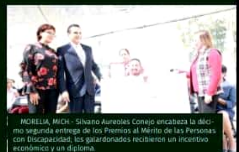
MORELIA, MICH.- Silvano Aureoles Conejo encabeza la décimo segunda entrega de los Premios al Mérito de las Personas con Discapacidad; los galardonados recibieron un incentivo económico y un diploma.