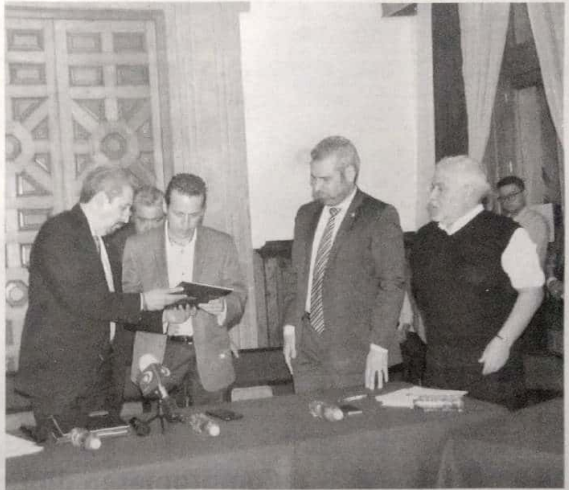
El rector de la UM y los líderes sindicales, en el Congreso.

Los sectores unidos de la Universidad Michoacana: autoridades, profesores, trabajadores administrativos y manuales, y personal jubilado, nos pronunciamos a favor de un presupuesto suficiente y oportuno que permita a