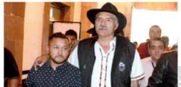
El líder de las autodefensas michoacanas aseguró que trabajará con AMLO.

"Van a continuar porque no hay seguridad... los que piensan que un autodefensa es un civil con un fusil buscando criminales están equivocados, eso es una función del estado mexicano y de sus instituciones, no es lo correcto que lo hagan los civiles, lo correcto es que la autoridad haga su trabajo, y se los digo yo; nosotros votamos por un