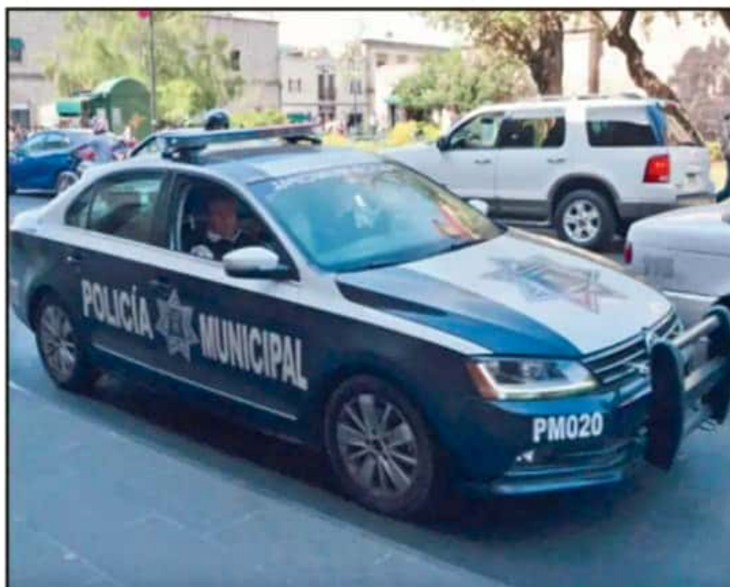
MORELIA ES DE LOS MUNICIPIOS QUE MÁS ELEMENTOS CERTIFICADOS TIENE, TRABAJAN CON EL IEESSPP PARA ELLO.

"Se les está notificando a los presidentes municipales, a todos, que deben dar de baja de manera