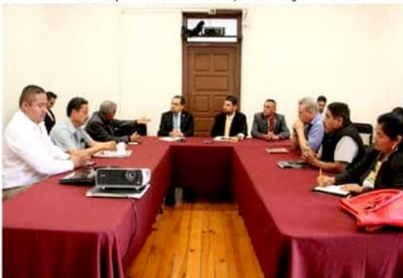
Integrantes de la COCOCAM y diputados del PRD, coincidieron en solicitar simplificación de trámites para que campesinos puedan acceder a programas, sin dificultades.

Atendiendo la reunión de trabajo que solicitaron los representantes de ➤ 10