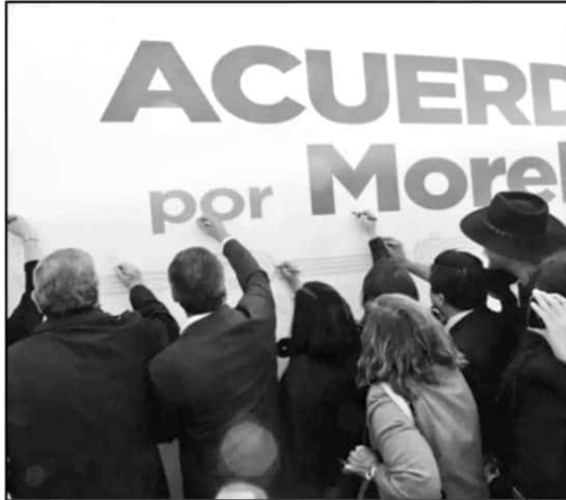
DE FORMA SIMBÓLICA, REPRESENTANTES DE DIVERSOS SECTORES FIRMARON EL MARCO PARA MOSTRAR SU COMPROMISO.

"Los gobiernos no hemos podido resolver los problemas, ¿desde cuándo?, desde todos los años. Yo creo reconocer un problema con el que no podemos solos e invitar a la ciudadanía a que participe, eso es honestidad,