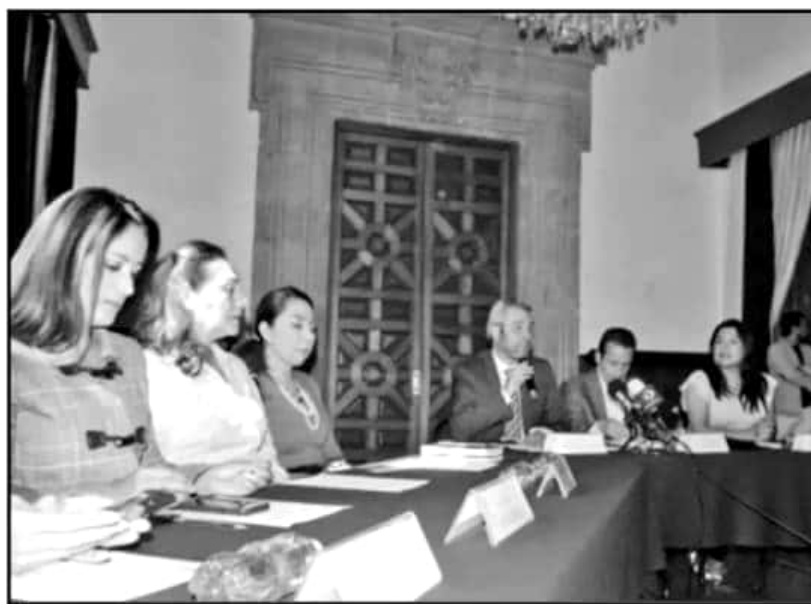
SE DIO FORMALMENTE LA INSTALACIÓN EN EL CONGRESO DEL ESTADO DE LA COMISIÓN PARA DESCENTRALIZAR EL IMSS.

PT, confirmó que las oficinas centrales del IMSS ocuparían el Palacio de Correos, y externó su confianza de que la descentralización del IMSS se realice sin contratiempos en Michoacán para que fluya la transición.