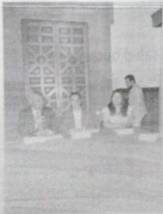
El traslado de las oficinas centrales del Instituto Mexicano del Seguro Social a la Zona Metropolitana de Morelia.