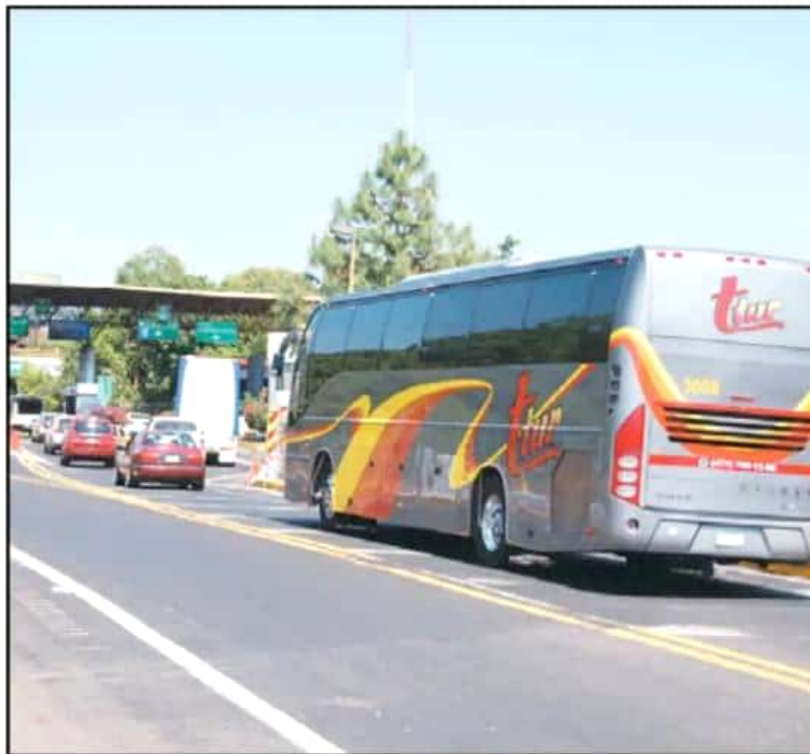
UNA MAYOR SEGURIDAD EN LOS CAMINOS ES LA PRINCIPAL DEMANDA DEL SECTOR TRANSPORTISTA DE URUAPAN.

Por ejemplo, dijo, actualmente para alguien que busca