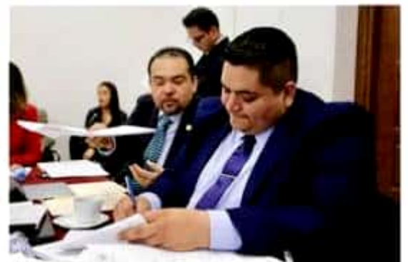
Con la eliminación de inconsistencias, que reflejaban cobros injustificados, se aprobó el proyecto presupuestal de la capital michoacana para el próximo año.