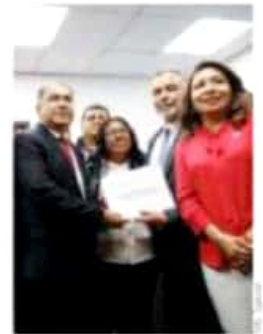
El gobernador guerrense entregó su proyecto a los legisladores.

El presidente, Andrés Manuel López Obrador propuso la descentralización como un mecanismo para dinamizar las economías regionales. Entre las instancias que se reubicarán, están: Economía (en Nuevo León); Conade, en Aguascalientes; el Instituto de Seguridad y Servicios Sociales para los Trabajadores del Estado, en Colima, y la Comisión Nacional del Agua, en Veracruz.