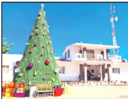
CON EL ENCENDIDO DEL PINO NAVIDEÑO QUE SE INSTALÓ AFUERA DEL PALACIO MUNICIPAL, EL ALCALDE DE GABRIEL ZAMORA INAUGURÓ LAS FIESTAS DECEMBRINAS.

Por último, manifestó que ante la alteración que está sufriendo el clima, se ha hecho mucho hincapié a los productores para que se auto-aseguren para en caso de que sus cultivos sufran algún siniestro puedan recuperar algo de la inversión que hicieron en la siembra y esto les permita seguir labrando las tierras.