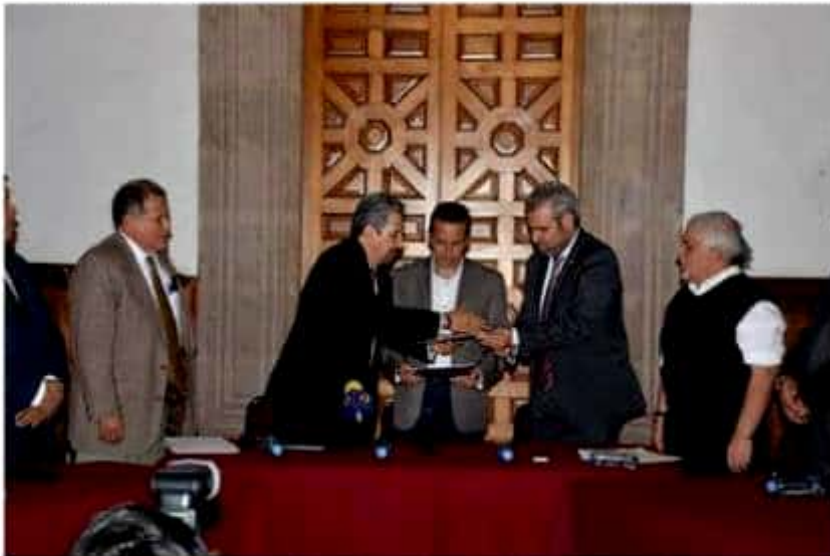
El Presidente de la Mesa Directiva hizo un llamado al trabajo conjunto y a la unidad.

"No podemos avanzar por las modificaciones que se van a realizar tras la decisión del gobernador de regresar los servicios de educación básica y normal y segundo, el PEF 2019 de la federación. Tenemos la intención de hacer una propuesta de Ley pronta y expedita, pero los tiempos de la federación no lo van a permitir, vislumbramos que quieren llevarlo al límite para que los diputados federales lo tengan a aprobar como se presente", reconoció.