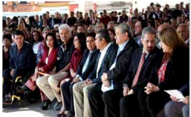
El Acuerdo por Morelia constituye una réplica del que se va a implementar en todo el país.

Recalcó que "sólo sumando esfuerzos Morelia podrá transformarse", y aseguró que este acuerdo está bien planeado, debido a que se hizo un análisis previo sobre cómo puede participar la ciudadanía, la responsabilidad que tienen las autoridades municipales en la