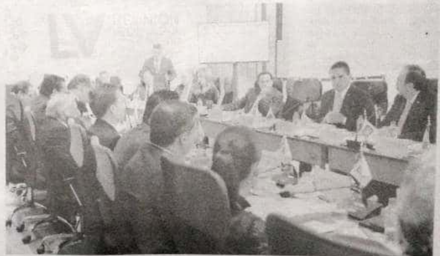
Un aspecto de la reunión, celebrada en la Ciudad de México.

En el mismo tenor, el mandatario michoacano hizo notar que hasta el momento no se ha mencionado ninguna medida relacionada con el fortalecimiento de las corporaciones policíacas estatales y municipales, en los planes federales, «cuando el éxito en el combate a la delincuencia organizada también incluye el tener cuerpos de seguridad adiestrados, equipados y con altos estándares de control de confianza».