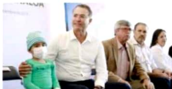
El mandatario sinaloense subrayó que todo se hace "por el bien de los niños".

El gobernador sinaloense dijo que desde la etapa de transición se dedicó a gestionar los recursos públicos para la construcción de estos hospitales, pues consideró que el esquema con el cual se pretendía construirlos en la pasada administración, mediante la figura