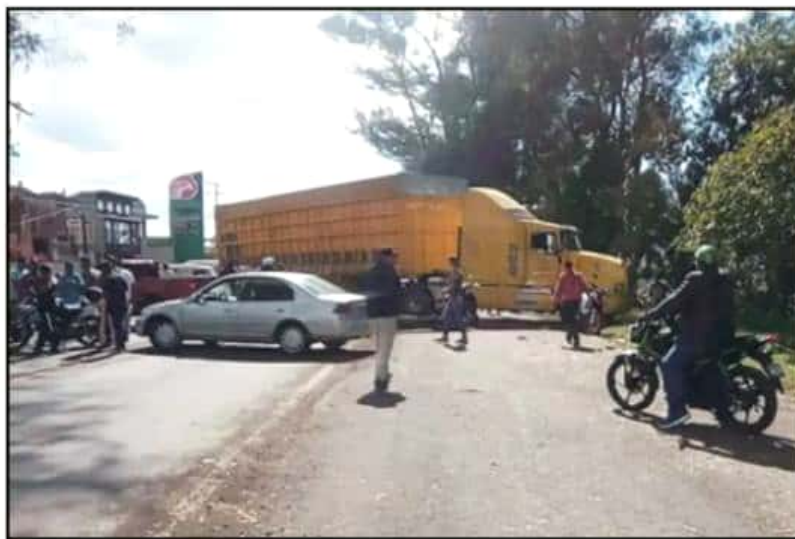
INCONFORMES POR EL OPERATIVO SORPRESA DE TRÁNSITO DESATARON BLOQUEOS CARRETEROS EN QUIROGA.