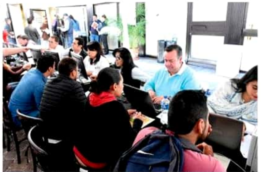
Al cierre de año, el SNE Michoacán habrá realizado 49 Ferias de Empleo en municipios como Pátzcuaro, Lázaro Cárdenas, Zitácuaro, Uruapan y Zamora, entre otros.

No obstante, con la PGJE resaltó que tras una constante capacitación en materia de derechos humanos -originadas por las recomendaciones de la CEDH-, hubo una disminución en las querrelas; sostuvo que al igual que la Policía Michoacán, y como posiblemente ocurra con la Dirección de Seguridad Pública Municipal, la capacitación de sus elementos fue una prioridad.