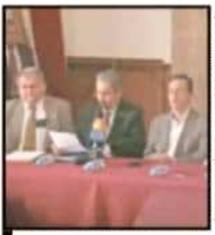
AL CENTRO, EL RECTOR DE LA UNIVERSIDAD, MEDARDO SERNA.

Rector y líderes sindicales aplauden la iniciativa de Moreno para asignar al menos el 6 por ciento del presupuesto estatal de egresos a la Casa de Hidalgo cada año, pero no asumen compromisos para frenar el despido y revertir la falta de transparencia financiera.