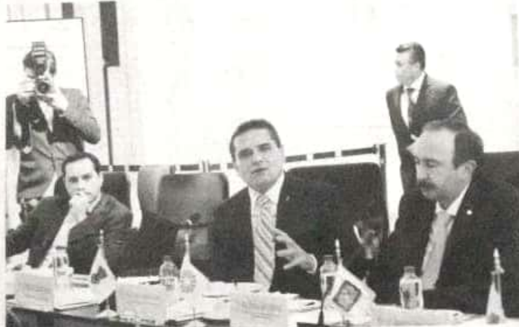
Silvano Aureoles encabezó el pronunciamiento de mandatarios de las entidades ante el presidente de México, Andrés Manuel López Obrador, en sesión plenaria celebrada en Palacio Nacional.

Apartó que los llamados delegados de programas para el desarrollo y delegados territoriales, legalmente no tienen atribuciones en materia de seguridad pública, pero ya intentan intervenir en toda la línea de mando de la seguridad en los estados, desconociendo a las autoridades civiles y mandos militares a "mesas estatales y regiona-