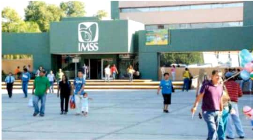
En el traslado y acomodo de los trabajadores del instituto, apoyarán diversas instancias del gobierno de Michoacán.

La comisión de seguimiento se coordinará con otras dependencias federales para elaborar el proyecto de traslado y facilitar la realización de trámites y procedimientos, como