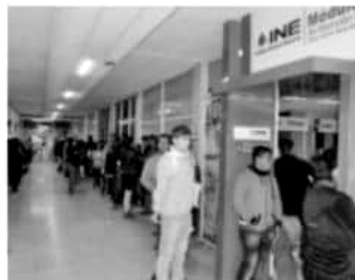
URUAPAN, MICH.- El pasado 31 de diciembre del 2018 se quedaron más de 16 mil ciudadanos sin cambiar la credencial