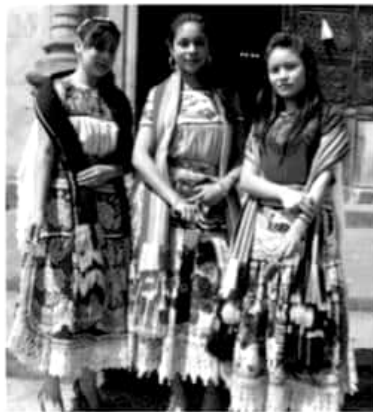
Principal requisito, comprobar que se es natural de comunidad originaria.