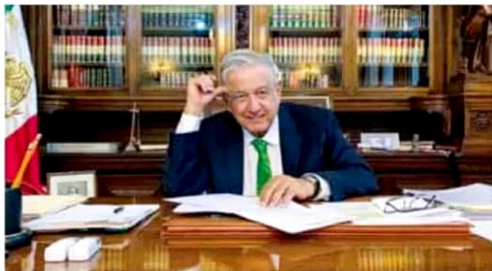
El mandatario enseñó a través de un video subido a sus redes sociales cómo firmó el documento. [PHOTO CREDIT]

"Esto, evidentemente, va hacia un Estado fallido, frente