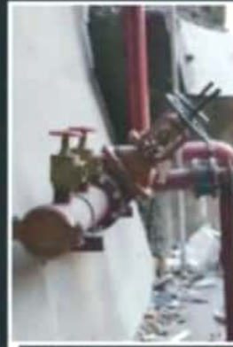
SE APRECIA QUE FALTAN PIEZAS.

lómetro de distancia y que tienen como objetivo evitar la acumulación de los gases tóxicos de los cerca de 40 mil automóviles que circulan en ascenso o descenso de esta vialidad.