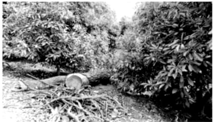
SALVADOR ESCALANTE, MICH.- En el lugar, se observa la extinción de un bosque de arbustos y herbácea de los géneros encino y pino, realizando su extinción y localizando el cambio de uso de suelo

El predio fue inspeccionado por peritos de la Policía Federal Ministerial, quienes aportan al Ministerio Público Federal en Morelia, los dictámenes correspondientes a fin de integrar la carpeta de investigación en contra de quien o quienes resulten responsables.