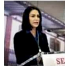
El caso sucedió hace más de una década.

Las consecuencias Este martes, el Primer Tribunal Unitario con residencia