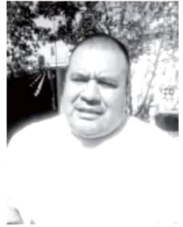
Habitantes de San Felipe buscarán dar de alta este dialecto y se incluya en el libro del Instituto Nacional de Lenguas Indígenas.

«Si no se ha dado de alta es porque como pueblo muchos se avergüenzan de hablarlo, de escribirlo y el INALI necesita conocer al detalle estas variantes para que aparezca en los libros; urge que nos pongamos a trabajar los de esta etnia».