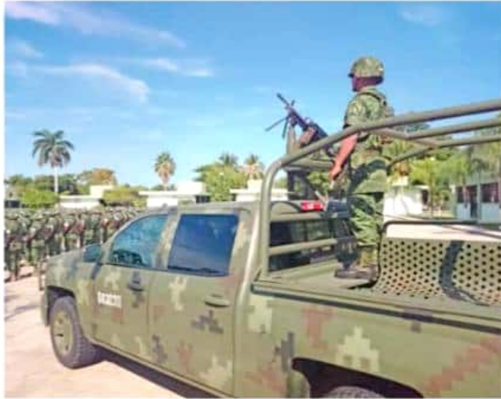
Para este año se cuenta con más recursos a través del Programa de Fortalecimiento a la Seguridad directos de la Federación.

Por tal motivo explicó que en tal caso deberán esperar a que se dé esa dinámica, para identificar la manera en la que habrán de trabajar, pero en este momento sólo les queda esperar a que se haga algún anuncio oficial.