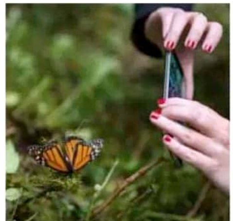
De los 212 millones de mariposas que llegaron al país, 185 millones estuvieron en Michoacán.

personas acudieron a la zona de la Monarca