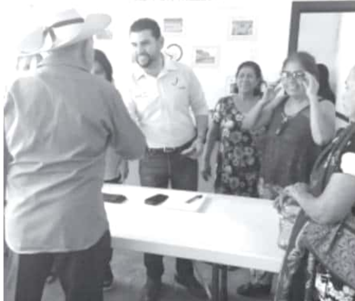
En esta campaña se ofrece atención integral y gratuita a la población de la región, los especialistas realizan el diagnóstico y se les brindan los anteojos a quienes lo requieren y los pacientes con problema mayor se les apoyará con el tratamiento.

-Entrega 500 lentes, luego del diagnóstico médico que especialistas realizaron en su Casa de Gestión