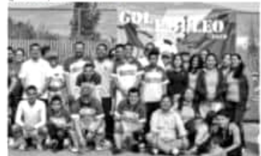
MORELIA, MICH.- El objetivo fundamental de este evento, es promover la inclusión laboral y la empleabilidad, así como lograr la integración mediante espacios de sano esparcimiento y el deporte.

El evento se efectuó en la Unidad Deportiva Bicentenario, en el que resultaron ganadores del primer lugar, en la rama femenil, el representativo de "Grupo Posadas" y, en segundo lugar, "Alcom Contact Center". En la rama varonil los equipos de "Cañadas del bosque" y "Liverpool", se hicieron acreedores al primer y segundo lugar, respectivamente.