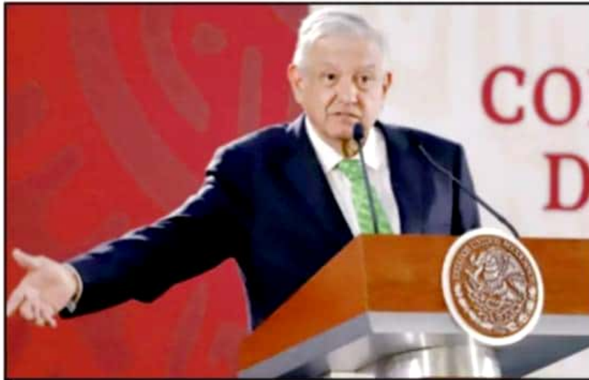
LÓPEZ OBRADOR DIO A CONOCER EN LA CONFERENCIA MAÑANERA SU DECISIÓN DE ABROGAR LA LEY EDUCATIVA.

"En cambio, este conjunto de modificaciones legales, impuesto mediante actitudes autoritarias y