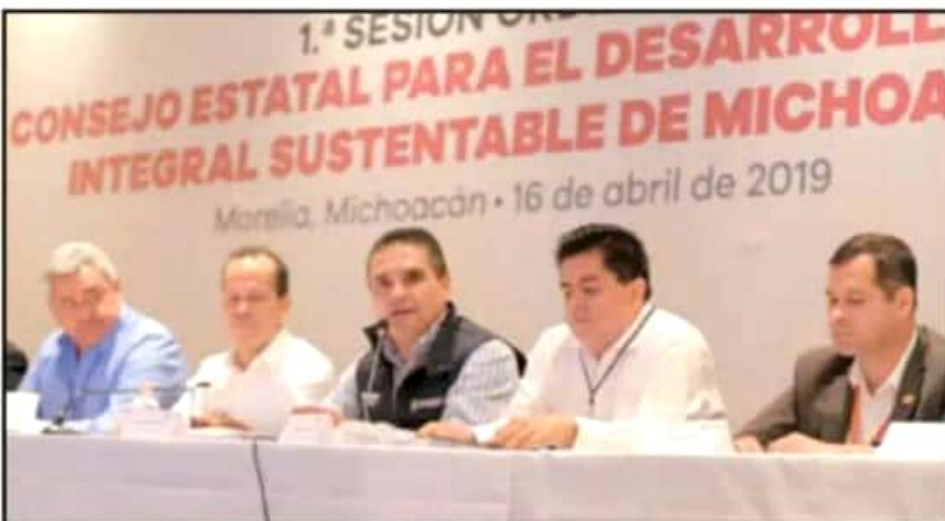
SESIONÓ ESTE MARTES EL CONSEJO ESTATAL PARA EL DESARROLLO INTEGRAL SUSTENTABLE DE MICHOACÁN.