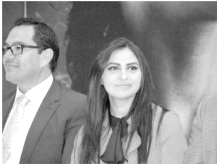
Araceli Saucedo Reyes, coordinadora del grupo parlamentario del Partido de la Revolución Democrática en el Congreso del Estado.