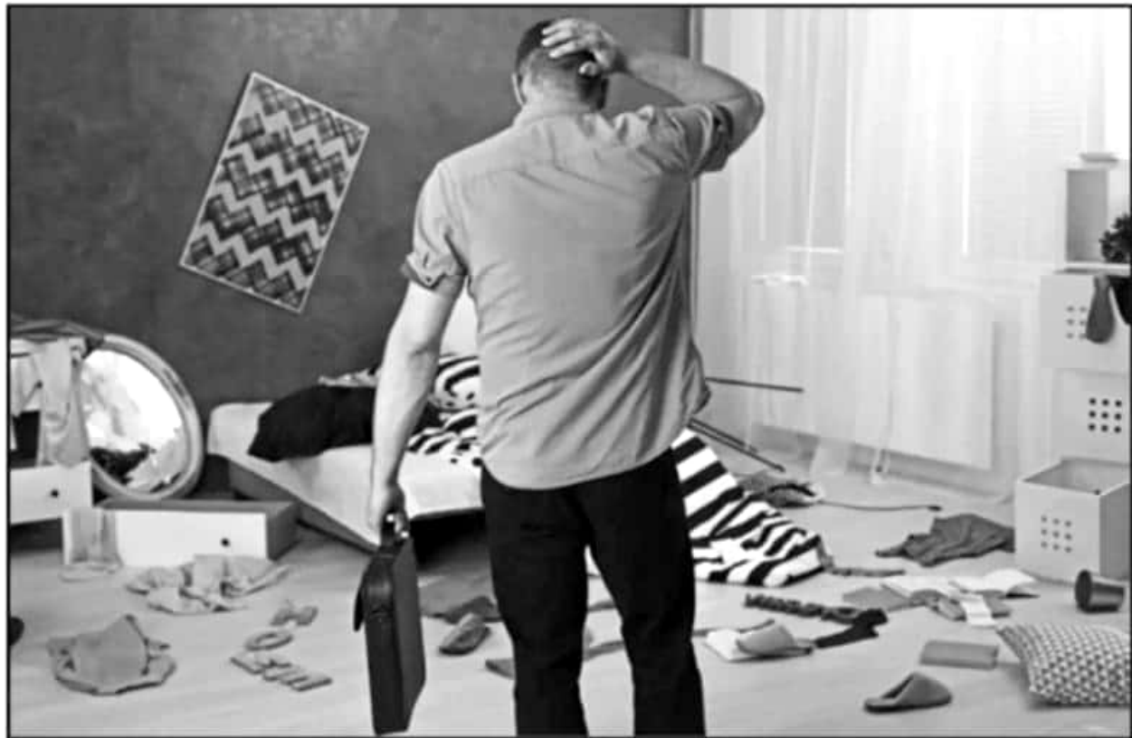
NO ANUNCIAR QUE VA A SALIR. ASEGURARSE DE DEJAR TODO BIEN CERRADO Y ESTABLECER REDES VECINALES. ALGUNAS SUGERENCIAS DE LA AUTORIDAD.

De acuerdo con la comisionada, la tendencia de robos a casa habitación es variable y ronda los dos casos diarios, de tal manera que mensualmente se dan cerca de 60 sucesos, principalmente en las colonias Félix Ireta, Molino de Parras, Prados