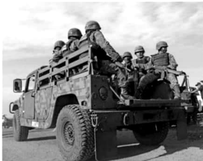
El gobernador Silvano Aureoles dio a conocer los avances logrados con el secretario de Seguridad y Protección Ciudadana, Alfonso Durazo.