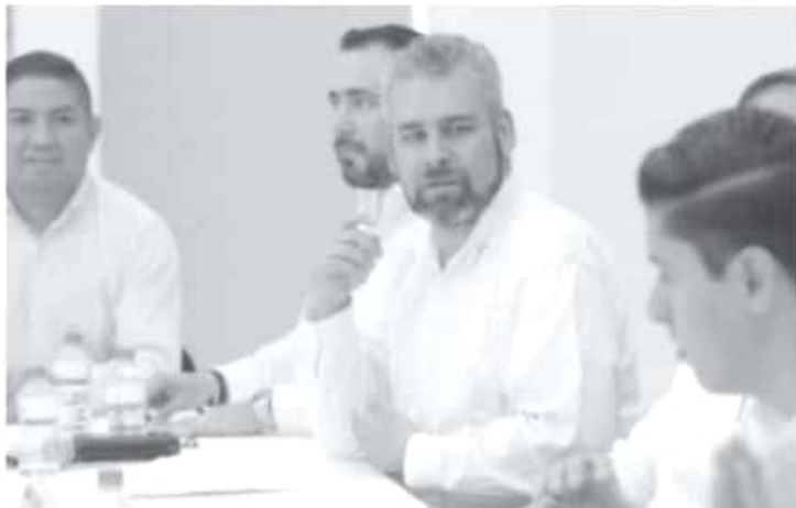
La Zona Libre alienta un desarrollo económico más equitativo y democrático, ya que beneficia a toda la población, incluye a las micro, pequeñas y medianas empresas, y genera fuentes de empleo bien remuneradas.

-Estimula la inversión y beneficia a la población en general, por lo que alienta un desarrollo más democrático y equitativo, afirma