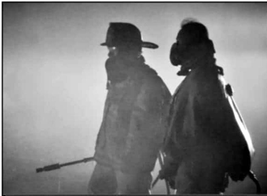
EN TODO EL ESTADO, LOS GRUPOS DE BOMBEROS CARECEN DEL EQUIPAMIENTO NECESARIO PARA SUS LABORES.

afirmó- fuera del marco normativo en los municipios de Cotija, Los Reyes, Peribán, Tancitaro, Uruapan, San Juan Nuevo, Ziracuaretiro, Morelia, Zacapu, Zitácuaro y Ocampo.