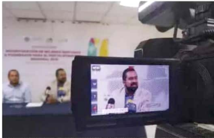
Cada vez son menos las mujeres indígenas que obtienen una beca de posgrado, lamentó el titular del ICTI.

Informó que de 2013 a la fecha se ha visto una disminución en el número de mujeres indígenas interesadas en elevar su grado académico, ya que de ese año a 2015 la cifra por año llegó a 20 postulantes, pero de 2016 a la fecha se redujo a diez, en incluso a sólo cinco interesadas.