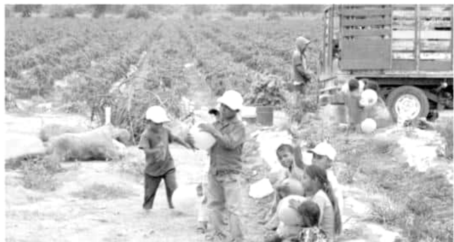
En México hay más de 2 millones 500 mil niños trabajadores.

en las zonas agrícolas, provenientes de otras entidades, sobreviven en condiciones de miseria, aunado a que realizan jornadas de trabajo superiores a las 12 horas y en muchos casos no tienen la opción de acudir a la escuela.