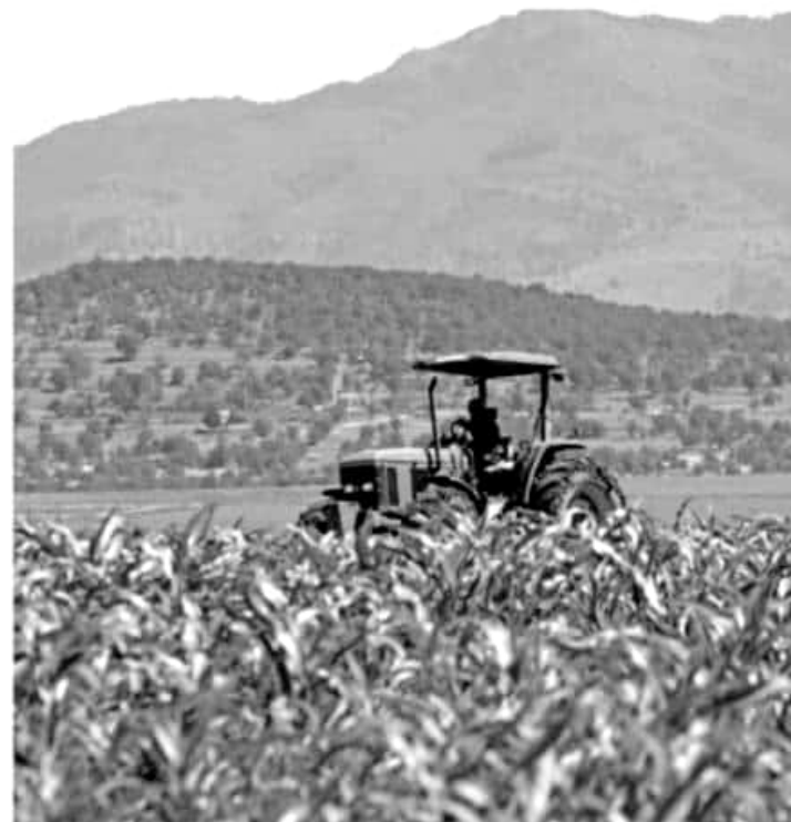
Los integrantes del Comité fueron exhortados a generar un mayor número de capacitaciones en el uso y cuidado del suelo.

EL TITULAR del Ejecutivo estatal resaltó que en próximas fechas el gobierno del estado cumplirá parte de la meta en cuanto a los apoyos para el sector femenino, al entregar el crédito número 100 mil de Palabra de Mujer, a la beneficiaria número 50 mil, pero además este programa se ampliará a otros grupos sociales para incidir en la disminución de la pobreza patrimonial, así como aumentar las oportunidades de empleo e ingresos para las familias.