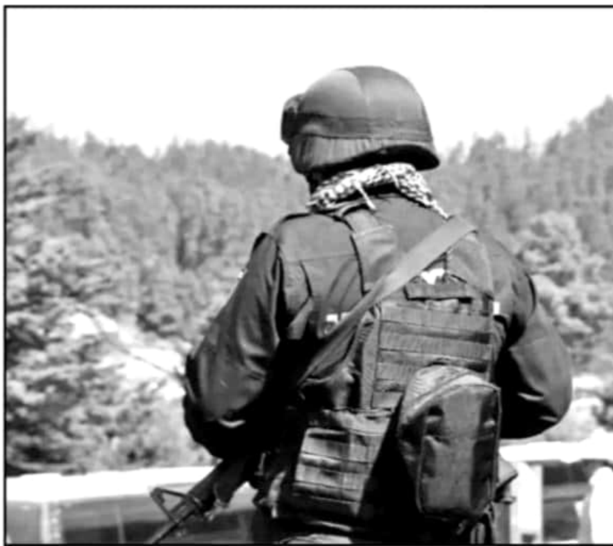
LAS REGIONES LÍMITROFES CON GUERRERO SIGUIEN SIENDO DE LOS FOCOS ROJOS PARA LAS AUTORIDADES MICHOCANAS.

miento municipal y el estatal seguirán siendo la parte central de la estrategia, en la que será la autoridad de Seguridad Pública del estado la que en próximos días revelará cuáles serán los cambios a tomarse en consideración con los cambios que se han dado en las áreas de procuración de justicia y propiamente en seguridad.