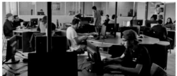
MORELIA, MICH.- La UTM ha decidido agregar la especialidad de Redes y Telecomunicaciones.

Es de resaltar que el 80 por ciento de los alumnos que optan por la carrera de Tecnologías de la Información concluyen su carrera de nivel ingeniería.