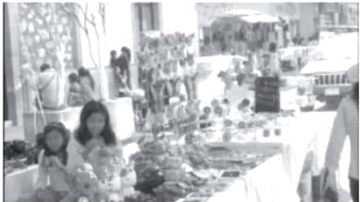
Esta vez son alrededor de 40 artesanos locales los que ya venden sus productos y tienen como meta colocar entre visitantes y Zitacuarenses el 90% de sus productos.

El horario en el que están listos todos los días para vender su producto es de 10:00 de la mañana a 8:00 de la noche, depende de la afluencia de la gente, a veces son las 10 y aún hay presencia de turistas que buscan llevarse un recuerdo de Zitácuaro.