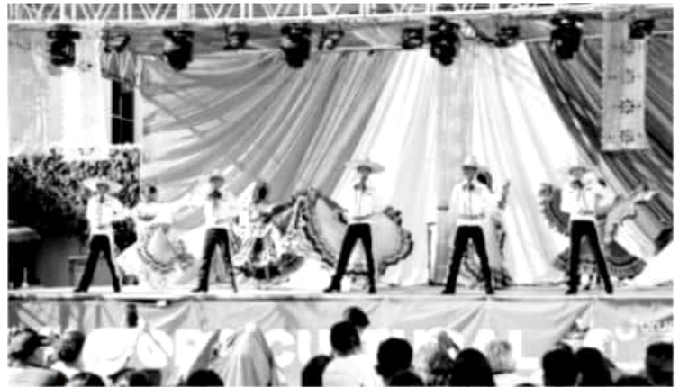
URUAPAN, MICH.- El Tianguis Artesanal y todas las actividades artísticas, culturales y de convivencia con la naturaleza representan un importante imán para el turismo

Mencionó además que se tienen eventos novedosos, tal es el caso de los recorridos nocturnos del Parque Nacional "Barranca del Cupatitzio" del 25 al 28 de abril. La funcionaria anotó que en este último caso el evento se desprende del proyecto conjunto con el Parque Nacional "Uruapan de Gran Visión", plasmado en el Plan Municipal de Desarrollo.