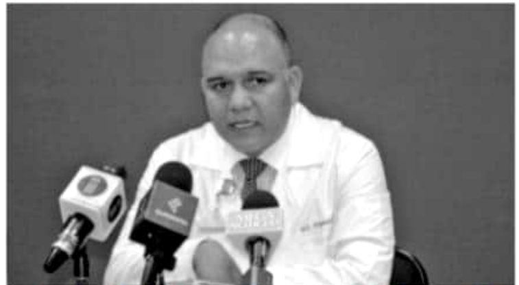
El IMSS informa que los días jueves, viernes y sábado santos prestará atención en los servicios de hospitalización y urgencias

hospitales del régimen ordinario y los 7 hospitales de REGIMEN IMSS BIENESTAR, así como en la Unidades de medicina Rural (UMR) con mayor afluencia turística, como las ubicadas en la zona lacustre.