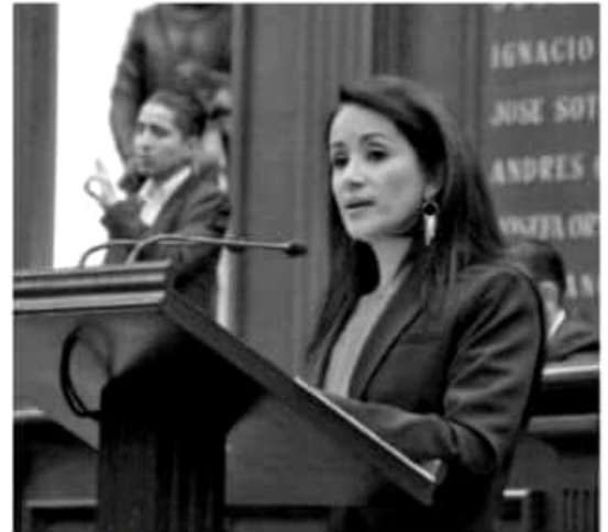
MORELIA, MICH.- El combate a la pobreza debe ser la prioridad en el impulso de las políticas públicas que se realizan en México.

De acuerdo a las estadísticas 7 de cada 10 trabajadores, entre cinco y 17 años viven en las zonas rurales de México, los restantes radican en las ciudades, ante lo que se hace necesario revisar la situación en la que se encuentran y luchar por sus derechos.