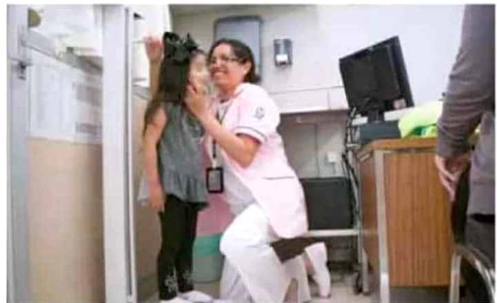
Niños de entre tres y ocho años, los más propensos a sufrir accidentes en el hogar.

Dijo que las consultas en Urgencias aumentan de 35 a 50 al día en los hospitales del IMSS en la entidad, por lo que las autoridades decidieron alertar y concientizar a los adultos sobre el cuidado que deben tener en el periodo vacacional.