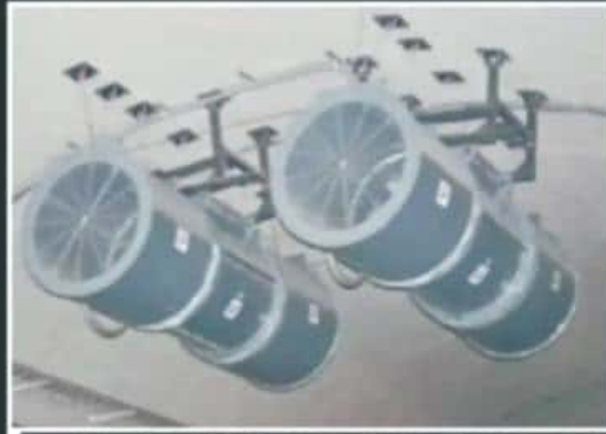
ANTE EL ROBO DE CABLEADO, LOS VENTILADORES TAMPOCO FUNCIONAN.

Si bien los costos de la reparación no han sido especificados, refieren que la reparación del sistema se hará con una nueva planta de energía. También han dejado de funcionar los enormes ventiladores y extractores de humo que fueron instalados en el túnel de casi un ki-