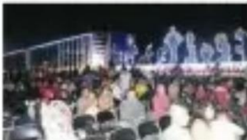
El tren navideño de KCS llegó a la estación de Morelia el día de hoy. El evento fue organizado por la compañía y contó con la presencia de autoridades locales y estatales. COMUNIDAD