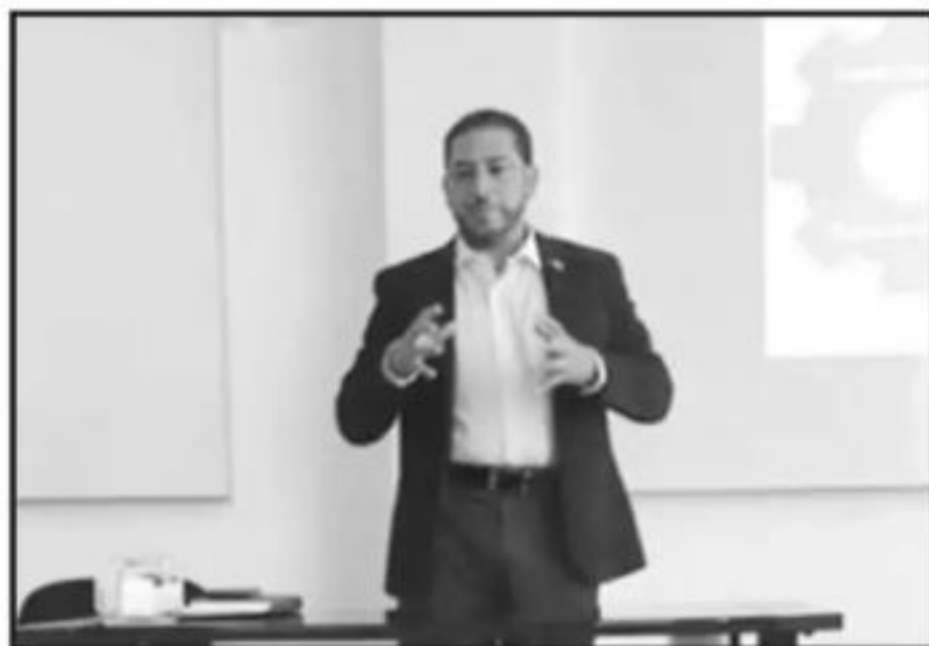
POR FIN FUE ELEGIDO EL NUEVO CONSEJERO DEL COMITÉ DE PARTICIPACIÓN CIUDADANA DEL SISTEMA ANTICORRUPCIÓN, UN "PERFIL NO POLÍTICO".