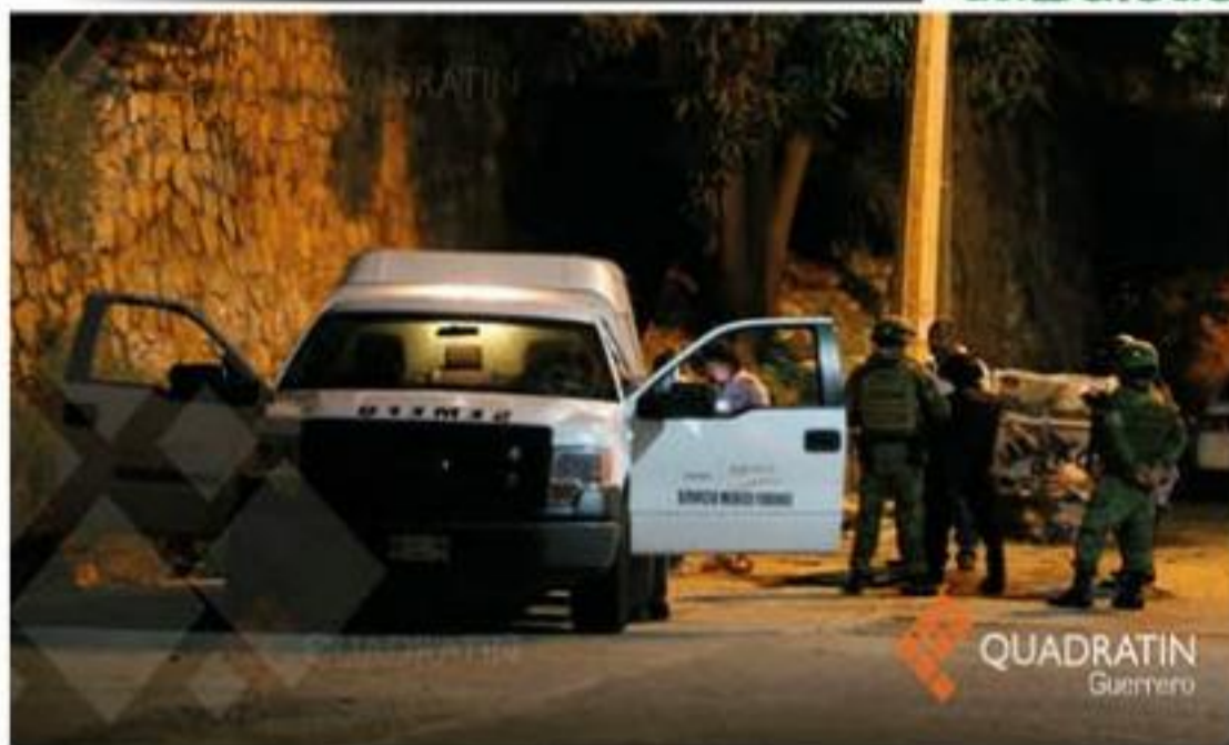
Un muerto y un herido fue el saldo de un ataque a una clínica ocurrido ayer en la periferia de Acapulco.

Además de realizar reuniones con las autoridades locales y ciudadanos en donde se encuentran los Pueblos Mágicos en la entidad, con el fin de conocer cuál es la situación actual y de qué manera se puede apoyar para el crecimiento ordenado de cada demarcación.