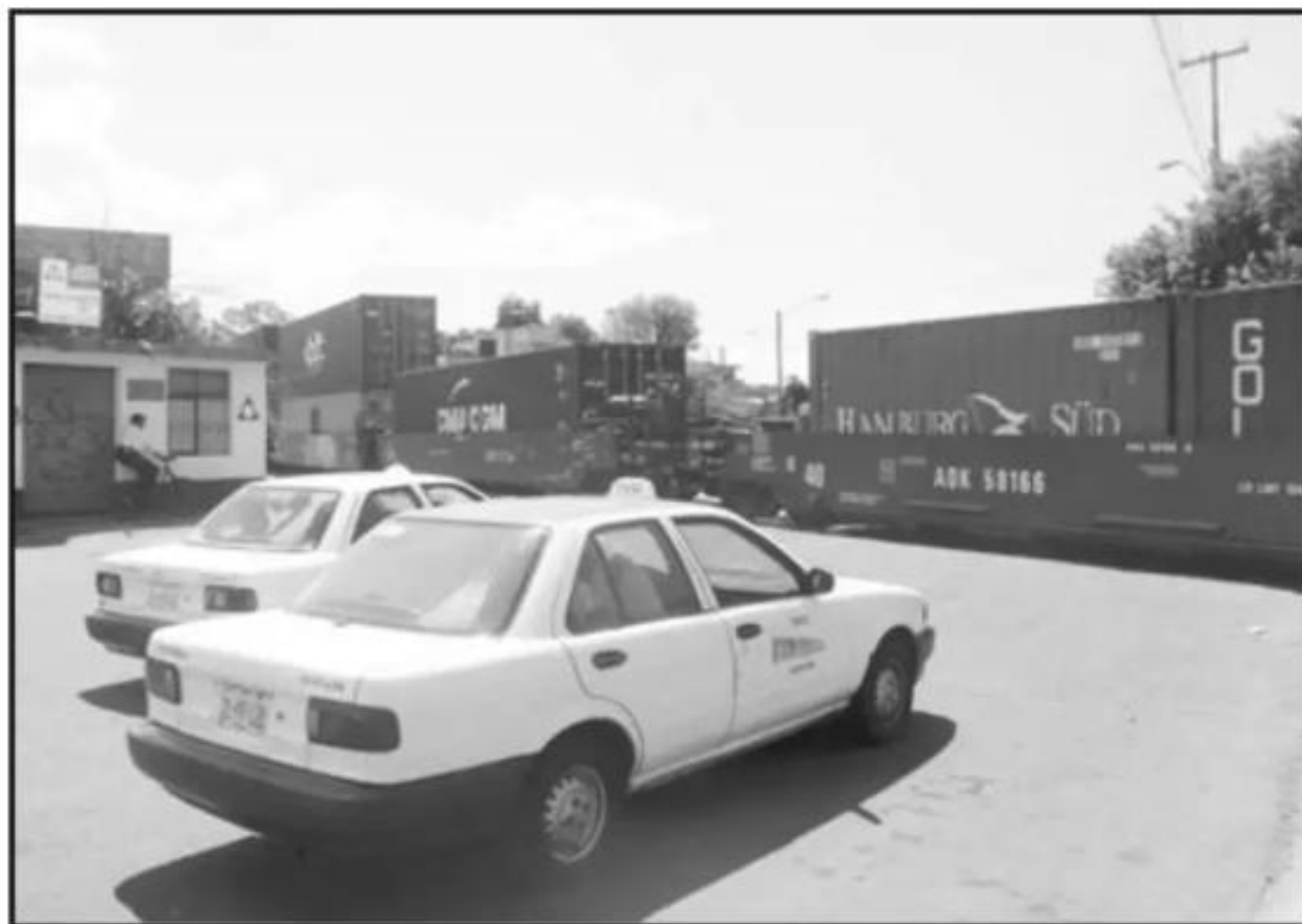
LA AVENIDA SIERVO DE LA NACIÓN SIEMPRE ES DE LAS MÁS AFECTADAS DEBIDO A LA CERCANÍA DEL PATIO DE MANIOBRAS.