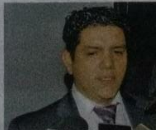
La idea de federalizar la nómina magisterial correspondió al Presidente electo. Lázaro Morales Olivares

Tras recordar que la idea de federalizar la nómina magisterial correspondió, en primera instancia, al Presidente electo, Andrés Manuel López Obrador, y después al grupo parlamentario de Morena en el Congreso de la Unión, el diputado integrante de la bancada morenista en la LXXIV Legislatura local afirmó que el mandatario estatal "se aventó a dar una declaración que ya se