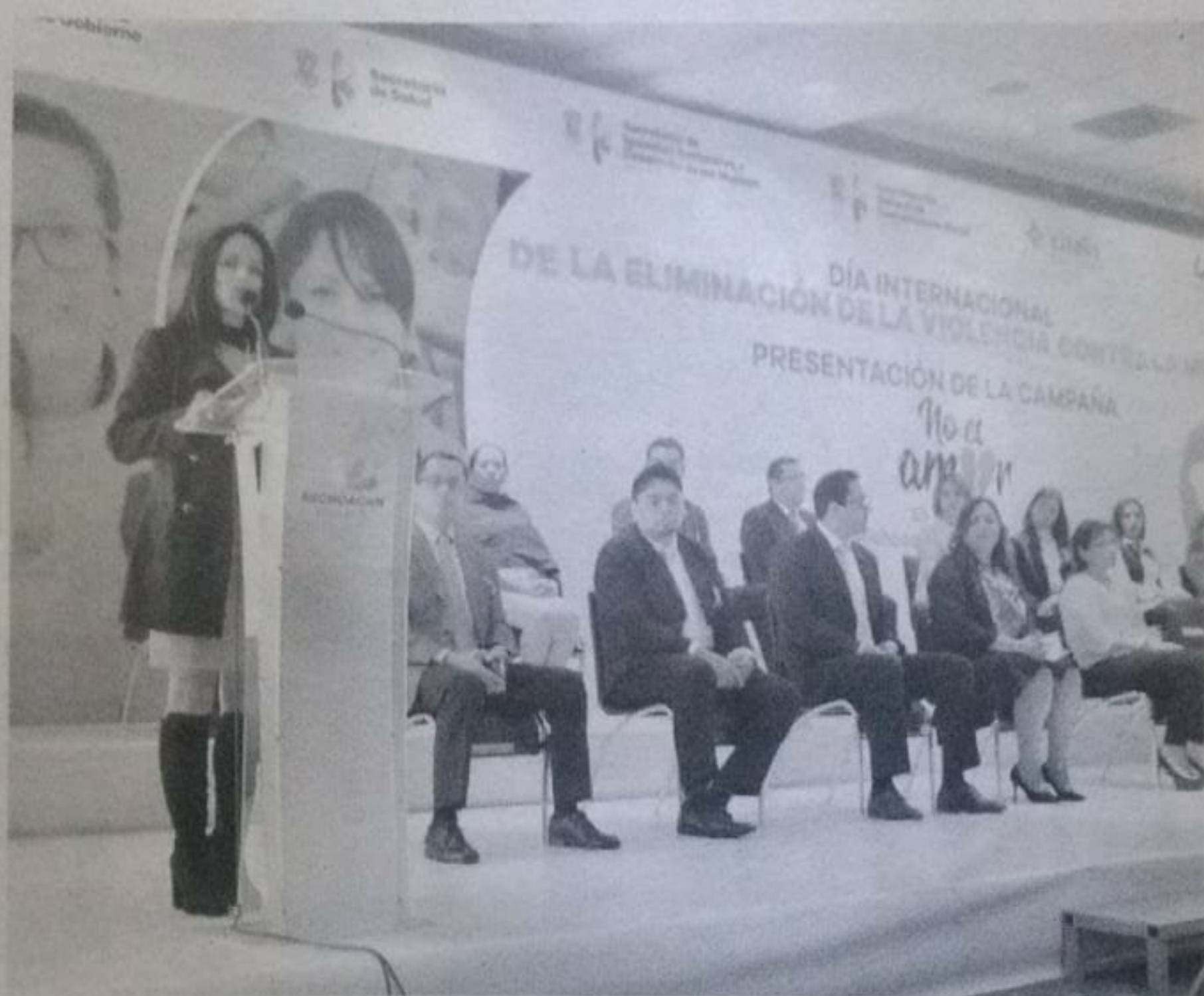
Con el programa se pretende combatir este problema entre la sociedad.

Por su parte, el presidente de la comisión estatal de derechos humanos (CEDH), Víctor Manuel Serrato Lozano, lamentó que la situación de violencia contra las mujeres se agrave en el estado, pues a la fecha tienen el reporte de por lo menos 146 casos de agresiones contra personas del sexo femenino.