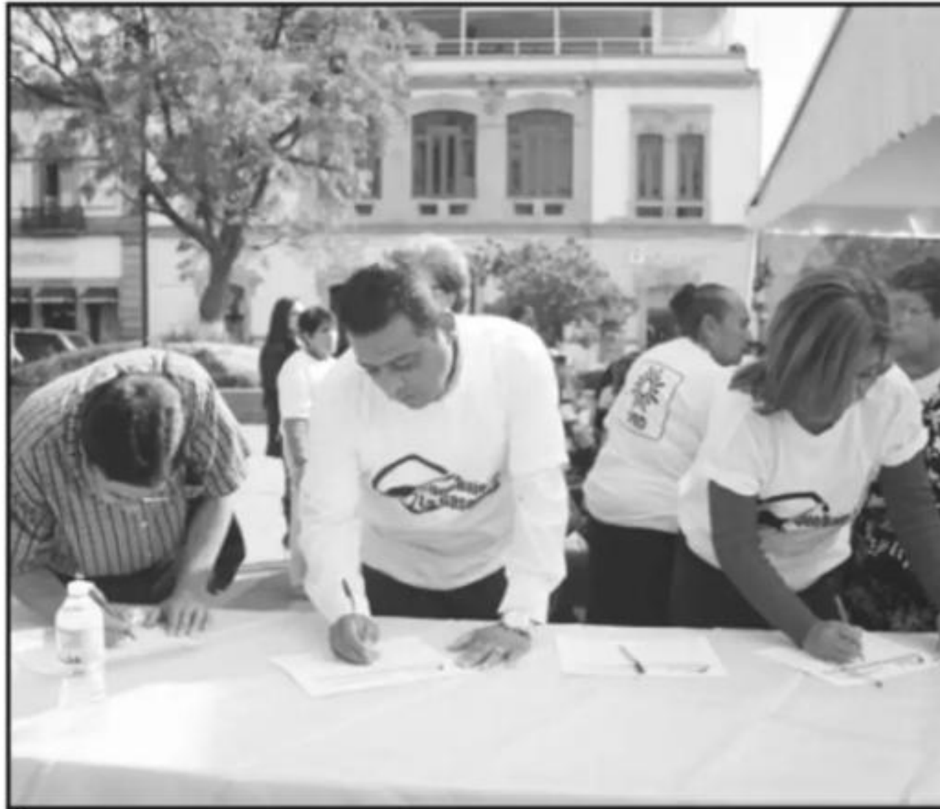
EL PRD APELA A LA RECOLECCIÓN DE FIRMAS ENTRE CIUDADANOS, ALGO PARECIDO A LAS CONSULTAS DE AMLO.

El exalcalde de Tumbiscatío informó que el PRD organiza la recopilación de firmas en las plazas públicas de todas las capitales estatales para hacerlas llegar antes del 10 de diciembre a la Cámara Baja del Congreso de la Unión, considerando que el 15 de diciembre es la fecha para la aprobación del Presupuesto de Egresos de la Federación para 2019, junto con la