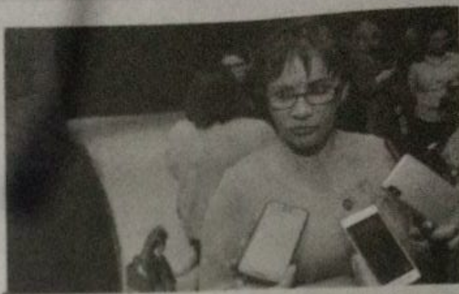
La Seimujer, le SSM y la iniciativa privada lanzaron la campaña No es amor. Es violencia, para concientizar sobre la problemática.

"El problema de la violencia política se tiene que seguir analizando, estipulando en las leyes y generar las condiciones y mecanismos para no concretar más violencia".