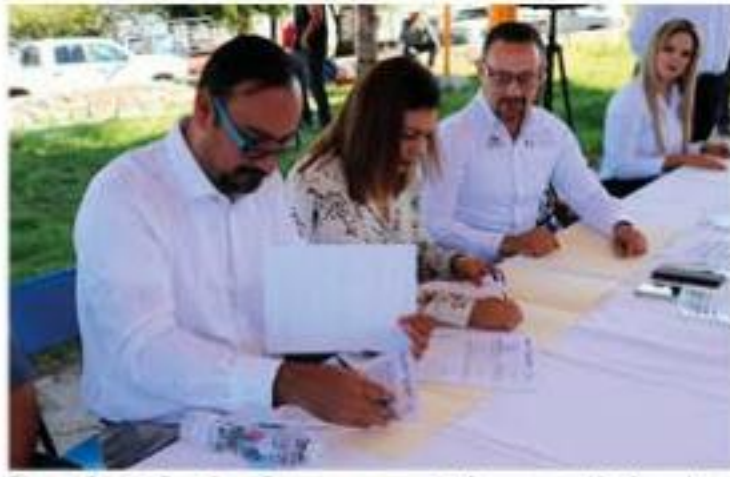
Firman Seguro Popular y Compesca convenio de concertación de acciones en beneficio de 70 cooperativas pesqueras; recibirán servicios de salud gratuitos.

Es de indicar que el objetivo de este convenio es avanzar en la cobertura en servicios de salud de los pescadores, mediante la Afiliación al Seguro Popular, así como contribuir a fortalecer el cumplimiento efectivo de los derechos sociales que potencien las capacidades de las personas en situación vulnerable, que son objetivos transversales donde las instituciones coinciden con un interés común: elevar las condiciones de bienestar de las michoacanas y los michoacanos.