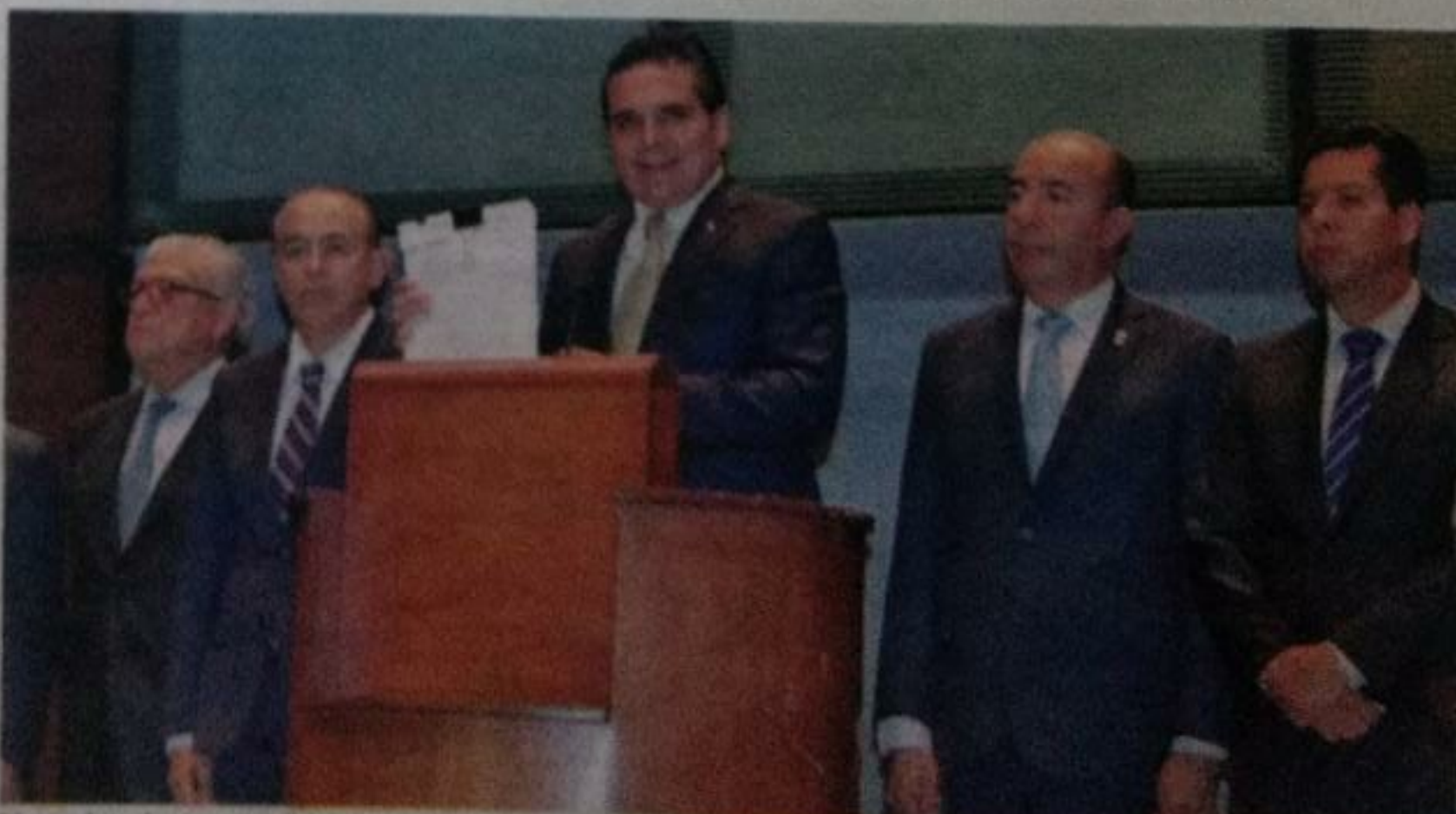
El mandatario estatal solicitó que se designen representantes de las secretarías para acordar el método para que en el término de 30 días se realice el proceso de entrega-recepción. Fernando Maldonado Martínez

Por ello, el día de ayer, el gobernador notificó a la Federación la decisión y en consecuencia, solicitó que se designen representantes de ambas secretarías con el fin de acordar el método y mecanismos para que, en el término de 30 días, se realice el proceso de entrega-recepción formal de los servicios de educación básica y normal que operan en Michoacán, tanto federales transferidos como los de financiamiento estatal, a la Secretaría de Educación Pública. (M) (6)