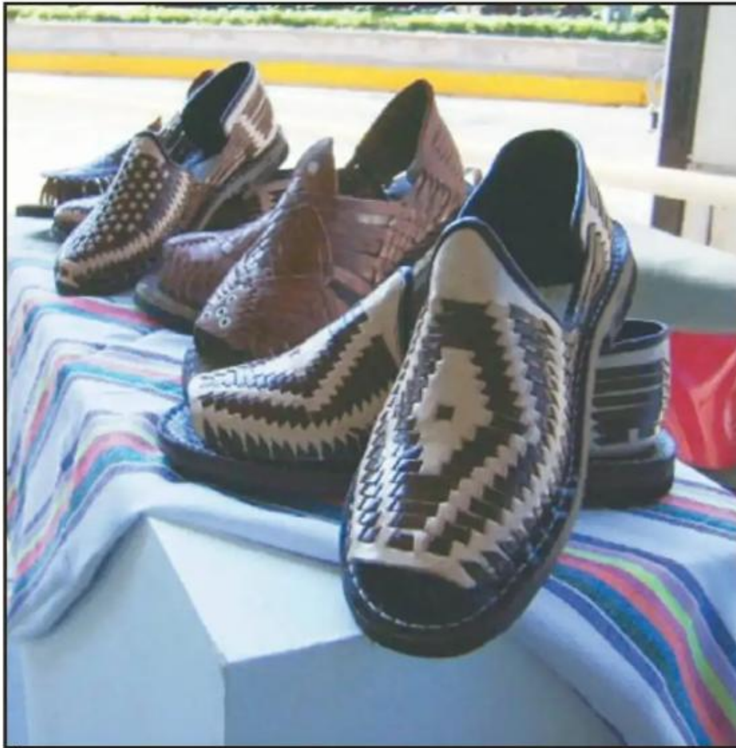
LAS AUTORIDADES MUNICIPALES DE SAHUAYO BUSCA AMPLIAR LA RED DE COMERCIO CON OTROS PAÍSES.

El simple hecho de que el huarache de nuestro municipio esté llegando a otras naciones económicas es un sinónimo de que estamos haciendo las cosas bien