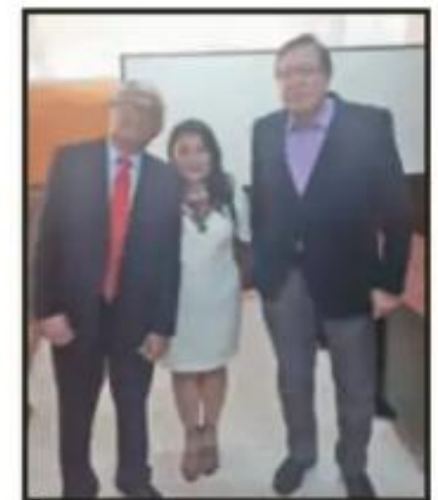
RAFAEL GÓMEZ MEDINA ESTUVO ESTE LUNES DE VISITA EN LA UNLA.

Todos los tribunales están obligados a una interpretación armónica de derechos humanos en materia agraria y con mayor razón en zonas indígenas, al dirimir conflictos con una carga social muy fuerte, expuso, ante el estudiantado universitario.