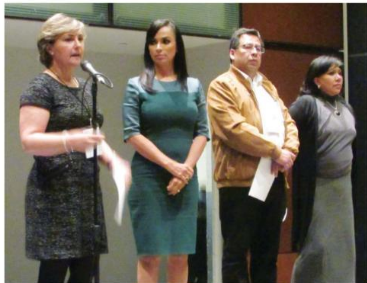
Los alcaldes pidieron establecer un diálogo directo con las autoridades federales de la nueva administración.

Declaró que lo que espera la oposición y en particular el PRD, es que el Movimiento de Regeneración Nacional construya puentes de diálogo y de acuerdo, para superar las divergencias. (Victor Mayén)