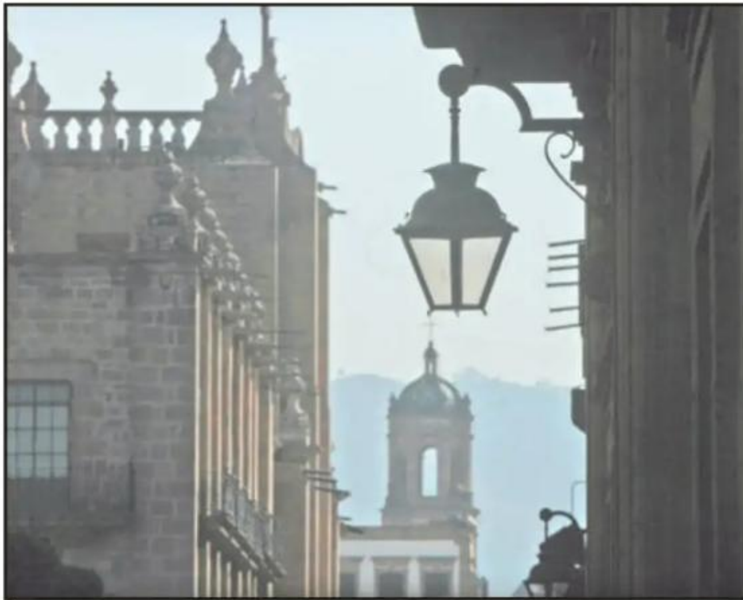
LA CAPITAL DEL ESTADO AÚN ESTÁ REZAGADA EN MATERIA DE ALUMBRADO, POR LO QUE URGE CAMBIAR A LED.