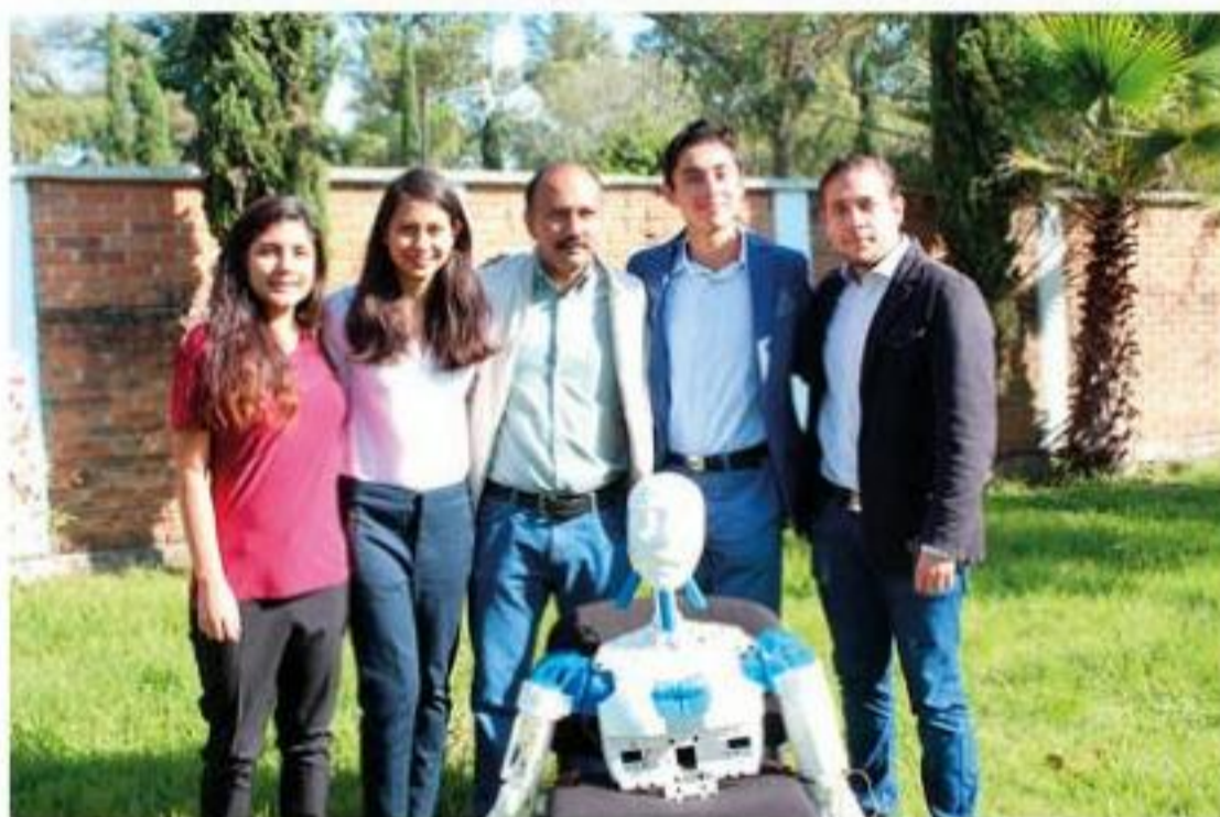
El Androide "Roby" y los productos agroalimenticios a base de calabaza, "Pihúaaani", recibieron pase directo para concursar en la ExpoCiencias Internacional, que se realizará el próximo año en Abu Dhabi.