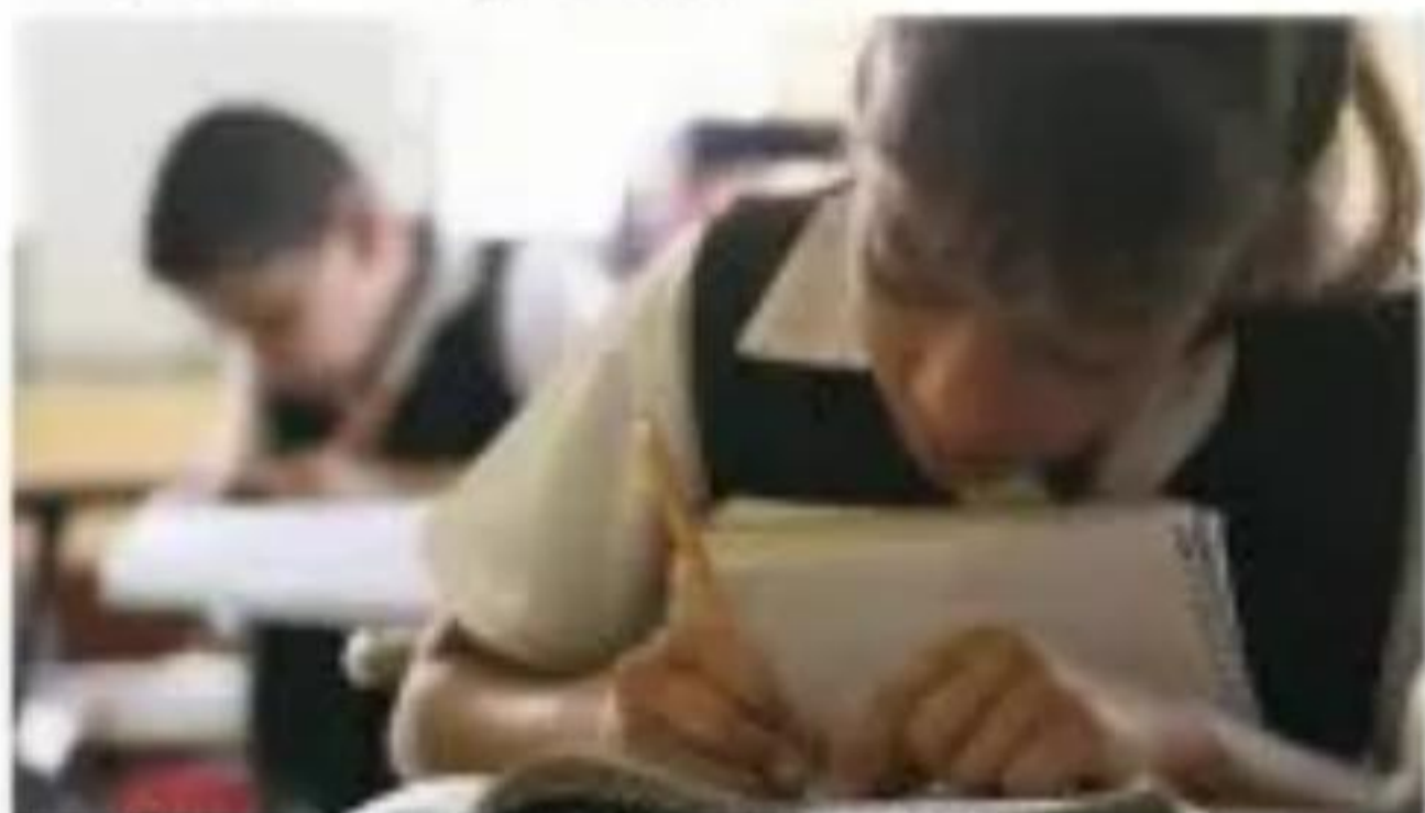
Trabajo de maestros en un aula durante la jornada escolar.