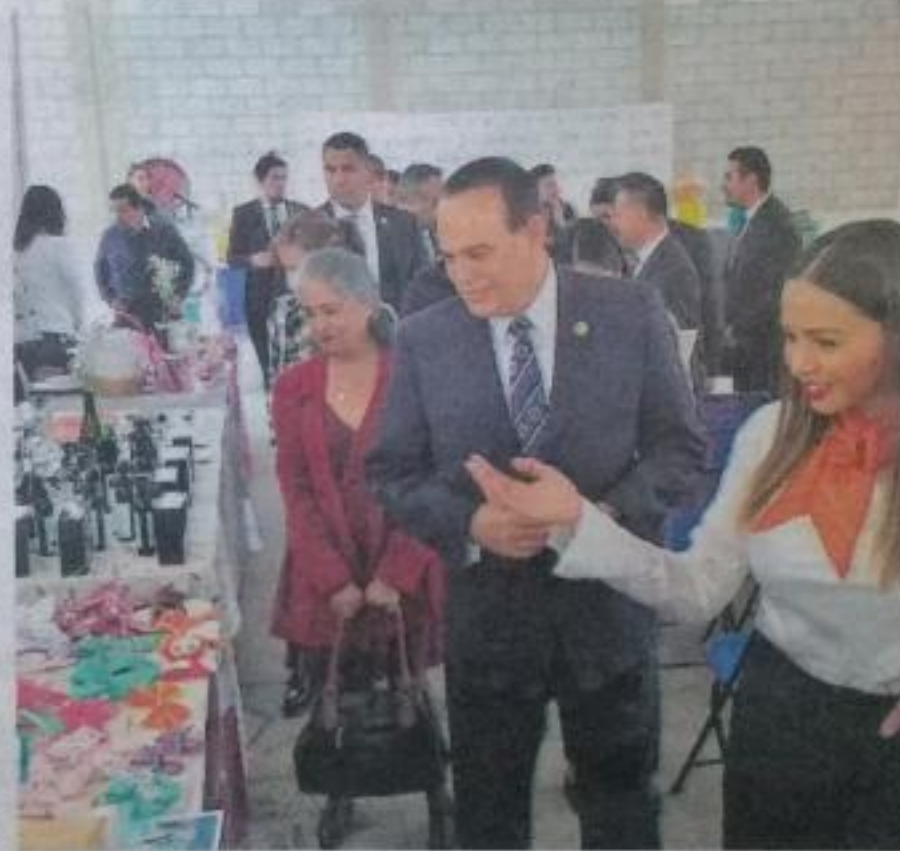
Durante el evento se agradeció al Gobierno del Estado y al procurador de Justicia del Estado, por el apoyo para que este tipo de políticas públicas sean eficientes y de ayuda.

Por su parte, el procurador señaló que se han dado pasos importantes en la PGJE en la especialización y profesionalización de distintas áreas para atender los delitos cometidos en agravio de la mujer; sin embargo, dijo: "Necesitamos que el problema de la violencia que enfrentan las mujeres se arranque desde raíz, es decir, desde la educación que se adquiere en casa se fortalezca en las escuelas y se haga legítimo en la sociedad".