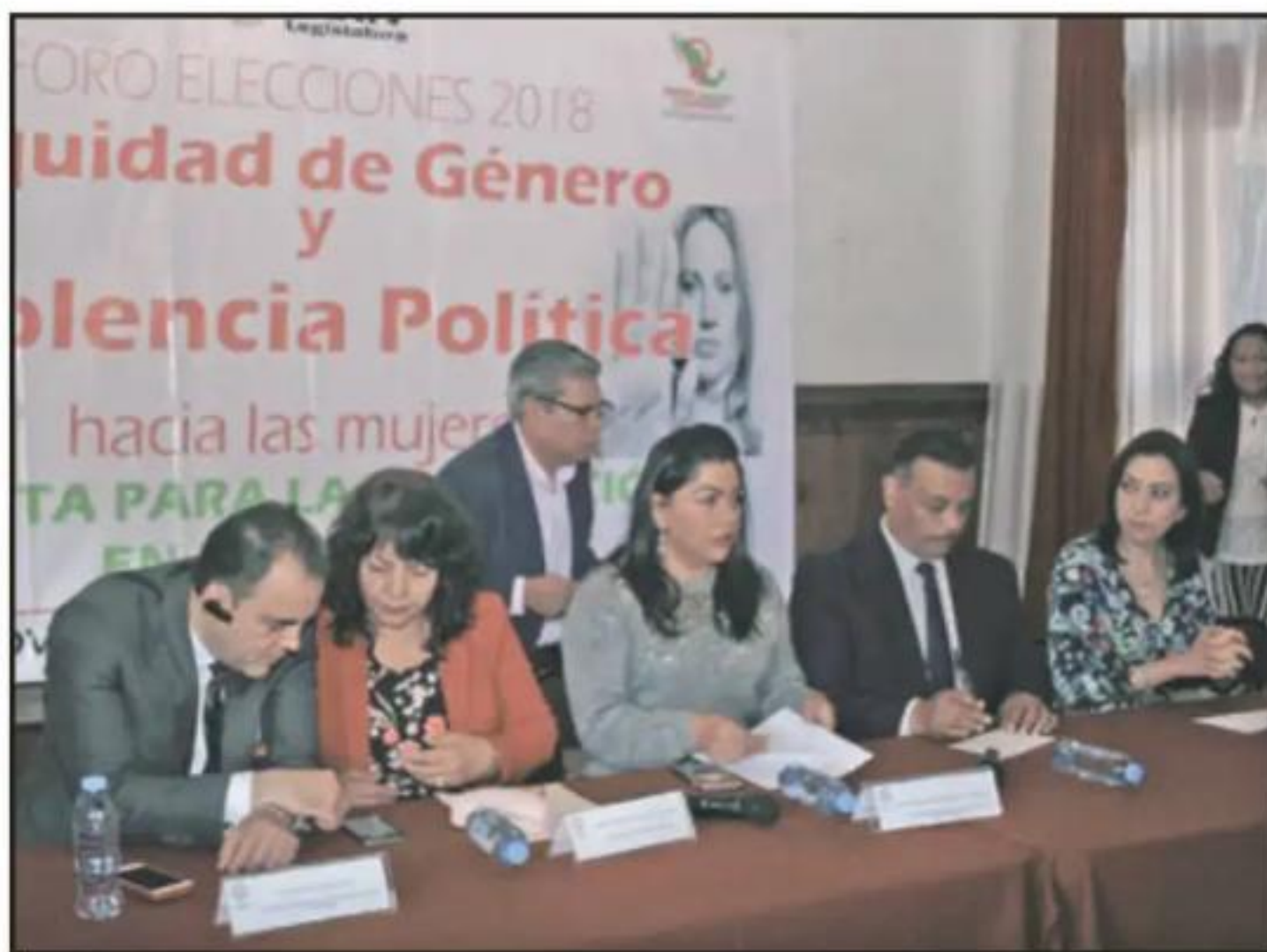
EL PARTIDO DEL TRABAJO ORGANIZÓ ESTA ACTIVIDAD EN EL SALÓN DE RECEPCIONES DEL CONGRESO DEL ESTADO.

La experredista lamentó que la mujer sea tratada como un cero a la izquierda en las comunidades rurales. Evocó que hace 40 años veía a los señores excluir de las votaciones a las mujeres y a las hijas, regresándolas a sus casas o dándoles línea