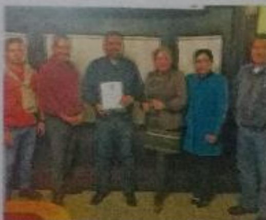
Se estableció impulsar una iniciativa conjunta.

El diputado integrante de la Comisión de Migración en la LXXIV legislatura informó que en esta gira de trabajo se han logrado hasta el momento varios acuerdos, entre ellos, elaborar una iniciativa conjunta que