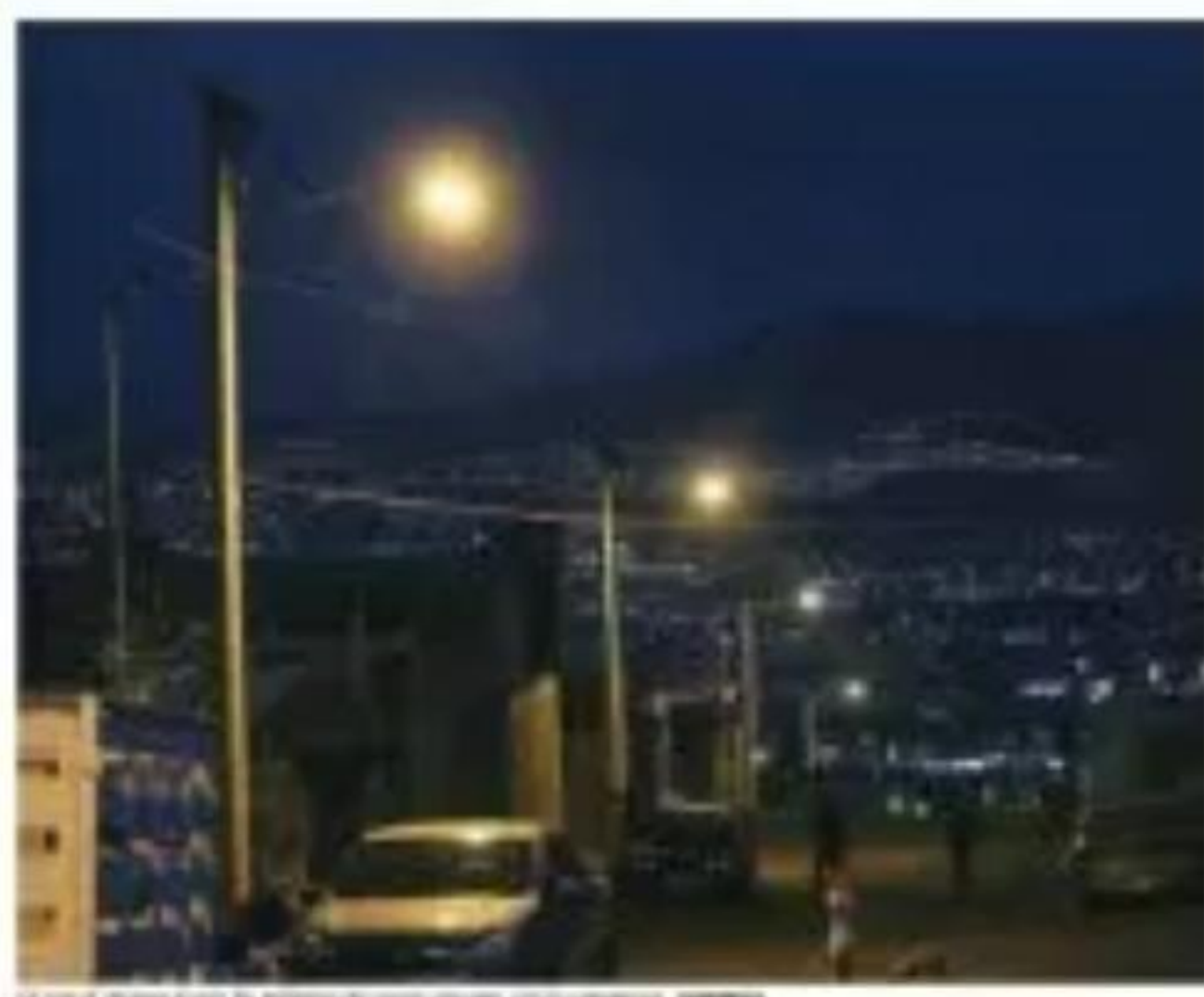
Se prevé ahorro hasta de 33% en los costos de mantenimiento y energía

Diego de Alumbrado Público buscando la renovación de la red de iluminación, y el programa comenzó en los sectores República y Revolución, desde un único camión la semana la ciudad, Morelia