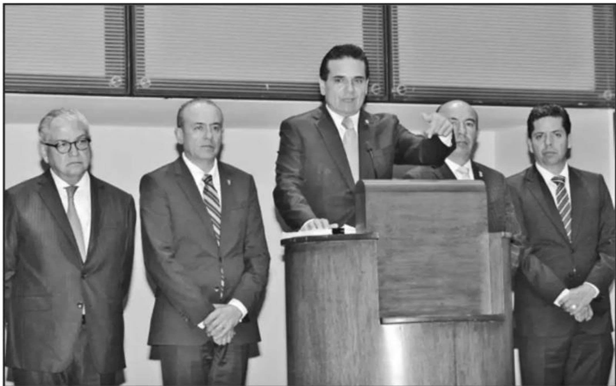
SILVANO AUREOLES DIO POR TERMINADA LA ADHESIÓN AL ACUERDO NACIONAL PARA LA MODERNIZACIÓN DE LA EDUCACIÓN BÁSICA, FIRMADO EL 18 DE MAYO DE 1992.

Sobre esa situación, advirtió que Michoacán no cuenta con recursos para cerrar el año en cuanto a los salarios de diciembre y las prestaciones de los más de 30 mil profesores. Destacó que sólo para cubrir