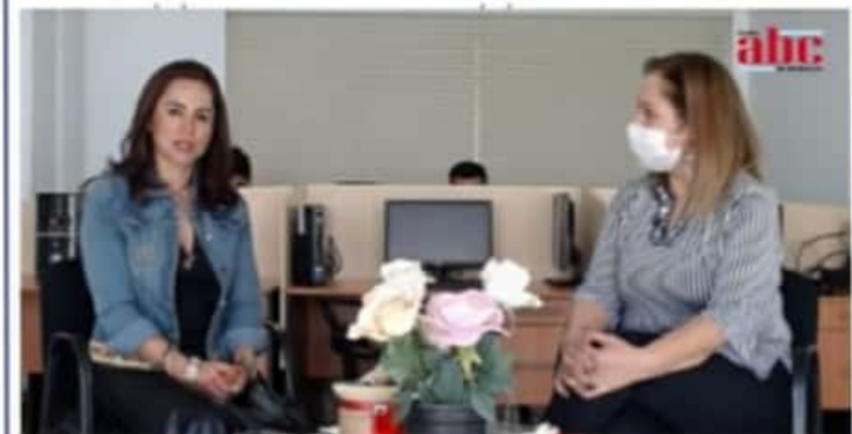
MORELIA, MICH.- En entrevista exclusiva para ABC Noticias Michoacán, señaló que compete para ganar y no se presta a simulaciones.

Se autodefinió como una mujer de causas sociales, "de toda la vida". Y dijo ser feminista, pero trabajando a la par con los hombres, en la educación y cultura, para lograr una mejor sociedad y un mejor Morelia para México.