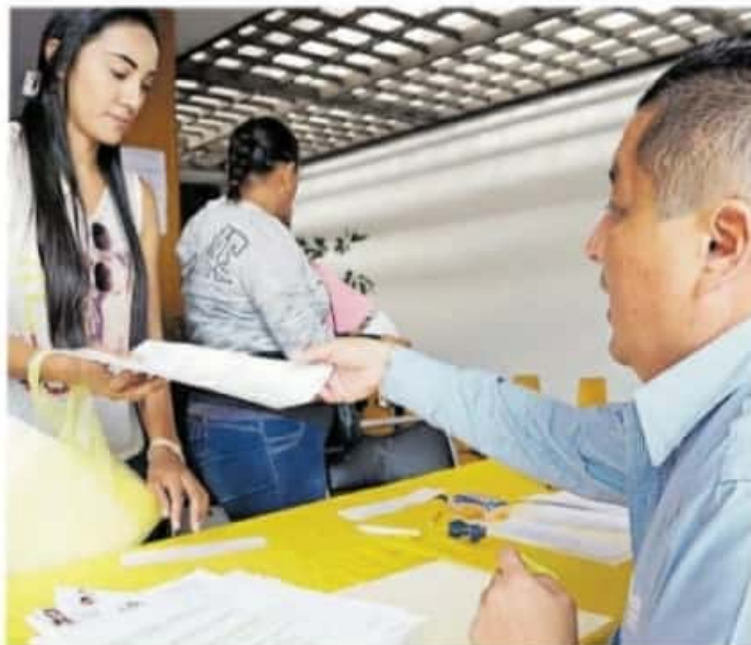
Los alumnos tanto de preparatoria como de universidad deben tener una calificación superior a 8.5

Se indicó que las fechas de renovación están indicadas en las mismas credenciales