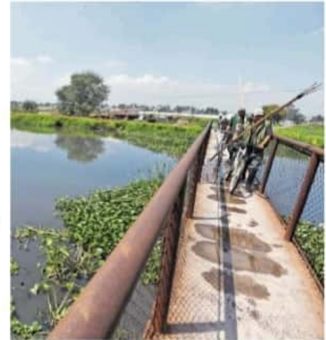
El río contiene metales pesados y productos agroquímicos