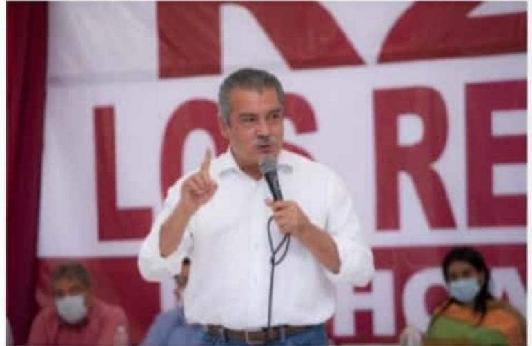
URUAPAN, MICH.- Según el estudio demoscópico, Raúl Morón tiene una intención del voto del 43.1 por ciento del electorado.

Raúl Morón, candidato del partido guinda, desde septiembre del 2020 encabeza la intención del voto en diferentes encuestas; sin embargo, había expectativa de que su posicionamiento se debilitara por no haber hecho precampaña, como si lo hizo Carlos Herrera Tello, aunque sin conseguir remontar en las preferencias de los ciudadanos.