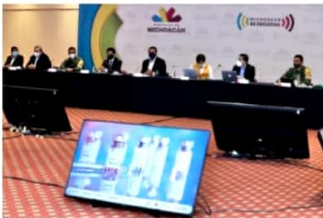
MORELIA, MICH.- La instalación fue encabezada por Silvano Aureoles Conejo, quien consideró que "vacunarse es una responsabilidad de todas y todos".

El Consejo Estatal de Vacunación quedó integrado por presidentes municipales de las 13 regiones del estado, las secretarías de Gobierno, Salud y Seguridad Pública Estatal, la Coordinación General de Comunicación Social del Estado, Sedena, la 21 Zona Militar, Guardia Nacional, la Marina, Secretaría del Bienestar, IMSS, Issste, así como organizaciones interreligiosas, civiles y empresariales.