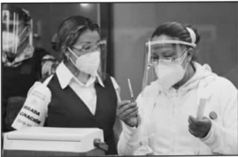
LA SEGUNDA ETAPA DE VACUNACIÓN SERÁ PARA EL RESTO DEL PERSONAL DE SALUD Y ADULTOS MAYORES.