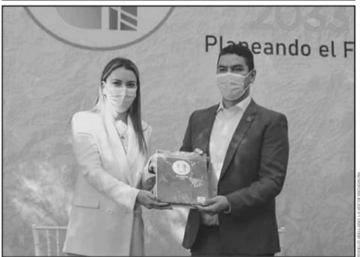
SE DUO QUE LA IDEA ES MANTENER UNA RUTA DE TRABAJO SOSTENIDA QUE TRASCIENDA A PESAR DEL CAMBIO DE LAS ADMINISTRACIONES MUNICIPALES.

duales o depósitos de basura, así como invasiones para dar paso a un extenso parque lineal que apoye el desarrollo de actividades culturales, de esparcimiento y turísticas.