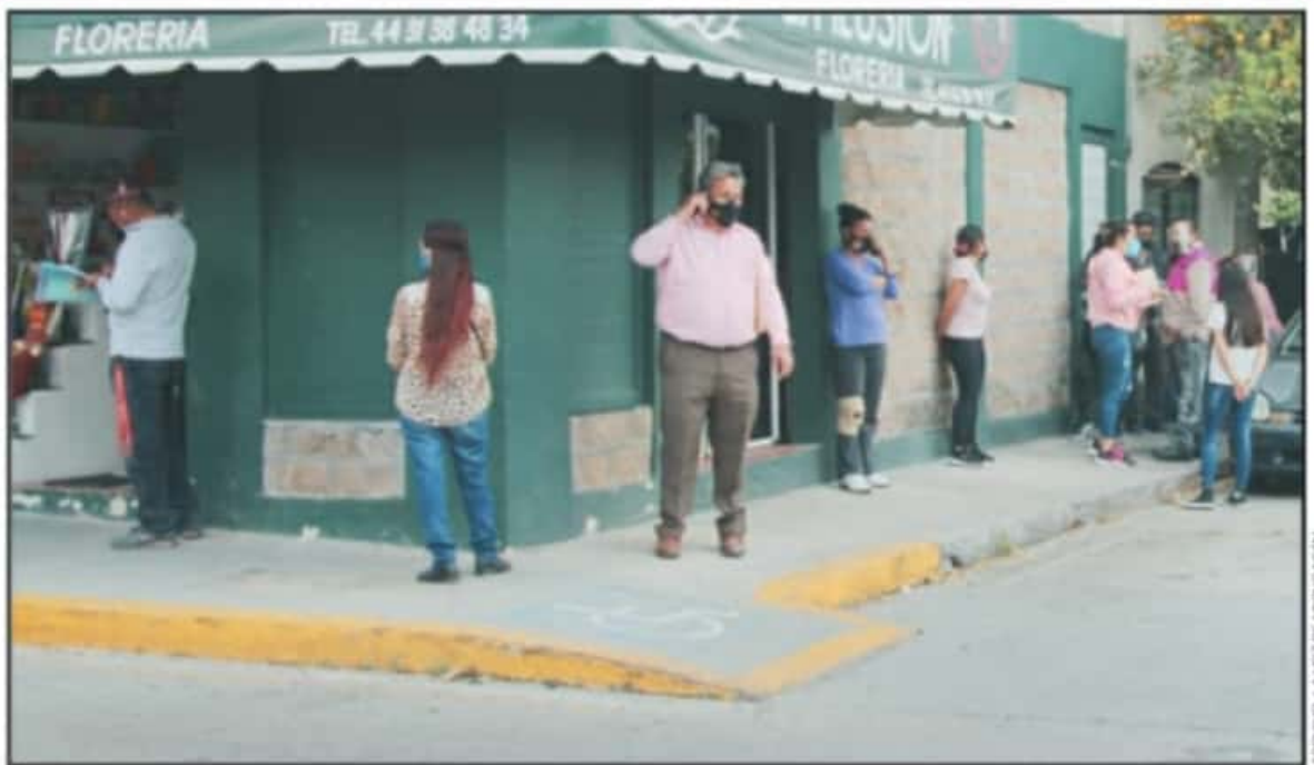
DESDE HACE VARIOS DÍAS SE HAN VISTO LOS MÓDULOS DEL INSTITUTO NACIONAL ELECTORAL CON IMPORTANTES AGLOMERACIONES DE PERSONAS.

Se les invita a que quienes acuden por una reposición por robo o extravío, a que esperen al 15 de febrero de 2021 para un trámite de reimpresión