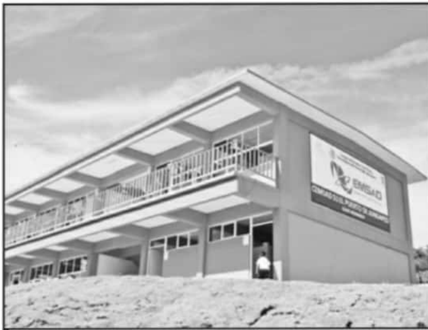
LAS AUTORIDADES EDUCATIVAS REITERARON QUE NO HAY RECURSOS PARA COMPLETAR LOS ADEUDOS AL CECyTEM

el orden de los 15 millones de pesos. Y es que desde el mes de febrero y hasta octubre, la autoridad nunca aplicó en su pago el aumento salarial aprobado para el año.