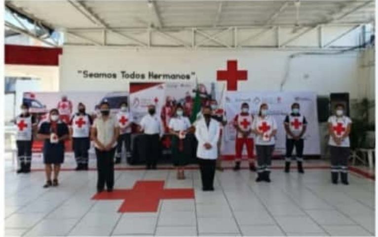
CD. LÁZARO CÁRDENAS, MICH.- 5x5 nueva dinámica de la Cruz Roja para llegar a más ciudadanos durante la Colecta Anual.

Destacó que desde el pasado martes 19 de enero hasta la fecha no se ha logrado llegar ni al 1% de la meta establecida, por ello se buscó en una nueva estrategia buscando llegar a más ciudadanos a través de una dinámica en redes sociales, con ello invita a la población en general a sumarse y retar a sus amigos y familiares a participar en la Colecta Anual 2021.