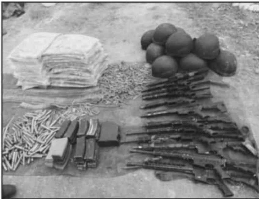
ARMAS DE GRUESO CALIBRE INGRESAN POR LA FRONTERA NORTE DEL PAÍS Y "BAJAN" PARA ABASTECER A CARTELES.