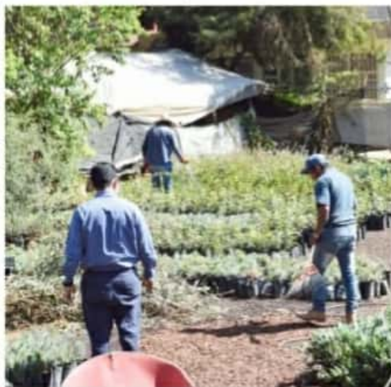
TANGANCÍCUARO, MICH.- Desde el inicio de la presente administración municipal, se ha trabajado para aumentar las áreas verdes para apoyar al medio ambiente.

Ambiente y Cambio Climático. Lo único que deben hacer es presentar su copia de la credencial de elector y se les pueden otorgar hasta 5 plantas por persona, para que las coloquen en los espacios que tienen destinado para ello.