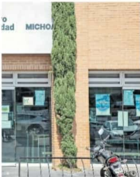
Oficinas de la Dirección del Registro Público de la Propiedad

Aproximadamente a las 06:00 horas del miércoles 28, un grupo de campesinos