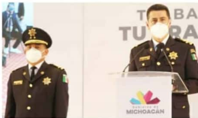
MORELIA, MICH.- El secretario destacó el trabajo que se lleva a cabo por parte de los elementos de la Policía Michoacán, para atender reportes de manera oportuna.

grupos de autodefensas mencionó que después de la desactivación de barricadas en las comunidades de Pinzándaro, Cenobio Moreno y el terrero de supuesto grupos de autodefensas hasta el momento no se ha registrado de nuevo este tipo de movimientos y en caso de que así sea, volverán a desarticular.