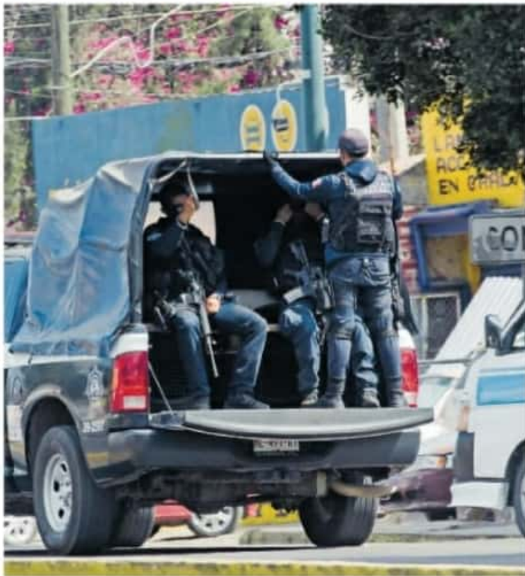
La SSP reconoció la necesidad de incrementar el número de elementos en la Policía Michoacán / AODI SÁENZ