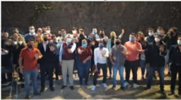
MORELIA, MICH.- El diputado local ha realizado visitas a las colonias y tenencias de Morelia junto con los coordinadores distritales del movimiento R21.