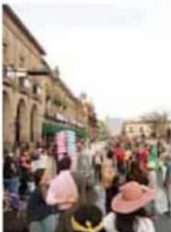
2019. Ese año Morelia recibió a 150 mil turistas en Semana Santa.

“Aquí se anunció la cancelación del Festival del Torito de Petate, que es una antesala, por eso se canceló, para evitar que la gente se concentre; es una representación popular muy importante; el año pasado se pudo hacer, pero éste se canceló, y