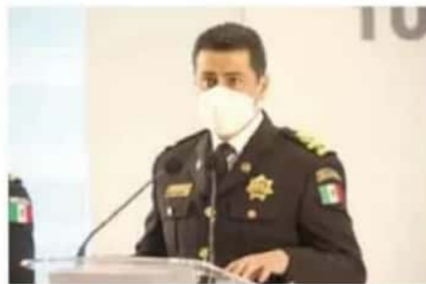
Operativos. Se han reforzado las acciones en ambos municipios, dijo el titular de la SSP.

En encuentro con medios de comunicación, el funcionario estatal afirmó que es una constante la intimidación del