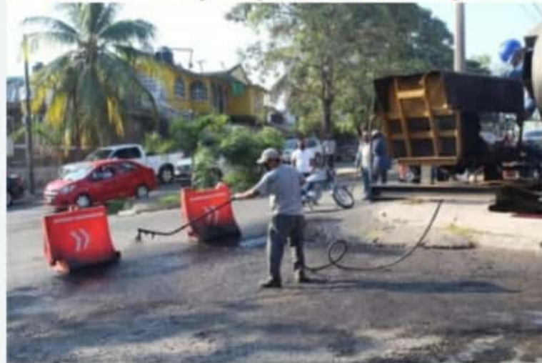
CD. LÁZARO CÁRDENAS, MICH.- La Secretaría de Obras Públicas Municipales arrancó con los trabajos para el reencarpentamiento de la Calle Ponciano Arriaga, en la colonia Pie de Casa.