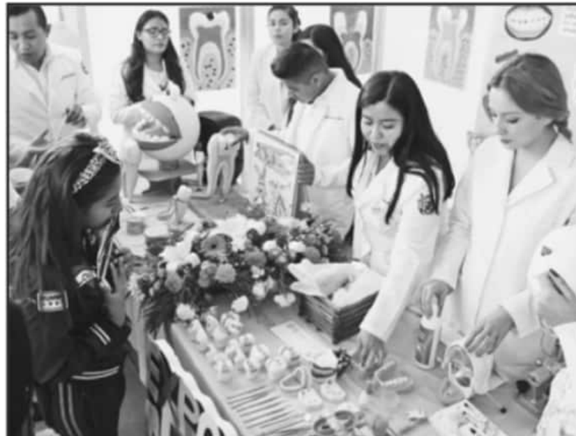
LA EDICIÓN DE ESTE AÑO 2021 DEL EXPORIENTA SE LLEVARÁ A CABO DE MANERA VIRTUAL, DICEN AUTORIDADES.

para que se puedan inscribir los alumnos será publicada del 15 al 24 de febrero y la feria estará en línea una semana, de igual forma se tendrá acceso a la plataforma hasta septiembre que es cuando cierran inscripciones.