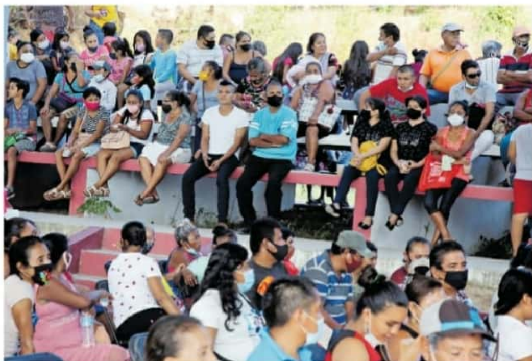
En los municipios que presentan bandera blanca, las reuniones electorales se podrán desarrollar con un máximo de 50 personas

Los protocolos sanitarios deberán respetarse en las campañas electorales de los candidatos a diputaciones federales y gubernatura, aunque no habrá sanciones para quienes los omitan