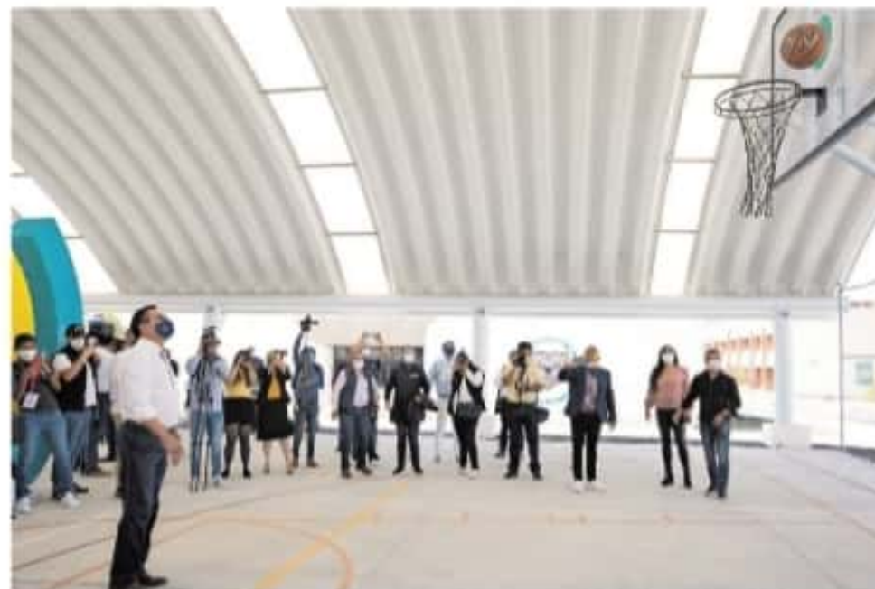
El gobernador Silvano Aureoles Conejo afirmó que mil millones de pesos han sido invertidos en el sector educativo

Aunado a esto, afirmó que la institución fue la primera en crear mil 500 aulas a través de plataformas virtuales por lo cual, aunque se sabe que habrá un recorte presupuestal a las universidades, solicitarán a través de convocatorias el recurso necesario para invertir en programas, puesto que se requiere de equipamiento, emprendimiento e investigación ante la