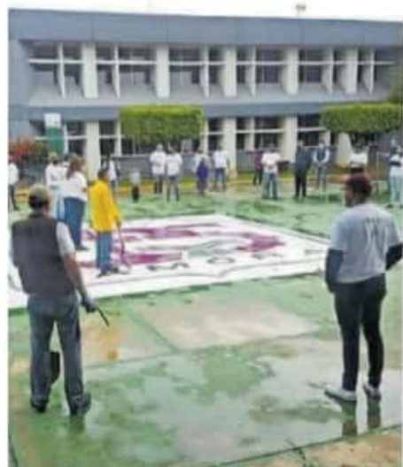
El Tecnológico cuenta con una amplia trayectoria en certificaciones ISO