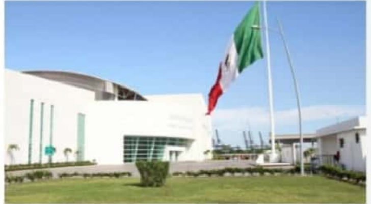
CD. LÁZARO CÁRDENAS, MICH.- La Administración Portuaria Integral de Lázaro Cárdenas y CNA se enfrascaron en un litigio por cinco años, al cabo, a la API se le impuso multa y ordenó demoler un muro.

En todo el tiempo del juicio, la Apilac buscó acreditar que ocupa bienes de propiedad nacional, y que el recinto portuario lo ha levantado en colindancia del brazo izquierdo y derecho del Río