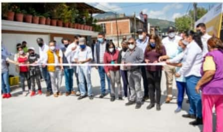
EL ALCALDE CORTÓ EL LISTÓN INAUGURAL DE DOS OBRAS. UNA EN LA COLONIA COLORÍN SUR Y OTRA EN EL SAUCO, CON UNA INVERSIÓN DE UN MILLÓN 352 MIL 645 PESOS

o del Nuevo Auditorio de la Unidad Deportiva, sino también se compone de acciones de menor escala como las entregadas este día, las cuales significan un gran avance en el bienestar de muchos colonos.