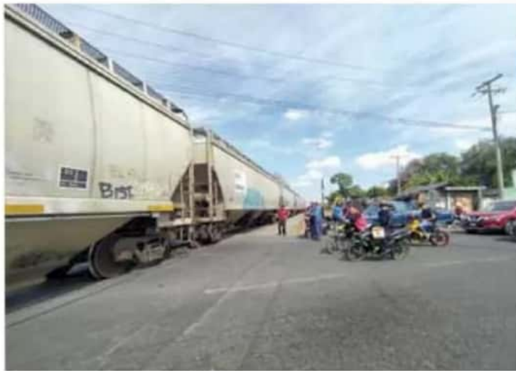
En duda. El cambio del patio de maniobras dependerá de la viabilidad, beneficios y costo.

determinarán la viabilidad de que se pueda cambiar el patio de maniobras y los recursos que se tendrían que invertir para la obra.