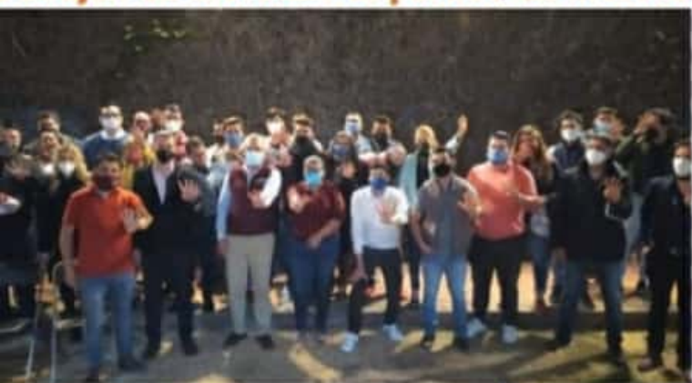
MORELIA, MICH.- El diputado local ha realizado visitas a las colonias y tenencias de Morelia junto con los coordinadores distritales del movimiento R21.