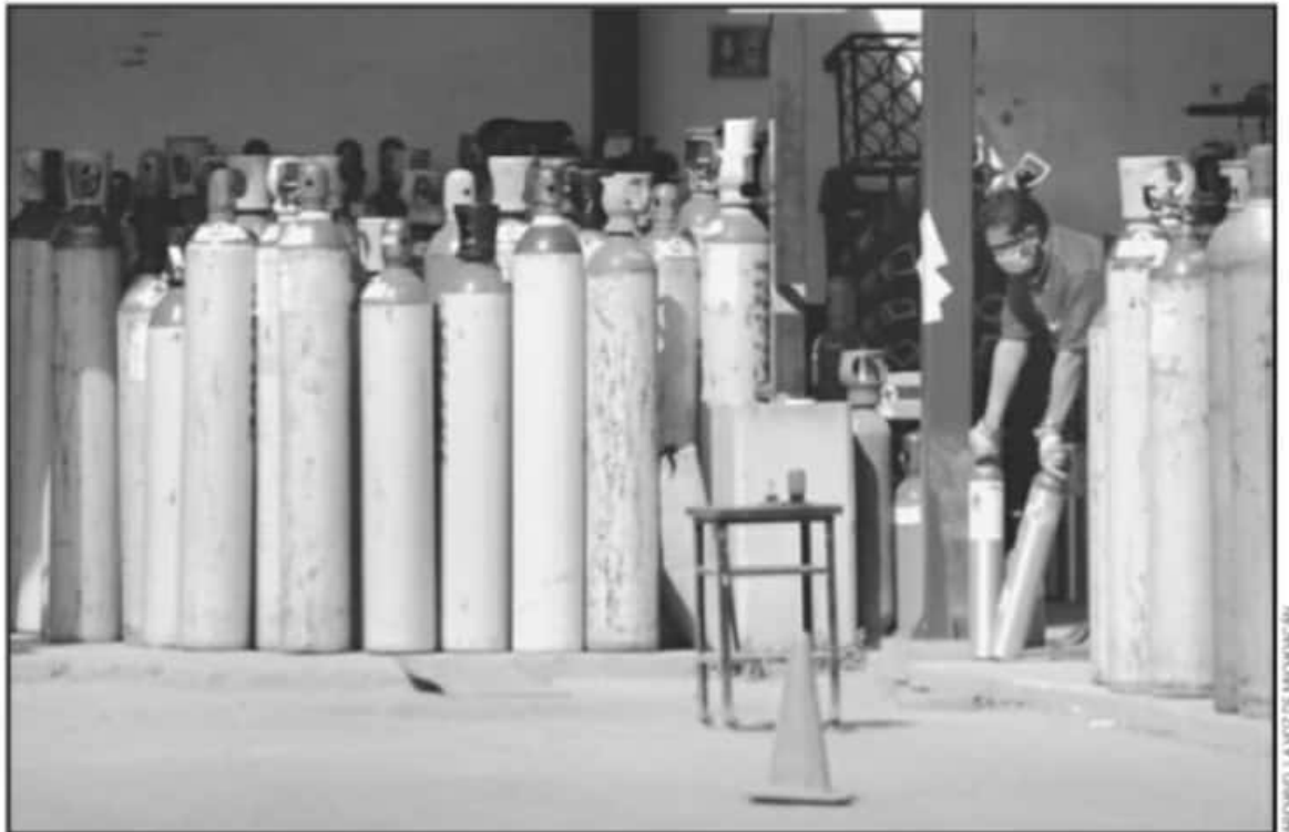
EL APOYO DE LA ARQUIDIOCESIS DE MORELIA EN EL TEMA DEL OXÍGENO MÉDICO. SERÁ CON VALES CANJEABLES PARA QUE RECARGUEN GRATIS UN TANQUE.

"La intención es que nosotros podamos entregar el vale a familias vulnerables que lo soliciten y que así no paguen su recarga de oxígeno en esta situación tan complicada. No se trata de que no hagan la fila o que no entreguen los documentos que pide Infra,