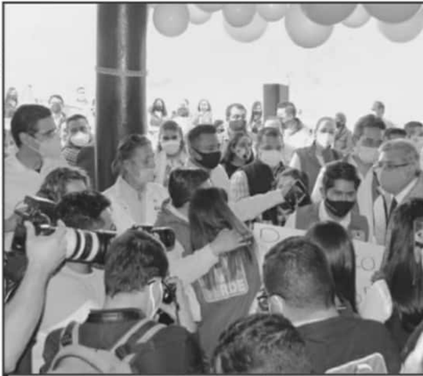
LOS POLÍTICOS Y PARTIDOS EN CAMPAÑAS DEBERÁN APEGARSE A LOS PROTOCOLOS BÁSICOS YA CONOCIDOS.

MIL políticos participarán en los procesos