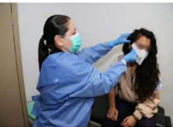
Durante el pasado mes de enero, la FGE brindó más de dos mil servicios integrales a mujeres víctimas de algún tipo de violencia.

Con acciones contundentes, la Fiscalía General del Estado de Michoacán refrenda su compromiso de atender de manera integral a las mujeres que viven una situación de vulnerabilidad a causa de la violencia de género.