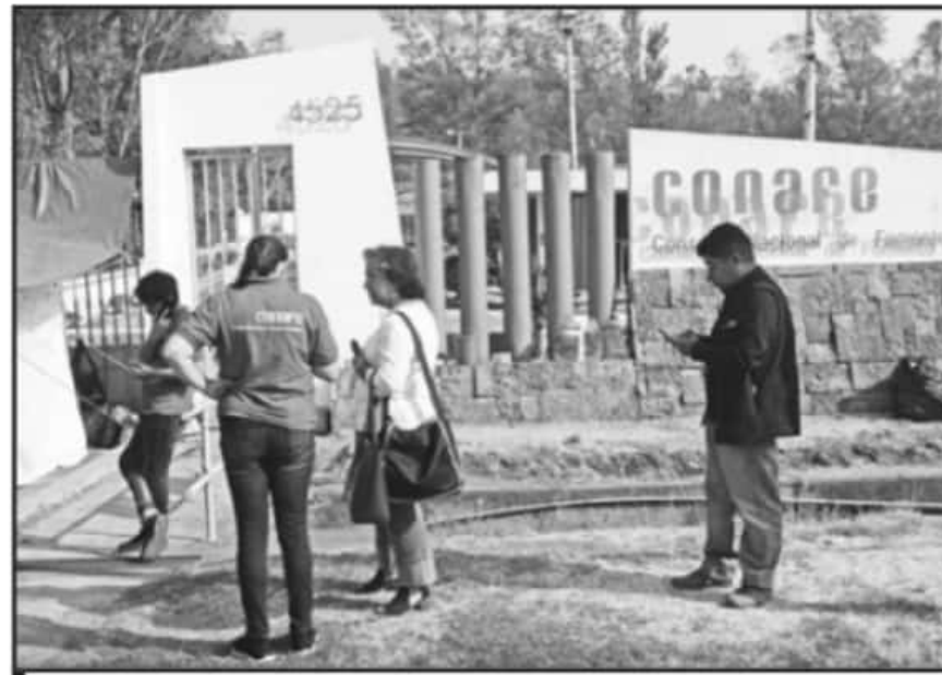
SE AFIRMÓ QUE SE HA LOGRADO ATENDER A UN GRAN NÚMERO DE COMUNIDAD CON LAS FIGURAS EDUCATIVAS.

Reiteró que las figuras educativas han estado presentando los reportes de las visitas a las comunidades la recolección de las tareas y las evidencias de los trabajos es-