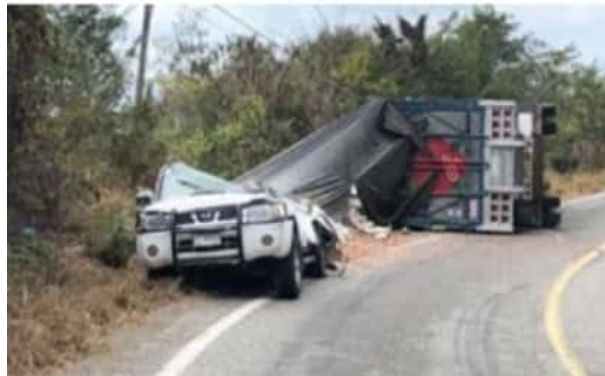
Ayer sobre la carretera costera, a la altura de San Juan de Alima, municipio de Aquila, un camión carguero volcó y cayó encima de una camioneta,

Del levantamiento de los cadáveres se hizo cargo en personal de la Fiscalía de Michoacán.