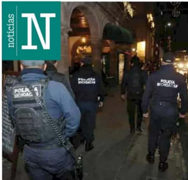
Lev. Hasta ayer, 34 personas habían sido detenidas por incumplir las normas sanitarias.