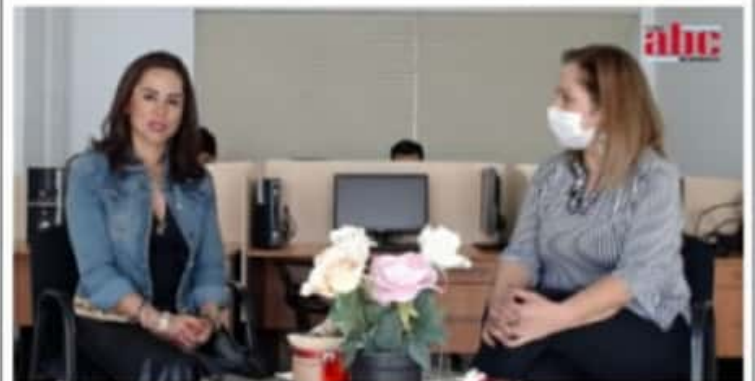
MORELIA, MICH.- En entrevista exclusiva para ABC Noticias Michoacán, señaló que compete para ganar y no se presta a simulaciones.

Se autodefinió como una mujer de causas sociales, "de toda la vida". Y dijo ser feminista, pero trabajando a la par con los hombres, en la educación y cultura, para lograr una mejor sociedad y un mejor Morelia para México.