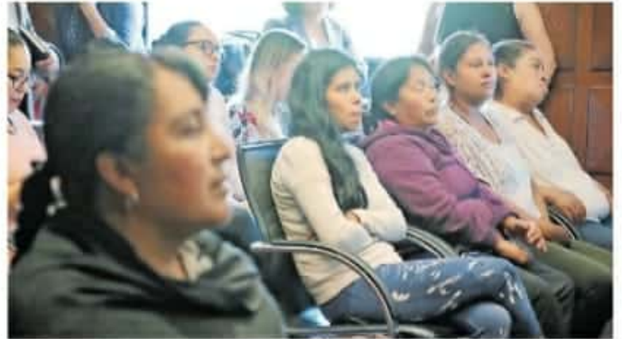
La participación de las mujeres en las elecciones debe estar libre de discriminación y violencia

En cuanto a las medidas de protección, el nuevo reglamento, establece que tienen el objetivo de garantizar que la participación de las mujeres en los procesos electorales se realice en un ambiente libre de discriminación y violencia política, ante cualquier acto u omisión en contra de las