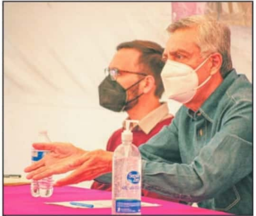
EL SENADOR CON LICENCIA PLANTEÓ SU VISIÓN ACERCA DE LO QUE MICHOACÁN REQUIERE PARA MEJORAR.