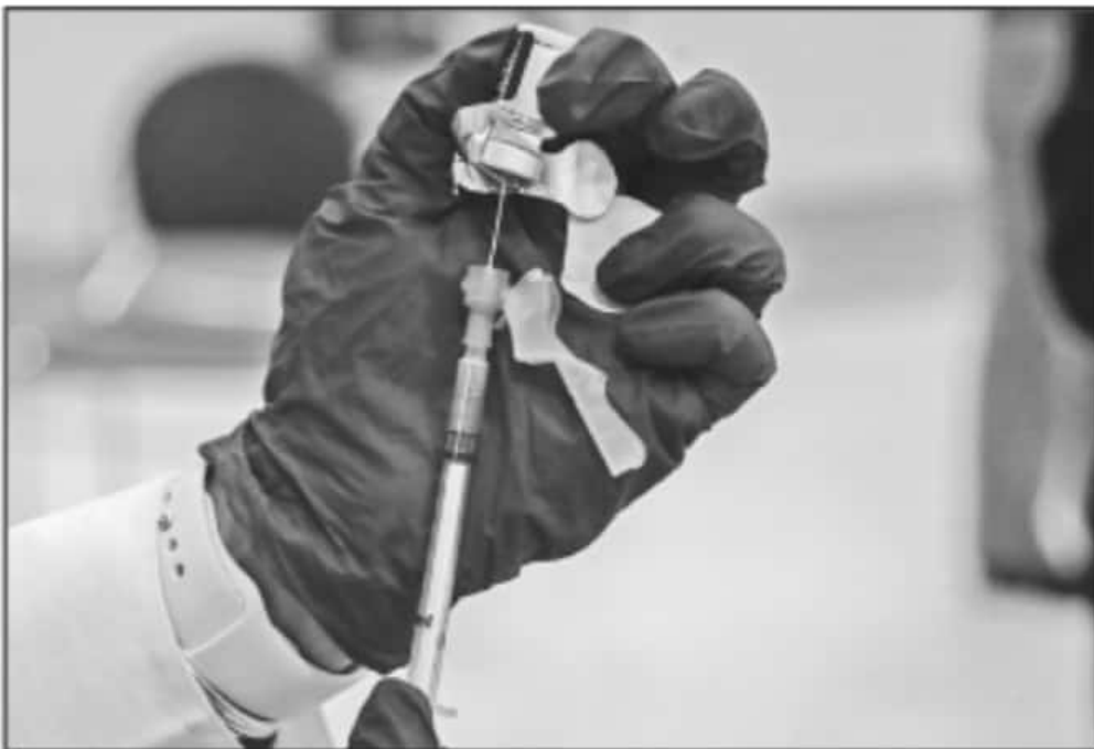
SE AFIRMO QUE A NIVEL LOCAL Y NACIONAL, DURANTE LA FASE DE PRUEBAS NO SE REGISTRARON ENTRE LOS VOLUNTARIOS EVENTOS GRAVES QUE LAMBEARAR

“Es una prueba muy interesante porque no se reportó ningún evento grave y esto habla de seguridad y eficacia. De los 15 mil que se completaron a nivel nacional ninguno tuvo este suceso en México y en el mundo los cinco países