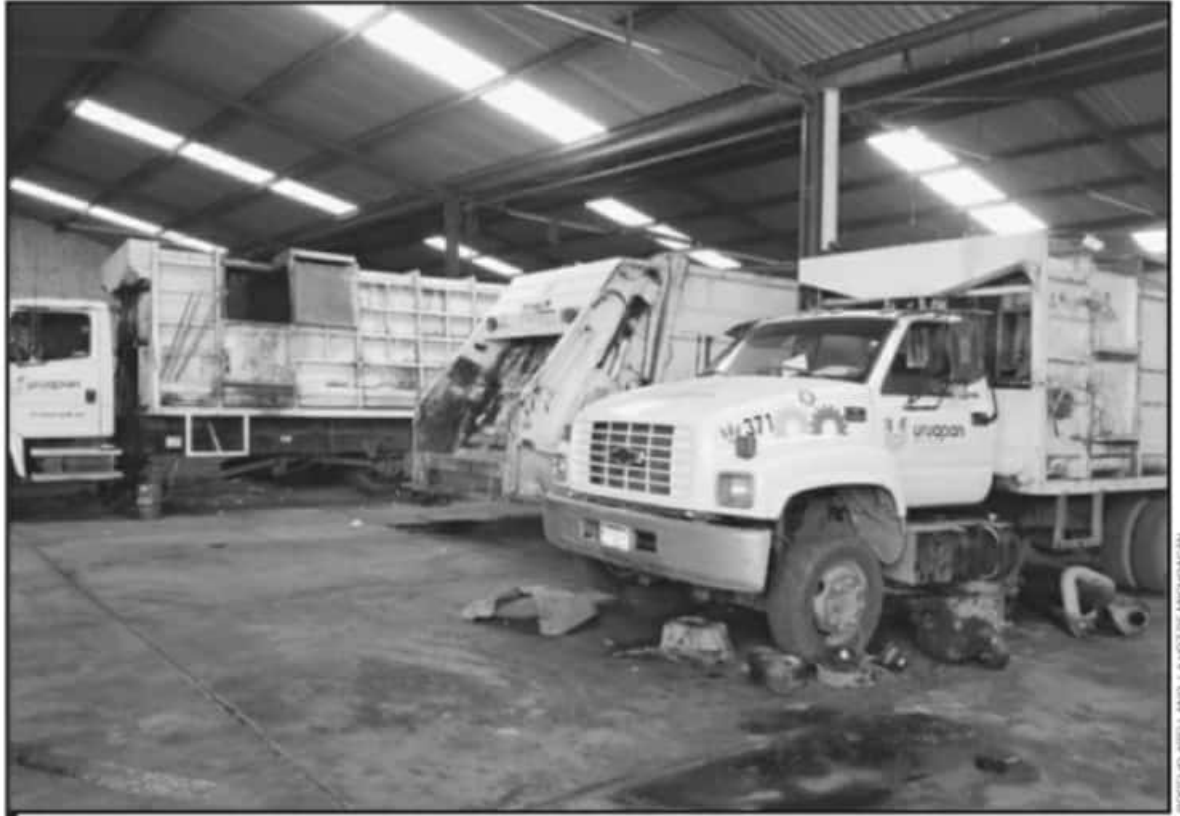
DE LAS CASI 40 UNIDADES MUNICIPALES PARA LA RECOLECCIÓN DE BASURA, LA MITAD NO CIRCUILA POR ESTAR SUJETAS A LAS REPARACIONES MECÁNICAS.

Es claro, añadió, que ante estos contratiempos no se cubren al cien por ciento las más de 36 rutas diseñadas por sanidad y limpia, en las cuales se generan más de 400 toneladas de residuos sólidos diariamente, de las cuales unas 200 son recolectadas por las otras 62 unidades