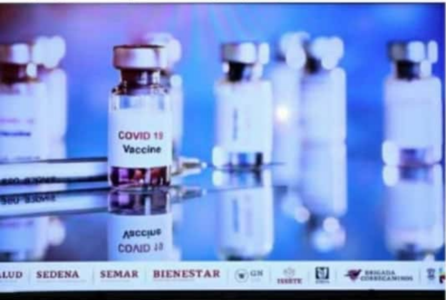
La aplicación de la vacuna contra el COVID-19, debe ser responsabilidad de todos, señaló ayer el gobernador Silvano Aureoles Conejo.

El Consejo Estatal de Vacunación quedó integrado por presidentes municipales de las 13 regiones del estado, las secretarías de Gobierno, Salud y Seguridad Pública Estatal, la Coordinación General de Comunicación Social del Estado, Sedena, la 21 Zona Militar, Guardia Nacional, la Marina, Secretaría del Bienestar, IMSS, ISSSTE, así como organizaciones interreligiosas, civiles y empresariales.