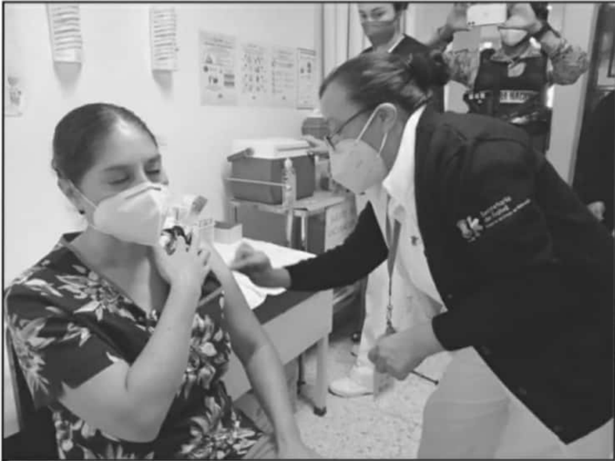
INICIÓ LA ETAPA DE VACUNACIÓN EN MICHOACÁN, PARA EL PERSONAL QUE TRABAJA EN PRIMERA LÍNEA EN LOS HOSPITALES CON PACIENTES DE COVID-19