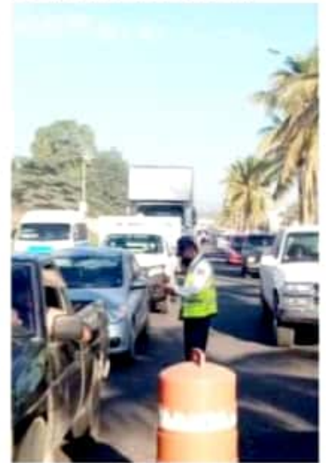
CD. LÁZARO CÁRDENAS, MICH.- Elementos de la Secretaría de Seguridad Pública continúan invitando a operadores y pasajeros del transporte público a usar el cubrebocas, a fin de inhibir el incremento de casos positivos por Covid-19.

La SSP pone al servicio de la población la línea de emergencias 911, para denunciar todo evento que infrinja las normas de la Nueva Convivencia y ponga en riesgo la salud de la sociedad michoacana.