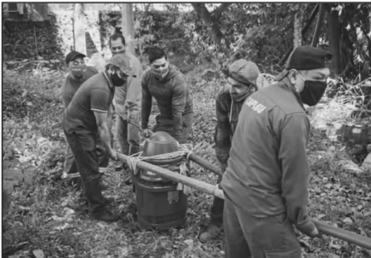
VECINOS DE LAS COLONIAS ALTAS DE LA CIUDAD, YA NO TENDRÁN QUE SUFRIR POR EL DESABASTO DEL VITAL LÍQUIDO, PUESTO TIENEN EQUIPO DE BOMBEO NUEVO.

En este 2021 se buscarán extender los recursos técnicos y financieros para consolidar la rehabilitación integral de los sistemas de bombeo de la red de agua potable