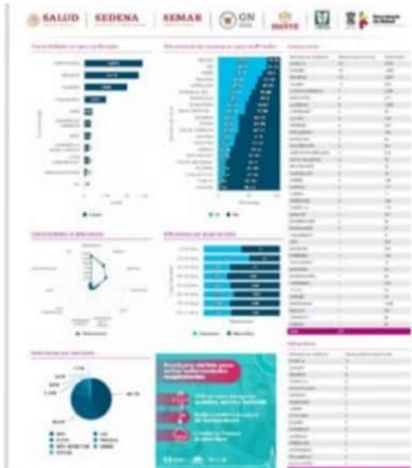
Ayer el municipio de LC registró 9 nuevos casos positivos más de COVID-19.