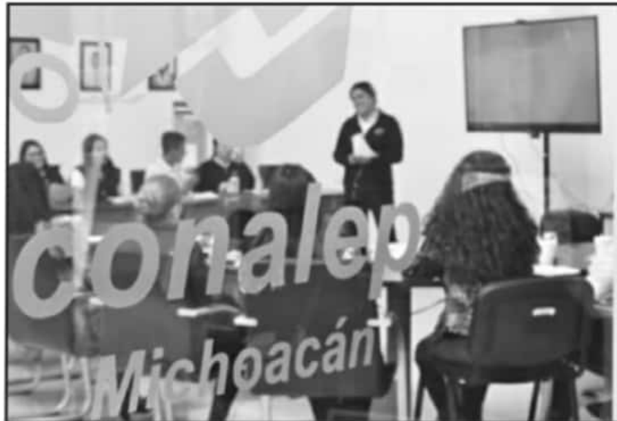
CONALEP HA TRABAJADO EN PROCESO DE NUEVO INGRESO CON MESES DE ANTECIPACIÓN E IMPULSAR LA MATRÍCULA.

El funcionario estatal apuntó que uno de los objetivos es contrarrestar la posible deserción que se pueda presentar, por lo que trabajaban para que en el tránsito de un