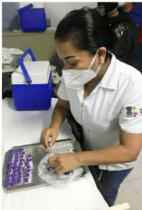
ZAMORA, MICH.- Llegó el primer lote de vacunas a Michoacán, resguardado por elementos castrenses.

Se espera que sea en los próximos cinco días que todo el personal en Michoacán este vacunado, y Zamora cumplirá con esta meta, al aplicar el biológico en tiempo y forma, lo que garantiza una protección a quienes llevan casi un mes frente a la batalla que cada vez se agudiza más.