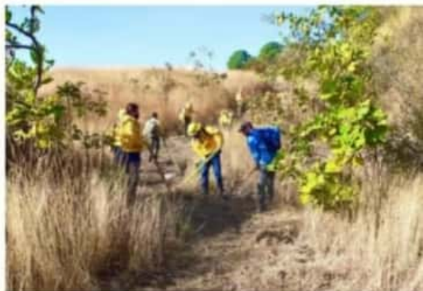
URUAPAN, MICH.- Hasta el momento, el gobierno municipal ha rehabilitado 80 kilómetros de brechas cortafuegos en cerros cercanos a la cabecera municipal.

Indicó que los 80 kilómetros de brechas cortafuego rehabilitados corresponden a los cerros de "La Charanda", "La Cruz" y Jicalá, así como el área de montaña del Parque Nacional, sobre la cual informó que la mañana de este miércoles se realizó una quemadura controlada en ocho mil metros cuadrados de pastizal en Lomas de Rosario, colindantes con esta zona, a fin de evitar mayores afectaciones por incendios durante la época de estiaje.