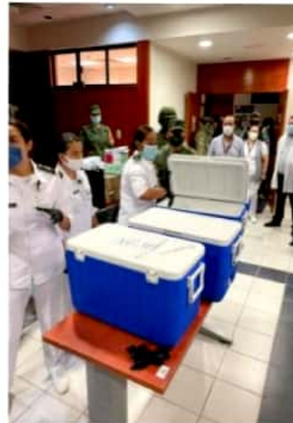
CD. LÁZARO CÁRDENAS, MICH.- Por la noche de este martes, arribaron al municipio de Lázaro Cárdenas las primeras dosis de vacunas contra el Covid-19.

"Aún vacunados, las medidas individuales de protección contra el virus SarsCoV 2 deberán continuar. Adaptarse - Protegerse - Avanzar", escribió.