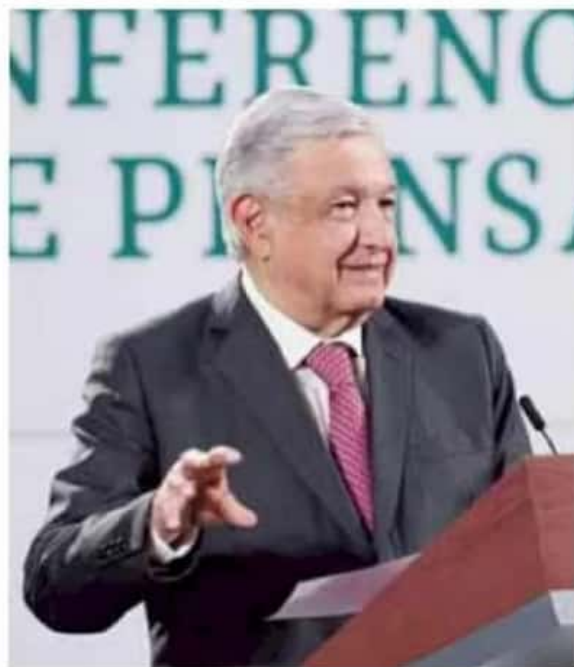
Burla. El presidente tomó la instrucción del Instituto Nacional Electoral (INE) con humor, previo a las elecciones.

Antes, López Obrador argumentó que las conferencias matutinas no se realizan con fines de propaganda de cara a las elec-