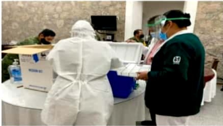
MORELIA, MICH.- No deben bajar la guardia todos aquellos trabajadores de salud que están recibiendo la vacuna en esta primera dosis.

■ No se debe bajar la guardia aún cuando se haya inyectado la primera vacuna, piden autoridades sanitarias