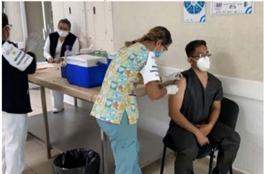
En total, serán 7 mil 370 profesionales de la salud los que serán vacunados en la SSM.

En esa coalición de 107 candidaturas para renovar igual número de alcaldías, en 70 será Morena quien proponga los candidatos y en 37 el PT. Entre las que le tocan al Partido del Trabajo están Apatzingán, Arteaga, La Huacana, Múgica, Pátzcuaro y Zitácuaro, entre otras, en tanto que Morena propondrá en Coahuayana, La Piedad, Morelia, Uruapan, entre otras.