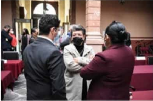
El gobierno de la 4T no es opaco en contratos de medicamentos: Tere López.