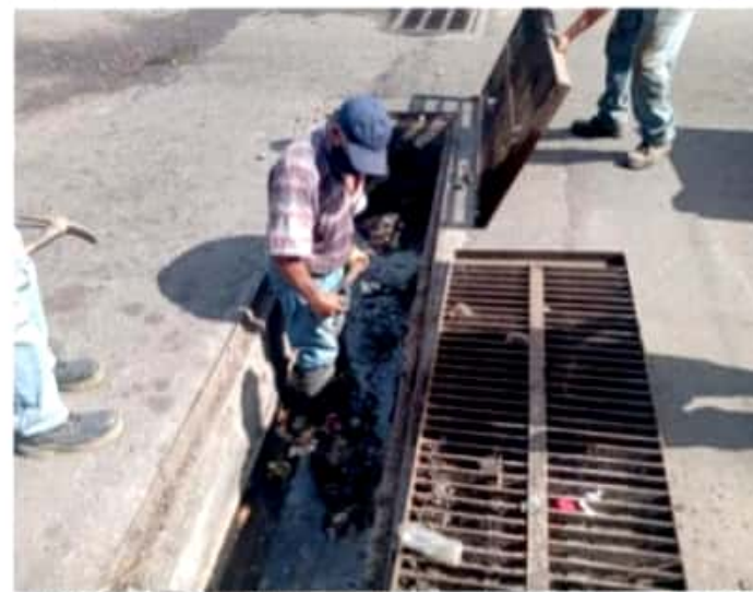
CD. LÁZARO CÁRDENAS, MICH.- Personal de Obras Públicas trabaja en la limpieza y desazolve de las alcantarillas pluviales en avenidas del Fundo Legal.