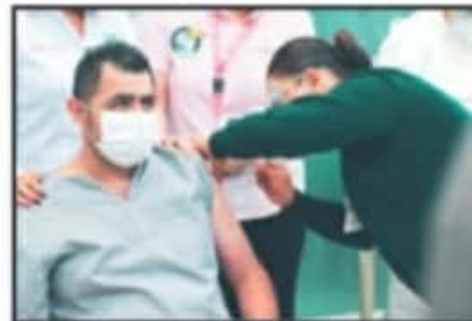
CASI SIETE MIL MÉDICOS FUERON VACUNADOS AYER.

Es un orgullo de verdad haber recibido esta primera vacuna y quiero decirles gracias porque si es algo histórico que estábamos esperando con mucho gusto