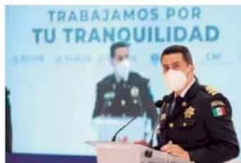
SSP. En el estado se comete el 2.49% de los delitos de todo el país, señaló el secretario de Seguridad Pública.

"Si hacemos un comparativo con el año 2019, se tiene un incremento del 16.19%, lo que equivale a recuperar mil 169 vehículos adicionales a los asegurados en 2019", destacó.