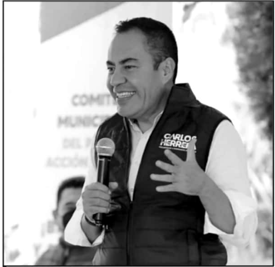
EL PRECANDIDATO SEÑALÓ TENER LA CAPACIDAD PARA ENCABEZAR EL PROYECTO ENFOCADO EN LAS Y LOS CIUDADANOS.