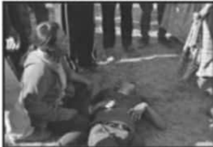
UNO DE LOS ASESINADOS FUE UN MENOR DE EDAD. LA COMUNIDAD LLORÓ DESCONSOLADA POR EL ATAQUE