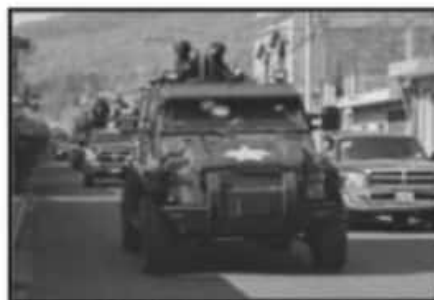
EXCESIVO USO DE FUERZA Y DE SUS ATRIBUCIONES DICTAMINARON CEDH Y CNDH. SSP NEGA SU CULPA.