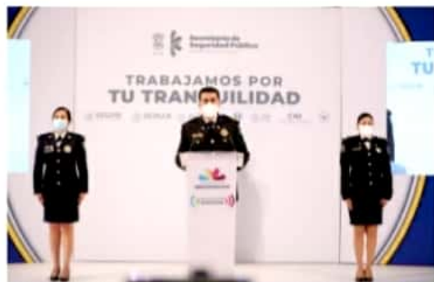
MORELIA, MICH.- Israel Patrón destacó que se desplegaron 22 mil 300 elementos para acciones de investigación, prevención y procuración de justicia entre 2019 y 2020.

"Los resultados que hoy presentamos son prueba de la coordinación con la Sedena, Guardia Nacional Semar, Fiscalías del Estado y de la República, y por supuesto con los municipios que participan en la estrategia", concluyó.