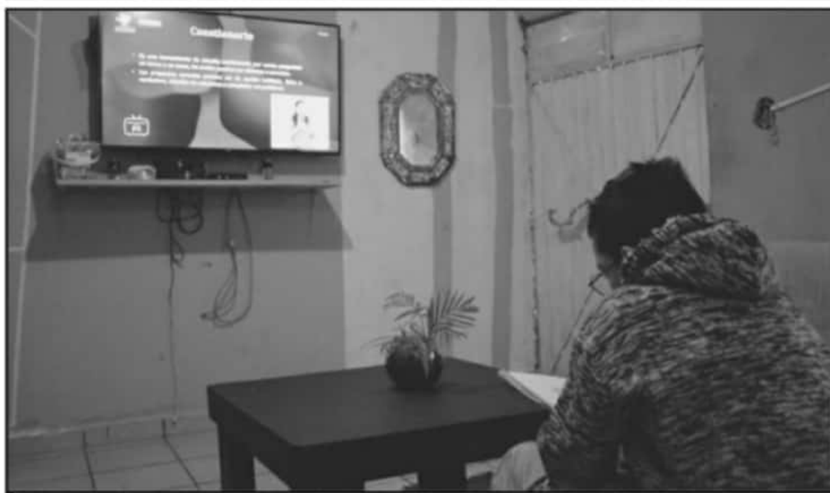
SE APUNTÓ QUE ES ALTAMENTE PREOCUPANTE SABER QUE MÁS DE LA MITAD DE LOS ALUMNOS NO RECIBEN CLASES A DIARIO; PROBLEMA QUE DEBE RESOLVERSE.

rio empleado, la media, moda, varianza, error estándar, la forma de difusión de la encuesta y la construcción del tamaño de la muestra permite conocer sobre la validez y la confiabilidad del instrumento utilizado, que a su vez son la plataforma para las conclusiones que se construyan.