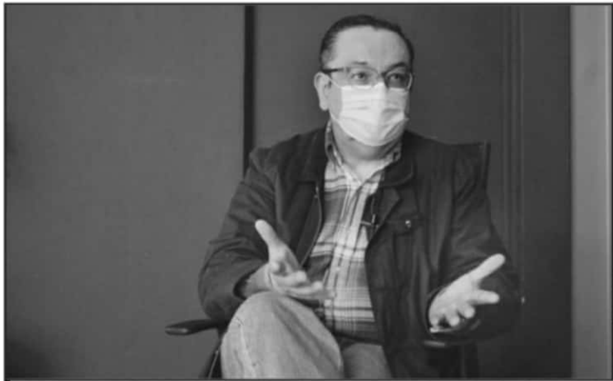
AL TAMBIÉN EXDIRIGENTE NACIONAL DEL PAN LE MOLESTA QUE A MICHOACÁN SE LETOME COMO UN TERRENO DE AVANZADA EN EL PROCESO, COMO LABORATORIO.

Ha hablado duro y fuerte por las pugnas internas que vive en estos momentos Morena debido a la selección de candidatos a las gubernaturas. Prevé que estos desencuentros están haciendo "patinar" a la cuarta transformación, por lo que ha responsabilizado a la dirigente nacional de lo que está