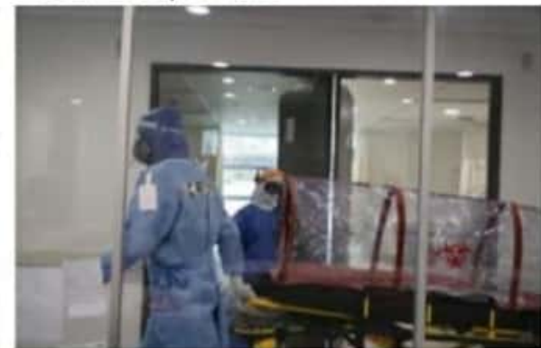
Exhorta SSM a la población a quedarse en casa, para evitar ser parte de las estadísticas del COVID-19.