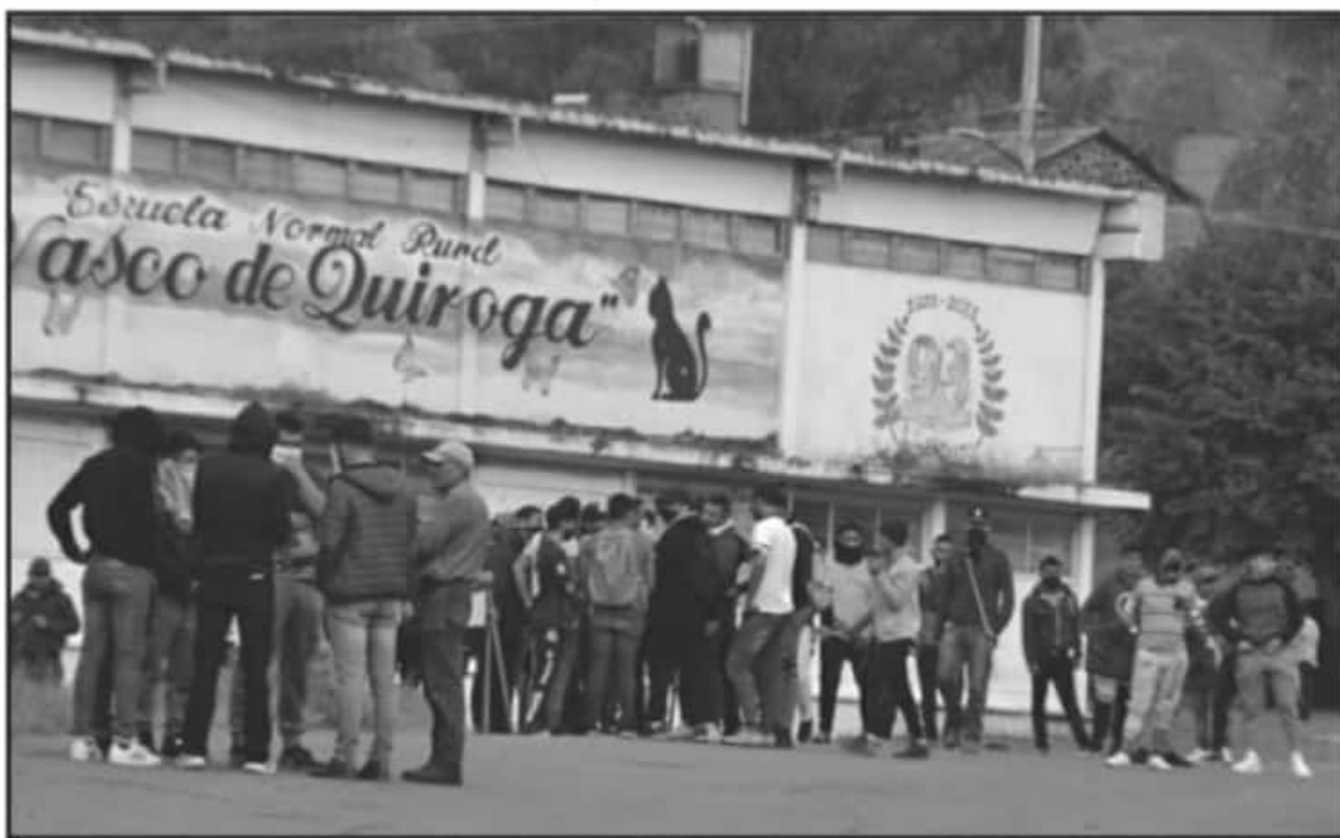
LOS ESTUDIANTES DE LA ESCUELA NORMAL DE TIRIPETÍO RECLAMAN PAGO DE BECAS DE ALIMENTACIÓN, AUNQUE POR LA PANDEMIA DEBERÍA ESTAR CERRADA.

de continuarán con la misma tónica de manifestaciones, secuestro y saqueo de unidades, además de obstrucción de las vías de comunicación, mientras la autoridad estatal no ceda a sus exigencias.