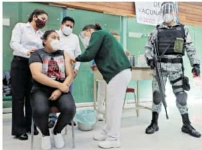
El sector médico perdió 62 trabajadores de la salud.