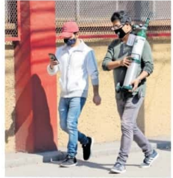
En Michoacán los ciudadanos han comenzado a enfrentarse a la escasez

"Eso obedece más a la falta de concertación que la autoridad debería de