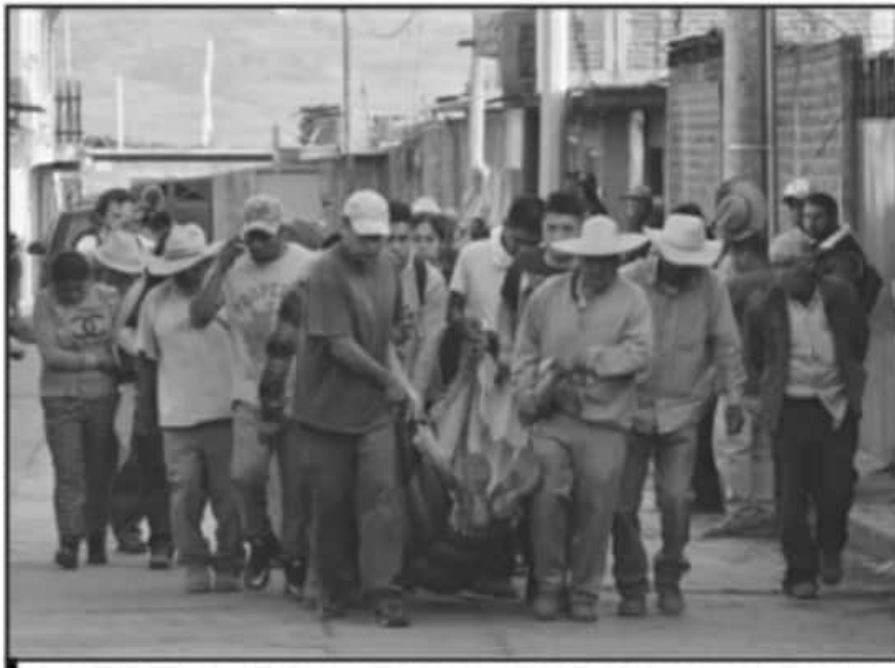
LOS COMUNEROS FUERON AGREDIDOS POR AL MENOS 300 AGENTES DE LA SSP. EL SALDO FUE DE 5 PERSONAS MUERTAS.

VG/2020 de la CNDH, que se dio a conocer el pasado 23 de diciembre del 2020, acreditó violaciones graves a los derechos humanos por parte de las corporaciones policíacas, consistentes en el derecho a la vida, a la integridad personal, al derecho de reunión, a la libertad de expresión, al interés superior de la niñez, así como a una vida libre de violencia.