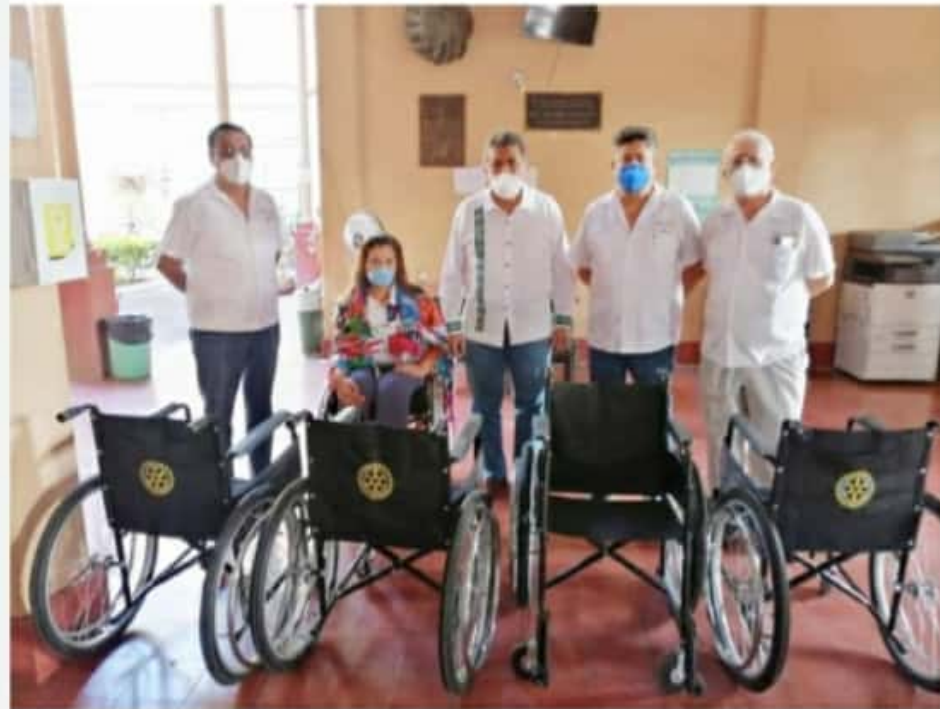
APATZINGÁN, MICH.- El alcalde dijo que en Apatzingán hay una gran demanda de artículos que ayuden al desplazamiento de las personas que tienen discapacidad motriz.