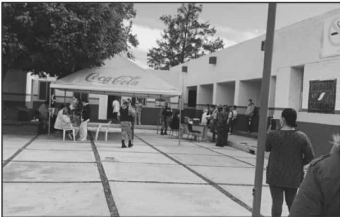
FUE EL PERSONAL DE LA GUARDIA NACIONAL EL ENCARGADO DE CUSTODIAR LAS DOSIS Y ENTREGARLAS A LOS SERVIDORES DE LA NACIÓN DE LA LOCALIDAD.