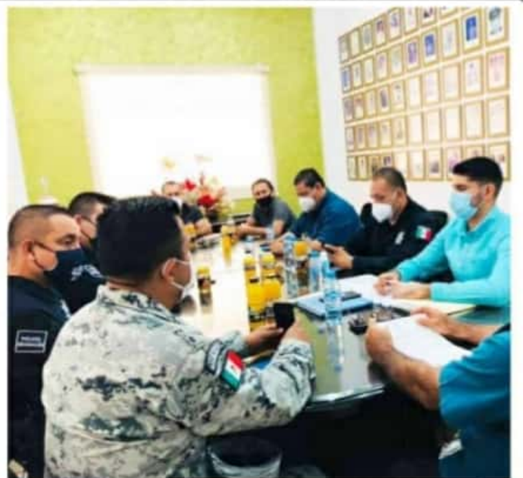
APATZINGÁN, MICH.- Acordaron que los negocios de venta de calzado, ropa y flores, permanecerán cerrados hasta nuevo aviso.

Asimismo agradeció la buena disposición de los comerciantes de giros no esenciales, para hacer frente a la pandemia. "sabemos que han sido afectados económicamente, pero se trata de un tema de salud pública, que no podemos dejar de lado", concluyó.