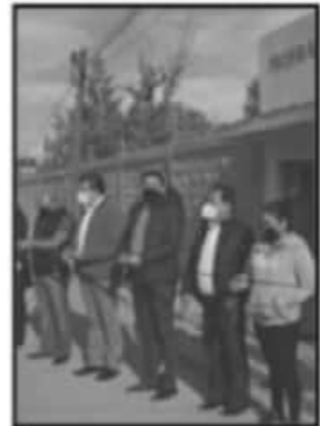
EL EVENTO FUE PROTAGONIZADO POR EL ALCALDE DE LA PIEDAD.