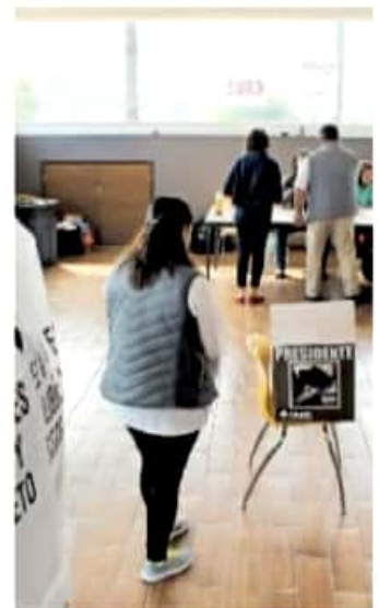
La jornada electoral será el próximo 06 de junio. —MARIANA LUNA

“Este acuerdo busca cuidar la salud de todas las personas que participarán en los comicios del próximo 06 de junio, dado que los espacios de las instituciones educativas son amplios, esto ayudaría a guardar la sana distancia, evitar amontonamiento de gente; además de que serían espacios ventilados, lo cual también suma a evitar contagios por Covid 19. Primero se visitarán las escuelas y una vez que se tenga la selección se pedirá la anuencia de la autoridad educativa, los recorridos comenzaron en la primera quincena de enero y el resultado lo podremos tener des-