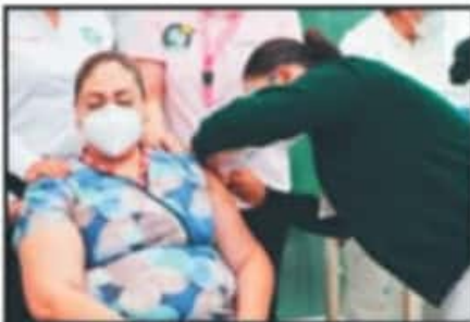
OCHO DECESOS POR COVID-19 FUERON ENFERMERAS.