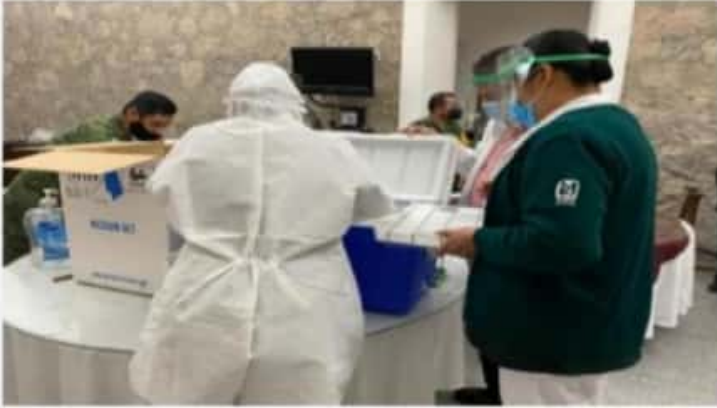
MORELIA, MICH.- No deben bajar la guardia todos aquellos trabajadores de salud que están recibiendo la vacuna en esta primera dosis.

■ No se debe bajar la guardia aún cuando se haya inyectado la primera vacuna, piden autoridades sanitarias