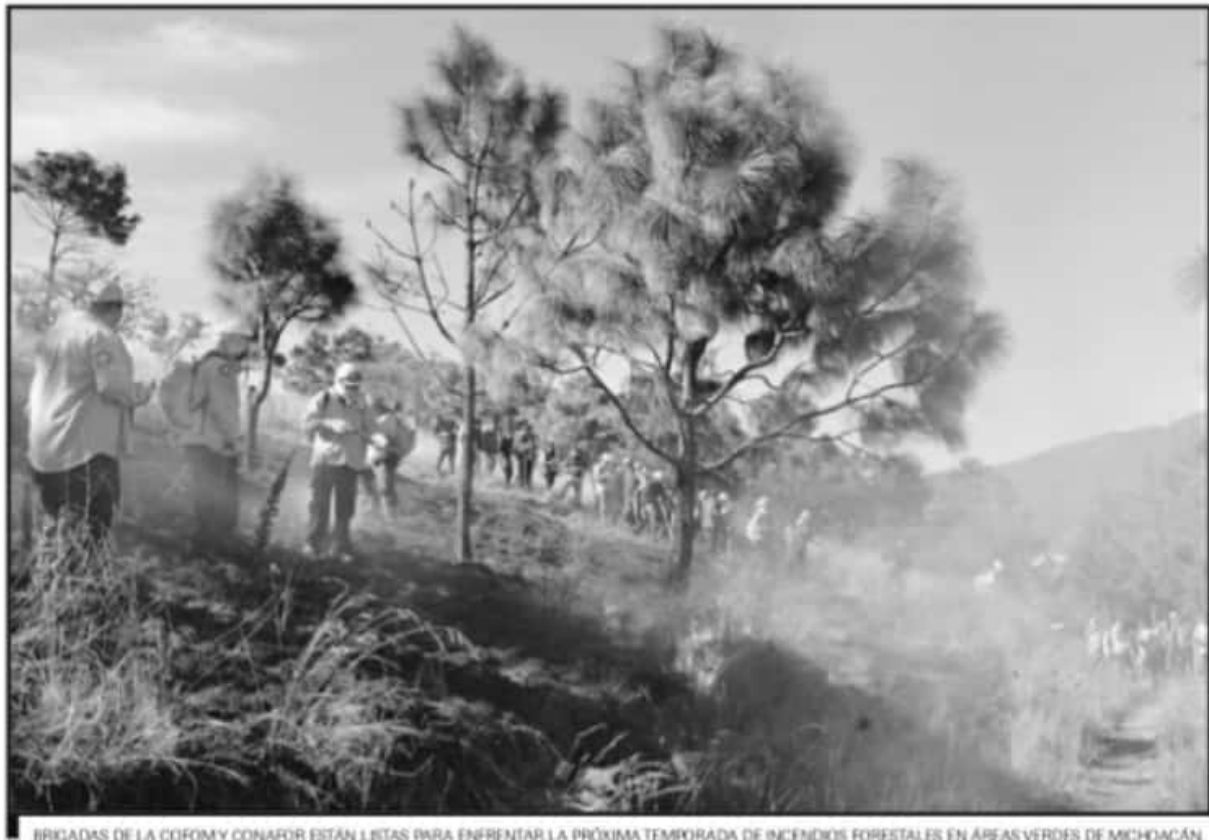
BRIGADAS DE LA COFOMY CONAFOR ESTÁN LISTAS PARA ENFRENTAR LA PRÓXIMA TEMPORADA DE INCENDIOS FORESTALES EN ÁREAS VERDES DE MICHOACÁN.

La preocupación para este 2021 se basa en los resultados del año pasado. A pesar de que en 2020 se tomaron medidas desde enero con la instalación de miles de metros de brechas cortafuegos y otras medidas, el año pasado quedó registrado como el de mayor afectación a los ecosistemas forestales por in-