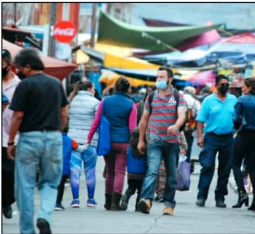
EL AUMENTO EN LA TRANSMISIÓN DEL VIRUS LLEVO A LAS AUTORIDADES A ELEVAR EL NIVEL DE RIESGO EN MUNICIPIOS.

En las últimas 24 horas murieron 38 personas más en 15 municipios estatales por complicaciones de la enfermedad de COVID-19. Morelia reportó la mayor cantidad de defunciones nuevas, con 17, seguido de Zamora y Uruapan, con 3 decesos cada uno, y Tuzantla y Panindícuaro, con dos. Otros 10 municipios añadieron una muerte más a su registro: Zitácuaro, Huaniqueo, Juárez, Zacapu, Tarímbaro, La Piedad, Yurécuaro, Apatzingán, Penjamillo y Pajacuara, además de un caso fortuito.