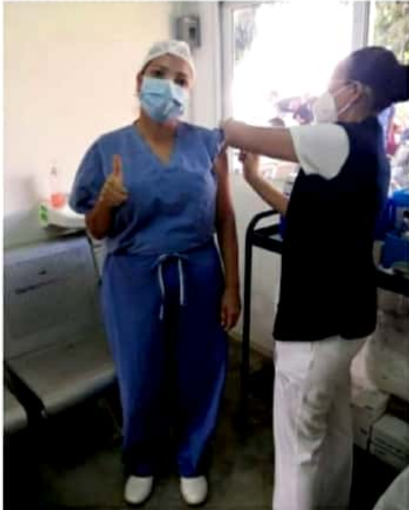
CD. LÁZARO CÁRDENAS, MICH.- La dotación de vacunas contra el Covid-19, que llegaron a esta ciudad la noche del martes, será suficiente para la protección del personal de salud de primera línea.