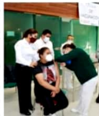
MORELIA, MICH.- Estas dosis serán para cubrir al cien por ciento al personal médico que se encuentra en contacto con los pacientes Covid.

Hasta la fecha, en Michoacán se tienen confirmados 35 mil 756 casos y 2 mil 881 personas han perdido la vida a causa de este padecimiento, por lo que la SSM reitera el llamado a la población a no bajar la guardia en la implementación de medidas preventivas.