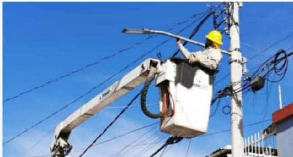
ZAMORA, MICH.- Se acordó sumar esfuerzos con el Ayuntamiento para la adquisición de las lámparas como parte del programa para renovar el alumbrado.

desarrollar el alumbrado público de Zamora. También se dialogó sobre la conformación de un Comité de Prevención en la calle Macario Ruiz Pérez, en el que los vecinos se comprometen a vigilar y estar al pendiente de la actividad que se realice en la zona, además de formar un vínculo con el municipio para atender la problemática que priva en la colonia. Los residentes de la vialidad, agradecieron el apoyo recibido por parte de las autoridades municipales, para mejorar el sistema de iluminación y prevenir los robos y actos vandálicos que se han suscitado en el lugar.