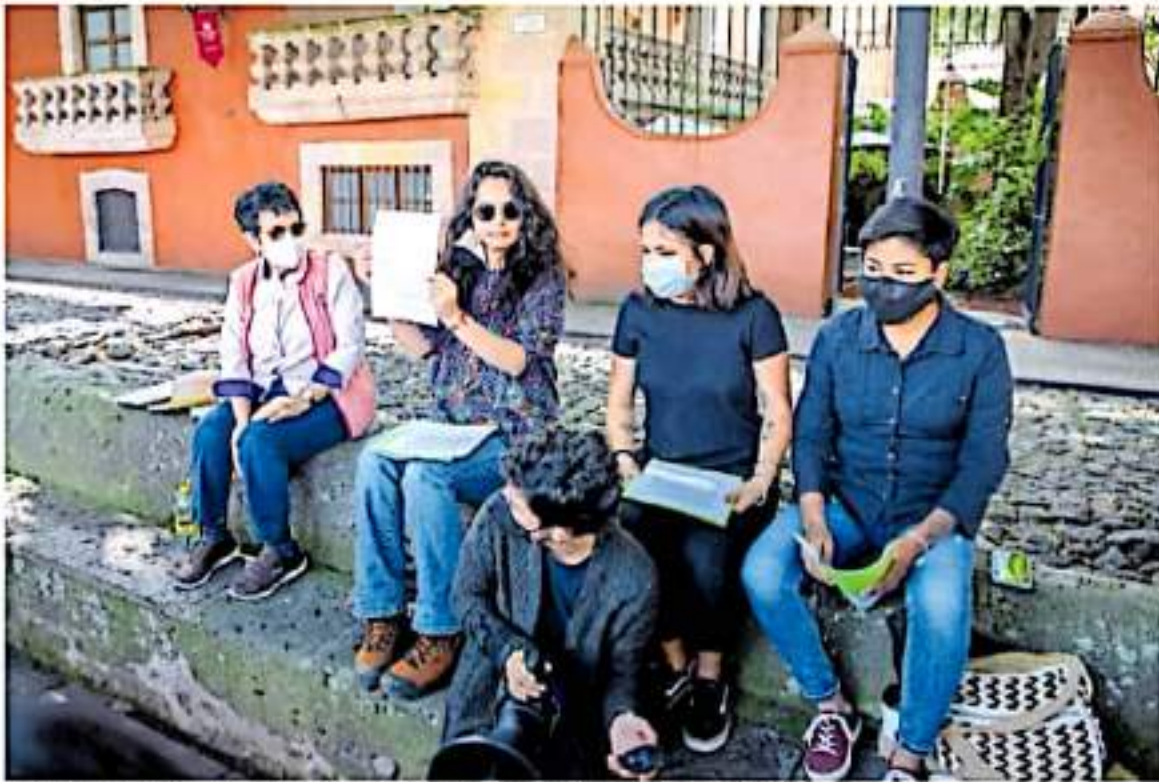
Integrantes del Bemich detallaron que existen perfiles con imputaciones graves de violencia / CAROLINA VIZCARRA

"TIENEN DEMANDAS DE ACOSO SEXUAL", ACUSAN