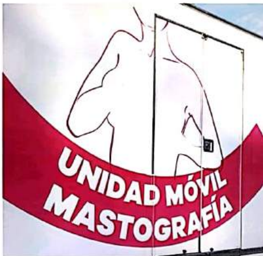
CD. LÁZARO CÁRDENAS, MICH.- Este 15, 18, 19 y 20 de octubre se realizarán Exámenes Gratuitos de Mastografías en la explanada municipal, actividad que coordina la Secretaría de Salud de Michoacán, a través de la Jurisdicción Sanitaria No. 08 (JSN08) con el Gobierno Municipal.