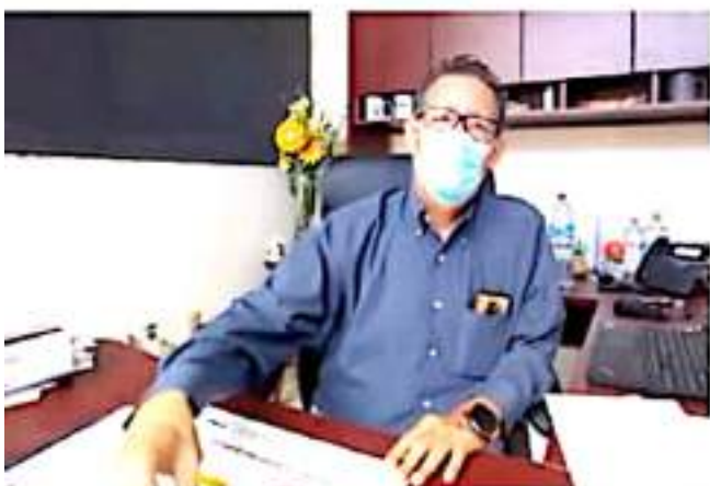
URUAPAN, MICH.- Ricardo Caro González, vocal ejecutivo del INE, en el 09 Distrito Electoral.

Todas las respuestas serán capturadas y tomadas en cuenta para sistematizar los resultados, determinar cuántos niños y adolescentes participaron, pero sobre todo qué opinaron. Los resultados se obtendrán a principios del próximo año con el cierre de cifras para seccionaria y dar a conocer a los tres órdenes de gobierno para que puedan ser tomadas en cuenta como políticas públicas.