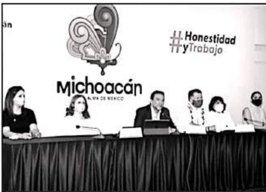
A TRAVÉS DE UNA ENCUESTA EN LAS REDES, LA SECTOR MICHOACÁN VULVIÓ A TOMAR LA MARCA 'EL ALMA DE MÉXICO'.