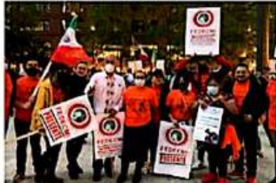
Piden al Presidente Joe Biden una reforma migratoria y "legalización" para todos.

Esto no sabemos si lo aceptarían o si será considerado en la negociación, -continuó-, por eso la importancia de poner los temas de la agenda migrante sobre la mesa, y la idea es seguir presionando a los demócratas, que cuentan con 50 curules y el voto de desempate de la vicepresidenta, Kamala Harris, y es abrir una senda a la residencia legal permanente, y posteriormente a la ciudadanía, para beneficiarios de los programas Acción Diferida (DACA) y Estatus de Protección Temporal (TPS) y trabajadores agrícolas y "esenciales" indocumentados.