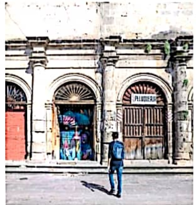
FNLS afirmó que nunca agredieron a los estudiantes y tampoco se les privó de su libertad