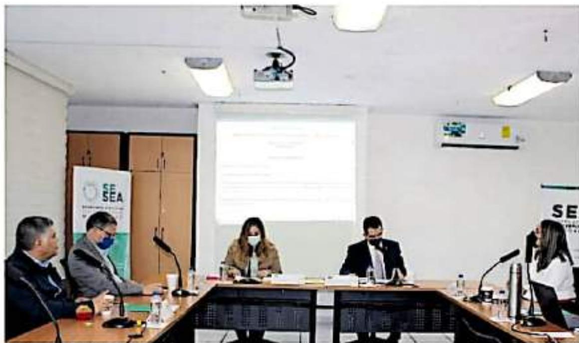
El objetivo es que los michoacanos puedan participar en denuncias

ESTÁN DISPONIBLES EN UNA PÁGINA WEB SIN COSTO