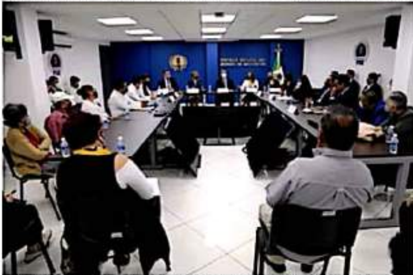
Aspecto de la reunión con integrantes de la Comisión Ejecutiva Estatal de Atención a Víctimas (CEEAV) y personas víctimas de delitos.