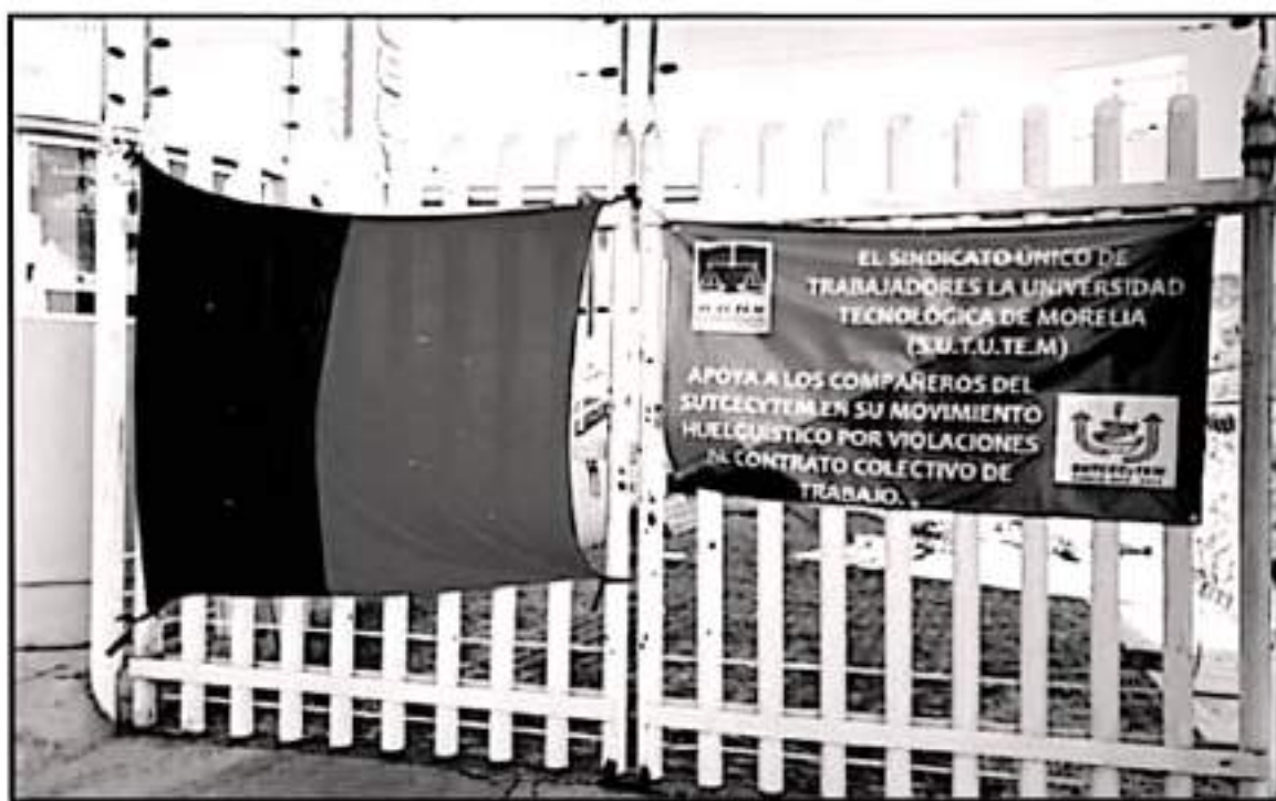
TRAS EL PAGO DE ADEUDOS EL MIÉRCOLES CONCLUYÓ EL PARO DE LABORES EN EL CENTRO DE ESTUDIOS CIENTÍFICOS Y TECNOLÓGICOS DEL ESTADO DE MICHOACÁN

El dirigente señaló que esperan puedan tener avances en este rubro ya que con la anterior administración esto no fue posible y de igual manera esperan que la