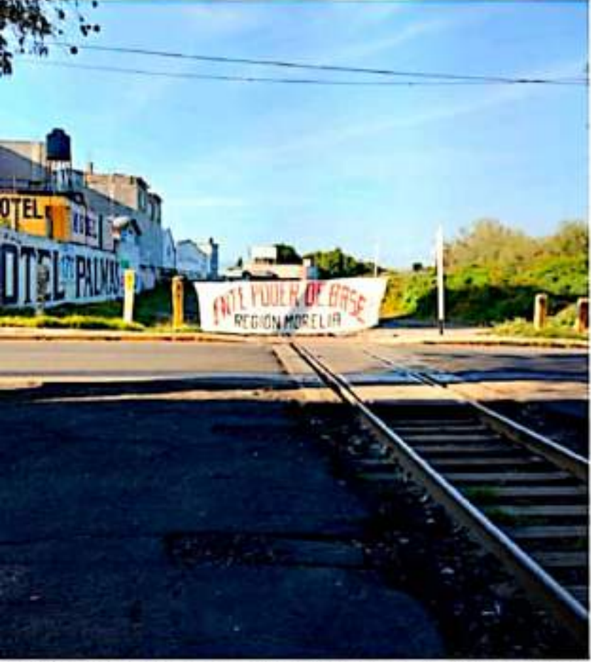
CD. LÁZARO CÁRDENAS, MICH.- Producto del bloqueo a las vías férreas en Calzontzin, siguen sin poder salir o dirigirse hacia el puerto de Lázaro Cárdenas, los trenes de la empresa KCSM.

Mientras que los sectores afectados, acusó el organismo, son los relacionados a la industria acerera, automotriz, agroindustria, cementera, así como tiendas de autoservicio y departamentales, y mercancía de importación que de igual forma permanece detenida.