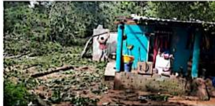
CD. LÁZARO CÁRDENAS, MICH.- A causa de la intensa lluvia y fuertes vientos, que se sucedieron acompañar de relámpagos, durante la noche del domingo, viviendas de las localidades de El Reino, Las Higueras y San Rafael presentaron daños.

Por lo anterior, solicitaron apoyo a las autoridades municipales, asociaciones civiles y grupos de voluntarios, para las familias que nuevamente perdieron parte de su patrimonio. "Vean que lo que ahora están viendo y leyendo es real, que se den cuenta en las condiciones que quedó la brecha que conduce a estas rancherías", exigen.