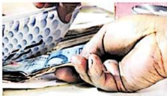
En las guías se explica con un lenguaje sencillo y concreto cómo es que se conforma el Sistema Estatal Anticorrupción / ARCA/VO

Junto con la Cartilla Anticorrupción que presentó la Fiscalía Especializada en