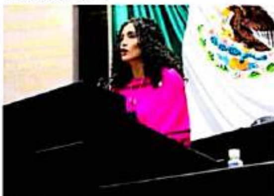
CDMX.- Diputada Federal, Edna Gisela Díaz Acevedo.

Por lo anterior, puso a consideración de la Asamblea, una iniciativa de Ley con Proyecto de Decreto, para reformar las Fracciones del Artículo 35 de la Ley General de Cultura Física y Deporte, que hace referencia a los planes municipales de desarrollo. Pero para que no se trate de palabras, sino de hechos, se tiene que dotar de recursos a dichos planes municipales, mencionó la diputada, por el que se adiciona una fracción al Artículo 13 y un Artículo 41 bis a la Ley General de Cultura Física y Deporte, en materia de subsidios municipales.