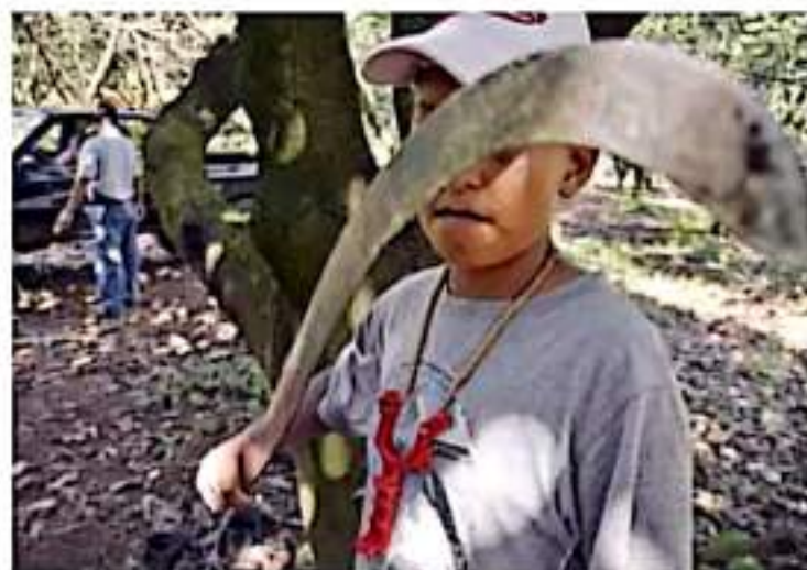
Reinsera. El estudio -basado en 67 testimonios de niños, niñas y adolescentes reclutados por el narco- busca retratar la realidad más cruda del mundo del crimen organizado.

Lee la columna completa en www.memoria.com