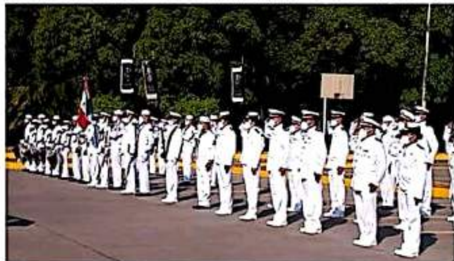
La Armada de México a través de la Décima Zona Naval, invita a jóvenes mexicanos a pertenecer al servicio activo de la institución.

La Secretaría de Marina-Armada de México por conducto de la Décima Zona Naval, convoca a mujeres y hombres de 18 a 29 años, a ingresar al Servicio Activo de la Armada de México, para servir a nuestro país