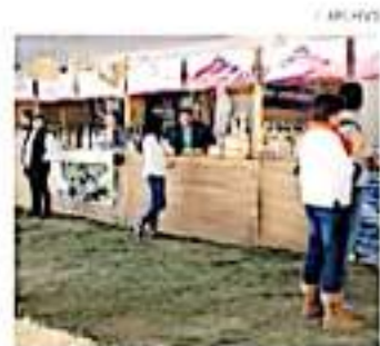
El evento se llevará a cabo este 15, 16 y 17 de octubre.

Anticiparon que habrá recorridos en el Eco-Safari el próximo viernes, sábado y domingo en donde se darán promociones.