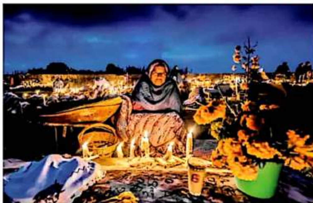
Panteones. Las comunidades de la región lacustre mantendrán abiertos los panteones a los visitantes. / J. OSORIO