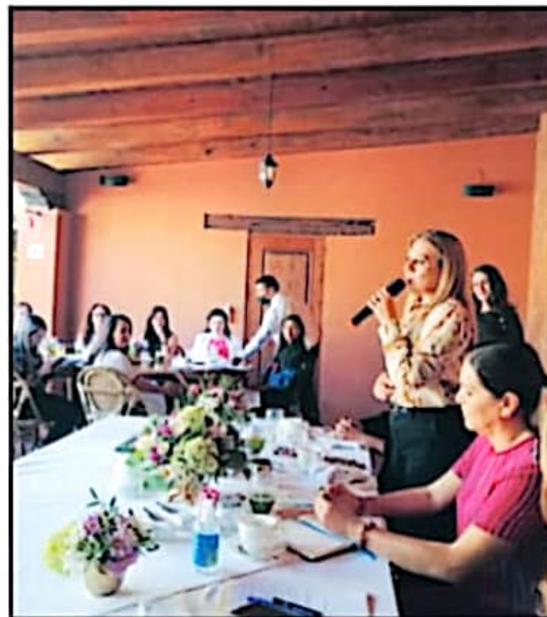
CON EL FIN DE CONFORMAR A MORELIA COMO UN "MUNICIPIO DE PAZ", MUJERES DE DIVERSOS SECTORES BUSCAN ESTABLECER UN PLAN DE ACCIÓN