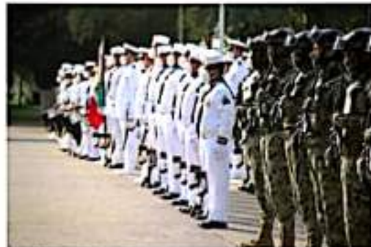
CD. LÁZARO CÁRDENAS, MICH.- La Décima Zona Naval convoca a hombres y mujeres a formar parte de las filas de la Secretaría de Marina como Infantes de Marina.