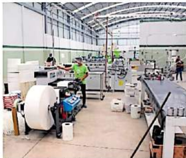
La inversión extranjera es insuficiente para detonar la economía

La Ciudad de México lidera la aportación al Producto Interno Bruto del país, con un 36.1%, mientras que en segundo lu-