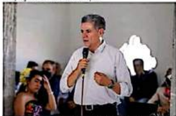
PRI, PAN, PRD y PES conformarán un equipo de trabajo que beneficia a los y