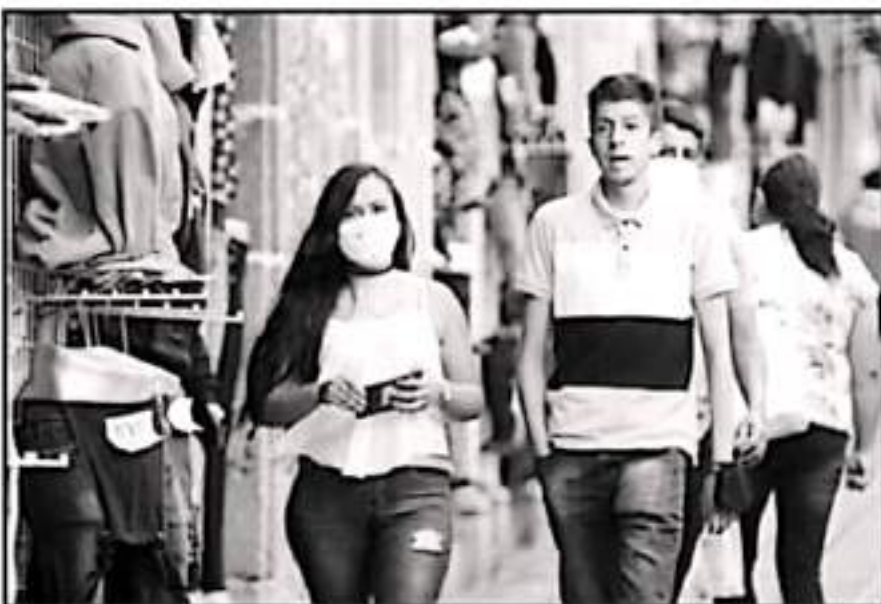
HAN RECORDADO A LAS PERSONAS REZAGADAS DE VACUNACIÓN ESTÁN AL PENDIENTE, PARA RECIBIR UNA O LAS DOS DOSIS.

La autoridad ha recordado también a todas las personas rezagadas de vacunación estar al pendiente, ya sea para una o las dos dosis faltantes, pues la idea es atender y completar sus respectivos cuadros. A destacar que, debido principalmente a problemas logísticos y las limitantes que la misma autoridad impuso a la estrategia de inmunización, alrededor de 300 mil michoacanos con el deseo de vacunarse no pudieron hacerlo no completaron su esquema.