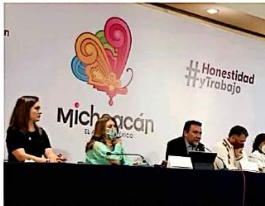
MORELIA, MICH.- El slogan "El Alma de México" volverá a hacer uso para identificar a Michoacán.

En entrevista, se dijo sorprendido de la convocatoria formal como representante del Sueum por parte de Rectoría, para acudir a la ceremonia de aniversario, luego de que por un año nueve meses no hubo ningún tipo de comunicación, por tanto, esta fue rechazada.