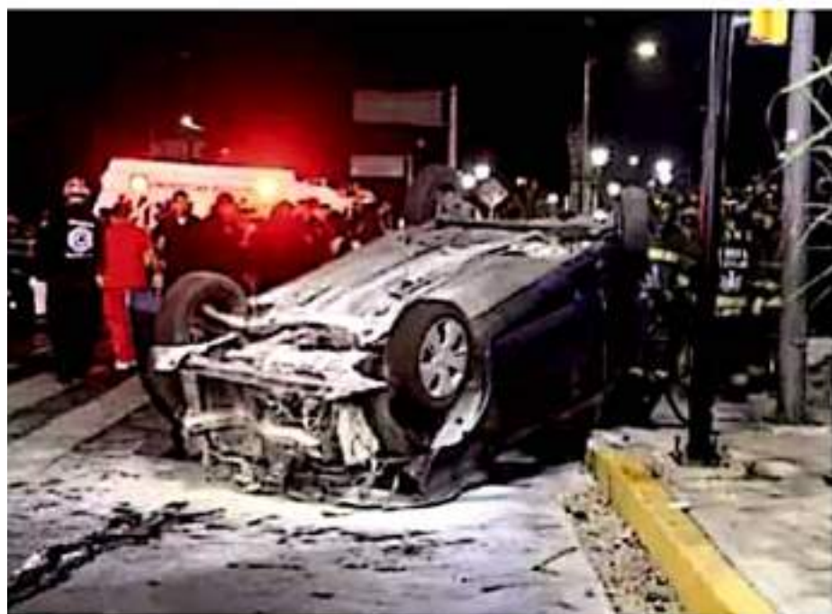
Norma. ONG piden la actualización de la NOM-194 para fortalecer la seguridad.