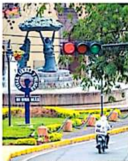
Hay problemas con refacciones, accidentes viales y robo de cables y tableros.

"Tenemos que repararlo, pero es un equipo electrónico grande y la persona que lo descompuso no va a pagar por que no tiene seguro", dijo. Además, indi-