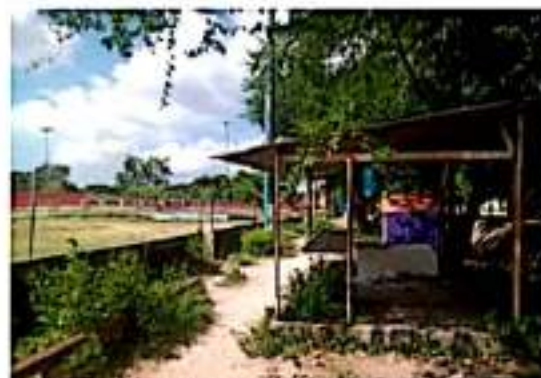
CD. LÁZARO CÁRDENAS, MICH.- Campos y espacios deportivos de la tenencia de Las Guacamayas se encuentran en malas condiciones ante el relajamiento de actividades por el Covid-19.

Por lo anterior, destaca, exhortarán a los amigos y comerciantes para solicitar pintura y otros insumos que se requieran para el mantenimiento intensivo de los campos y espacios deportivos, porque la nueva normalidad exige crear condiciones para que la gente pueda regresar a su vida cotidiana, pero en condiciones dignas y atendiendo a las medidas emitidas por las autoridades de Salud.