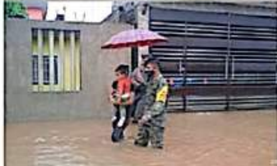
Personal del 82BI siempre dispuestos a apoyar a la población civil en casos de desastres, como lo fue en zonas inundadas por las lluvias de tormentas y huracanes, en que acudieron a comunidades de Arteaga y Lázaro Cárdenas, en auxilio de las personas damnificadas.