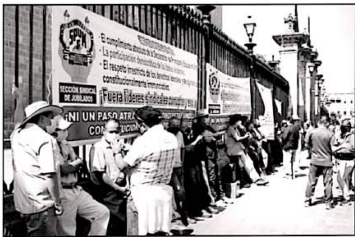
LA DIVISIÓN DEL SINDICATO DE PROFESORES TAMBIÉN HA DERIVADO EN UN GUERRA QUE HA PROTESTADO RECIENTES DESEMPEÑOS DE LA JUNTA LOCAL DE CONCILIACIÓN Y ARBITRAJE.