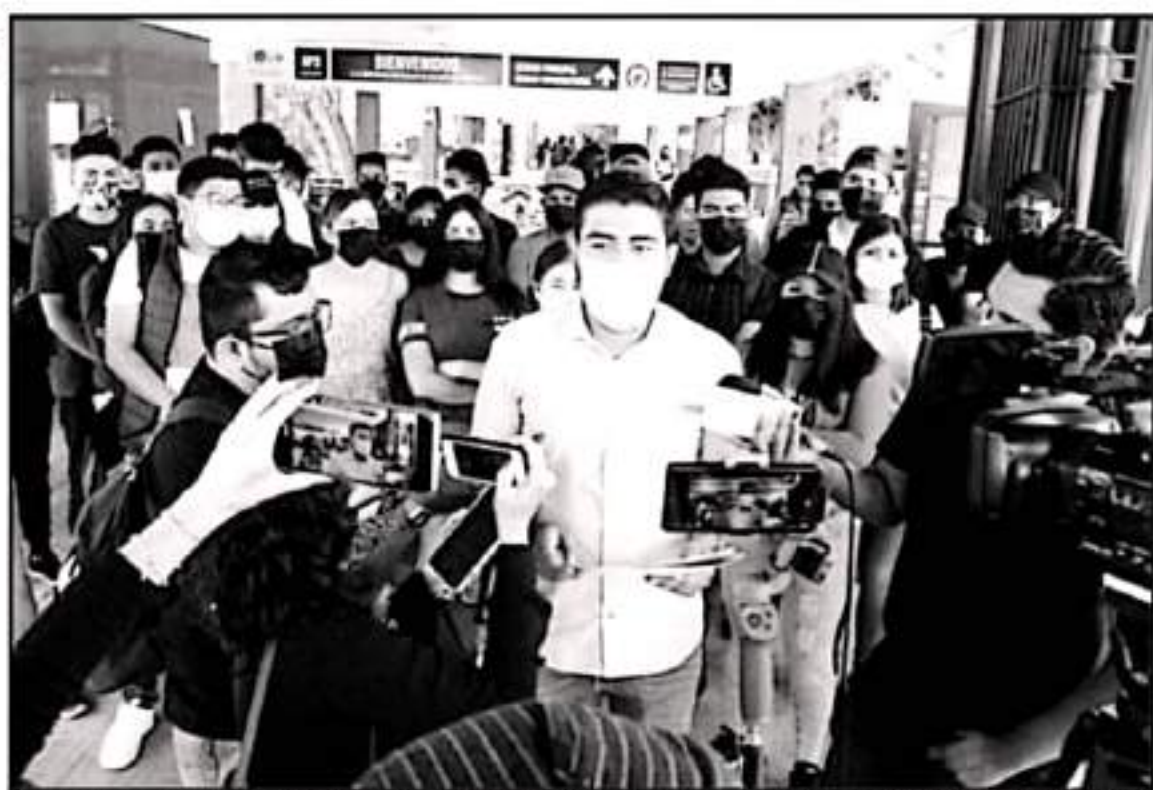
SEÑALACIÓN QUE ENTREGARÁN EL DOCUMENTO EN LAS OFICINAS DEL GOBIERNO DEL ESTADO PIDIENDO LA INTERVENCIÓN PARA RECUPERAR EL ALBERGUE NICOLAITA.

Agregó que las denuncias presentadas por las lesiones y ataques que sufrieron por integrantes del FNLS es algo que ya está tramitado, recordando que en la última incursión de este grupo en el espacio universitario fueron golpeados y lesionados, mientras que también retuvieron contra su voluntad al