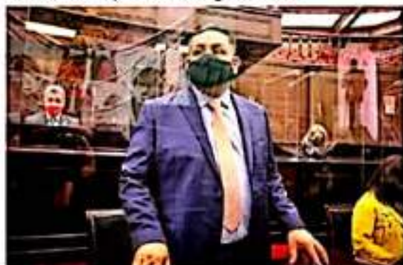
Vemos cómo el modelo autoritario que se ha venido instalado en el Ejecutivo Federal, pretende replicarse en las entidades federativas con el modelo de súper gobernadores: Víctor Manríquez.

Reforma enviada por el presidente AMLO al Congreso de la Unión el pasado 30 de septiembre, entre sus propósitos tiene la eliminación de los contratos legados, que son acuerdos con subsidiarias y entre éstas, para aprovechar los subsidios.