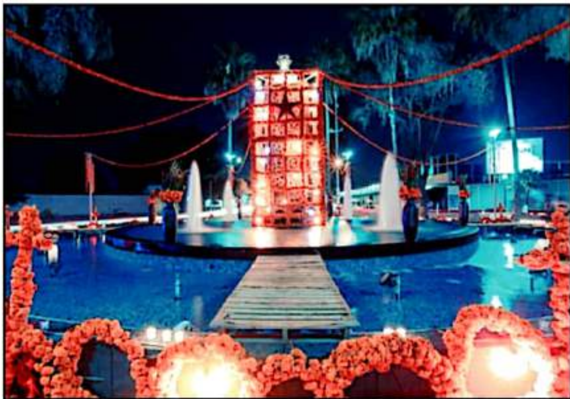
ES ESTA OCASIÓN LA DIFUSIÓN SERÁ SOLO REGIONAL, PUES POR EL MOMENTO LAS RESTRICCIONES SANITARIAS OBLIGAN A LA PRESENCIA PARA VISITAR COMARCAS.

En el caso concreto del Festival de Velas 2021, serán actividades que se realizarán del 29 del presente a 1 de noviembre próximo, periodo en que grupos de danza y teatro, tanto de la Casa de la Cultura, así como de grupos organizados de la sociedad civil, realizarán algunas presentaciones en diversos esce-