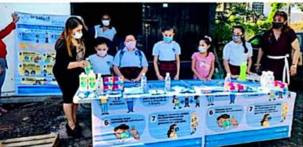
CD. LÁZARO CÁRDENAS, MICH.- Protegen a escuelas del Covid-19 con entrega de insumos sanitarios.

■ Entregan insumos sanitarios en 174 planteles de la Zona Escolar 271