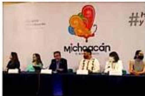
Sectur. El secretario de Turismo estatal aseguró que con esta marca se sienten más identificados los michoacanos.

choacán, el alma de México” se creó en 2012, con una inversión de 50 mil pesos, por lo que ahora no tendrá un costo extra, ya que se tiene registrada ante el IMPIF y se retiraron los derechos, que expiraban el año pasado en dicha institución.