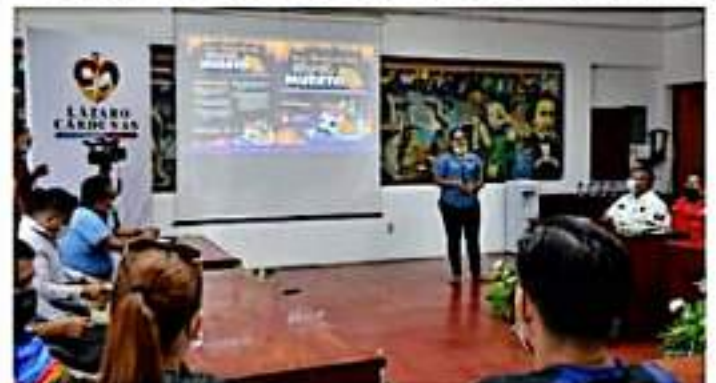
CD. LÁZARO CÁRDENAS, MICH.- El Gobierno Municipal a través de la Coordinación de Imagen, Protocolo y Logística, dio a conocer las actividades que formarán parte del Festival Cultural del Día de Muertos 2021, que se realizará del 31 de octubre al 02 de noviembre.

Se realizará del 31 de octubre del 2 de noviembre