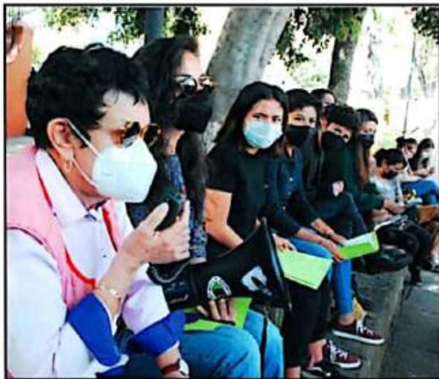
EXIGEN EN EL CUMPLIMIENTO DE LA PARIDAD DE GÉNERO Y POLÍTICAS QUE FORTALEZCAN EL DESARROLLO DE LAS MUJERES