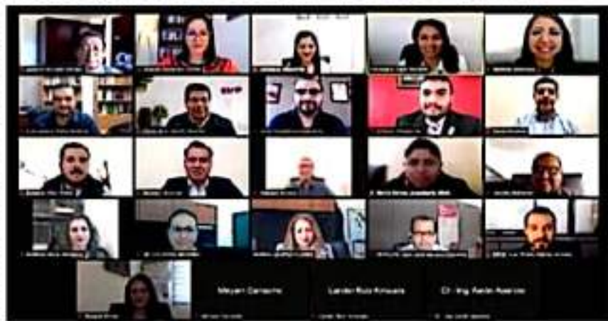
Las representaciones de los partidos políticos ante el IEM hablaron de un congreso de Proceso Electoral en medio de la pandemia, registro de candidaturas, redes sociales y otros temas.

Asimismo, compartieron para cumplir con los protocolos sanitarios en el ingreso a las insta-