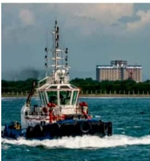
CD. LÁZARO CÁRDENAS, MICH.- Tras iniciar operaciones en enero de 2017, la empresa de remolcadores Mextug conmemora su quinto aniversario en el Puerto Lázaro Cárdenas.

Fabricados en China y bajo bandera mexicana, se encuentra el Mextug Duero con un tonelaje de registro grueso de 449 toneladas y 70 de tiro (BollardPull) y 3,364 HP, el Mextug Lerma y el Mextug Balsas tienen 339 toneladas de registro grueso y 62 de tiro, con 4,500 HP ambos navíos.