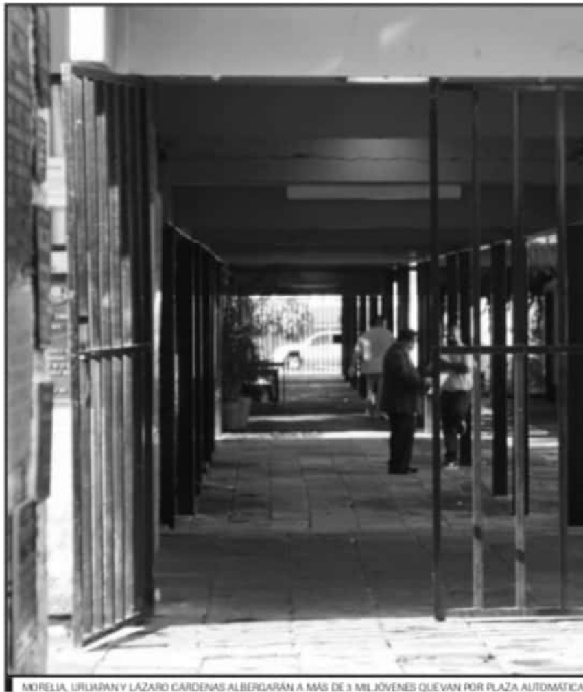
MORELIA, URUAPAN Y LAZARO CÁRDENAS ALBERGARÁN A MÁS DE 3 MIL JÓVENES QUE VAN POR PLAZA AUTOMÁTICA.

De acuerdo a los datos de la SEE, en el desglose de fichas emitidas por plantel, el Centro de Actualización del Magisterio de Michoacán registró 110 fichas, para las Normales de Arteaga se