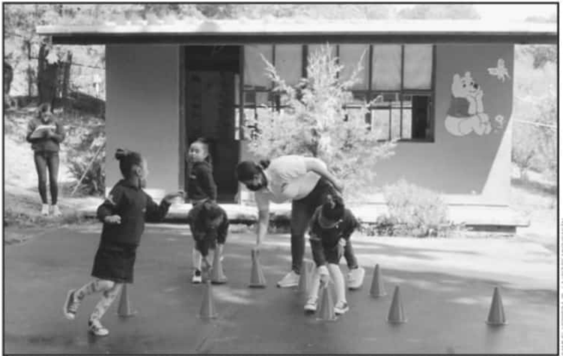
LOS MAESTROS DEL CONAFE EN ALGUNAS COMUNIDADES SI PUEDIERON DAR CLASES PRESENCIALES ANTE LA BAJA CANTIDAD DE ALUMNOS QUE ATIENDEN.

Explicó que en preescolar se atendieron a tres mil 280 niños que pasaron a primaria y en el caso de secundarias egresaron 820 niños, asimismo la expectativa es lograr atender más de 21 mil 300 estudiantes.