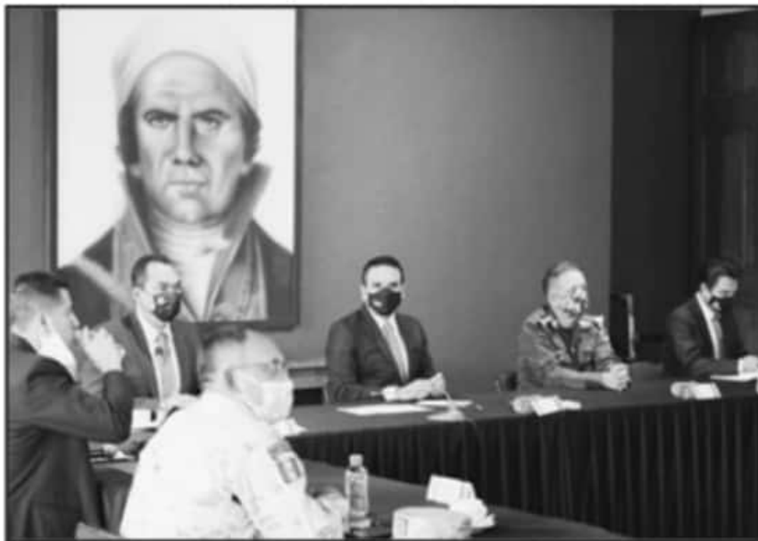
EL GOBERNADOR INSISTIÓ EN QUE ESTÁN LISTOS PARA COORDINAR CON EL GOBIERNO CENTRAL MATERIA DE SEGURIDAD.

No obstante, las cifras e índices de inseguridad siguen creciendo en todas las regiones del estado y principalmente en los municipios enclavados en la región de Tierra caliente y los límites con Jalisco. "Si no tomamos medidas ahora esto va a acabar muy mal. En el mismo periodo de Calderón hubo 30 mil asesinatos, en el mismo tramo de este gobierno van 90 mil. Significa que las becas no resuelven la problemática", concluyó el mandatario.