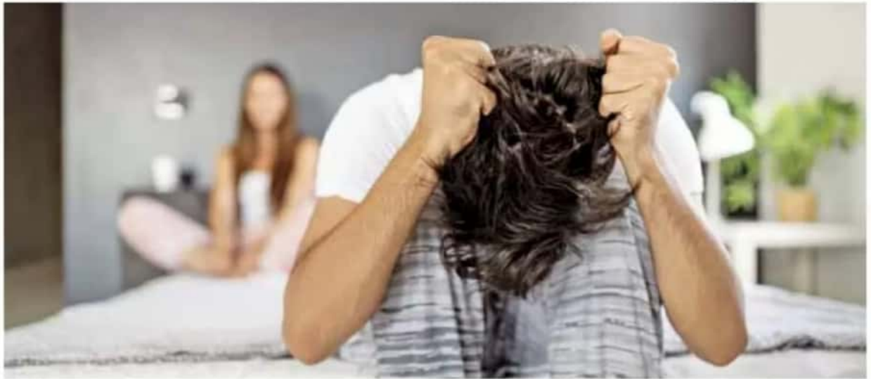
Encierro. Las ETS se dispararon en medio del confinamiento por la crisis sanitaria.

Cuidados. La gente ha descuidado el uso de anticonceptivos de barrera y de los métodos de protección, alertó una especialista