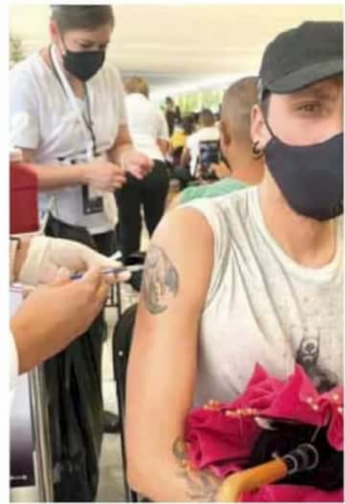
Covid-19. La vacunación de personas de 30-39 años continuará en Morelia hasta el viernes en el Polifórum y CU.

LA CLAVE Continúa la vacunación en el estado En Michoacán se encuentran activos 31 puestos de vacunación anti-Covid-19 para la inmunización de personas de 30 a 39 años de edad. Hasta ayer se habían aplicado 53 mil 465 dosis. Del biológico Sinovac suman 19 mil 429, de CanSino, 18 mil 504, y de AstraZeneca, 15 mil 532, en beneficio de habitantes de 41 municipios. Además, en los municipios de Apatzingán, La Piedad, Lázaro Cárdenas, Zamora y Zitácuaro se aplica la segunda dosis de Pfizer a personas de entre 40 y 49 años de edad.