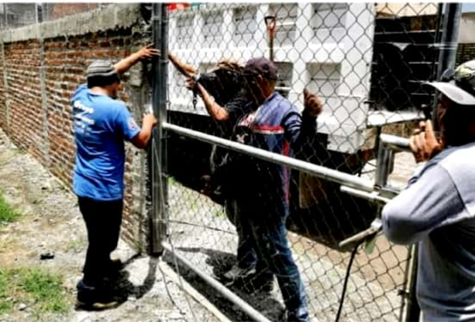
ZAMORA, MICH.- La obra comprendió la edificación de aproximadamente 71 metros lineales de la barda perimetral del inmueble.

También se colocó un portón de malla ciclónica para permitir el acceso de vehículos a la parte posterior del recinto, donde cotidianamente se efectúan dinámicas y sesiones de integración entre los agremiados del magisterio zamorano.