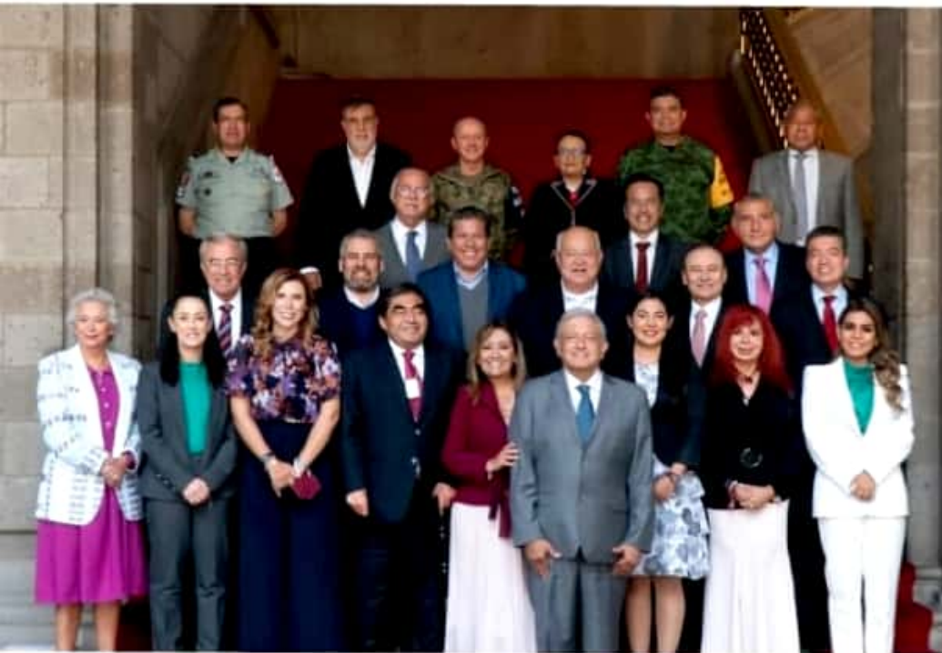
CIUDAD DE MÉXICO.- El gobernador electo de Michoacán, Alfredo Ramírez Bedolla, al igual que 15 gobernadores de Morena, en funciones y electos, participó en una reunión con el presidente, Andrés Manuel López Obrador, e integrantes del gabinete federal.

"Se evidencia su desesperación por legitimar en una rueda de prensa lo que no pudieron hacer en las urnas, el 'Equipo por Michoacán', siguiendo las instancias legales y ante las autoridades jurisdiccionales electorales que son las competentes para determinarlo, buscamos dar la certeza que se merece la población, sin argumentos genéricos y falaces, por el contrario, con datos precisos y contundentes". Los abogados de la triple alianza aseguraron que no permitirán que Michoacán sea rehén de prácticas antidemocráticas, en el que grupos del crimen organizado intenten venir para favorecer a un candidato.