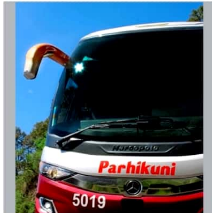
CD. LÁZARO CÁRDENAS, MICH.- La Empresa Autobuses Destinos Parhíkuni tomó la decisión de suspender sus servicios a Buenavista, Apatzingán Tepalcatepec

Desde hace algunos días, en esa región se han registrado constantes enfrentamientos armados, bloqueos carreteros, retención de vehículos y robo de los mismos sobre las vías de comunicación.