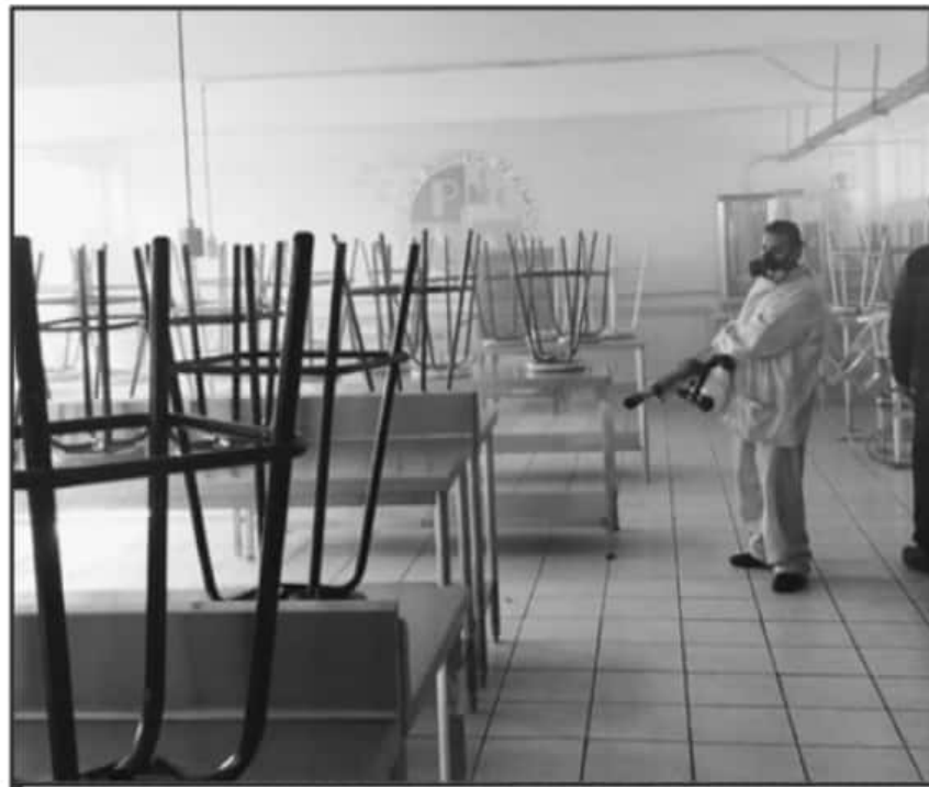
ESTE MIÉRCOLES FUMIGARON EL PLANTEL PURÉPERO; ALISTA EL COLEGIO REGRESO PRESENCIAL A LAS AULAS.

Debemos reforzar las medidas de higiene y cuidar a nuestros jóvenes por el incremento de casos positivos por COVID-19 y la confirmación de contagios con la nueva variante Delta, esto nos obliga a volver más eficientes las me-