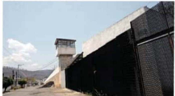
Las instalaciones del antiguo Cereso, otro de los inmuebles involucrados / NAIAN ARIAS

"Observamos muchas deficiencias en la iniciativa, no contiene la motivación ni la fundamentación suficiente para que se dictamine a favor, los avalúos están por abajo de su precio real. La Comisión de Hacienda no convocó a reunión a la Comisión de Desarrollo ni tampoco quien preside la misma comisión ha lanzado la invitación para realizar las inspecciones que se requieren por ley. Además, las iniciativas no dejan claro el destino del mon-