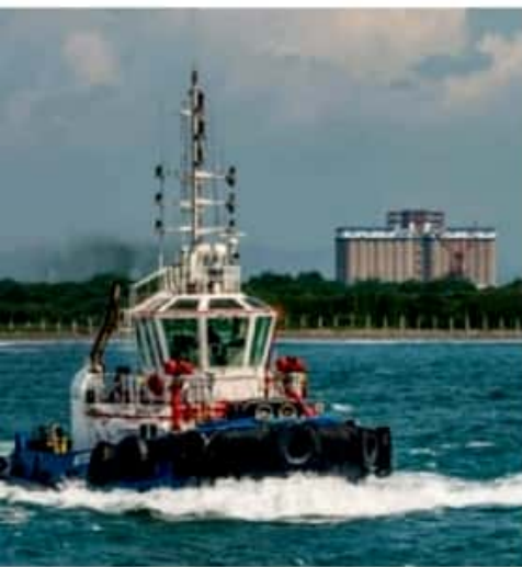
CD. LÁZARO CÁRDENAS, MICH.- Tras iniciar operaciones en enero de 2017, la empresa de remolcadores Mextug, conmemora su quinto aniversario en el Puerto Lázaro Cárdenas.

Fabricados en China y bajo bandera mexicana, se encuentra el Mextug Duero con un tonelaje de registro grueso de 449 toneladas y 70 de tiro (BoliardPuli) y 5,364 HP, el Mextug Lerma y el Mextug Balsas tienen 339 toneladas de registro grueso y 62 de tiro, con 4,500 HP ambos navíos.