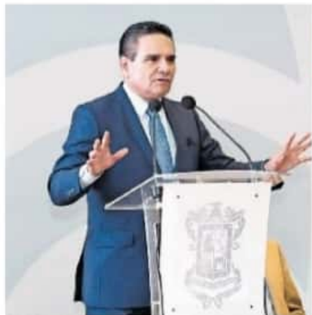
El mandatario acudirá a California, Chicago y Washington

Al no haber respuesta oficial respecto al eventual retiro de militares, los organizadores del plantón advirtieron que no habría diálogo, razón por la que no pudo concretarse la mesa de trabajo sobre los temas de seguridad y transitabilidad.