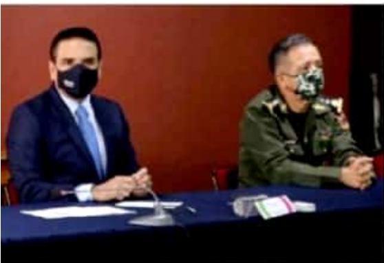
MORELIA, MICH.- En entrevista, el gobernador del estado, Silvano Aureoles Conejo, señaló que lo que se requiere en Aguililla es mayor seguridad.

En Michoacán no hay autodefensas, son grupos delincuenciales