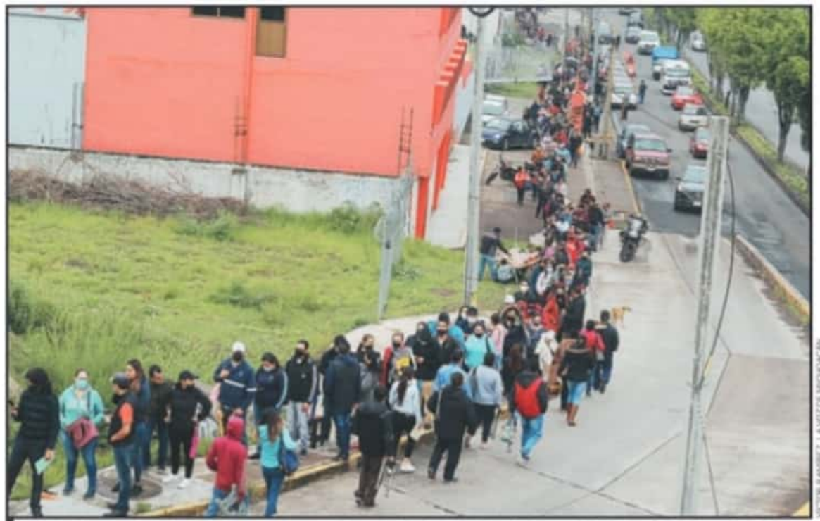
DATOS REFLEJAN QUE LA CAPITAL MICHOACANA ES EL MUNICIPIO QUE HA TENIDO MAYOR APLICACIÓN DE DOSIS PARA POBLACIÓN DE 30 A 39 AÑOS DE EDAD.

En el segundo día de inmunización en la capital michoacana se volvió a registrar una alta respuesta de los mayores de 30 años, en tanto que las autoridades han anunciado que se gestionarían más dosis del biológico si éste se terminara a temprana hora de la jornada, así como tampoco se descarta ampliar los días de aplicación originalmente fijados hasta este viernes 16 de julio.