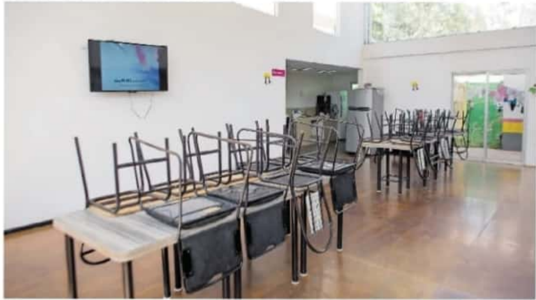
El albergue del Hospital Infantil fue uno de los primeros bienes desincorporados

DETECTAN IRREGULARIDADES DE PROCEDIMIENTO