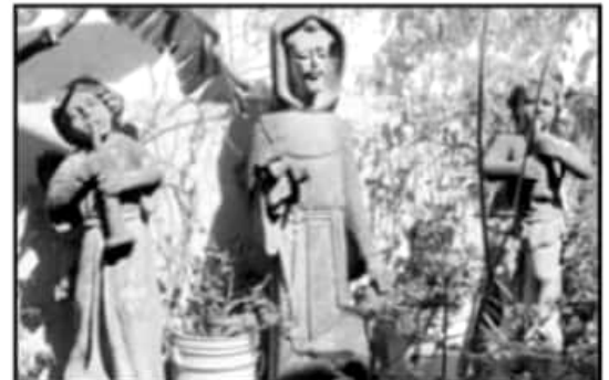
SU OBRA FUE DE LAS PRIMERAS EN INCLUIR EL REUSO DE MATERIALES