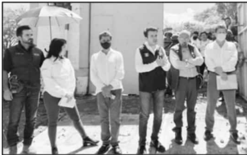
LOS REPRESENTANTES FEDERALES LLEGARON A LA CABECERA MUNICIPAL A LA HORA SOLICITADA POR LA COMUNIDAD.

También se les pedía mantener vigilancia para impedir que nuevamente se cortaran los servicios de telecomunicación y energía en la región, pero la Federación no aceptó que los uniformados salieran del cuartel.