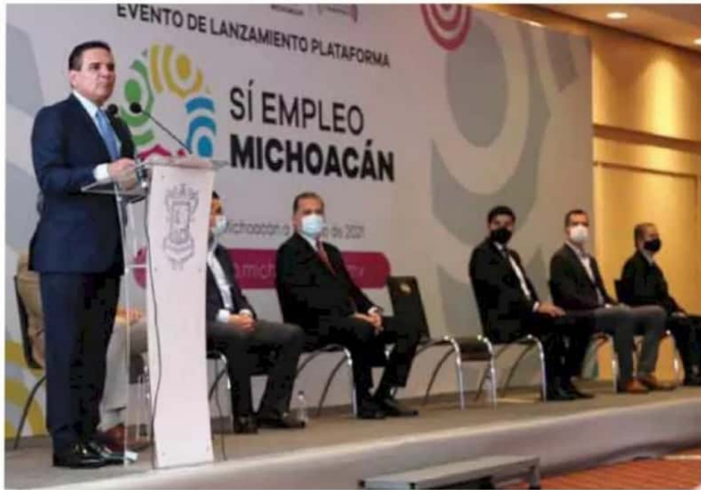
Innovación. Con la plataforma se podrán agilizar procesos y usar la información para tener mejores perfiles en el empleo.