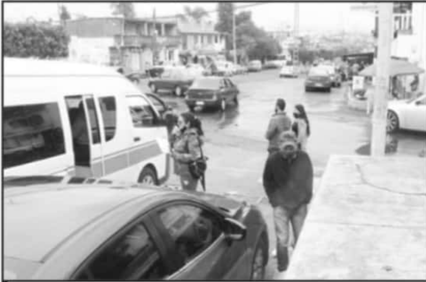
LA PREOCUPACIÓN DE INFECCIONES POR LAS NUEVAS VARIANTES HA ENCENDIDO LAS ALARMAS YA EN LA SSM.

Ante el escenario, el Ayuntamiento de Morelia ha reconocido que se encuentra ya en reuniones con el Comité de Se-