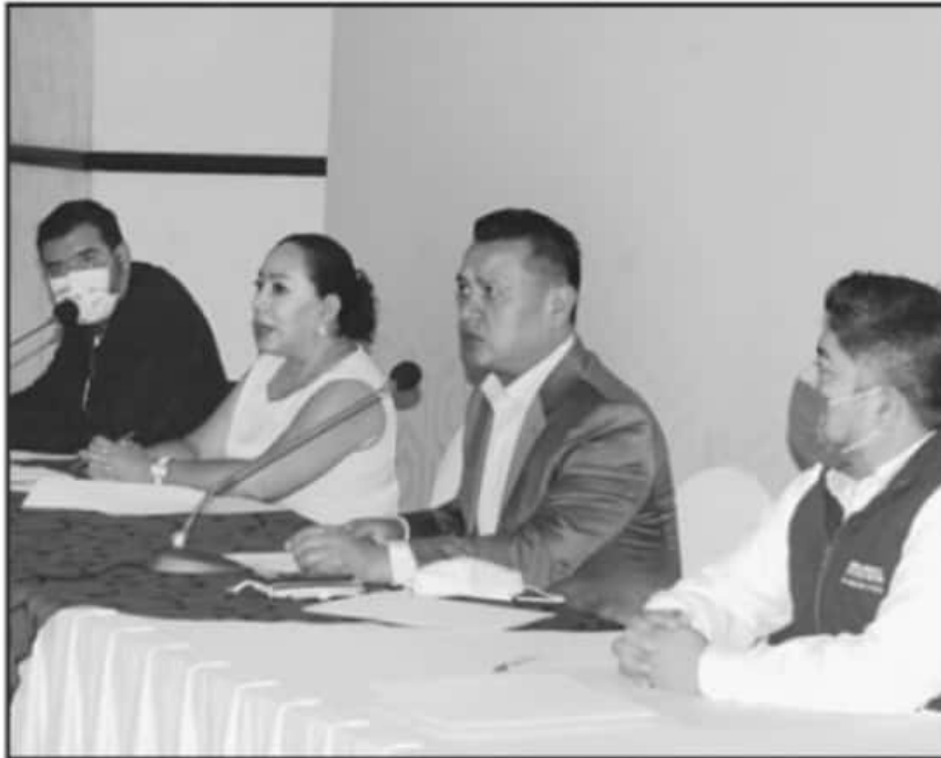
SE DESTACÓ QUE HASTA EL MOMENTO NO SE HA PROBADO NINGUNA DE LAS CUATRO CAUSALES EN LA INCONFORMIDAD.

Lo anterior, explicó, es evidencia de que los institutos políticos no estuvieron atentos y nos informaron respecto a los procesos legales a los cuales