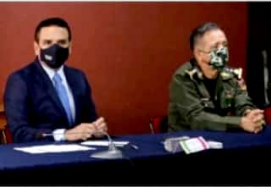
MORELIA, MICH.- En entrevista, el gobernador del estado, Silvano Aureoles Conejo, señaló que lo que se requiere en Aguililla es mayor seguridad.

En Michoacán no hay autodefensas, son grupos delincuenciales