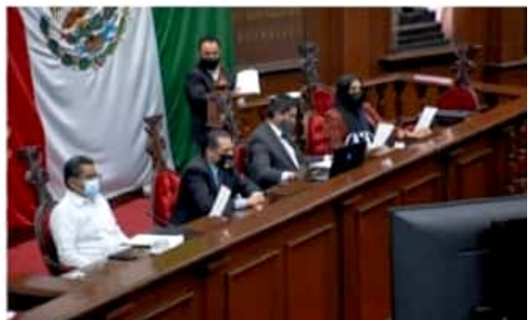
MORELIA, MICH.- El Congreso estatal aprobó el exhorto a los gobiernos estatal y federal para que restablezcan de manera inmediata las vialidades y carreteras de acceso a los municipios de Aguililla y Buenavista.