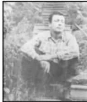
UNA FOTOGRAFÍA EN SU JUVENTUD