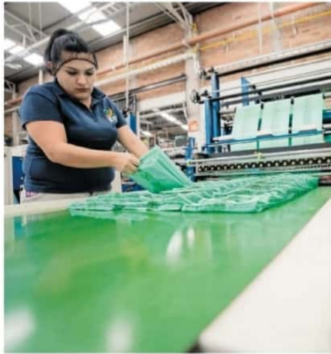
El tránsito a la formalidad es uno de los mayores objetivos