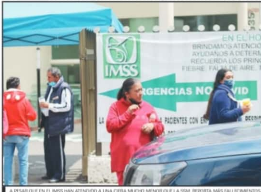
A PESAR QUE EN EL IMSS HAN ATENDIDO A UNA CIFRA MUCHO MENOR QUE LA SSM, REPORTA MÁS FALLECIMIENTOS.

rían depender y ser proporcionales al número de pacientes atendidos por cada institución, las estadísticas reflejan que no es así. La SSM es la institución que más pacientes ha atendido llegando a un 66.7 por ciento de los casos, la sigue precisamente el IMSS con un 22.3 por ciento, el ISSSTE con un 5.9 por ciento, el IMSS Bienestar con un 2.3 por ciento, el sector privado con un 1.7 por ciento y la Semar con solo un 0.7 por ciento.