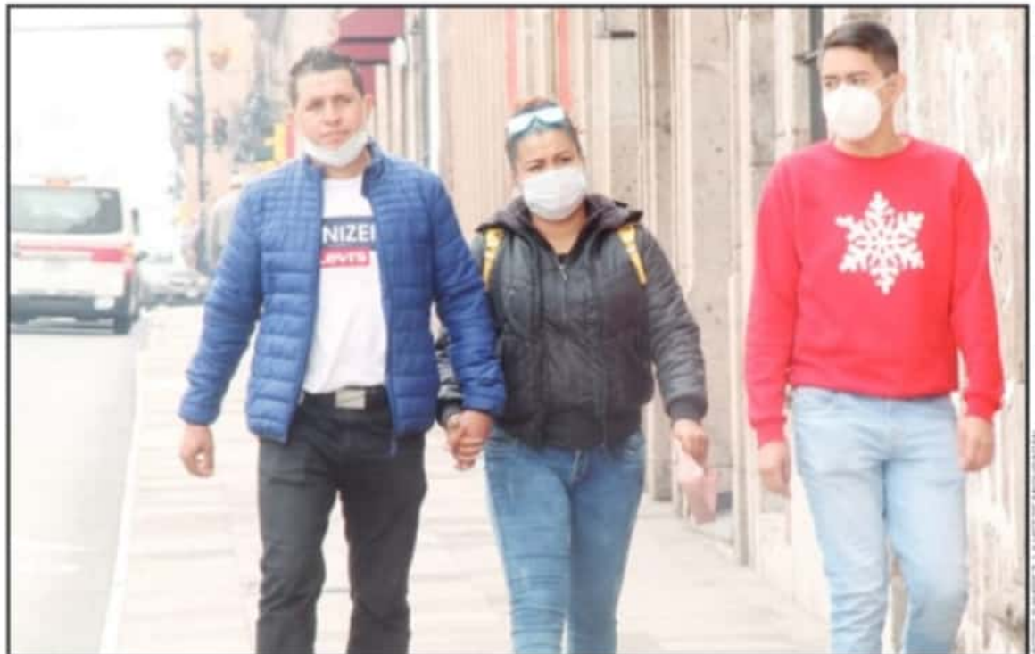
MÉDICOS AFIRMAN QUE UNA PERSONA INFECTADA CON LA CEPAS DELTA PUEDE INFECTAR DETRES A OCHO PERSONAS DE CADA DIEZ QUE TENGAN CONTACTO.

Tanto las autoridades del sector salud como el integrante de la Comemac coincidieron en que el riesgo de la variante Delta proveniente de La India es que se le considera más contagiosa, pues una persona infectada puede afectar a entre tres u