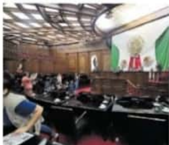
Congreso no acordó nada en torno al tema de Seguridad