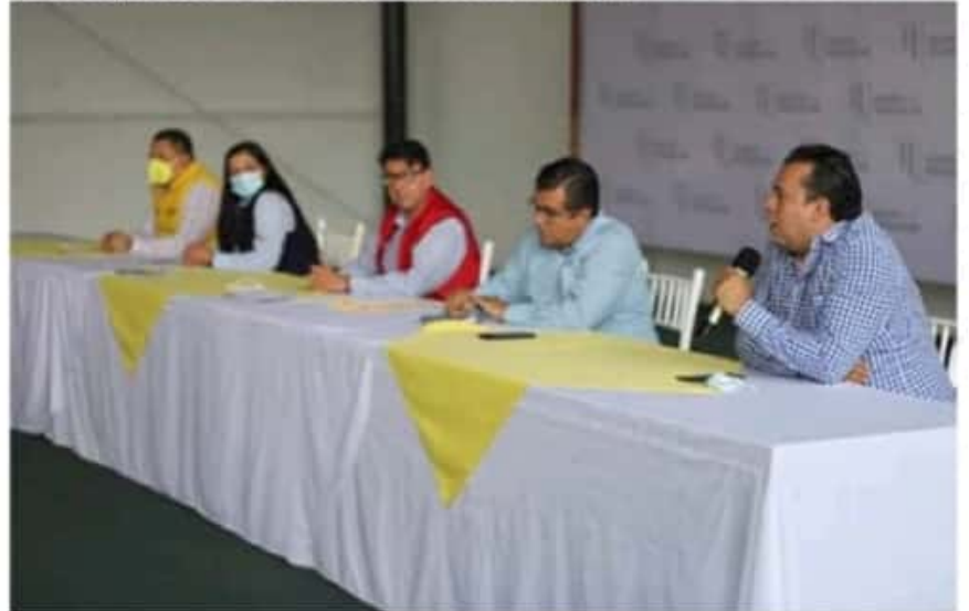
El grupo jurídico del Equipo por Michoacán denunció falta de claridad por parte de los representantes legales de Morena ante votación atípica en elección a Gobernador.

ciento de los sufragios y al contendiente más cercano con cero por ciento de votación, corresponde a que, en varias comunidades indígenas, no se permitió la instalación de las mismas, a lo que el Equipo por Michoacán aseguró, son argumentos por demás inverosímiles que denotan completa ignorancia de la situación.