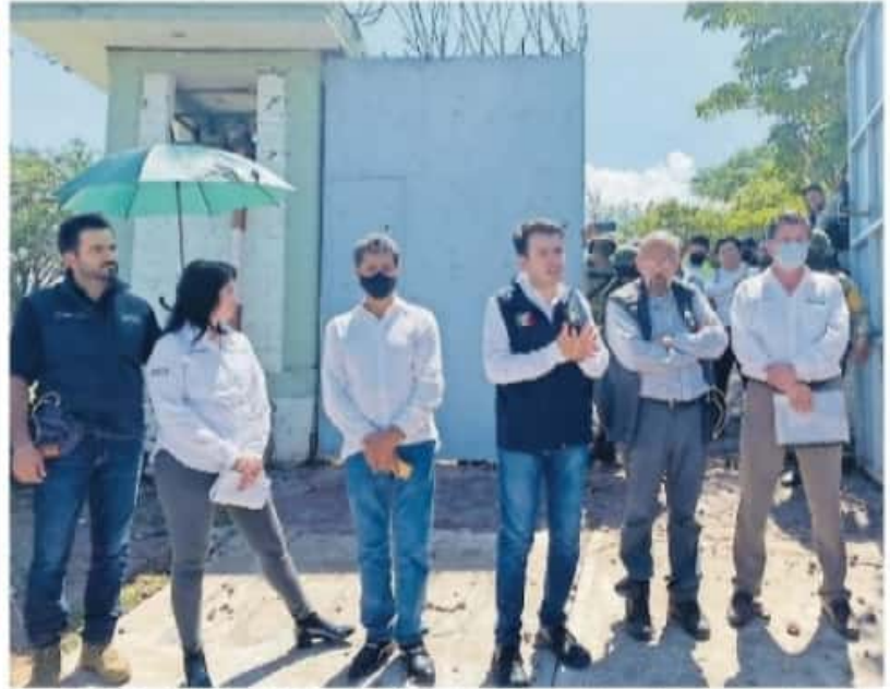
Representantes federales de Delegación Bienestar y Gobernación no dieron respuesta oficial, según pobladores

Yo le puse por escrito en la parte de abajo que si no había un ambiente favorable y no se cumplía lo que se pedía, posiblemente las reuniones no se llegarían a realizar"