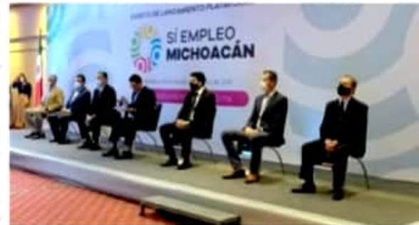
MORELIA, MICH.- Ayer se puso en marcha la Plataforma de Desarrollo Económico (PDE) denominada "Sí Empleo", que posiciona a Michoacán como el primer estado en implementar iniciativa nacional de mapeo con inteligencia artificial.

Con esto, Morelia se colocó por encima de otras capitales de México en el rubro, como Monterrey, Toluca, Puebla, La Paz, Chilpancingo, San Luis Potosí, Xalapa, Hermosillo, Oaxaca, Pachuca y Cuicuilán.