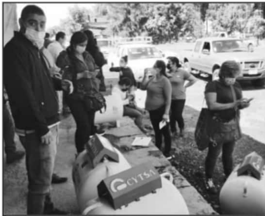
SE DIO QUE NO HABRÁ DIFUSIÓN EL TERCER Y ÚLTIMO INFORME DEL GOBIERNO MUNICIPAL DEL PRÓXIMO 30 DE JULIO.