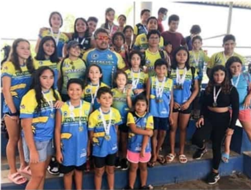
El equipo IMSS-Tintorerías sigue poniendo en alto el nombre de Lázaro Cárdenas.