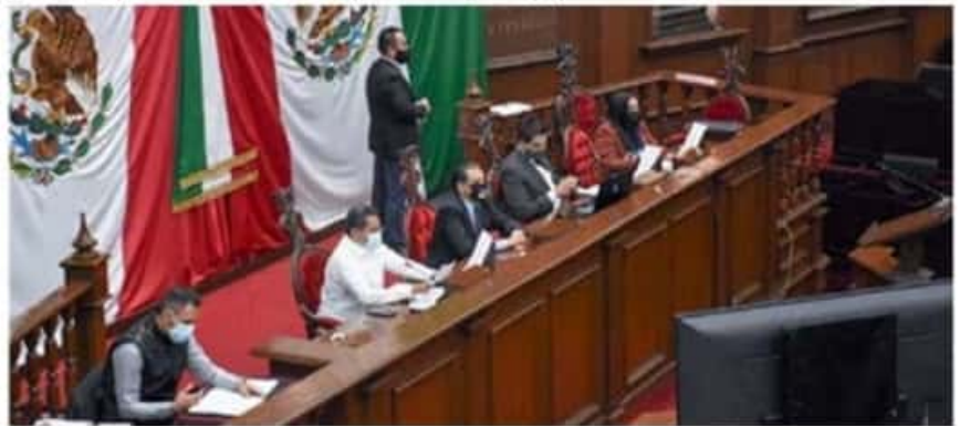
La reestructura es con la finalidad de atender las necesidades y el correcto desarrollo del trabajo legislativo.