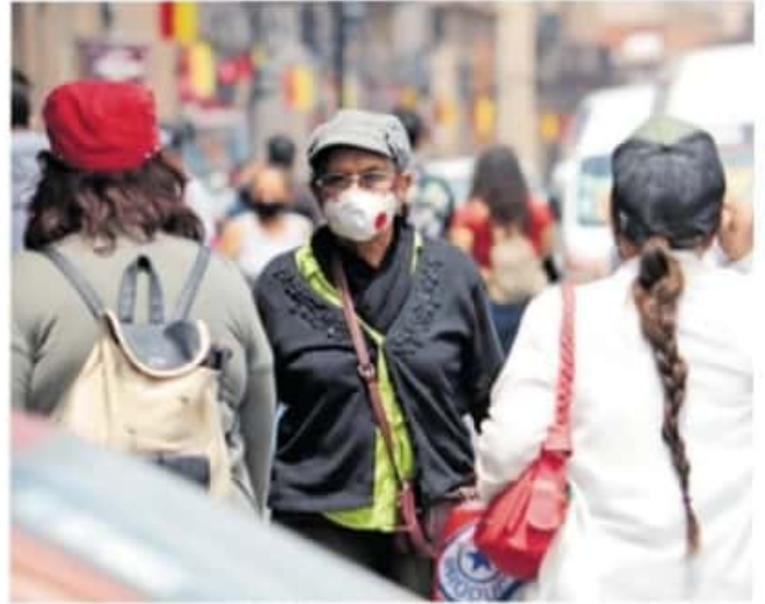
La dependencia alerta que la variante es altamente contagiosa

La primera acción hecha por la autoridad municipal fue cancelar la presenta-