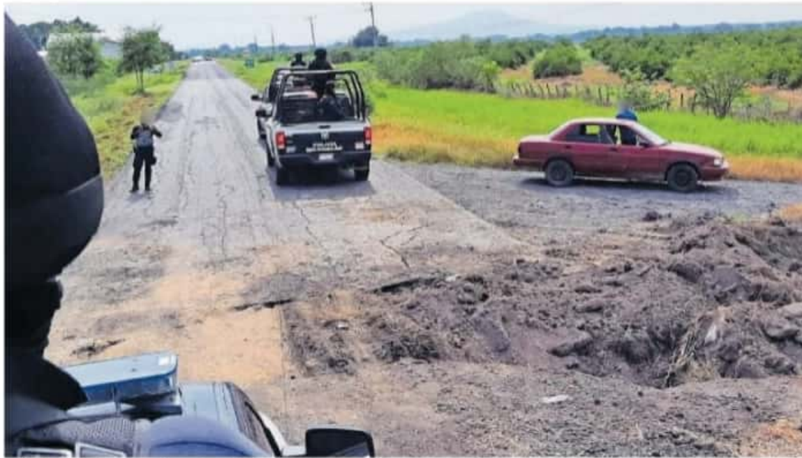
Pobladores de Aguililla y elementos del Ejército Mexicano se enfrentaron