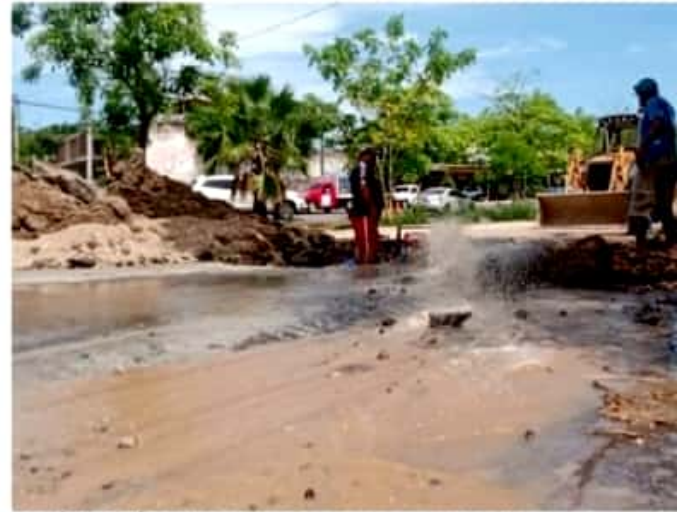
CD. LÁZARO CÁRDENAS, MICH.- Fuga de agua potable, origen de socavones en céntrica avenida de Lázaro Cárdenas.

Dijo que los trabajos deberían de concluir a la brevedad posible pues colonias como Pie de Casa, 600 Casas y Jarene carecen del vital líquido desde el pasado lunes, por ello el servicio se restablecerá una vez concluidos los trabajos de reparación de dicha fuga.