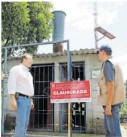
Este año suman ocho acusaciones

De los casi 500 infectados, 430 lograron recuperarse después de ser portadores del coronavirus, registrando un 89.21% de tasa de recuperación. Según lo informado por la Secretaría de Salud de Michoacán (SSM), no hay personas hospitalizadas en Zinapécuaro a causa de coronavirus hasta el pasado miércoles.