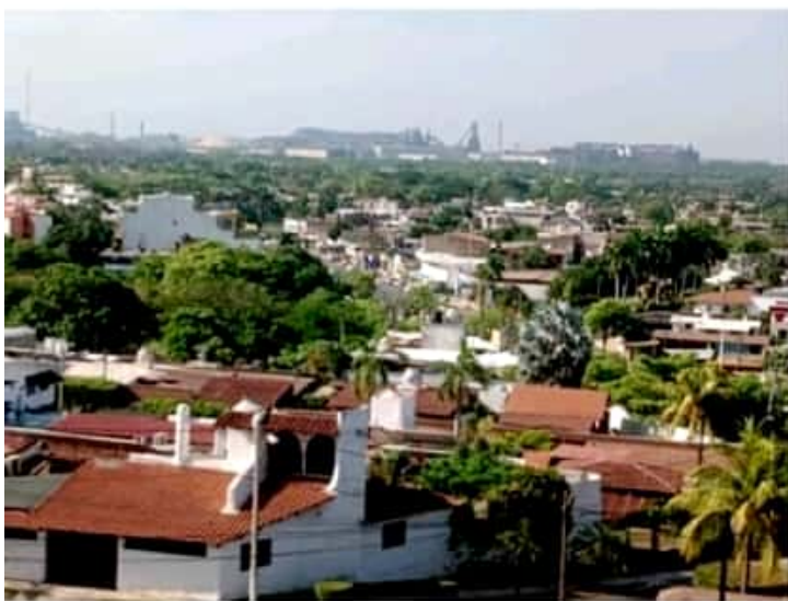
CD. LÁZARO CÁRDENAS, MICH.- El municipio de Lázaro Cárdenas registró 81 nuevos casos positivos de Covid-19 en tan solo 48 horas.