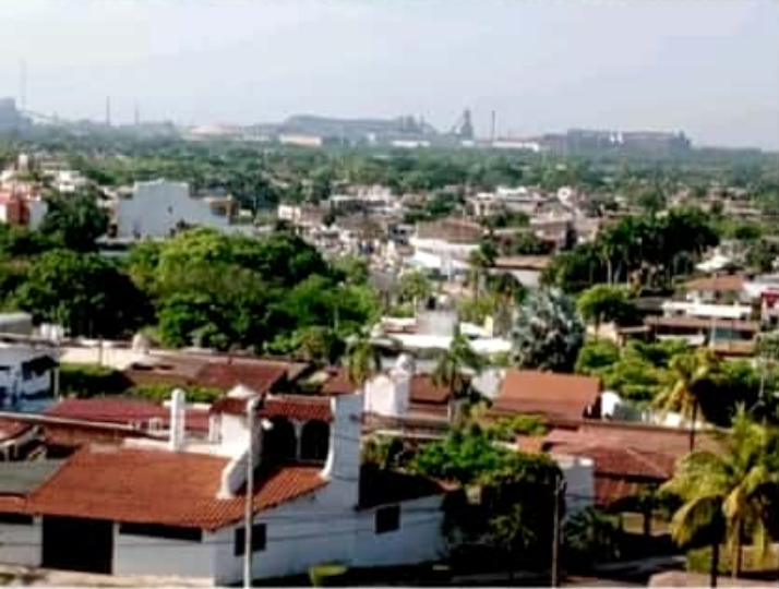
CD. LÁZARO CÁRDENAS, MICH.- El municipio de Lázaro Cárdenas registró 81 nuevos casos positivos de Covid-19 en tan solo 48 horas.