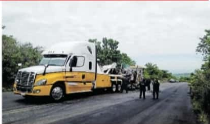
En Jacona sujetos atravesaron un tráiler para cerrar la circulación

"Además, en días pasados por la situación que hemos vivido en derredor que no tiene que ver directamente con nosotros,