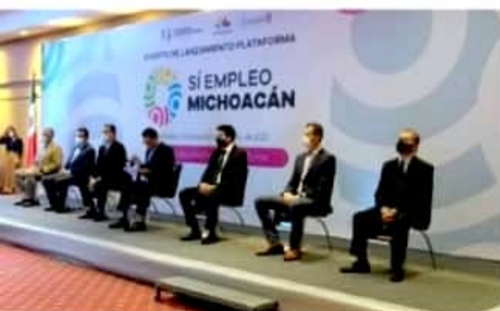
MORELIA, MICH.- Ayer se puso en marcha la Plataforma de Desarrollo Económico (PDE) denominada "Sí Empleo", que posiciona a Michoacán como el primer estado en implementar iniciativa na-