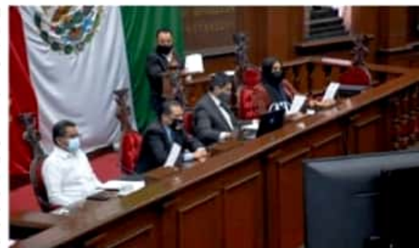
MORELIA, MICH.- El Congreso estatal aprobó el exhorto a los gobiernos estatal y federal para que restablezcan de manera inmediata las carreteras de acceso a los municipios de Aguililla y Buenavista.