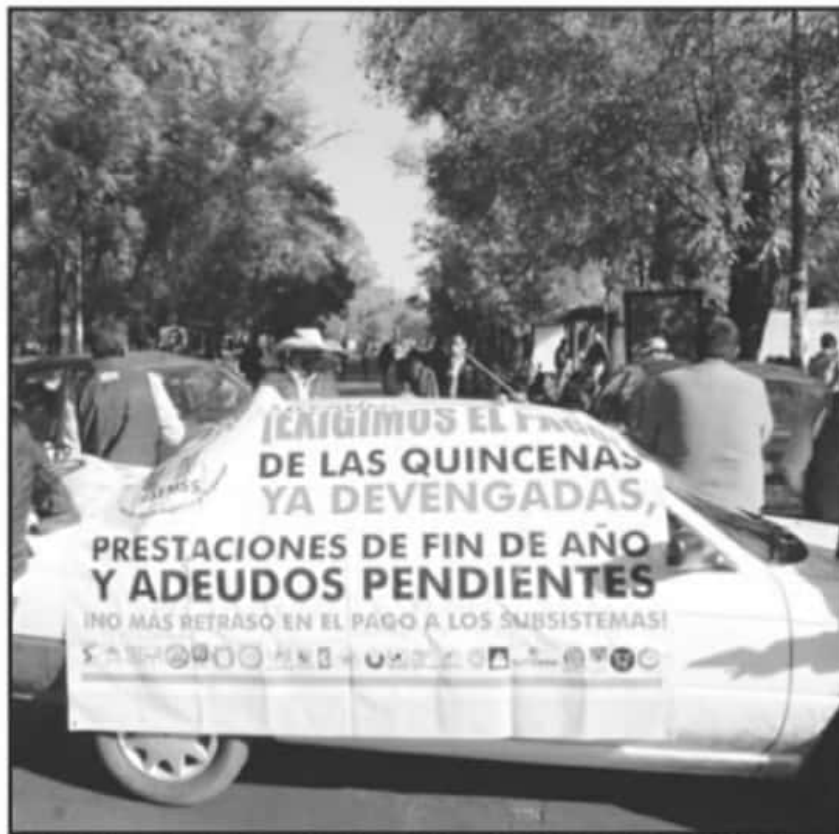
TRAS SEMANAS DE MOVILIZACIONES Y BLOQUEOS, YA SE COMENZÓ A CUBRIR LOS PAGOS A LOS SINDICATOS.

se avanzó en las mesas de trabajo con pagos a los tecnológicos regionales, con la Universidad Tecnológica de Morelia, Colegio de Bachilleres y el Instituto de Capacitación de Michoacán (Icatmi) en pagos pendientes y quincenas rezagadas, además de la que se completó el pasado 15 de diciembre.