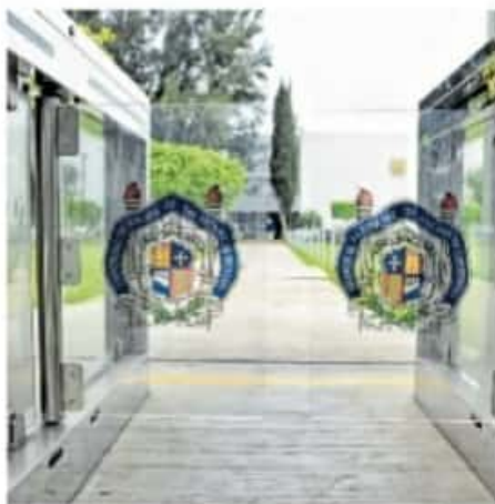
La Casa de Hidalgo está dentro de las 10 mejores Universidades a nivel nacional/CARMEN HERNÁNDEZ

El Consejo General de Huelga del SUEUM, acordó realizar plantón permanente frente al Colegio de San Nicolás a partir de hoy jueves 17 de diciembre.