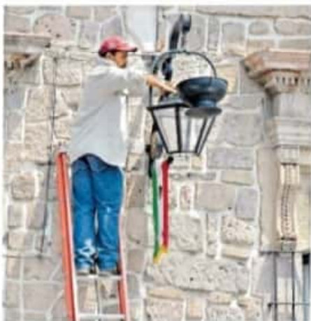
Lo que pagarían los morelianos son menos de 46 pesos bimestrales por el DAP

Los organismos políticos aquí expuestos aterrizaron su postura en manifestar su disposición a que la comunidad gay, lesbica y transexual pueda tener participación en la siguiente contienda electoral, con base en lo que ya está establecido constitucionalmente.