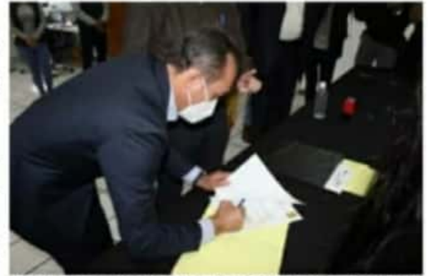
El diputado Antonio Soto Sánchez solicitó al Partido Revolucionario Institucional en Michoacán, ser considerado en su proceso interno para la definición de candidatos.

Hizo hincapié que el día en que la militancia de dichos partidos desee, puede acudir a presentar su propuesta, la cual es abierta a la sociedad para construir unidos, acciones afirmativas que atiendan y resuelvan los problemas que más aquejan a la población.