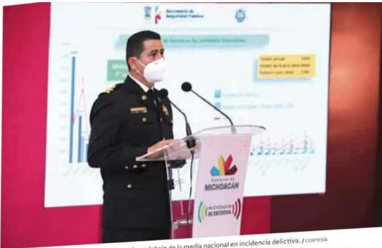
SSP. Autoridades aseguran que Michoacán está por debajo de la media nacional en incidencia delictiva.