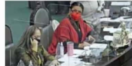
Meta. El objetivo es preservar la salud de los legisladores y trabajadores que laboran en San Lázaro.

Este monto sirvió para la aplicación de 21 mil 970 pruebas a legisladores y personal administrativo