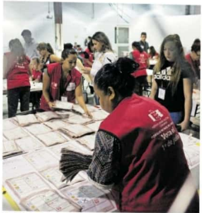
El estado fue el primero en avalar el voto de extranjeros en un proceso electoral local.

A pesar de que Michoacán es el tercer estado con más migrantes, el porcentaje