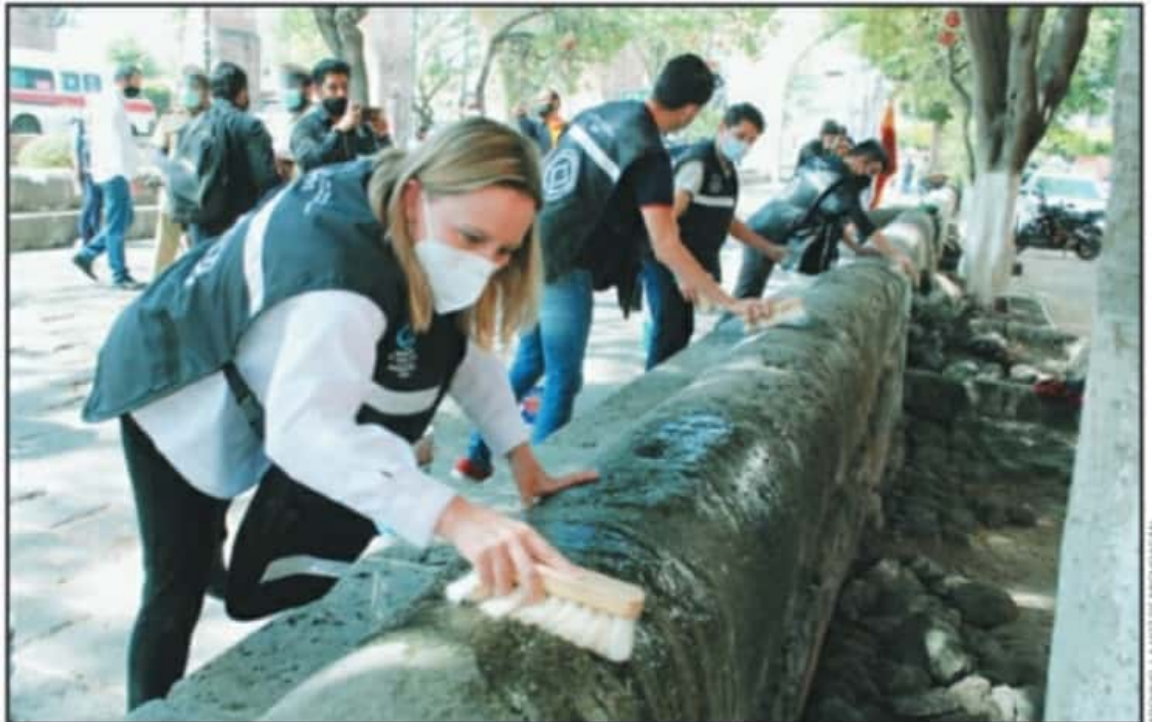
LA COORDINACIÓN DEL CENTRO HISTÓRICO RECIBIÓ UNA EXCELENTE RESPUESTA DE LOS JÓVENES, PARA LIMPIAR EL PATRIMONIO HISTÓRICO QUE SE HA DAÑADO.

"El espíritu de este programa es que sean ciudadanos que amen o que quieran acercarse al patrimonio. Hemos tenido tres o cuatro esquemas. En uno llegaron unos jovencitos