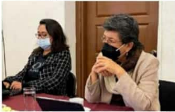
La diputada local Teresa López Hernández se reunió con el FIOCSSEM.

La diputada por el Distrito XXIV, Tere López Hernández, se reunió con el Frente Independiente de Organizaciones Campesinas Sociales y Sindicales del Estado de Michoacán (FIOCSSEM).