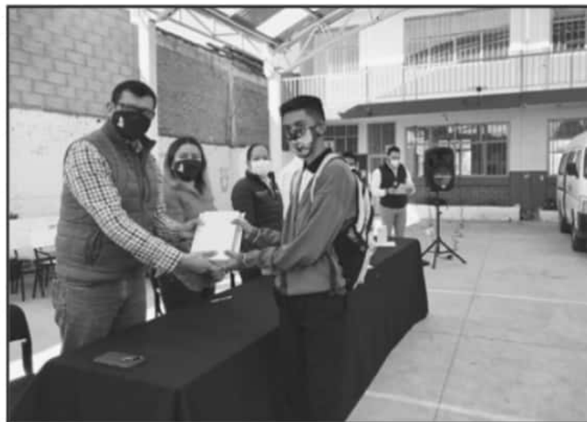
JÓVENES FUERON APOYADOS CON DISPOSITIVOS ELECTRÓNICOS PARA PODER CONTINUAR SUS ESTUDIOS A DISTANCIA.

mientas necesarias para dar seguimiento a su preparación.