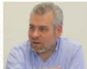
MORELIA, MICH.- El diputado Alfredo Ramírez Bedolla.

En razón de lo anterior, Ramírez Bedolla reiteró el llamado a los diputados de la LXXIV Legislatura a que aprueben la reforma constitucional que presentó con el propósito de que el recurso asignado a la Umsnh no puede ser menor al 6 por ciento del presupuesto total de egresos de Michoacán; "el déficit presupuestal no es un problema que vaya a desaparecer simplemente ignorándolo, tenemos que encontrar una solución estructural", concluyó.