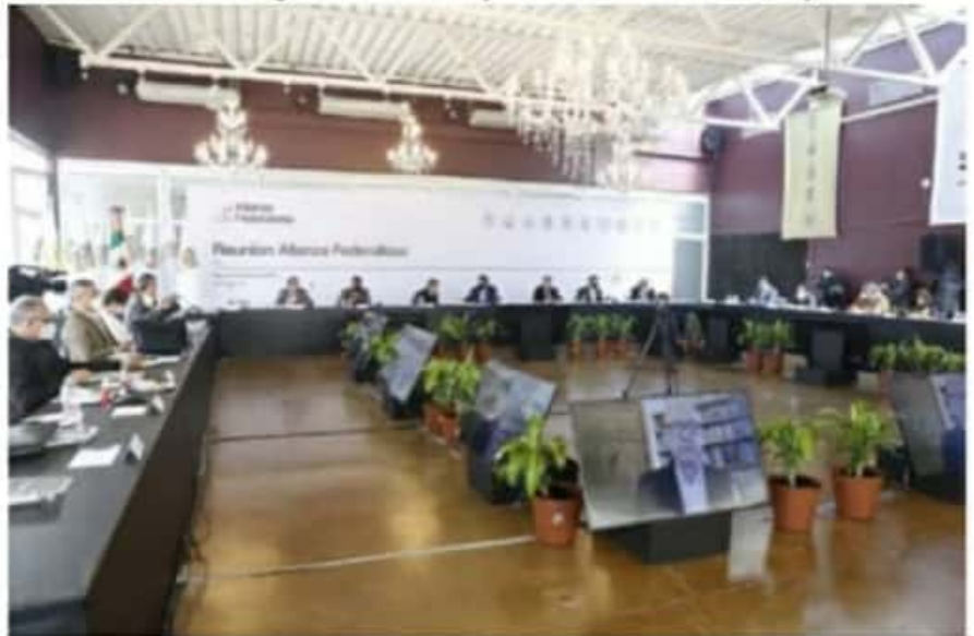
Gobernadores de la Alianza federalista, acuerdan unificar criterios para contener incremento de casos positivos de coronavirus durante periodo decembrina.

"Unificaremos criterios contundentes para implementar medidas posteriores al 25 de diciembre, que ayuden a contener repuntes en nuestros 10 Estados, esto de la mano y con el compromiso del sector productivo, para evitar lastimar nuestras economías locales, pero poniendo por delante el cuidado de la salud y la vida de los 40 millones de mexicanos y mexicanas que viven en nuestros Estados", aseguró el mandatario michoacano, Silvano Aureoles Conejo.