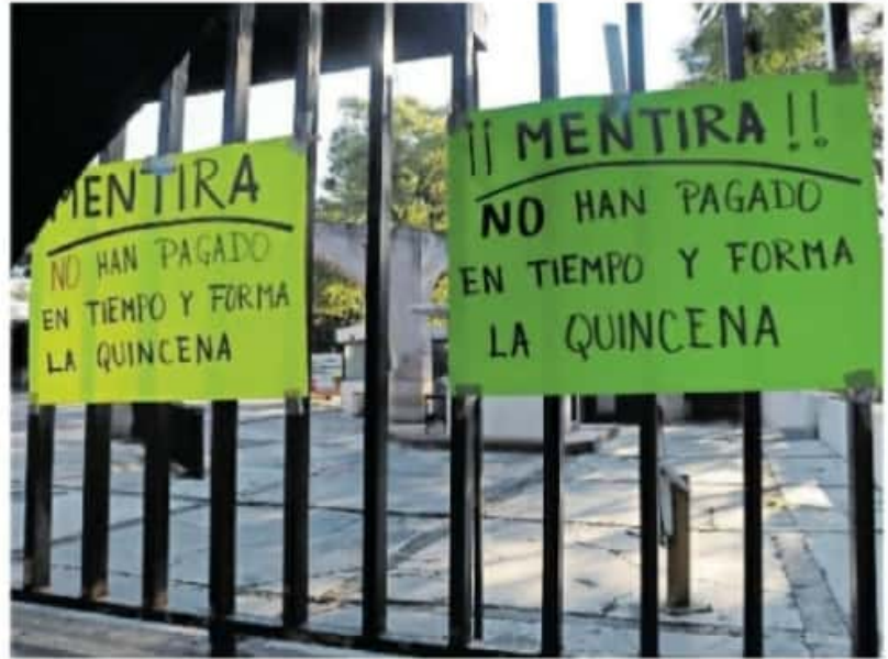
Profesores y trabajadores no han cesado en exigir las quincenas faltantes

Sin embargo, tanto los maestros estatales como los de los subsistemas de los