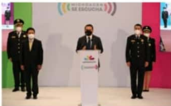
MORELIA MICH.- El Gobernador Silvano Aureoles Conejo anunció que todos los miércoles se presentará un Informe detallado de la situación de la entidad en materia de seguridad.