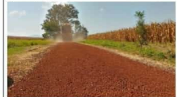
ZAMORA, MICH.- Con 100 viajes de granzón y la intervención de la Dirección de Desarrollo Rural, se mejoró el camino sacacosechas de la comunidad El Llano.

Agregó que en la medida de lo posible se han estado mejorando estos accesos parcelarios de todos los ejidos del municipio, lo que ha sido agradecido por los comisariados.