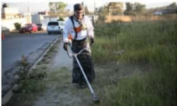
JACONA, MICH.- Personal del gobierno municipal atendió la limpieza y el mantenimiento del acceso a la colonia Lomas Universidad.

dependerá seguir conservando caminos, calles y servicios públicos generales en óptimas condiciones, si como vecinos existe la disponibilidad de hacer equipo y Lomas Universidad no sería la excepción ya que como comunidad han trabajado por su propio bienestar, lo que como autoridades reconocen y en la espera de que estas acciones valdrán la pena con un trabajo coordinado entre gobierno y ciudadanía.