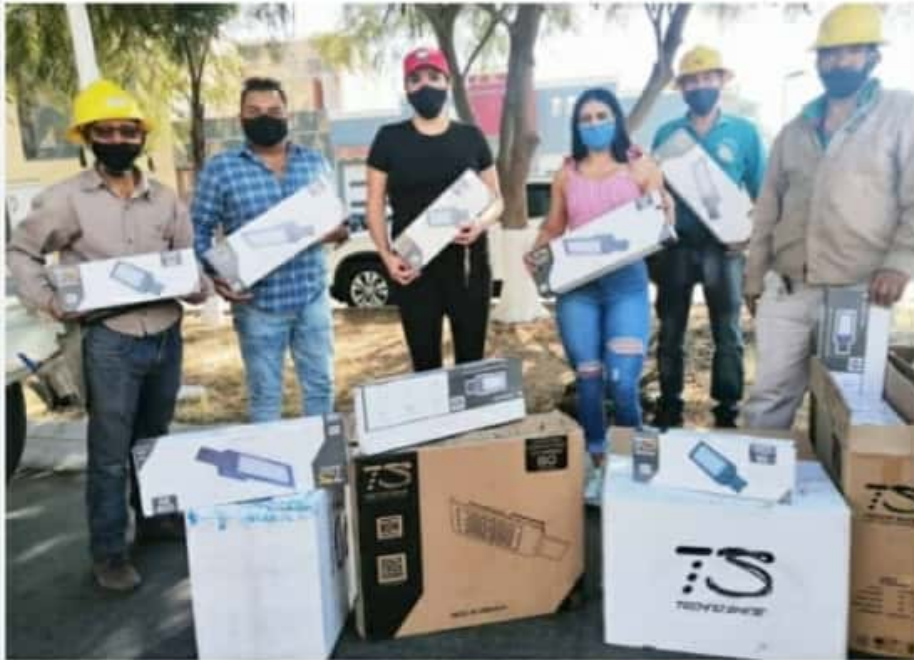
ZAMORA, MICH.- 32 nuevas luminarias fueron instaladas en el fraccionamiento Huertas de San Antonio, con el apoyo de personal de la coordinación de Alumbrado Público y Obras Públicas.