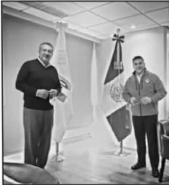
EL OBJETIVO DE LA REUNIÓN FUE PARA ENCONTRAR PUNTOS EN COMÚN

Al término de la reunión, así se expresó Alejandro Moreno Cárdenas a través de sus redes sociales: "Un gusto recibir en el PRI Nacional a mi amigo Wil-