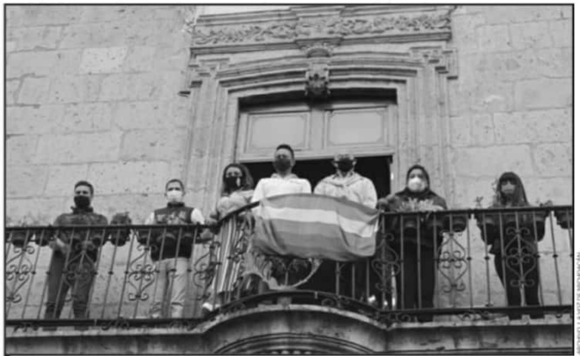
REGIDORES DE OPOSICIÓN Y COLECTIVOS HAN SIDO LOS ENCARGADOS DE PROMOVER UN AYUNTAMIENTO INCLUYENTE Y SENSIBLE A TEMAS DE GÉNERO.

Como cuarto punto y una vez terminadas las diligencias de investigación, señaló, se procederá a un análisis de los hechos para determinar posibles responsabilidades. En tanto que