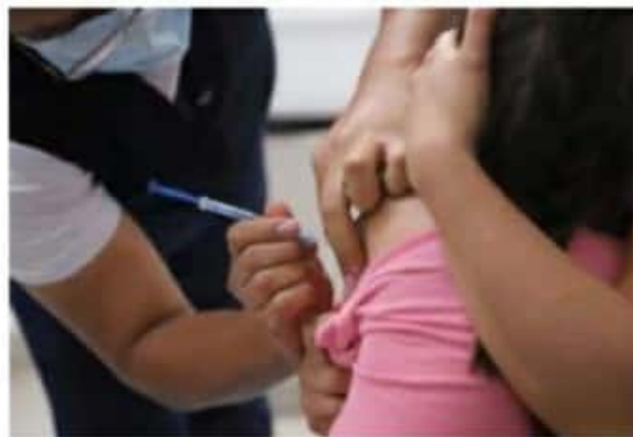
Adultos mayores, niños menores de cinco años, mujeres embarazadas y personas con padecimiento crónico no transmisibles, principal grupo de atención.

Por ello, se recomienda vacunar a la población vulnerable, que son las y los menores de 5 años, adultos mayores, mujeres embarazadas y personas con enfermedades crónicas no transmisibles como la diabetes, obesidad, hipertensión o enfermedades respiratorias como el asma o enfermedad pulmonar obstructiva crónica (EPOC).