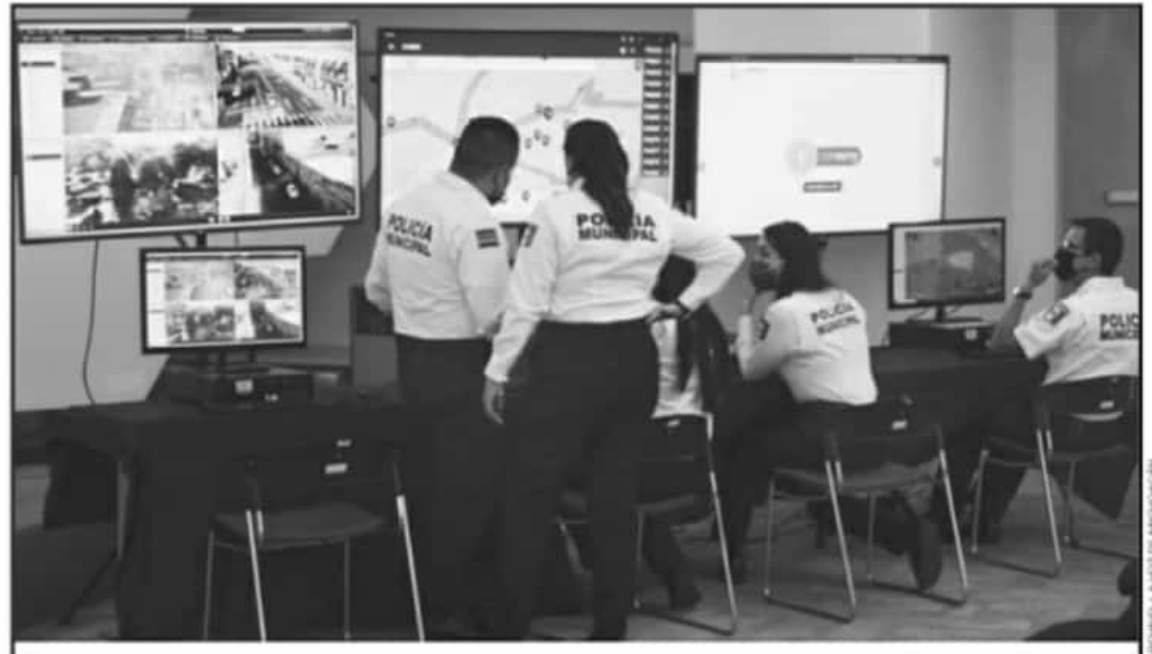
MIENTRAS LAS POLICÍAS ESTATALES Y FEDERALES AUMENTAN SU ESTADO DE FUERZA, LOS MUNICIPIOS NO LOGRAN HACER CRECER SUS CORPORACIONES.

A pesar de ser el primer nivel de atención en materia de seguridad, y ser señalados por el 115 constitucional como los responsables de la seguridad pública de los territorios, las corporaciones policiales cuentan con apenas en pro-