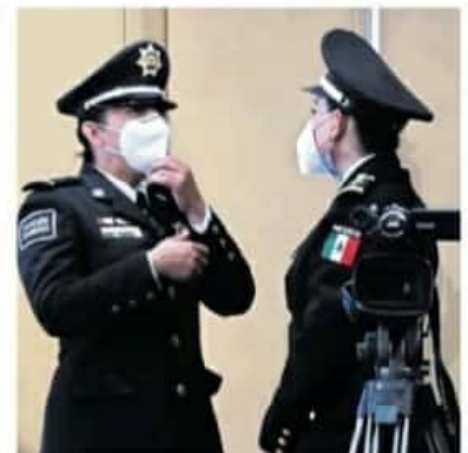
Michoacán cuenta con 6 mil 400 elementos de la SSP. /FERNANDO MALDONADO

Michoacán se ubica en la posición nacional número siete entre las entidades con mayor número de policías operando en calle, al contar con 6 mil 400 elementos de la SSP aunque se proyectaría cerrar con al menos 8 mil 686 policías.