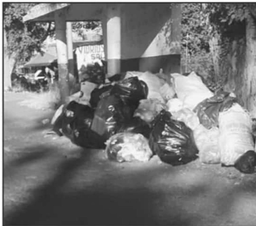
VECINOS DE AL MENOS TRES ASENTAMIENTOS URBANOS HAN DECIDIDO ESTABLECER SUS PROPIOS TIRADEROS

Ante lo anterior, en el caso del tiradero habilitado en la ubicación conocida como "El 50" el riesgo se potencializa debido a que a escasos metros se localiza un puesto de comida que tiene que operar en condiciones de riesgo para los comensales, pues aun cuando el propietario del establecimiento pugna por mantener las condiciones de higiene requeridas, resulta complicado poder garantizar que no puedan darse problemas de enfermedades gastrointestinales entre los clientes, sobre todo ante la recurrente ausencia de la regi-