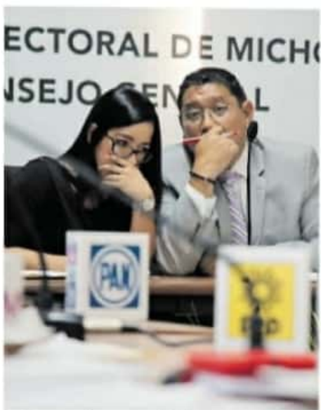
Deben renunciar a su partido 18 meses antes.

Las elecciones para gobernador de ese año, los michoacanos en cualquier parte del mundo pudieron votar vía postal. En esa ocasión se contó con un presupuesto de 10 millones de pesos y se obtuvieron 349 votos, con un costo por voto de 28 mil 653 pesos.