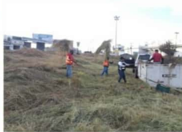
ZAMORA, MICH.- La Dirección de Servicios Públicos Municipales realiza labores de poda y limpieza de maleza en el acceso norte de la ciudad.

Se realizan con personal y equipo del gobierno local, cuyo objetivo es poner en óptimas condiciones esta zona para permitir un tránsito más fluido y mejorar la imagen de este sector.