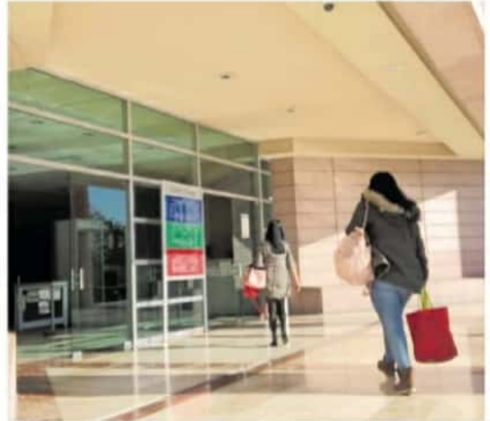
Si para el 18 de enero las partes no llegan a un acuerdo de reparación del daño, ya no habrá oportunidad del juicio abreviado.

La audiencia que se realizaría ayer, se iba a realizar el 06 de octubre, pero se