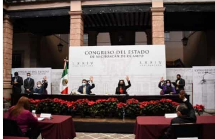
El pleno del Congreso local aprobó reformas constitucionales que tienen que ver con la eliminación del fuero al Presidente de la República.

respecto a la eliminación de la declaratoria de procedencia, conocida como fuero.