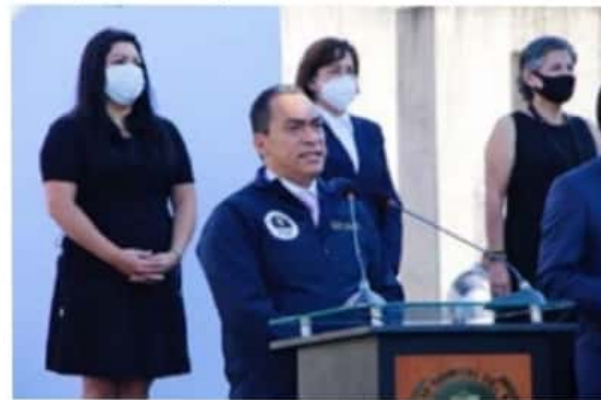
La FGE, ha iniciado más de 400 carpetas del delito de violencia familiar.

pa el fallo respectivo. La obra, que promete modernidad y seguridad a la entrada de la ciudad, cumplió un año de su oficial banderazo, y entonces la oferta era entregarlo precisamente en este diciembre, cuando, como se sabe, no tiene ni un 10% de avance, dado que se interrumpió a semanas de haber arrancado.