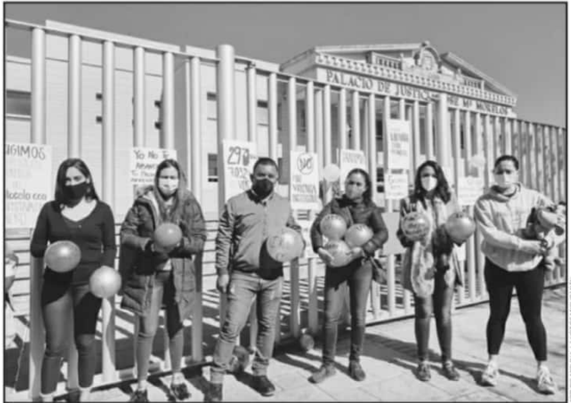
DURANTE LA MANIFESTACIÓN SE PUDIERON VER CARTULINAS, JUGUETES REPRESENTATIVOS Y LA EXIGENCIA A LAS AUTORIDADES DEL PODER JUDICIAL DEL ESTADO.

En el peor de los casos, mujeres en su mayoría han perdido el contacto con sus hijos sólo por el hecho de decidir separarse de sus parejas. A pesar del daño y el perjuicio generado por lo anterior, las ventanillas para denunciarlo, aseguran, se mantienen cerradas desde el año pasado. En total, se han manifestado hasta en tres ocasiones distintas en la capital del estado y han interpuesto quejas ante las comiso-