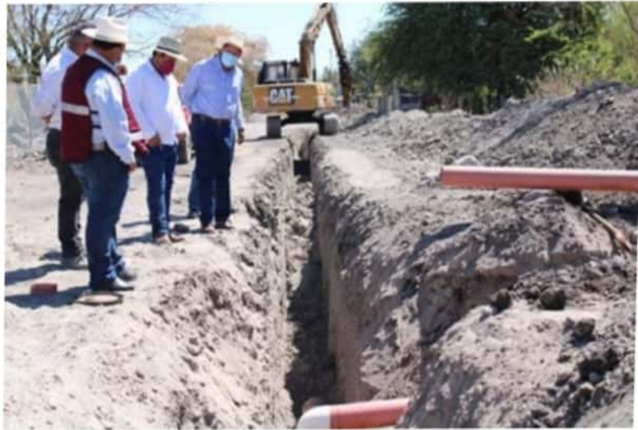
En la obra de drenaje de El Cahulote del municipio de Parácuaro, se invierten cerca de 6 millones de pesos, recursos gestionados por el diputado Feliciano Flores Anguiano.