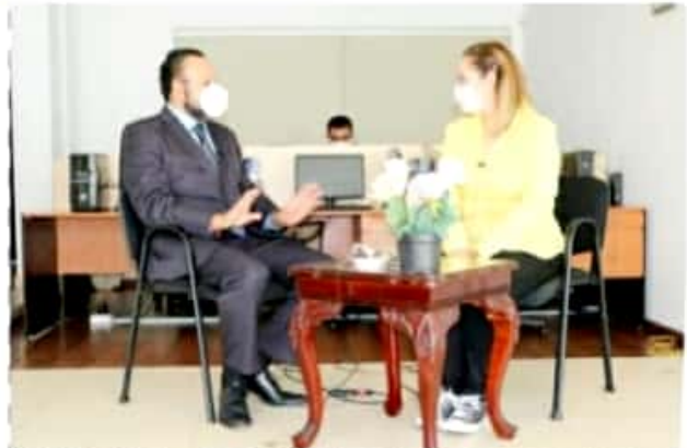
MORELIA, MICH.- Salvador Alejandro Pérez Contreras, magistrado del Tribunal Electoral del Estado de Michoacán, en entrevista con abc DE MORELIA.

Finalmente, adelantó que pueden ser causales de pérdida de candidaturas conductas tales como peculado, desvío de recursos públicos, coacción del voto o utilización de programas sociales en que incurran los precandidatos o candidatos para conseguir el voto popular, concluyó.