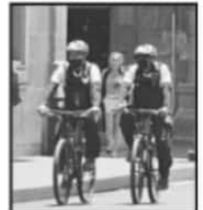
POLICIAS EN BICICLETAS, ACTIVOS.

"El domingo es cuando menos delitos se cometen. En la zona centro es donde más delitos hubo de las que recorrimos, falta hacer comparativas de periodos anteriores. Lo que yo diría es que la zona centro es la que tiene mayor densidad de población y una colonia de población más densa es la que presenta una mayor cantidad de delitos, como hay mucho tránsito de vehículos y de turismo algunos delincuentes van ahí a delinquir. Hay que comparar, lo que puedo afirmar es que es por la densidad poblacional", señaló.