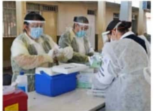
Llegaron ayer otras 16 mil 500 para segundas dosis.