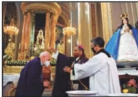
AL INTERIOR DE LA CATEDRAL DE MORELIA LOS PRIMEROS EN RECIBIR LA CENIZA FUERON LOS JERARCAS RELIGIOSOS.