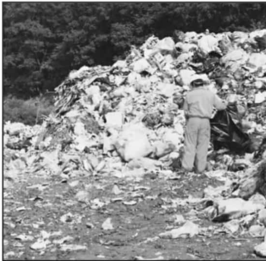
EXPERTOS SEÑALAN QUE EL IMPACTO AMBIENTAL QUE GENERA LA BASURA EN LA ZONA LACUSTRE ES MUY ALTO.

Pátzcuaro, por su cantidad de población es el municipio que más residuos sólidos produce con 60 a 65 toneladas diarias, le sigue Salvador Escalante con 30 a 35 toneladas, después Tingambato con 25 y Tzintzuntzan produce de 15 a 18 toneladas aproximadamente, mismos que llevan sus residuos al CITIRS, donde también cobran por la dis-