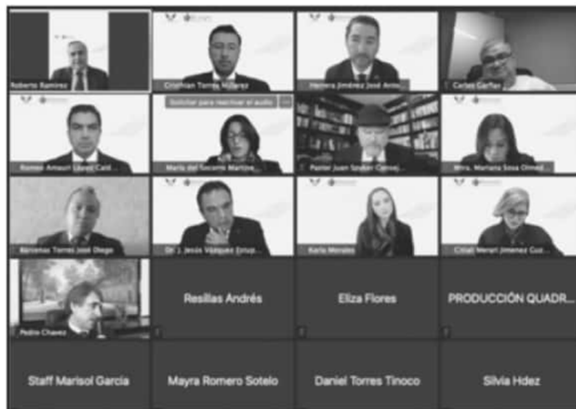
POR CONTINGENCIA, ENCUENTRO DOCENTE DE ESTE AÑO 2021 SE LLEVARÁ A CABO A TRAVÉS DE MEDIOS VIRTUALES.

3 WEBINARS es necesario atender para constancia