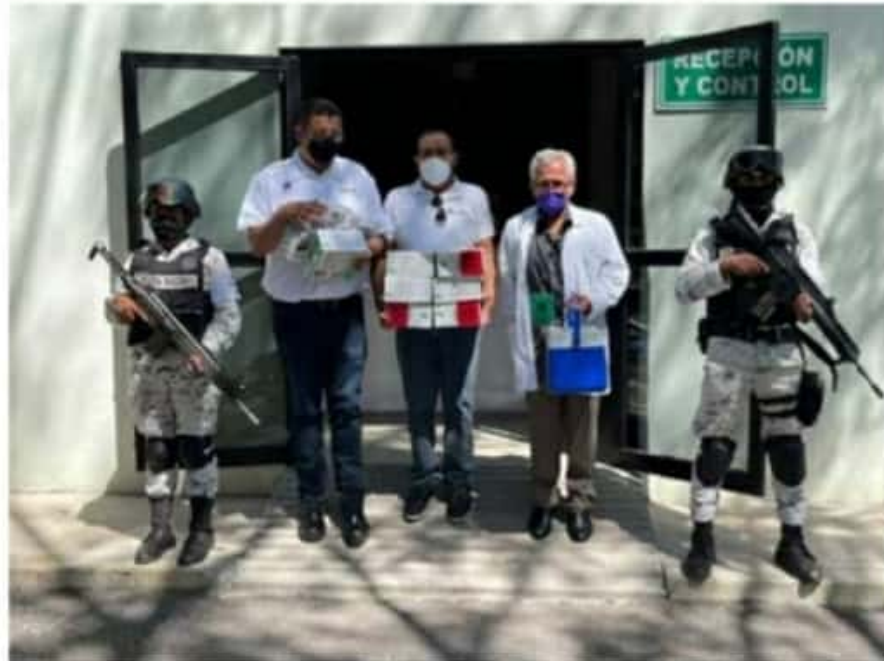
La SSM recibió más dosis de vacuna contra el COVID-19 para ser aplicadas al personal que labora en la primera línea de ataque a este mortal virus.

La Policía acordonó el lugar, mientras personal de la Fiscalía realizaba las investigaciones en relación al crimen de "El Paletas".