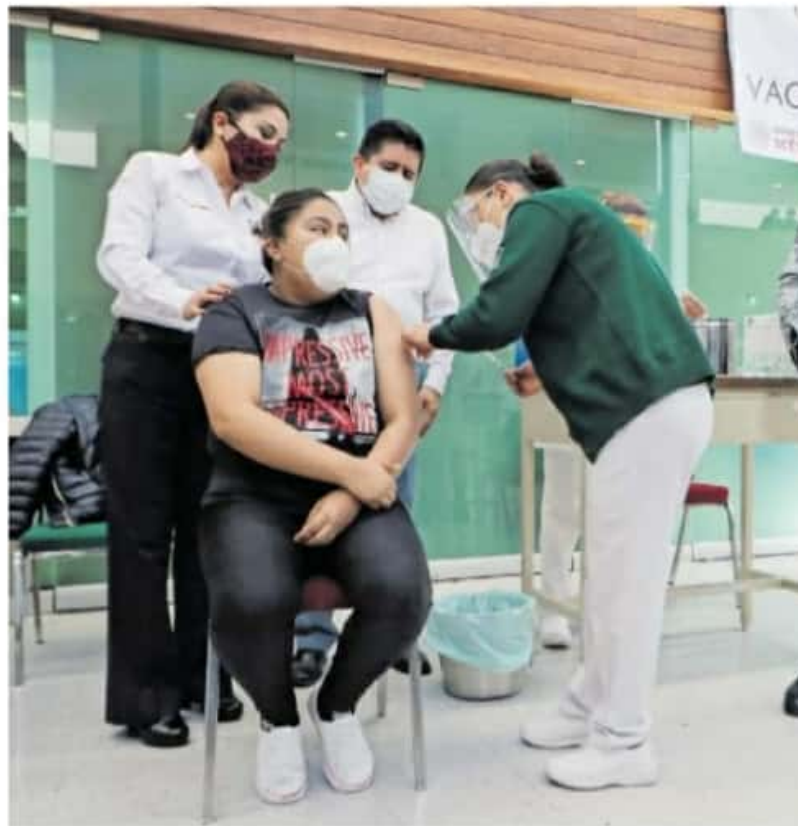
Las unidades faltantes son, en promedio, 2 mil

Hay que recordar que la aplicación se hace de forma simultánea a las 37 mil 175 dosis de AstraZeneca que se realizan a adultos mayores, una vez que esta vacunación se termine habrá 55 mil 700 personas vacunadas en Michoacán, que es el 1.9 por ciento de la población.