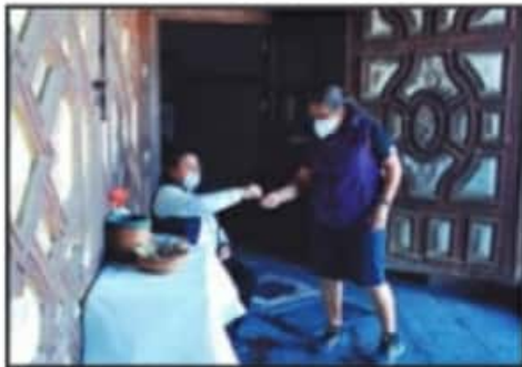
LA IGLESIA CATÓLICA IMPROVISÓ LA ENTREGA DE CENIZA A LOS FIELES, PARA QUE PUDIERAN LLEVAR LA BENEDICIÓN A SUS CASAS.