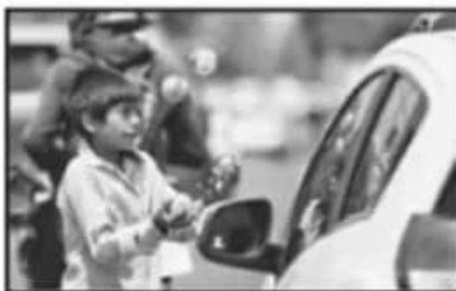
POR DERECHOS HUMANOS, NO SE PUEDE OBLIGAR A LOS MENORES PARA QUE INGRESEN A ESTOS PROGRAMAS.