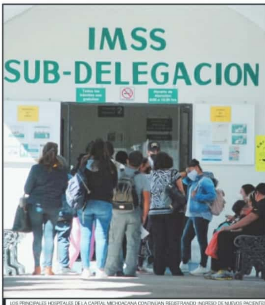
LOS PRINCIPALES HOSPITALES DE LA CAPITAL MICHOACANA CONTINUAN REGISTRANDO INGRESO DE NUEVOS PACIENTES.