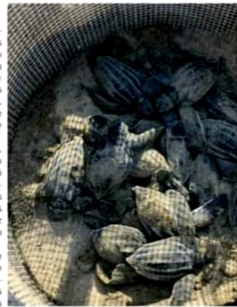
CD. LÁZARO CÁRDENAS, MICH.- El Campamento Tortuguero El Habillal reportó la liberación de 107 mil crías y 1.200 nidos recuperados.