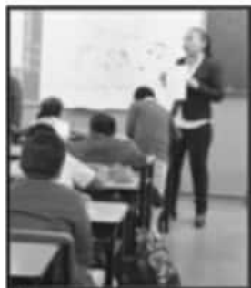
SINDICALIZADOS BUSCAN REFRENDAR LA CULTURA DEMOCRÁTICA.

"El fomento de las empresas limpias pasa necesariamente por la adecuación de nuestro marco normativo, la generación de políticas públicas que las fomenten, y la aplicación de incentivos fiscales que estimulen su operación", refirió la legisladora.