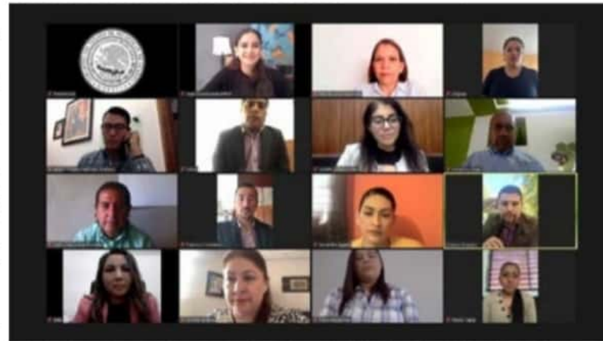
Diputados de la LIV Legislatura, instalaron formalmente el Sistema Institucional de Archivos del Congreso del Estado.

Asimismo, la legisladora agregó que el libre acceso a los archivos promueve la democracia y protege los derechos de los ciudadanos, por lo tanto, su preservación, organización, sistematización y digitalización, con la que se garantiza el manejo integral y la preservación documental de carácter público, es un compromiso de las instituciones que las gene-