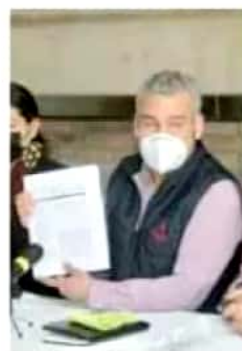
Logro. Durante 2 años se trabajaron las reformas aplicadas, dijo el diputado.