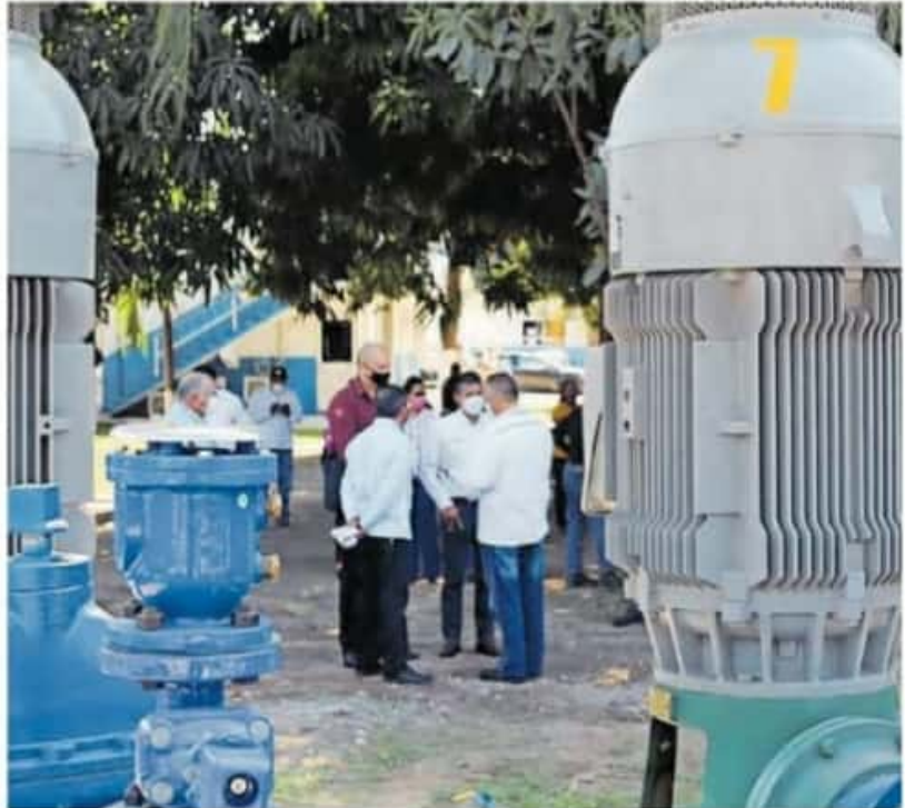
El nuevo sistema tuvo una inversión total de 235 millones de pesos

En las acciones de la comisión en dicha región, que se compone de 16 municipios, se efectuaron diversas modificaciones al sistema hídrico y se llevaron a cabo perforaciones, equipamientos de pozos profundos, tanques de almacenamiento, sistemas de captación de agua pluvial, líneas de conducción, alimentación y distribución; drenajes, colectores sanitarios y equipamiento para la conducción de descargas. En toda la región, se estima que se