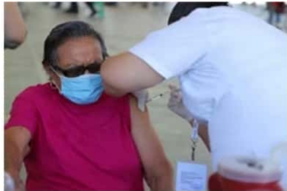
El biológico es aplicado por personal de enfermería capacitado y con experiencia.

El funcionario dijo que esperará los informes para tratar de conocer el estado real del Fideicomiso, donde desde luego, los mismos deben estar justificados y sustentados. Además de saber qué ruta se ha seguido o seguirá en la demanda contra gobierno municipal donde están de por medio algunos millones de pesos.