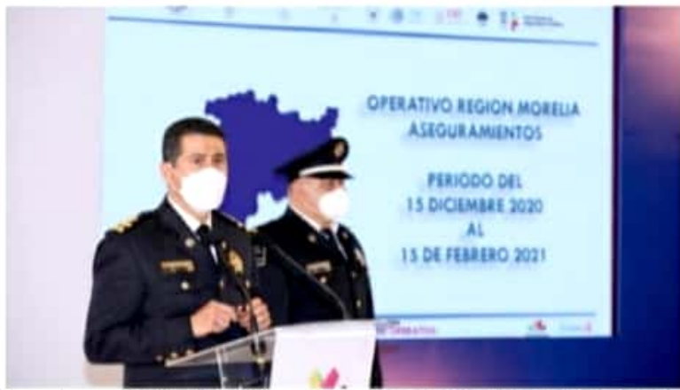
MORELIA, MICH.- Operativo Conjunto Morelia, con avances en la capital michoacana, informa el secretario de Seguridad Pública del Estado de Michoacán (SSP), Israel Patrón Reyes.

Seguridad Pública explicó que las 35 mil plantas equivalen a 17 toneladas de droga, aproximadamente, que se evitó llegara a las calles y se comercializara. Además de que, del 15 de diciembre al 15 de enero, se aseguraron a un total de 86 personas, de las cuales 46 fue por posesión de narcótico; y del 16 de enero al 15 de febrero se aseguraron a 119 en total, de las cuales 68 fue por posesión de narcótico.