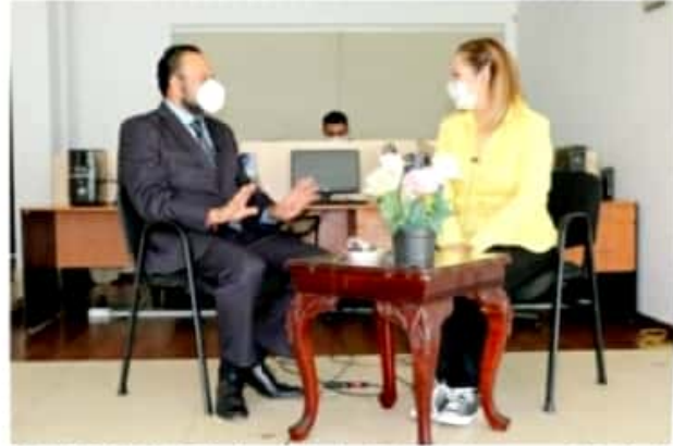
MORELIA, MICH.- Salvador Alejandro Pérez Contreras, magistrado del Tribunal Electoral del Estado de Michoacán, en entrevista con abc DE MORELIA.

Finalmente, adelantó que pueden ser causales de pérdida de candidaturas conductas tales como peculado, desvío de recursos públicos, coacción del voto o utilización de programas sociales en que incurran los precandidatos o candidatos para conseguir el voto popular, concluyó.