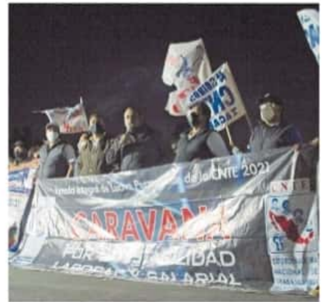
Se les indicó que no era posible el acceso por medidas y protocolos

El 7 de febrero, el contingente de maestros se dirigió a la capital michoacana con la intención de bloquear el Aeropuerto Internacional General Francisco Mújica, a donde los miembros arribaron esa tarde. El 8 de febrero bloquearon la vialidad frente a las instalaciones de Palacio de