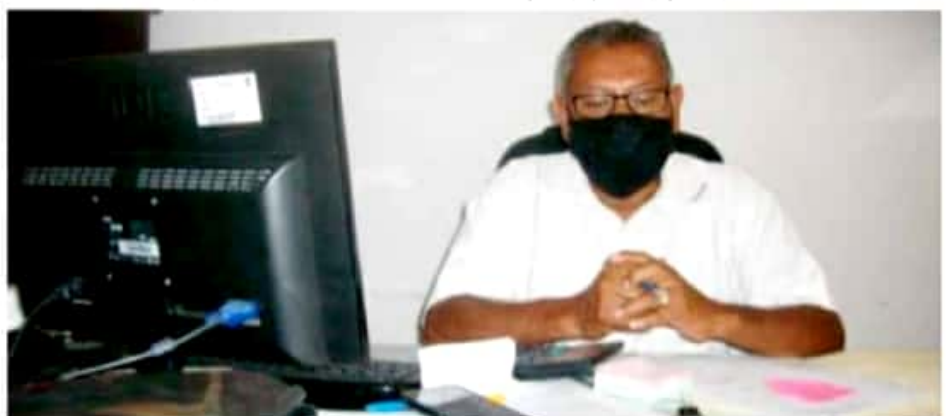
APATZINGÁN, MICH.- En reunión de evaluación las autoridades municipales determinaron continuar con las medidas establecidas en la primera quincena del mes de febrero, para frenar el contagio por Covid-19.

Las autoridades decidieron que la unidad deportiva "Adolfo López Mateos", continuará cerrada en lo que resta del mes de febrero, a fin de evitar concentraciones masivas en las diferentes disciplinas que se imparten.