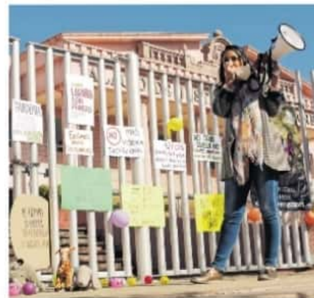
Es la tercera ocasión que se manifiesta el colectivo Padres y Madres en Custodia

Linda tiene 10 meses sin ver a su hija de siete años, a pesar de que ella tiene la custodia legal de la menor.