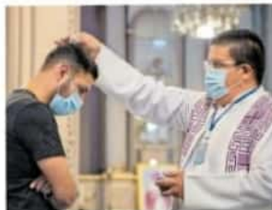
Con este acto religioso inicia formalmente el periodo de Cuaresma.

"Lo esencial en este Miércoles de Ceniza es buscar a Dios, tomar conciencia de revisar la vida, mejorar las acciones. No basta con poner-