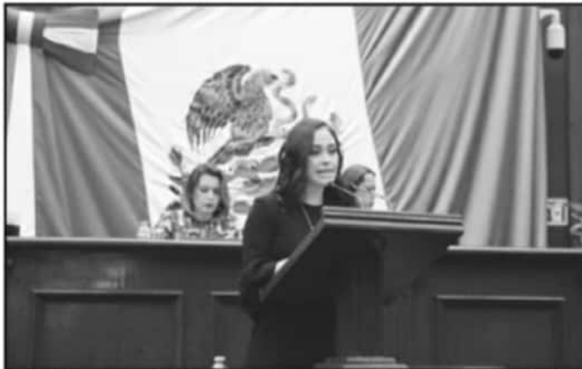
SE RESALTO QUE EL USO DE LAS ENERGIAS LIMPIAS TRAE CONSIGO UN ENORME IMPACTO SOBRE LA ECONOMÍA.

El uso de energías limpias trae consigo un enorme impacto sobre la economía y la vertebración social de los Estados. De acuerdo con el estudio sobre Prospectivas