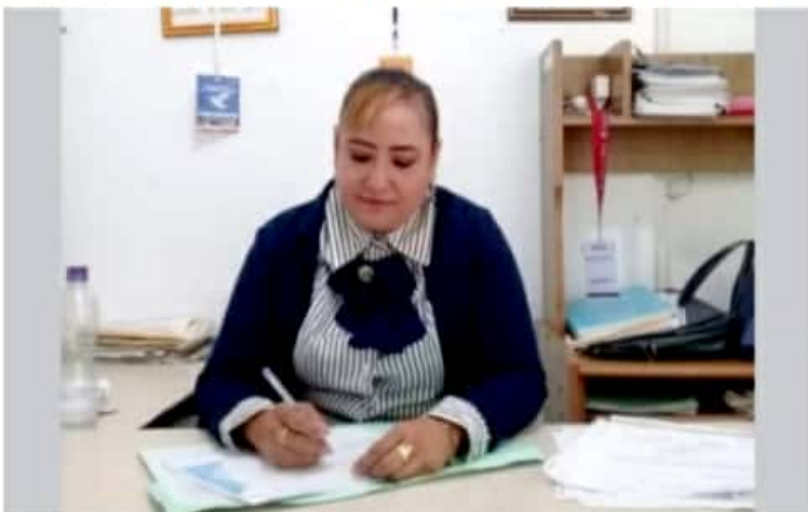
CD. LÁZARO CÁRDENAS, MICH.- El Instituto Municipal de la Mujer invita a la población femenina a tramitar sus becas de descuento para los cursos en línea que ofrece el Cecati 70.

Eduardo CHÁVEZ CD. LÁZARO CÁRDENAS, MICH.-