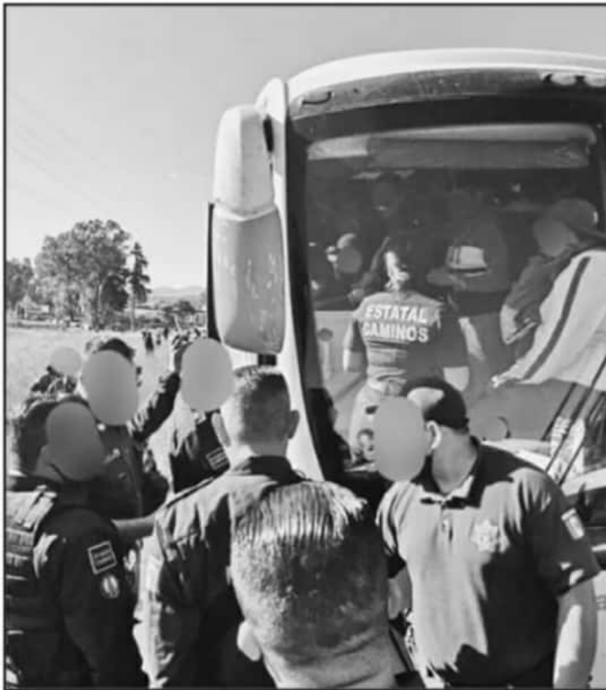
INTEGRANTES DE LA NORMAL DE TIRIPEÑO BUSCAN QUE SE RETIREN SANCIONES A 65 ESTUDIANTES EXPULSADOS.

Detalló que los integrantes de la Normal buscan que se retiren sanciones a 65 estudiantes expulsados por diversas acciones, una de ellas fue el bloqueo