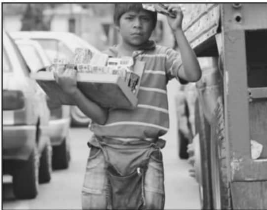
A TRAVÉS DE LAS BECAS MUNICIPALES SON 160 LOS BENEFICIADOS, MIENTRAS QUE LA BECA PADRINO CUBRE A 18 MENORES.