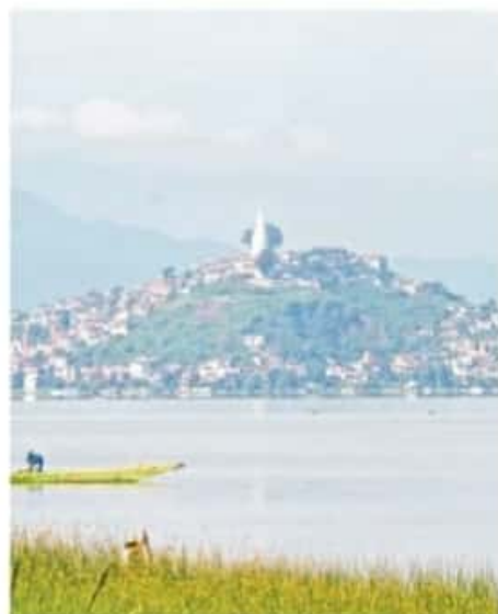
Alcalde reconoce trabajo de la población

La dependencia añadió que en la comunidad de El Bodeco, del mismo municipio, se inauguró recientemente otra obra hídrica, una red de agua potable con la que se benefició directamente a 560 habitantes mediante la instalación de 3 mil 830 metros de tubería, 50 tomas domiciliarias y la puesta en marcha del sistema.