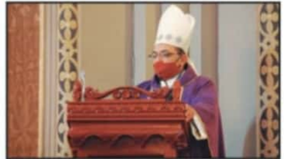
ANTES DE REPARTIR LA CENIZA A LOS PRESENTES, SE LLEVARON A CABO MISAS PARA MARCAR EL INICIO DE LA CUARENTENA Y PERIODO DE LA SEMANA SANTA.