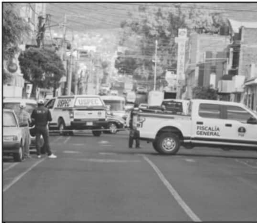
LOS FRACCIONAMIENTOS DE LA PERFERIA URBANA DE MORELIA CONCENTRAN LA MAYOR INCIDENCIA DELICTIVA.

Entre otros datos obtenidos por la implementación de Operación Conjunta, a un mes del inicio, fue que el día que se genera una mayor incidencia de delitos en toda la mancha urbana es el día lunes; cada inicio de semana aumenta la incidencia con un total de 166 delitos denunciados, mientras