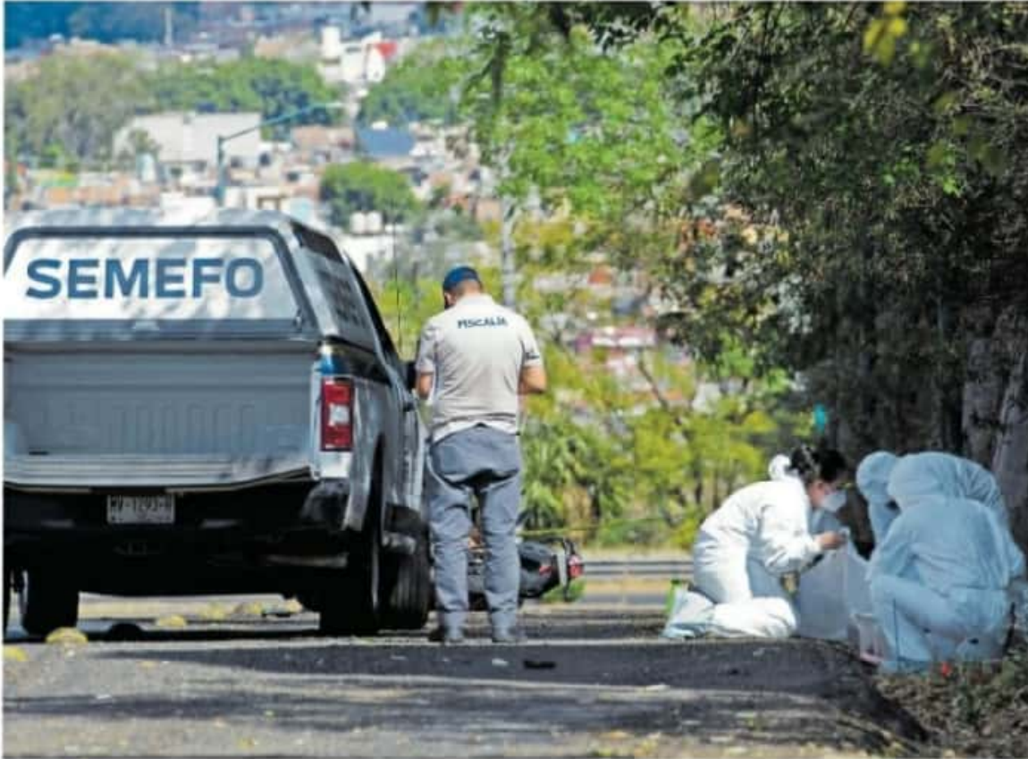
En Morelia un hombre fue asesinado a tiros. /ADID JIMÉNEZ