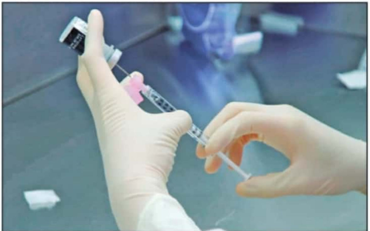
LAS VACUNAS DE ACTUAL APLICACIÓN EN MÉXICO SON BIOLÓGICOS APROBADOS PARA SU USO DE EMERGENCIA ÚNICAMENTE A LOS GOBIERNOS NACIONALES.

Mientras que por el momento no se han tenido reportes oficiales de venta ilegal de la presunta vacuna en Michoacán, el titular