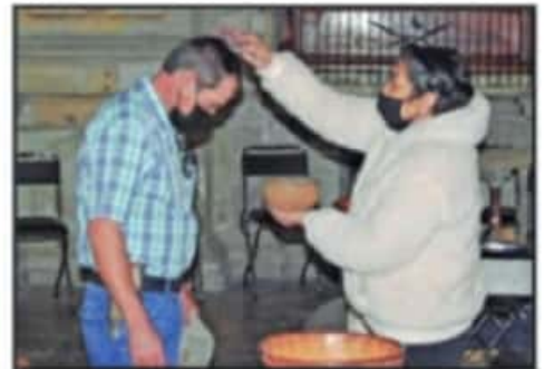
EL TEMPLO DE SAN AGUSTÍN FUE UNO DE LOS RECINTOS DONDE LAS CATEQUISTAS SE HICIERON CARGO DE REPARTIR LA CENIZA.

IRITO VIVEN CATÓLICOS UN MIÉRCOLES DIFERENTE