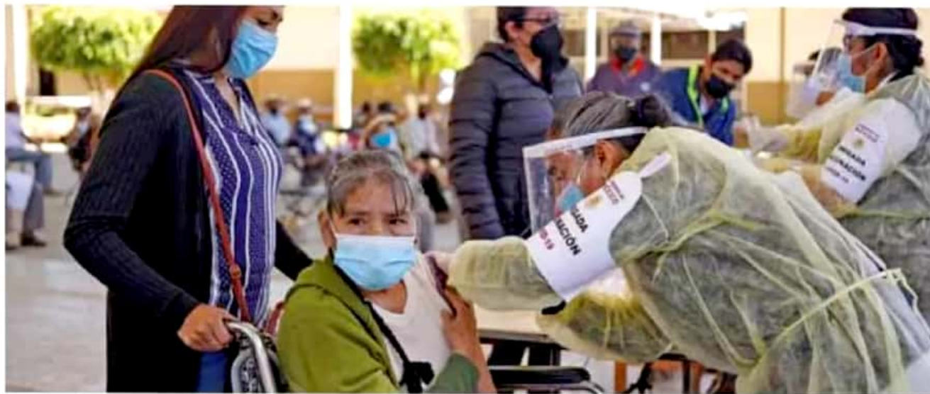
Comparativo. Mientras algunos países ya vacunaron a más de 50% de su población, en México el avance es de sólo 0.7%.