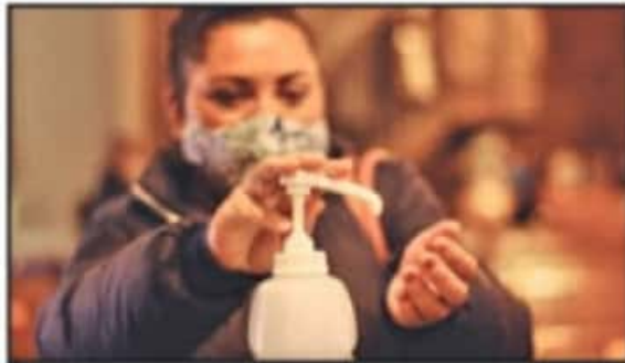
PARA RECIBIR LA BENEDICIÓN DE FORMA DIRECTA, LOS PRESENTES TUVIERON QUE ACATAR TODAS LAS MEDIDAS SANITARIAS EN LOS RECINTOS SACRADOS.

En las entradas de las parroquias, las mujeres encargadas de las iglesias y catequistas estarán repartiendo la ceniza de palma (en bolsita) bendecida a todo aquel que se acerque a pedirla.