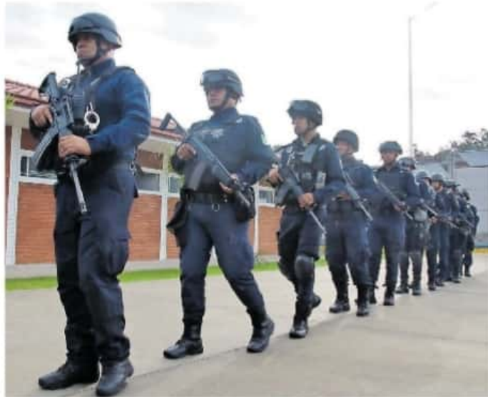
Las acciones no se ven reflejadas en los índices de seguridad pública