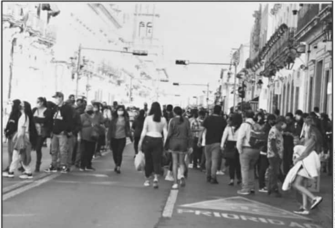
LOS ESPECIALISTAS AFIRMAN QUE LA APARICIÓN DE ENFERMEDADES EN EL MUNDO ES CONSECUENCIA DIRECTA DE ACTIVIDADES HUMANAS DISRUPTIVAS.

En tanto los investigadores que editaron este material señalaron que en la Plataforma Intergubernamental Científico-Normativa sobre Diversidad Biológica y Servicios de los Ecosistemas (IPBES, https://ipbes.net/pandemics ), se ha documentado ya que, además de las consecuencias a la salud humana, las pandemias y zoonosis