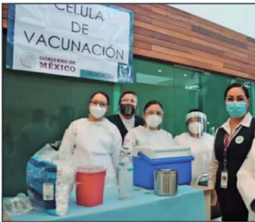
EN LA CLÍNICA DEL IMSS, EN CAMELINAS, YA COMENZÓ LA SEGUNDA ETAPA PARA INMUNIZAR AL PERSONAL MÉDICO.

Pfizer para segunda dosis de sector salud