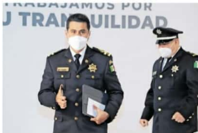
El titular de la SSP, Israel Patrón Reyes, aseguró que los delitos reportados al corte del 20 de diciembre fueron mil 736.

Recordó que en los últimos meses se han registrado bloqueos carreteros en la zona de Zitácuaro, sin embargo, indicó