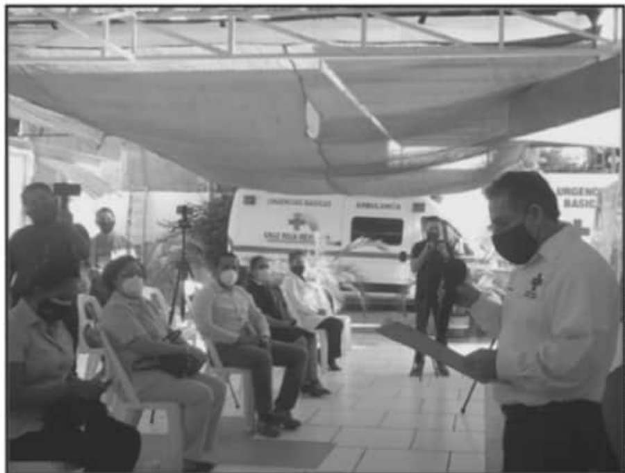
EL DIRECTOR LOCAL DE LA CRUZ ROJA ADVIRTIÓ QUE LA EXIGENCIA DE SERVICIO ENTRE LA SOCIEDAD HA SIDO MUCHO.