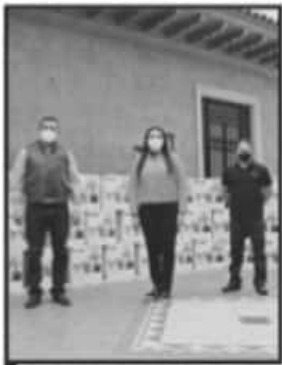
ALCALDESA ADVIRTIÓ QUE SON 40 EQUIPOS Y PARA DESPROTEGIDOS.

Informando que en el 2018 contaba la institución con 76 voluntarios, el directivo dio cuenta que la cifra incrementó en 2019 a 107 y el año que concluyó a 137, porque la escuela de capacitación de la Cruz Roja realizó dos cursos para voluntarios. En el 2020 fueron 15 mil 915 servicios los que brindó Cruz Roja entre consultas médicas, certificados médicos, servicios dentales, servicios de psicología y servicios de enfermería, mientras que su coordinación de socorro brindó 1827 servicios entre los cuales se cuenta a los traslados foráneos, servicios de emergencia y servicios especiales para la enfermedad de COVID-19.