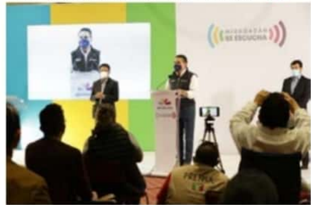
Uso obligatorio del cubrebocas en todo Michoacán, cierre de oficinas del Gobierno del Estado, cierre de actividades no esenciales de jueves a sábado a partir de las 7:00 PM y cierre total los domingos en todo el estado, entre las medidas que emitió el gobierno de Silvano Aureoles Conejo.

El mensaje sobre la pandemia fue a no bajar la guardia ni descuidarse para evitar efectos en la salud propia o de la familia.