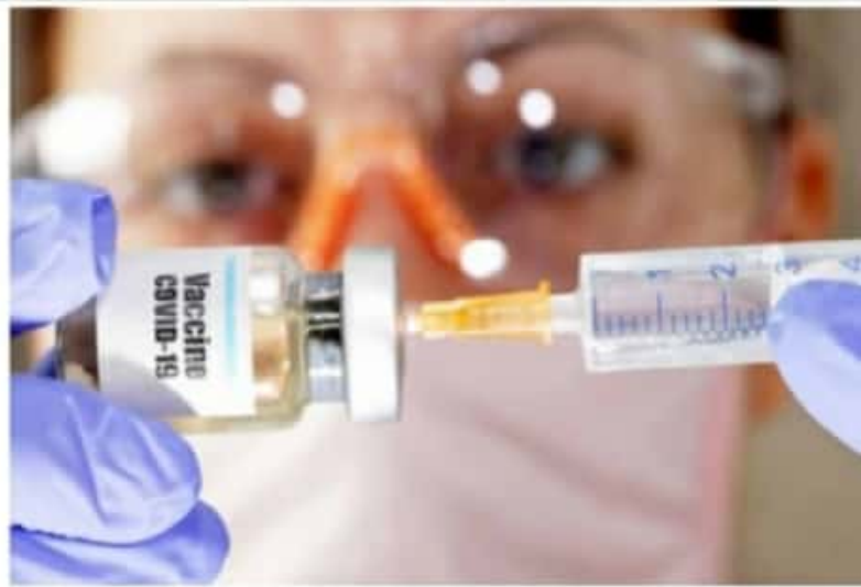
CD. LÁZARO CÁRDENAS, MICH.- Se pudo confirmar con la Secretaría de Bienestar que para el municipio de Lázaro Cárdenas, únicamente se envió un centenar de dosis de vacunas contra Covid-19.

Al recordar que se inscribió para ser candidato del PAN a la alcaldía antes del ejercicio de la alianza, comentó que espera una pronta respuesta del directivo estatal a la solicitud de quedar fuera de la alianza, para poder ir a la integración de una planilla con la cual competir fuera de coaliciones.