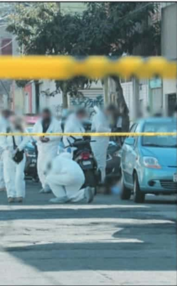
ENTRE LAS DOS SE JUNTARON CASI 700 DE ESOS CASOS, SEGÚN LOS REPORTES.