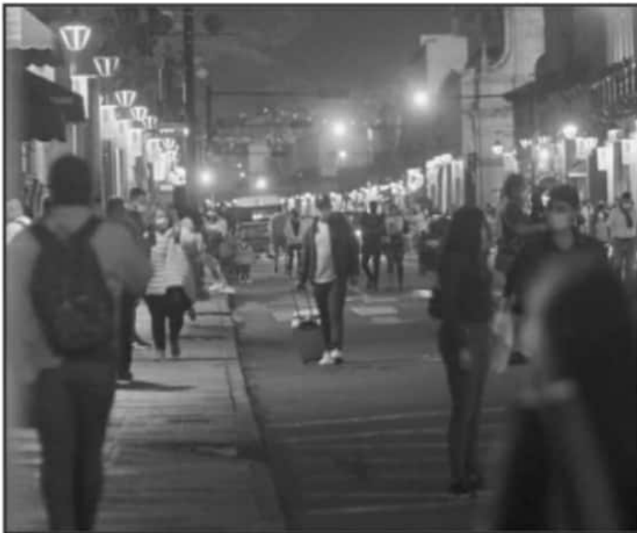
EN LOS ÚLTIMOS DÍAS EL PRIMER CUADRO DE LA CAPITAL MICHOACANA SE HA VISTO AGLOMERADO DE PASEANTES

Si bien se previó que el gobernador de Michoacán dictara un cierre total desde esta semana, durante su mensaje a medios de comunicación únicamente anunció la entrada en vigor del uso obligatorio de cubrebocas y el cierre de oficinas no esenciales del Gobierno del Estado, dando una semana más de revisión antes de que se tome una resolución definitiva