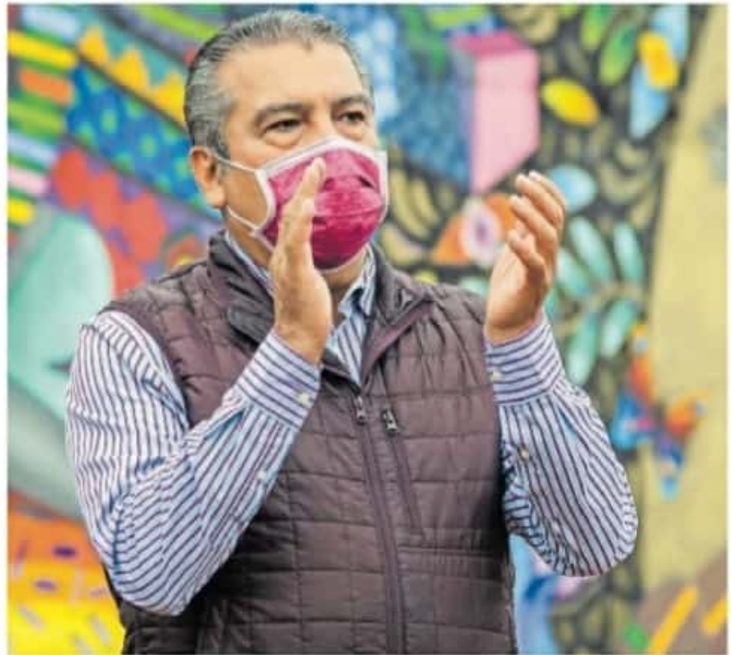
El edil tiene como plazo hasta el 6 de marzo para dejar el cargo