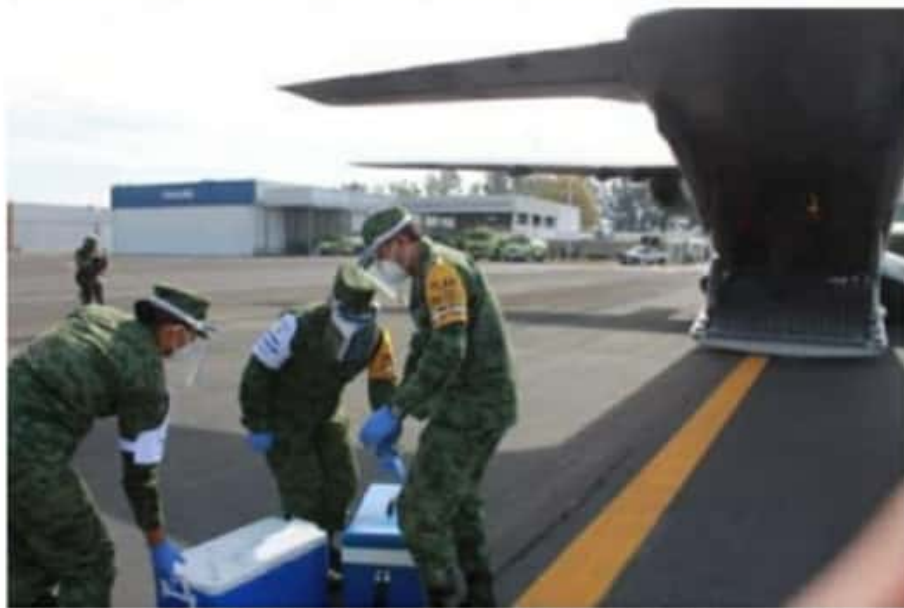
La nueva remesa de vacunas contra el COVID-19 que llegó ayer al aeropuerto de Morelia, se suma a las 14 mil 652 aplicadas la semana pasada al sector salud.

"En el mes de diciembre se tenían 325 en promedio de hospitalizados en la Red de Atención a Pacientes con Infección Respiratoria Aguda Grave, pero hoy se tienen en promedio 631 hospitalizados en todo el estado; los hospitales de Morelia tienen una ocupación del 90 al 100 por ciento y en el estado estamos en un 72 por ciento en promedio", detalló.