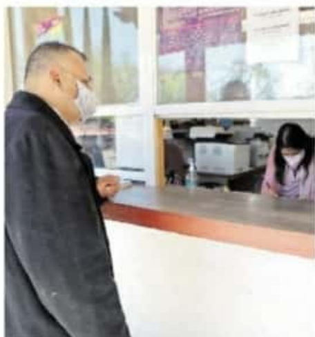
Al registrarse los candidatos sólo se limitaron a señalar colores genéricos.

Concluida la jornada electoral, el próximo 06 de junio, los partidos tendrán un mes para quitar la propaganda de estos espacios, de no hacerlo, el ayuntamiento la retirará pero con cargo al recurso público que reciben los institutos políticos.