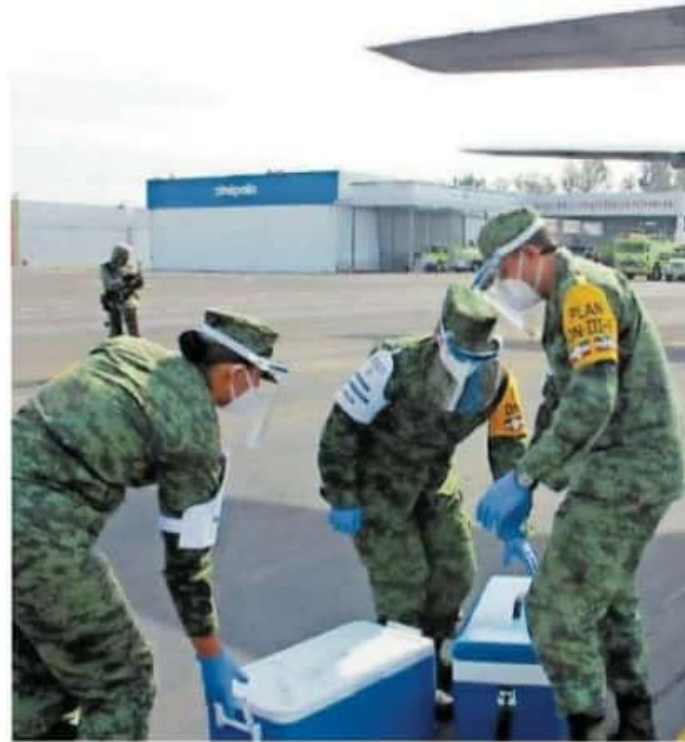
Llegaron a Michoacán mil 923 vacunas menos de las que se esperaban, en el segundo lote

Se mantendrá el cierre parcial de actividades de jueves a sábado