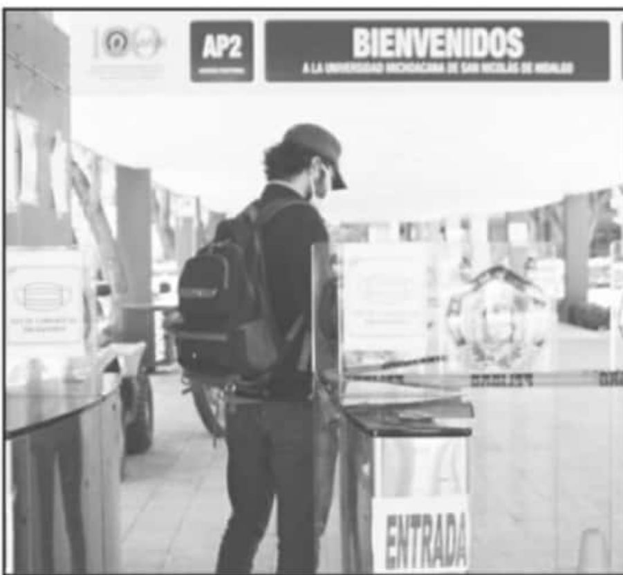
DETERMINA LA UMSNH SUMARSE A LA SUSPENSIÓN DE LABORES EN SUS TODAS SUS ÁREAS PARA FRENAR CONTAGIOS.

Hay compañeros que están trabajando diversos aspectos administrativos, pero desde casa, coordinándose a la distancia, por lo cual si se han seguido algunos procesos