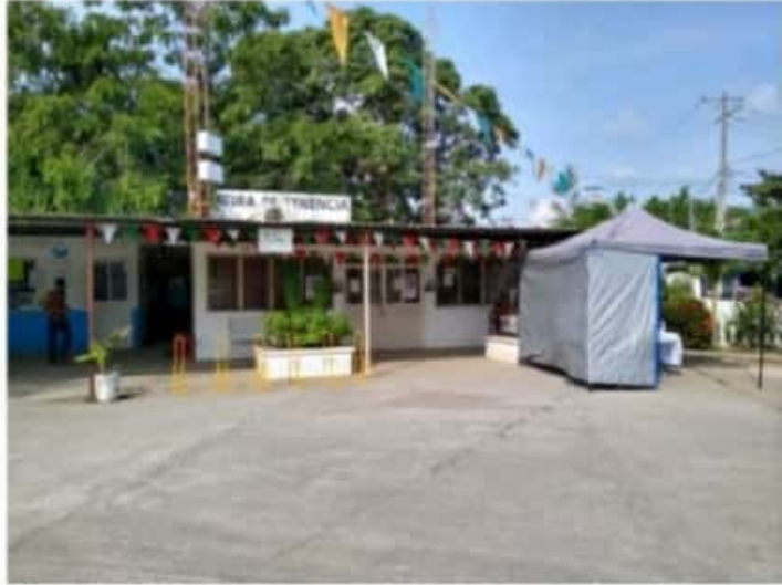
CD. LÁZARO CÁRDENAS, MICH.- En la jefatura de tenencia de Las Guacamayas podría establecerse una base de emergencias de PC.