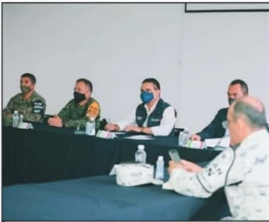
ZAMORA, APATZINGÁN-TEPALCATEPEC Y EL PUERTO DE LÁZARO CÁRDENAS, LOS PUNTOS QUE ACORDARON REFORZAR.