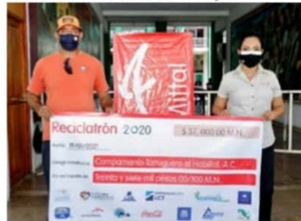
El cheque simbólico fue entregado por un monto de $37,206 pesos.

Con estas acciones ArcelorMittal refrenda su compromiso con la preservación del medio ambiente al margen de sus estrategias de Responsabilidad Social Empresarial y de Sustentabilidad encaminadas a generar alternativas que minimicen el impacto ecológico y mejoren las condiciones para las futuras generaciones.