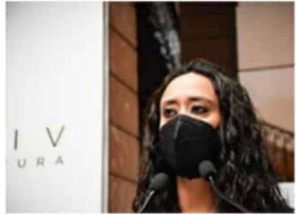
La legisladora petista dijo que estará alerta de que no haya abusos por parte de la autoridad en contra de la ciudadanía.

Actualmente, México ocupa el lugar 12 a nivel mundial en la aplicación de vacunas contra COVID-19, con 468 mil 708 dosis. El Gobierno Federal ha pactado con diferentes farmacéuticas internacionales la compra para el primer trimestre del año de 21 millones 394 mil 650 dosis de vacunas contra COVID-19, que servirán para inmunizar a 14 millones 172 mil personas.