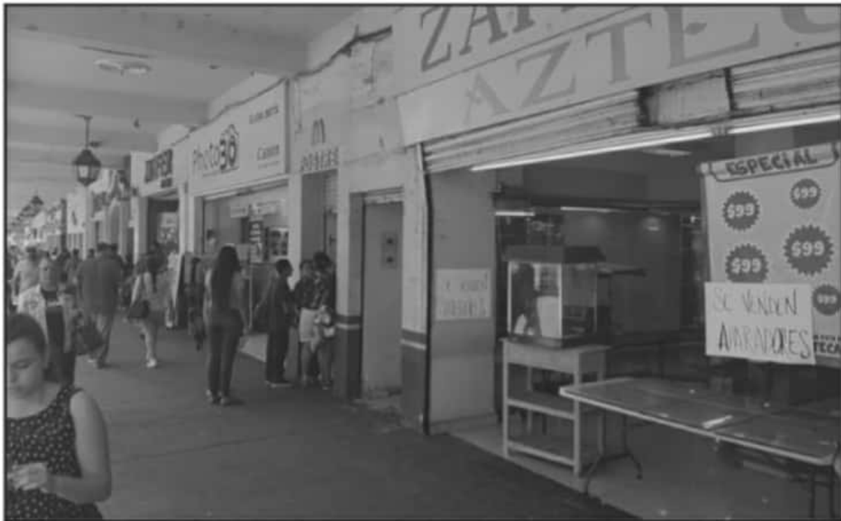
EL CIERRE PARCIAL Y TOTAL DE COMERCIOS EN ESTA CIUDAD. NO SE CONTEMPLA HASTA EL MOMENTO EN LA AGENDA DE LAS CÁMARA EMPRESARIALES.

En el gobierno municipal analizamos a detalle las acciones que habremos de seguir instrumentando para hacer frente a la pandemia, ello mediante el consenso de la población