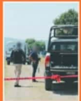
LA VIOLENCIA TAMPOCO SE HA DETENIDO DURANTE ENERO.