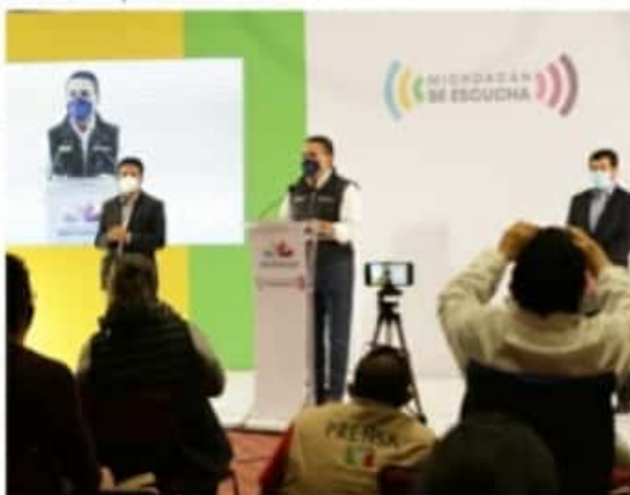
MORELIA, MICH.- Aureoles Conejo puntualizó que con dichas medidas se busca reducir la movilidad de las personas y cortar la cadena de contagios.

El gobernador advirtió que, si los números no disminuyen, la próxima semana sesionará el Comité Estatal de Seguridad en Salud para considerar medidas más estrictas, que ayuden a contener los contagios, como el aislamiento obligatorio y el cierre total de actividades, ante una inminente llegada al semáforo rojo para Michoacán.