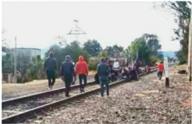
MORELIA, MICH.- Autogobierno, corrupción y vandalismo son acciones realizadas por estudiantes, que han amenazado, golpeado y sacado a un total de 28 compañeros.