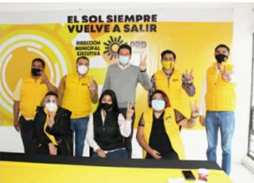
MORELIA, MICH.- En las instalaciones del partido del sol azteca en la ciudad, la dirigencia coincidió en que es a través de la unidad como se logrará recuperar el rumbo por el que iba Morelia.