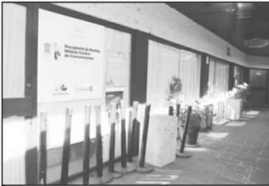
LAS OFICINAS PÚBLICAS NO ESENCIALES DEL GOBIERNO ESTATAL. CERRARON SUS PUERTAS HASTA NUEVO AVISO.