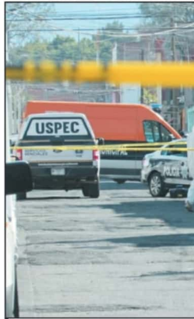
ZAMORA Y MORELIA SON LAS CIUDADES QUE MÁS ASESINATOS ACUMULARON

De acuerdo con los datos del mandatario, las diversas modalidades de robo tuvieron disminuciones por arriba del 20 por ciento en el año 2020. "En Michoacán tuvimos una reducción con respecto al 2019 de mil 400 delitos de alto impacto. En esos delitos de alto impacto destaca por su cantidad numérica el robo de vehículos. Del 2019 al 2020, disminuyó en mil vehículos menos. Es un