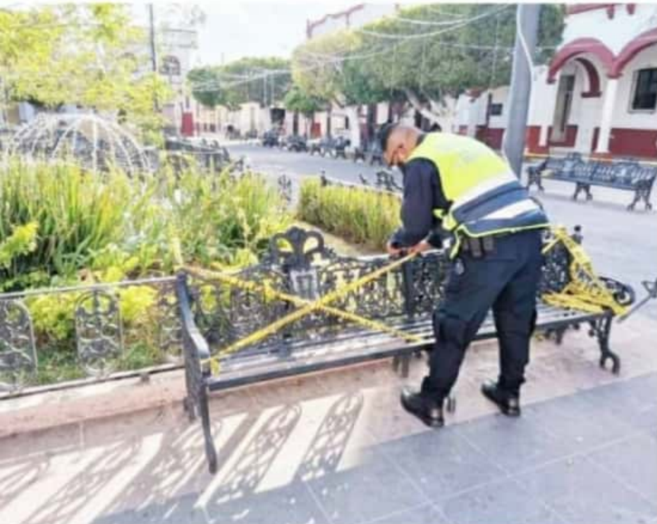
IXTLÁN DE LOS HERVORES, MICH.- Respeto al pago de los impuestos, se espera que después las personas acudan, ofreciendo alguna prórroga para recibir los descuentos.

La operatividad del Ayuntamiento continúa, sólo de detuvo el pago del impuesto predial, las solicitudes de apoyos y las audiencias con el presidente, su personal sigue sus labores en favor de los itxtlanenses.