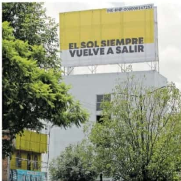
El próximo viernes 22 de enero, el IEM deberá aprobar los lineamientos para la designación de lugares de uso común para el actual proceso electoral. JUAN ARIAS