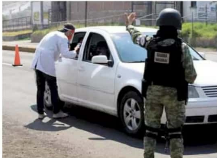
Análisis. En Morelia se analizarán las nuevas medidas que van a implementarse.

casos de Covid acumula Morelia, de los cuales 669 permanecen activos, es decir, pueden contagiar a otras personas.