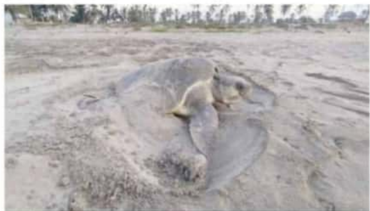
CD. LÁZARO CÁRDENAS, MICH.- Mejoran cifras en cuanto a arribazón de la tortuga marina en el campamento El Habitlal

De los mil 200 nidos restan 30 nidos que aún están a resguardo y que a principios del mes de febrero pudieran nacer y realizar su liberación, mismos que motivan a los campenteros a seguir con su noble labor de proteger a la tortuga marina.