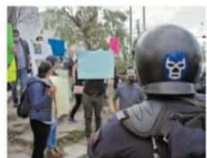
"Estamos esperando que nos depositen 4 quincenas", dicen inconformes.

De acuerdo a lo referido por la manifestante, los adeudos que arrastra el gobierno de Aureoles Conejo ascenderían a 13 millones de pesos, con base en un informe de la Secretaría de Finanzas y Administración del Estado, dijo.