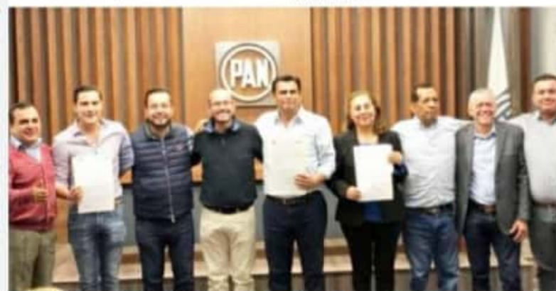
CD. LÁZARO CÁRDENAS, MICH.- Para la presidencia municipal de esta ciudad es más competitivo el Partido Acción Nacional solo que una alianza en la que el PRI, señaló el diputado Javier Estrada Cárdenas.