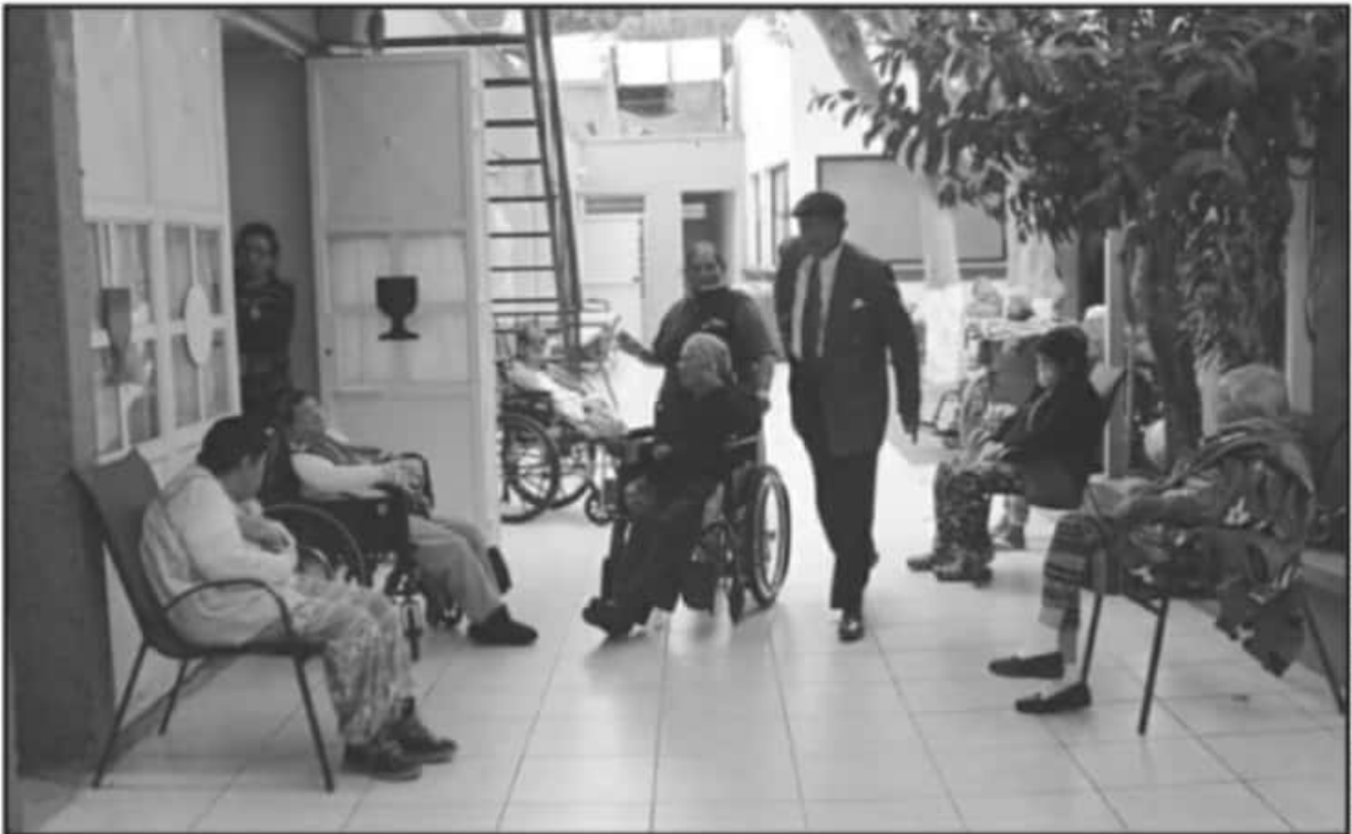
PESE A LAS COMPLICACIONES POR LA PANDEMIA, AFIRMAN QUE HAN PODIDO MANTENER A RAYA LOS CONTAGIOS DE COVID-19 EN EL CRISTO ABANDONADO.

fácilmente, en ese porcentaje, pero conseguí algunas aportaciones de amigos. Ahorita por este problema lamentablemente muchas empresas están casi en quiebra", mayores albergan en el hogar