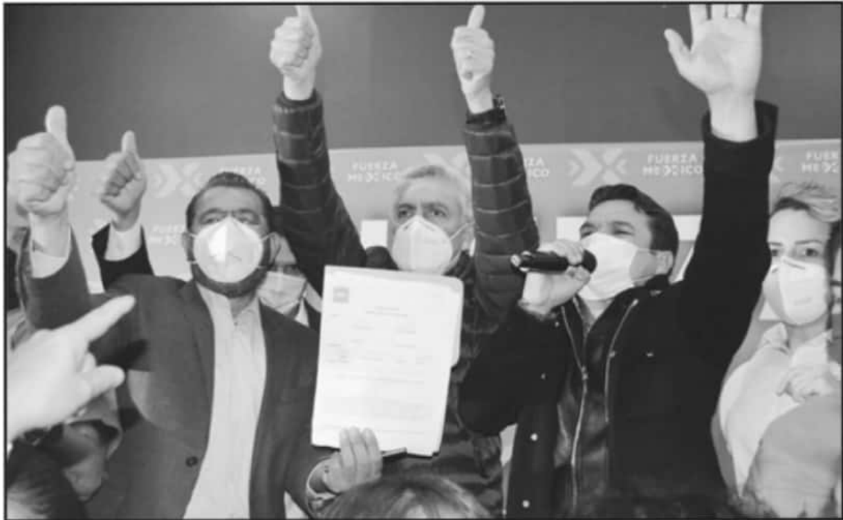
EL SENADOR CON LICENCIA ASEGURA HABER ESTADO RECIBIENDO COMISIONES DE SIMPATIZANTES Y PARTIDARIOS DE DISTINTOS MUNICIPIOS DE LA ENTIDAD