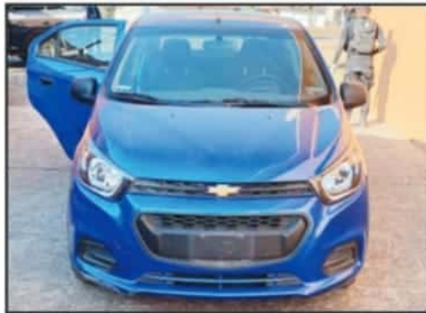
DEL 2019 AL 2020, DISMINUYÓ EN MIL VEHÍCULOS MENOS. ES UN PORCENTAJE ARRIBA DEL 20 POR CIENTO. EN EL ROBO A COMERCIO Y ROBO A TRANSEÚNTE.