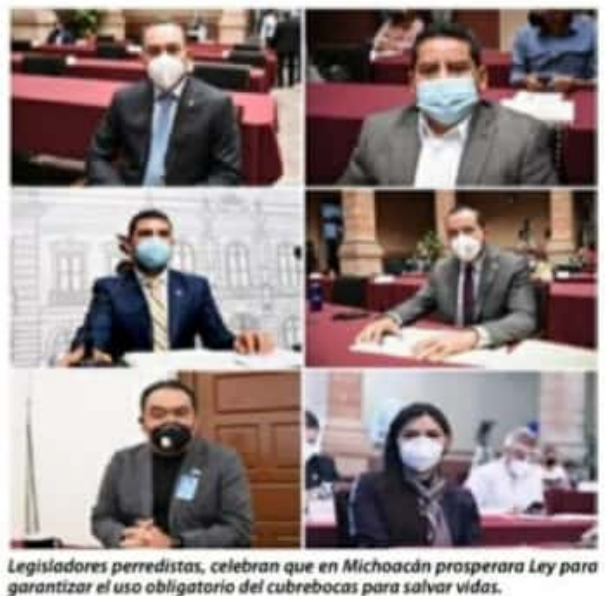
Legisladores perredistas, celebran que en Michoacán prosperara Ley para garantizar el uso obligatorio del cubrebocas para salvar vidas.

por lo que ahora el acumulado de personas muertas a consecuencia del contagio de este virus es ya de 333. En todo Michoacán se reportaron 382 nuevos casos positivos de esta pandemia, para sumar ya 38,683 así como 22 nuevas defunciones para sumar 3,054 personas fallecidas a consecuencia de este virus, y el número de enfermos recuperados, llegó ya a los 32,030. Por municipios, Morelia sigue a la cabeza, con 66 nuevos positivos para 9,129 casos acumulados, seguido de Zamora con 37 para 1,454, La Piedad