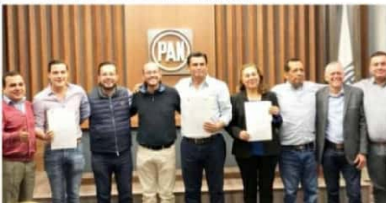
CD. LÁZARO CÁRDENAS, MICH.- Para la presidencia municipal de esta ciudad es más competitivo el Partido Acción Nacional solo que una alianza en la que el PRI, señaló el diputado Javier Estrada Cárdenas.