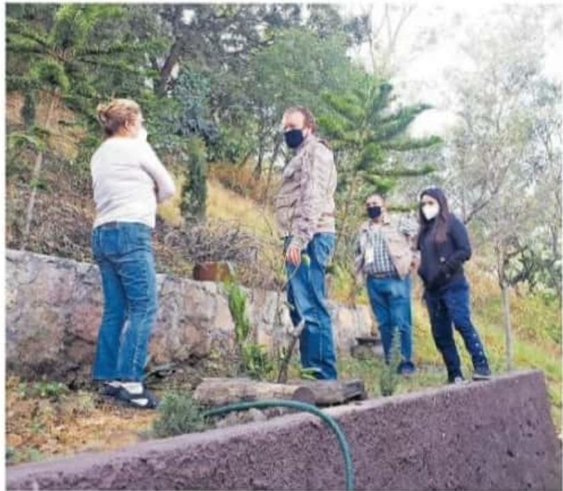
Vigilará que se respete la riqueza natural que viste al cerro de Pico Azul y el manantial El Peral.

Como el propio reglamento de la ley ambiental lo señala, tenemos facultades para suspender temporalmente las obras hasta que no se cumpla con los términos"