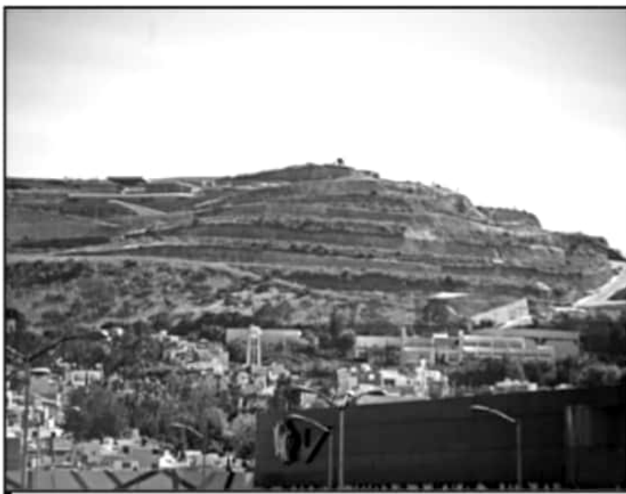
EN DOS DÉCADAS LA MANCHA URBANA DE LA CAPITAL DEL ESTADO HA CRECIDO SIN CORRECTO CONTROL AMBIENTAL.

"A pesar de que hemos propuesto decenas de ocasiones un estudio del arbolado de Morelia para proponer un plan de bosque urbano. Nunca se han interesado las autoridades municipales. Nosotros tenemos la propuesta, pero no se considera prioritario. En esta administración hay un programa de inventario de árboles dirigido por la UNAM con la participación ciudadana", manifestó el especialista.