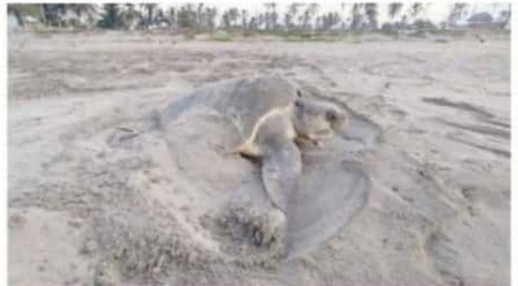
CD. LÁZARO CÁRDENAS, MICH.- Mejoran cifras en cuanto a arribazón de la tortuga marina en el campamento El Habillal

De los mil 200 nidos restan 30 nidos que aún están a resguardo y que a principios del mes de febrero pudieran nacer y realizar su liberación, mismos que motivan a los camperos a seguir con su noble labor de proteger a la tortuga marina.