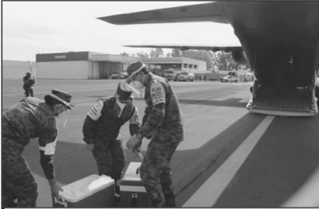
ESTE MIÉRCOLES ARRIBÓ A MICHOACÁN EL SEGUNDO PAQUETE DE VACUNAS CONTRA LA COVID-19, ORIENTADAS PARA CUBRIR LAS APLICACIONES AL PERSONAL DE SALUD

Es importante recordar que el primer paquete de 14 mil 625 vacunas contra el COVID-19 arribó el pasado 13 de enero a Michoacán, pero se registró un déficit de más de dos mil dosis para cubrir a todo el