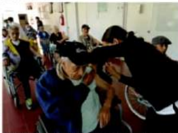
MORELIA, MICH. - Personal del Consejo Estatal de Vacunación, acudieron a la residencia, a fin de evitar el traslado de los abuelitos.

quienes seguirán en confinamiento y con medidas preventivas.