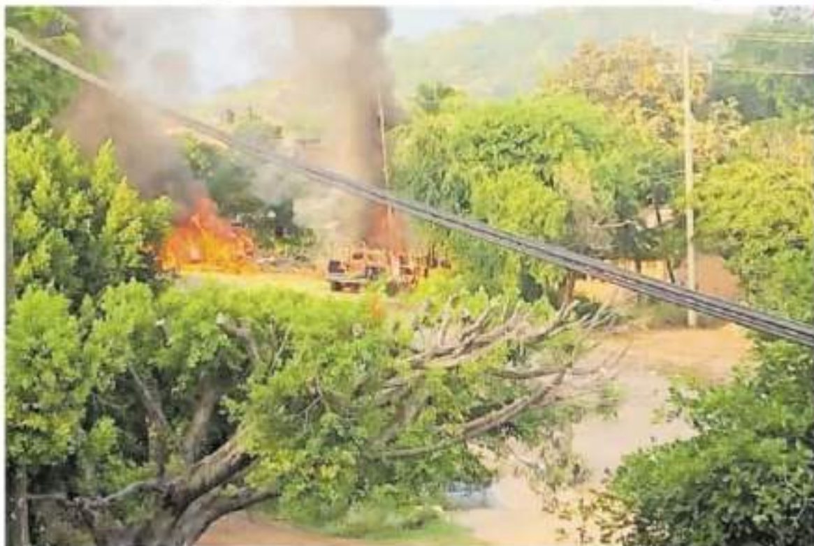
Con bloqueos carreteros casi a diario, los habitantes saben que si no mueren en el fuego cruzado, probablemente lo hagan producto de una enfermedad.

“Si acaso quedan unas 50 personas, los demás ya fueron desplazados por el crimen organizado”