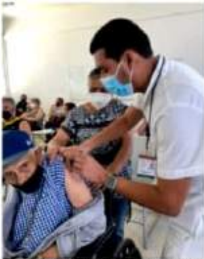
MORELIA, MICH.- El Coeva informa que la aplicación se llevará a cabo según las fechas en que recibieron la primera dosis.