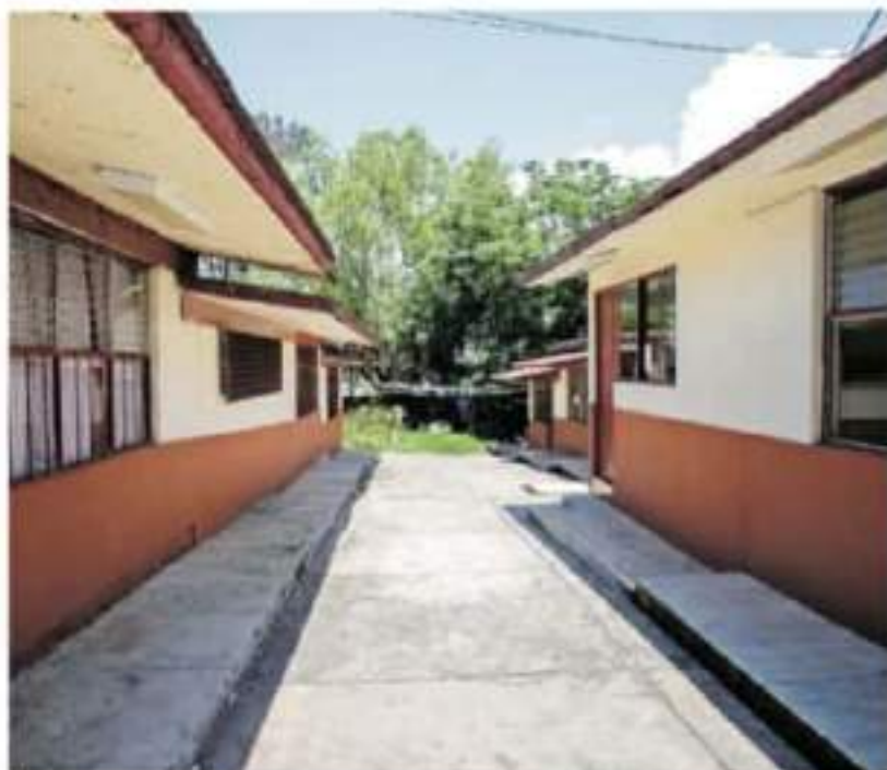
El regreso a las escuelas supone que la falta de los servicios básicos debería estar resuelta.

En el rubro de Condiciones de las Escuelas y sus Servicios, 2 de cada 10 aulas