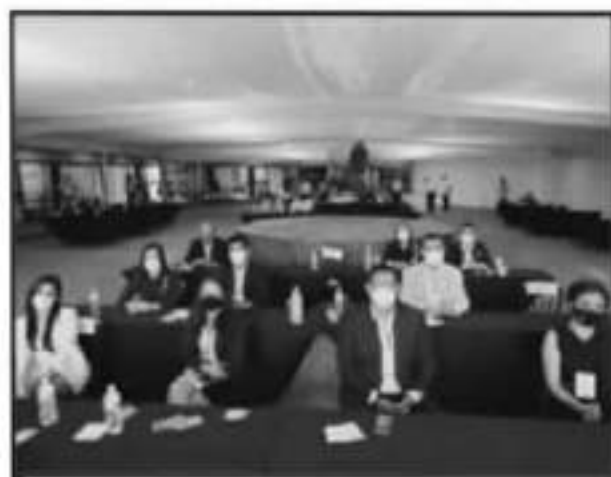
NO HUBO ACCESO A LA PRENSA NI INVITADOS ÚNICAMENTE LOS EQUIPOS DE CAMPAÑA, AUTORIDADES ELECTORALES Y EQUIPO TÉCNICO Y LOGÍSTICO.