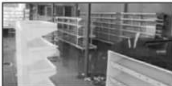
CIENTOS DE PERSONAS HAN PREFERIDO ABANDONAR LAS COMUNIDADES