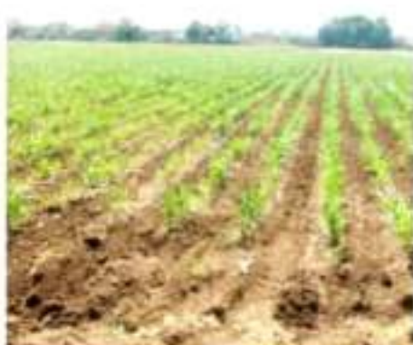
ZAMORA, MICH.- Señaló que en Michoacán hay zonas en donde se pronostican sequías severas extremas, incluso.

Puntualizó al decir que cuál y el pronóstico sea contrario a lo que se tiene en este momento, ya que es necesario que haya lluvias regulares que contribuyan a que los embalses alcancen una considerable recuperación en sus niveles y con ello tener garantizada el agua para el riego agrícola.