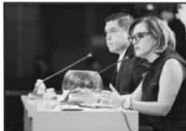
EN LA RUTE FINAL DEL DEBATE SE PUDO EL TEMA DE LA INSEGURIDAD EN EL ESTADO Y CÓMO ENFRENTAR A LOS GRUPOS DE LA DELINCUENCIA.