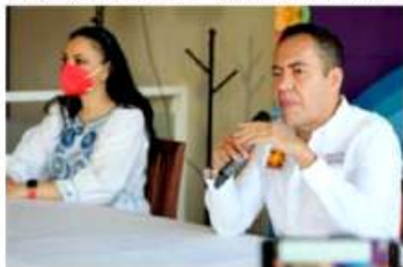
La vocera de la campaña del Equipo por Michoacán adelantó que el candidato continuará impulsando una agenda de trabajo para resolver las problemáticas que aquejan a Michoacán.

puntuales y concretos sobre economía, educación y salud; temas que se desarrollaron en el debate. A su vez recordó que también tiene un compromiso amplio con las mujeres, así como con el tema de seguridad, el medio ambiente, los maestros, además de garantizar un gobierno derecho y transparente.