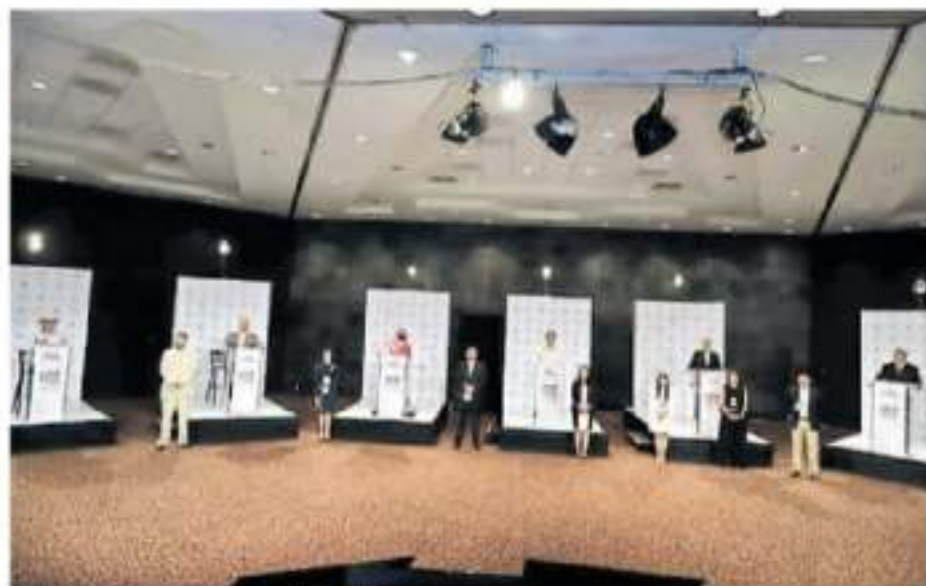
Raúl Morón, el gran ausente en el encuentro