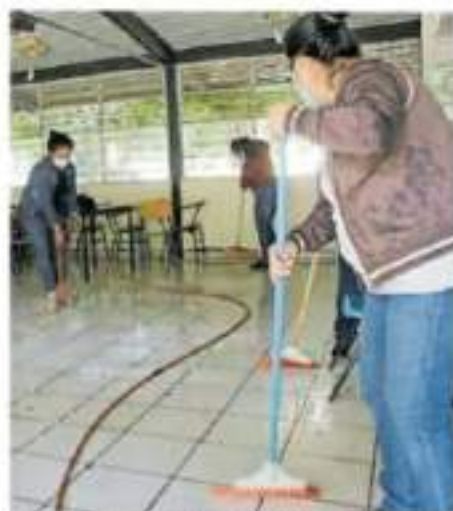
Las jornadas de limpieza se deberán realizar en las más de 12 mil escuelas de Michoacán.

Por último, indicaron que las condiciones necesarias para garantizar el regreso a clases son la vacunación para toda la población escolar, semáforo en verde, dotación de limpiera, garantizar el agua potable, personal médico en las escuelas, rehabilitar y construir los sanitarios, computadoras en escuelas indígenas.