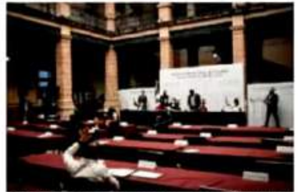
La 74 Legislatura, reconoció que con este proyecto se brinda sustento jurídico y se fortalece la cultura del sistema de donación y trasplante.

Los funcionarios municipales asumirán su cargo en forma inmediata en tanto los alcaldes y el regidor con licencia se encuentren en posibilidad legal y material de reincorporarse a su encargo, mediando el trámite respectivo.