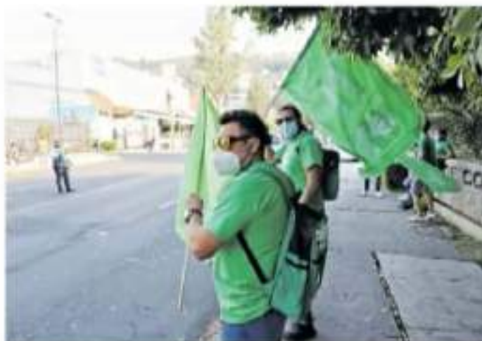
Parras de todos los colores se acercaron al Centro de Convenciones

El candidato del PBL, PAN y PRIJ, comentó su discurso como lo hace en sus