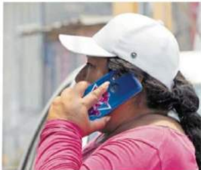
La SSM brinda orientación y asistencia telefónica para atender las enfermedades de salud mental.

El registro de datos del 2018 respecto a personas con los problemas ya antes mencionados suman la cantidad de 232