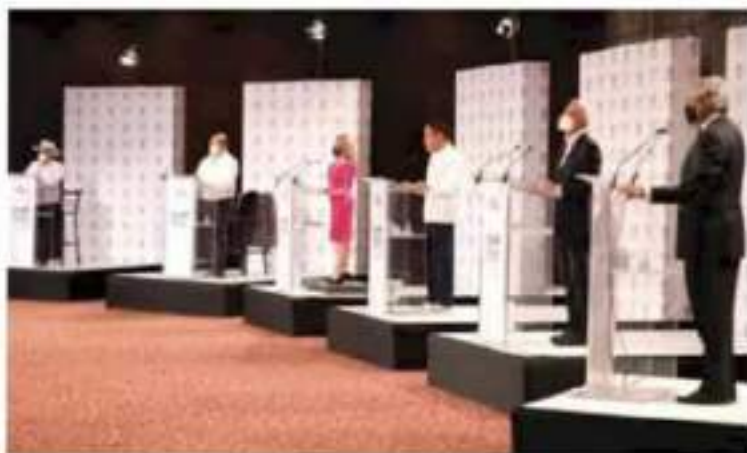
Coincidencia. Los seis consideran que es necesario tocar las puertas de la federación. publicismo