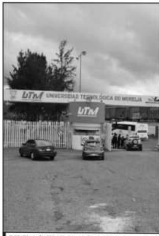
SELCARÁ LA UTM RECLUTAR LA CONFIANZA DE GREMIO Y ESTUDIANTES