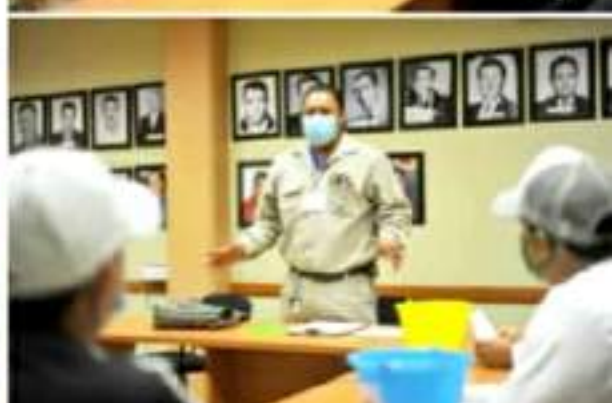
JACONA, MICH.- El Gobierno Municipal trabaja anticipadamente, en coordinación con la Secretaría de Salud, respecto al tema del dengue.