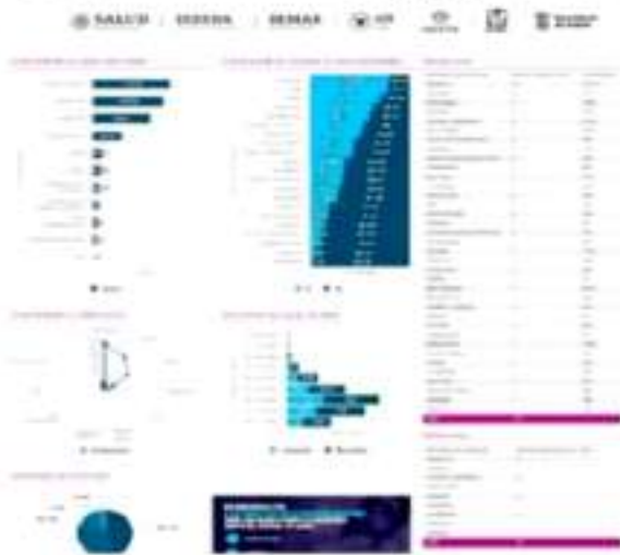
Ayer el CESS reportó 5 nuevos casos positivos de COVID-19 para este municipio, así como tres defunciones más a consecuencia del contagio de este virus.

Por lo que hace a los 20 nuevos decesos por COVID-19, de ellos 5 ocurrieron en Uruapan, así como en Morelia, Maravatio y Lázaro Cárdenas tres en cada lugar, llegando este último municipio a 411 personas falle- ➔