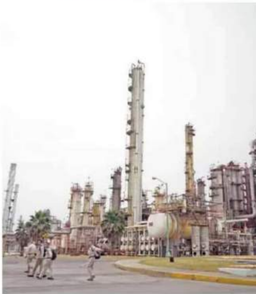
Dictamen. Se anticipan diversos recursos legales de las empresas afectadas.

Incluso, el integrante de Morena agregó que la Comisión Reguladora de Energía (CRE) ha dejado sin efecto la regulación