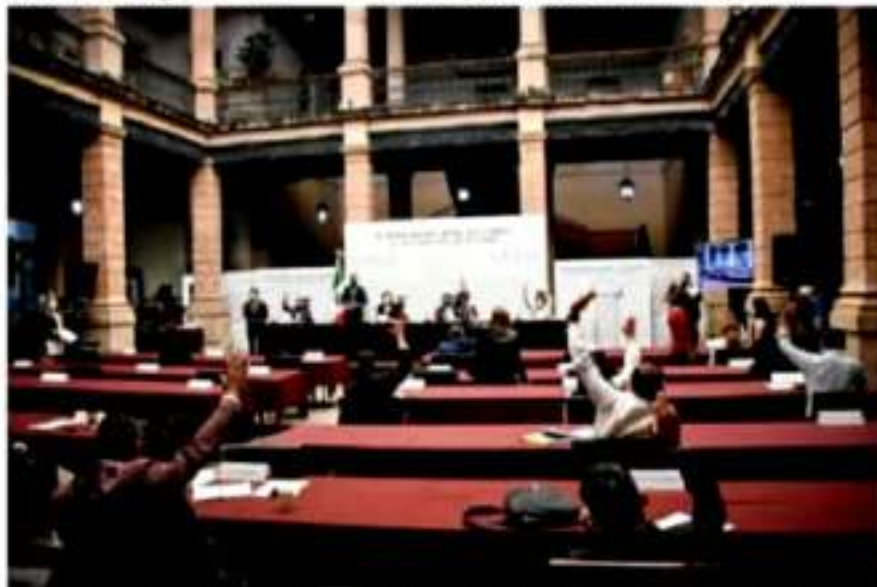
Los alcaldes de Uruapan, Charapan, Pátzcuaro y Tlanhuatío rindieron protesta ante el Pleno.