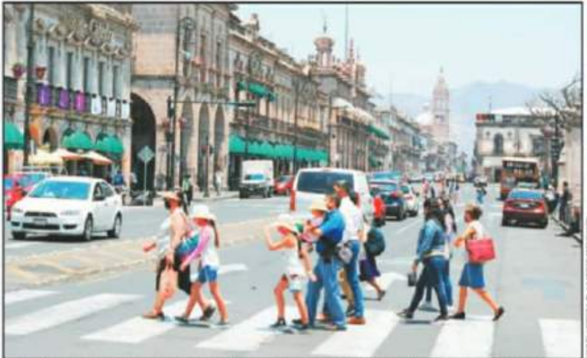
MUCHAS PERSONAS DEJERON LA BANDERA Y PERDIERON TODO CUIDADO SANSINO CUANDO SALIERON A LAS CALLES, ELLO ABONA AL ALLENTO DE CONTAGIOS.

En lo que respecta a los casos acumulados durante más de un año de la pandemia por el COVID-19, Morelia llegó a 13 mil 710 contagios confirmados, Uruapan a 5 mil 291, Lázaro Cárdenas a 6 mil 286 y Pátzcuaro a 2 mil 367. Es decir que estos cuatro