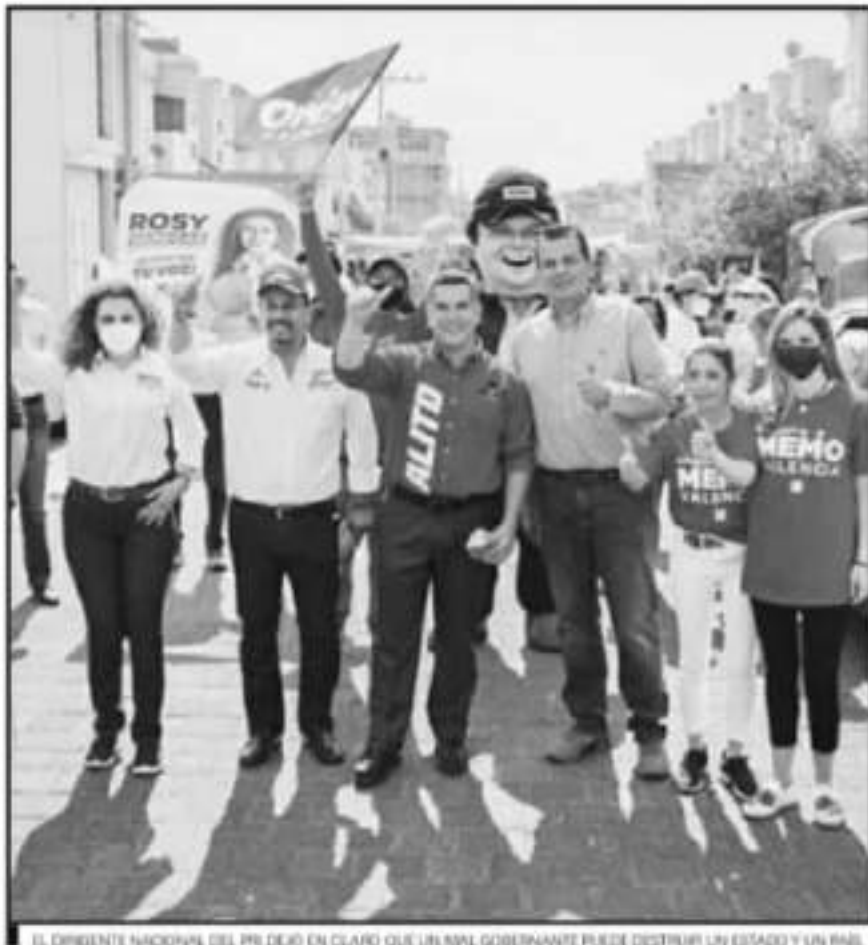
EL DIRIGENTE NACIONAL DEL PRI DEjó EN CLARO QUE UN MAL GOBIERNO PUEDE DESTRUIR UN ESTADO Y UN PAÍS.

En un evento con líderes y militantes priistas de la región de Atapanes, después de haber