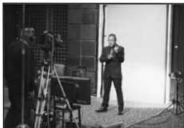
LA CIUDADANA PUDO PROPONER SUSTIMAS O FRECUENCIAS DE SU INTERÉS, ESTO MEDIANTE LAS REDES SOCIALES Y UNA PLATAFORMA DIGITAL.