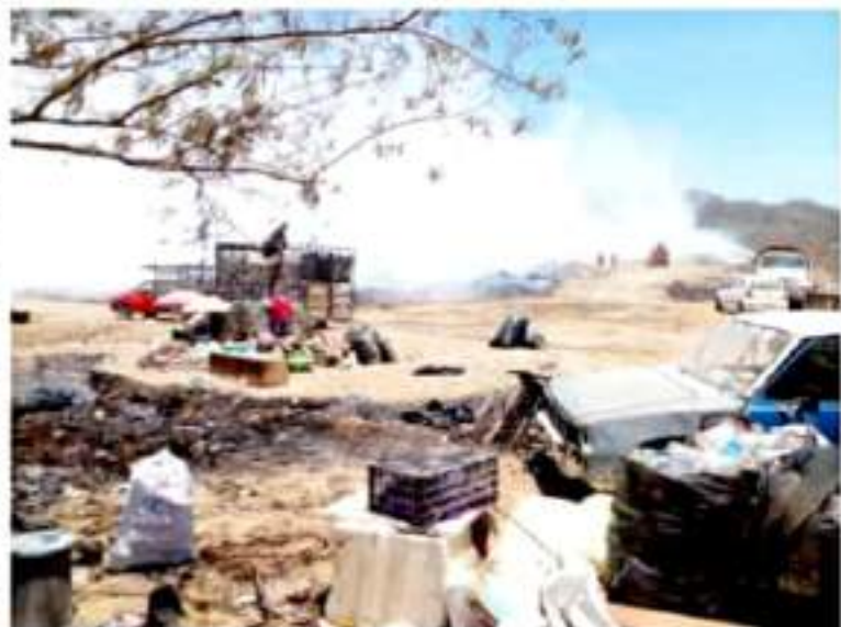
CD. LÁZARO CÁRDENAS, MICH.- El incendio en el relleno sanitario de San Juan Bosco pudiera ocasionar problemas de salud entre los habitantes de las comunidades cercanas.

"La constancia de estas conflagraciones se debe al gas metano producido por los restos orgánicos, los cuales, bajo un buen aprovechamiento, podrían transformarse en bio-fertilizantes y evitar este tipo de incendios, que pone en jaque a la población", destacan en redes sociales grupos ambientalistas.