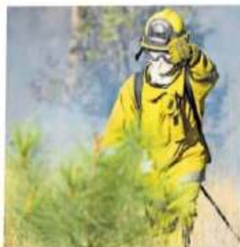
Michoacán ha presenciado varios incendios en distintas zonas.

De las poblaciones que brindaron su ayuda, se mencionó a Sincicho, Cherán, Cheránillo, Nuevo Zirota, San José de Periban, Imbaracuanes, Periban, Uruapan y Patamacuar. Con información de Juan Barro