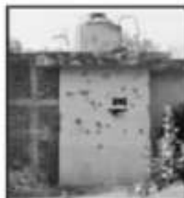
VIVIENDAS LLEEN BALLEADAS