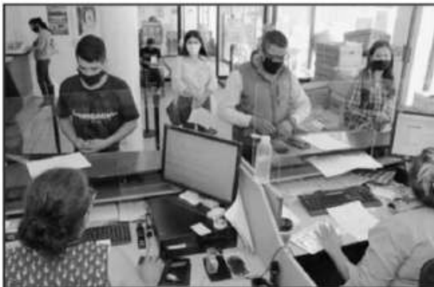
HASTA EL MOMENTO NO HAY NINGÚN ANUNCIO SOBRE LA EXTENSIÓN DEL PLAZO PARA PAGAR ESTE IMPUESTO.

Nueva' permite un recargo porcentual del 20 al 25% en los autos al coincidir con el pago del refrendo, habiendo casos de personas que deben más de uno o dos años.