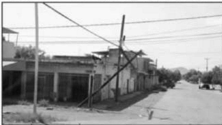
ANTEFRONTOS EXTORSIONES Y AGRESIONES DE GRUPOS DELICTIVOS AGUILILLA LUCE COMO PUEBLO FANTASMA

una conducta de tipo penal que se tipifica como terrorismo", manifestó el titular de la SSP.