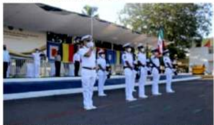
CD. LÁZARO CÁRDENAS, MICH.- La Décima Zona Naval con sede en este Puerto, llevó a cabo la Ceremonia Conmemorativa del Centésimo Séptimo Aniversario de la Gesta Heroica del puerto de Veracruz, en la cual los alumnos de primer y segundo año de la Escuela de Maquinaria Naval

El acto dio inicio con la historia de la Armada de México y se llevó a cabo en la explanada de la Escuela de Maquinaria Naval.