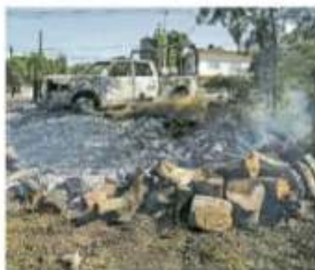
Quiénes han decidido quedarse, afirma Segura, “son los más pobres y los más viejos”

Desde que la crisis tuvo su punto más alto, en el último mes de 2020, diferentes sacerdotes se han organizado para llevar desposos y medicinas a los cada vez menos habitantes de El Aguaje, sin la certeza