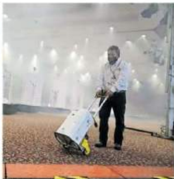
Desinfección previa al debate