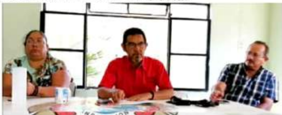
ZAMORA, MICH.- En total son 21 sindicatos afiliados a la Confederación, pero tan sólo 19 son de Zamora.

Es por ello, que decidieron no apoyar al candidato a la presidencia municipal, quien en los últimos años no ha unificado a su gente, y se ha presentado una desbandada del partido, algunos de ellos, incluso han renunciado.