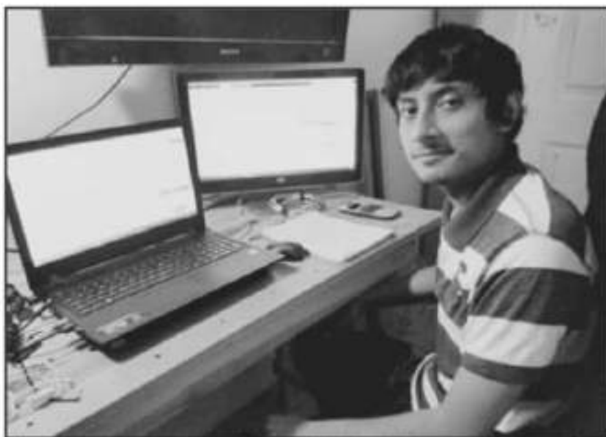
LA CASA DE LAS INGENIERÍAS APROVECHA PARA SEGUIR OFRECIENDO ACTIVIDADES ALTERNATIVAS AL ALUMNADO.

Las y los estudiantes se inscribieron de forma voluntaria y todos los jueves se reúnen en línea durante una hora y media en este taller literario, detalló, además de señalar que esta actividad se da en el marco de las actividades por