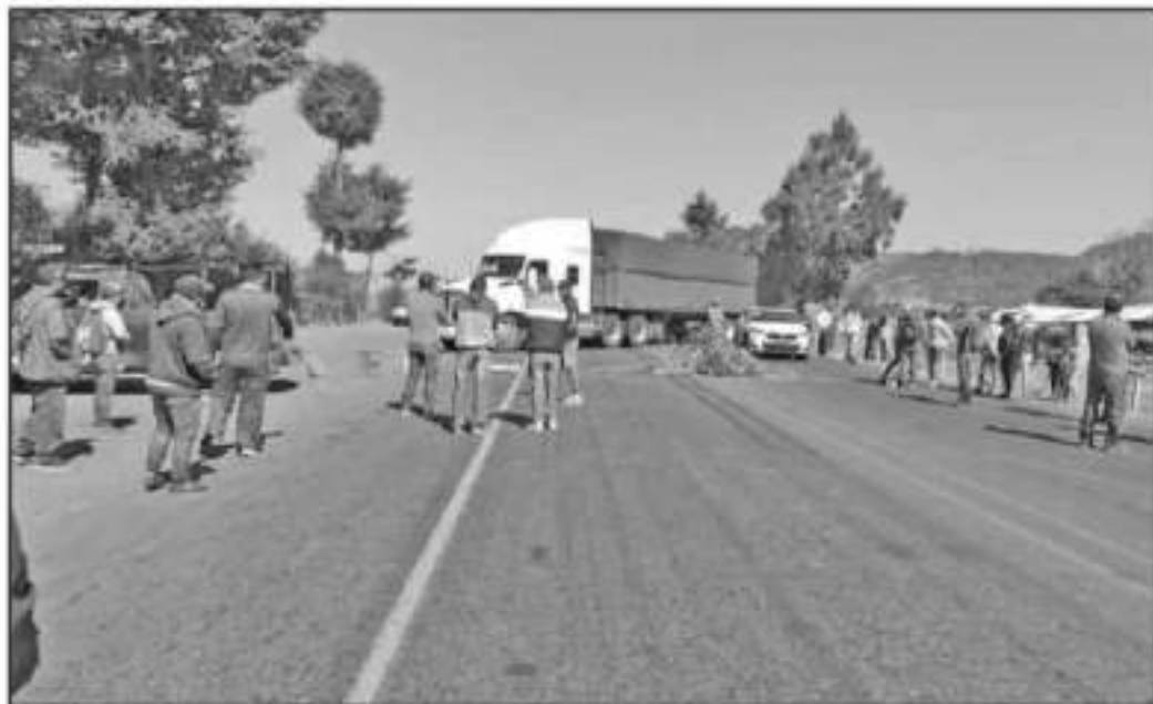
HABITANTES DE COMUNIDADES PURÉPECHAS AFECTADAS POR LOS INCENDIOS BLOQUEARON LAS VÍAS REYES-ISCORIA Y URUAPAN-LOS REYES PARA EXIGIR RESPUESTAS.

Las carreteras, los Reyes-Iscoria a la altura de Tingitredes y la carretera Uruapan-Los Reyes fueron cerradas durante varias horas para exigir al gobierno federal y estatal la atención oportuna a los problemas medio ambientales que han dejado los incendios.