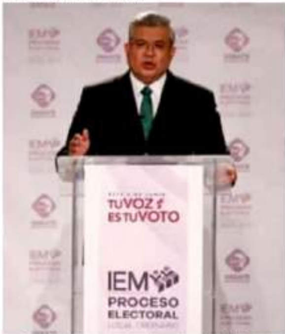
Partido Verde, la opción real para lograr el cambio en Michoacán.