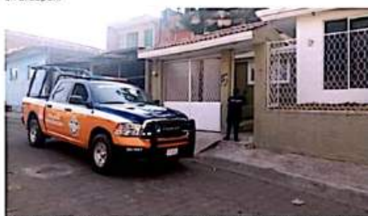
URUAPAN, MICH.- La Secretaría de Seguridad Pública Tránsito y Vialidad Municipal, a través de la Unidad Especializada de Atención a Víctimas de Violencia de Género, realiza acciones para la prevención del maltrato y atención a mujeres.

Además de brindar apoyo psicológico y asesoría legal, en los casos que así lo requieren, la también conocida como Unidad Naranja mediante el CSI, da atención a un promedio de 5 llamadas diarias de apoyo por violencia doméstica en Uruapan.