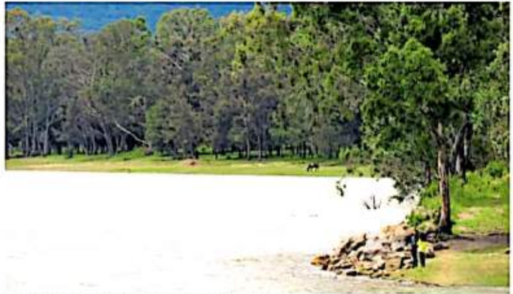
Presas de Coitzió, es una de las que tiene su capacidad rebasada. ANDRÉS HERNÁNDEZ