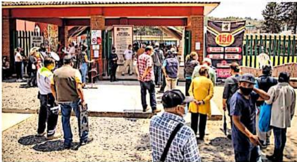
En Jarácuaro, las autoridades comunales tuvieron que acordar la aplicación del biológico directamente con el delegado de Bienestar.

Después de sufrir durante años las extorsiones de Los Caballeros Templarios, los habitantes de Coahuayana ahora enfrentan la llegada del CMG. Pág. 7