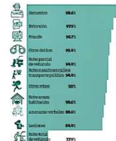
*Porcentaje de los delitos que no se denuncian

por cada 100 mil habitantes y en 2019 se registraron 24 mil 849 delitos.