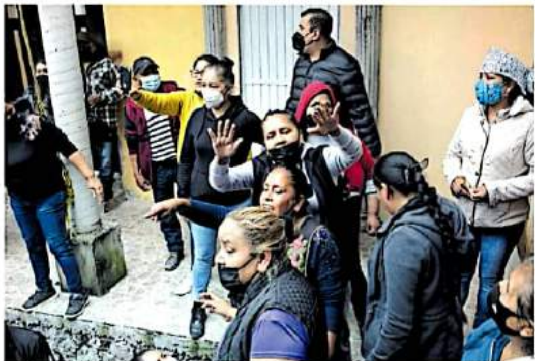
En la consulta celebrada en Jarácuaro asediaron a las autoridades electorales. (CINCUENUEVE)