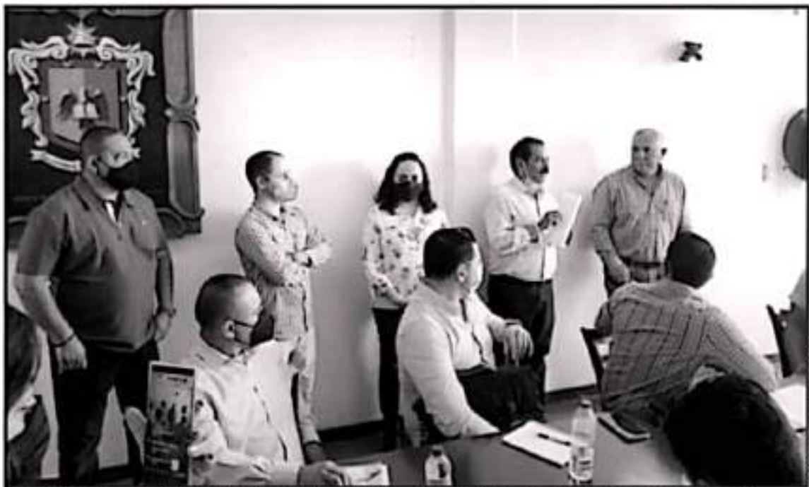
LA QUEJA DEL REGIDOR MORENISTA ES PORQUE EL SECRETARIO DEL AYUNTAMIENTO INCUMPLIÓ LO ESTABLECIDO POR LA LEY ORGÁNICA MUNICIPAL.

"Razon por lo que solicito que en términos del Artículo 109 de la Constitución Política del Estado Libre y Soberano de Michoacán de Ocampo se le devuelva de la presente denuncia a la Auditoría Superior del Estado a fin de que se deslinde las responsabilidades conducentes". Anexo a la denuncia el regidor morenista entregó a la funcionaria municipal copia certificada del Acta de Cabildo número 3 de