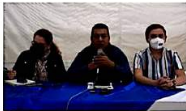
MORELIA, MICH.- Se prepara una caravana motorizada desde las diversas regiones hasta la capital michoacana.