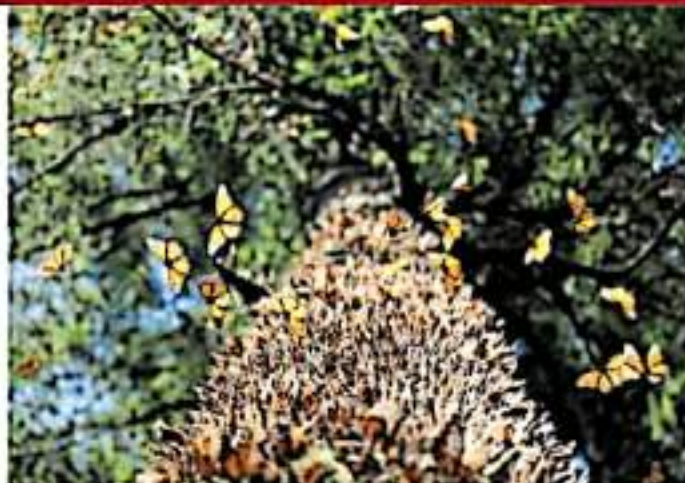
El oyamel no puede plantarse a más de 3 mil 500 metros sobre el nivel del mar.

Diversos modelos de cambio climático indican que el hábitat de estos insectos va a extinguirse por completo, pues el espacio en las montañas se está degradando