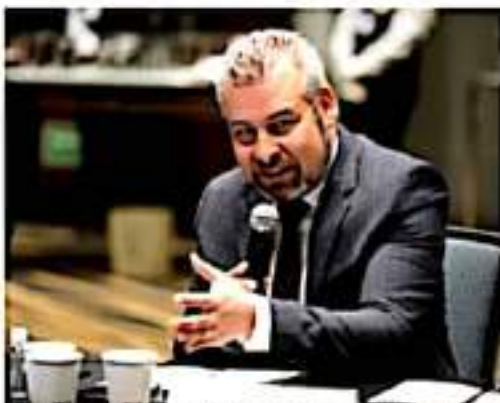
MORELIA, MICH.- El gobernador electo de Michoacán, Alfredo Ramírez Bedolla.

Educación Pública Delfina Gómez tienen disposición plena a dialogar con el magisterio, y trabajar en conjunto con Michoacán.