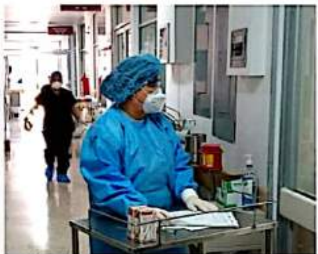
CD. LÁZARO CÁRDENAS, MICH.- La ocupación hospitalaria de los nosocomios con camas reconvertidas para la atención de pacientes Covid-19 de Lázaro Cárdenas reporta un 48.65 por ciento.

Asimismo, se mantiene a disposición de la población el 800-123-2890 con 11 líneas para resolver todas sus dudas sobre el padecimiento.