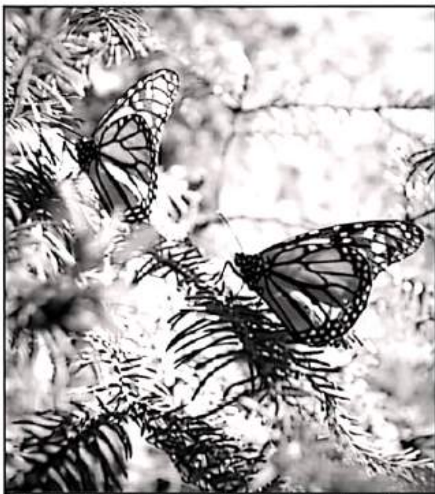
UNOS 70 AÑOS DE VIDA COMO HABITAT DE LA MARIPOSA MONARCA LE Quedan a bosques michoacanos

Los investigadores señalan que, a finales de este siglo el bosque específico de oyamales des-