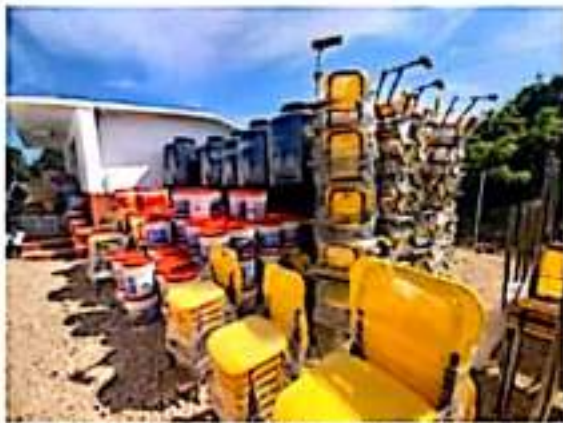
Un total de 24 escuelas primarias de los municipios de Aquila, Arteaga y Lázaro Cárdenas, fueron beneficiadas con la dotación de diverso material.

Informar además, que parte del material entregado será distribuido en 24 escuelas primarias de los municipios de Aquila, Arteaga y Lázaro Cárdenas, el cual es consistente en: tinacos, cubetas de pintura e impermeabilizante, equipo de cómputo, kits de material de limpieza, mesas (escritorios), pintarrones, kits de material didáctico, sillas para docentes, mesas binarias con sillas, butacas, cuaderillos, carteles informativos, lonas con filtros escolares, botellas de alcohol en gel y cloro, barras de jabón, toallas sanitarias y cubrebocas.