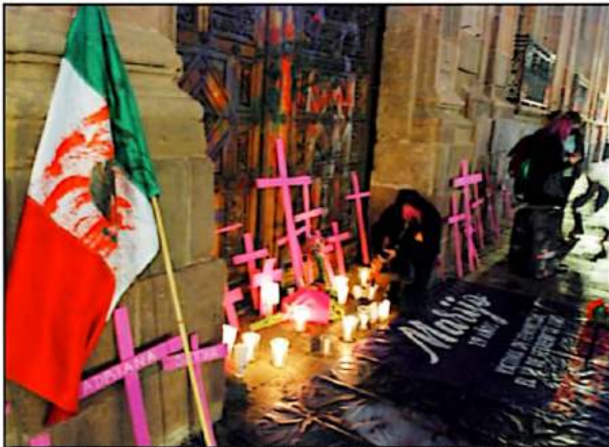
SON MÁS DE 160 MUJERES QUE FUERON VÍCTIMAS DE HOMICIDIO EN EL ESTADO, CUYOS CASOS SE INVESTIGAN EN SU MAYORÍA BAJO EL DELITO DE HOMICIDIO DOLOSO.

CONTRARIO AL COMPORTAMIENTO EN MICHOACÁN LA CIFRA NO SÓLO NO BAJA, SINO C