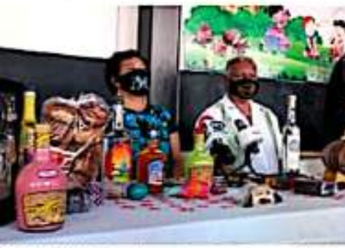
MORELIA, MICH. - En el lugar hay diversas artesanías, textil, bordados, pan, mezcales de diferentes tipos, moles, café, chocolate, tlaxuyudas y tamales oaxaqueños, entre mucho más.