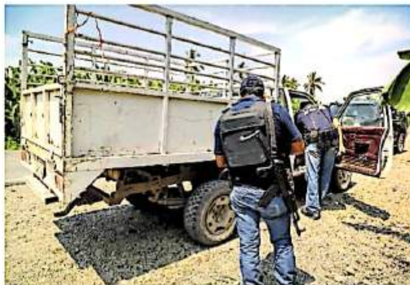
Rondín cotidiano de la policía comunitaria en los caminos entre las distintas propiedades dedicadas a la producción de plátano.