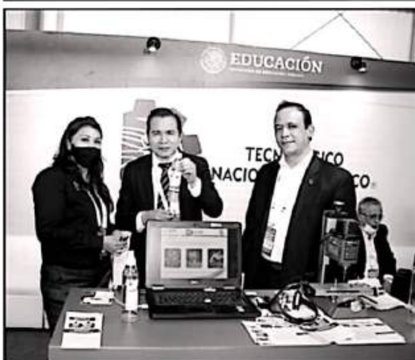
EL TECNOLÓGICO DE MORELIA SE DID CITA EN LA BASE AÉREA DE SANTA LUCÍA PARA DAR A CONOCER SUS PROYECTOS