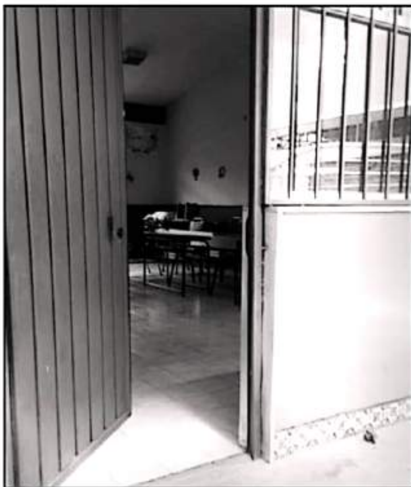
LOS LADRONES FUERZARON LAS CHAPAS Y SE LLEVARON PARTE DEL FORTÍN MUEBLAR QUE TENÍA EL PLANTEL.

Es importante señalar que expresiones magisteriales de diverso espectro político, han señalado que existen pocas condiciones para el retorno presencial y que si bien existe ánimo