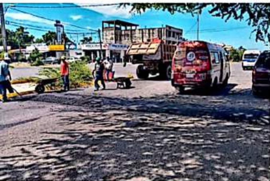
CD. LÁZARO CÁRDENAS, MICH.- El gobierno municipal mantiene activo el programa de bacheo en calles y avenidas de Lázaro Cárdenas que han sido dañadas por las constantes lluvias.