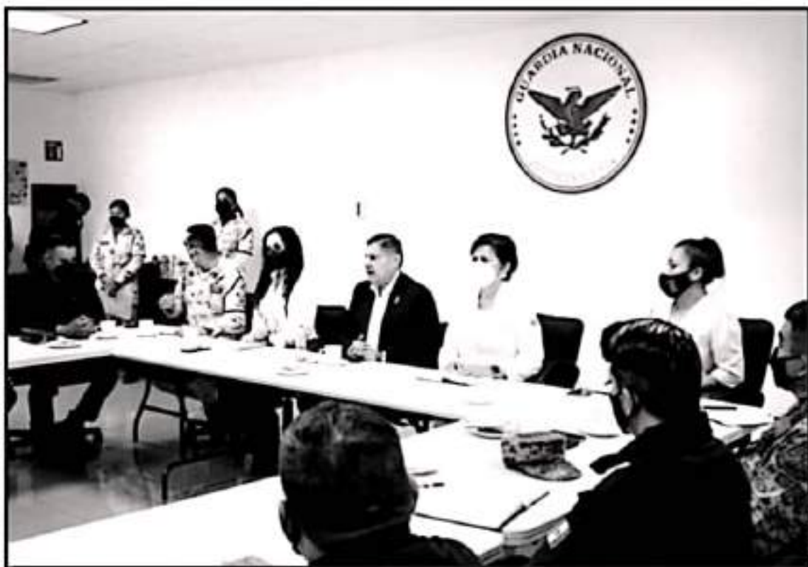
LA ÚLTIMA REUNIÓN DE LA MESA DE SEGURIDAD REGIONAL, DE LA SECRETARÍA DE SEGURIDAD Y PROTECCIÓN CIUDADANA SE LLEVÓ A CABO EN CARTEA PUERTA ERRADA.