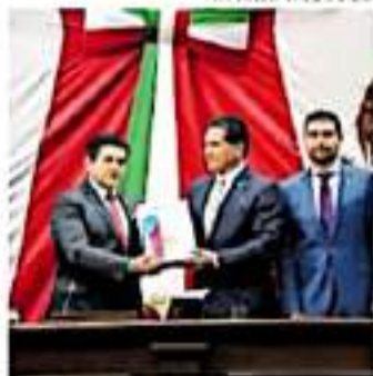
El último informe está programado para el 29 de septiembre.