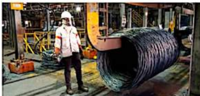
CD. LÁZARO CÁRDENAS, MICH.-A ArcelorMittal, durante el gobierno de Felipe Calderón le fue eximido el pago de impuestos por 1279 mdp, y con Peña Nieto 260 mdp, según el listado que presentó la Presidencia de la República.

Así, recordó que esas instituciones -junto con muchas otras- fueron beneficiadas por los gobiernos de Felipe Calderón y Enrique Peña Nieto, quienes les perdonaron el pago multimillonario de impuestos.