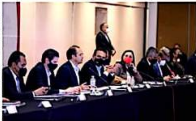
MORELIA, MICH.- "Michoacán ocupa el lugar 25 en incidencia delictiva, donde el uno es el que más incidencia delictiva tiene, donde el uno es el que más incidencia delictiva tiene", sentenció Silvano Aureoles.

Al encabezar la reunión plenaria de las Mesas Ciudadanas de Seguridad y Justicia de Michoacán, destacó que hubo una transformación total en la atención de estos temas en los municipios, para combatir los delitos y renovar el sistema penitenciario. "Si hay un tema importante para los ciudadanos es la seguridad y tenemos que seguir fortaleciendo la