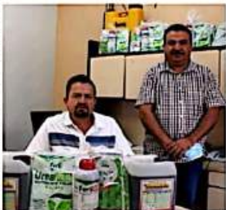
JACONA, MICH.- Isidro Mosqueda, alcalde de este municipio y quien además es conocido productor del campo.

Cabe resaltar que estos programas serán permanentes durante toda la administración municipal ya que el apoyo al campo es una prioridad del presidente municipal, Isidro Mosqueda, porque siendo él parte de este sector comprende las necesidades que enfrentan todos los que se dedican a cualquier práctica agrícola.