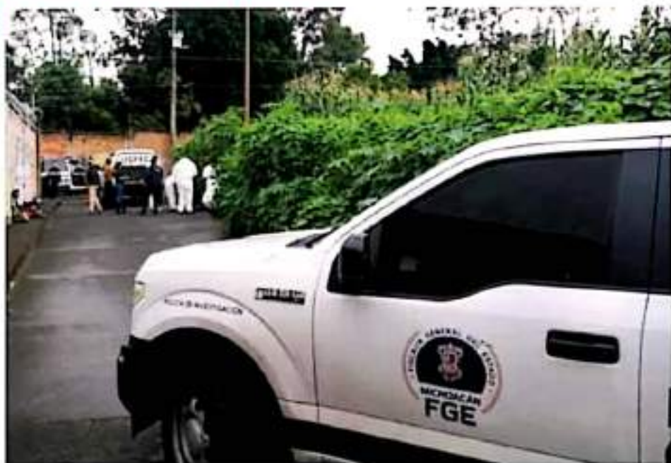
Inseguridad. Durante las últimas semanas se han registrado varios asesinatos en la entidad.

Según datos de Semáforo Delictivo, los meses de enero y agosto de este año fueron los que tuvieron el mayor número de incidencias, al acumular 73 casos, es decir, el 32.44% del total.