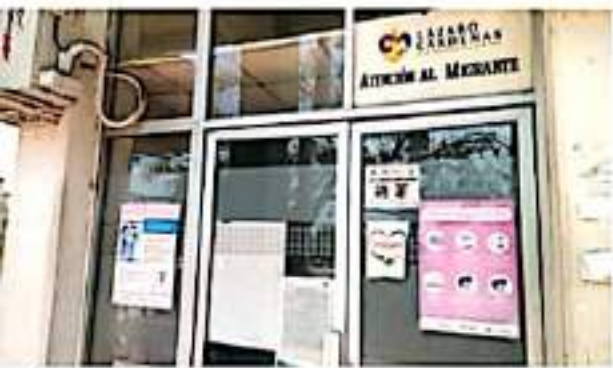
CD. LÁZARO CÁRDENAS, MICH.- El Departamento de Atención al Migrante e Indígena invita a ser parte del Programa "Soy México".

Este programa estará vigente hasta el mes de noviembre y para mayor información se invita a pasar a las oficinas de Atención al Migrante, ubicadas en la planta baja del Palacio Municipal, de lunes a viernes en horario de 8 am a 16 horas.