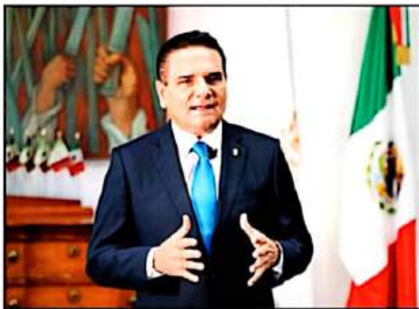
NO SE DESCARTA QUE AURELES COMPLEMENTE UN MENSAJE POLÍTICO A TRAVÉS DE LAS REDES SOCIALES.

No se descarta que Aureoles Consejo emita un mensaje político a través de las redes socia-