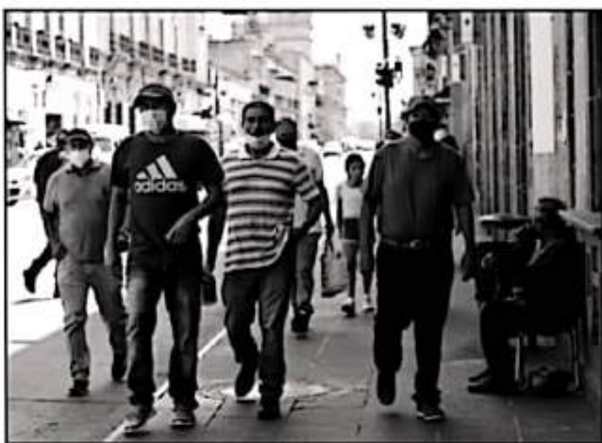
EXISTE LA AUTORIDAD EN LO QUE RESPECTA A LAS NORMAS SANITARIAS, AUN CONTANDO CON LA VACUNACIÓN.

casos activos en el estado, los cuales podían ser hasta ocho veces más, pues de acuerdo con autoridades sanitarias, esa sería la verdadera magnitud estimada de la epidemia.