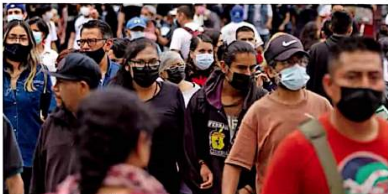
Delincuencia. En términos generales, las mujeres se sienten más inseguras que los hombres en diversos lugares públicos o privados. / QUINTANA ROO