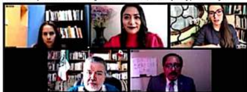
Durante el Conversatorio sobre la Participación y Representación Indígena en el Proceso Electoral 2021 se habló del reconocimiento de sus derechos político-electorales de los pueblos originarios.