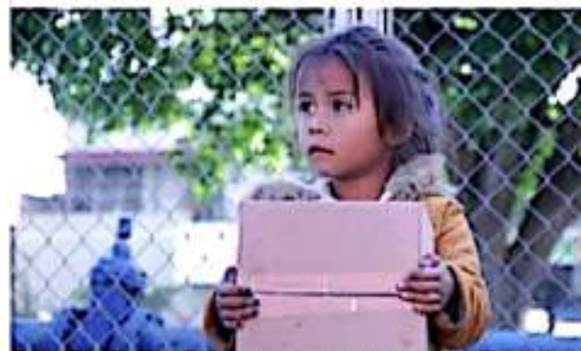
ZAMORA, MICH.- La entrega de los apoyos fue dirigida a madres de familia, mujeres embarazadas y en periodo de lactancia.

Agregó que para abarcar completamente el municipio para que más familias tengan acceso a estos programas, se cuenta con el apoyo de 65 alumnos del Colegio de Bachilleres, quienes están realizando el levantamiento del padrón de beneficiados y con ello concluir su servicio social. Recalcó que se está trabajando en nuevas estrategias para reactivar lo más rápido posible las actividades en los Cedeco y PREP ofrecer a los usuarios servicios de psicología, enfermería, odontología y talleres que al mismo tiempo sirven para que las familias puedan autoemplearse para un buen vivir.