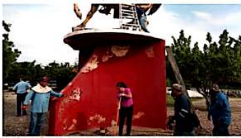
CD. LÁZARO CÁRDENAS, MICH.- La administración municipal realiza trabajos de limpieza en avenidas de Lázaro Cárdenas y en la comunidad de Acalpican de Morelos, embelleciendo la plaza y el lugar, como parte de los festejos del mes patrio.

En conmemoración del natalicio de José María Morelos y Pavón, también se realizó el mantenimiento a la plaza de Acalpican de Morelos y el monumento al Siervo de la Nación.