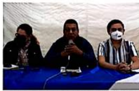
MORELIA, MICH. - Se prepara una caravana motorizada desde las diversas regiones hasta la capital michoacana.