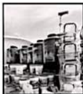
SE NECESARIAN OTROS PLANTELES