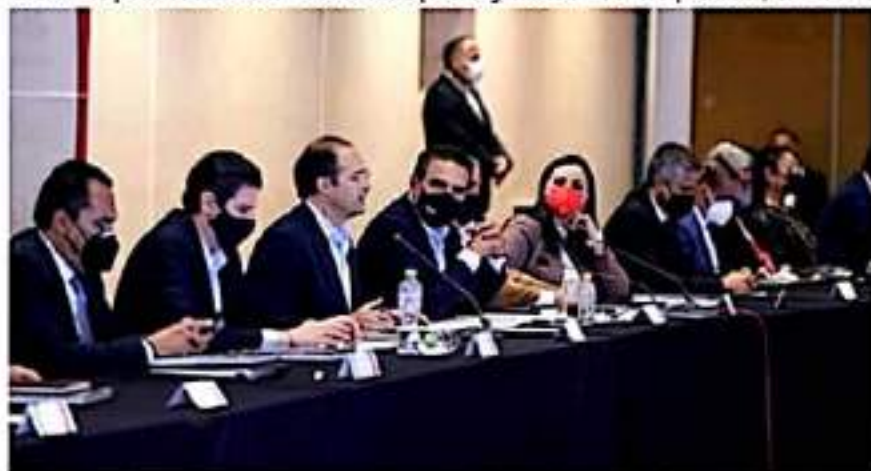
Encabeza Gobernador reunión plenaria de las Mesas Ciudadanas de Seguridad y Justicia de Michoacán.