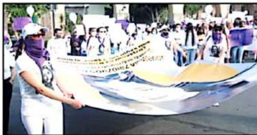
TODOS LOS MESES DEL 2021 HAN REGISTRADO AL MENOS UN CASO DE UNA ASESINADA EN CONDICIONES DE VIOLENCIA DE GÉNERO

Violencia de género, al alza La incidencia registrada por el Secretariado, destaca un total de 41 víctimas de homicidios dolosos por cada 100 mil mujeres, mientras que en el tema de feminicidios el dato es aun menor. La tasa obviada menos de un 0.24 presuntos casos de este delito por cada 100 mil mujeres que habitan en el estado de Michoacán, dato incluso por