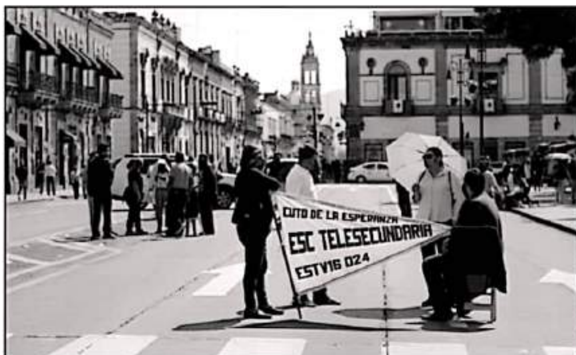
SIGUIRÁN LAS MANIFESTACIONES DE MAESTROS EN EL CENTRO HISTÓRICO; TEMER QUE LLEGARÁN A CUARTO QUINCENAS SIN PAGO POR TEMAS POLÍTICOS.

Cabe señalar que a las acciones de presión se sumarán representantes de 16 grupos de educación media superior y superior, como parte de los acuerdos de la primera Convención de los trabajadores.