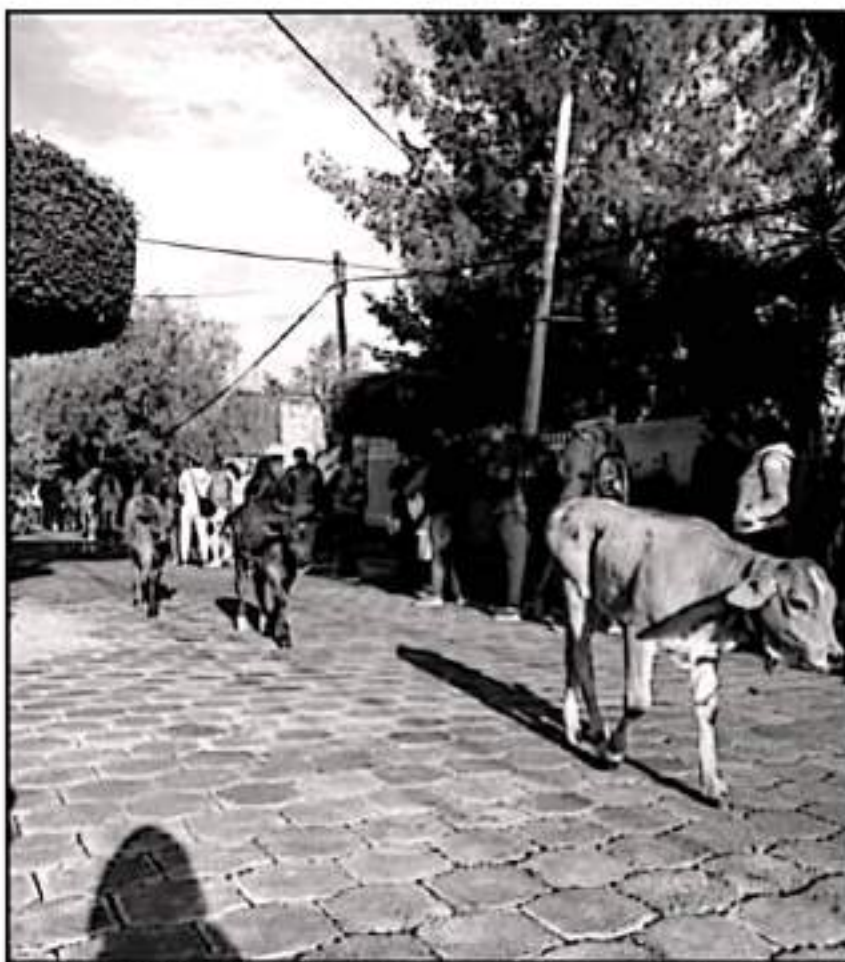
SE TIENE CONTEMPLADA LA APLICACIÓN DE CINCO MIL DOSIS DEL BIOLÓGICO DURANTE ESTE MIÉRCOLES Y JUEVES