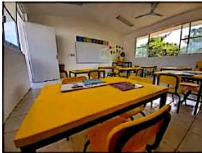
CD. LÁZARO CÁRDENAS, MICH.- Dignifican educación de niños y niñas con nueva aula y sanitarios en la colonia Antorcha Campesina.