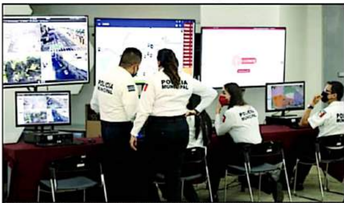
SE DESTACÓ QUE LA POLICÍA MORELIA DEBÓ DE LEVANTAR DENUNCIAS Y TRABAJAR EN COORDINACIÓN CON LOS ELEMENTOS DE LA FISCALÍA DE MICHOACÁN

"Nosotros no tenemos todavía a información de si ellos enviaban estadísticas o no. Para que la estrategia funcione o se pueda construir algo es en base