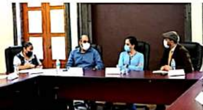
ZAMORA, MICH.- Los módulos para la aplicación del biológico se habilitaron en la Unidad Deportiva "El Chamizal" y la Clínica Familiar del IMSS 82 de Romero de Torres.