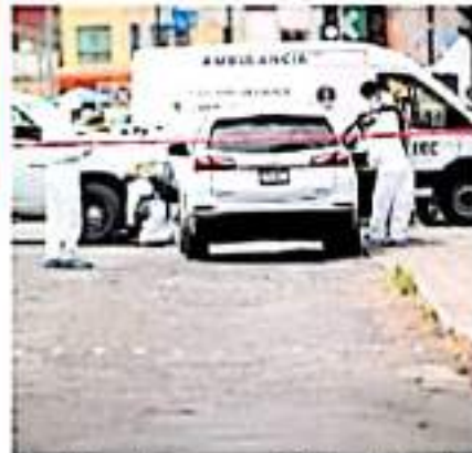
La capital registró en agosto 37 homicidios dolosos.