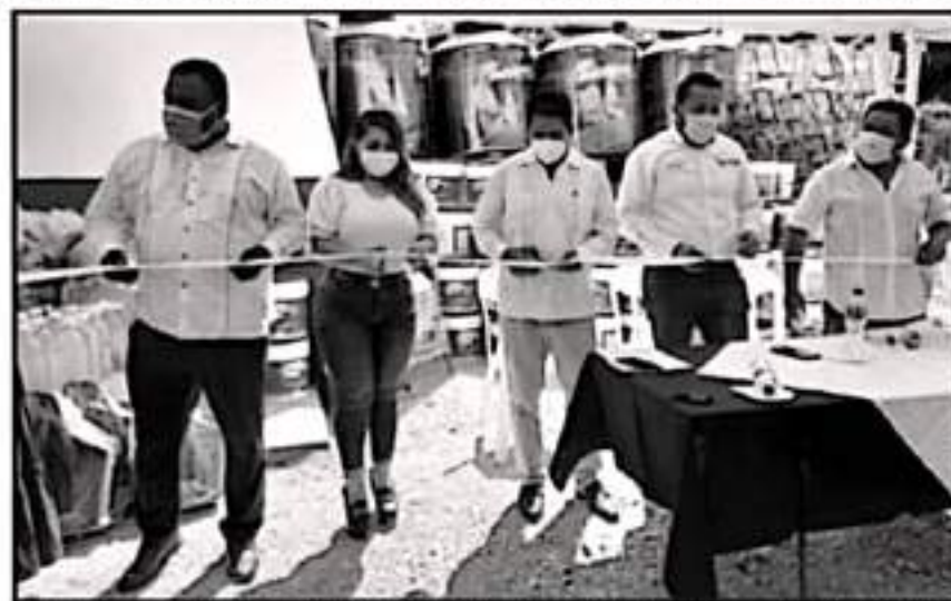
CON LA CONSTRUCCIÓN ENTREGADA SE CUMPLE EL OBJETIVO DE CONVERTIR AL PREESCOLAR EN UN ESPACIO DIGNO