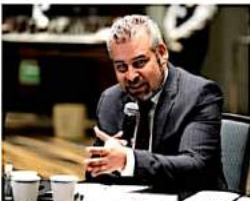
MORELIA, MICH.- El gobernador electo de Michoacán, Alfredo Ramírez Bedolla.

Educación Pública Delfina Gómez tienen disposición plena a dialogar con el magisterio, y trabajar en conjunto con Michoacán.