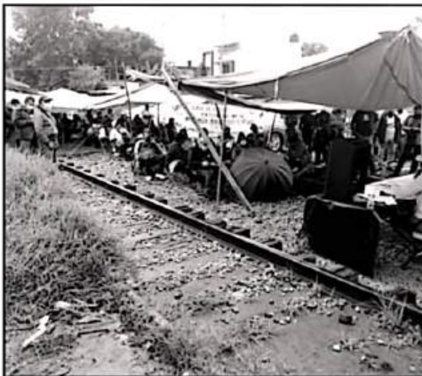
EMPRESARIOS PIDEN AL GOBIERNO MAYOR DISCRECIÓN PARA RESOLVER INCISOS DOCENTES Y LIBERAR LAS VÍAS