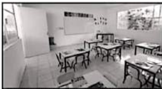
EL SALÓN FUE ENTREGADO COMPLETO.