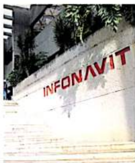
Son más de 4 millones de preguntas y consultas las que se reciben al año en el Instituto

De forma paralela, la Sección XVIII de la CNTE informó que el jueves y viernes empezarán más acciones de protesta tanto en Morelia como en otros municipios de la entidad. En la capital del estado se instalará un plantón frente a casa de Gobierno, y de forma simultánea habrá toma de casetas, así como el cierre de carnicerías y de instalaciones de Petróleos Mexicanos en el puerto de Lázaro Cárdenas.