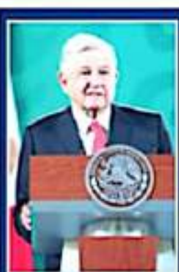
AMLO DESTACA TRABAJO

La capital michoacana ocupa la sexta posición de 50, con 37 asesinatos, de acuerdo con el informe federal. Uruapan y Zamora están en los lugares 13 y 14, con 29 y 26 delitos, respectivamente, y Irapuato es el lugar 23, con 23.