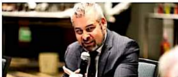
Llamado. El gobierno de México tiene disposición de dialogar, afirmó Bedolla.