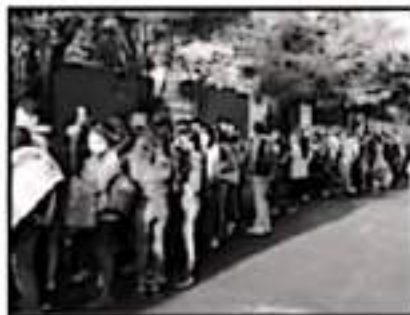
EN LA FILA SE PRESENTARON MOMENTOS DE TENSIÓN