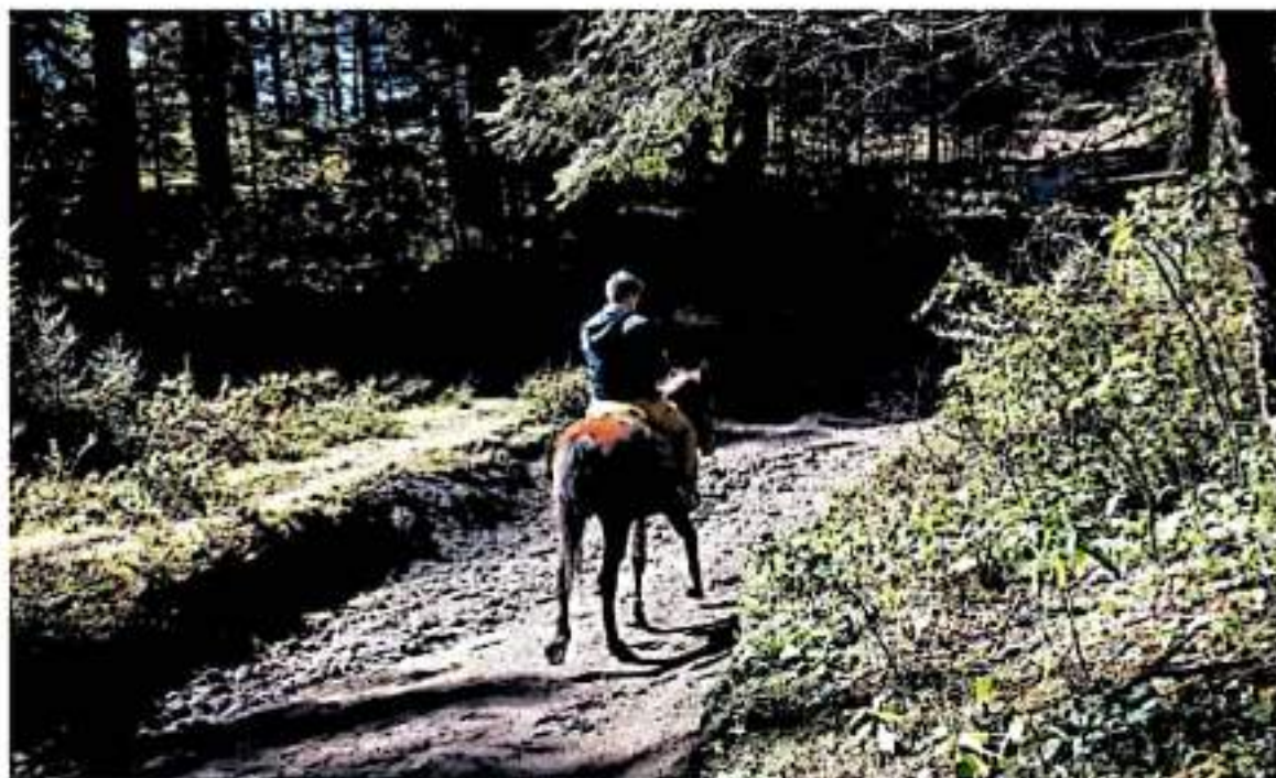
El clima propicio para el oyamel va a desaparecer en la Reserva de la Biosfera de Monarca en menos de un siglo.

PREVEÉN QUE PARA 2090 DESAPAREZCA HÁBITAT