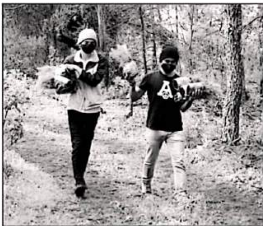
LOS BOSQUES MICHOACANOS HAN SIDO DEGRADADOS EN BUENA PARTE POR LAS FRACCIONADORAS

los distritos michoacanos en el desarrollo de sus propios planes de ordenamiento territorial y ecológico ha torpado la necesidad de que se diseñen de manera regional con el apoyo del Gobierno del estado. Desde la Sierra Costa y otras zonas del estado han desarrollado esquemas de coordinación para estudiar el uso de los suelos y los recursos naturales. El objetivo es que estos programas de ordenamiento, sean tomados como herramientas por parte de los ayuntamientos para que cumplan con sus obligaciones.