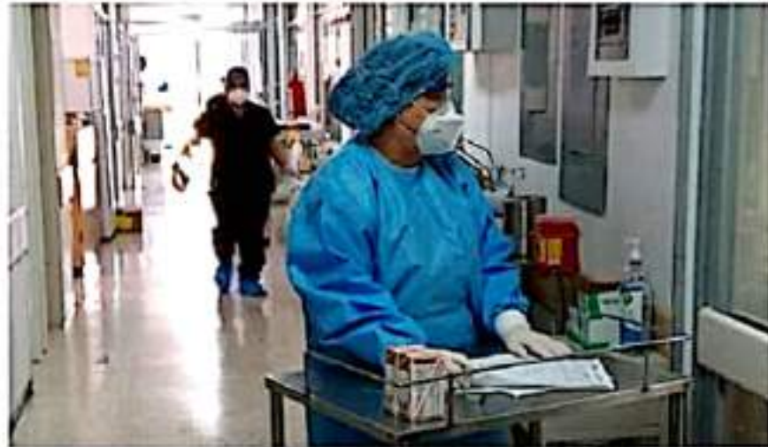
Según la SSM hasta el pasado martes, el Hospital General de LC, presentaba una ocupación de camas Covid del 68.75 por ciento.