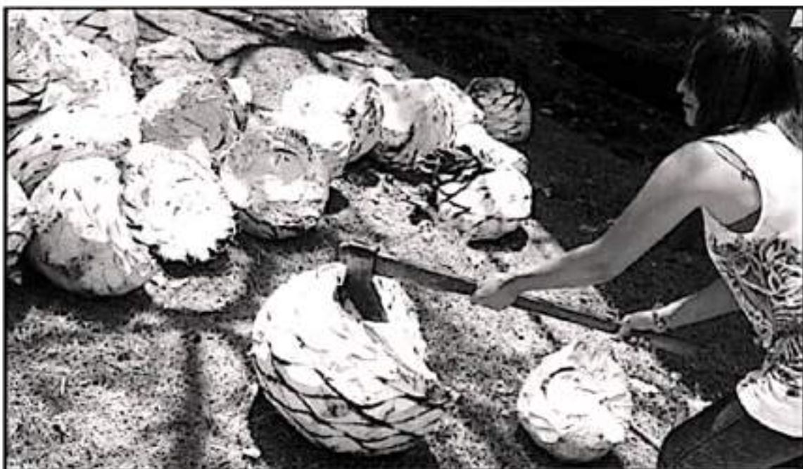
LOS ARTESANOS RESALTARON QUE ESTA TEMPORADA CLIMÁTICA ES APTA PARA LA SIEMBRAS DEL MAGÜEY, ASÍ COMO PARA EL CUIDADO DE LOS VIVEROS.

de origen de mezcal tienen en la Asociación