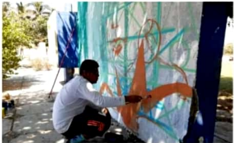
CD. LÁZARO CÁRDENAS, MICH.- Invitan a la primera edición del "Vive la Semana Santa en Playa Azul".

La cita es del primero al 4 de abril a partir de las 10 de la mañana hasta las 5 de la tarde, exposición que se concentrará en las canchas de la unidad deportiva en la tenencia de Playa Azul.