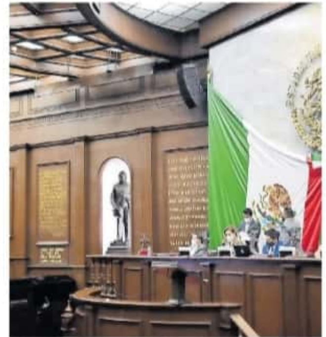
El TEEM también hizo la petición de una ampliación presupuestal

Según la lectura, el TEEM solicitó a los integrantes del Congreso que se pueda autorizar a la brevedad el ajuste presupuestario, que les permita implementar las herramientas digitales correspondientes para dicho juicio, dado que éste no fue contemplado en el presupuesto autorizado.