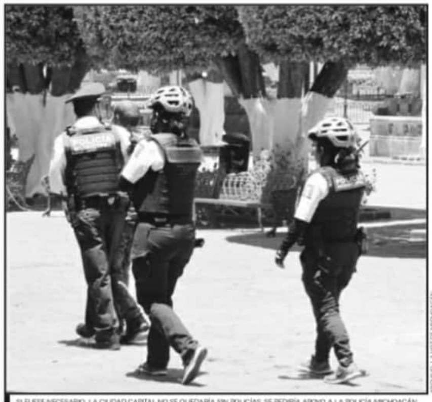
SI FUESE NECESARIO, LA CIUDAD CAPITAL NO SE QUEDARÍA SIN POLICÍAS, SE PEDIRÍA APOYO A LA POLICÍA MICHOACÁN.

En contraste, Ayala García negó que haya pagos de quincena pendientes con los uniformados,