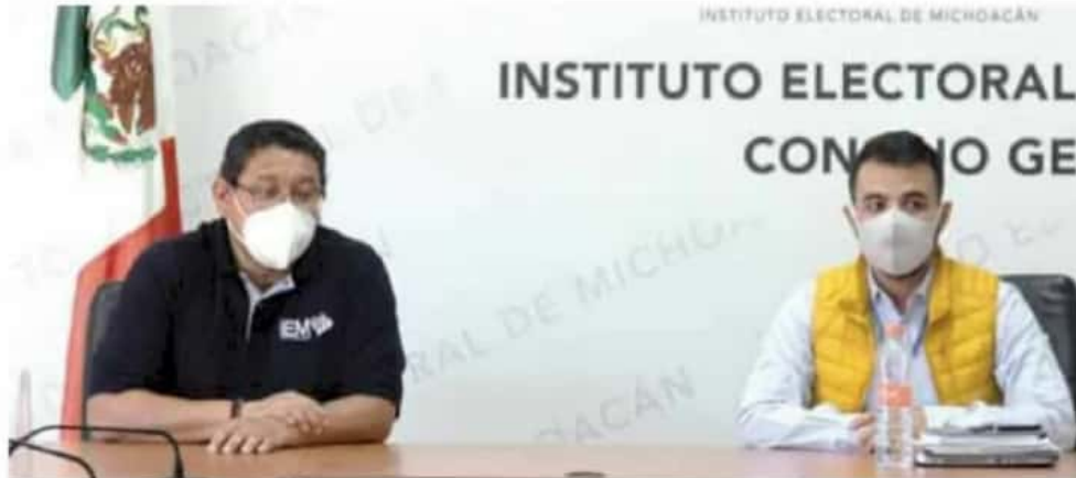
Sin independientes. El único aspirante sin partido lo logró el apoyo ciudadano requerido.