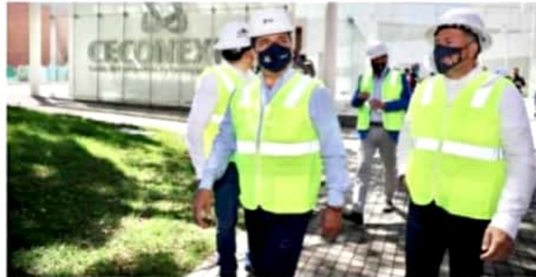
MORELIA, MICH.- Se contará con una capacidad de hasta 11 mil personas, y hasta 499 stands lo que representa múltiples beneficios para la capital.

"Todas estas cualidades ofrecerán muchas ventajas para la reactivación del espacio público, la generación de empleos y mayor plusvalía para el contexto urbano inmediato", agregó las empresas que utilizarán sus servicios no deberán preocuparse por cubrir los costos que implica el alquiler de una oficina habitual, con la instalación de equipos, muebles, pago de limpieza, gastos de servicios, entre otros".