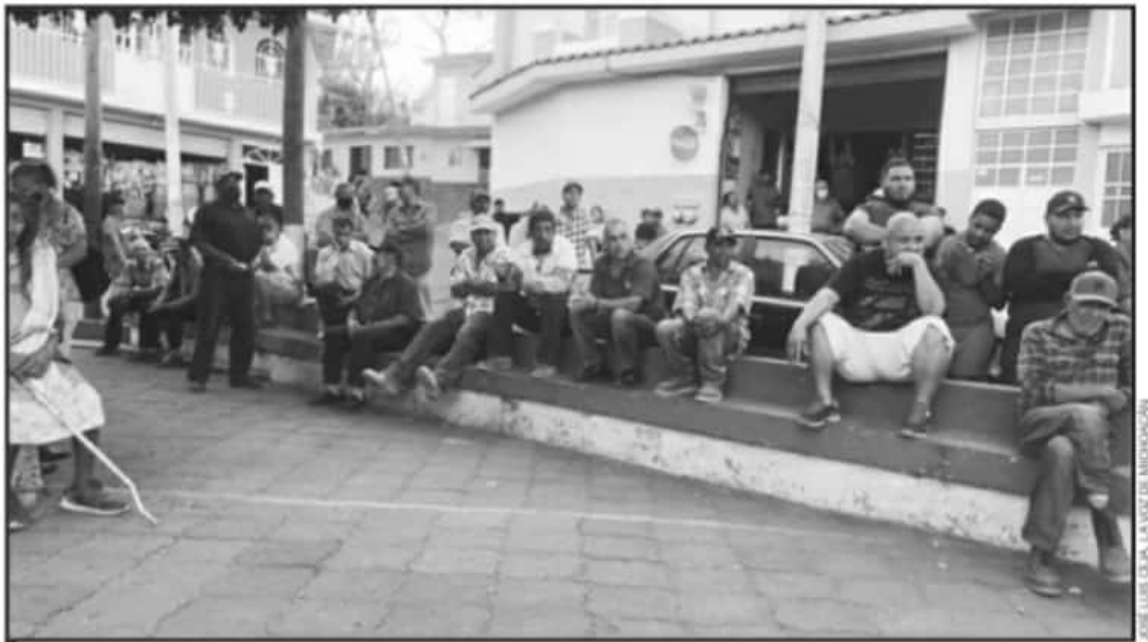
EL CONFLICTO POR EL AGUA, GENERADO DESDE LA SEMANA PASADA, ES ENTRE LOS HABITANTES DE LAS TENENCIAS DE TOTOLÁN Y LOS REMEDIOS.