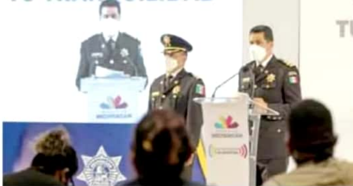
Seguridad. De acuerdo al riesgo se implementarán los protocolos de seguridad.

el Ministerio Público, a fin de que se determinen las medidas de protección necesarias.