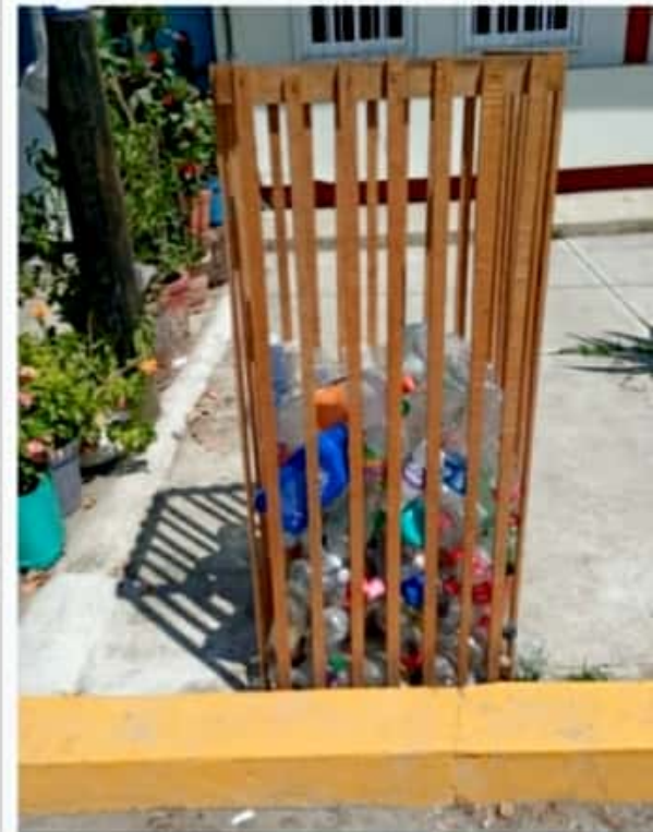
CD. LÁZARO CÁRDENAS, MICH.- Ciudadanos de Playa Azul logran concientización sobre cultura de reciclaje del PET.

■ Fueron distribuidos 74 contenedores para esta causa