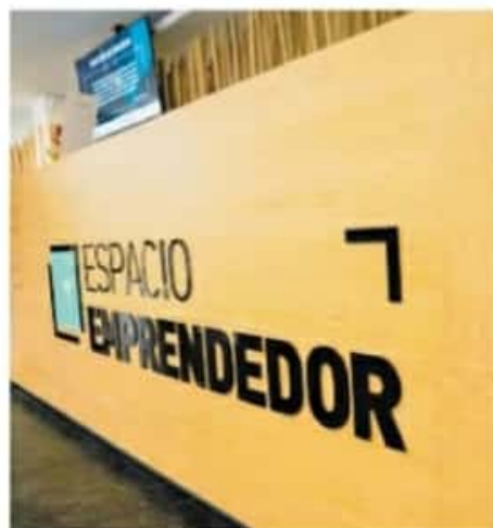
Entre los planes para 2021 se encuentra habilitar más oficinas en el estado / ADRIÁN RIVERA

Recordó que el 1 y 2 de noviembre de 2020, Tzintzuntzan se había preparado para celebrar “sólo en comunidad”, pero ante el arribo de turismo nacional y extranjero —dijo— “la mayoría de la gente del pueblo nos quedamos en nuestras casas y quienes tenían que ir a velar fueron”. Sin embargo, aseguró que las medidas de confinamiento adoptadas por el pueblo poco sirvieron, pues a la tercera semana de noviembre hubo una ola de contagios derivada de dichas celebraciones.