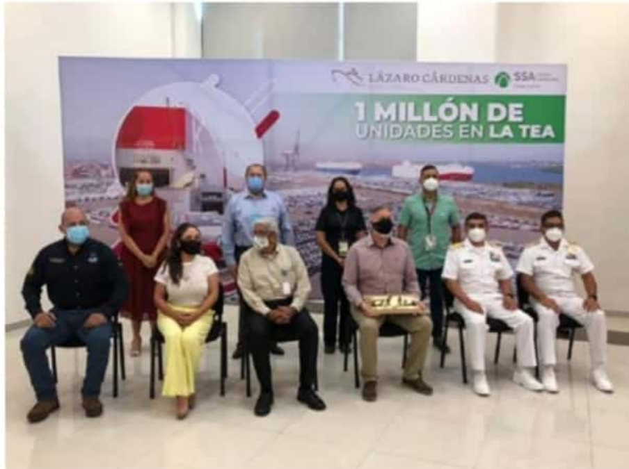
Asistentes al evento de entrega de reconocimiento a SSA México por el manejo de la unidad automotriz un millón por el puerto michoacano. (Foto: Kike Rivera).