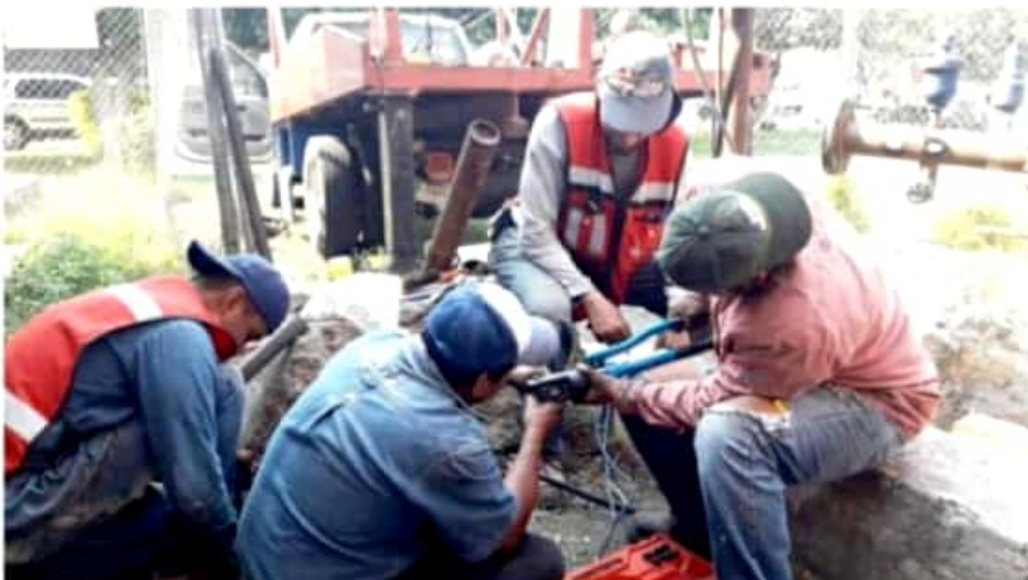
ZAMORA, MICH.- Personal operativo del organismo detectó la falla en la fuente de abastecimiento, por lo que

Los vecinos fueron informados sobre la problemática y se les apoyó durante los trabajos con el servicio de pipas. El Sapaz agradece a los vecinos su comprensión por las molestias que estas acciones conllevan.