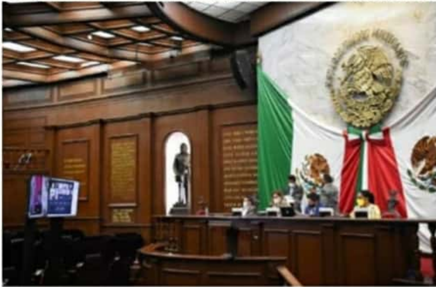
El Congreso del estado reestructuró diversas comisiones y la Junta de Coordinación Política (JUCOPO).

En lo que se refiere a la Comisión Especial para coadyuvar en la atención y facilidades para el traslado de las oficinas centra- ➤ 6