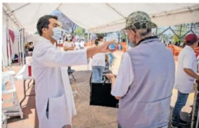
Michoacán ha acumulado 56 mil 349 contagios confirmados

Tres de los 19 decesos ocurridos en las últimas 24 horas corresponden a Urua-