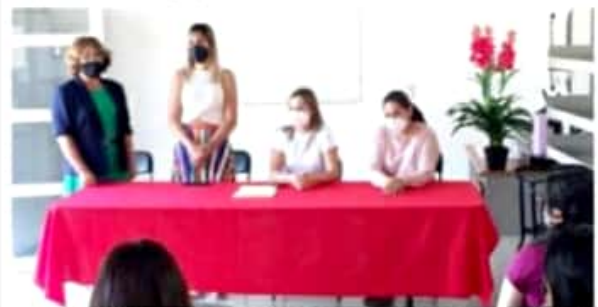
JACONA, MICH.- Este es uno de los talleres de mayor relevancia e interés para las féminas que buscan la superación personal.

Finalmente, se hizo entrega de los reconocimientos como parte de la clausura de este curso que tuvo éxito y que posterior se darán a conocer las nuevas fechas para que sean más mujeres las que emprendan nuevos proyectos.