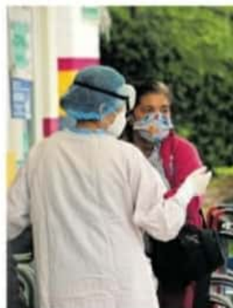
Los parientes del contagiado pueden ayudar con el trámite.

Añadió que en caso de que el trabajador haya sido confirmado o atendido de forma externa al IMSS, un pariente puede acudir al consultorio de Medicina Familiar asignado con la documentación que lo acredite, y de igual manera se expide la incapacidad inicial y subsecuente.