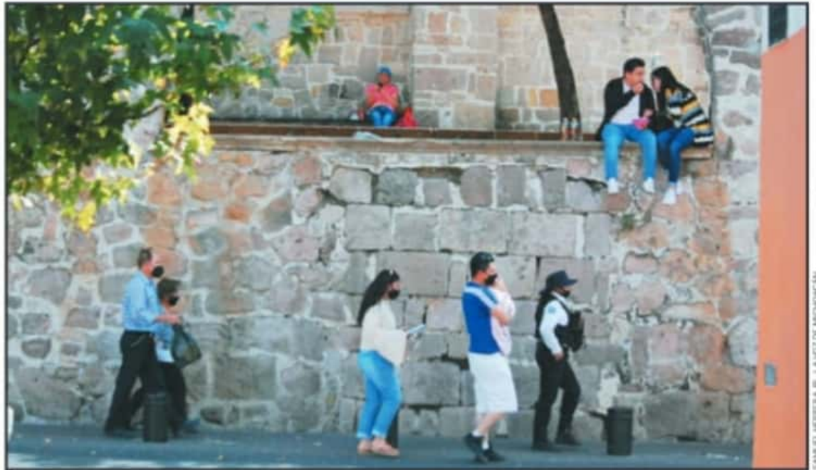
LA MOVILIDAD DE LAS PERSONAS EN EL CENTRO DE MORELIA NO BAJA, AL CONTRARIO, SE PERCIBE QUE LAS FAMILIAS HAN DEJADO EN EL OLVIDO EL CONFINAMIENTO.

pequeñas operan en la capital michoacana