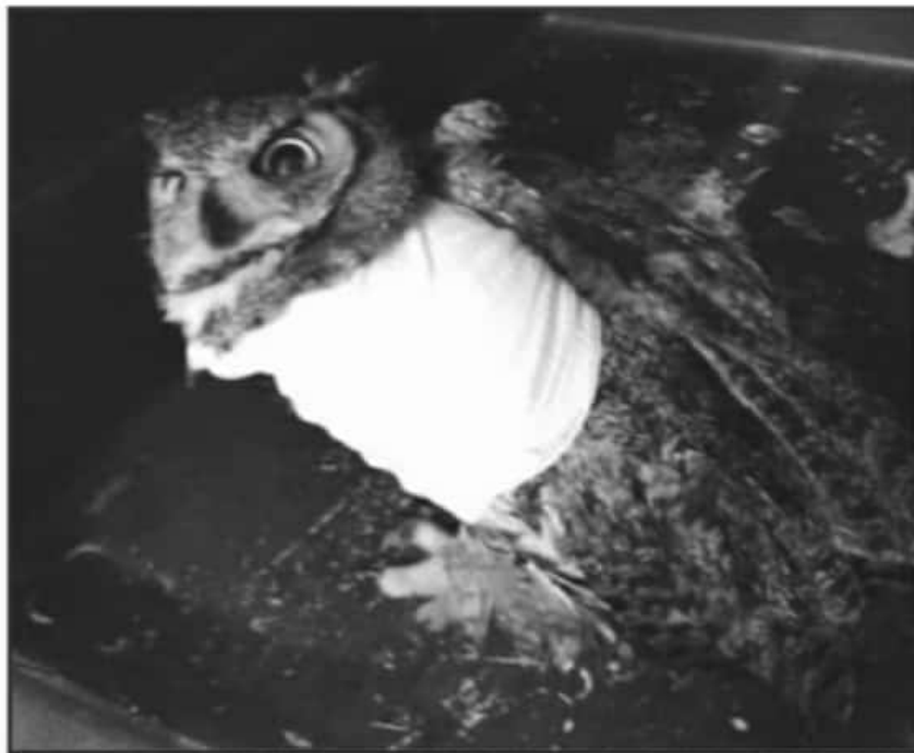
UN ALBERGUE EMERGENTE, PARA RESCATE DE VIDA SILVESTRE, ES UN TEMA ALTERNATIVO A LOS INCENDIOS FORESTALES.

Con estas acciones de manera indirecta se generan entornos de protección a la flor, fauna y zonas de vocación forestal a la espera de que se consoliden otras acciones como albergues para fortalecer la vida silvestre.