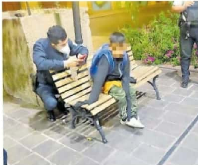
El niño fue encontrado cerca de Plaza Valladolid.

A nivel municipal señaló que el estado no cuenta con asesores en todos los municipios del estado; además de que a pesar de que hay