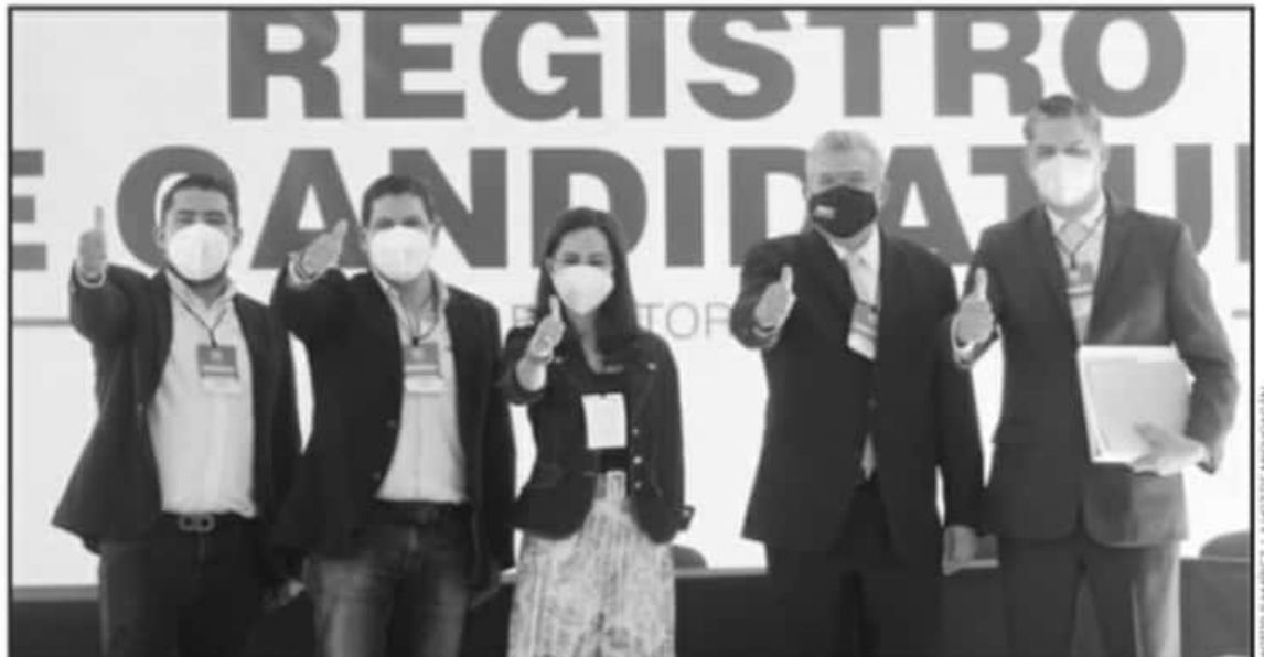
EL EXMAGISTRADO SE ASUME COMO UN CANDIDATO HONESTO QUE IRA ANTE LA CIUDADANÍA A PEDIR TRABAJO DE GOBERNADOR DE MICHOACÁN

El dirigente verde-ecologista subrayó que el 38 o 40 por ciento del electorado michoacano toda-