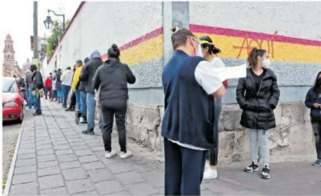
El objetivo de la incapacidad es cortar la cadena de contagio.