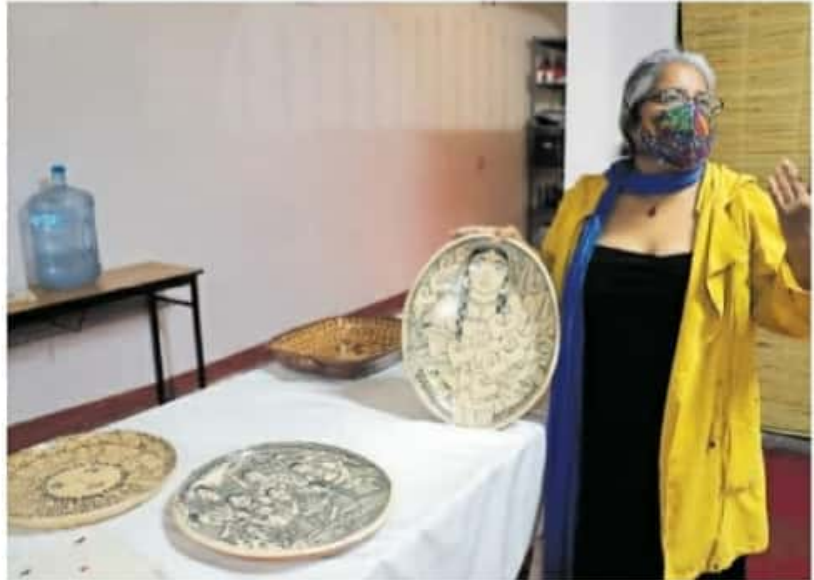
Los concursos artesanales se realizaron aún sin turistas, con el objetivo de apoyar al gremio local

En relación a las acciones implementadas por el municipio para promover la afluencia turística, la funcionaria y maestra alfarera dijo que en próximas fechas se ofertarán cursos en los 15 talleres