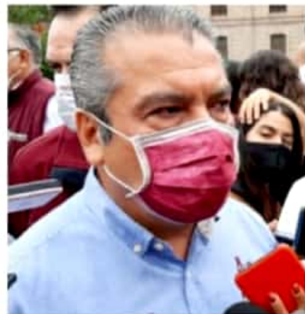
MORELIA, MICH.- El 41.4 por ciento de las preferencias electorales se inclinan a favor de Raúl Morón para que éste sea el próximo gobernador de Michoacán.