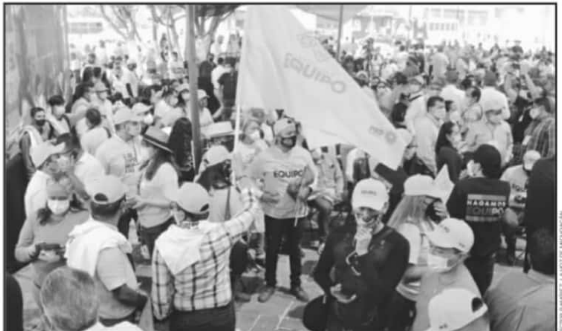
EL OBJETIVO ES TERMINAR CON LA TENDENCIA DE VENTILAR LAS EXPERIENCIAS DE AGRESIONES Y AMENAZAS ÚNICAMENTE A TRAVÉS DE MEDIOS DE COMUNICACIÓN.

El semáforo de riesgo presentado a la opinión pública, destaca en color verde el peligro "Bajo", contexto en el cual se otorgará a los candidatos protección en horarios, días y zonas específicas en consideración a