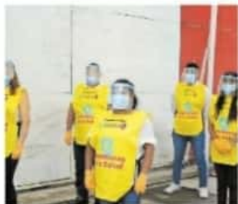
Estas brigadas han visitado 22 mil 731 viviendas.

A través de la acción comunitaria y de la promoción de estilos y entornos saludables, la SSM contiene, previene y rompe con la cadena de contagios de Covid-19.