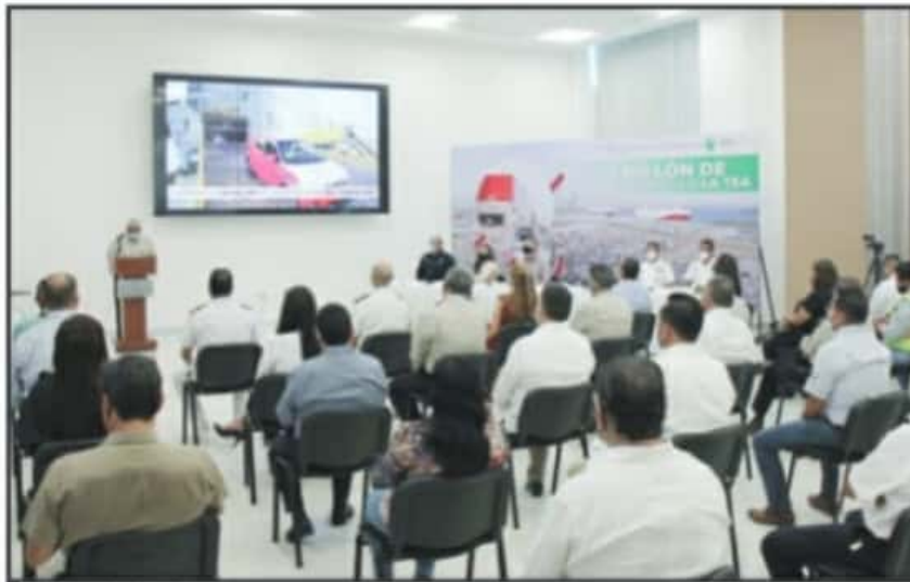
SE PUSO DE MANIFIESTO QUE LA INDUSTRIA AUTOMOTRIZ SE HA CONSOLIDADO COMO DE LAS IMPORTANTES EN MÉXICO.

consolidado en los últimos años como una de las más importantes en México y en ello el Puerto Lázaro Cárdenas ha sido un pilar fundamental con la importación y exportación de unidades de diversas marcas y rutas comerciales, que parten de este punto y son distribuidos en varias entidades del país.