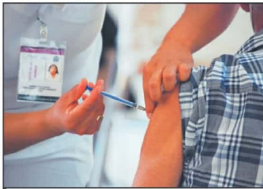
CON UNA UNIDAD DE VACUNA SE INMUNIZABA A CINCO PERSONAS, PERO CON NUEVA TECNOLOGÍA RENDIRÁ PARA SEIS.

con el registro de 90 mil adultos mayores y se tenía contemplado que más de 111 mil adultos mayores de 60 años habitan en la capital.