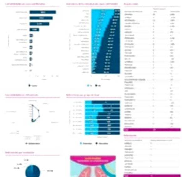
Ayer el municipio de LC volvió a un dígito en los registros de nuevos casos positivos, al documentar el CESS 9 contagios más para un acumulado 6,047.