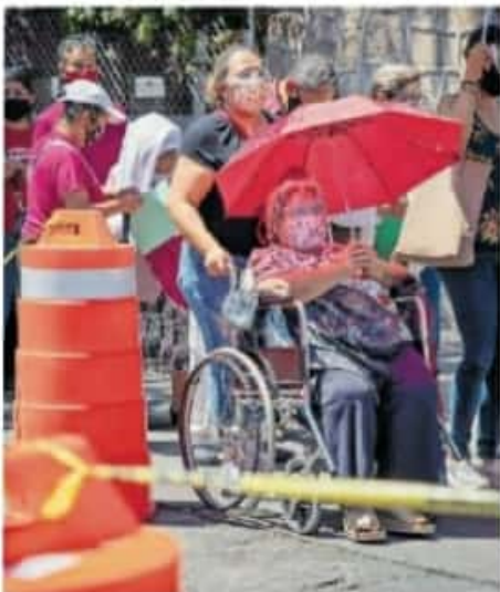
Algunos adultos mayores se quedaron esperando la vacuna / CARMEN HERNÁNDEZ