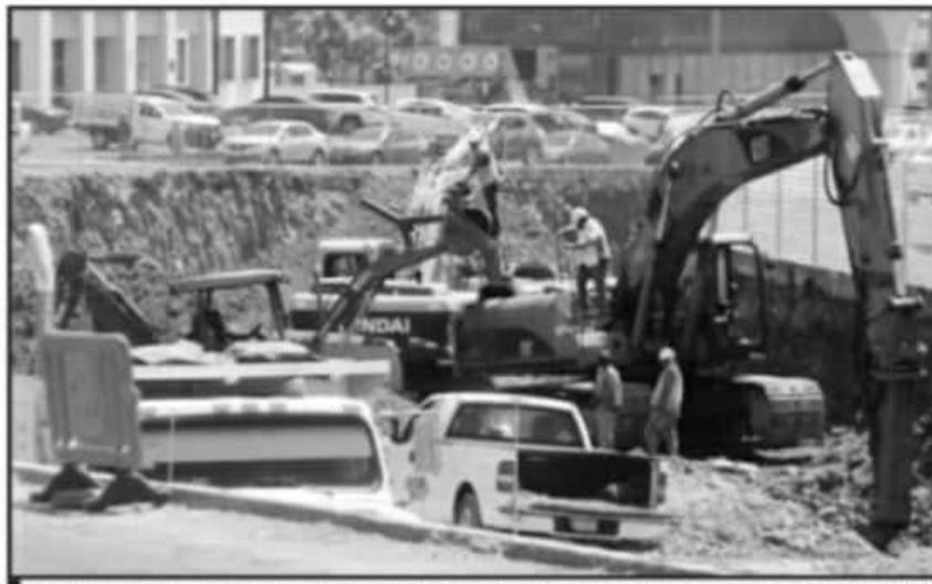
POR EL RECURSO QUE DEJÓ DE RECIBIR MICHOACÁN, NO HAY UNA CIFRA DE CUANTAS OBRAS SE HABRÍAN SUSPENDIDO.

expectativas de gestión porque no nos han explicado cómo acceder a recursos, simplemente están cancelados", precisó el titular a pregunta expresa de esta casa editorial.