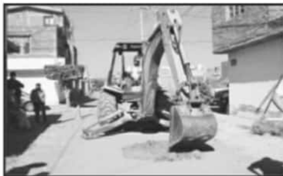
DESTINAN MÁS DE 1.8 MDP PARA REHABILITAR CALLE EN EJIDO LOS MORENO.

masa forestal, pero ello también afectó la flora y fauna, incluso con apoyo del Gobierno del Estado se lograron rescatar algunas especies de orquídeas, así como algunos animales, incluidas aves, sin embargo, otros muchos escaparon del fuego hacia la zona urbana en