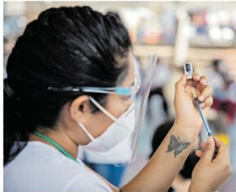
Al momento se ha inoculado a 29 mil 400 mayores de 60 años

total de 29 mil 400 morelianos mayores de 60 años.