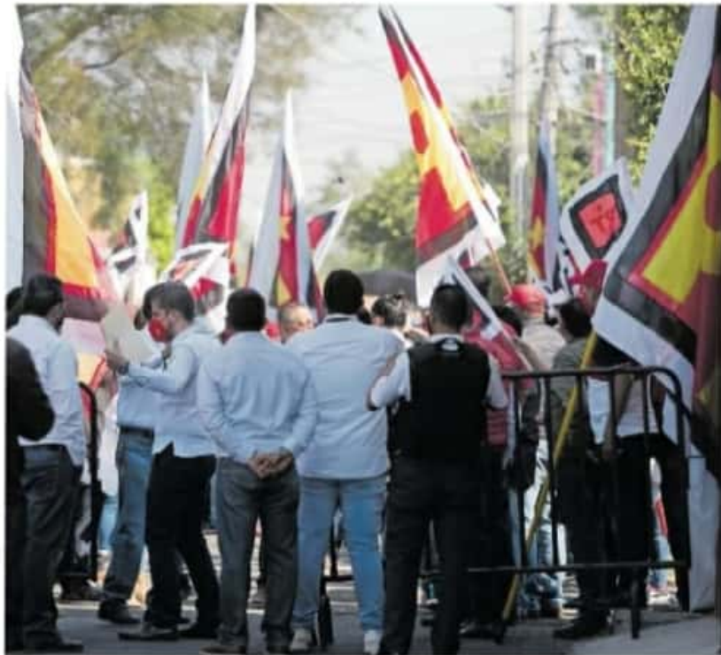
El PT se deslindó de los hechos porque no puede regular lo que sus militantes promueven / IVÁN ARIAS

En otro tema, en el orden del día los juristas votaron el Proyecto de Sentencia del Juicio para la Protección de los Dere-