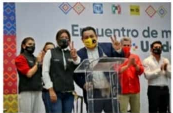
El Equipo Por Michoacán promueve acciones para una vida libre de violencia y sin discriminación.

cemos la igualdad entre mujeres y hombres en trabajo político y público.