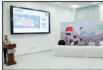
AL EVENTO ASISTIERON AUTORIDADES NAVALES Y CIVILES.