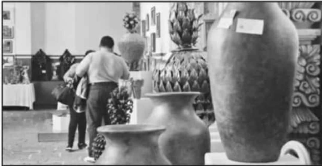
ARTESANO ESPERAN PALIAR LA DIFÍCIL SITUACIÓN CON LA VENTA DE ARTESANÍAS EN EL CONCURSO DE DOMINGO DE RAMOS.