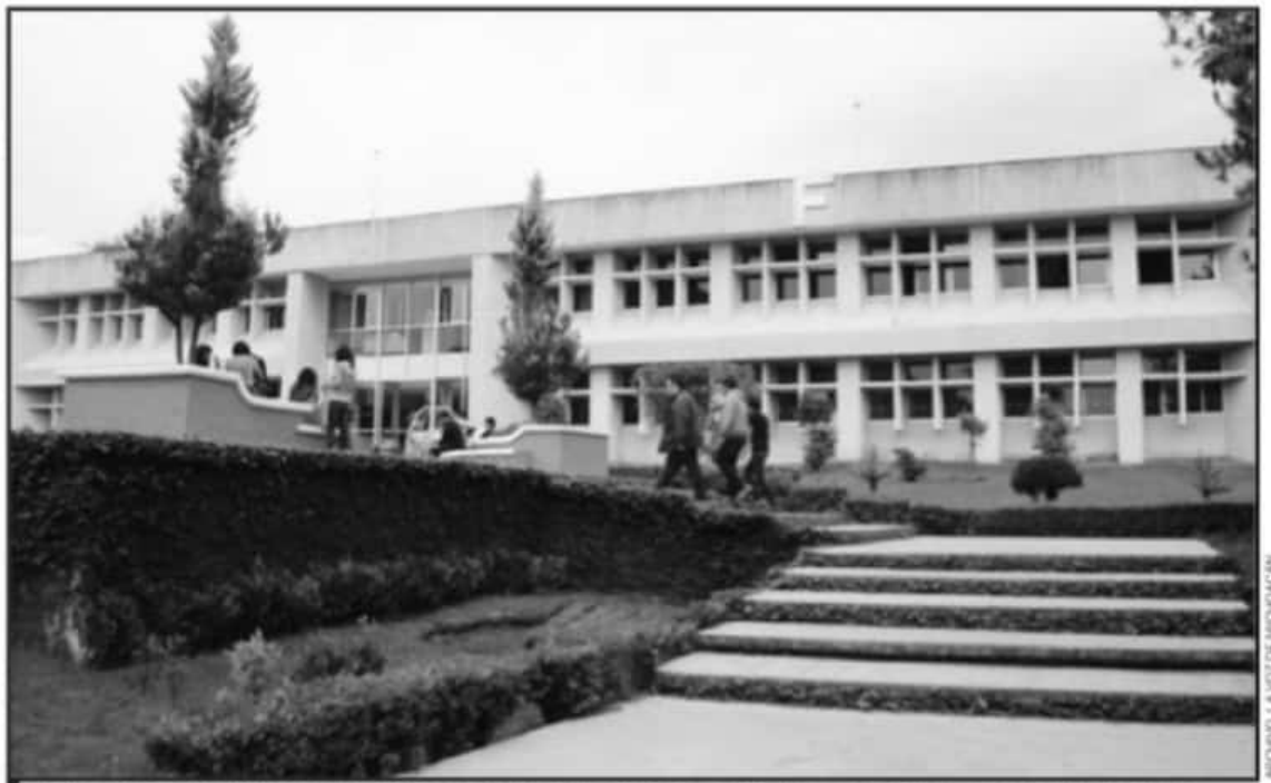
ALUMNOS DEL TEC DE URUAPAN SEÑALAN QUE NO HAY UNA AUTORIDAD ACADÉMICA QUE ATIENDA LOS CASOS DE ACOSO ESCOLAR EN LA INSTITUCIÓN.

Explicó que se burla de alumnas y alumnas por cosas mínimas e incluso a alumnas con resultados académicos destacados las acusa de tener romances con profesores, "nos parece que, por simple hecho de no caerle bien a la docente esto determine complicaciones académicas".