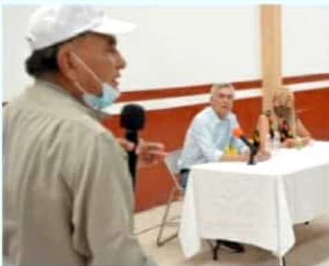
QUITZEO, MICH.- Instó a hacer de esta preocupación una causa social nacional para diseñar entre todos un proyecto de rescate.

Sin embargo, señaló, se requieren buenas autoridades municipales, que quieran el progreso de su gente, porque quienes han gobernado aquí han aletargado la posibilidad de dar un salto cualitativo y cuantitativo hacia el desarrollo económico y social. Es necesario romper la hegemonía de tantos años y detener el acaparamiento de tierras, cuidar el entorno y revertir la ausencia de planes urbanos.