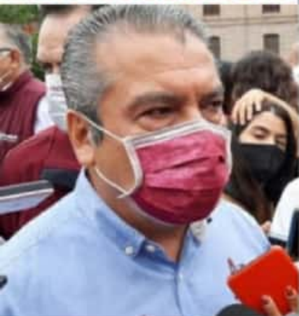
MORELIA, MICH.- El 41.4 por ciento de las preferencias electorales se inclinan a favor de Raúl Morón para que éste sea el próximo gobernador de Michoacán.