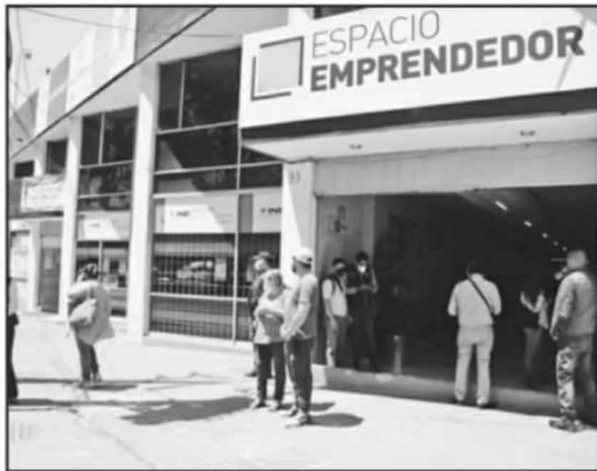
POR FIN SE CONSOLIDÓ Y ABRIÓ EN URUAPAN EL ESPACIO EMPRENDEDOR QUE DARÁ SERVICIO A MÚLTIPLES EMPRESAS.

cual trascenderá más allá de los cambios de gobierno.