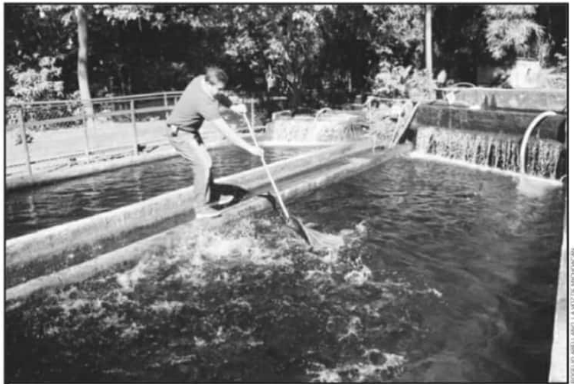
EL EFECTO DE ESTA CRISIS SE OBSERVA EN QUE DURANTE ESTA TEMPORADA DE CUARESMA TAMPOCO HUBO CENTROS DE VENTA A BAJO COSTO EN URUAPAN.

"Dicen que los apoyos ya son directos al productor, pero, por ejemplo, en el 2020 y este 2021,