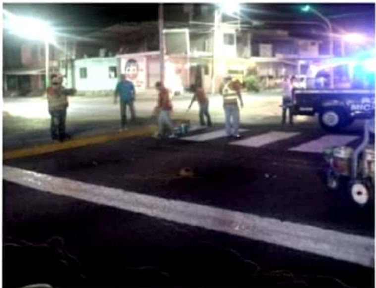
CD. LÁZARO CÁRDENAS, MICH.- La Delegación de Tránsito del Estado en coordinación con el gobierno municipal, llevaron a cabo el balizamiento de un tramo de la avenida Belisario Domínguez.