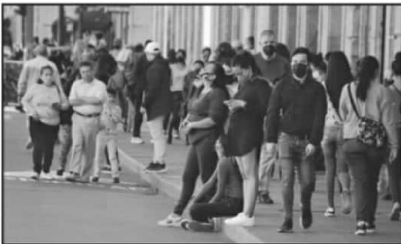
MORELIA NO SE QUEDA EN CASA, AL CORTE DEL DÍA DE AYER, YA REBASAMOS LOS 800 MUERTOS POR EL VIRUS.