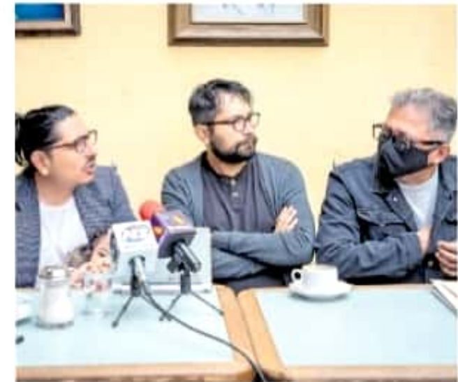
Los docentes afectados dijeron ser respaldados por directivos y estudiantes

Osorio Bucio afirmó que los profesores en conjunto han desarrollado sus activida-