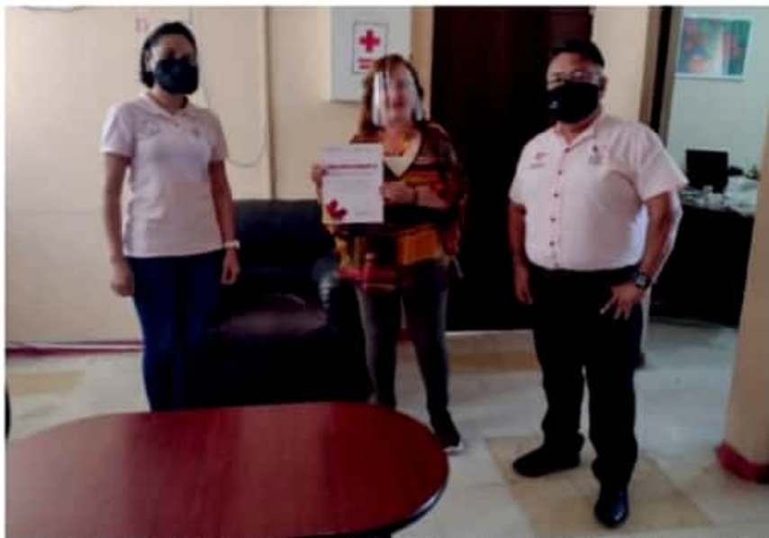
CD. LÁZARO CÁRDENAS, MICH.- El Sistema DIF Municipal, Centro de Rehabilitación Integral (CRI) y la Casa del Adulto Mayor recibieron la certificación como Espacios Libres de Humo de Tabaco por parte de la Jurisdicción Sanitaria No. 08 y la Coepris.