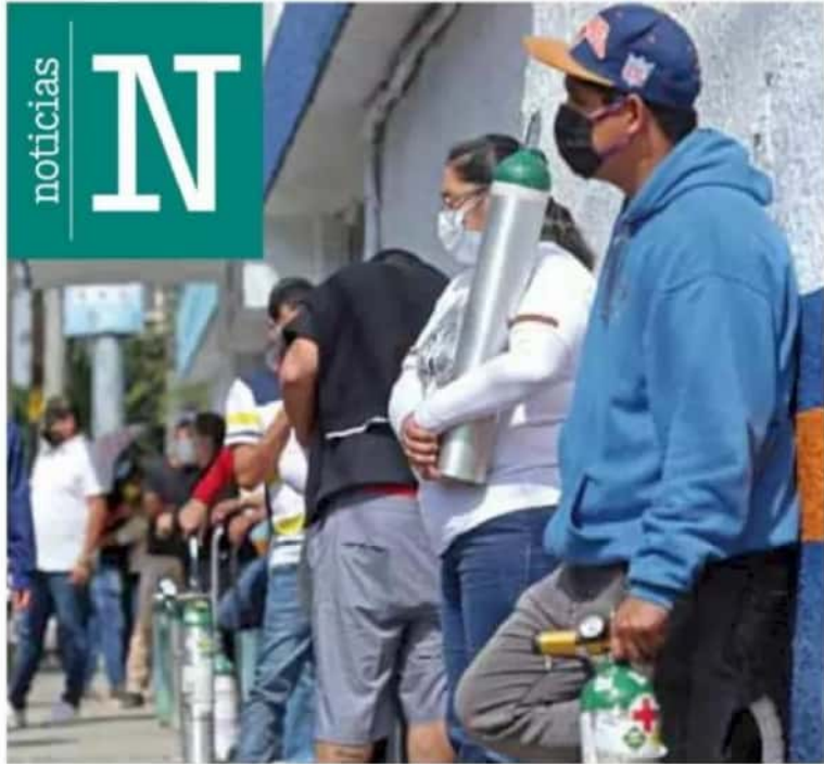
Tormento. En la capital del estado los ciudadanos deben esperar hasta seis horas por una recarga de su tanque de oxígeno.