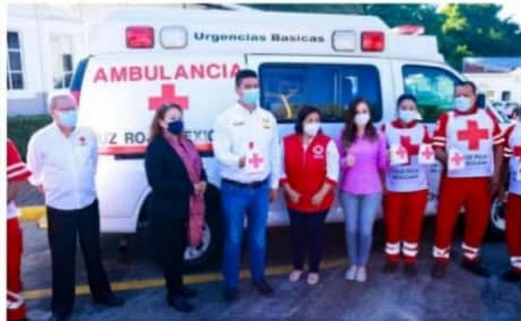
URUAPAN, MICH.- El alcalde realizó la primera aportación a la Colecta Anual de la Cruz Roja en Uruapan, cuyos gastos ascienden a unos 200 mil pesos mensuales; su ejemplo fue seguido por funcionarios municipales.

Remarcó que debido a la emergencia sanitaria se viven tiempos difíciles en