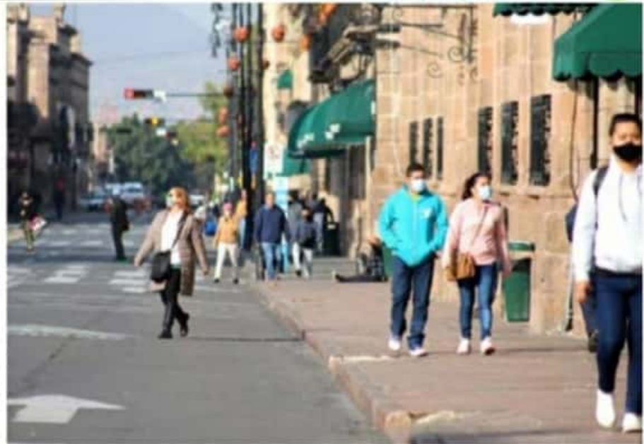
El 59.95% de los casos positivos de COVID-19 en la entidad, son personas de 20 a 49 años de edad, dice la SSM.

Por lo anterior, la SSM reitera el llamado a la corresponsabilidad ciudadana para romper la cadena de contagio y con esto, salvaguardar la vida y la salud de todos los integrantes de las familias michoacanas.