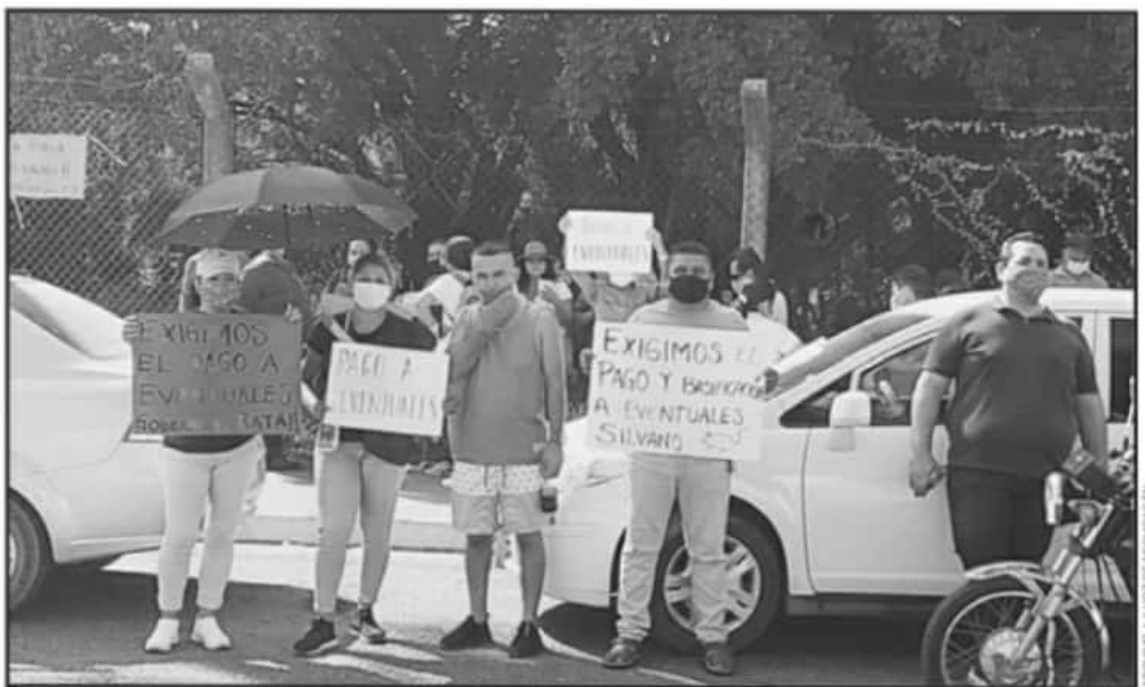
A PESAR DE LA CONTINGENCIA SANITARIA POR LA PANDEMIA, TRABAJADORES DE LA EDUCACIÓN ANUNCIAN UNA MANIFESTACIÓN PARA ESTE DÍA.

Cuevas Alcaraz reconoció que, si bien ahorita se ha ido avanzando un poco con lo que es el pago a sus compañeros even-