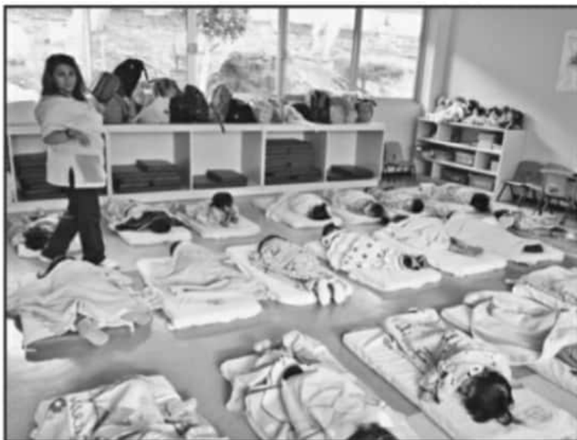
EN TÉRMINOS LOCALES EL GOBIERNO DEL ESTADO INVERTIRÁ MÁS DE 85 MILLONES DE PESOS EN EL PROGRAMA.

Silvano Aureoles, GOBERNADOR DE MICHOACÁN