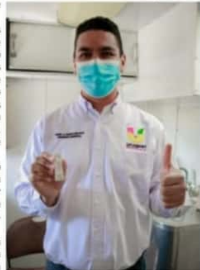
URUAPAN, MICH.- El alcalde de este municipio fue de los primeros en realizarse la prueba rápida gratuita para detectar Covid-19; el resultado fue negativo.