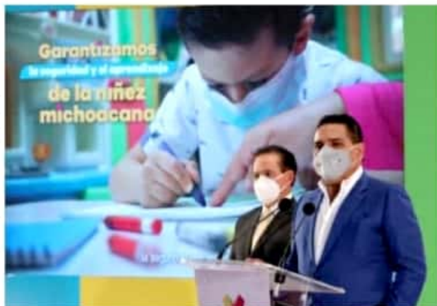
MORELIA, MICH.- el Gobierno del Estado de Michoacán reactivará el programa de Estancias Infantiles que dejaron de percibir recursos del Gobierno federal hace dos años, con una inversión de 85 millones de pesos.