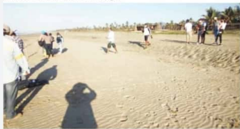
CD. LÁZARO CÁRDENAS, MICH.- Tortuga gollina sigue siendo afectada por depredadores.

Finalmente, explica que, en lo que va de la temporada de arribo, se han localizado de 10 a 15 tortugas muertas, pero por diferentes causas, entre las más comunes por uso de redes, enmallamientos u otras causas, pero la que más destacó fue la localización de una tortuga "caguama o careta del Atlántico", la cual no arriba a costas michoacanas, pero esta, señalan, fue partida en dos aparentemente por la propele del algún buque comercial.