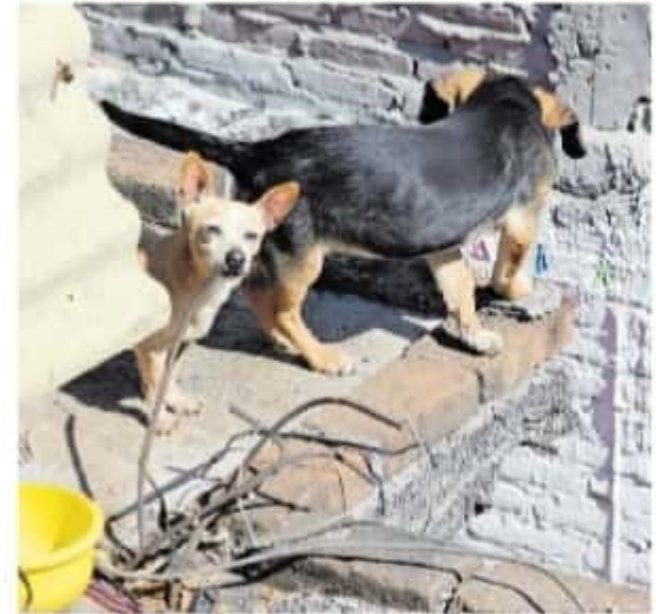
Muchos inmuebles no cuentan con las condiciones apropiadas para una mascota.

También, el 29 de julio fueron retirados 17 perros de la vía pública quienes se encontraban en resguardo de un civil que no contaba con la licencia necesaria para resguardar a los caninos.