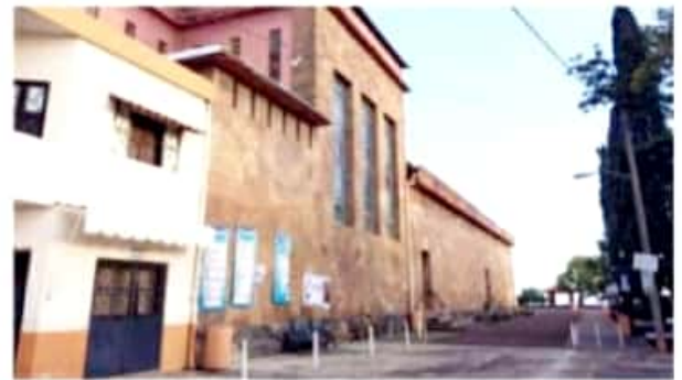
APATZINGÁN, MICH.- Se acordó que el día 2 de febrero no habrá acceso al santuario de la Virgen de la Candelaria y las celebraciones eucarísticas se transmitirán por redes sociales.

Se informó que los habitantes de la comunidad, podrán entrar y salir a través de los filtros sanitarios que se instalarán en los accesos a la comunidad. Todo lo anterior, con la finalidad de frenar la cadena de contagios por Covid-19.