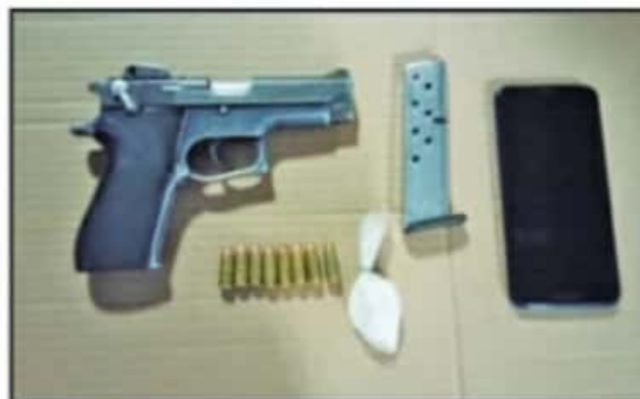
EN MUCHAS CIUDADES LA VIOLENCIA CRECIÓ POR LA DISPUTA DE LA PLAZA, YA NO COMO UN PASO DE TRÁFICO DE DROGA, SINO PARA CONTROLAR EL CONSUMO.

Este fenómeno se ha visto agravado en los últimos dos años de forma paralela a los hechos de homicidio en la capital, lo cual ha sido atribuido a conflictos entre grupos delictivos que luchan por controlar el territorio de la capital michoacana para llevar a cabo sus actividades ilegales. Sin embargo, a más de un año y medio de que las autoridades apuntaron a esta hipótesis, no se ha parado el aumento de asesinatos ni de hechos de narcomenudeo en la capital michoacana.