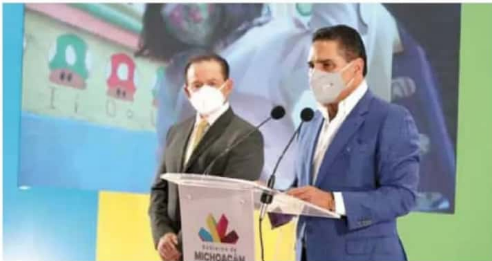
Beneficio. El gobernador dijo que la intención es brindar apoyo a las madres solteras que estudian o trabajan.