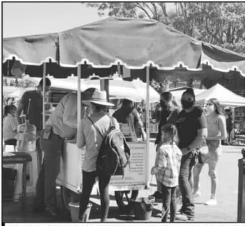
PESE A LA PROHIBICIÓN ESTABLECIDA POR EL DECRETO ESTATAL, LOS COMERCIANTE AMAGAN CON LABORAR EL DOMINGO.

Estamos teniendo pérdidas y Sahuayo sigue abriendo y la pregunta es si va a haber un castigo para el comercio en Sahuayo porque si no es así entonces vamos a abrir