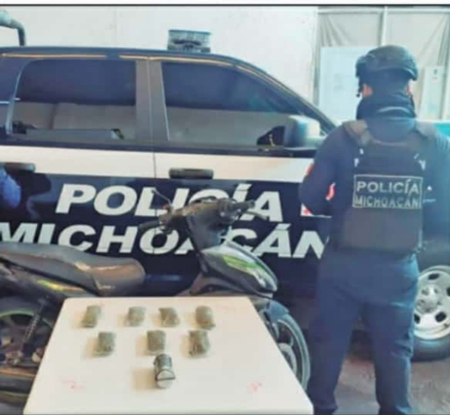
HECHOS DE NARCOMENUDEO EN EL 2020 REPRESENTA UN REPUNTE DE CASI EL 60 POR CIENTO RESPECTO A LA MARCA DEL 2019.

del 2020. Este año comenzó con las mayores cifras mensuales vistas en la capital michoacana, de 59 y 65 casos en enero y febrero, para posteriormente bajar a 42, 22 y 21 casos durante los meses de resguardo por la contingencia sanitaria de la enfermedad del coronavirus (COVID-19).