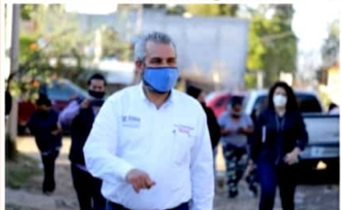
MORELIA, MICH.- Ramírez Bedolla propuso una serie de reformas para aprobar la emisión de licencias de conducir sin periodo de vencimiento.

■ Reitera el llamado a que se emita el documento vehicular durante todo el año, y no sólo cuando el Gobierno del Estado necesite ingresos extraordinarios