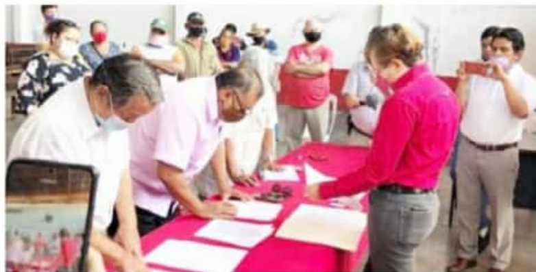
CD. LÁZARO CÁRDENAS, MICH.- Cuatro mujeres se registraron en las oficinas del Comité Ejecutivo Municipal PRI para buscar ser candidatas por la presidencia municipal de Lázaro Cárdenas.