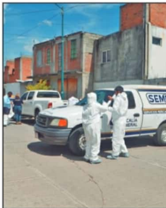
EL FENÓMENO DE LAS DROGAS SE HA VISTO AGRAVADO EN LOS ÚLTIMOS DOS AÑOS DE FORMA PARALELA A LOS HECHOS DE HOMICIDIO EN LA CAPITAL.