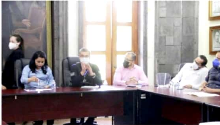
ZAMORA, MICH.- Durante las horas en las que más se han estado presentando estos casos, que es entre 5 y 6 de la madrugada y 9 y 11 de la noche.

Del mismo modo, el director mencionó los operativos y trabajos de seguridad que se han estado realizando, así como la integración de nuevos elementos a la policía municipal. Mencionó también, que estos trabajos se realizan en coordinación con los niveles de poder federal y estatal, de quienes es competencia directa atender este tipo de delitos, siendo la policía municipal una entidad preventiva más que persecutoria.