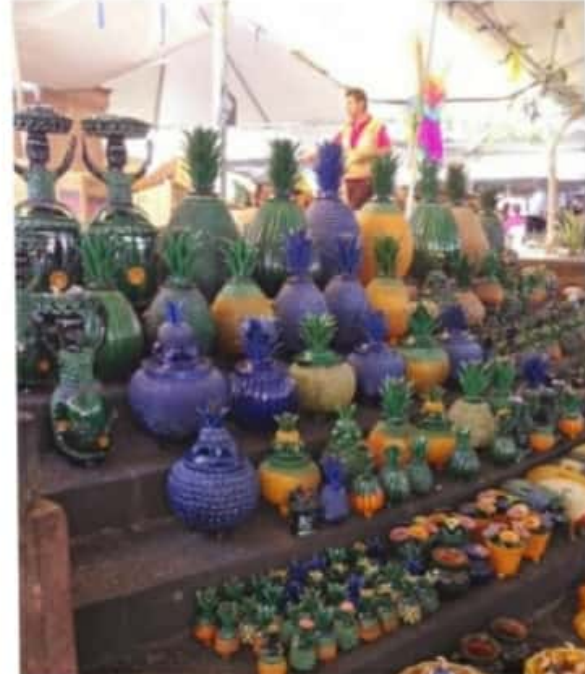
URUAPAN, MICH.- Toda la belleza y riqueza cultural del Tianguis de Artesanías del Domingo de Ramos en Uruapan, corre el riesgo de tener que esperar otro año para ser disfrutado, debido a la pandemia.

Dijo que entienden que se debe cortar la cadena de contagio, pero los artesanos no tienen ningún apoyo y apenas sobreviven, pues tampoco hay turismo, por lo que ven la necesidad de abrir sus negocios más temprano, pero por las disposiciones tienen que cerrar más temprano.