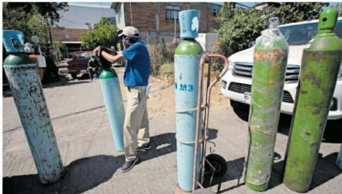
También se ofrecerán cuatro mil recargas de oxigenación

"A partir de la próxima semana, vamos a ofrecer de forma gratuita mil pruebas rápidas para la detección de Covid-19 (...) también se colocaron filtros de sanitización para autos"