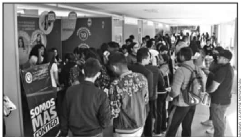
LA INTENCIÓN ES OFRECER LA MEJOR OFERTA EDUCATIVA A NIVEL SUPERIOR Y MEJORES CONDICIONES DE ESTUDIO.

Le expresamos a toda la familia nuestro mas sentido pésame por su irreparable pérdida.