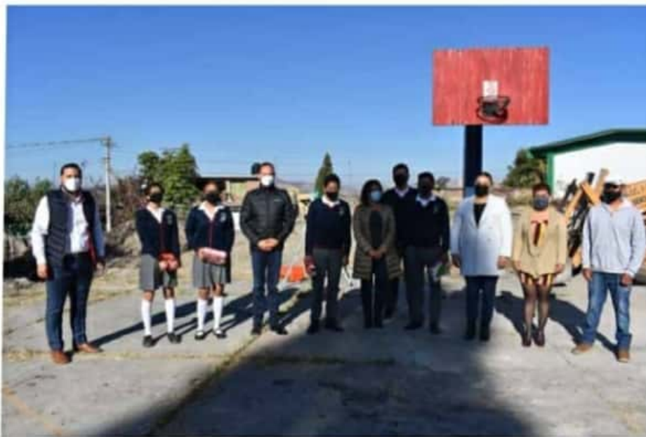
Juntos padres de familia y autoridades proyectan nuevas mejoras a la institución.