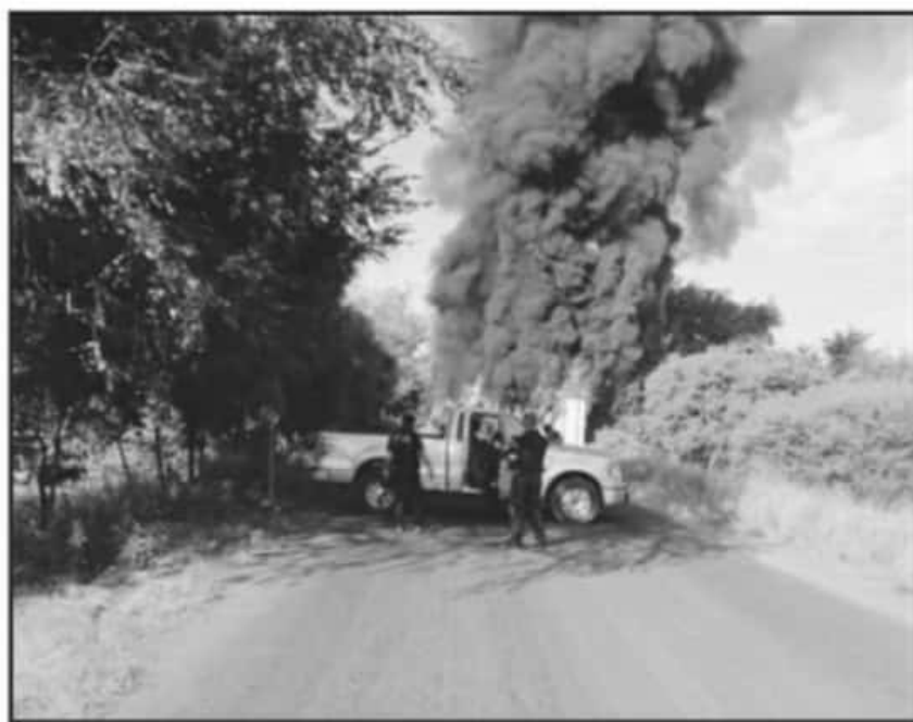
SE AFIRMÓ QUE EN LA REGIÓN DE TIERRA CALIENTE ES DONDE SE HAN OBTENIDO LA MAYOR CANTIDAD DE CAPTURAS

por objetivos criminales identificados y también contener porque mucho la presencia policial es disuasiva, porque es una región muy complicada", aclaró.