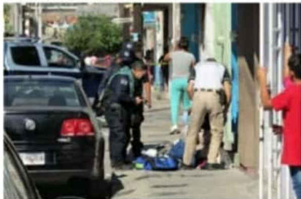
Ayer en Zamora, un solitario sujeto hirió de por lo menos cinco disparos a una mujer.

Los elementos de la Policía Municipal ya buscan al agresor que logró huir, con rumbo desconocido.