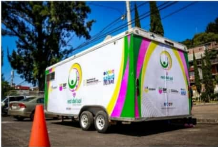
URUAPAN, MICH.- Desde ayer, junto a la explanada del Monumento a Benito Juárez, se encuentra un módulo para la prueba rápida gratuita para la detección de Covid-19.