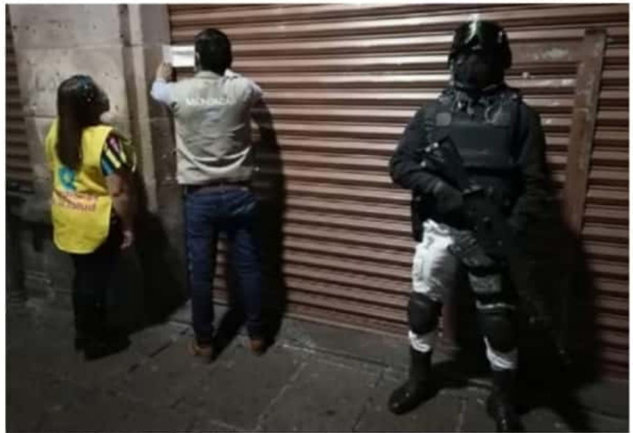
Los Guardianes de la Salud han supervisado 218 mil 852 establecimientos esenciales y no esenciales, en 37 municipios del estado.

Se mantiene a disposición de la ciudadanía el 800-123-2890 con 11 líneas para resolver todas sus dudas médicas, así como el microsítio bit.ly/MichCOVID-19, donde encontrará toda la información del padecimiento.