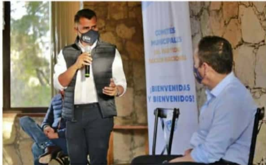
El precandidato al Gobierno de Michoacán recorrió los distritos locales de Tarímbaro y Puruándiro.