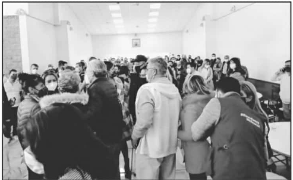
SE ADVIRTIÓ QUE APLICAR LAS SANCIONES POR EVENTOS DE TIPO ELECTORAL CORRESPONDERÍAN DIRECTAMENTE INSTITUTO ELECTORAL DE MICHOACÁN.

A pesar de que al inicio de la "Nueva normalidad" la auto-