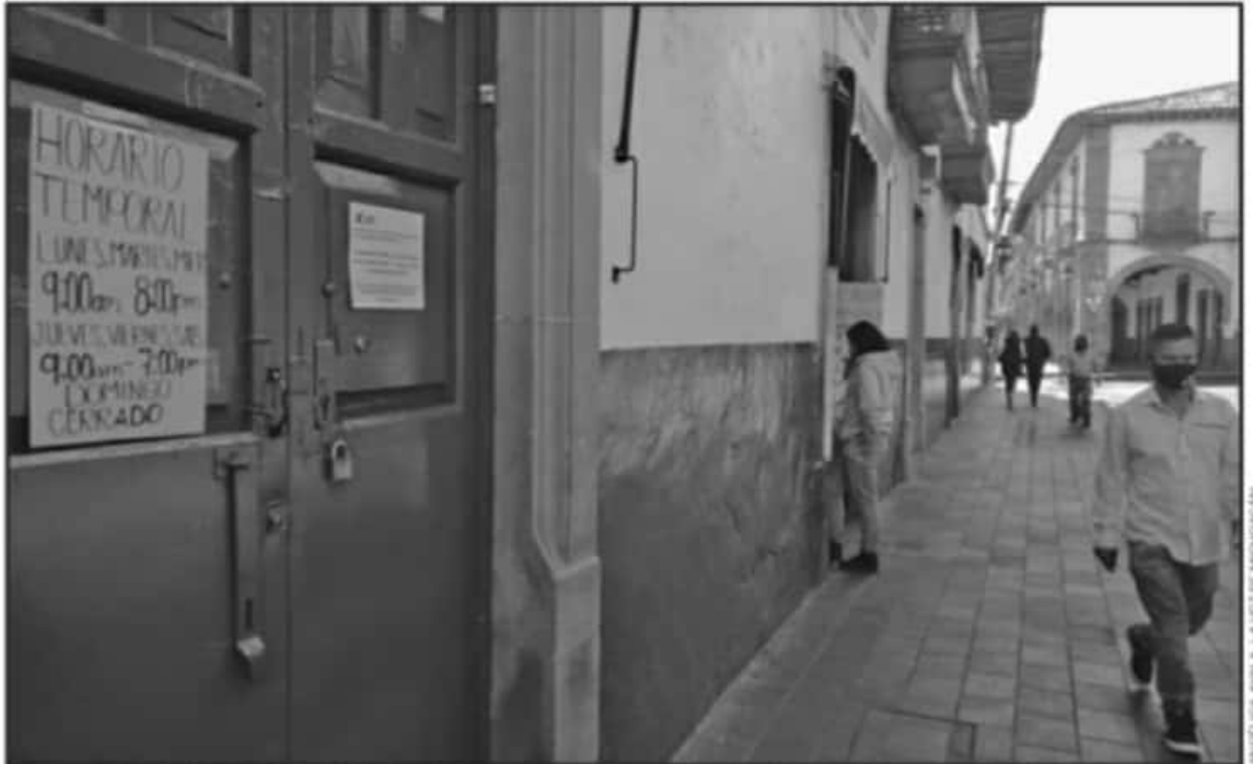
EL DOMINGO PASADO LA MAYORÍA DE LOS ESTABLECIMIENTOS COMERCIALES Y ARTESANALES DE LA REGIÓN LACUSTRE NO PRESTARON SUS SERVICIOS

Quiroga, también se sumó a las medidas emitidas en el decreto por el Gobierno del Estado, al suspender las actividades co-