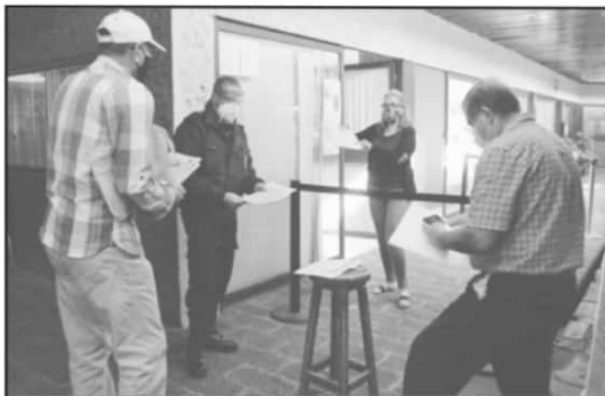
CON LA FINALIDAD DE ATRAER A MOROSOS POR PAGOS VEHICULARES, SE PROMUEVE EL PROGRAMA DE APOYO.

En este sentido, es muy importante destacar que en caso de