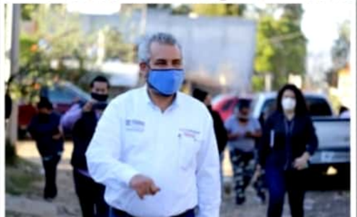
MORELIA, MICH.- Ramírez Bedolla propuso una serie de reformas para aprobar la emisión de licencias de conducir sin periodo de vencimiento.

■ Reitera el llamado a que se emita el documento vehicular durante todo el año, y no sólo cuando el Gobierno del Estado necesite ingresos extraordinarios