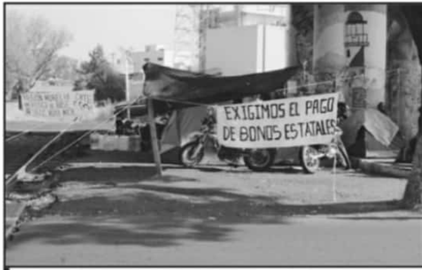
LLAMAN A LOS EGRESADOS NORMALISTAS PARA QUE PUEдан RESPETAR A TERCEROS Y QUE NO QUIERAN CHANTAJEAR.

Detalló que el tema está siendo revisado y que fue precisamente la pandemia de la COVID-19, la que impidió que se avanzara de manera importante en la autorización de esta nueva etapa de estímulo jubilación, "se presentó la contingencia y cambió las prioridades en temas de asignación de recursos".