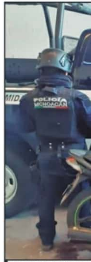
LA NUEVA MARCA HISTÓRICA DE 502

El coordinador de la Dimensión de Fe y Compromiso Social precisó que la Arquidiócesis de Morelia cuenta con un centro desde hace unos tres años.