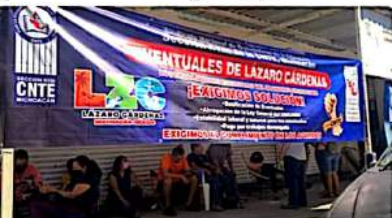
CD. LÁZARO CÁRDENAS, MICH.- Pese a que el gobierno de Michoacán inició con el pago de quincenas atrasadas, la CNTE mantiene sus protestas al interior del estado.

Eduardo CHÁVEZ CD. LÁZARO CÁRDENAS, MICH.-