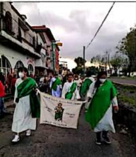
URUAPAN, MICH.- Vecinos de la colonia El Periodista, están preparados para festejar hoy a su santo patrón, San Judas Tadeo, aunque aún con restricciones por la pandemia del Covid-19.

Integrantes de distintas agrupaciones y colectivos de familiares en búsqueda de personas desaparecidas realizaron una marcha en apoyo a la familia