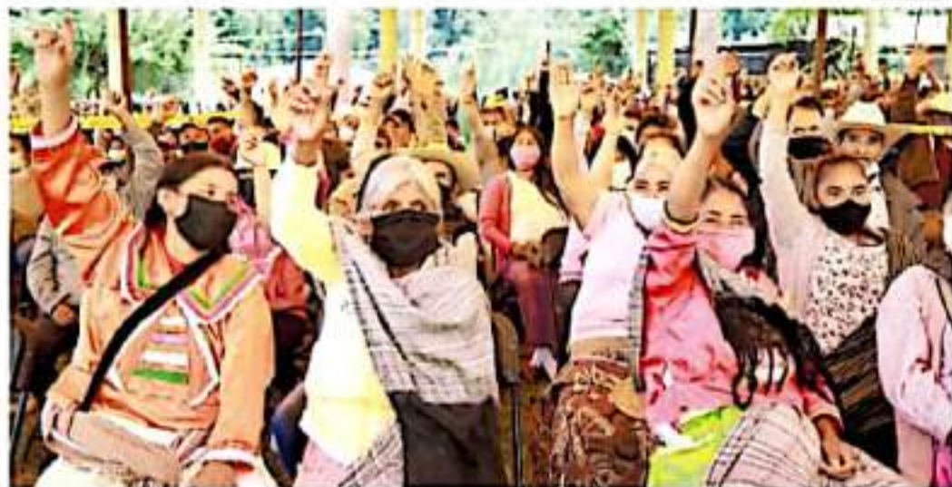
En Francisco Serrato se determinó llevar a cabo dos asambleas simultáneas, una en el ejido y otra en la comunidad.