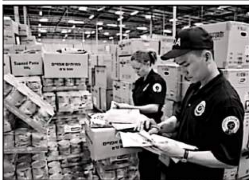
VELOS OBLIGAN A REDOBLAR ESFUERZOS EN TORNO A IMPULSAR UNA AGRESIVA CAMPAÑA DE CAPACITACIONES.