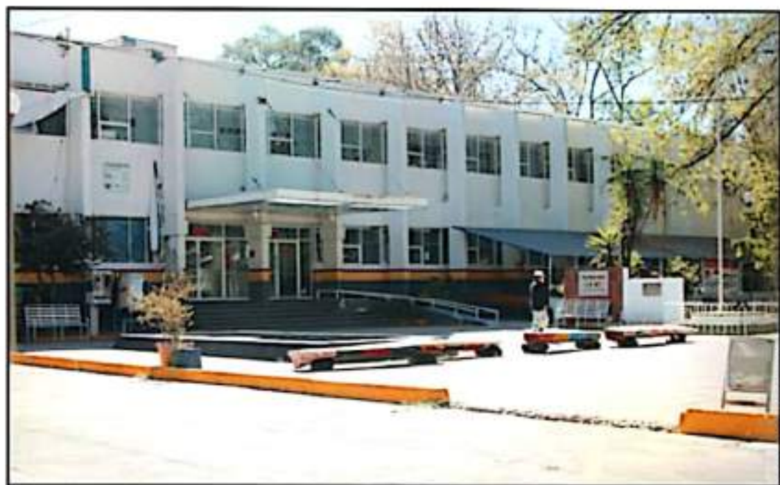
EN EL QUE ERA EL HOSPITAL INFANTIL SE ESTÁN HACIENDO FORTIFICACIONES PARA QUE EN EL SIGUIENTE AÑO SEA UN CENTRO ESTATAL CONTRA LAS ADICCIONES

"Son patrimonio del estado. En una cláusula nos preocupa que si pasa más de un año sin