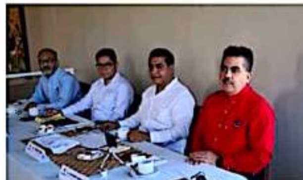
CD. LÁZARO CÁRDENAS, MICH.- Coparmex mostró confianza porque las autoridades federales resuelvan el conflicto magisterial que mantiene bloqueadas las vías del tren en Michoacán, desde hace más de 90 días.

Cabe mencionar que, de acuerdo con la Asociación de Industriales del Estado de Michoacán, se mantienen varados 11 trenes con 48 mil 719 toneladas de carga inmovilizada con destino o salida del puerto de Lázaro Cárdenas.