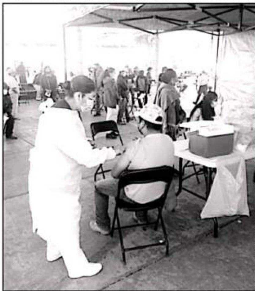
ESTOS SE LEVANTARÁN PADRONES PARA QUE SE VACUNEN Y RECIBAN LA PRIMEIRA DOSIS A AL MENOS 10 MIL PERSONAS.