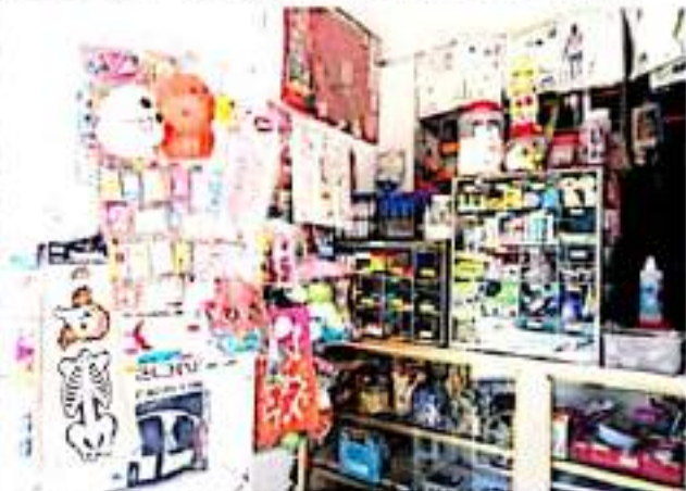
ZAMORA, MICH.- Ya que las clases no se han normalizado en las escuelas de manera presencial, en donde varios alumnos aún se encuentran recibiendo la educación virtualmente.

Por último, exhortó a la población para que continúe extremando todas las medidas para evitar contagios del Covid y esto permita a su vez que se vaya regresando de forma gradual a la normalidad y con ello también se mejore el tema monetario.