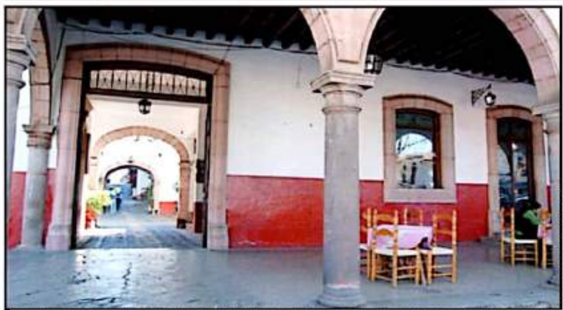
SE DESTACÓ QUE LOS HOTELES NO HAN BAJADO LA GUARDIA Y HAN CUMPLIDO CON TODOS LOS PROTOCOLOS SANITARIOS EXIGIDOS POR LAS AUTORIDADES

Es de mencionar, que esta celebración, Pátzcuaro la recibe en bandera verde, que representa un riesgo intermedio de contagio, con un total, hasta este miércoles, de 20 personas activas con el coronavirus, con 2 casos nuevos de contagios, del inicio de la pandemia a la fecha en el municipio se han registrado 215 defunciones, esto después de que se ubicara entre los cuatro primeros municipios en Michoacán con más contagios por la COVID-19.