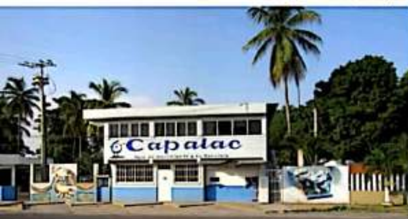
CD. LÁZARO CÁRDENAS, MICH.- Capalac dio a conocer la suspensión del servicio de agua potable en gran parte del municipio, esto a raíz de los daños sufridos por el huracán Rick.

El Comité de Agua Potable y Alcantarillado de Lázaro Cárdenas informó que el personal de Capalac ya está trabajando para dar solución y restablecer el servicio a la brevedad posible.