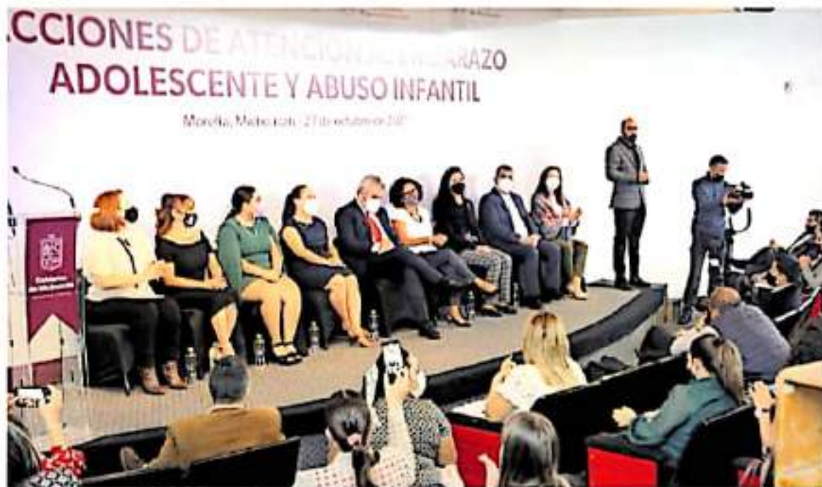
Morelia, Michoacán, 27 de octubre de 2021

Evento de presentación del Fondo para el Bienestar y el Avance de las Mujeres - EN EL PAÍS