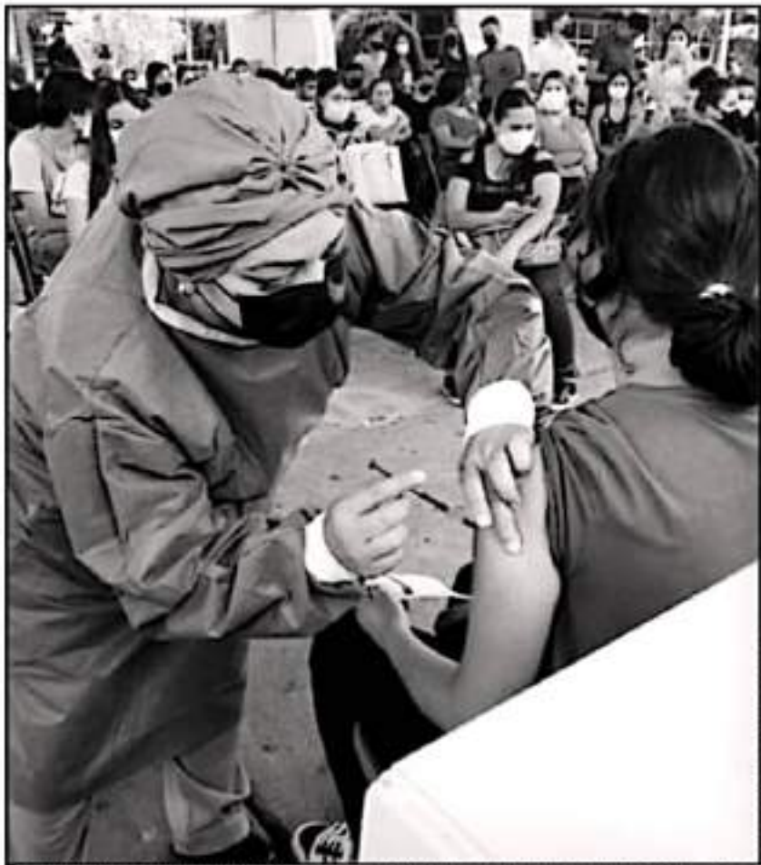
SEORIO BIOLÓGICO PFIZER EL CUAL SE MANTIENE EN FRÍO CONGELADO PARA LA APLICACIÓN DE LA SEGUNDA DOSIS.

730 VACUNAS de primera dosis se aplicaron a menores