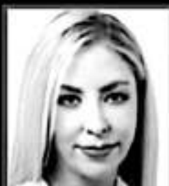
Mayela Salas Sáenz, DIPUTADA PT

“La Suprema Corte ya decidió y ya determinó, pero yo no estoy de acuerdo con la despenalización total del aborto”