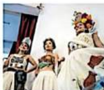
Cuitzeo celebrará el 471 aniversario de su fundación / CARLOS HERNÁNDEZ

El municipio celebrará su aniversario hispanico el 1 de noviembre, y el del título de Pueblo Mágico el 13 del mismo mes.