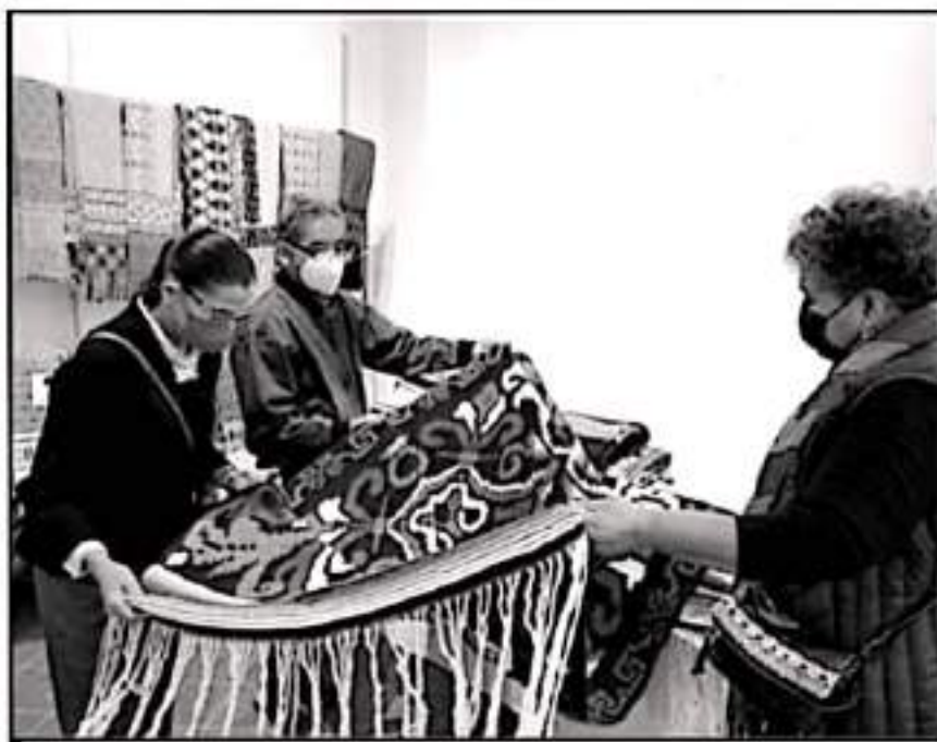
ANTES Y DESPUÉS DEL CONCURSO SE PODRÁN APLICAR LAS OBRAS INSCRITAS. HABRÁ COMERCIALIZACIÓN DE ARTESANÍAS

con representación en el concurso artesanal