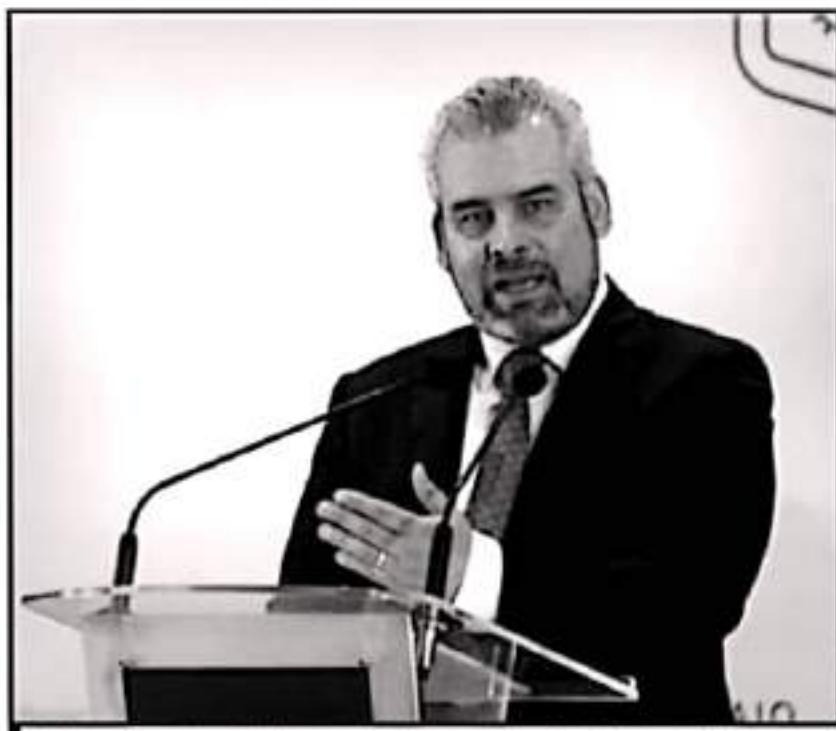
PIDIÓ EL GOBERNADOR RAMÍREZ BEDOLLA COMPRENSIÓN Y COMPROMISO DE PARTE DEL MAGISTERIO MICHOACÁN

les y recursos extraordinarios, pero que próximo jueves, se darían los detalles de la composición de los recursos que posibilitaron los pagos.