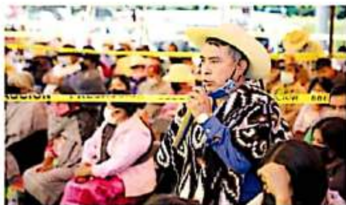
En Donaciano Ojeda participaron 677 personas

das las funciones de gobierno establecidas en el artículo 18 de la Ley Orgánica Municipal de Michoacán, y que en consecuencia se trasladara a la comunidad la parte proporcional conforme al criterio poblacional de todos los fondos y ramos estatales y federales que recibe el ayuntamiento para cubrir dichas funciones, 209