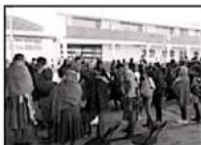
SE LEVANTARÁN PADRONES EN SU COMUNIDADES

El coordinador del Consejo Supremo Indígena de Michoacán,