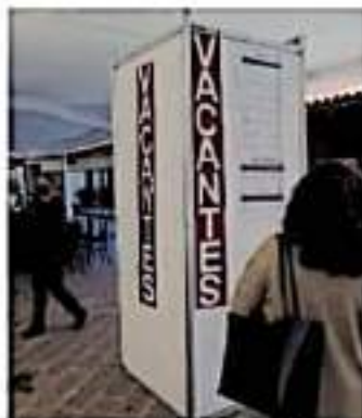
El evento presencial fue en el Salón Michoacán del Centro de Convenciones.

"Tenemos la confianza en que se podrán recobrar los niveles mínimos de ocupación laboral formal".