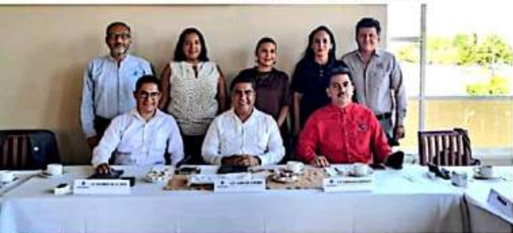
CD. LÁZARO CÁRDENAS, MICH.- Tras varios años de ausencia, resurgió la presencia local de la Confederación Patronal de México en Lázaro Cárdenas.

El vicepresidente de la Coparmex agregó que otro objetivo es "darles voz a los empresarios", además de brindar asesoría y gestionar capacitaciones y certificaciones a emprendedores.