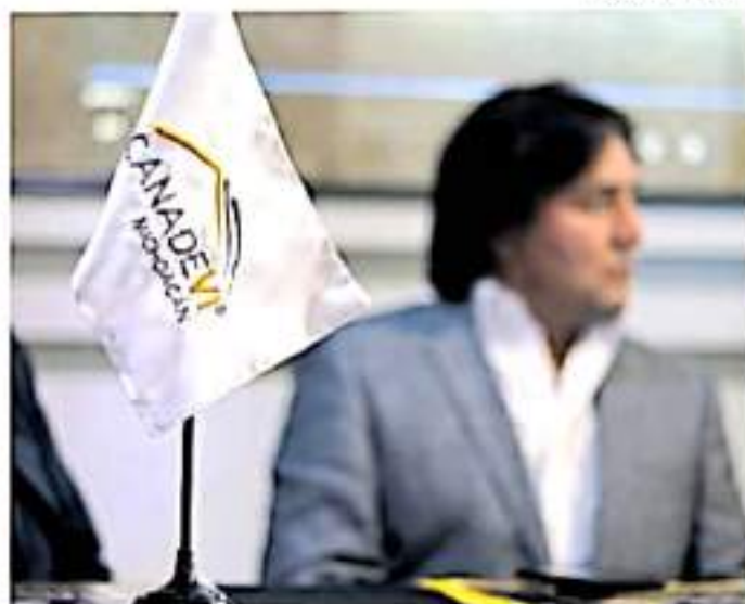
En la expo tendrán la asesoria necesaria para elegir la mejor opción.