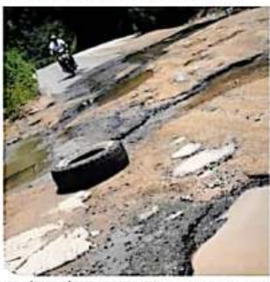
CD. LÁZARO CÁRDENAS, MICH.- Deterioro de calles obstaculiza entrada de servicios básicos a Caleta de Campos.