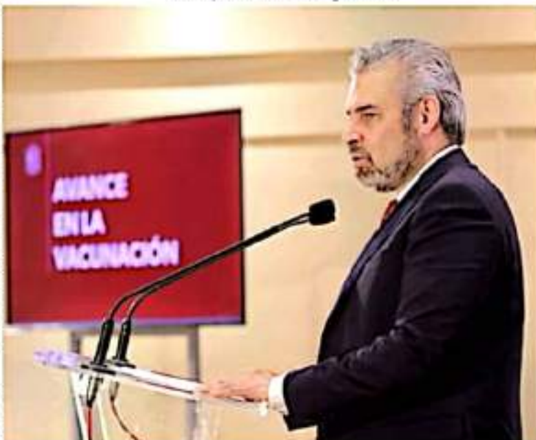
MORELIA, MICH.- El gobernador Alfredo Ramírez Bedolla, informó sobre la firma de un convenio por 120 millones de pesos con el Insabi para garantizar abasto de insumos para el estado.

Agregó que el abasto de medicamentos para todas las enfermedades incluido el cáncer, subió de un 40% al 68% en hospitales y 60% en centros de salud en 26 días que lleva el nuevo gobierno.