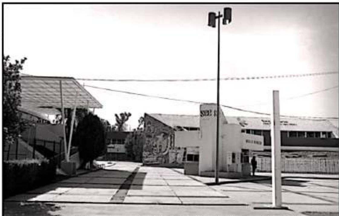
LA SEDE DE LA SECRETARÍA DE EDUCACIÓN DEL ESTADO RECIBIÓ A RECIBIÓ POTENCIA RECUPERAR LA NORMALIDAD QUE HABÍA ANTES DE LA PANDEMIA

Indicó también que eran dando nombres de las personas que han arribado a la Secretaría de Educación durante el periodo de pandemia sin perfil y que incluso se dieron hasta plazas, además de que colocaron docentes cuando un acuerdo era que ya no viniera personal docente.