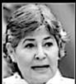
Seyra Alejandra Sierra, DIPUTADA MORENA

“Hay 280 mujeres privadas de su libertad en el país. Yo estoy a favor de la vida y en contra de la penalización”