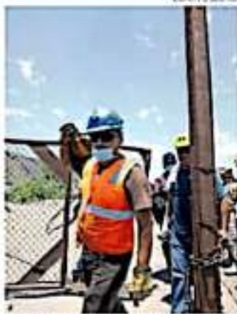
Se está trazando el camino para la exportación de hierro del estado.

din de Naciones del Sudeste Asiático (ASEAN), también surgió un interés por invertir en el aguacate y la piña que se producen en territorio michoacano.