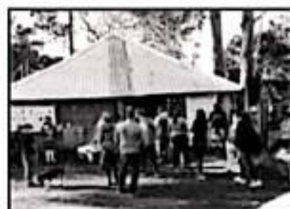
EL VIERNES VACUNARÁN EN CUATRO COMUNIDADES MÁS.