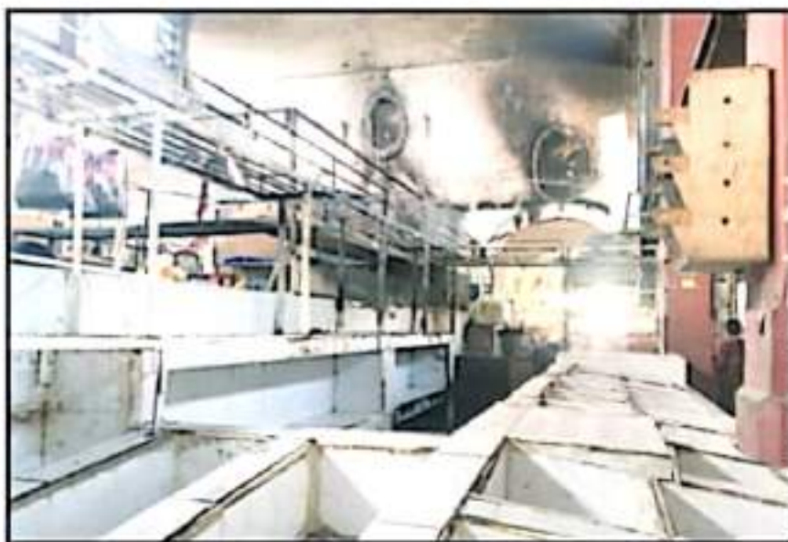
EN SU ARRENTU, DIFERENTES SEÑALARON ESTAR DISPUESTOS A SUFRIR LA TOTALIDAD DE LOS GASTOS DE ESTA OBRA.