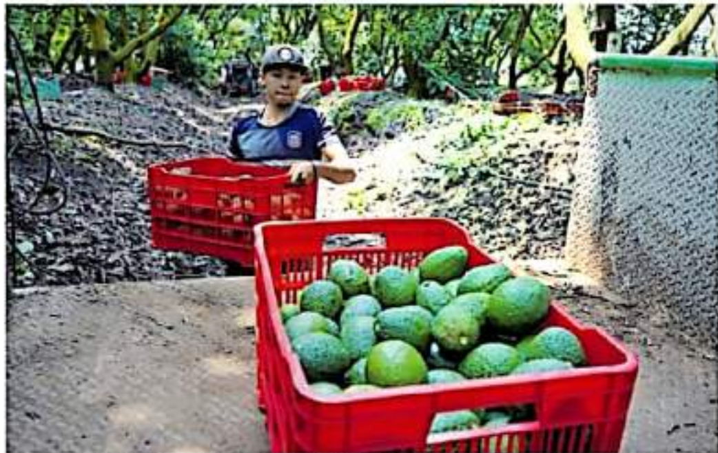
El interés particular por invertir en el aguacate es de los embajadores de la Asociación de Naciones del Sudeste Asiático (ASEAN).