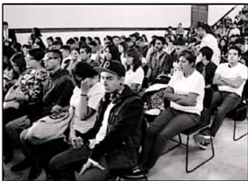
SE TIENEN HASTA 20 MIL JÓVENES INSCRITOS QUE "ALZARÁN LA MANO" Y QUE ESTÁN A LA ESPERA DE SER RECLUTADOS

De acuerdo con cifras del Gobierno estatal se tienen hasta 20 mil jóvenes inscritos que "alzarán la mano" y que están a la espera de ser reclutados como parte de la fuerza de trabajo local según sus experiencias, capacidades y la forma de desen-