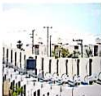
De 2016 a 2018 solo se entregaron dos mil apoyos

Castro Valdez dijo que lo que se espera de este programa para el año 2022