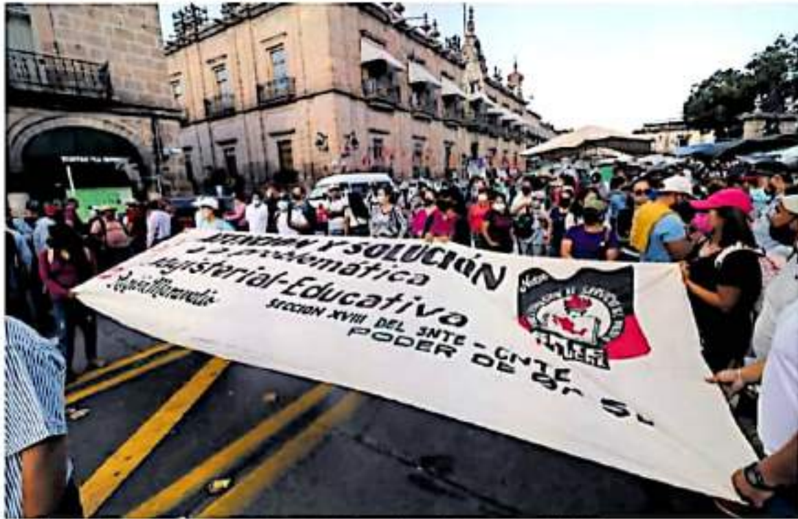
El magisterio salió en una marcha desde la fuente de Las Tarascas hasta el primer cuadro de la ciudad. FERNANDO WALDENAZO