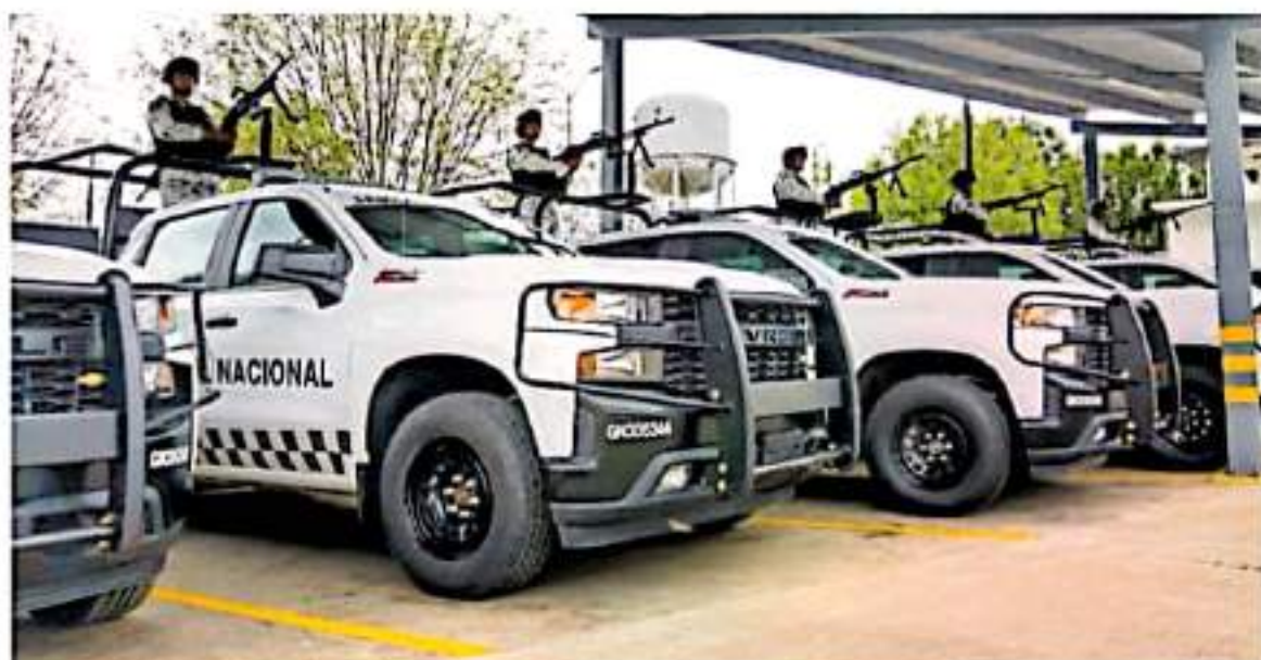
Actualmente hay 22 espacios de este tipo en Michoacán, divididos en diferentes regiones / ANDRÉS HERNÁNDEZ