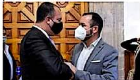
El GPPT trabajará de la par con la CEDH para velar por el respeto a los Derechos Humanos de las y los michoacanos.

"En estos días quedarán determinados los integrantes de las distintas comisiones al interior del Congreso, para nosotros será importante presidir o integrar esta comisión y con ello tendremos la oportunidad de revisar a detalle lo que se nos informa por parte de la CEDH. Tanto en lo administrativo como en la atención a los michoacanos el trabajo de la comisión debe ser impecable", finalizó el legislador.