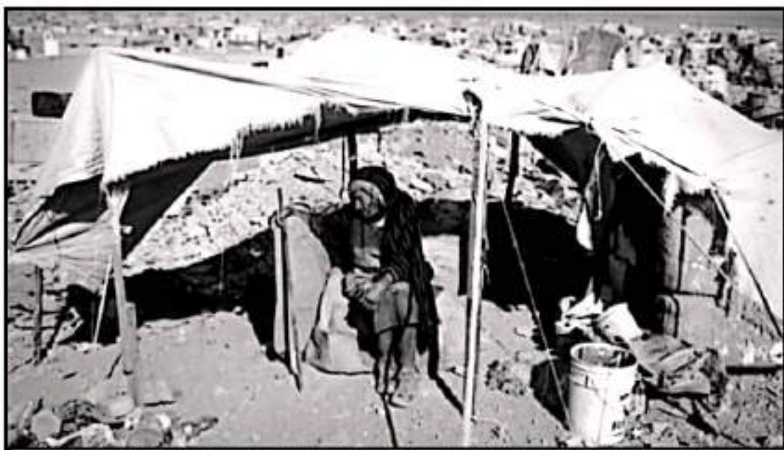
AL NUEVO GOBIERNO LE ESPERAN RETOS MAYÚSCULOS Y SE REQUIEREN DE CAMBIOS ESTRUCTURALES EN TODOS LOS SENTIDOS PARA REPOSICIONAR LA ECONOMÍA