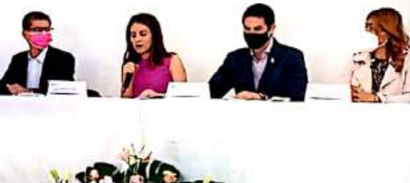
MORELIA, MICH.- Durante todo octubre y de manera permanente, se realizarán jornadas gratuitas de mastografía.

Pese a que no se cuentan con cifras registradas del número de pacientes vinculadas a servicios como el Hospital de la Mujer o el Hospital Civil para su seguimiento, en 2020 se confirmaron 229 casos nuevos de tumores malignos, lo que corresponde a 18.9 casos por cada 100 mil mujeres mayores de 29 años. No obstante 7 de cada 10 mujeres logran salvar su vida, gracias a un diagnóstico oportuno.