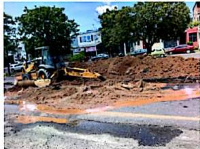
CD. LÁZARO CÁRDENAS, MICH.- Ayer inició Capalac la reparación de socavones en la avenida Melchor Ocampo, por lo que se estarán realizando cierres en diversos tramos de la vialidad