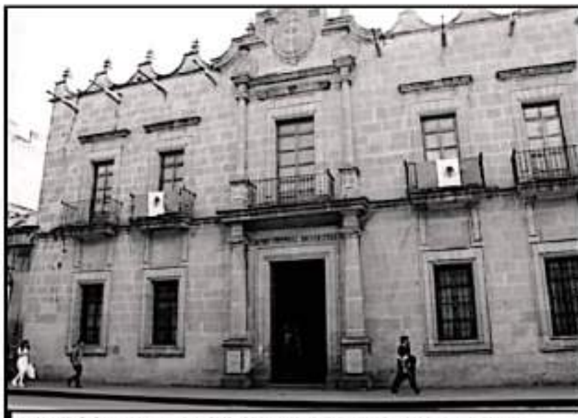
LA UNIVERSIDAD MICHOACANA NO HA DETENIDO SUS ACTIVIDADES SUSTANTIVAS POR LA FALTA DE PAGO

Y es que pese a las complicaciones financieras por las que atraviesan las finanzas del estado, las cuales afectan directa-