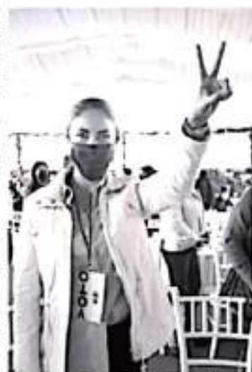
Si bien falta mucho trabajo por realizar, en este sexenio se realizaron más de diez mil obras para mejorar la calidad de vida de la población y se tienen avances significativos.

La legisladora consideró necesario que en Michoacán el nuevo gobierno de continuidad a programas claves para la población, como es Palomas Mensajeros, Palabra de Mujer y Agricultura Sustentable, mediante los cuales se generaron beneficios directos a las y los michoacanos.