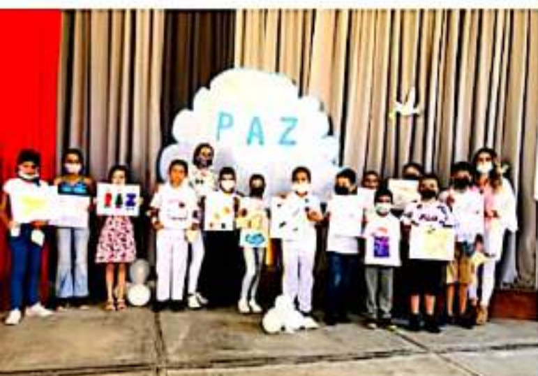
ARTEAGA, MICH.- En el Día Internacional de la Paz, en el municipio de Arteaga celebraron con la acción "Pintando por la Paz" en la que participaron niños y niñas de diferentes escuelas.