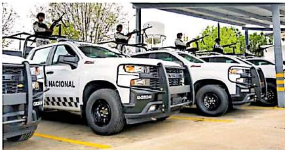
Actualmente hay 22 espacios de este tipo en Michoacán, divididos en diferentes regiones / ADO JIMÉNEZ