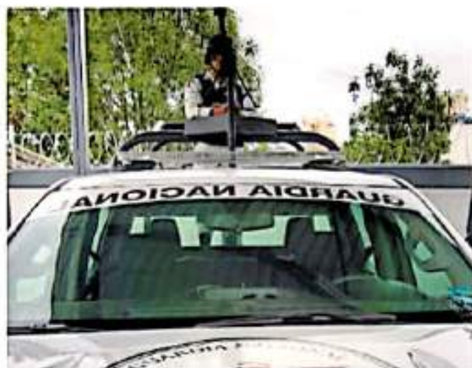
Los cuarteles más nuevos se ubican en Maravatio, Zamora y Cotija

El recinto de la Guardia Nacional con el nuevo espacio cubrirá Tzitzio, Tiqui-