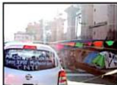
DESCONTENTO MAGISTERIAL MARCO ULIBRE SERENI