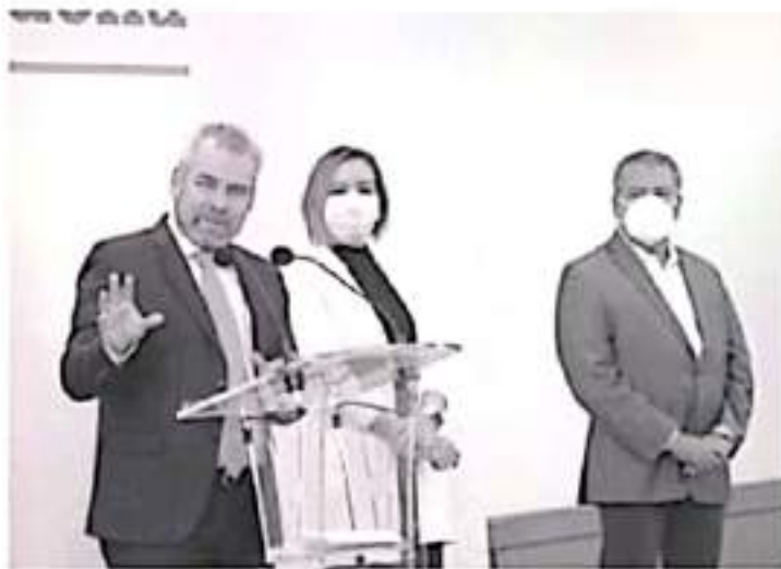
Bedolla informó que durante su administración los funcionarios y dependencias estarán obligados a seguir una serie de lineamientos orientados a tener un gobierno menos costoso, y más eficaz.

Morelia, Michoacán, 27 de septiembre del 2021.- A partir del 1 de octubre se pondrá un alto al derroche de recursos públicos, corrupción y abuso de poder que dejan a Michoacán en quiebra técnica, con un boquete financiero de casi 50 mil millones de pesos, afirmó el gobernador electo Alfredo Ramírez Bedolla.