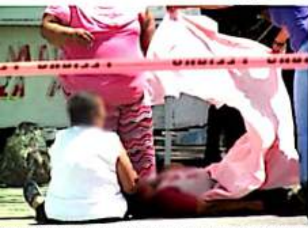
ZAMORA, MICH.- Es una situación muy lamentable y que no parece terminar.

Esperamos que esta situación tan difícil pueda cambiar, dijo, pero hay pocas evidencias de que esto se pueda solucionar, y la responsabilidad es de todas las instancias de gobierno y de