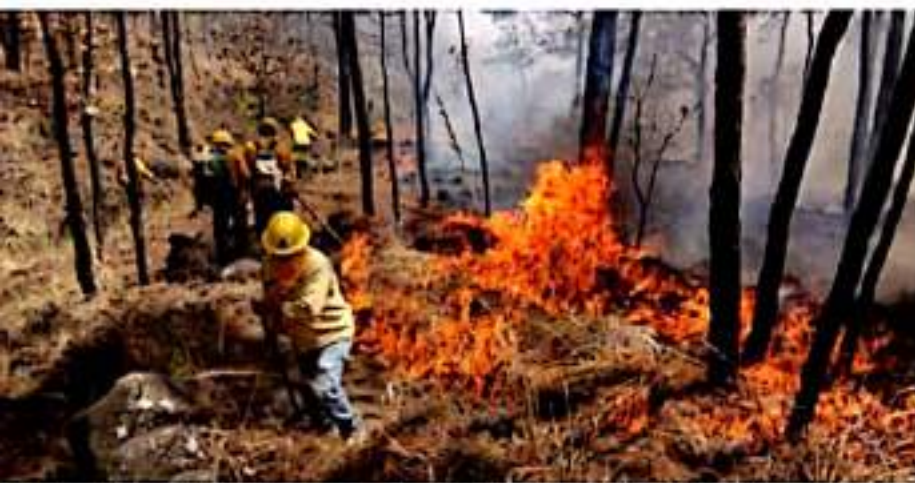
ZAMORA, MICH.- Se debió en gran medida a las condiciones meteorológicas presentadas como las altas temperaturas y los fuertes vientos.

"Por eso se tuvimos la necesidad de solicitar apoyo a brigadas de otros estados y de equipo aéreo; nos apoyaron del estado de Hidalgo y Colima, una Brigada Nacional compuesta por elementos de otras entidades del país".