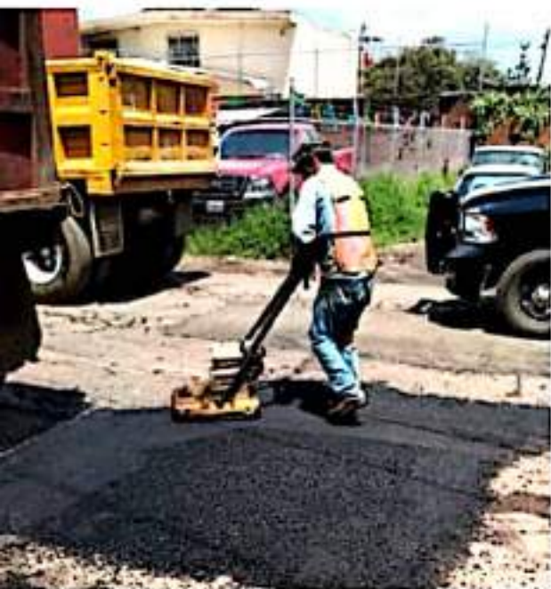
URUAPAN, MICH.- Obras Públicas Municipales concentra su trabajo en la reparación de baches y sincronización de semáforos.

De igual manera, en el tema de los semáforos se realizó una sincronización en varios puntos y cruces de mayor tráfico en la ciudad.