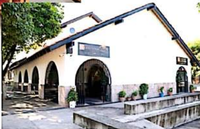
APATZINGÁN, MICH.- Iniciarán el próximo 4 de octubre.

En otro orden de ideas, la directora destacó que se llevan a cabo los preparativos para entregar a la sociedad la primera generación de 22 licenciados en enfermería que egresarán de ese plantel educativo en un acto que se está programando para el 16 de octubre en un lugar aún por definir.