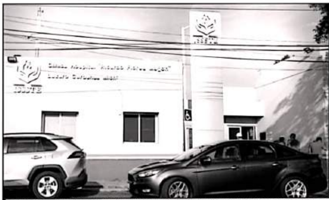
EL DENUNCIANTE SOSTIENE QUE PARA EL ISSSTE NO HAY NINGÚN APOYO QUE SEA CUAL SEA EL ASUNTO ES MOREBILO QUE ESTA CLÍNICA NO TIENE ESTE SERVICIO

globina cuando el mínimo debe de ser 13, está a punto de infartarse por falta de sangre, pero resulta ser que no tienen bómbas para almacenar la sangre y ahí procesarla", comentó Pineda Ramírez cuestionándose: "Se me hace así como que está pasando en donde vivimos, vivimos en un pueblo de Lázaro Cárdenas, se manejan miles de millones de pesos, de dólares, y que el Hospital General no tenga para una bobota que a lo mejor puede costar 30 pesos, realmente se me hace raro".