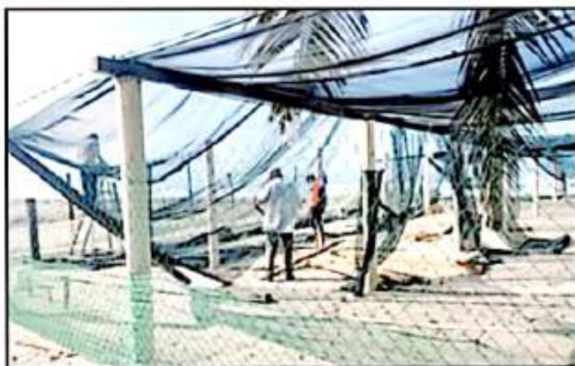
ES EL CENTRO DE PROTECCIÓN DE LA TORTUGA MARINA "TARA-COSTA", EL QUE REGISTRA UNA DESTRUCCIÓN TOTAL.

haber terminado con los trabajos de rehabilitación del centro de protección para iniciar con la temporada de anidación 2021-2022 de tortuga Gálina, Negra y Land. Los trabajos realizados fueron para resolver los daños a su infraestructura por fuertes vientos registrados en junio al paso de "Etaipi".