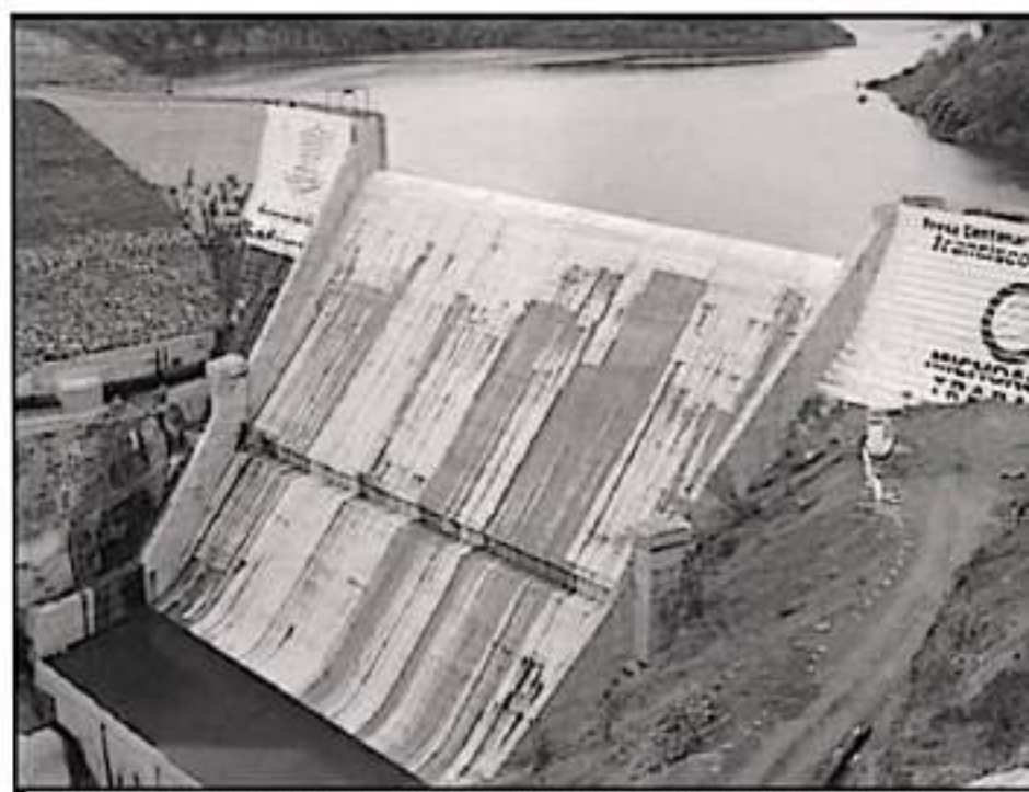
LA PRESA CENTENARIO DE LA REVOLUCIÓN FRANCISCO J. MUGICA FUE UN TEMA QUE MARCO A LOS GOBIERNOS DE LÁZARO CÁRDENAS

Nieto del general Lázaro Cárdenas del Río, senador en funciones e hijo