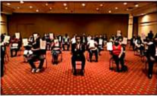
MORELIA, MICH.- Los afectados por los atentados con granadas aquel 15 de septiembre de 2008, se sentían abandonados por las

El gobernador Silvano Aureoles Conejo recordó que desde el primer encuentro con las y los afectados por el atentado del 15 de septiembre de 2008, los apoyó como no se hizo en dos administraciones anteriores, a través de la gestión para que pudieran finalmente contar con su pensión vitalicia, para cubrir sus necesidades en materia de salud, fuentes de empleo, así como con distintos proyectos productivos para que pudieran contar con un ingreso extra, y ahora se cumple la promesa de dotarles certidumbre jurídica de su vivienda.