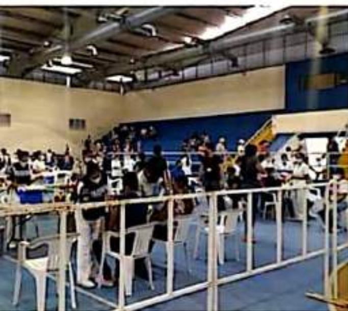
CD. LÁZARO CÁRDENAS, MICH.- Más de 6 mil dosis se aplicaron en el primer día de vacunación, correspondiente a la jornada de inmunización contra el Covid-19, en personas de 18 a 29 años.

Eduardo CHÁVEZ CD. LÁZARO CÁRDENAS, MICH.-