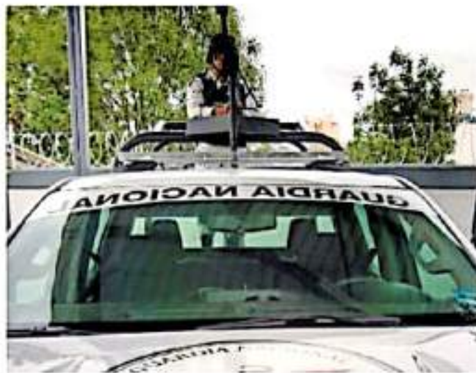
Los cuarteles más nuevos se ubican en Maravatío, Zamora y Cotija

El refuerzo de la Guardia Nacional con el nuevo espacio cubre las zonas Tiqui-