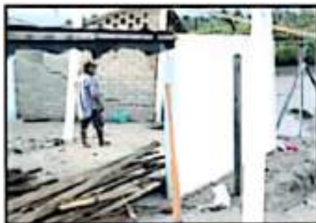
CAMPAMENTOS TORTUGEROS PUEDEN SER DAÑADOS