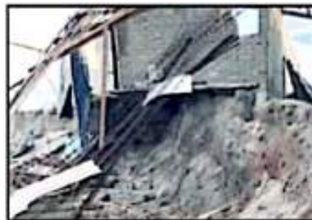
LOS DAÑOS EN LAS ENRAMADAS FUERON MILLONARIOS