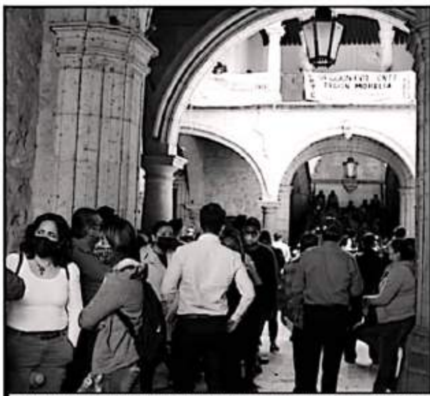
ESTI MÉRCELES LOS MAESTROS PROTESTARON TAMBIÉN EN EL AYUNTAMIENTO, AHORA POR FALTA DE INSUMOS.

Como parte de la jornada de Movilizaciones para exigir los pagos contemplaron la realización