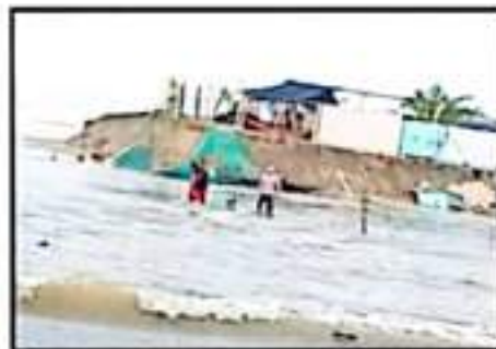
A PESAR DE LAS AFECTACIONES LAS AUTORIDADES NO LLEGAN