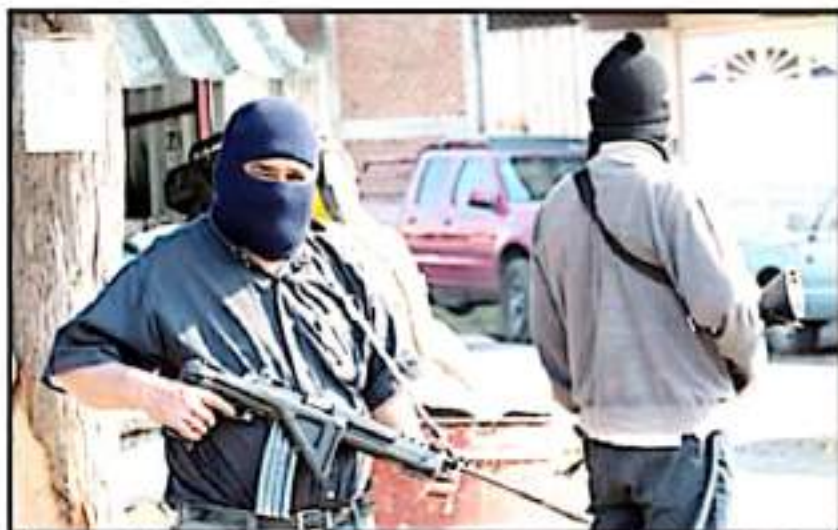
EL SUEGIMIENTO DE GRUPOS DE AUTODEFENSAS Y LA INFILTRACIÓN DEL CRIMEN ORGANIZADO EN LA ERA PRIISTA