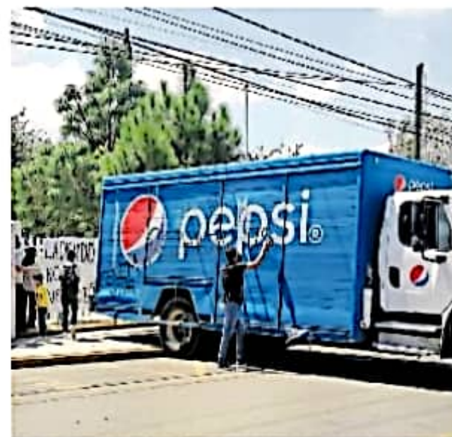
Pintaron consignas para exigir estabilidad laboral

Asimismo, refirió que la federación tampoco ha resuelto el tema del mecanismo de pago directo, el cual podría efectuarse a través del Banco de Bienestar, pero descartó que los agremiados se trasla-