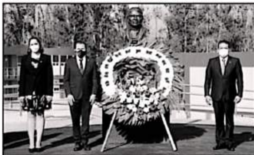
AUTORIDADES DEL ITM, MONTARON GUARDIA EN EL RECINTO DEVELADO BUSTO DEL SIERVO DE LA NACIÓN

Aunado a lo anterior, se tienen como impactos ambientales positivos, además de la preservación y conservación de manglares y la restauración de un recinto de estero y la construcción de un corredor biológico, la aplicación de un plan de compensación mediante la reforestación y rehabilitación de un pulgino en el puerto urbano ecológico El Nangitillo.