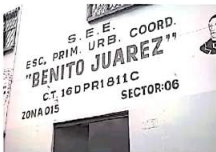
El director declaró que la prueba de antígeno nasal se hizo en un laboratorio particular, y se sabe que el alumno sí presenta fiebre, pero se encuentra estable.

- La prueba se hizo en un laboratorio particular, el niño presenta fiebre, pero estable.