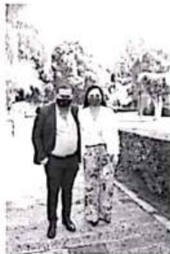
En equipo consolidaremos al Congreso como un Poder fuerte y atento a las necesidades de sus trabajadores, comentó la legisladora.

Por su parte, el dirigente sindical se dijo contento porque exista una relación estrecha con las y los diputados de la nueva legislatura y Mesa Directiva.