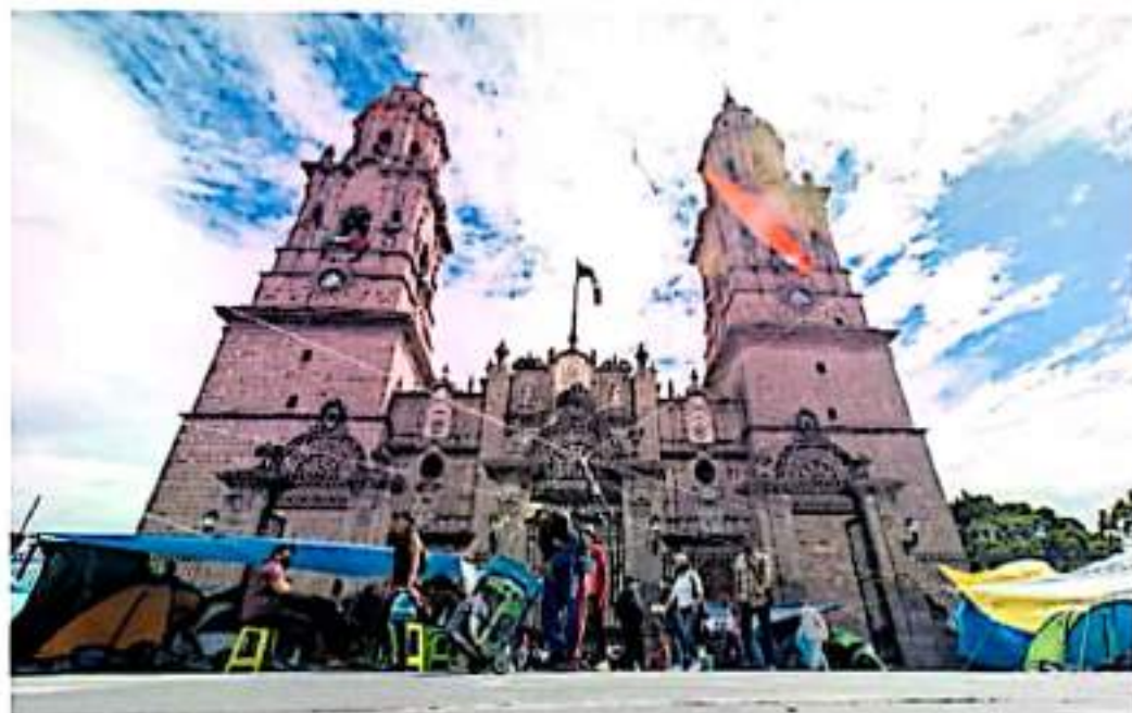
El evento se agendará de acuerdo al semáforo epidemiológico / ASOCIACIÓN