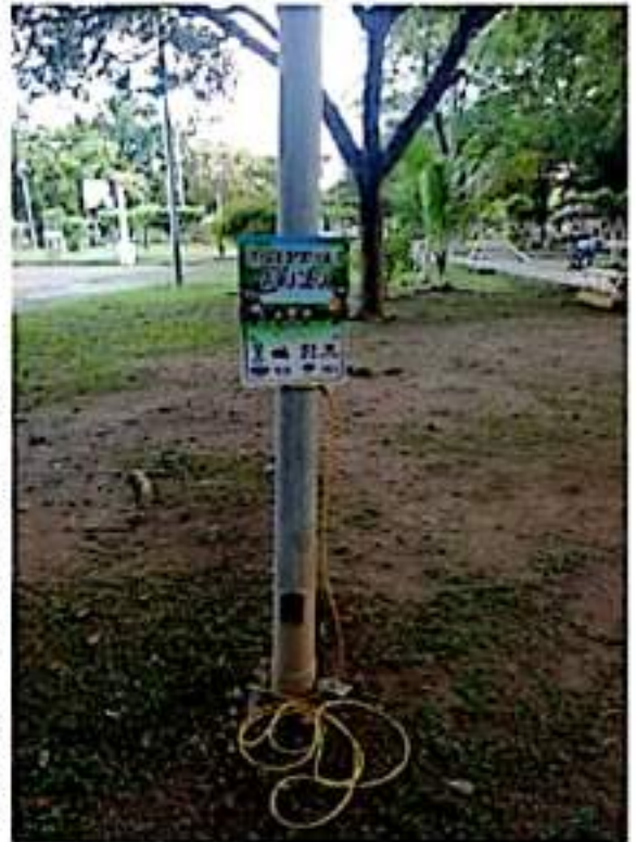
Deportistas con Causa, está colocando letreos relativos al fomento a la actividad deportiva.

Deportiva Municipal y Parque Uruapan, han iniciado con la dotación de cuerdas, pero el plan incluye a otros puntos de reunión familiar, comunidades y clubes deportivos.