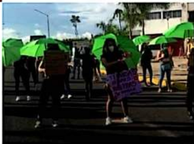
CD. LÁZARO CÁRDENAS, MICH.- Como en diversos puntos del país, en Lázaro Cárdenas también hubo movilizaciones por el Día de Acción Global por el Aborto Legal y Seguro.

Bajo el inclemente sol, este grupo de 50 feministas, aproximadamente, realizaron una performance, además de exigir también justicia ante los casos de feminicidio sin resolver.