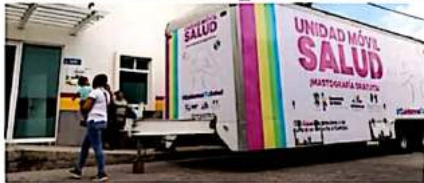
La Unidad Móvil de la SSM para la toma de mastografías gratuitas estará en el municipio del 4 al 20 de octubre próximo.