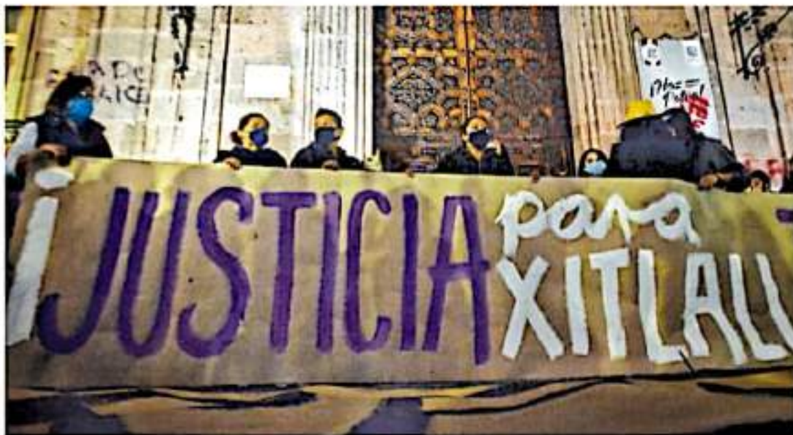
Xitlali Ballesteros fue asesinada el 30 de septiembre de 2020. / FAMILIA HERNÁNDEZ