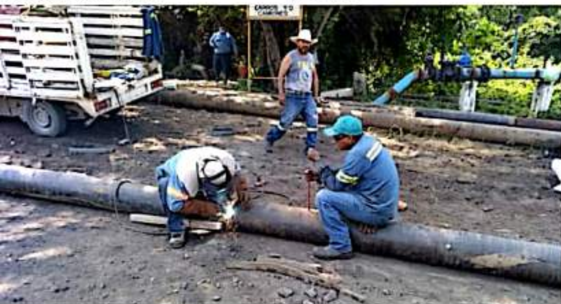
CD. LÁZARO CÁRDENAS, MICH.- Capalac dio a conocer que se tiene un avance del 60 por ciento en la reparación de la tubería que se dañó en el área de Minas por las lluvias y a más tardar la próxima semana estima esté regularizando el suministro de agua en la tenencia de La Mira.