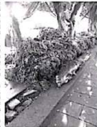
Uno de estos árboles, que se ubican sobre la calle Lerdo de Tejada, uno de sus ramales se vino abajo la mañana de este lunes, afortunadamente no causó ningún accidente.