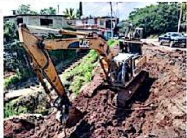
ZIRIMÍCUARO, MPIO. DE ZIRACUARETIRO, MICH.- Inició la reparación de un socavón en la carretera, frente a Zirimícuaro

dejará de ser un peligro para el tráfico vehicular, pues esa carretera une a poblaciones como Taretan, Santa Clara del Cobre, Ario de Rosales, y es utilizada sobre todo para sacar los productos del campo.