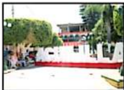
LA VOLUNTAD DE CASTILLO, ÚLTIMA A RESOLVER

Vallejo Figueroa solicitó en tres ocasiones licencia para ausentarse de su encomienda, aunque la última fue para separarse de manera definitiva del Poder Ejecutivo. En los más de 270 días que estuvo ausente, se