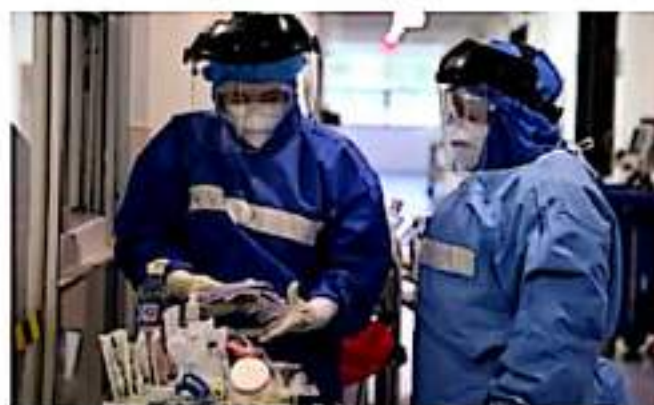
CD. LÁZARO CÁRDENAS, MICH.- La Jurisdicción Sanitaria de Lázaro Cárdenas, suma 14 mil 757 casos confirmados de Covid-19 y 684 defunciones.

La SSM, pone a disposición de la población el 800-123-2890 con 11 líneas para resolver todas sus dudas, así como el micrositio bit.ly/MichCOVID19 donde encontrarán toda la información disponible sobre Covid-19.