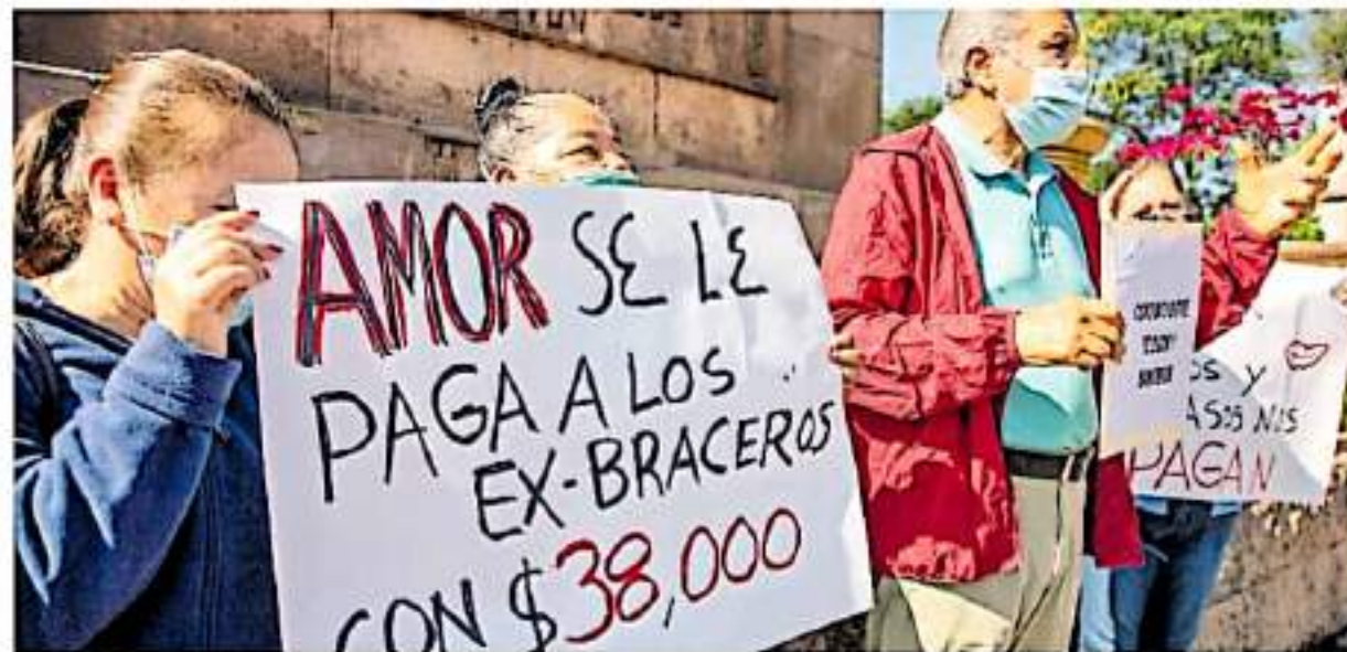
Exbraceros y familiares se manifestaron en la Plaza Jardín Morelos, donde anunciaron que habrá más movilizaciones.

A NIVEL NACIONAL ESPERAN 50 MIL PERSONAS