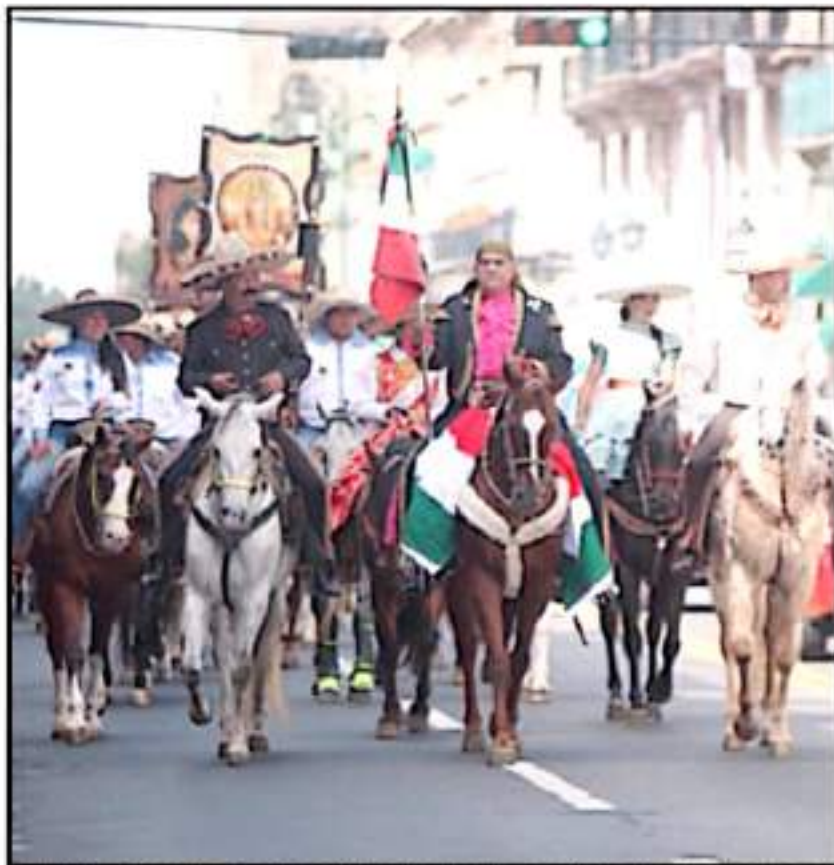
DESTACA QUE LA CIUDAD QUE SE VIÓ NACER A MORELOS ES DONDE EL 60% DE LOS MORELIANOS SE SIENTE INSEGURO

En el marco de la conmemoración del Natalicio de José María Morelos y Pavón, la situación en la antigua Valladolid, hoy Morelia, es compleja en cuanto a la violencia generalizada, crisis de valores y la mar-