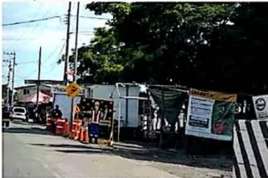
En Coahuayana dieron a conocer los mecanismos para el transporte de papaya de Michoacán a Colima.

La invitación a los productores de papaya es a cumplir con estos requisitos para no tener problemas en los puntos de verificación de Senasica, precisándose que los verificadores tienen todo el respaldo del Gobierno Federal y que una vez detenido un camión cargado no se puede hacer nada por rescatarlo, porque la finalidad de este operativo es prevenir y controlar la proliferación de la mosca del mediterráneo.