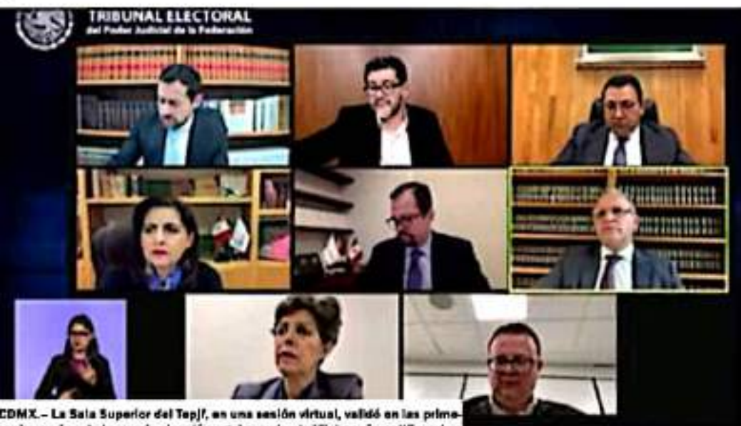
CDMX.- La Sala Superior del Tepjf, en una sesión virtual, validó en las primeras horas de este jueves, la elección a gobernador de Michoacán, ratificando a Alfredo Ramírez Bedolla como el sucesor de Silvano Aureoles.