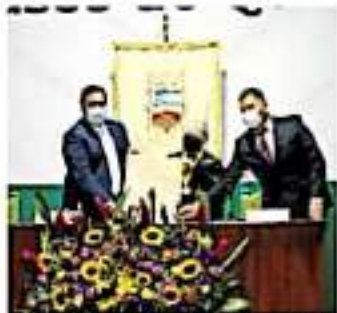
Se hizo entrega de la presca a la hija del científico