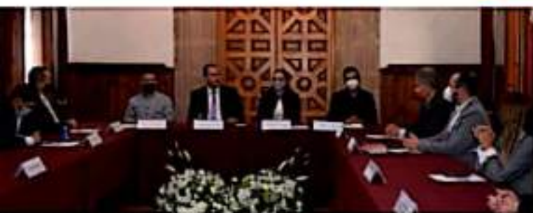
MORELIA, MICH.- El contenido del informe se realizó en versión electrónica, con la intención de evitar dispendios innecesarios.