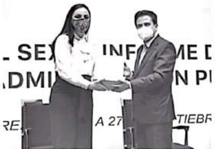
Este Informe de Gobierno es el instrumento de rendición de cuentas del Poder Ejecutivo Estatal y, por lo tanto, está sujeto al análisis por parte del Poder Legislativo.