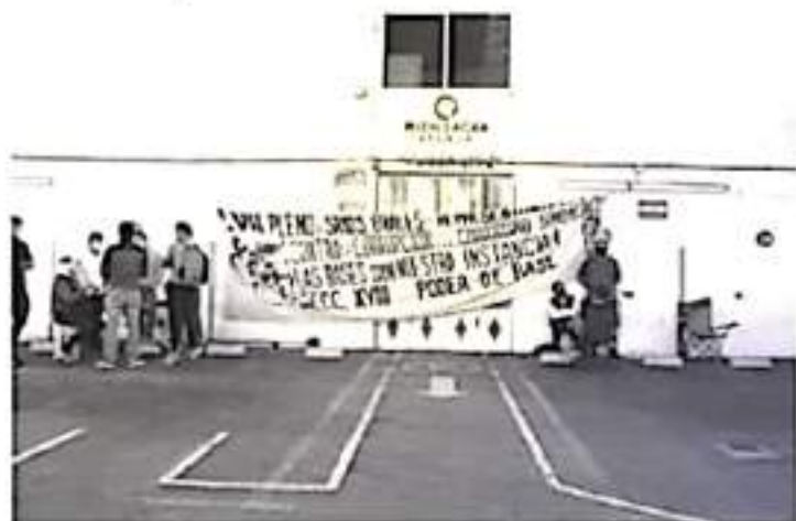
Habrán toma de Rentas toda la semana, además martes y miércoles la liberación de la autopista, jueves un bloqueo de la carretera Zitácuaro-Toluca a la altura de Conalep.

- Jueves bloqueo de la carretera Zitácuaro-Toluca