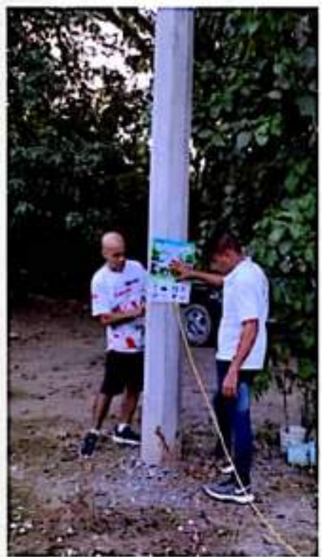
CD. LÁZARO CÁRDENAS, MICH.- Deportistas con Causa se mantiene vigente en acciones de promoción de la salud.

Es así que con iniciativas pequeñas se logran grandes resultados y puedes mejorar los estilos de vida de un pueblo.