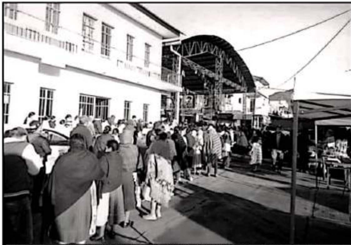
CENTROS DE VACUNACIÓN EMERGENTES EN EL MEDIO RURAL INDÍGENA, TENDRÁ CAPACIDAD DE ATENDER A RESIDENTES DE LAS COMUNIDADES VECINAS

De esta forma ayer se inició la vacunación que culminará hoy en Calatzenim con mil 500 dosis, Angahuan con mil 370 y Capatzenim con dos mil 470, todas de la farmacéutica AstraZeneca, mientras que para el 1 de octubre se activará el último módulo en Nuevo Zitosto con 760 dosis de las cuales 530 será Canino de una sola dosis y el resto de AstraZeneca de dos dosis.