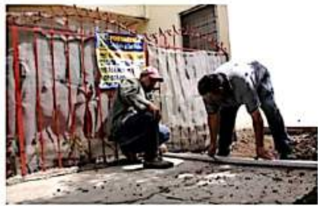
ZAMORA, MICH.- Los trabajos consisten en eliminar puntos de peligro para que puedan transitar libremente sin sufrir algún accidente.