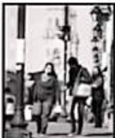
RECORVA HAY 2 MIL 654 CASOS ACTIVOS EN MICHOACÁN

Las muertes reportadas en la última jornada son 17, y ocurrieron en 13 municipios: 3 en Morelia, 2 en La Piedad y una más en Hidalgo, La Huacana, Zimapacuato, Uruapan, Apatzingán, Lazaro Cárdenas, Zacapu, Panindícuti, Los Reyes, Huatanay y Coahuila, además de un caso fortuito.