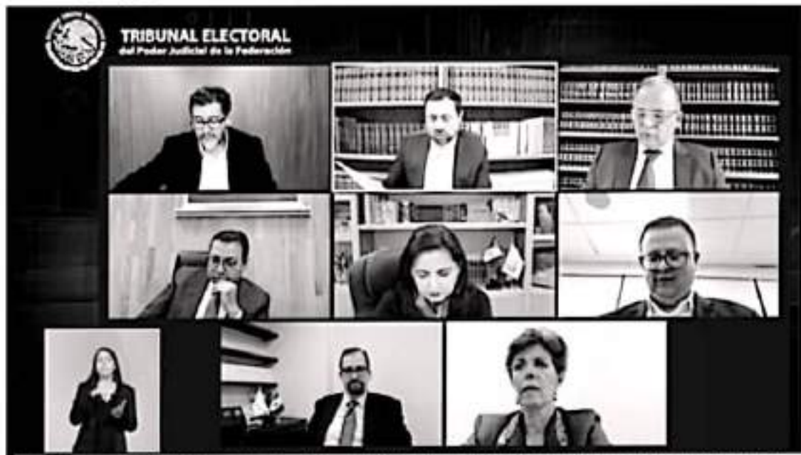
DE MANERA UNÁNIME LOS MAGISTRADOS CERTIFICARON ELECCIÓN, SI BIEN NO DEJARON DE SEÑALAR LA INGENCIA DEL CRIMEN DE FORMA FOCALIZADA