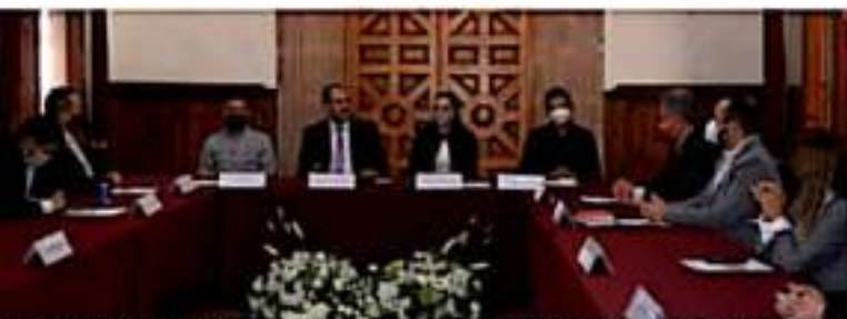
MORELIA, MICH.- El contenido del informe se realizó en versión electrónica, con la intención de evitar dispendios innecesarios.