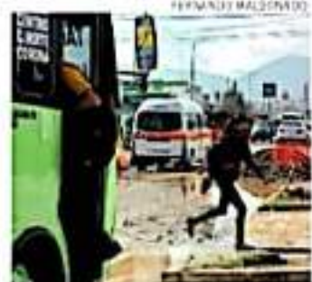
En la zona hay muchas zanjas donde han caído personas y automóviles.