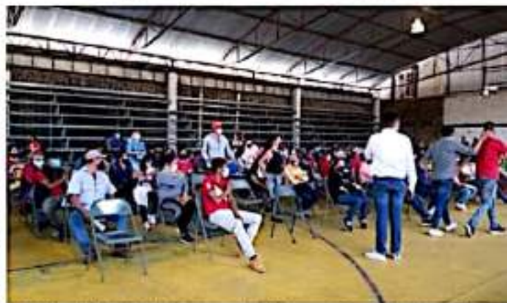
URUAPAN, MICH.- Sin incidentes se registró la Jornada Especial de Vacunación anti-Covid-19 a rezagados de poblaciones rurales.

Pidió paciencia para llegar a la recta final de la vacuna de los grupos etarios de 18 años en adelante, y quedará pendiente el grupo etario de 12 a 17 años, pero no se cuenta con una fecha específica, pues antes se tiene que cubrir la segunda dosis del grupo etario de 18 a 29 años de edad, por lo que pidió estar pendientes de la estrategia ya que habrá alguna modificación y enseguida atenderán la cuestión de rezago.