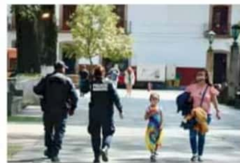
Efecto dominó. La falta de turistas afecta también a hoteleros, restauranteros, comerciantes y otros.

Nohemi Barragán comentó que la afectación a las agencias de viajes por la pandemia