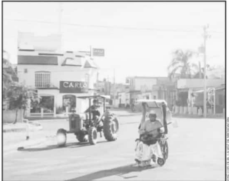
ANTE LOS RIESGOS DE CONTAGIOS POR LA COVID-19, LA REGIÓN DE LA CIÉNEGA URGE REDOBLAR PLAN DE SANIDAD.

Además, se tienen registradas ya 85 defunciones lo que coloca a este municipio en el segundo lugar con casos positivos y defunciones en la Jurisdicción Sanitaria en la que se integra esta localidad, lo anterior como reflejo de lo que llamó "relaja-