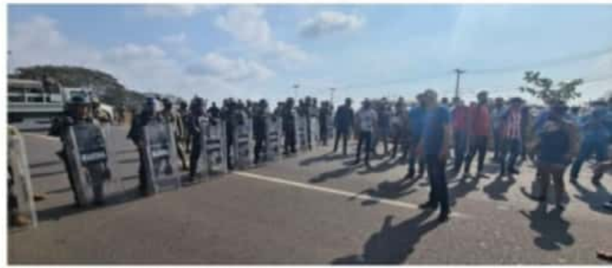
CD. LÁZARO CÁRDENAS, MICH.- Normalistas y marinos se confrontan, para impedir el paso de los primeros al recinto portuario.