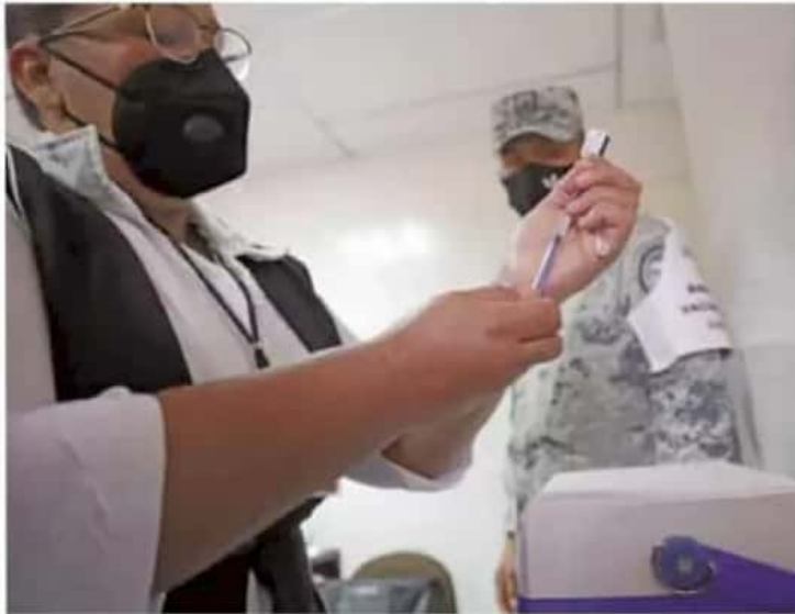
Calendario. Se espera que la vacunación en México concluya en el año 2022.

En total, son cuatro las empresas con las que ya se tienen programadas las cantidades y fechas de entrega. De la vacuna que más dosis se esperan en el país (hasta 130 millones) es la de AstraZeneca y la Universidad de Oxford, la cual tiene una efectividad de 70%. No obstante, ésta no ha sido recomendada para aplicar a mayores de 65 años.