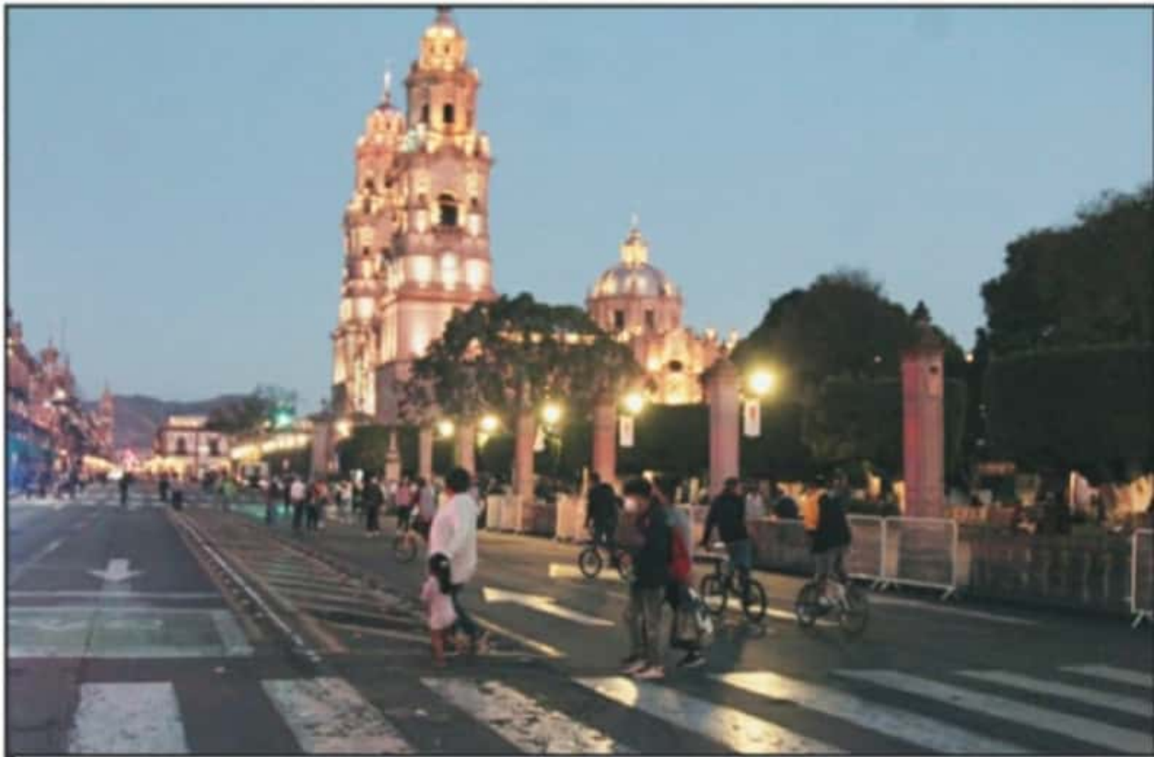
EL OPERATIVO DE CIERRE DE PLAZAS PÚBLICAS, COORDINADO POR EL AYUNTAMIENTO DE MORELIA, SE PROLONGÓ HASTA ENTRADA LA NOCHE DEL MIÉRCOLES

Finalmente, también destaca "instalar puntos de revisión itine-