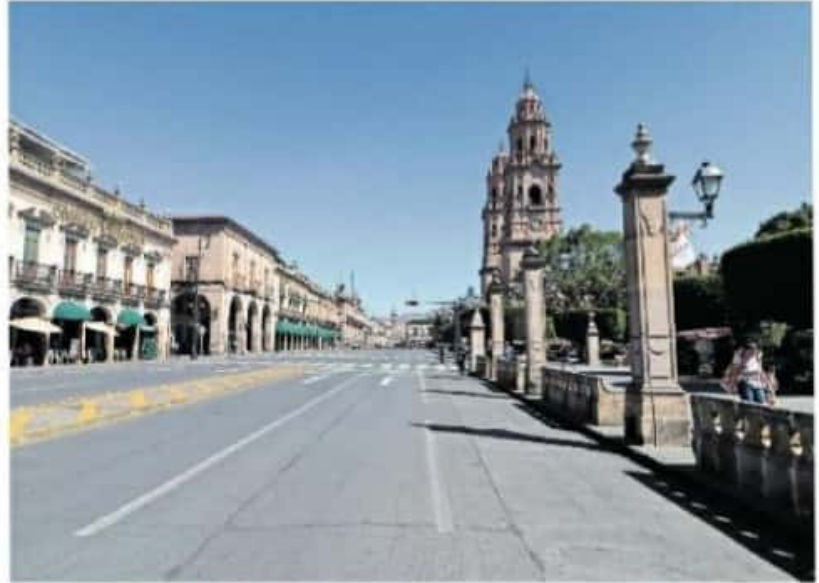
Se desechó la idea de prohibir la entrada a adultos mayores

Los acuerdos tienen como vigencia 15 días, debido a que se convocará a otra reunión a mediados del mes