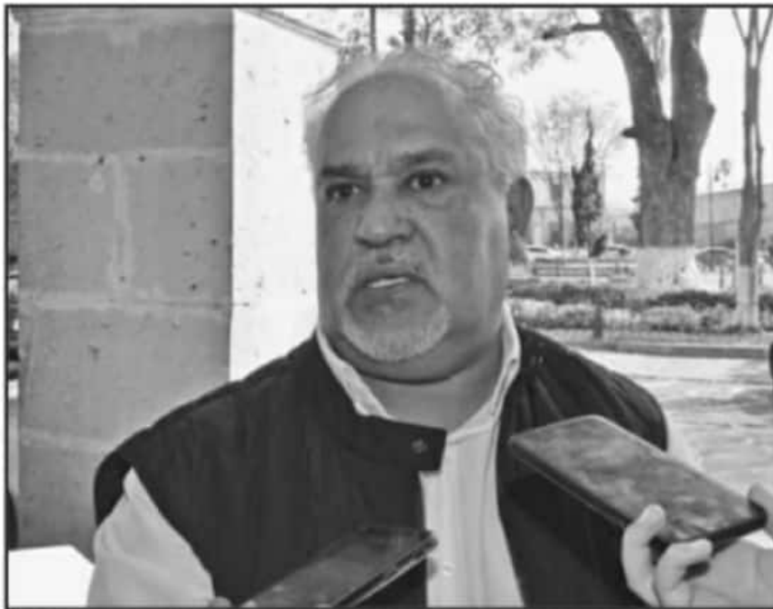
EL LÍDER DEL SINDICATO ÚNICO DE LA UNIVERSIDAD MICHOACANA TIENE QUE CLARIFICAR A QUIÉN ENTREGA AYUDA SINDICAL.

SUEUM el que no ha entregado la información de a quién se destina los recursos entregados por la institución.