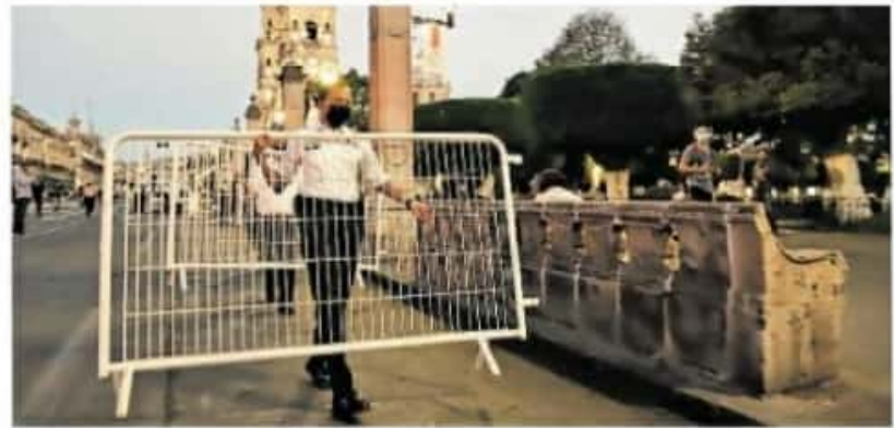
Los sábados y domingos no habrá permiso de operación de centros nocturnos / CARMEN HERNÁNDEZ