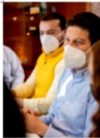
MORELIA, MICH.- Coincidieron en que el contexto actual obliga a anteponer los intereses personales para evitar que la inexperiencia siga gobernando.

Tras este primer acercamiento, dejaron patente el compromiso de seguir trabajando para construir este proyecto que trasciende las ideologías políticas y que busca el desarrollo de la ciudad.