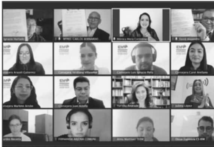
LAS AUTORIDADES ELECTORALES ESTAMPARON LA FIRMA EN UN CONVENIO DE COLABORACIÓN CON EL SMRTV.

En tanto, el segundo debate entre contendientes a la gubernatura tendría verificativo entre los días 9 y 16 de mayo del presente año, según la programación de tiempos del calendario electoral. La