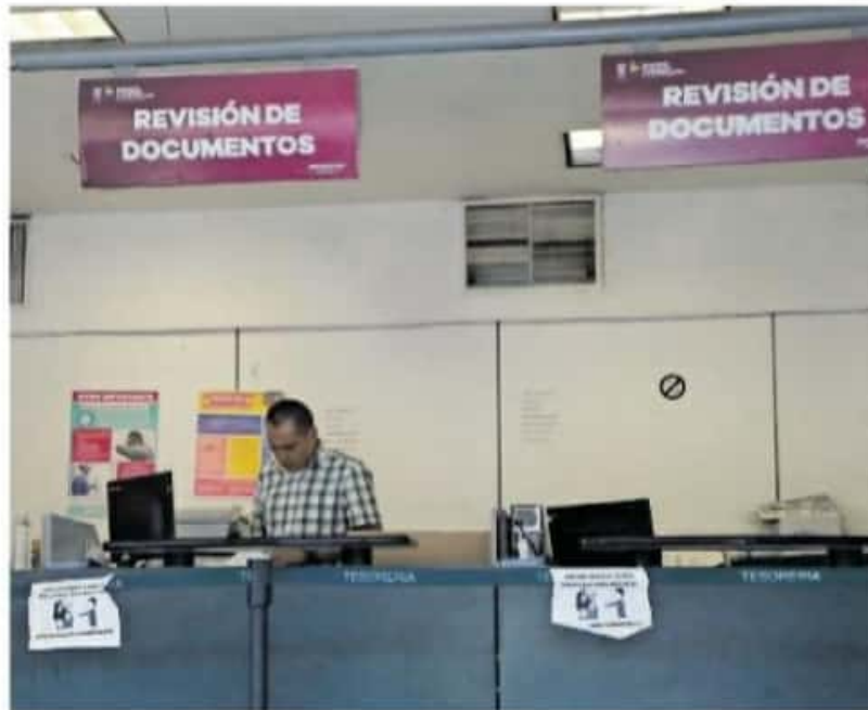
La Secretaría de Finanzas tuvo 31 observaciones previas, una eliminada, 25 ratificadas y cinco rectificadas.

De las observaciones que no fueron subsanadas, destacan, entre otras, la falta de autorización de la Comisión Gasto-Fi-