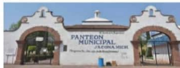
JACONA, MICH.- Las autoridades municipales hacen un llamado a toda la ciudadanía a no bajar la guardia en estos momentos críticos de

Se permitirá el acceso al lugar de una sola persona a la vez, en horario de 9:00 a 15:00 horas, por tiempo limitado, en aquellos casos en los que solicite al tel. 560 1582, con antelación a la administración del panteón para mantenimiento de las tumbas. Cabe mencionar que se intensifican acciones de limpieza y mantenimiento de áreas verdes al interior del Panteón, a fin de evitar cualquier tipo de contaminante que perjudique la salud de los visitantes.