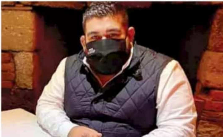
Diálogo. Antes de la ruptura con Morena se va a ponderar la conciliación, señaló.

En entrevista radiofónica exclusiva, el también diputado federal por el distrito 12