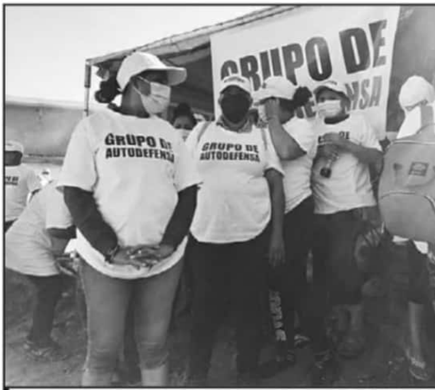
LA DETERMINACIÓN DEL ESTADO ES CLARA, NO SE RECONOCERÁN LAS AUTODEFENSAS Y SE ACTUARÁ DE FORMA LEGAL.

"Hemos hecho presencia con las instituciones de seguridad y las labores de inteligencia que tenemos establecidas nos permitió identificar a 4 de sus integrantes que mostraron su imagen. Tenemos nombre y apellido, domicilios y esquemas que no quiero anunciar, pero todas ellas generaron apología del delito en favor de una célula delictiva y que todas han mostrado interés en favorecer las actividades delictivas