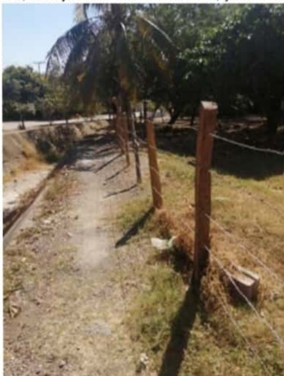
El departamento de Patrimonio del ayuntamiento local, señaló que ningún funcionario de la actual administración municipal está involucrado en invasión de áreas verdes.

Afirmó el funcionario municipal que se continuará explorando una forma de solución pacífica, donde los colonos estén de acuerdo porque lo que se quiere es coadyuvar a que haya paz social y no sobrevida el conflicto.