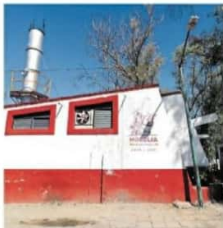
Cada crematorio puede incinerar hasta seis cuerpos por día

Los acuerdos tienen como vigencia 15 días, debido a que se convocará a otra reunión a mediados del mes para evaluar el comportamiento de los casos.