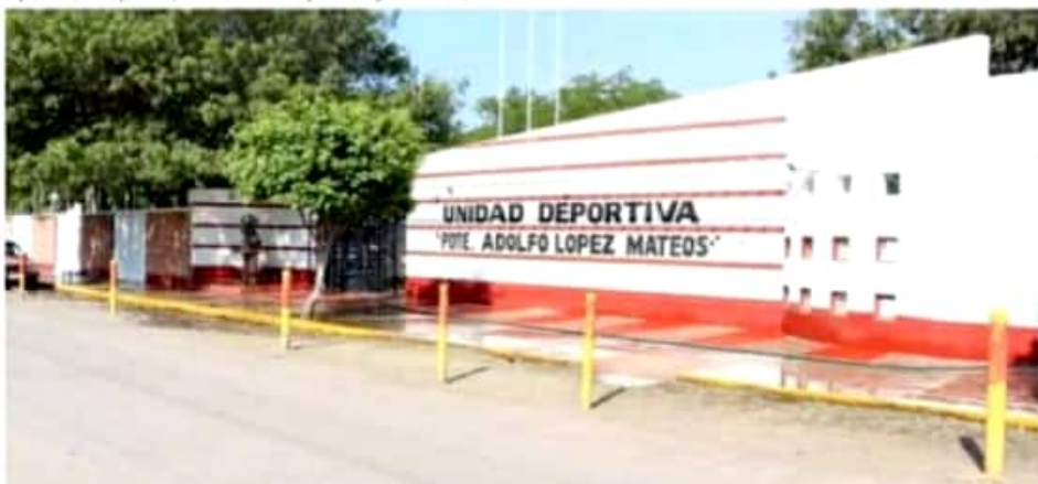
APATZINGÁN, MICH.- Mauricio Magadan, indicó que se decidió cerrar la unidad deportiva debido a que todos los días acuden cientos de personas.

El funcionario local, abundó que será de acuerdo a cómo se comporten los números para determinar la nueva apertura de la Unidad Deportiva, "por ahora lo más sano y para cuidar la salud de todos es mejor suspender todos los cursos y la práctica de deporte" finalizó.