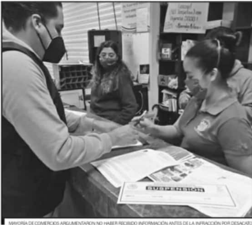
MAYORÍA DE COMERCIOS ARGUMENTARON NO HABER RECIBIDO INFORMACIÓN ANTES DE LA INFRACCIÓN POR DESATADO.

"Realizamos un corte en la dirección con un saldo de 27 clausuras, la mayoría son por el desatado a las medidas establecidas en la minuta de acuerdos. Adicionalmente se aplicaron un total de 45 infracciones también en su mayoría por desatado. La diferencia entre las clausuras y las infracciones es un criterio de que en algunos establecimientos no habíamos dejado como