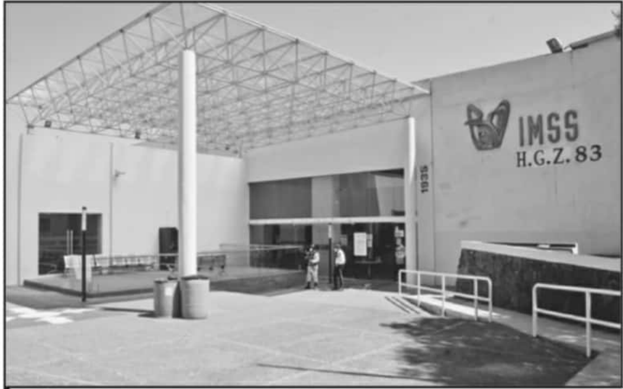
SE PREVÉ QUE LA CONSTRUCCIÓN DE LOS DOS SANATORIOS TEMPORALES PARA ATENDER CASOS DE COVID-19 SE LLEVE A CABO EN LAS ÚLTIMAS DOS SEMANAS DE FEBRERO.

En cuanto a las características y materiales que tendrán dichas uni-