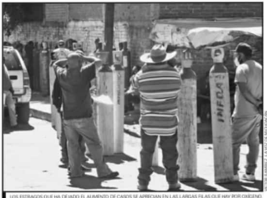
LOS ESTRAGOS QUE HA DEJADO EL AUMENTO DE CASOS SE APRECIAN EN LAS LARGAS FILAS QUE HAY POR OXIGENO.