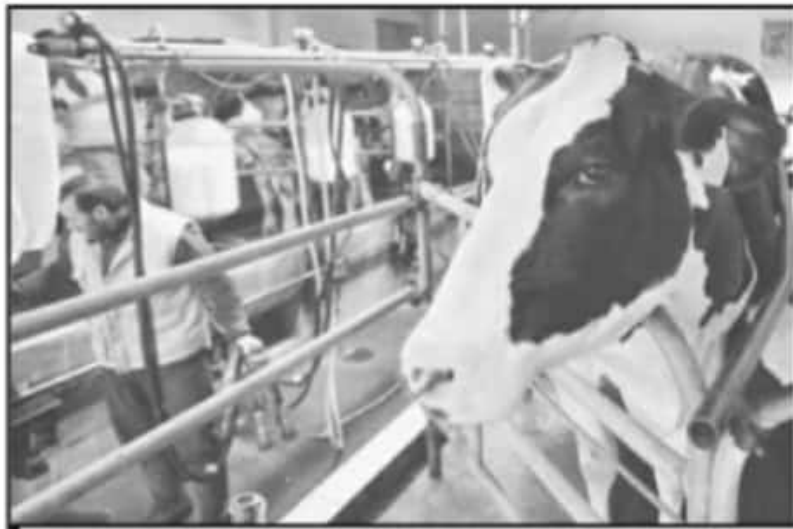
EL SIAP ASEGURA QUE PESE A LA PANDEMIA LA TENDENCIA DE LOS LÁCTEOS VA EN ASCENDENTE.

acán se mantiene como la entidad trece en cuanto a producción de leche bovina, sitio que ha ocupado los últimos dos años tras brincar desde el lugar 16 que ocupaba en 2018.