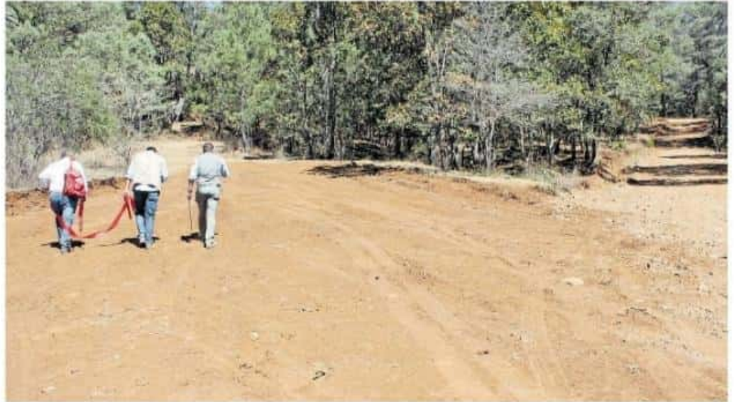
La respuesta de la ProAm partió de una serie de denuncias públicas que emitieron comuneros de la Tenencia de Jesús del Monte.