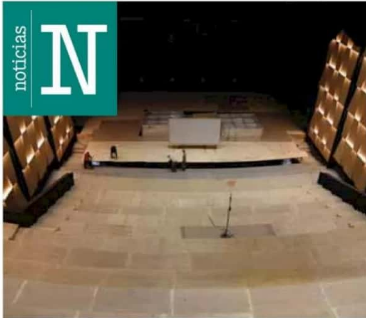
Inmueble. Albergará puestas en escena, espectáculos, conciertos, festivales y más.