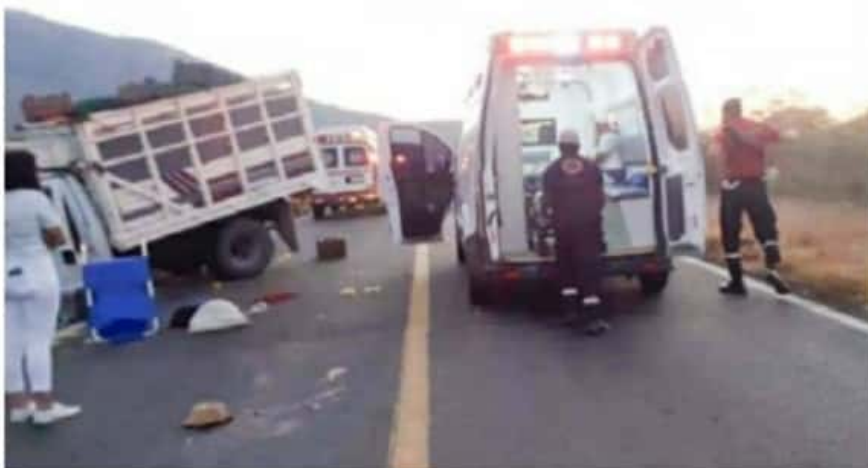
Por la mañana de ayer, sobre la carretera Apatzingán-Buenavista ocurrió el choque de tres camionetas, con saldo

Personal de peritos se encargaron de realizar el peritaje correspondiente y retiraron las unidades siniestradas del lugar, para reabrir la circulación que duró varias horas cerrada.