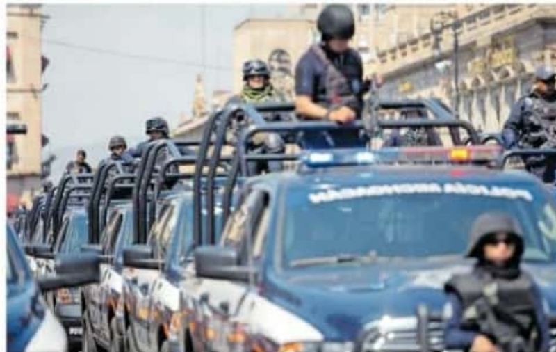
En la SSP faltó información respecto al gasto para capacitación.