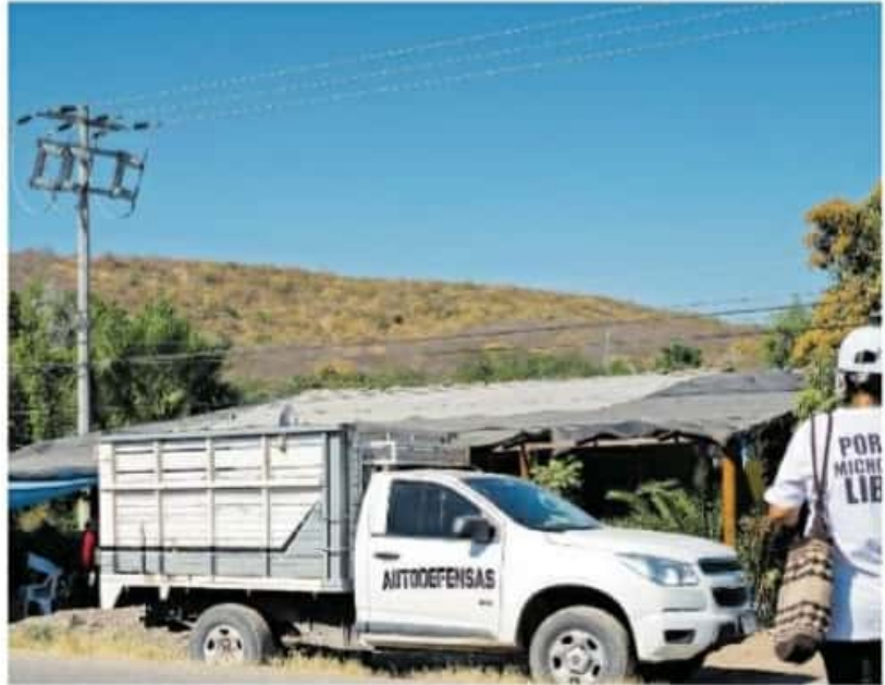
La limpia de barricadas de presuntas autodefensas inició en las comunidades de Cenobio Moreno, el Terrero y Pinzándaro.