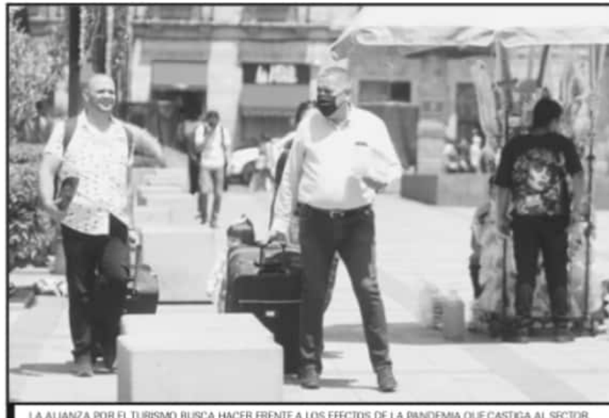
LA ALIANZA POR EL TURISMO BUSCA HACER FRENTE A LOS EFECTOS DE LA PANDEMIA QUE CASTIGA AL SECTOR.

30% AGENCIAS de viaje ha suspendido labores