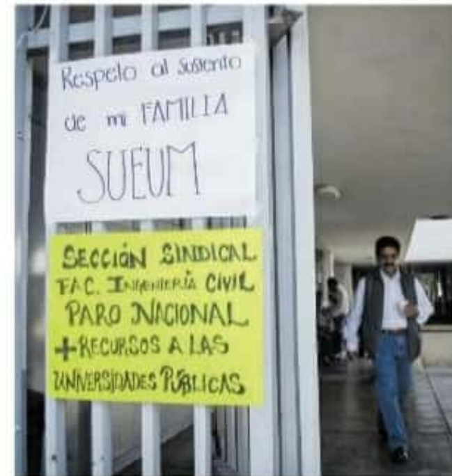
Se detectaron anomalías en el informe financiero de la institución por 61 millones de pesos /CARMEN HERNÁNDEZ

Aseguraron que a pesar de que son observaciones que la Auditoría le ha hecho a la Universidad, quienes realmente tienen la información, pero no han querido proporcionar es el sindicato y es directamente el único responsable de que sus afiliados se ven perjudicados por la mala administración.