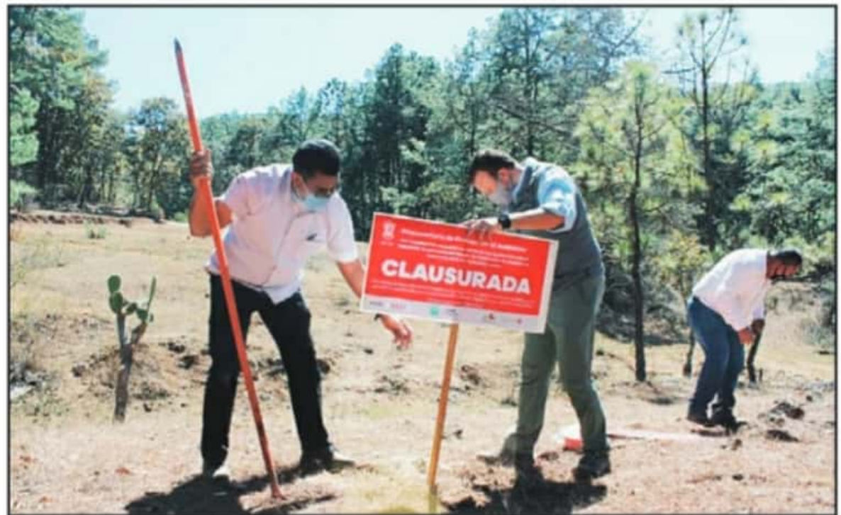
LA PROCURADURÍA AMBIENTAL DE MICHOACÁN COLOCÓ LOS SELLOS DE CLAUSURA AL MEDIO DÍA DE ESTE MIÉRCOLES, POR EL RETIRO DE ESPECIES FORESTALES.

Las imágenes sobre el desarrollo de cabañas demuestran el impacto generado por los