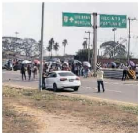
Fueron alrededor de 100 personas quienes obstruyeron la vialidad.

Este mismo argumento ha sido defendido por el gobernador Silvano Aureoles Conejo, quien en reiteradas ocasiones ha sostenido que los presuntos grupos de autodefensa que resurgieron en Michoacán tendrían conexión con organizaciones criminales que operan en la entidad.