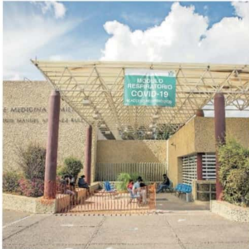
Dichas habilitaciones tienen como objetivo contener el alto índice de ocupación hospitalaria. CARMEN HERNÁNDEZ

El hospital que más demanda presenta es el ISSSTE de la capital michoacana, donde incluso se han tenido que habilitar espacios más allá de su propia capacidad,