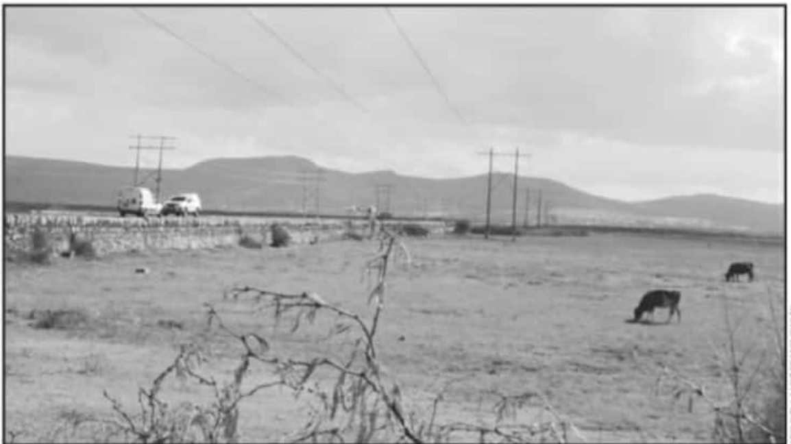
CON EL FIN DE REVERTIR EL GRAVE DAÑO QUE EXISTE EN EL LAGO DE CUITZEO, AUTORIDADES Y ACTIVISTAS BUSCAN FINCAR UNA ESTRATEGIA INTEGRAL.

La biodiversidad se vio impactada por el declive ambiental y los altos niveles de contaminación; de las 19 especies de peces que habitaban en 1975 en el Lago de Cuitzeo ahora quedan seis. Asimismo, el daño ambiental y económico ha