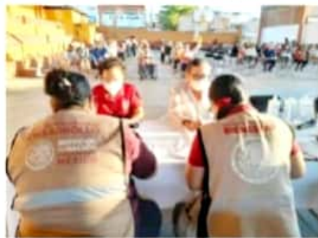
APATZINGÁN, MICH.- El funcionario de Salud, precisó que los ayuntamientos están realizando coordinación con la secretaria de Bienestar para organizar a los adultos mayores.