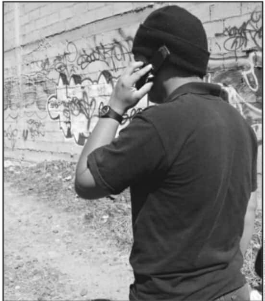
POR FALTA DE DENUNCIAS, EL COBRO DE PISO, AMENAZAS Y OTROS TIPOS DE EXTORSIÓN PASAN DESAPERCIBIDOS

Al respecto, el fiscal general de Michoacán, Adrián López Solís, ha detallado en diversas