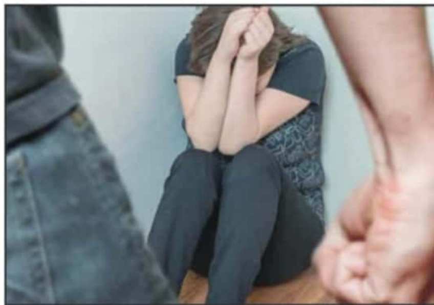
LA DESATENCIÓN Y OMISIÓN DE LOS CASOS DE PARTE DE LA AUTORIDAD MUNICIPAL HA COSTADO LA VIDA A MUJERES.

Los municipios que están pendientes son Aguililla, Ario de Rosales, Aporo, Angangueo,