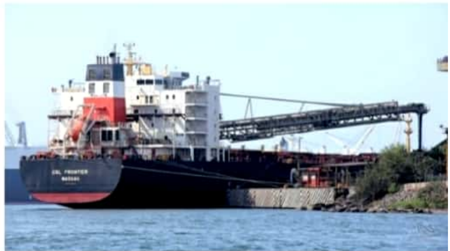
CD. LÁZARO CÁRDENAS, MICH.- Al cierre de enero de 2021 la carga de graneles minerales permitió que el puerto de Lázaro Cárdenas incrementara en un 9 por ciento sus volúmenes totales en comparación a enero de 2020.