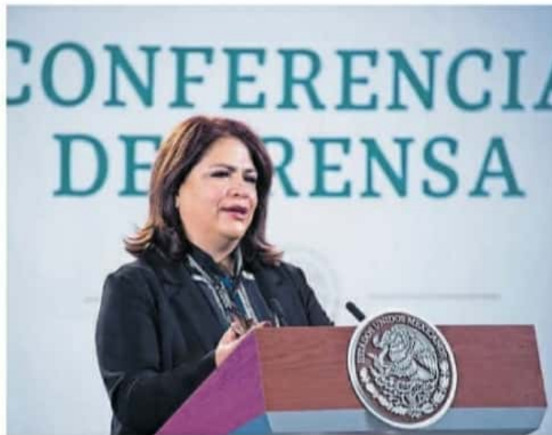
El diagnóstico de violencia patrimonial fue hecho con Conavim; en la foto, su titular, Fabiola Alanís Sámano

La presidenta aclaró que este mapeo no incluyó casos sobre feminicidio, pero se observó que tanto se cumple la ley de igualdad en hombre y mujeres en la gene-