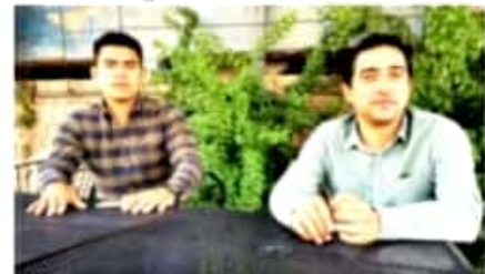
APATZINGÁN, MICH.- Se indicó que rumbo a la elección interna del partido, los perfiles siguen firmes y sólo esperarán los tiempos.

De esta manera la unidad sigue firme en el municipio y distrito, indicaron a título personal ambos liderazgos.