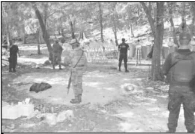
MICHOACÁN LA VOZ DE MICHOACÁN