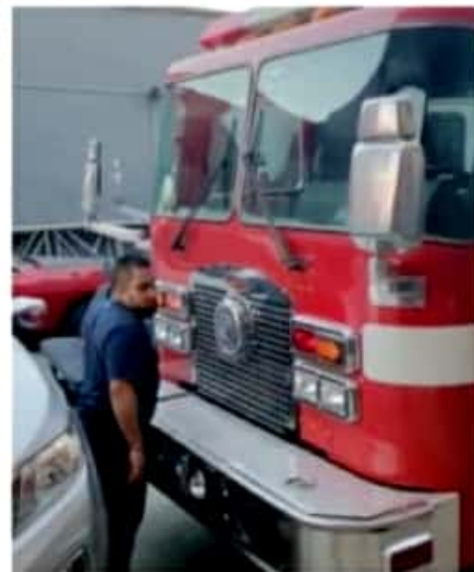
CD. LÁZARO CÁRDENAS, MICH.- Empresarios y diversos sectores de la sociedad, además de la incansable labor de la agrupación de Bomberos Voluntarios LZC, el municipio de Lázaro Cárdenas tendrá un segundo camión de bomberos.

Las personas interesadas en sumarse y aportar con un recurso económico para los gastos de traslado del camión, pueden hacerlo a través del número de cuenta (Santander) 56579402164; tarjeta bancaria: 5579 1002 5852 8635, club interbancaria: 014497565794921649