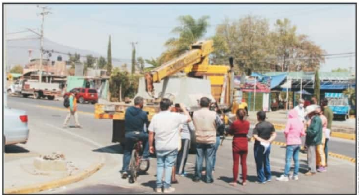
LA RESISTENCIA POR LA CONSTRUCCIÓN DEL PUENTE EN EL CRUCE DE LAS AVENIDAS PERROSSIMO Y SIERVO DE LA NACIÓN LLEVA VARIOS MESES.

"Le dijimos que nos vamos a sumar a su proyecto, pero que-