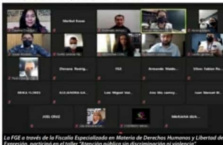
La FGE a través de la Fiscalía Especializada en Materia de Derechos Humanos y Libertad de Expresión, participó en el taller "Atención pública sin discriminación ni violencia".