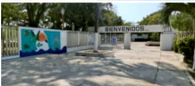
CD. LÁZARO CÁRDENAS, MICH.- Tras dar a conocer a los ganadores del concurso Una Nueva Forma de Vivir , los dibujos serán plasmando en los muros de la unidad deportiva municipal.