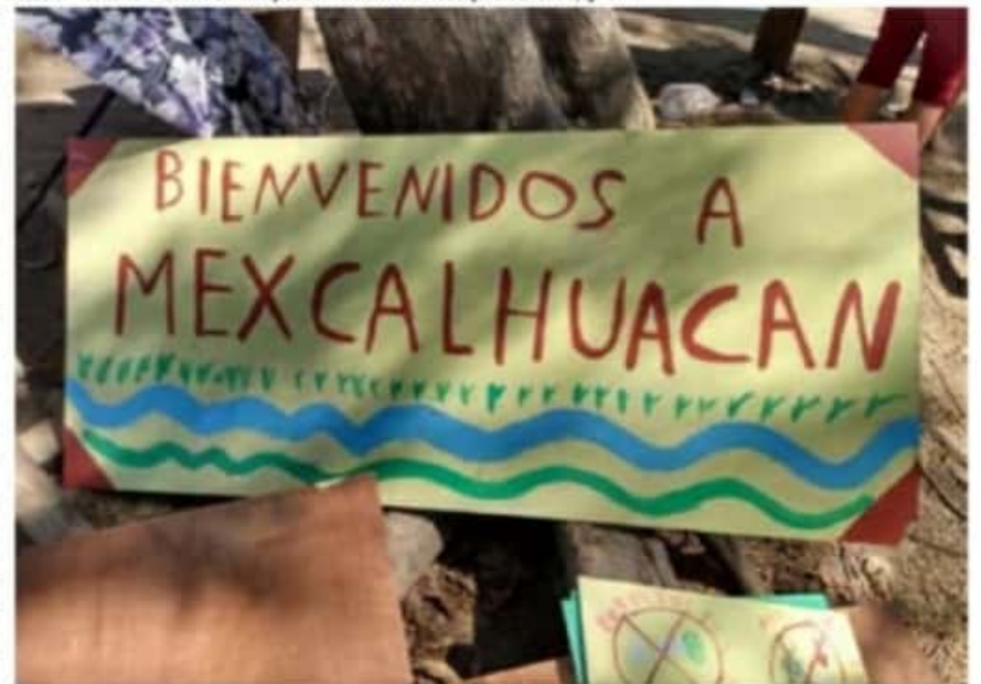
Una de las letreros realizados por niños y adultos, con el apoyo de la Fundación El Sol.