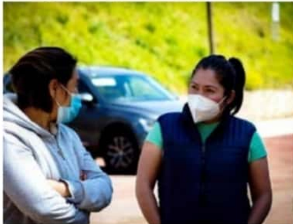
La diputada local recalzó que las mujeres tienen hasta un 25% menos de probabilidades de ocupar un cargo público en México.