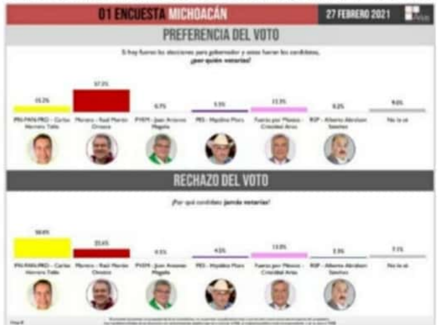
La encuesta de Arias Consultores.