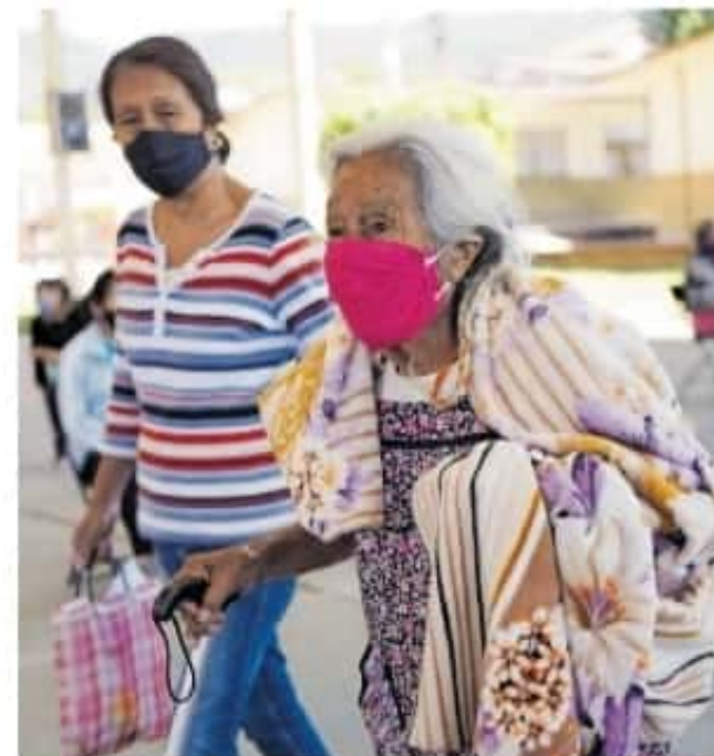
Las personas mayores de 60 años son más vulnerables a desarrollar complicaciones

Sobre los centros de vacunación, en Lázaro Cárdenas se habilitarán tres puntos: Instituto Tecnológico, Centro de Salud Las Guacamayas y Centro de Salud La Mira, mientras que en Ciudad Hidalgo serán dos: Unidad Deportiva y Secundaria Melchor Ocampo.