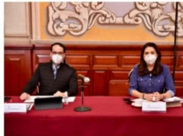
MORELIA, MICH.- Indicarón que es claro que la administración independiente pagó más deuda que el actual Gobierno, en virtud que los compromisos económicos eran mayores.

La conmemoración por el Día Internacional de la Mujer se prologará por todo el mes de marzo hasta el día 31, en su mayoría de manera virtual.