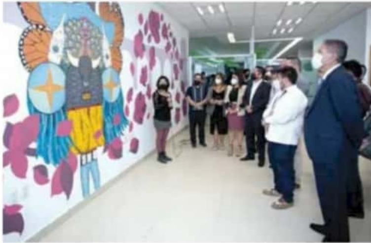
Objetivo. Se busca atender al sector joven del municipio a través de diferentes aristas.

En su intervención, el titular del Instituto Mexicano de la Juventud (Imjuve), Guillermo Rafael Santiago Rodríguez, aseguró que desde el gobierno federal se terminó la criminalización y estigmatización de la juventud mexicana, que cambió por el respeto a los derechos de este sector que fue vulnerado. Por ello, a través de esta estrate-