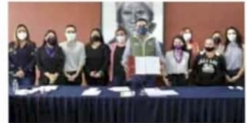
Luto. El 3 de noviembre se estableció como el día de luto estatal por las víctimas de feminicidio.

La medida, sugerida por colectivas y familiares de las víctimas, fue adoptada por el gobernador