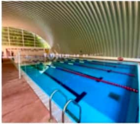
URUAPAN, MICH.- Así luce la alberca semiolímpica de la Unidad Deportiva "Hnos. López Rayón".