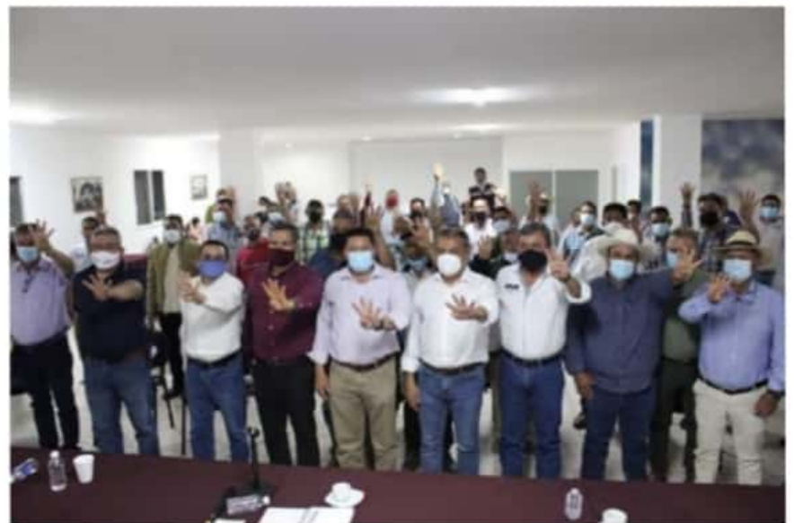
Usuarios de Riego, acuerdan con el diputado Feliciano Flores, desarrollar agenda de trabajo para el desarrollo del campo michoacano.

"Tenemos muchos años trabajando con este decreto, el Congreso nunca nos contestó, en otros espacios no se nos ha escuchado, agradezco que tengamos empatía con los familiares y que el Gobernador sí nos abra las puertas", finalizó.