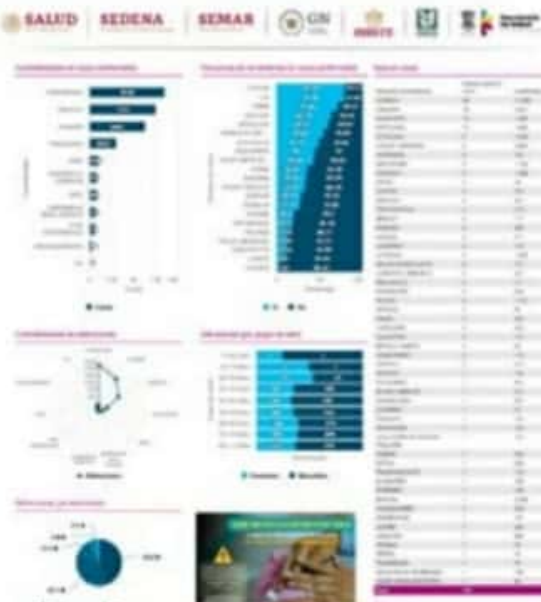
El día de ayer el CCES documentó 6 nuevos casos positivos para el municipio de LC, que llegó ya a un acumulado de 5,892.