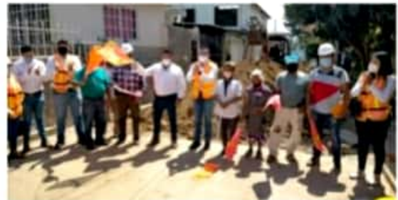
SAN ANDRÉS CORÚ, MPIO. DE ZIRACUARETIRO, MICH.- José Rodríguez Baca, presidente municipal, acompañado de miembros del Cabildo, así como de vecinos de la calle sin nombre, realiza el banderazo de inicio de pavimentación.

El presidente municipal indicó que estos son recursos del Fondo de Aportaciones para Infraestructura Social Municipal (FISM) y los vecinos no aportaron ninguna cantidad.