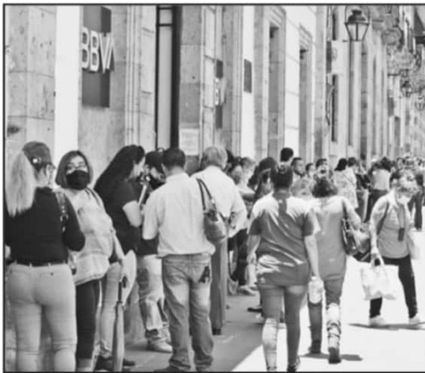
USUARIOS DIERON SU CALIFICACIÓN A LAS INSTITUCIONES BANCARIAS SEGÚN LA CALIDAD Y EFICIENCIA DEL SERVICIO.

Y es que, si bien normalmente las personas buscan abrir una cuenta, solicitar un préstamo o contratar algún servicio bancario en específico, cada año hay miles de quejas ante la Condusef por cargos no reconocidos, que suelen estar divididos entre aquellos que se realizan por medio de estafas o engaños por parte de terceros a los cuentahabientes, así como por cargos que la misma institución obliga y presiona para imponer, como la contratación de un seguro para