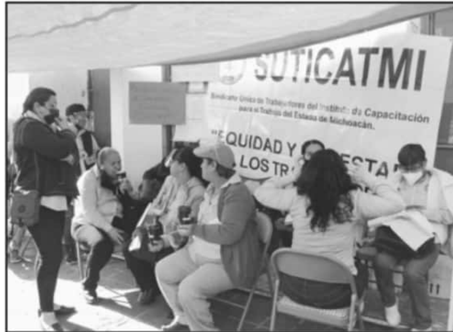
ESTE MIÉRCOLES PROTESTARON EN LA SEDE DEL ICATMI, ANTE VARIAS IRREGULARIDADES QUE PERSISTEN DE AÑOS.

hace 6 años interpusieron un recurso ante la JLCA, sin embargo, a pesar de las peticiones al organismo no ha habido ningún avance y que ahora, por la pandemia que se vive, parece que tiene intención de no atender la problemática.