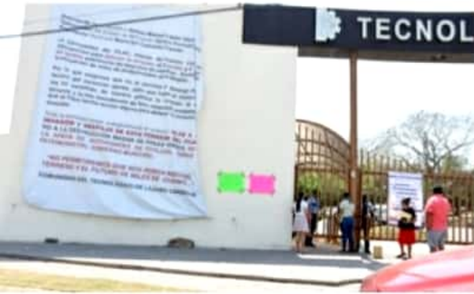
CD. LÁZARO CÁRDENAS, MICH.- Ante la falta de información concreta sobre la vacunación contra el Covid-19, los adultos mayores siguen acudiendo al Tecnológico de este municipio.

Eduardo CHÁVEZ CD. LÁZARO CÁRDENAS, MICH.- Ante la falta de información concreta sobre la vacunación contra el Covid-19 anunciada por la Jurisdicción Sanitaria y la Secretaría del Bienestar, adultos mayores siguen acudiendo a las instalaciones del Instituto Tecnológico de Lázaro Cárdenas, en busca de recibir esta y poder estar protegidos contra esta enfermedad, que ha causado un gran número de muertes.