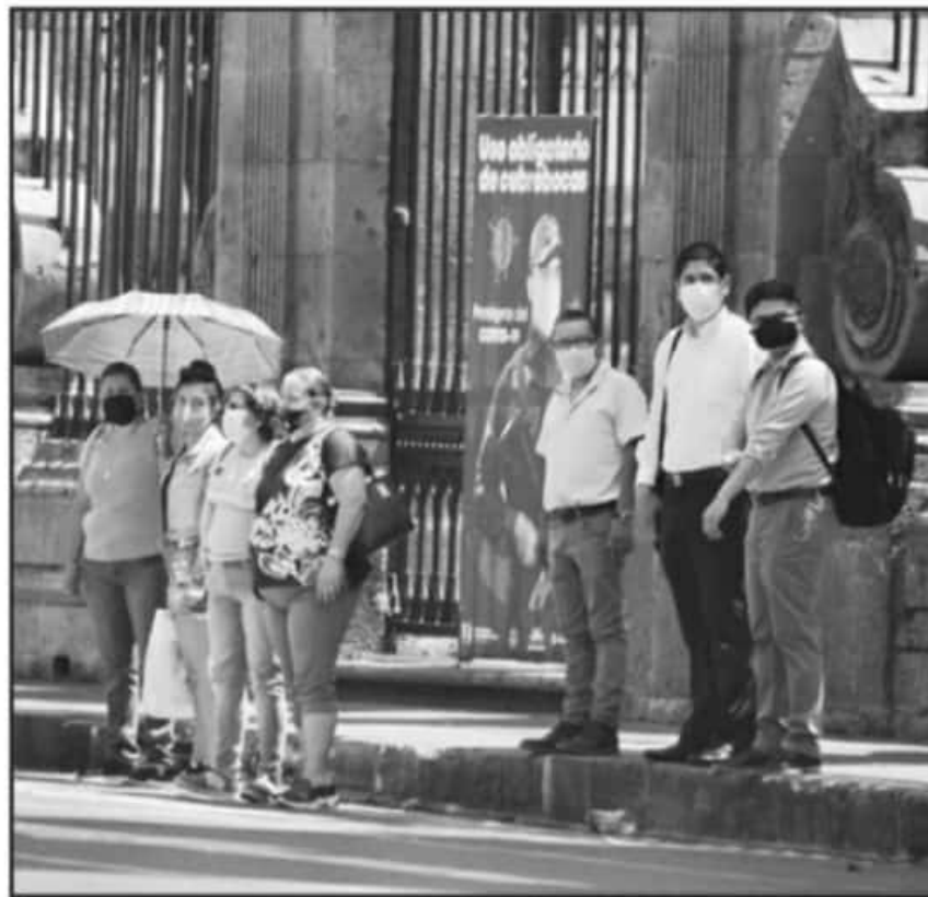
LA SSM PIDE A LA CIUDADANÍA NO CONFARSE Y LA EXHORTA A MANTENER LOS PROTOCOLOS ESTABLECIDOS.

También en el transcurso del último día murieron 13 personas