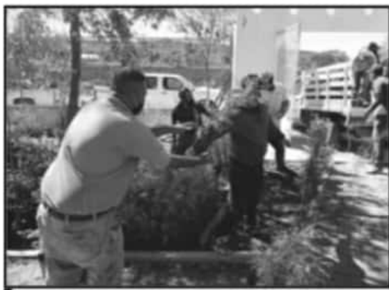
LOS ÁRBOLES FUERON DONADOS AL MUNICIPIO POR EL CLUB ROTARIO.