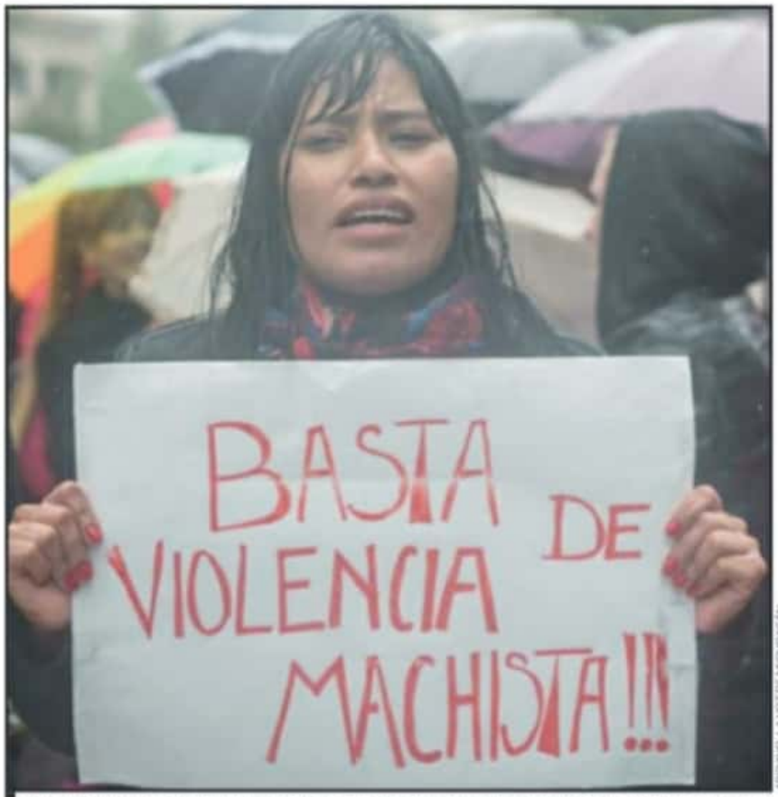
COLECTIVOS FEMINISTAS SEÑALAN QUE ES TIEMPO DE TRABAJAR ACTIVAMENTE PARA REDUCIR LA VIOLENCIA A LA MUJER.