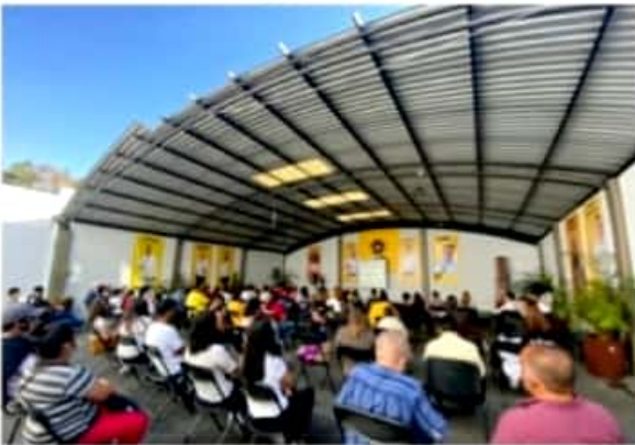
URUAPAN, MICH.- En este municipio, quienes conforman los comités de la juventud del PAN, PRI y PRD, se reunieron para comenzar a organizarse y fortalecer en sus sectores a los candidatos de "Equipo por Michoacán".

Se pretende, pues, hacer un equipo fuerte y consolidado de las juventudes de los tres partidos políticos, con la finalidad de consolidar la coalición, con miras a la próxima contienda electoral.