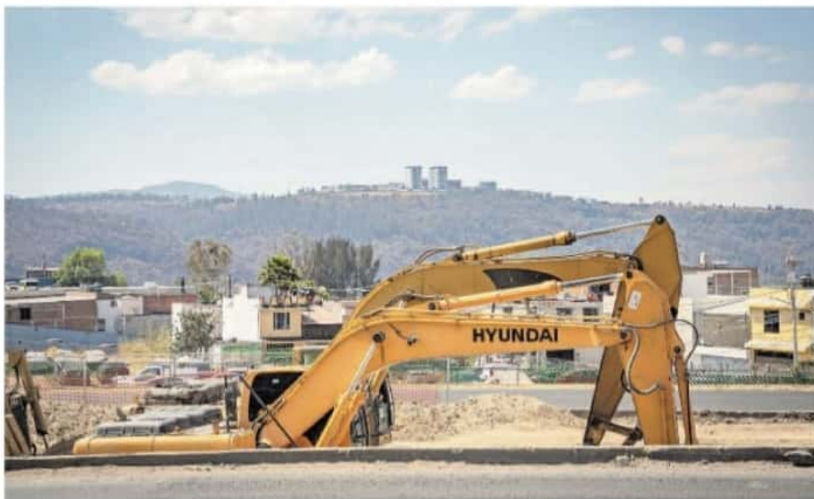
De la construcción dependen 66 de los 72 sectores económicos de Michoacán / CARMEN HERNÁNDEZ