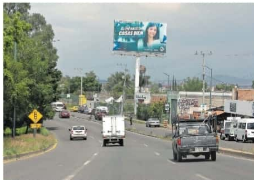
El IEM hará un monitoreo en temas como registro de encuestas, equidad y no discriminación

Con el propósito de dar a conocer el tratamiento que se dará a las campañas electorales a la gubernatura en los programas de noticias en radio y televisión,