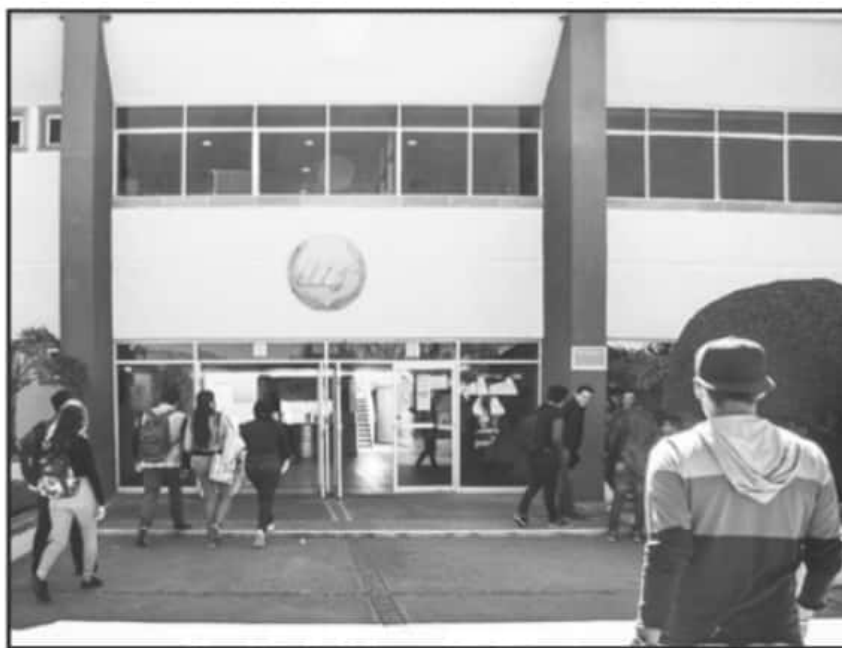
TRAS LA FIRMA DE LA CALENDARIZACIÓN DE PAGOS, TAMBIÉN SE RESALTÓ LA ATENCIÓN A TEMAS ADMINISTRATIVOS.