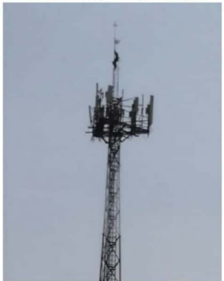
Un drogadicto o ebrio sujeto, mantuvo por espacio de dos horas una movilización policiaca y de cuerpos de auxilio y rescate, al subir a lo alto de una antena telefónica, ayer en Morelia.

Fueron vecinos de la calle José Ignacio Arciga, del fraccionamiento Villas de la Loma, que observaron a un hombre sentado en la cima de la antena y alertaron a la policía.