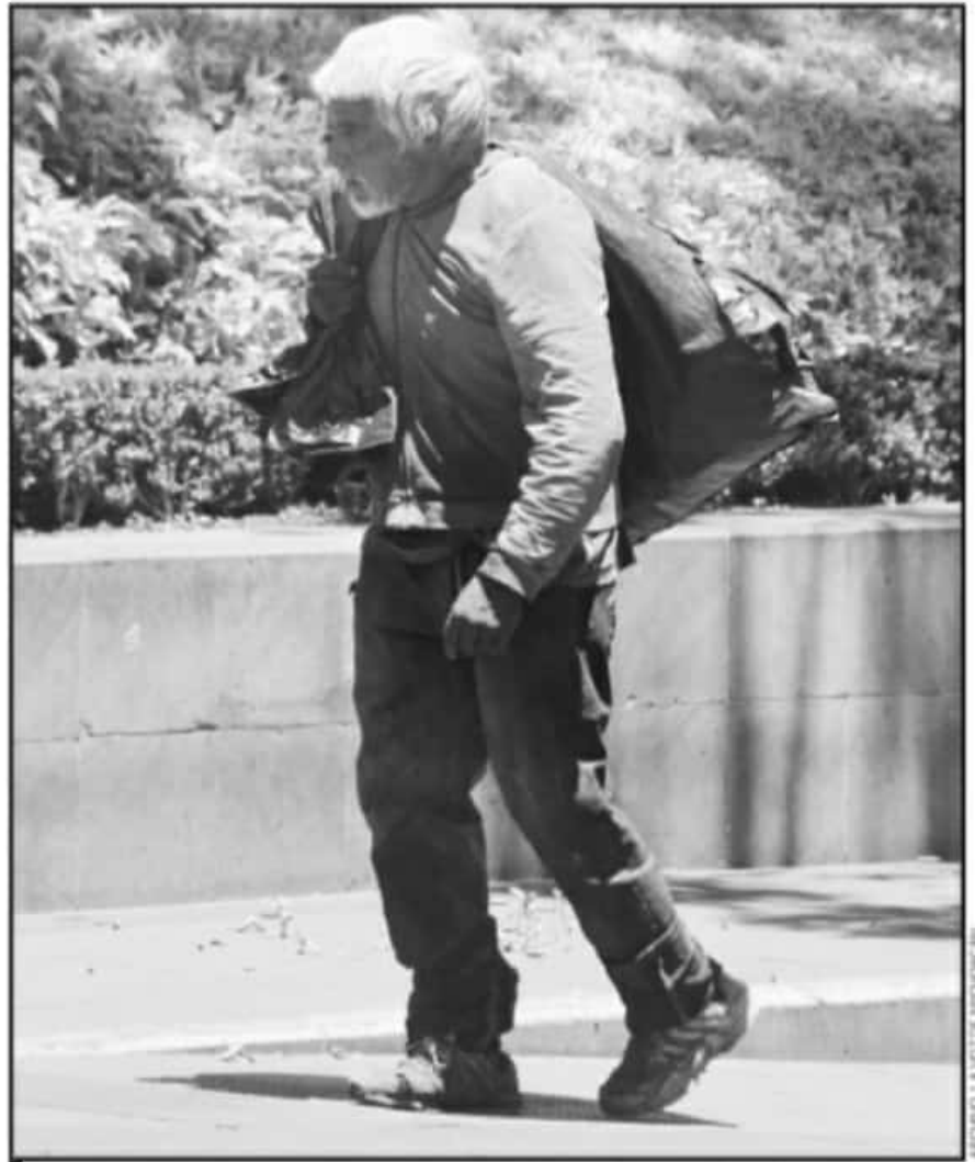
A FINALES DEL 2019 SE IDENTIFICARON 49 PERSONAS EN SITUACIÓN DE CALLE, LA MAYORÍA LLEGÓ DE OTRAS ENTIDADES.

Así como también hizo referencia al caso de una mujer de edad avanzada que recibió atención médica y albergue. "Hace unos dos meses, en los primeros días de enero, ingresamos a una persona de edad avanzada, la llevaron al hospital civil, tenía una situación de salud, fue dada de alta y la ingresamos al asilo. Pero