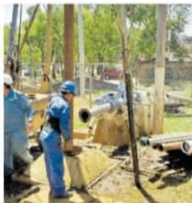
Se hará mantenimiento preventivo en pozo de la Casa Hogar

En total serán 23 las colonias a las que se les interrumpirá el servicio. Centenario, Clara