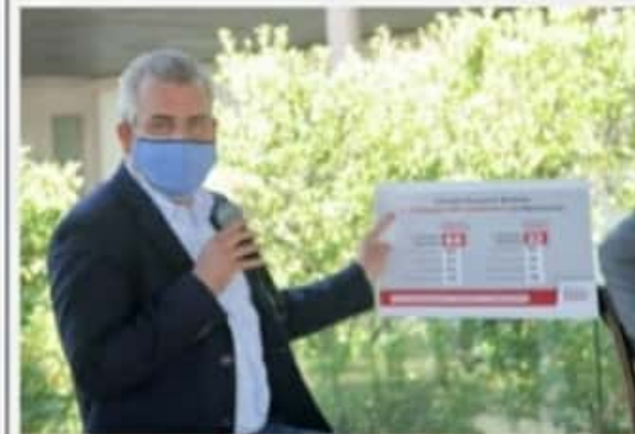
MORELIA, MICH.- Alfredo Ramírez refirió que es el legislador con mayor número de asuntos presentados (71) y al que más iniciativas le aprobaron (29).

Alfredo Ramírez señaló que deja la LXXIV Legislatura con la satisfacción de no haber traicionado a las michoacanas y michoacanos, porque en el Poder Legislativo defendió los intereses de la gente, y logró la aprobación de iniciativas en favor de mujeres, pueblos indígenas, personas con discapacidad y población en general.