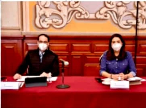
MORELIA, MICH.- Indicaron que es claro que la administración independiente pagó más deuda que el actual Gobierno, en virtud de que los compromisos económicos eran mayores.

La conmemoración por el Día Internacional de la Mujer se prolongará por todo el mes de marzo hasta el día 31, en su mayoría de manera virtual.