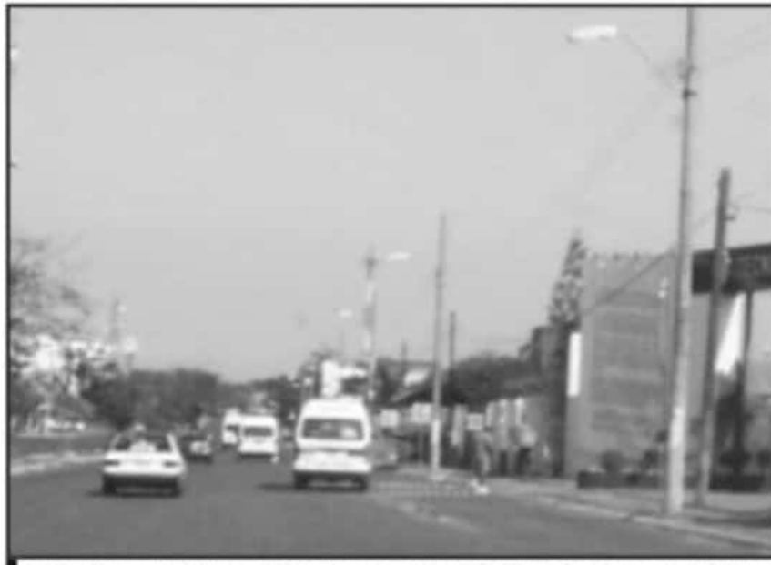
UNA OPCIÓN, QUE LAS UNIDADES QUE CIRCULEN CERCA DE LOS CENTROS DE VACUNACIÓN, SE ACERQUEN LO MÁS POSIBLE.

Palomares Ávila consignó que fue inmediata la respuesta del sector transporte de pasajeros puntualizando que se está delineando la forma de poder brindar el servicio, incluso, sin