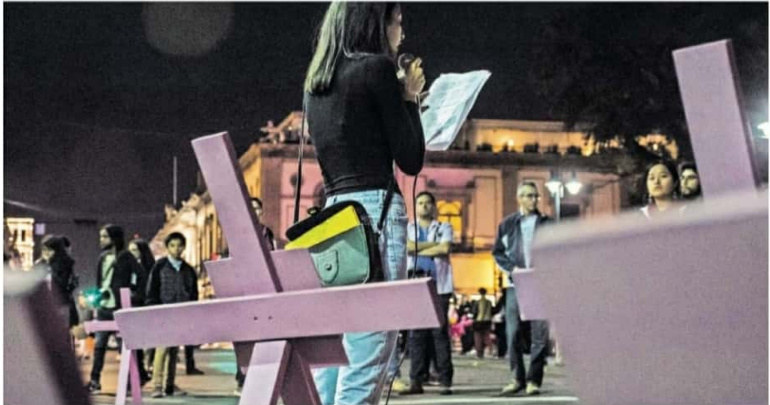
3 de noviembre, Día de Luto Estatal y Conmemoración por Todas las Mujeres Víctimas de Femicidio