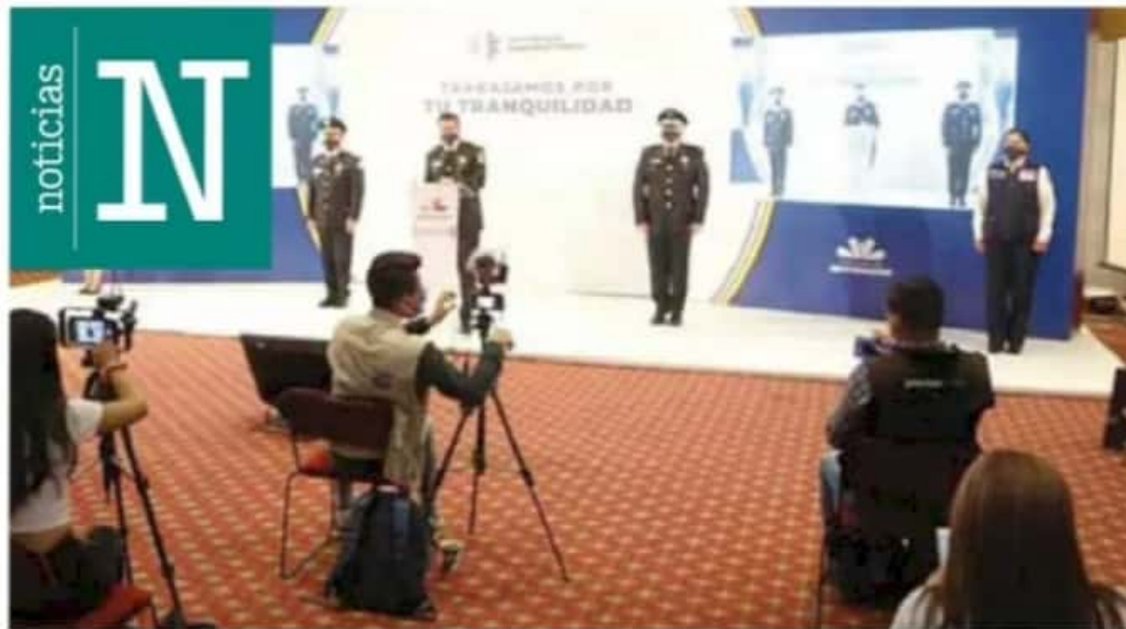
SSP. En charla con medios, el secretario de Seguridad también dio a conocer la reducción de delitos de alto impacto.