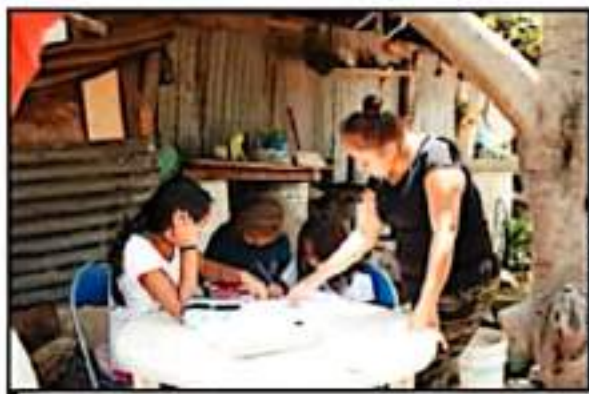
EL ESQUEMA DE EDUCACIÓN A DISTANCIA FRACASÓ CASI POR COMPLETO