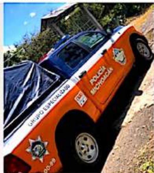
URUAPAN, MICH.- La Unidad Naranja de la Secretaría de Seguridad Pública Tránsito y Vialidad Municipal, atendió en septiembre a un total de 97 mujeres, niñas, niños y adultos mayores víctimas de maltrato familiar o violencia de género.

Asimismo, se brindó apoyo a 14 menores infractores; se efectuaron medidas de protección o restricción, así como igual número de canalizaciones de mujeres ante instancias municipales o la Fiscalía General del Estado, para atención psicológica, asesoría jurídica, o bien acompañamiento para interponer denuncia por violencia.