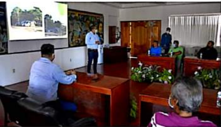
CD. LÁZARO CÁRDENAS, MICH.- El gobierno municipal capacitó a integrantes de la Unión Mutualista de Recolectores de Basura y Reciclaje en el tema de separación y manejo de residuos.