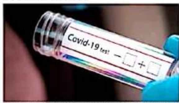
Tercera oleada de COVID-19 incrementa en forma alarmante los casos acumulados en la mayoría de los municipios michoacanos.

Uruapan incrementó 73 por ciento, ya que aumentó de 5 mil 906 a 10 mil 216, y tampoco superó sus casos en el último cuatrimestre. Pátzcuaro estuvo más cerca, al pasar de 2 mil 586 a 4 mil 981, el 92.6 por ciento. Los tres con bandera amarilla de riesgo alto.