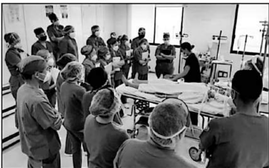
SE EXHIBO QUE LA UMSNH SIEMPRE SE HA DIRIGIDO EN ATENCIÓN A LA EVOLUCIÓN DE LA PANDEMIA DEL CORONAVIRUS Y A LA NECESIDAD EDUCATIVA

"En tal virtud, continuará con la implementación de acciones en materia de seguridad sanitaria e higiene para un regreso responsable y ordenado a las actividades presenciales, con apoyo a la normativa universitaria y con el concurso de los cuer-