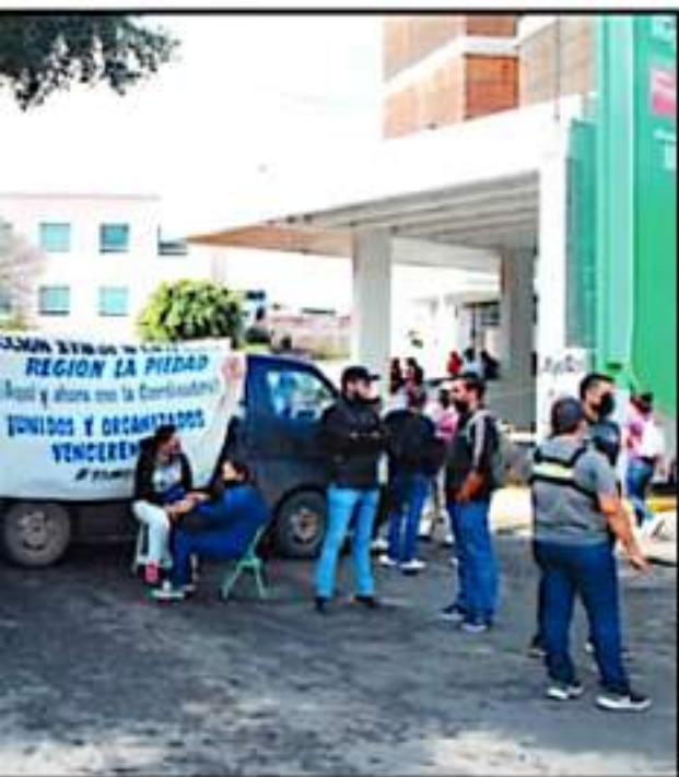
PRIMERO TRIBUNAL DE JUSTICIA, DONDE PIDIERON SOLUCIÓN A SUS DEMANDAS

ista apuntó que se incumplió la Agenda por Michoacán, donde el gobernador empujó su palabra y su firma ante 126 organizaciones de la sociedad civil, en donde en una evaluación independiente apenas se alcanzó el 11 por ciento de su totalidad, y no se rindieron cuentas por parte de las autoridades al pleno de las organizaciones.