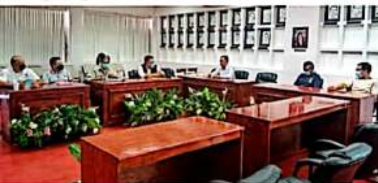
CD. LÁZARO CÁRDENAS, MICH.- El gobierno municipal refuerza las acciones de prevención contra el dengue.

■ En mercados y panteones se acordó limpieza y descacharrización