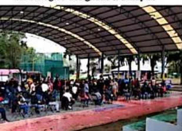
URUAPAN, MICH.- Ayer, en el segundo día de la Jornada se aplicaron 16 mil 492 dosis de vacuna anti Covid-19, en el macro centro, ubicado en la unidad deportiva.

— En dos días se ha aplicado el 58% del biológico designado a Uruapan