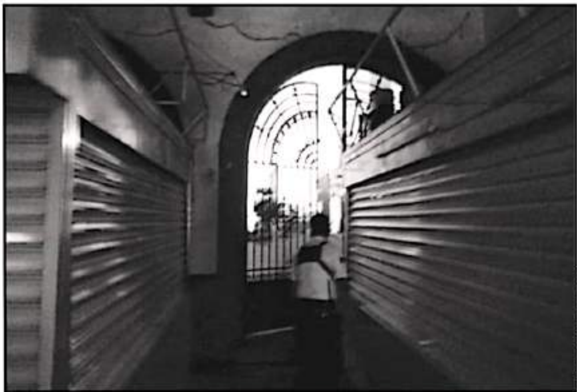
TRAS EL INCENDIO EL ALCALDE ELÍAS BARRAJAS DECLARÓ QUE SE REALIZARÁ UNA INVESTIGACIÓN A FONDO PARA DETERMINAR LAS CAUSAS DE ESTE INCENDIO

La columna de humo que se elevaba contra el cielo plomizo era impresionante, el calor irradiaba hasta el exterior del Mercado Zaragoza, en cuya explanada se agolpaban los curiosos, los que no daban crédito a lo que estaban presenciando, y los elementos de Seguridad