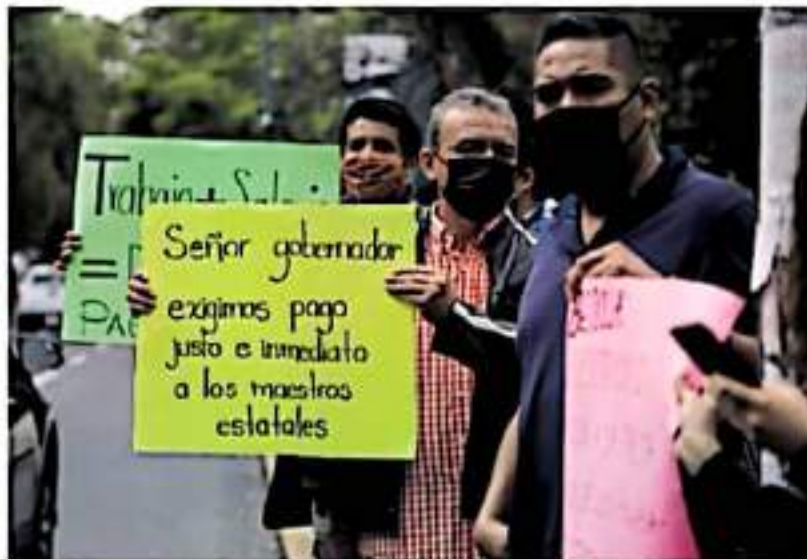
Se requieren cerca de dos mil millones para pagar al sector educativo.

de sus espacios de trabajo, como lo es el Palacio de Justicia, ubicado en la calzada La Huerta, en distintos centros educativos y en las inmediaciones de la Secretaría de Finanzas, ubicada en la avenida Ventura Fuente.