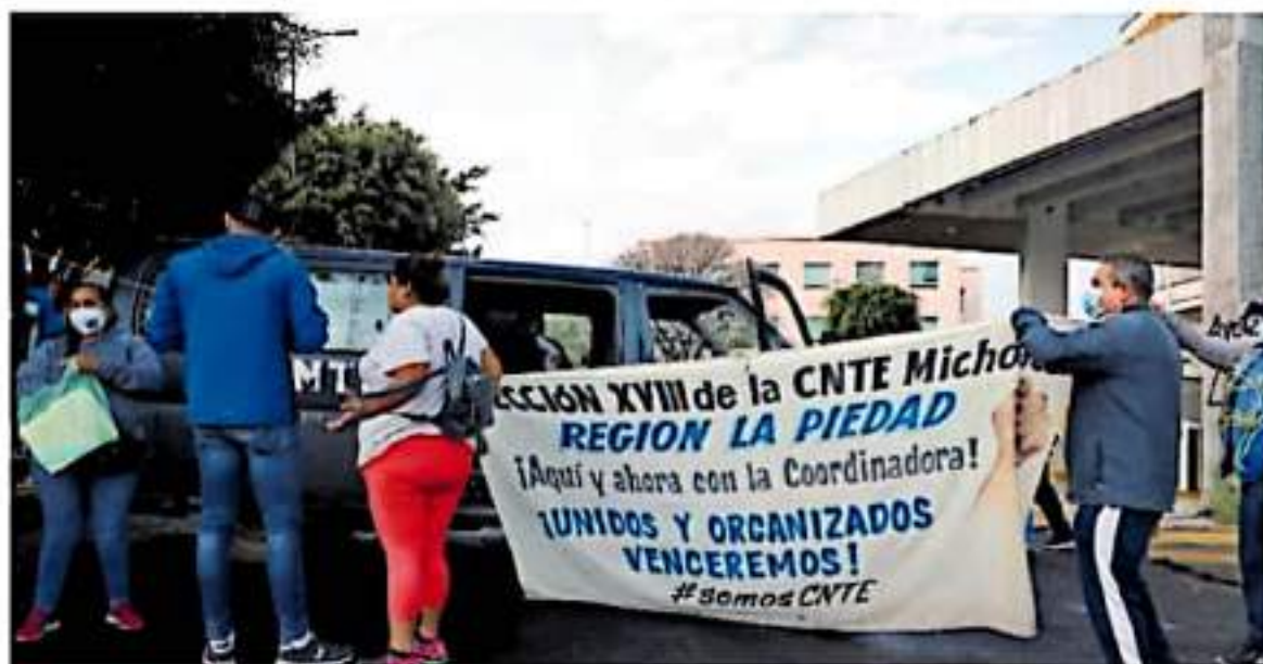
CNTE amagó con liberar las casetas y realizar boteo este jueves en diversas zonas de la geografía michoacana. / FERNANDO MALDONADO