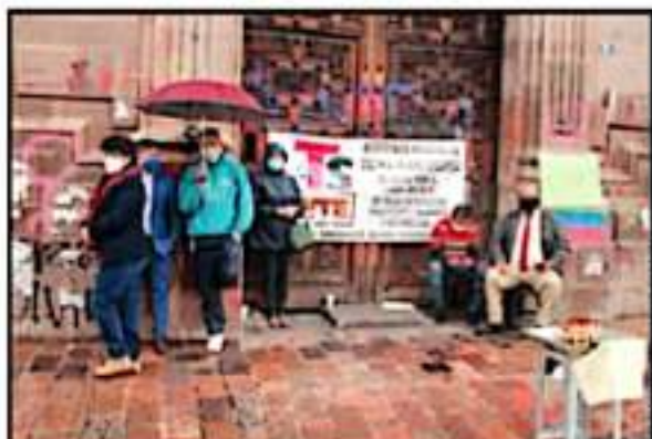
ANTE INFANCIAS EL GOBIERNO ESTATAL CERRÓ SIN CLASES EN MAYORÍA DE ALLAS