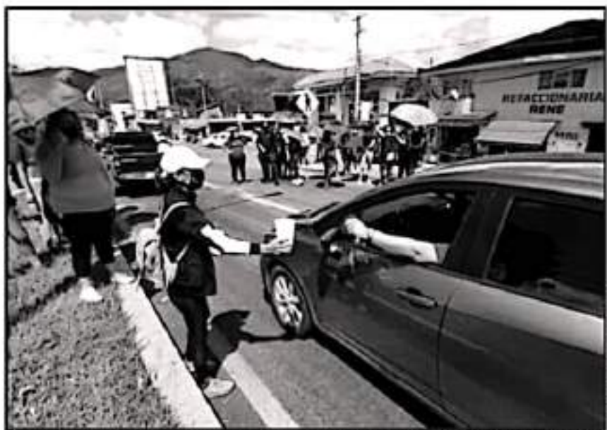
SE REVELÓ QUE PODER DE BASE ESTE MIÉRCOLES SECUESTRO UNIDADES Y REALIZÓ 'BOTÍO' PARA HACERSE DE RECURSOS

"Aparentemente luchamos por lo mismo, sin embargo, lo que buscan los pocos seguidores de Poder de Base con su brazo violento del Frente Nacional de Lucha por el Socialismo, es satisfacer intereses personales de los líderes, lamentablemente a través de una espiral de mentiras man-