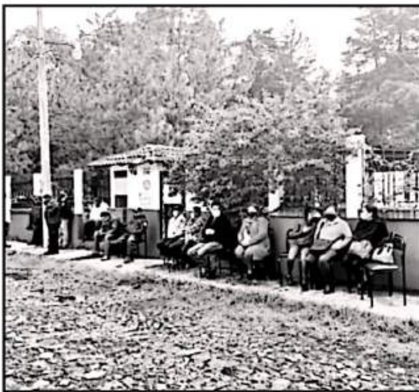
EN VOZ DE SU LIDER SINDICAL, SE LEO QUE LOS INCONFORMES SON GENTE DE TRABAJO QUE NO TENGAN PROBLEMAS

nos vamos a quedar hasta que tengamos la mesa de diálogo presencial, y que escuchen la versión de los compañeros, porque todos coinciden con los malos tratos y la discriminación que han sufrido por la doctora, deben de ser escuchados",