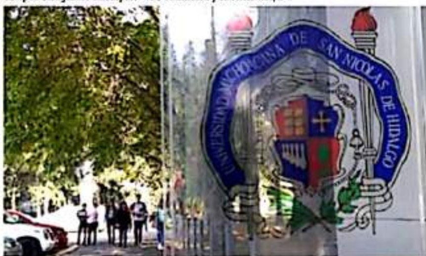
La UMSNH se alista para el regreso a clases presenciales.

generar las condiciones para el regreso presencial a las aulas, una vez que el Consejo en Seguridad de Salud así lo apruebe.