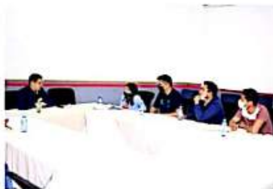
La Coordinadora de Universitarios en Lucha (CUL) participará en el Festival de Velas

Es importante recordar que en el pasado las casas de estudiantes tenían un antecedente histórico de fomentar la violencia, el desapego de valores y una constante participación en temas del índole político y social, sin embargo, una clara muestra de su disposición por participar fue en la reciente conmemoración del 53 aniversario de la matanza estudiantil de la Plaza de las Tres Culturas, en donde cada año eran vandalizadas instituciones bancarias y edificios públicos, situación que este año no ocurrió, en base a la disposición del gobierno de Nacho Campos por crear un esquema de diálogo y concertación.