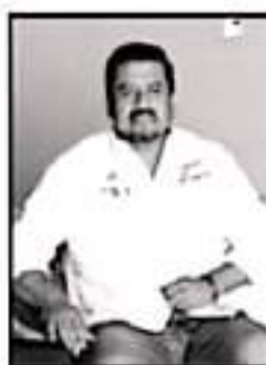
El diputado tomó la representación ante la Cámara Baja

así como delegado federal de las secretarías de Educación Pública y de Gobernación. El conditino a la estructura del gobierno de Enrique Peña Nieto en Michoacán Es doctor en derecho, ha sido di-