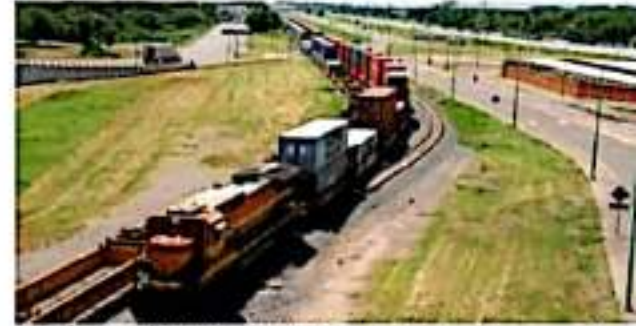
CD. LÁZARO CÁRDENAS, MICH.- El dirigente de la Aiemac alertó que empresas, como Kansas City Southern México, han emprendido acciones legales por la toma de vías, ya que se registran pérdidas de 3 mil millones de pesos.

sumado otras firmas importantes. "Ya hemos visto algunas declaraciones donde algunas empresas deciden no continuar con inversiones en el estado. No quiere decir esto que se retiren las que están, pero que han decidido no crecer las inversiones, no seguir apostando por eso y eso nos duele mucho porque el volver a tener la confianza de quien la hemos perdido cuesta mucho más tiempo de lo que llevamos con las vías tomadas, y eso nos va a costar muchísimo", lamentó. Por lo anterior, además de lograr la liberación de las vías, la Asociación de Industriales exige más medidas que impidan su toma por cualquier situación, tomando en cuenta que Michoacán se apuntala a crecer tras la firma del T-MEC. "La reciente firma del T-MEC tiene condiciones que apuntan a hacerlos más atractivos y competitivos, pero tenemos que limpiar estos problemas que venimos arrastrando en el estado. Entonces, esperemos que verdaderamente lo solucionemos en los próximos días y hemos comentado ya también que no nada más solucionemos esta toma que tenemos hoy", expresó.