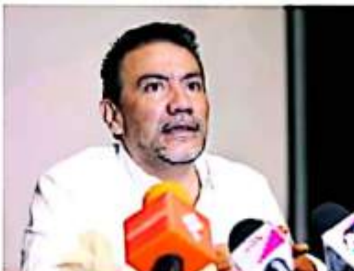
MORELIA, MICH.- Roberto Morrey, secretario de Turismo en el estado.

Agregó que debido a la pandemia de Covid-19 es obligatorio primero evaluar la situación y semáforo de contagios en el estado para determinar los aforos en las festividades pero también hablar con las comunidades para determinar en conjunto las acciones.