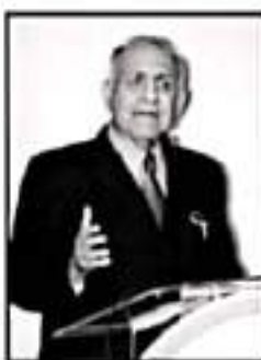
El doctor asumió la Secretaría Adjunta de la Presidencia

Con cambios, el CEN del PRI busca mejorar su presencia en el país