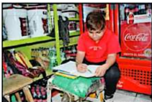
LA SEGUNDA FASE DEL SEXENIO SIGUIÓ HUNDIENDO AL ESTADO EN ENSEÑANZA

El legado negro de "la administración que termina incluye el que antes había una sola CNTE cuando ingresó, y gracias a su esfuerzo brindando gestoría unilateral, nos dejan dos colores de la CNTE, con más radicalismos".