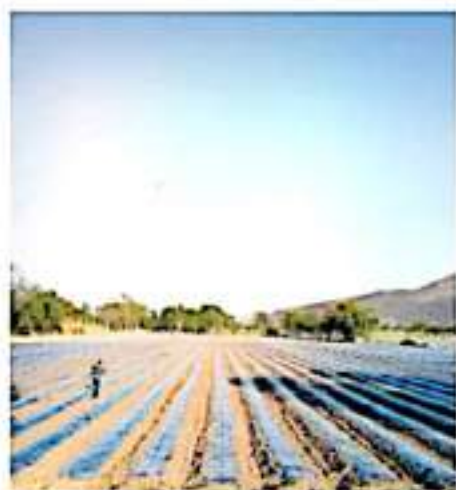
En promedio por hectárea al año se utilizan 4 mil kilos de plásticos. JARDÍN JIMÉNEZ

De acuerdo a integrantes del Consejo Supremo Indígena aún persiste el rezago de vacunación. CAROLINE FERNÁNDEZ