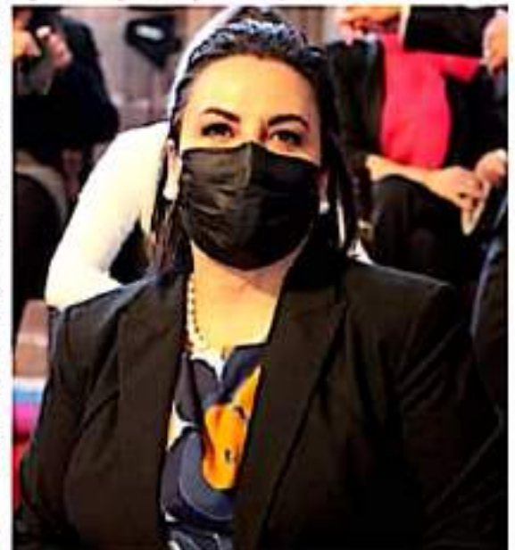
Se puso especial énfasis en la transparencia de la entrega de recursos a través de programas sociales, como la entrega de becas.