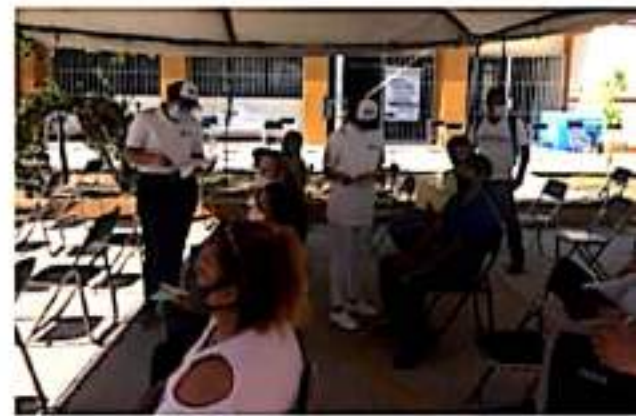
CD. LÁZARO CÁRDENAS, MICH.- Tras cerrar las jornadas de vacunación contra Covid-19 en esta ciudad, se dieron a conocer las cifras totales de inmunizados.