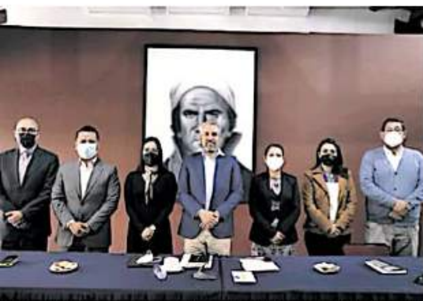
MORELIA, MICH.- En reunión con los consejeros del Instituto Electoral de Michoacán (IEM), el mandatario propuso programar un encuentro con diversas secretarías.