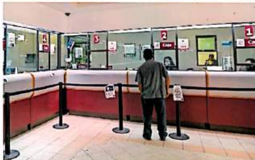
La administración municipal es una de las tres capitales del país con calificación reprobatoria

La falta de capacitación en los funcionarios es otro de los orígenes de este problema,