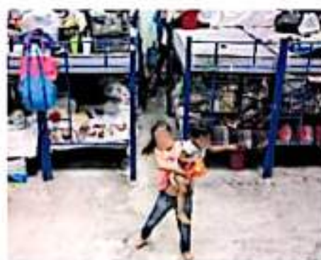
En Coahuila, entre mil 200 y tres mil personas de 15 comunidades huyeron. (Cortina/Quem)

En el caso de Tlapacotalpec, se reportó el desplazamiento de habitantes de al menos 10 comunidades debido a extorsiones y ataques en contra de la población.