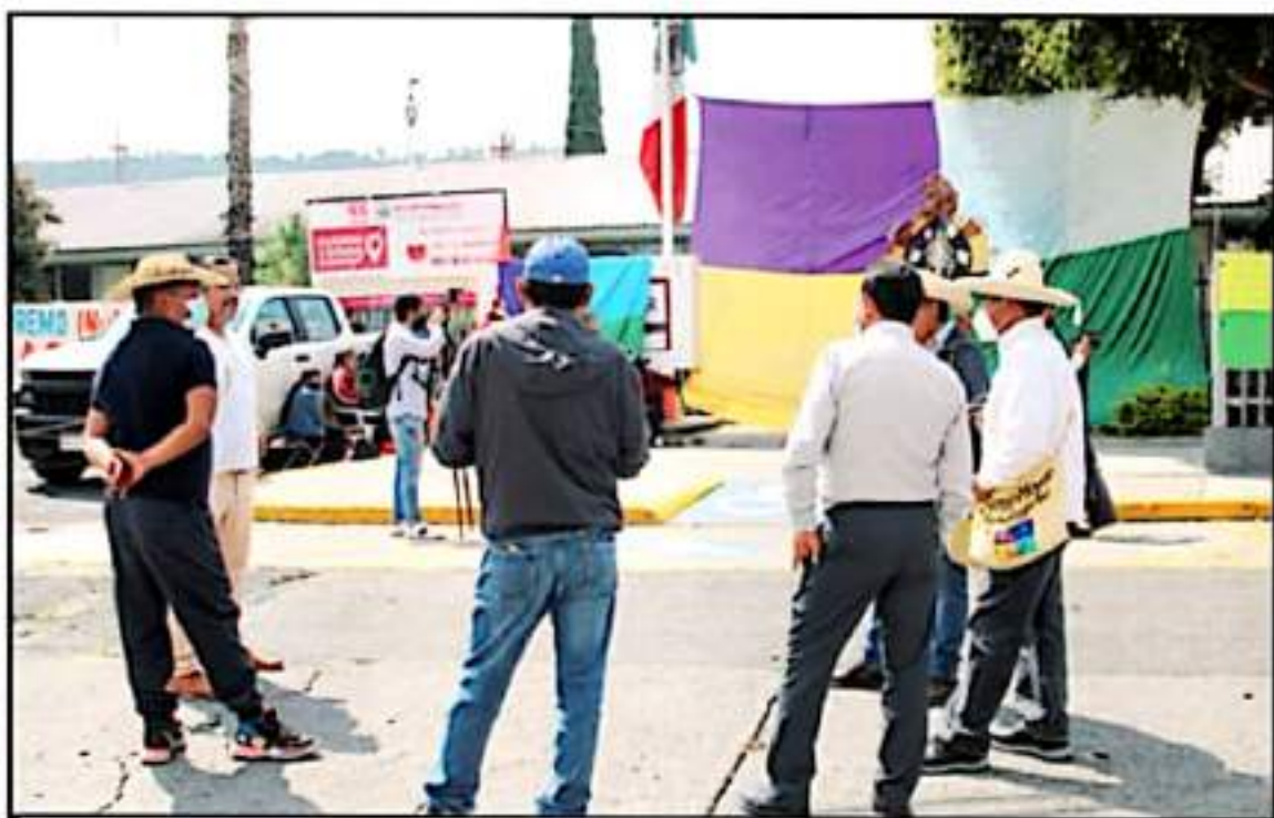
DIVERSAS COMUNIDADES EN EL ESTADO DE MICHOACÁN HAN POSTULADO LAS RONDAS COMUNITARIAS PARA DAR SEGURIDAD A LA POBLACIÓN EN GENERAL.

Tratados internacionales respaldan este sistema de seguridad y vamos a exigir que se respete. Las comunidades autónomas tienen su propia vigilancia en más de 20 comunidades, cada una tiene su ronda", argumentó el también activista ante medios lo-