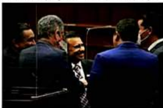
La propuesta inicial fue enriquecida con el diálogo y la diversidad de opiniones que se recogieron de todos los partidos, señaló el legislador.

Hacemos un llamado, nuevamente, al Gobernador Alfredo Ramírez Bedolla, a cumplir con su palabra, ya que a la fecha no ha atendido ninguna de nuestras propuestas, incumpliendo los principios de su mismo partido, donde no traicionar es una condición. https://psicologaydesarrollocomunitario.com/