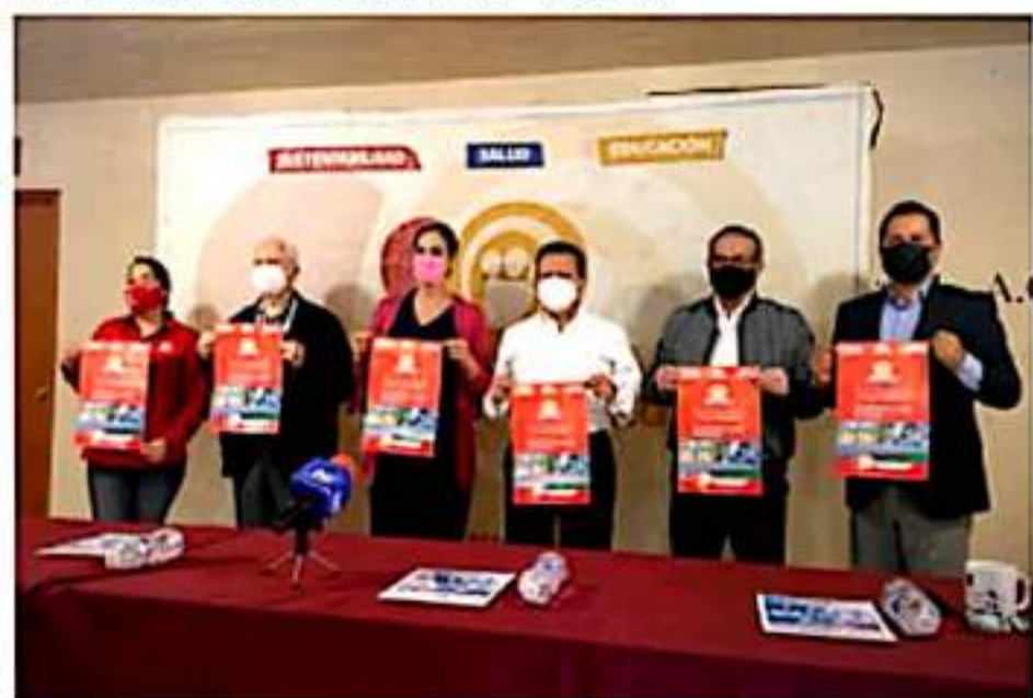
ZAMORA, MICH. - Con la recaudación en anteriores redondeos se ha logrado la edificación de la plancha de concreto, así como la colocación de la estructura metálica que consistió en los tableros para basquetbol, además de voleibol.

Por último, manifestó que quienes están interesados en el apoyo, solo deben de presentar copia de su identificación oficial, CURP, acta de nacimiento y comprobante de domicilio, una vez que decidan que material ocupan deben hacer el depósito correspondiente y al siguiente día se les hace la entrega del equipo o material.