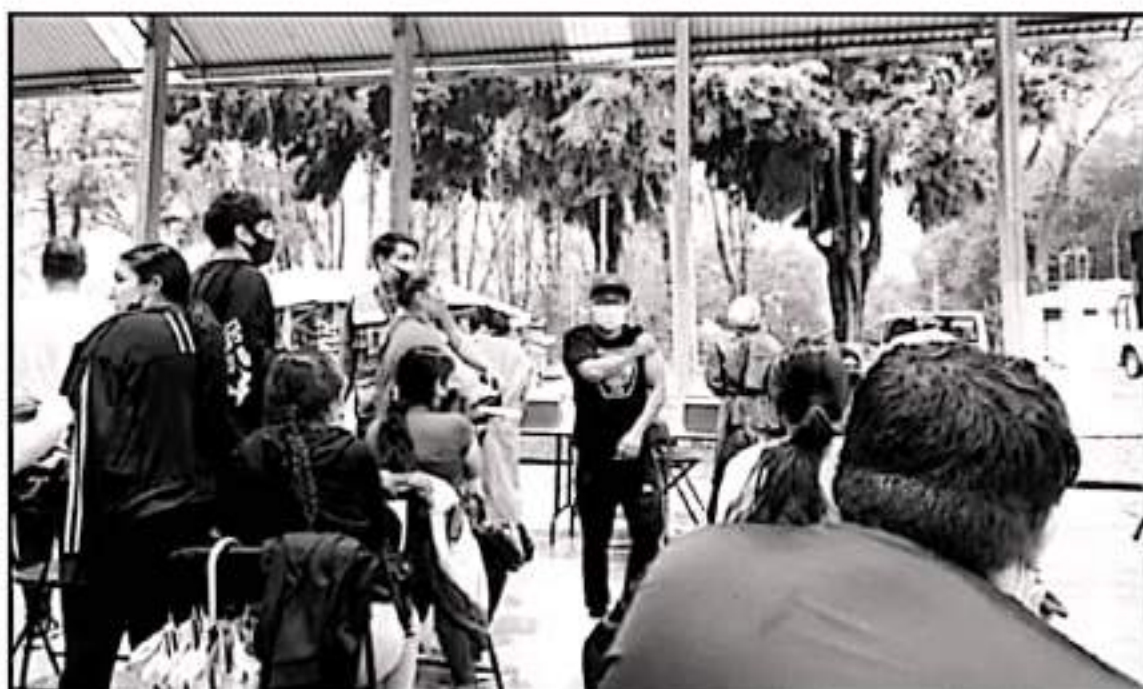
LAS CAMPAÑAS DE VACUNACIÓN EN URUAPAN Y MORELIA HAN ESTADO PLAGADAS EN PROBLEMAS LOGÍSTICOS E INCLUSO INSUFICIENTES BIOLÓGICOS.

CUADRAS llegan a prolongarse filas para la vacunación