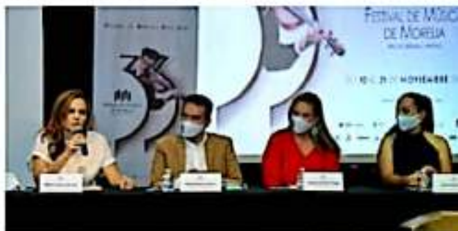
MORELIA, MICH.- Ayer se dio a conocer el programa que presentará la 33ª edición del Festival de Música de Morelia "Miguel Bernal Jiménez".

En el marco de la presentación del programa, se dieron cita integrantes del patronato del FMM y autoridades de Cultura y Turismo, tanto estatales como