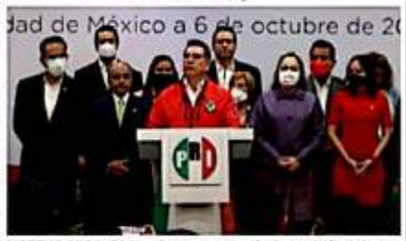
MORELIA, MICH.- Dicha reforma ya se turnó a la comisión de la que forma parte y la de Energía deberán analizar esta reforma.

respalda la postura del partido albi azul. "Me sumo a la exigencia del PAN, deben definir la ruta de cómo vamos a transitar y hablamos quedado una alianza legislativa que iba resguardar las reformas constitucionales y en este caso se encuentra la reforma eléctrica y quiere se apruebe, sin discusión, debates y foros abiertos". Informó que la fracción parlamentaria del PRD acompaña la postura de Acción Nacional y le pedimos al PRI defina su acompañara al presidente, y recordó que ya hubo un primer desencuentro en la votación de Armada de México, donde el PRI acompañó en su totalidad esta reforma sin discusión y con todos los votos a favor se sumó a esa propuesta. "Sería muy grave que decidiera acompañar al presidente solo por las amenazas del presidente de la República", y agregó que hay legisladores del PRI que no están de acuerdo en acompañar la reforma eléctrica, concluyó.