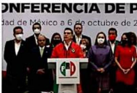
MORELIA, MICH.- Dicha reforma ya se turnó a la comisión de la que forma parte y la de Energía deberán analizar esta reforma.

"Sería muy grave que decidiera acompañar al presidente solo por las amenazas de presidente de la República", y agregó que hay legisladores del PRI que no están de acuerdo en acompañar la reforma eléctrica concluyó.