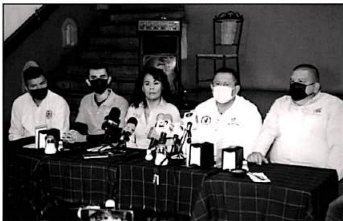
ESTE MIÉRCOLES DIERON RUEDA DE PRENSA DIRIGENTES DE LA ATEM, EN DONDE OFRECIERON INCLUSO SU RESPALDO A LA ADMINISTRACIÓN ENTRANTE.