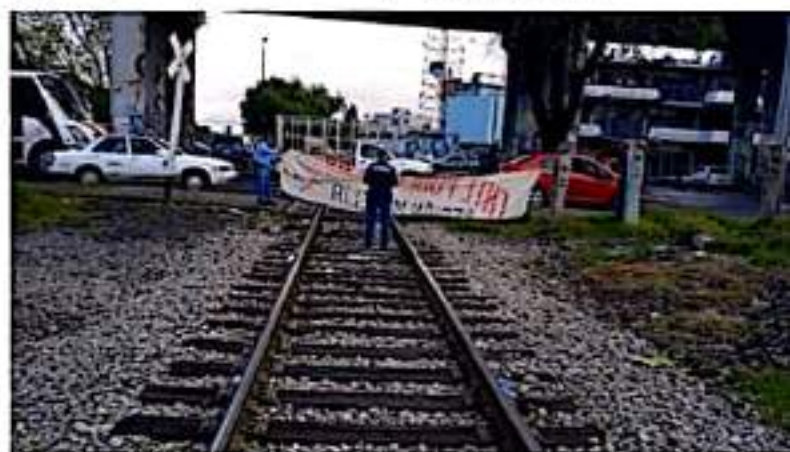
CD. LÁZARO CÁRDENAS, MICH.- Los maestros de Poder de Base, grupo disidente de la CNTE advierten que hasta no cumplirse sus demandas, como el pago de salarios y prestaciones, no desistirán de los bloqueos a la red ferroviaria de Michoacán.

Las acciones se van a enfocar en lo que es limpieza, descacharrización y fumigación, siendo este último el de mayor atención para los comercios de los mercados.