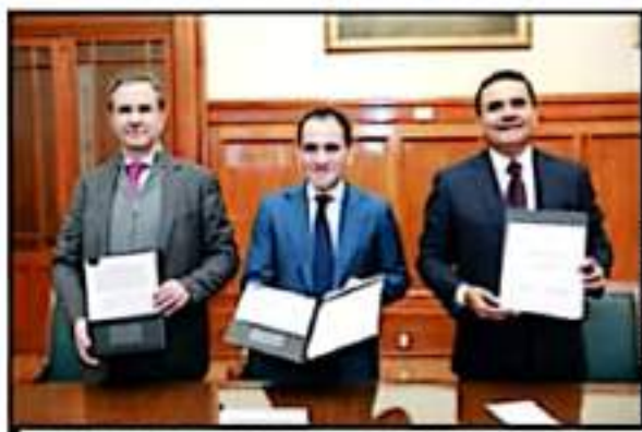
SURTESITA FEDERALIZACIÓN DE LA NÓMINA SE CAYÓ DEL DICHIO AL HECHO