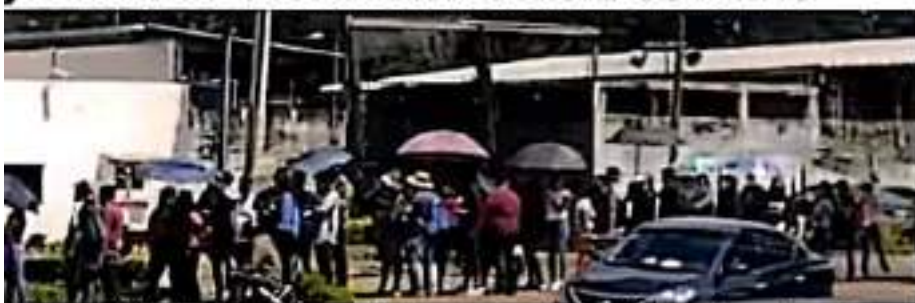
URUAPAN, MICH.- Al ser la unidad deportiva la única sede para la jornada de vacunación, se formaron largas filas, incluso desde el día anterior.