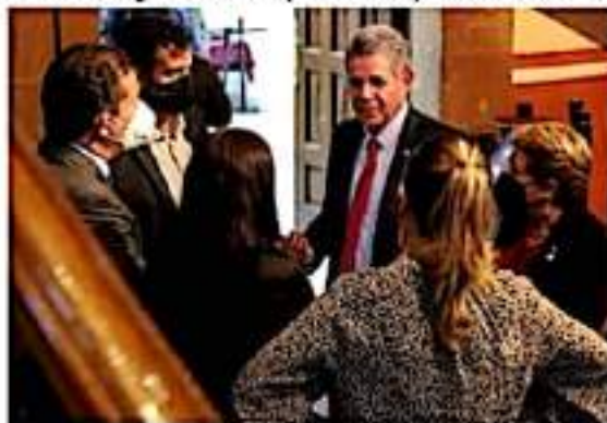
Tras la aprobación de la nueva estructura administrativa, el coordinador de los diputados locales priistas dio un voto de confianza al ejecutivo michoacano.

Con estas observaciones, señaló la vicecoordinadora de los diputados del PAN, es que la Ley Orgánica de Michoacán cumple con un propósito de mayor equidad y cuidado del funcionamiento del estado, sin embargo, permanecerán vigilantes del desempeño del Ejecutivo estatal.