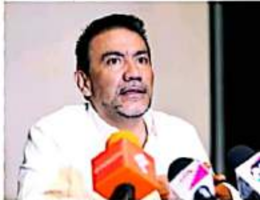
MORELIA, MICH.- Roberto Monroy, secretario de Turismo en el estado.

Agregó que debido a la pandemia de Covid-19 es obligatorio primero evaluar la situación y semáforo de contagios en el estado para determinar los aforos en las festividades pero también hablar con las comunidades para definir en conjunto las acciones.