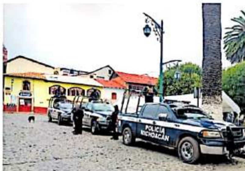
La SSP informó que instaló un destacamento en Tlalpujahua.

Tlalpujahua es un municipio situado en la región oriente del estado, donde más de 100 familias se dedican a lo largo del