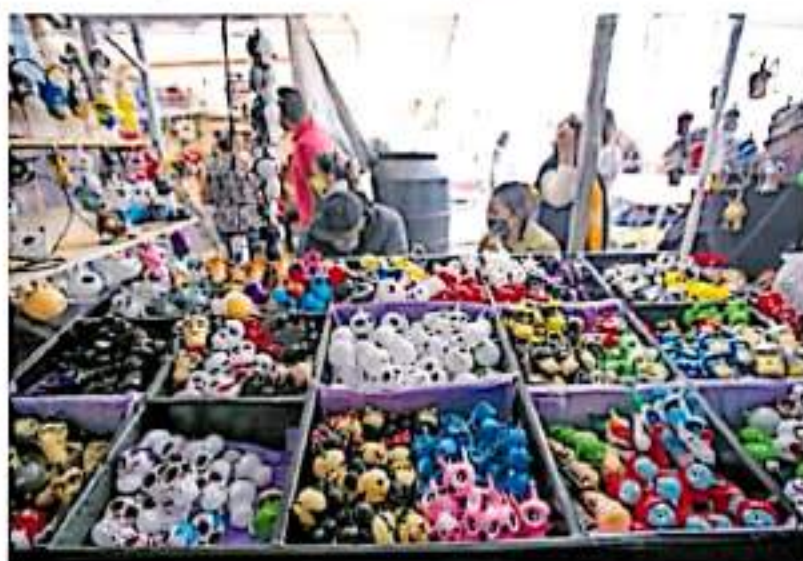
Son más de 600 familias las que se dedican a lo largo del año a la producción de esferas artesanales.

año a la producción de esferas artesanales, que son expuestas a varias partes del mundo y a gran parte del país.