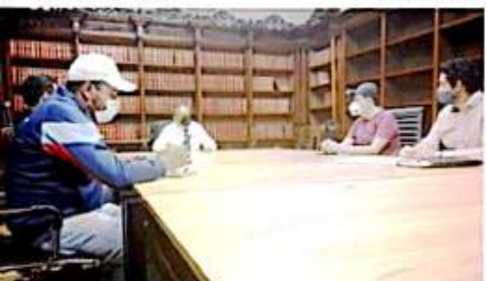
MORELIA, MICH.- Fueron atendidos por el magistrado presidente, Héctor Octavio Morales Juárez.

Por su parte, Morales Juárez, escuchó el posicionamiento del grupo magisterial y comprometió que todo será resuelto conforme a derecho.