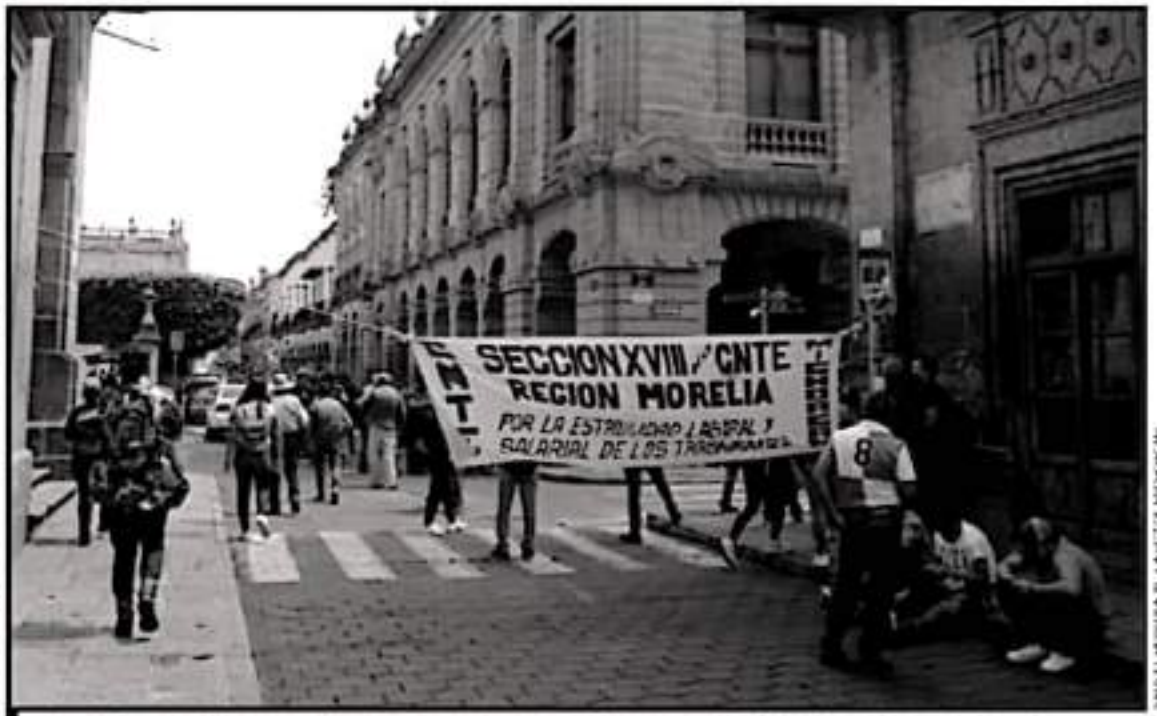
SE MANTIENEN LAS PRÓTESTAS POR LAS DIFERENTES EXPRESIONES SINDICALES DE MAESTROS, ANTE LA FALTA DE PAGO DE DOS MESES DE SUeldo