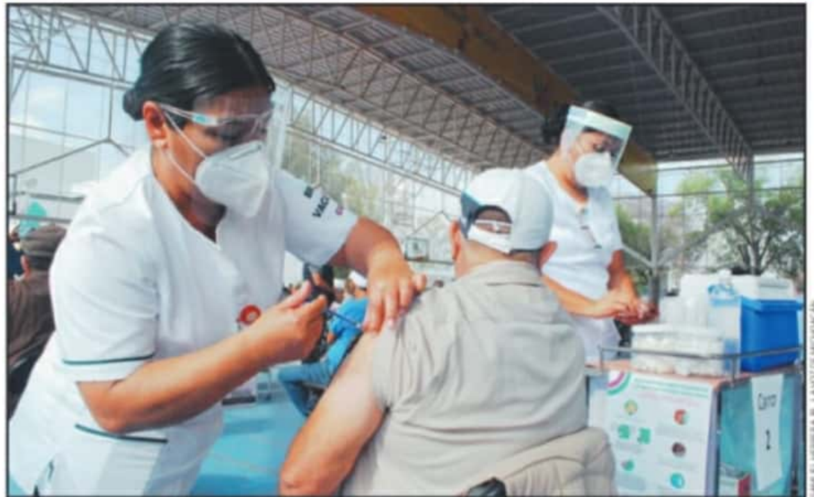
LAS AUTORIDADES DE SALUD AFIRMAN QUE EL PROGRAMA DE VACUNACIÓN CONTINUARÁ POR SI TODAVÍA HUBIERA ALGUN ADULTO MAYOR POR RECIBIR LA DOSIS.

la vacunación en Morelia comience a concluir a partir del jueves o viernes de esta semana, se concluiría con la previsión de que las labores tomarán un periodo de tres semanas en la capital michoacana a partir del sábado 20 de marzo.