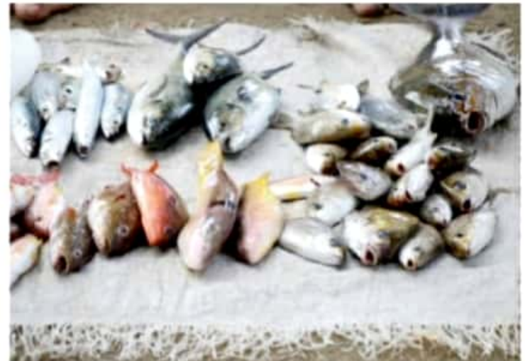
ZIHUATANEJO, GRO.- La demanda de productos marinos superó a la oferta durante la Semana Santa.

Cabe destacar que hoteles, restaurantes y marisquerías duplicaron la demanda de pescado; sin embargo, la producción local es insuficiente desde hace varios años, lo que motiva a la compra de productos marinos que se traen de otras partes del país.