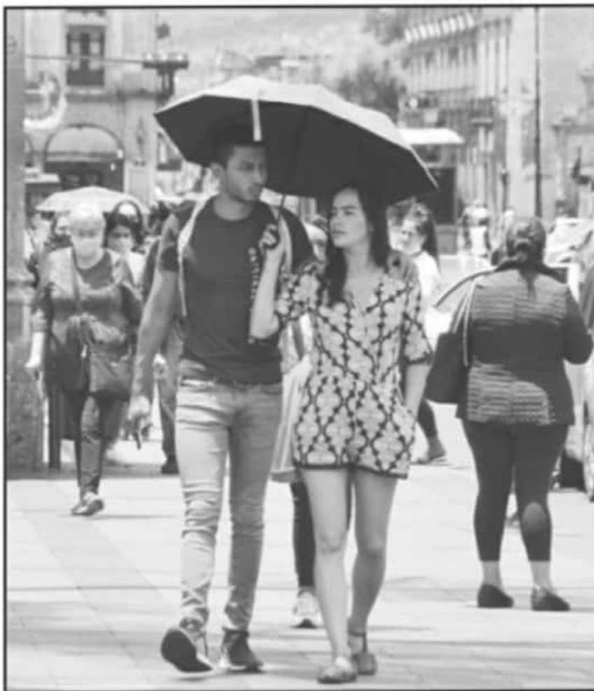
EL PASADO FIN DE SEMANA SE EMITIÓ LA ALERTA POR LA TEMPERATURA RÉCORD DE LA TEMPORADA A NIVEL NACIONAL.

Lo anterior, también trajo consecuencias en lo que se conoce como a la temporada de calor en el estado, con registros de 45 grados en la región de Tierra Caliente del Valle de Tepalcatepec y la del Bajo Balsas, ambas regiones afectadas por el azote de