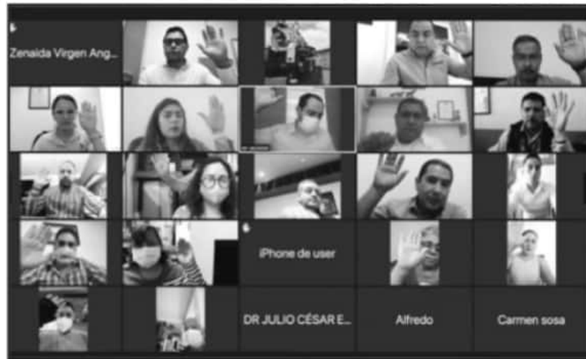
HOY SE LLEVARÁ LA OCTAVA SESIÓN DEL COMITÉ MUNICIPAL DE SALUD, EN LA QUE ABORDARÁN TEMAS IMPORTANTES.