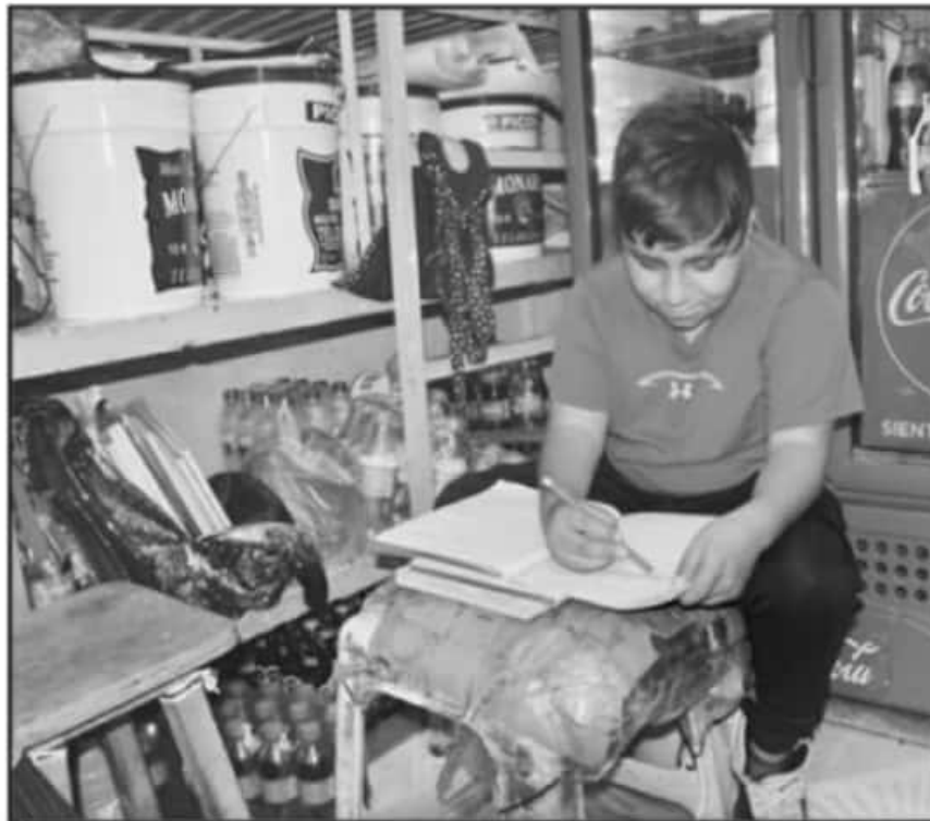
RECONOCE LA SEE QUE ES NECESARIA UNA ESTRATEGIA DE CURSOS DE REMEDIACIÓN Y ACOMPAÑAMIENTO.

Indicó que han hecho énfasis en que el Gobierno del Estado debe proveer las condiciones de conectividad, de comunicación y de accesibilidad a contenidos para el aprendizaje tanto para maestros, como para estudiantes y sus familias, poniendo especial cuidado en verificar que existan condiciones materiales y socioemocionales en sus hogares para lograr tales efectos.