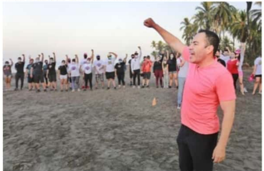
Trabajar en unidad es una forma de aprovechar los talentos de las personas e incrementamos la motivación de todos, afirmó el candidato del Equipo por Michoacán.

En ese sentido, reiteró su compromiso con las y los michoacanos, ya que "todas y todos ustedes cuentan con mi amor por Michoacán, cuentan con mis capacidades, con mi afecto por esta tierra, con mis manos para chambear, con mi creatividad y experiencia porque en Michoacán merecemos muchas cosas más" expresó.