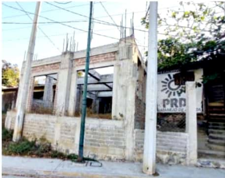
ZIHUATANEJO, GRO.- En el abandono, la obra para más oficinas del Comité Municipal del PRD en Zihuatanejo.

Precisó que la "obra negra" tiene un avance del 90 por ciento y que el proyecto contempla la creación de un auditorio de usos múltiples, una sala privada, baños y una área verde. "Es un gran proyecto", acotó el perredista. Cabe destacar que además las instalaciones se encuentran llenas de maleza y con el paso de los meses están sufriendo deterioro.