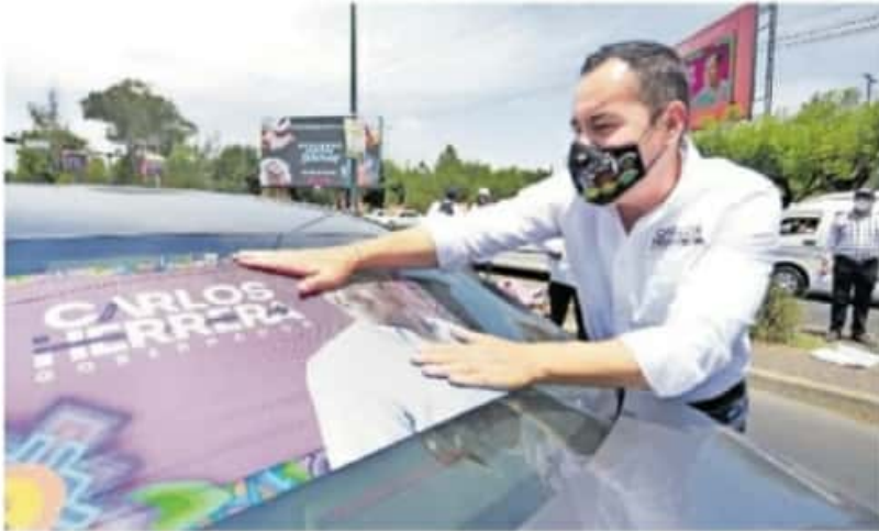
Una de las propuestas de Herrera Tello tiene el objetivo de que las mujeres de Michoacán vivan seguras, / C. ORTIZ/ EQUIPO POR MICHOACÁN