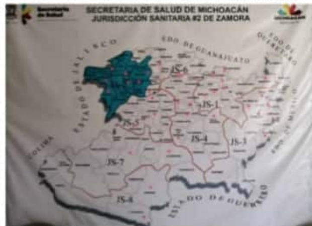
ZAMORA, MICH.- El encargado de la Salud dijo que una estrategia que tienen las autoridades, es comenzar a vacunar a las grandes ciudades.

La región se aleja de las predicciones que han mencionado de una tercera ola de casos de Covid-19, pero aún así estarán alertas y seguirán los protocolos de salud necesarios para mantener controlada la pandemia.