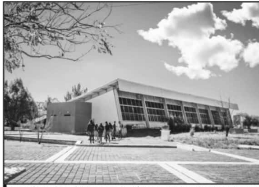
SE RESALTÓ QUE LA INSTITUCIÓN HA ENFRENTADO EN LOS ÚLTIMOS DOS AÑOS SITUACIONES COMPLICADAS EN PAGOS.

Es de resaltar que la institución ha enfrentado en los últimos dos años situaciones complicadas, debido a las dificultades por el déficit de poco más de 5 millones de pesos que anualmente enfrenta.