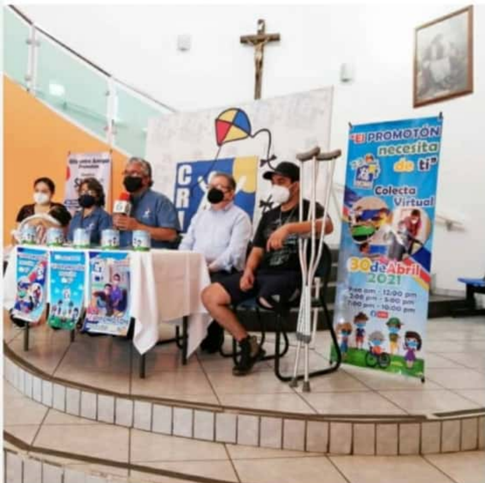
ZAMORA, MICH.- Durante 13 años el centro ha funcionado para atender a niños y adultos con algún tipo de discapacidad.

Ahora el próximo 30 de abril se realizará una vez más el evento del Cri-Promotón, en sus instalaciones, para que la gente pueda apoyar de manera telefónica, pasar a dejar su donativo o realizar el boteo, con las medidas sanitarias correspondientes.