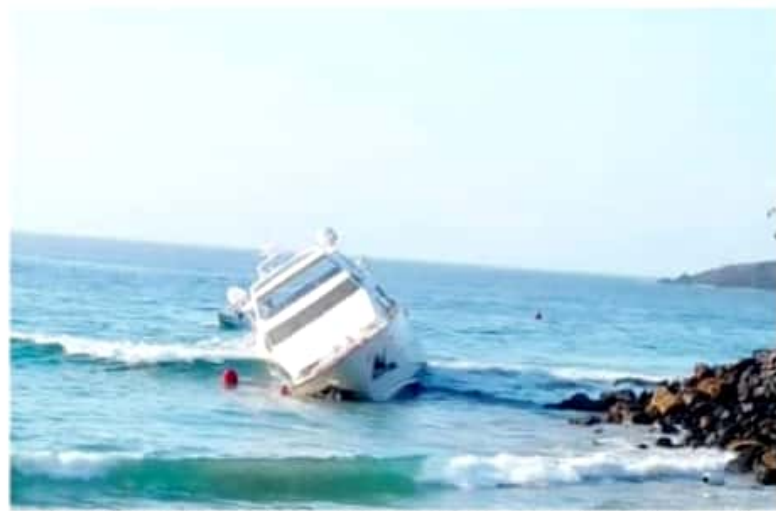
ZIHUATANEJO, GRO.- Una empresa declinó remolcar el yate "Etuale", por lo que se busca contratar a otra.

Lo que motivó a que la aseguradora comenzara la búsqueda de otra empresa que se encargue del manejo y el retiro de la embarcación, la cual encalló el pasado lunes 15 de marzo luego de tratar de ingresar a Marina Ixtapa. Sobre un posible derrame de combustible, el primer edil aseguró que las válvulas del yate se cerraron y se continúa realizando un monitoreo por parte de las autoridades federales, ya que es su área de competencia. Cabe destacar que después de lo sucedido al yate "Etuale", se reportó la mortandad de miles de peces en Marina Ixtapa, sin que hasta ahora las autoridades federales hayan dado a conocer las causas que provocaron la mortandad en ese lugar.