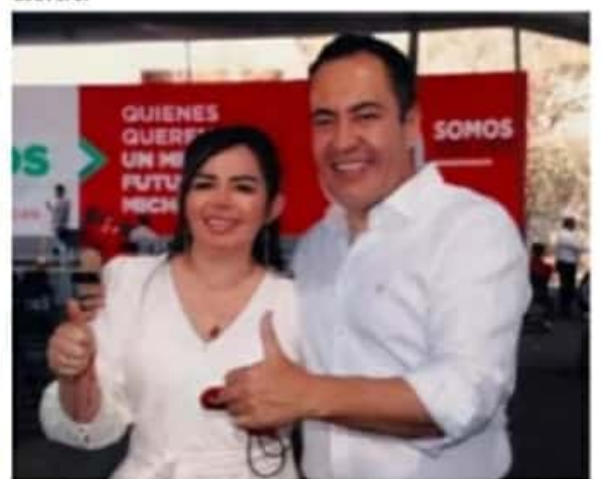
La delegada política para la Estrategia Territorial del Equipo por Michoacán en Lázaro Cárdenas celebró la primera visita del abanderado de PRD, PRI y PAN a este municipio.