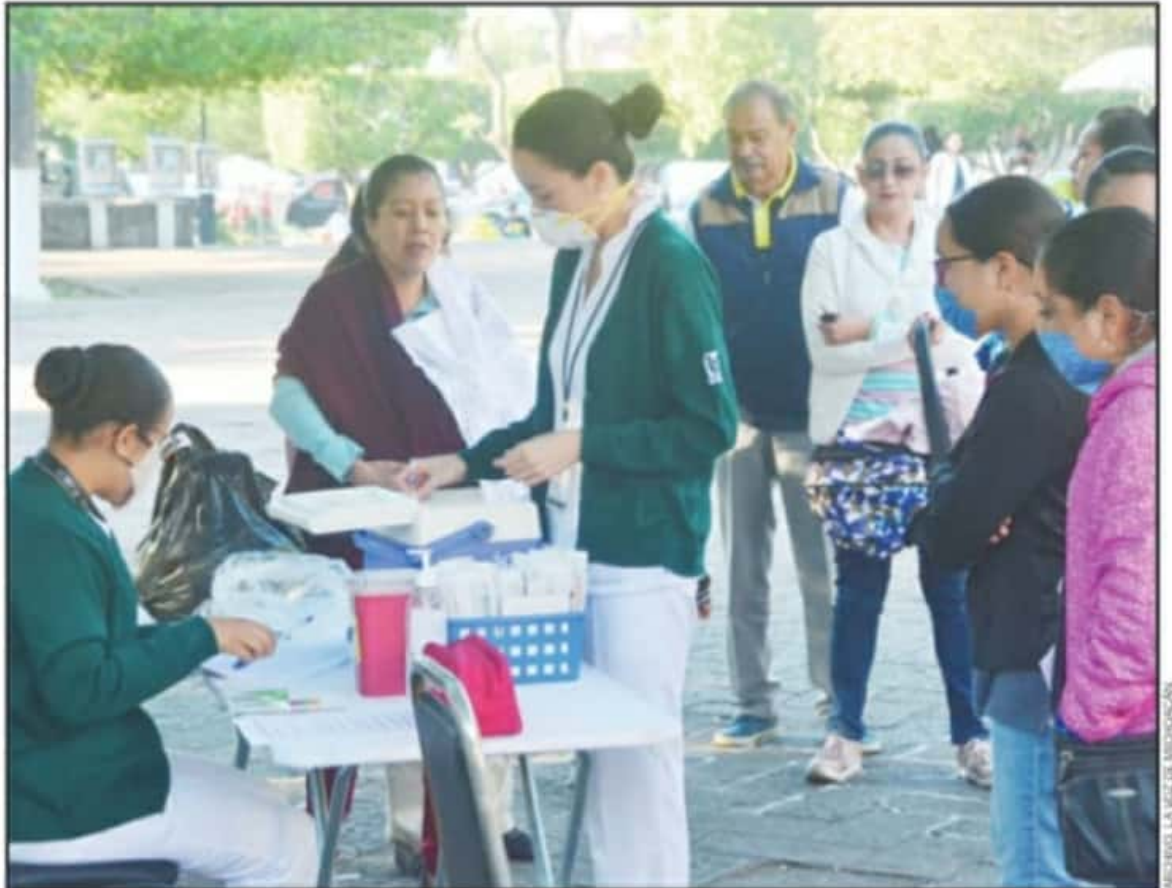
PARA PROMOVER LA CAMPAÑA DE VACUNACIÓN CONTRA LA INFLUENZA, EL PERSONAL MÉDICO DEL SEGURO SOCIAL TUVO QUE SALIR A LAS CALLES DE MORELIA.

El personal médico especializado subrayó que la vacuna contra la Influenza no tiene como fin evitar el contagio del nuevo coronavirus (COVID-19), pero estudios médicos hospitalarios apuntan que esta enfermedad resulta menos agresiva en personas inmunizadas contra el otro padecimiento, debido