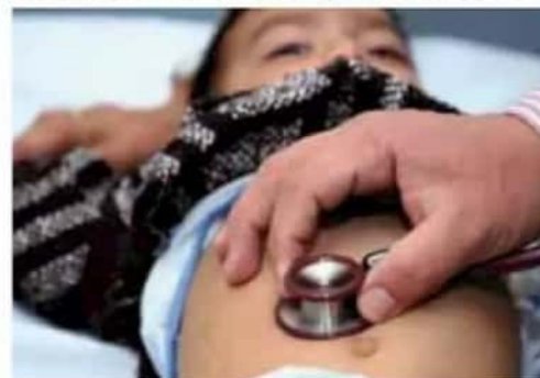
Cuidado. El calor provoca descomposición de los alimentos y aumenta el riesgo de enfermedades.

“En este periodo incrementa la escheriquia collie, el rotavirus, enterovirus, bacillus cereus y el estafilococo, que pueden causar infecciones agudas y graves por intoxicación”, afirmó el especialista, y añadió que cualquiera de éstos se puede identificar por los siguientes signos de alarma: