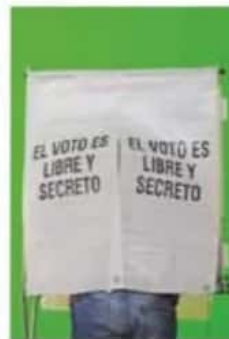
Elección. El reto será vencer el abstencionismo.

Consideró que el INE desarrolló buenas campañas de promoción del voto; sin embargo, en los siguientes meses será decisiva la actuación de los