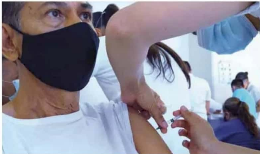
Riesgo. Los adultos mayores representan el grupo poblacional con mayor riesgo de complicaciones por el Covid.

Las personas que recibieron dosis de AztraZenca, Sinovac y Pfizer, deberán estar al tanto de la llegada de la segunda dosis a sus municipios, para completar el esquema; en el caso de los que fueron vacunados con Cansino, su esquema ya está completo, debido a que este