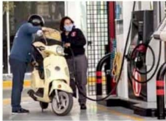
Hidrocarburos. El gobierno de México niega que haya habido gasolinazos.

Los precios de la gasolina y el diésel llevan un incremento superior a 24% en lo que va del gobierno del presidente Andrés Manuel López Obrador, quien —al inicio de esta semana, así como en reiteradas ocasiones— aseguró que bajo su administración no ha habido gasolinazos.