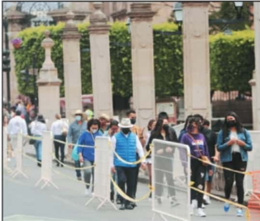
A PESAR DE QUE LAS PLAZAS PÚBLICAS FUERON CERRADAS, LA MOVILIDAD DE LAS PERSONAS SIEMPRE FUE ALTA.

voy a pedir a la señorita secretaria (del ayuntamiento) que pondere la posibilidad de que se abran las plazas públicas".