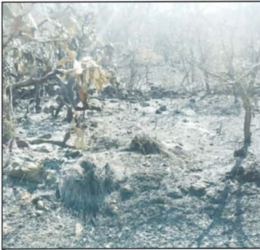
EL MÁS RECIENTE INCENDIO SE COMIÓ BUENA PARTE DEL ÁREA NATURAL PROTEGIDA DE LA CAPITAL MICHOACANA.

Entre las tareas urgentes para realizar en próximos días, es el retirar todo el material que dejó la conflagración como troncos caídos con la finalidad de evitar la presencia de plagas en el resto de vegetación sana y así disminuir