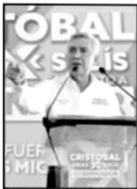
ARIAS, PARTIDO DE PASALAGUA

Ayer mismo, Mario Delgado, presidente nacional de Morena, levantó el plantón ante la sede del TEPJF en apoyo a Raúl Morón y Salgado Macedonio, mientras que el INE imponía otra veintena de sanciones anulatorias en Jalisco, por violar reglas de precampaña.