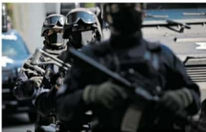
Elementos de la Policía Michoacán los cuidan

El funcionario evitó dar detalles sobre la identidad de quién o quienes la interpusieron además de que tampoco precisó si se trata de aspirantes, precandidatos o candidatos