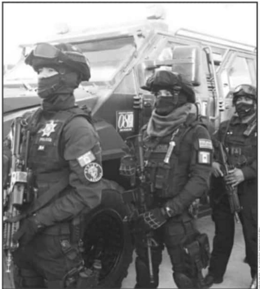
A RAÍZ DE UN VIDEO DE UNOS ELEMENTOS QUE BAILAN CON EL UNIFORME, SE REVISAN ACCIONES DE LOS AGENTES.

dos por parte de elementos de Tránsito y Policía Michoacán en los últimos meses. A pesar de las evidencias que han circulado en redes sociales, ningún caso ha alcanzado sanciones penales.