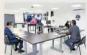
La reunión se hizo de forma virtual