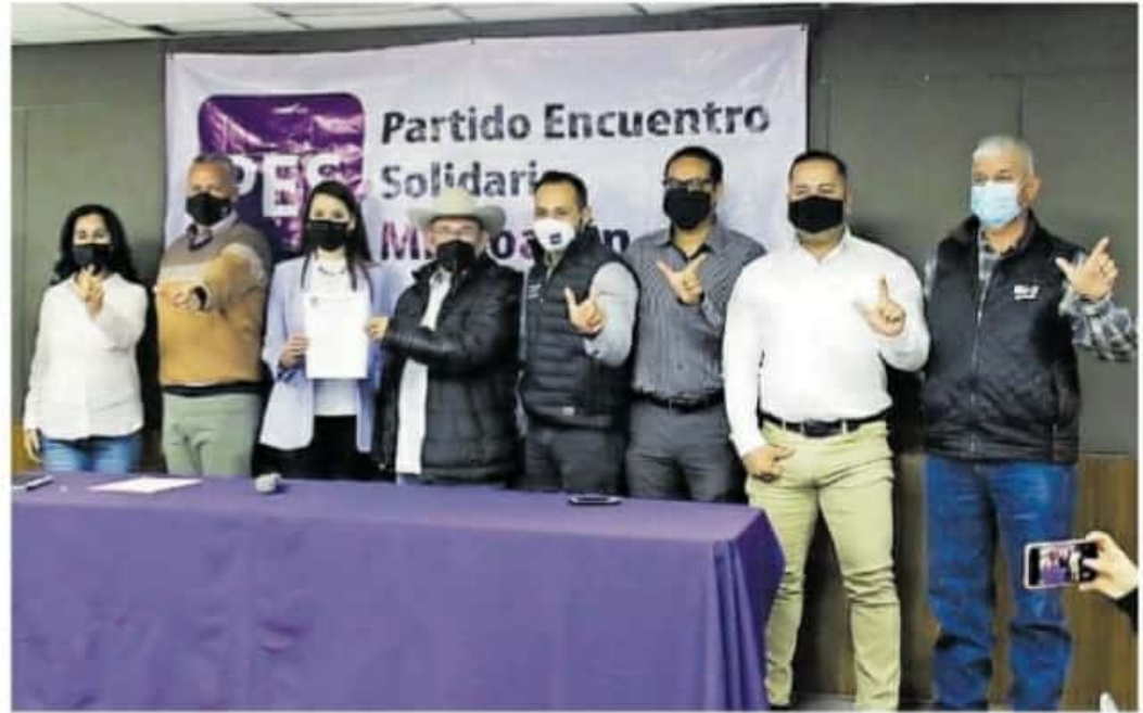
Mora Chávez consideró que es genuino el crecimiento del equipo del PES

cos el próximo 6 de junio y así poder comenzar un cambio verdadero en el estado, llevando a Hipólito Mora Chávez al frente del gobierno de Michoacán.