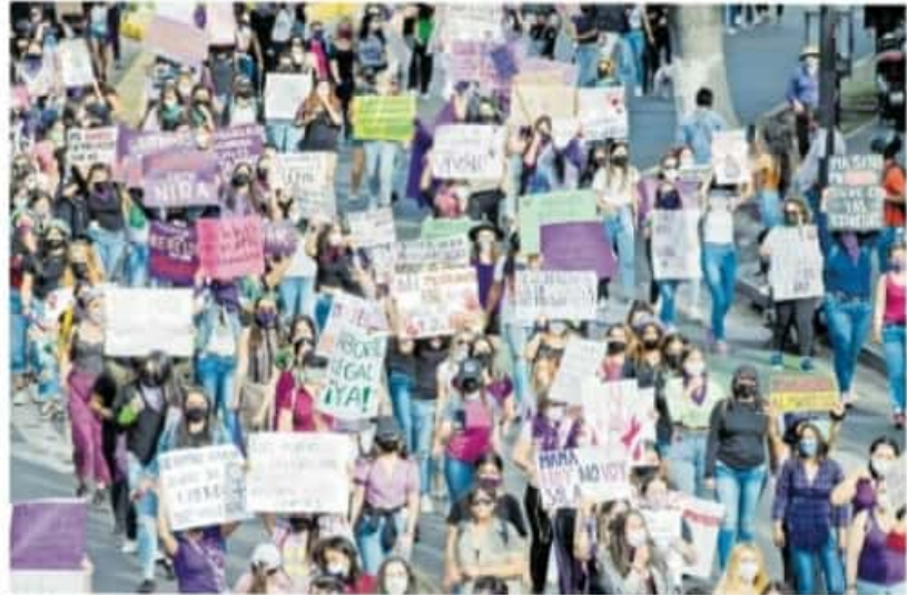
Iniciará en la plaza principal de Zamora y finalizará en la presidencia municipal de Jacona