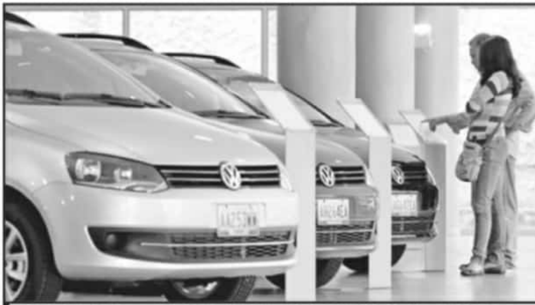
LA CONTINGENCIA SANITARIA HA LIMITADO LA ACTIVIDAD ECONÓMICA EN EL ESTADO, POR ELLO BAJÓ LA VENTA DE AUTOS.