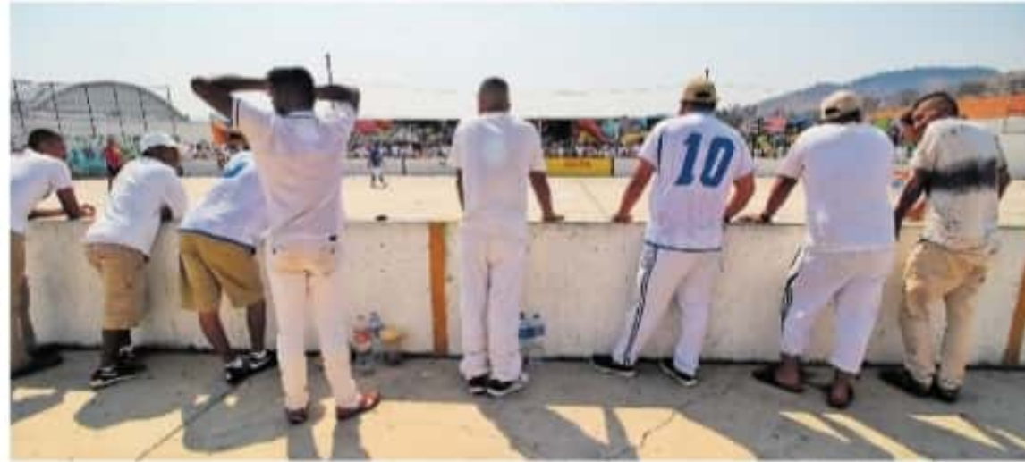
La prueba piloto tendrá cinco centros de reclusión federales

de las 278 solicitudes, solamente resultaron procedentes 98; del resto hubo una improcedente 77 cuyos datos no se pudieron localizar, y 102 que ya habían sido dados de baja del Padrón o Lista Nominal por haber recibido sentencia y con ello perdieron sus derechos político electorales.