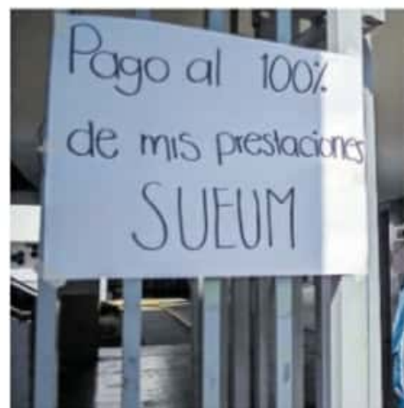
Cerca de 8 mil empleados y profesores de la Máxima Casa de Hidalgo son los afectados.

Por consiguiente algunos agremiados acudieron a Ciudad de México ante la Comisión de Educación del Senado para exponer la situación que atraviesa la institución. Los 225 trabajadores entre profesores de tiempo completo, de medio tiempo, de asignatura, de honorarios e invitados exigen el pago de salarios y prestaciones como aguinaldo, canasta navideña y prima vacacional.