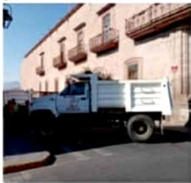
MORELIA, MICH.- Acusan hostigamiento laboral en Asilo de Ancianos Miguel Hidalgo, dependiente del DIF Morelia.

Cabe señalar, entre las demandas no se ha solicitado la remoción del cargo ni de la responsable del asilo, ni la directora general del DIF.