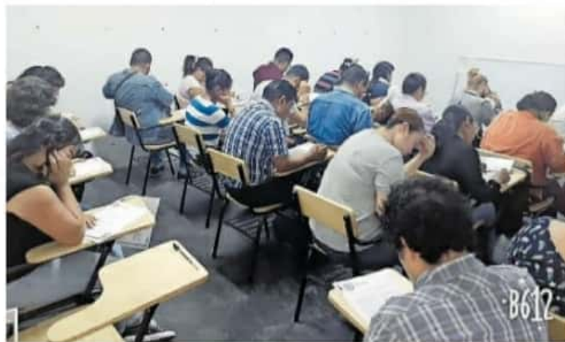
Ha habido rectores sin título, reveló docente

Las autoridades aún deben tres quincenas y el 100 % del aguinaldo, así como las prestaciones del año pasado