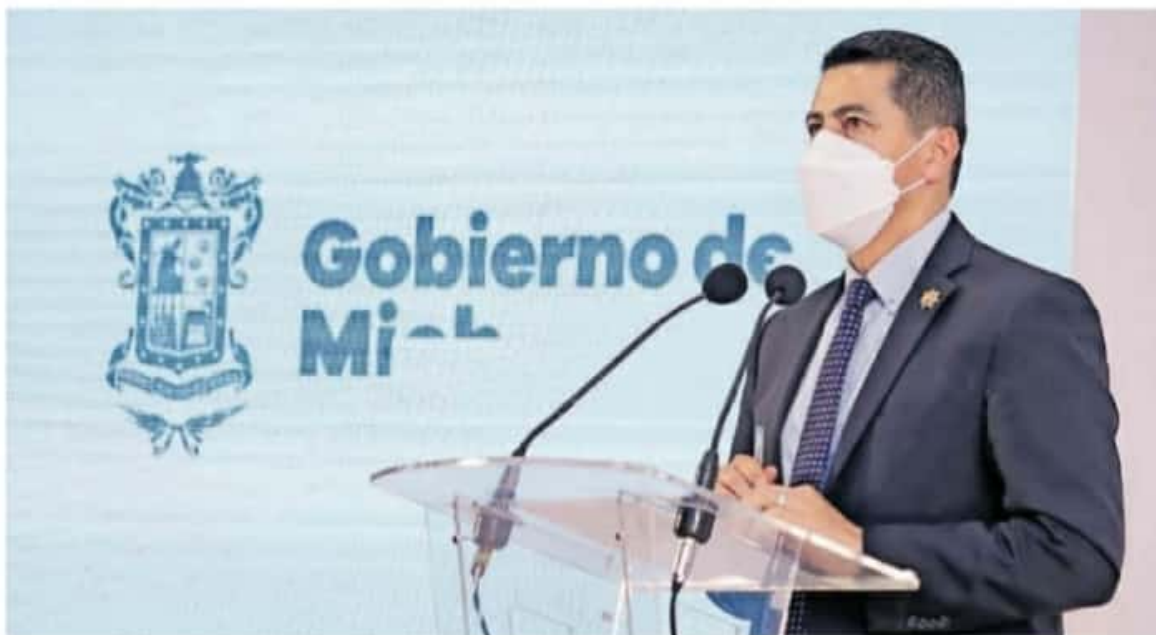
El titular de la dependencia dijo que por la secrecía de la investigación no podía dar más detalles