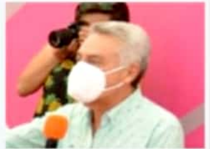
MORELIA, MICH.- Anoche trascendió extraoficialmente, la posible renuncia de Cristóbal Arias Solís a la candidatura al gobierno de Michoacán por Fuerza Por México.

La decisión se daría en el marco del análisis que realiza el Tribunal Electoral del Poder Judicial de la Federación (Tepjf), sobre la candidatura de Raúl Morón Orozco, en donde aseguran que no han faltado morenistas que piden el regreso de Cristóbal Arias a Morena.