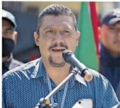
Hoy será despedido con un homenaje de cuerpo presente