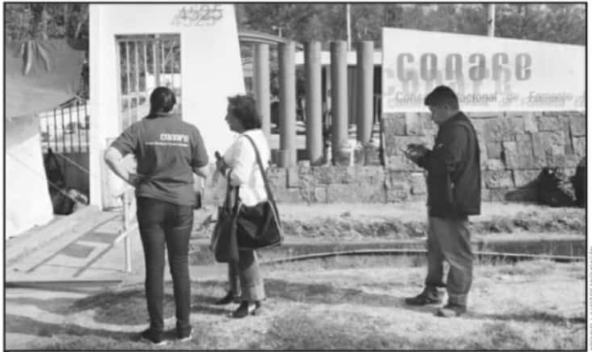
CONAFE ABRE CONVOCATORIA PARA LOS QUE QUIERAN PARTICIPAR COMO LÍDERES EDUCATIVOS Y APOYAR EN TEMAS DE ENSEÑANZA EN COMUNIDADES MARGINADAS.

"Lamentablemente los promedios que tenemos de la primera evaluación son promedios abajo de 8, en primaria son alrededor de 7.9 y en secundaria de 7.8, son los promedios que arrojan los primeros diagnósticos",