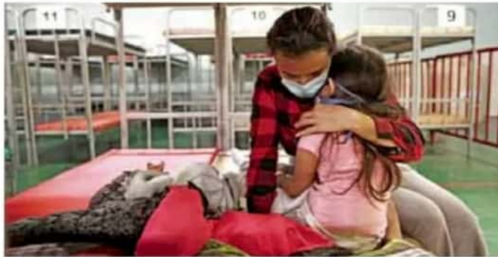
Niños. Más de mil 500 migrantes se concentran en el campamento improvisado en la garita internacional del Chaparral, en Tijuana, de los cuales 40% son menores de edad.

De acuerdo con información del Instituto Nacional de Migración (INM), entre enero y febrero de 2021 se detectaron mil 742 niños migrantes, destacando que febrero superó en cuatro veces la cifra de enero, señaló en entrevista con Publi-