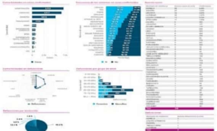
Según el CESS ayer el municipio de LC registró 12 nuevos casos positivos el sábado 29 más para llegar a un acumulado de 5,356.

Por lo que hace a las 6 nuevas defunciones, de ellas 2 fueron en Morelia y el resto en 4 municipios más con un deceso en cada lugar, entre ellos Lázaro Cárdenas que ahora acumula 325.