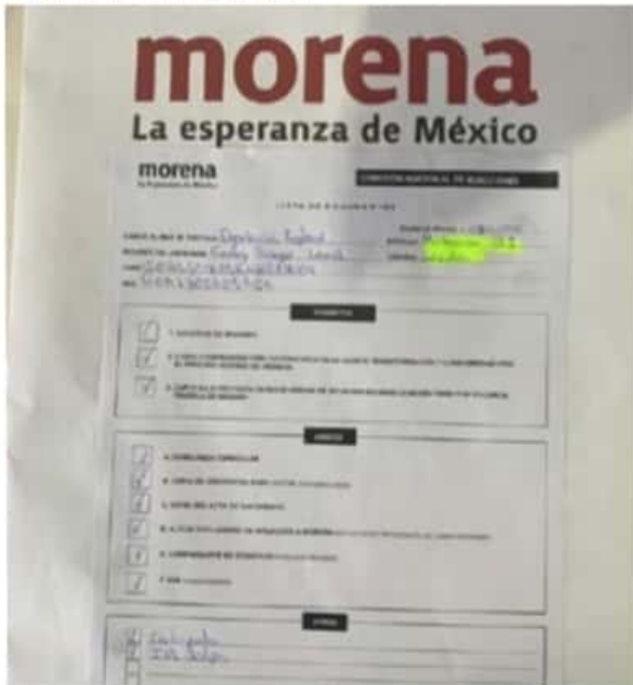
El registro del ex gobernador Leonel Godoy Rangel, como aspirante a la candidatura de Morena por el 01 Distrito Federal Electoral

Sin embargo también en redes sociales ya se ha comenzado a denostar al ex mandatario michoacano, recordando el endeudamiento en que dejó a Michoacán y su señalamiento de estar metido en negocios turbios con la constructora brasileña Odebrecht.