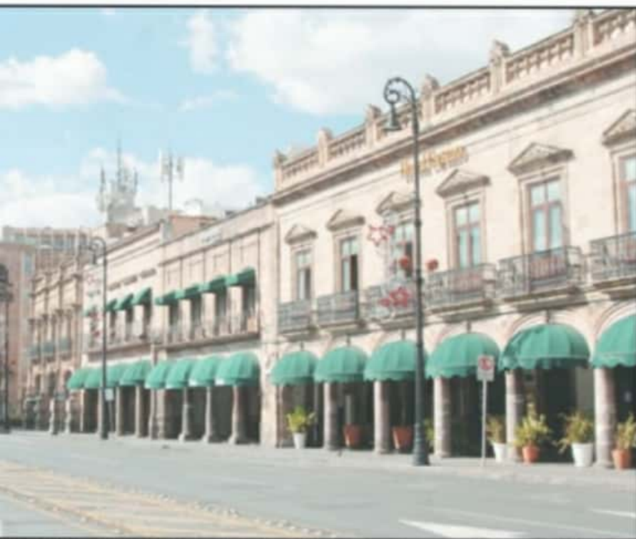
EN MUCHO MENOS AFILIENCIA QUE EN LOS DÍAS PASADOS Y LOS NEGOCIOS MANTUVIERON LAS CORTINAS ABAJO.

que a partir de este sábado inicia- ron las acciones para reducir las ac- tividades de la ciudadanía en espacios públicos y comercios.