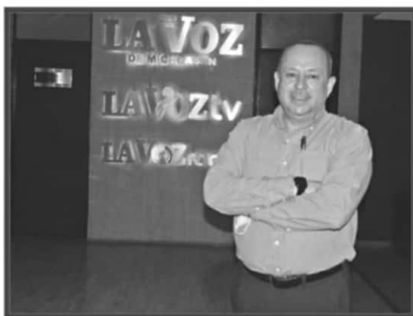
SAMUEL HERRERA/LA VOZ DE MICHOACÁN

La postura de Martínez Pasalagua es clara en cuanto a las defi-