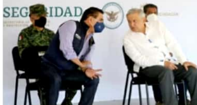
El presidente AMLO y el gobernador SAC dialogan.