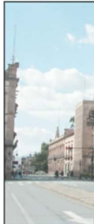
LAS CALLES DEL CENTRO LUCIERON CON

mercados sobre ruedas que normalmente se instalan los domingos en la capital michoacana.