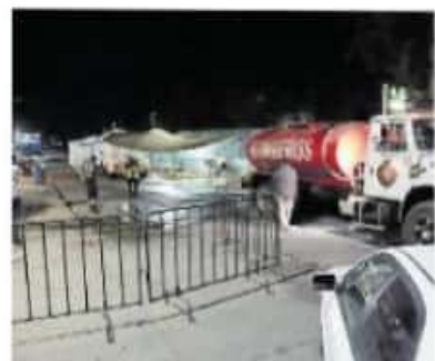
Paracho registra hasta la fecha 44 defunciones

Estas medidas pretenden romper con la cadena de contagio de Covid-19, enfermedad que, en el municipio, de acuerdo con el más reciente