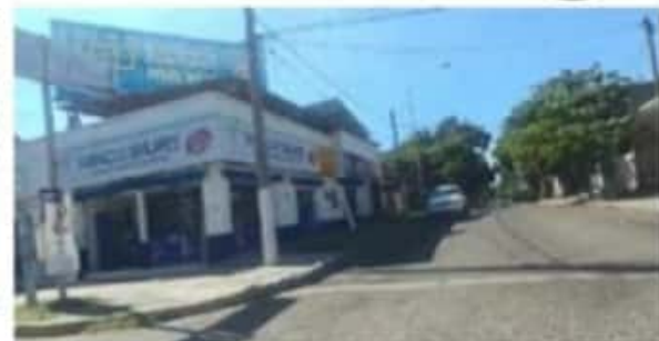
La cadena de farmacias Similares, fue de los negocios que ayer permanecieron abiertos para dar servicio de consulta a la población en general.