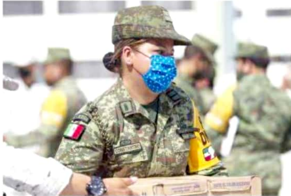
APATZINGÁN, MICH.- Se recibieron en las instalaciones del Campo Militar de la 43 Zona Militar medicamentos, mascarillas, cubrebocas, etc.

Con estas acciones, la Secretaría de la Defensa Nacional refrenda su compromiso y responsabilidad de servir al pueblo de México en cualquier condición y lugar, a fin de realizar actividades para proteger la integridad física de la población.