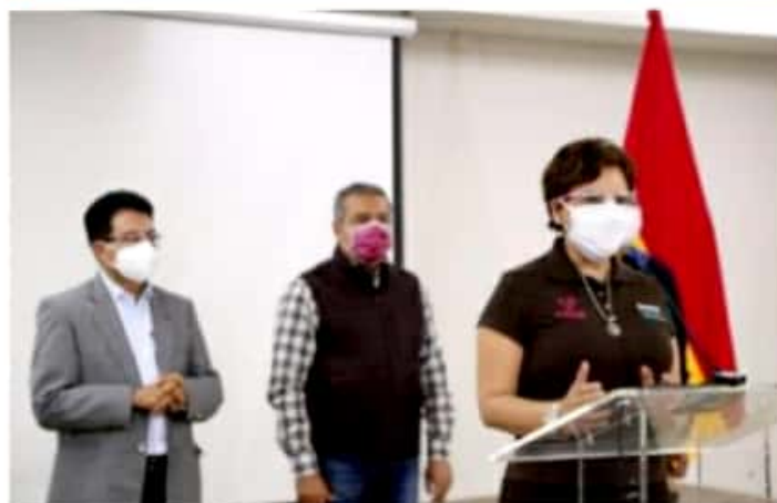
MORELIA, MICH.- Morelia aplica medidas extraordinarias para mitigar la pandemia