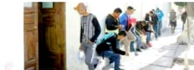
APATZINGÁN, MICH.- Añadieron que la Sedena entregó a dicha Junta un total de 550 formatos para igual número de jóvenes.

Para concluir, el personal de la Junta Municipal de Reclutamiento de Apatzingán recordó que el trámite y el documento son gratuitos, y que la cartilla se entregará 48 horas después de haber sido solicitada.