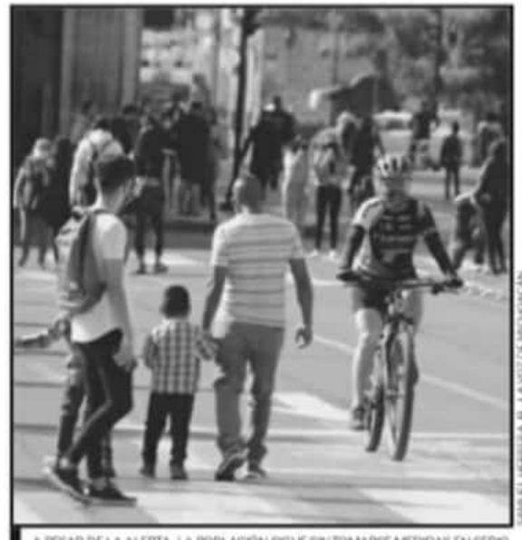
A PESAR DE LA ALERTA, LA POBLACIÓN SIGUE SIN TOMARSE MEDIDAS EN SERIO.

Los municipios que tuvieron casos con más de doble dígito -además de la capital michoacana- fueron La Piedad (95), Pátzcuaro (58), Apatzingán (44), Uruapan (40), La Piedad (20), Zitácuaro (34), Zamora (25) y Lázaro Cárdenas (12). Ante este comportamiento, la SSM sumó más demarcaciones al nivel de Bandera Amarilla (alto riesgo), para dejar seis por el momento: La Piedad, Uruapan, Pátzcuaro, Zamora, Lázaro Cárdenas y Zitácuaro.