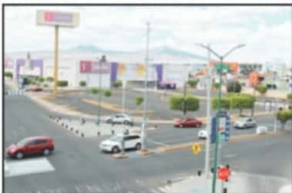
LA ZONA COMERCIAL AL SUR DE LA CIUDAD MANTUVO CERRADAS SUS PUERTAS.