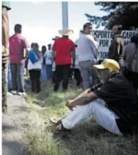
Los comuneros lograron recuperar 40 hectáreas de tierra.

Reconoció que existen “prácticas muy arraigadas y no es común que las mujeres se involucren mucho en los temas de la vida pública y las decisiones es un asunto de empoderamiento y capacitación”, pero éste será el principal reto que deberá lograr el IEM en esta elección, recalzó.