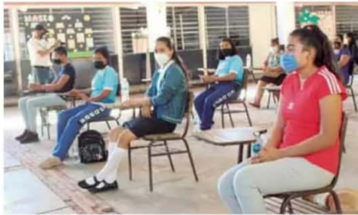
Aulas. El regreso a las escuelas será hasta que haya condiciones para hacerlo.

En el caso del Colegio de Bachilleres del Estado de