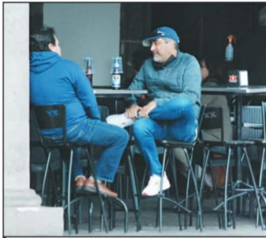
LO QUE BUSCA LA AUTORIDAD ES QUE LA GENTE NO SALGA SOLO PASEAR O BEBER EN PLENO PICO DE PANDEMIA.