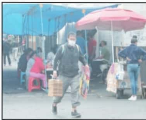
VENEDORES AMBULANTES SE PUSIERON COMO SI NADA CERCA DE LA LAZARO.