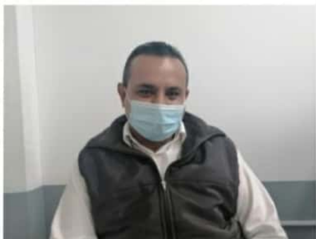
URUAPAN, MICH.- Los negocios que tienen que pagar el trámite de resello

Finalmente, detalló que hay un total de 21,000 licencias expedidas en el municipio, de las cuales quedaron pendientes de regularizar en el 2020 un 30 por ciento de los negocios diversos en los que destacan rojos, blancos y anuncios.