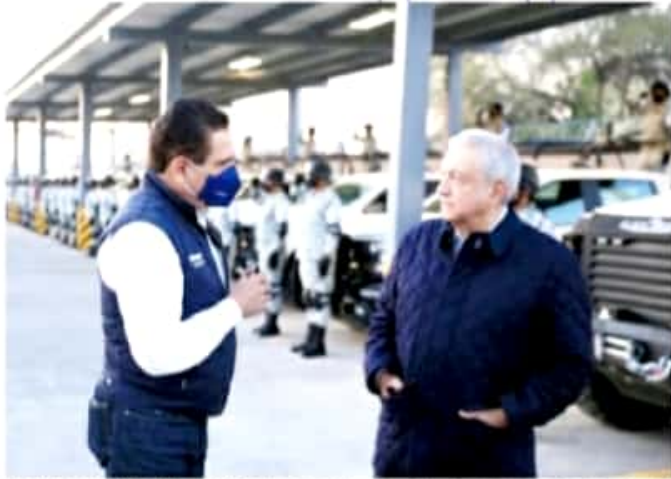
MORELIA, MICH.- El presidente anunció el inicio de entrega de apoyos del Bienestar y compra de vacunas, desde Cotija.

Con el compromiso de adquirir 120 millones de dosis se busca garantizar el acceso universal y gratuito