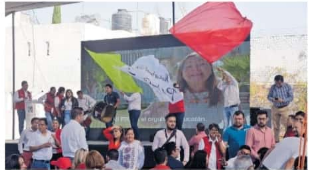
IEM aprobó los lineamientos 3 de 3 el pasado 23 de noviembre

La presidenta del OPPMM comentó que el siguiente paso será que estos lineamientos sean ley, lo cual corresponderá al