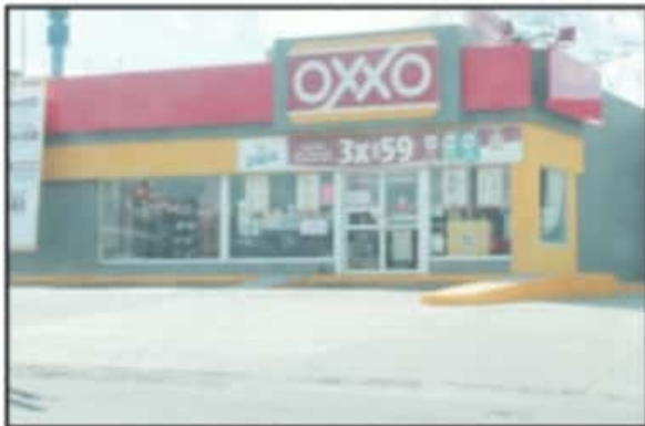
LA GRAN MAYORÍA DE TIENDAS OXXO RESPETARON LA MEDIDA SANITARIA.