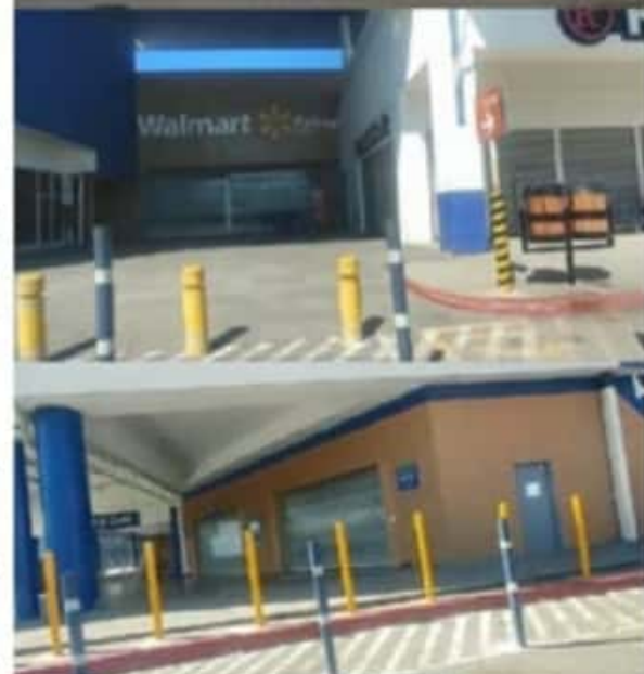
Las diversas cadenas de tiendas o supermercados que hay en la ciudad, acataron las disposiciones sanitarias y también mantuvieron cerradas ayer domingo sus instalaciones.