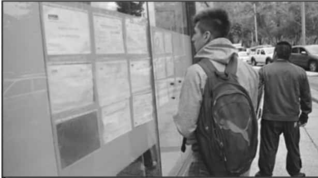
DEBIDO A LOS EFECTOS DE LA PANDEMIA LA OFERTA LABORAL RESULTA PRECARIA Y CADA VEZ MAS SE QUEDAN SIN EMPLEO.