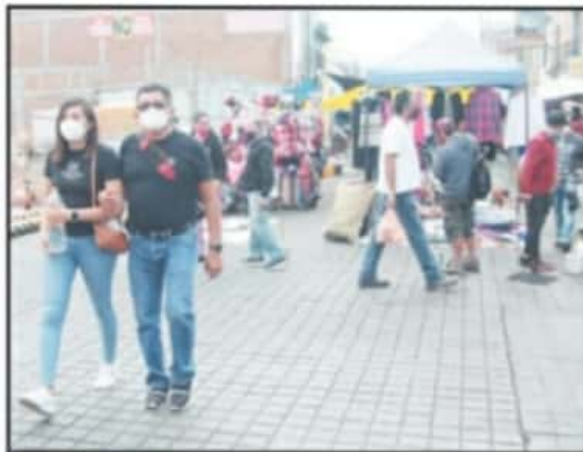
LOS ACCESOS A LOS TIANGUIS SIGUEN SIN TENER REALES FILTROS SANITARIOS.