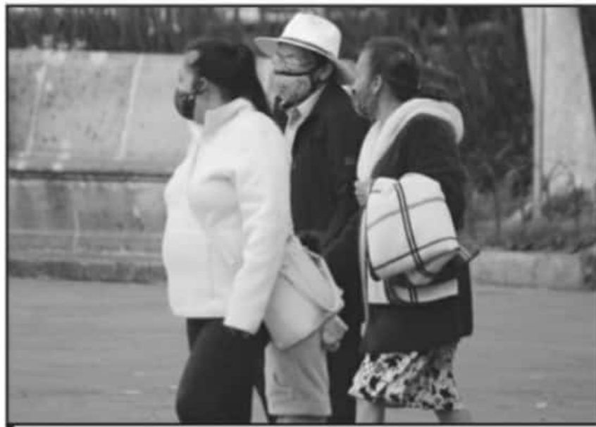
ES IMPORTANTE NO EXPONER A ADULTOS DE EDAD AVANZADA AL FRÍO DURANTE ESTA TEMPORADA, ADVIERTEN.

Tanto por el tema de la pandemia como por el frío, la indicación es mantenerse en casa y salir lo menos posible. En caso de tener que desplazarse, se pide abrigarse lo suficiente preferentemente usando la técnica de cebolla (ves-