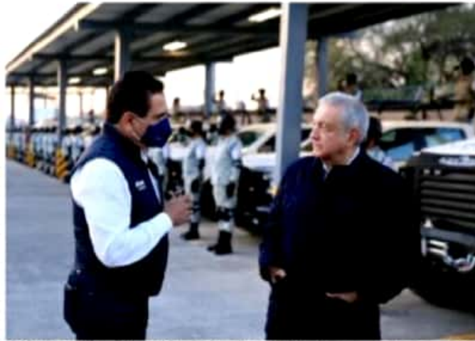
MORELIA, MICH.- El presidente anunció el inicio de entrega de apoyos del Bienestar y compra de vacunas, desde Cotija.

■ Con el compromiso de adquirir 120 millones de dosis se busca garantizar el acceso universal y gratuito