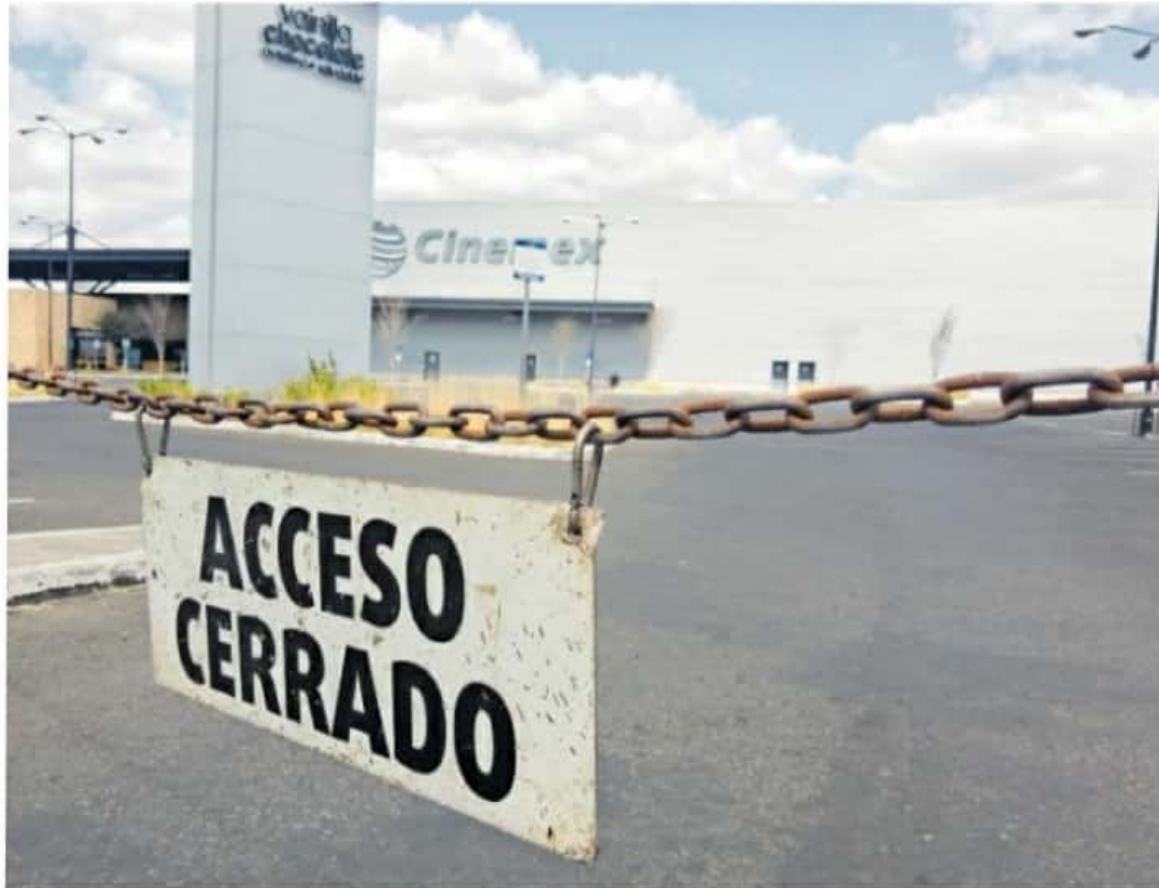
Plazas comerciales cerraron sus puertas y lucieron vacías para cumplir el mandato

Negocios de comida del Centro Histórico ayer permanecieron cerrados