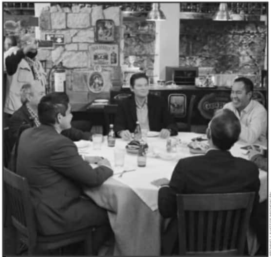
EN NOVIEMBRE PASADO SE REUNIERON POR PRIMERA VEZ LOS PERFILES QUE DESTACABAN PARA LA GUBERNATURA.

A la distancia observamos que el PRD, con su comandante