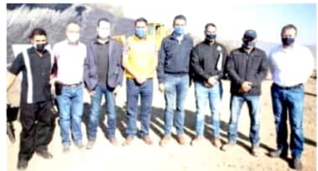
COTIJA, MICH.- El alcalde manifestó que espera coordinar esfuerzos con la empresa encargada de administrar el centro.

En el centro se invertirán más de 14 millones de pesos, que servirán para eliminar los tiraderos a cielo abierto y evitar la contaminación de suelo y agua, mejorando la calidad de vida de los habitantes.