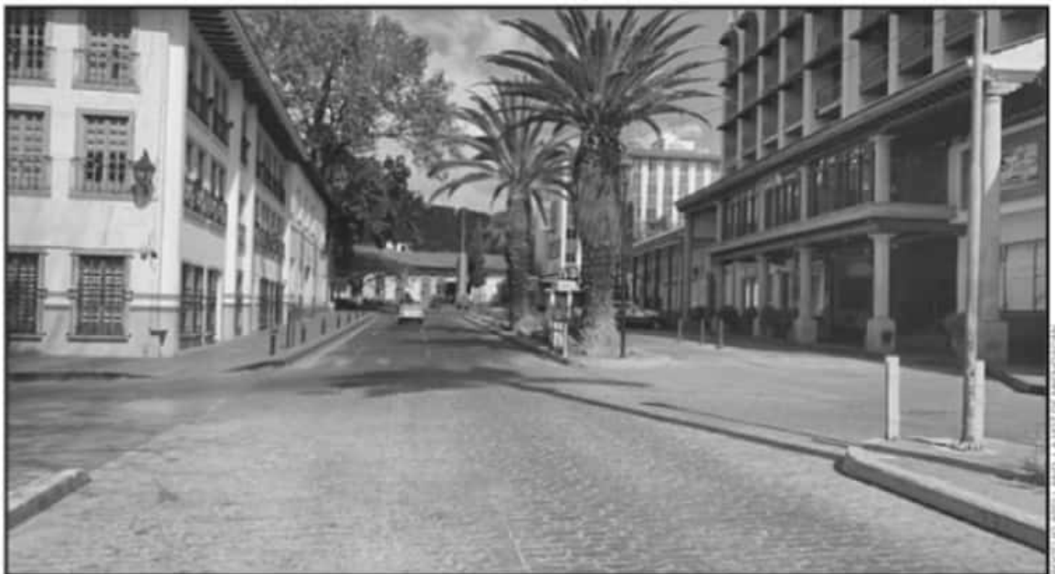
ESTE DOMINGO LAS CALLES LUCIERON VACÍAS, SIN NINGÚN COMERCIO ABIERTO Y PRÁCTICAMENTE NULA CIRCULACIÓN DE VEHÍCULOS Y PEATONES EN URUAPAN.