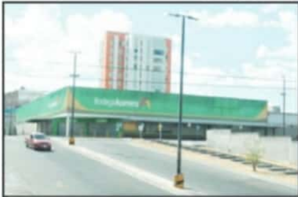
CENTROS COMERCIALES NO OPERARON DURANTE ESTE DÍA POR DECRETO OFICIAL.