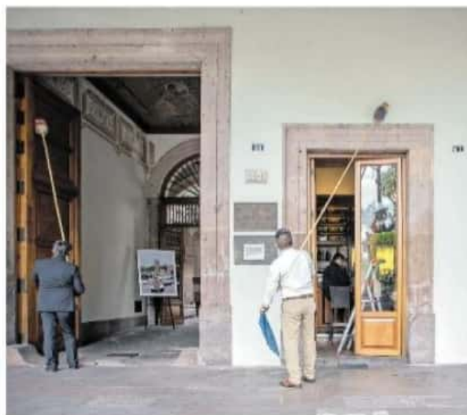
Los restaurantes podrán trabajar los domingos y después de las 19:00 horas, únicamente bajo la modalidad de servicio a domicilio

Para intensificar las inspecciones, el Ayuntamiento de Morelia instruirá personal que revisará diariamente el cumplimiento del aforo en un 30 por ciento en los establecimientos, así como que los comercios cuenten con tapetes sanitizantes, termómetros y gel antibacterial en los puestos de entrada.