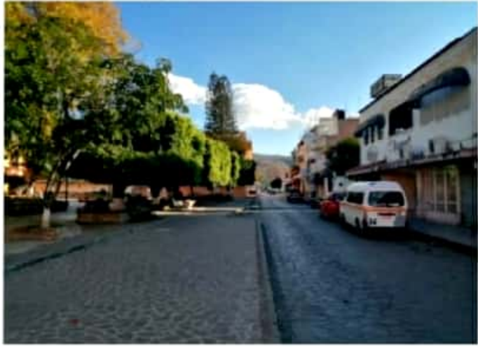
MORELIA, MICH.- El comportamiento epidemiológico impulsó una serie de acciones que buscan frenar el alza en la ocupación de las camas por Covid.

MORELIA, MICH.- Un total de 47 municipios se sumaron a las medidas de mitigación para romper la cadena de contagio de Covid-19 en la entidad, acatando el decreto estatal que busca proteger la vida y la salud de la población. Derivado del comportamiento epidemiológico, con 35 mil 27 casos confirmados, y 2 mil 841 defunciones, el gobernador del Estado, Silvano Aureoles Conejo, impulsó una serie de acciones que buscan frenar el alza en la ocupación de las camas reconvertidas para la atención de pacientes con Infecciones Respiratorias Agudas Graves (IRAG) la cual se reporta a un 48.19 por ciento en la entidad.