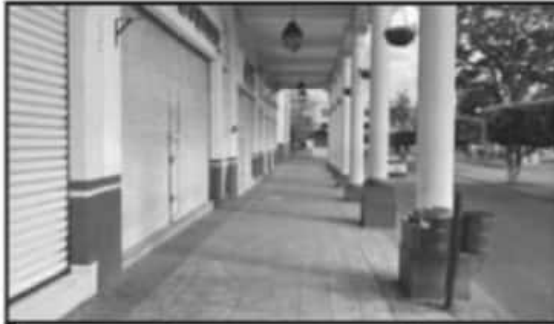
LOS COMERCIOS DEL MUNICIPIO RESPETARON EL DECRETO SANITARIO.

Lo anterior en virtud de que las medidas para disminuir la movilidad social se aplicarán