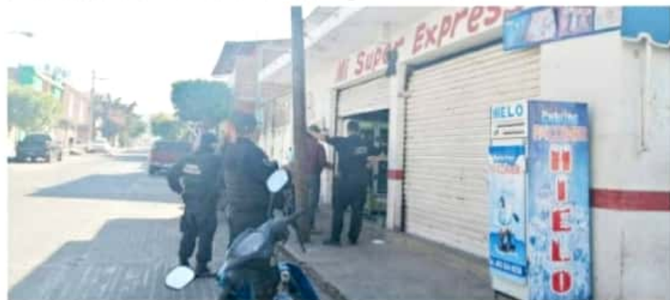
APATZINGÁN, MICH.- A través del departamento de Inspectores, fueron notificados los dueños y administradores de los diferentes negocios.

Cabe mencionar que también se desarrollarán recorridos por toda la ciudad para solicitar a los comerciantes que acaten las disposiciones del gobierno municipal y del estado.