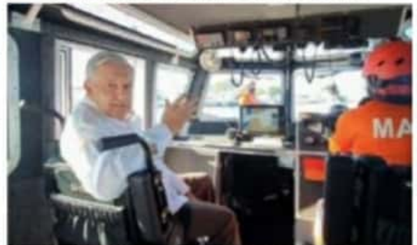
Ayer el presidente AMLO señaló que el estado de Colima es el de mayor incidencia delictiva en el país.