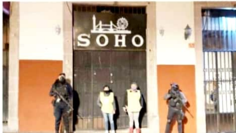
MORELIA, MICH.- La Coepris, con el apoyo de Guardia Nacional y Policía Michoacán, supervisaron los principales bares, antros y centros nocturnos.

Recordar que el decreto manifiesta el cierre a partir de las 19:00 horas, de jueves a sábado de las actividades no esenciales y los domingos cierre total en todo el territorio michoacano; así como cumplir con las normas sanitarias indicadas, instalación de filtros sanitarios, usos de gel antibacterial, uso obligatorio de cubrebocas, tapete sanitizante, mantener la sana distancia, lavado constante de manos y medición de temperatura.