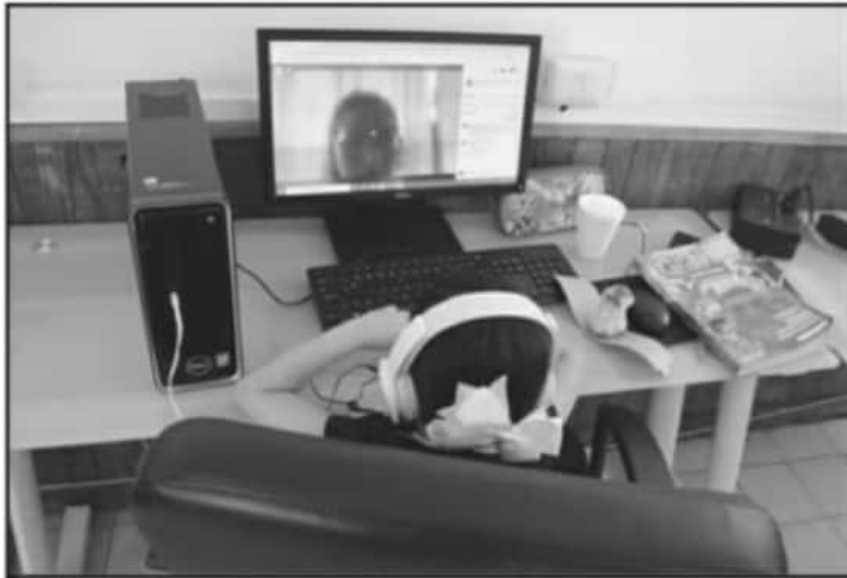
MÁS DE UN MILLÓN DE ALUMNOS REGRESARÁN Y CERRARÁN EL CICLO CON EL SISTEMA DE CLASES EN LÍNEA.

remediales que puedan contener esta problemática.