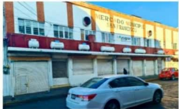
URUAPAN, MICH.- Los comerciantes en un acto de conciencia, respetaron las medidas giradas por las autoridades, manteniendo sus locales cerrados.

Así, la gran mayoría de los uruapenses, dieron una muestra de responsabilidad social, locatarios de los distintos Mercados Municipales cerraron sus puertas para disminuir la movilidad y sumar así a frenar la cadena de contagios en Uruapan. Sin actividad lució el centro de la ciudad por la tarde, gracias a la disposición y responsabilidad del Comité del Centro Histórico.