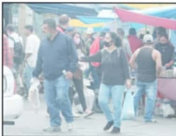
PERSISTEN LAS PERSONAS QUE SE NIEGAN A MANTENER MEDIDAS SANITARIAS.