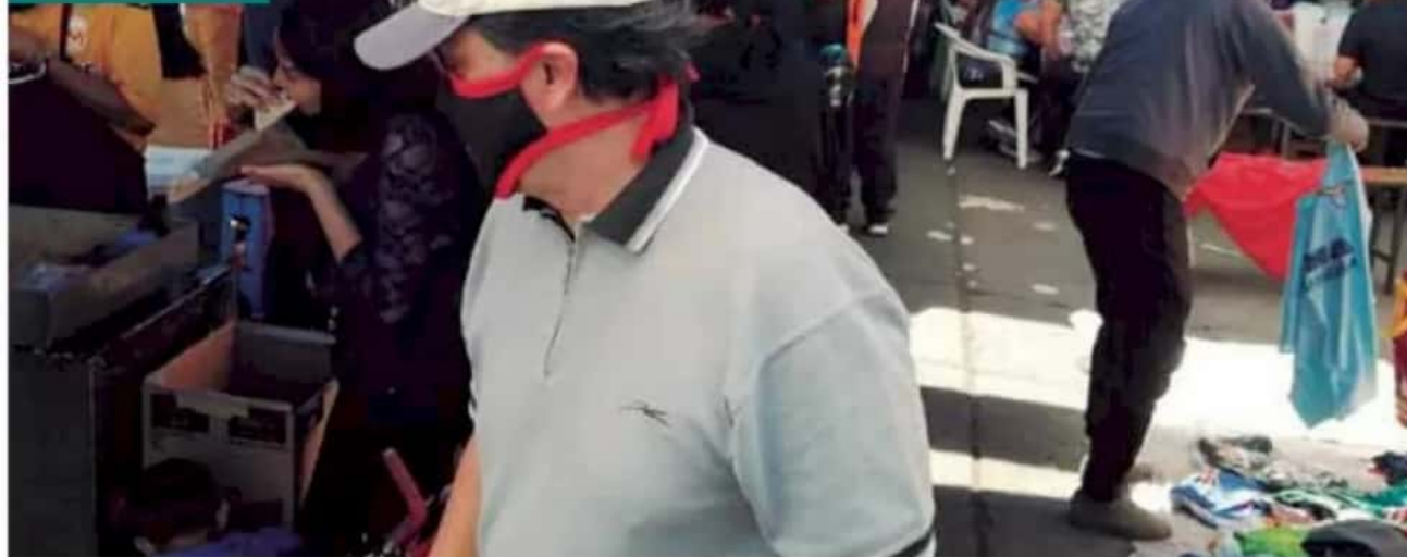
Oídos sordos. Pese al llamado de las autoridades y al decreto, vendedores de diversos artículos se instalaron en mercados y tianguis de la ciudad.