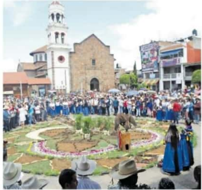
Se realizará una reunión presencial con la Comisión de Enlace de Cherán.

“El principal reto está encaminado al tema de la pandemia, porque la naturaleza misma de la toma de decisiones en Cherán es propiamente de acumulación de personas, ellos toman las decisiones por barrios o en una asamblea general y esto implica que tengan que reunirse, toman la determinación a mano alzada, ahora no podemos hacer eso. La comisión de enlace de Cherán sabe que tenemos que cambiar esta dinámica. A diferencia del