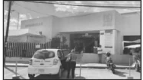
INCLUSO LAS UNIDADES DE ATENCIÓN MÉDICA SEVIERON CON Poca GENTE.