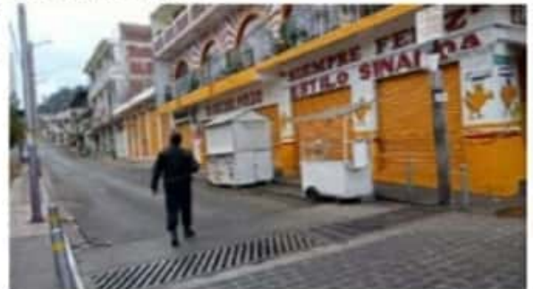
Autoridades locales acataron el decreto que busca romper la cadena de contagio.