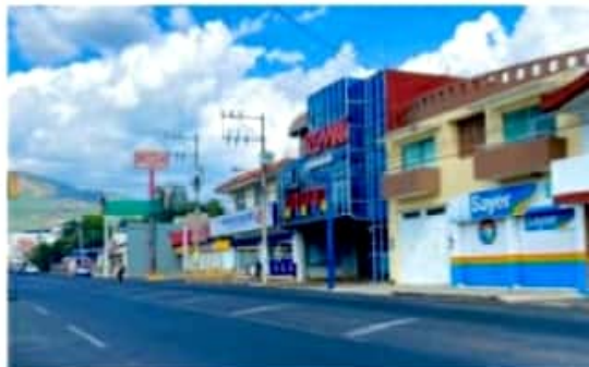
URUAPAN, MICH.- Solitarias, lucieron las calles de la ciudad este domingo, con respecto a las indicaciones.

Así como Jungapeo, La Piedad, Lagunillas, Lázaro Cárdenas, Morelia, Morelos, Múgica, Numarán, Panindícuaro, Paracho, Parácuaro, Pátzcuaro, Puruándiro, Queréndaro, Quiroga,