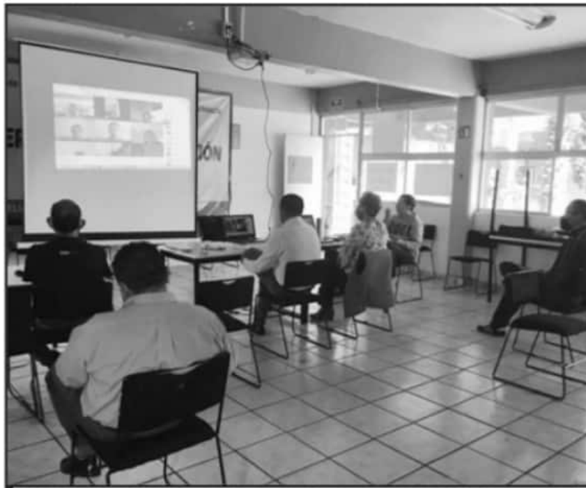
EL COLEGIO DE ESTUDIOS CIENTÍFICOS Y TECNOLÓGICOS DEL ESTADO DE MICHOACÁN REFUERZA TEMAS DE CONECTIVIDAD.