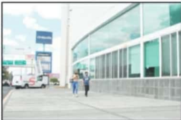
LA PLAZA COMERCIAL DE LAS AMÉRICAS NO RECIBIÓ CLIENTES ESTE DOMINGO.