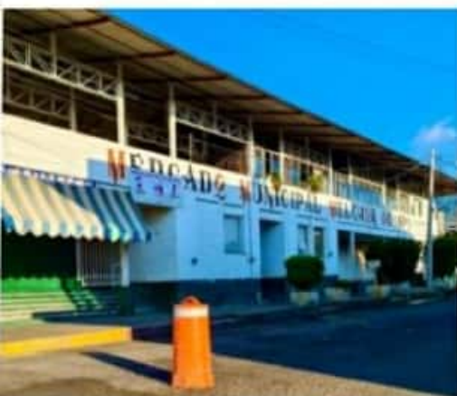
URUAPAN, MICH.- La mayor parte de la población fue precavida en sus compras desde días anteriores y la gran mayoría se quedó en casa.