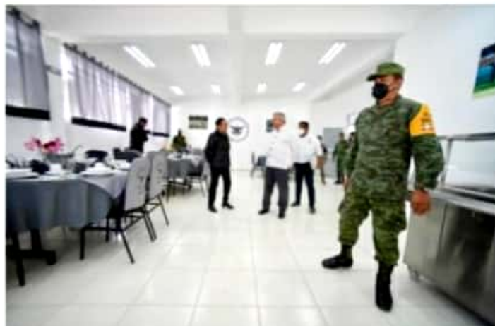
MORELIA, MICH.- AMLO compromete fortalecer la seguridad de Michoacán y el país, pese a diferencias con los gobiernos estatales.

De acuerdo con el Presidente de México, a nivel nacional ya se registra una disminución considerable en los delitos de alto impacto. Con un decremento del 30 por ciento en secuestros y por ciento por robo en general. Respecto a los homicidios dolosos, al inicio de la presente administración la tendencia se mantenía al alza; incidencia que actualmente permanece en Colima, Michoacán, Jalisco, Guanajuato y el Estado de México.