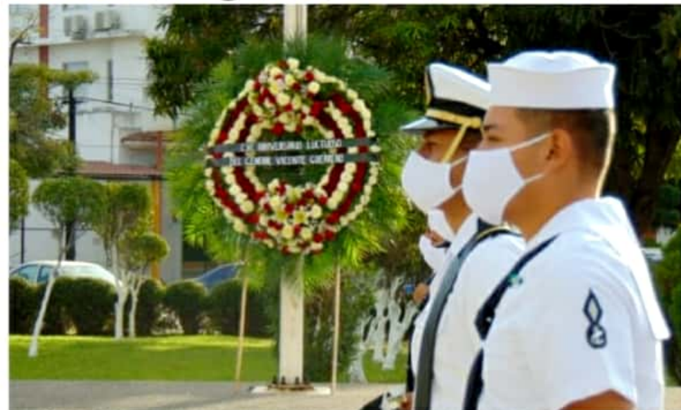
CD. LÁZARO CÁRDENAS, MICH.- Autoridades municipales y militares conmemoraron con un acto cívico, el CXC Aniversario Luctuoso del general Vicente Guerrero, quien fuera destacado insurgente.