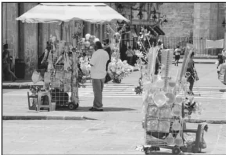
LA PANDEMIA ES UN FACTOR IMPORTANTE EN LOS ÚLTIMOS MESES YA QUE SE PERDIERON MILES DE EMPLEOS FORMALES.

dad para que se genere un círculo virtuoso de que paguen impuestos, de que tengan mejores accesos a créditos, de que tengan personal asegurado", comentó el funcionario estatal.