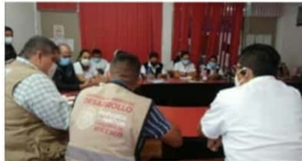
En el seno del comité jurisdiccional de salud se acordó la logística para la aplicación de la vacuna contra el COVID-19 a los adultos mayores.

Está establecida la red de atención »» 4