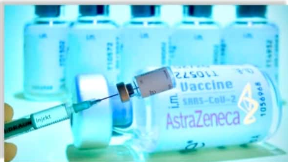
Michoacán recibirá vacunas para inmunizar a adultos mayores.