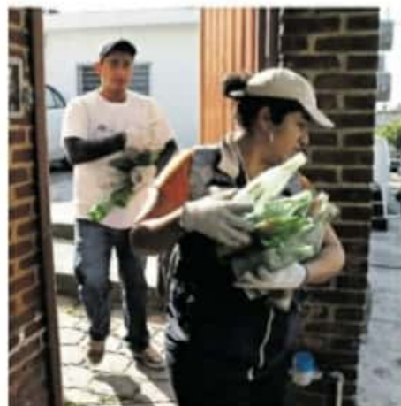
En todas las colonias del municipio se realizarán los trabajos / CUARTOSURIO

La SSP hizo un llamado a denunciar a la línea de emergencias 911 todo acto que atente en contra del bienestar de los michoacanos.