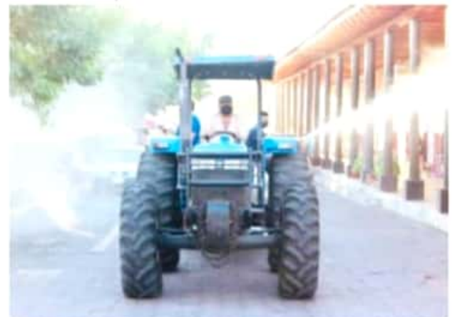
PARÁCUARO, MICH.- En Parácuaro se llevó a cabo una jornada de desinfección en las calles principales, aledaños y banquetas de la cabecera municipal.

Dijo que la prioridad de su gobierno es redoblar esfuerzos para evitar la propagación de la enfermedad, en lugares donde se concentra la gente. El alcalde mencionó que han desinfectado las principales calles del centro histórico, los portales y la mayoría de las calles de la cabecera municipal.