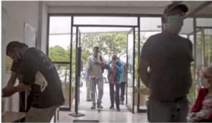
Esquema de vacunación completo. La segunda dosis de la vacuna se aplicará en un lapso de ocho a 12 semanas.

Documentos. Para vacunarse, los adultos mayores deberán llevar su identificación, comprobante de domicilio y, de preferencia, su cartilla de vacunación