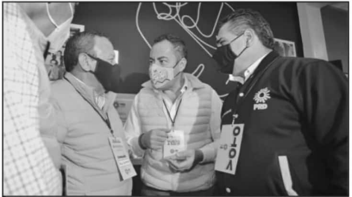
EL EXSECRETARIO DE GOBIERNO QUE ABANDERARÁ LA ALIANZA DEL PRD Y DEL PRI A LA GUBERNATURA, FUE AROPPADO POR JESÚS ZAMBRANO Y SILVANO AUREOLES.

En su mensaje, Jesús Zambrano expresó: "Las elecciones de Michoacán adquieren una importancia de un enorme valor estratégico, Michoacán ha sido, es y seguirá siendo un referente fundamental para el perredismo nacional. Nosotros juntos, ustedes, los dirigentes, militantes y ciudadanía, estamos obligados a ganar los espacios que vamos a disputar".