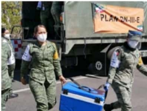
Llegaron a Michoacán 37 mil 250 dosis de AstraZeneca; personal militar se encargó de su traslado.