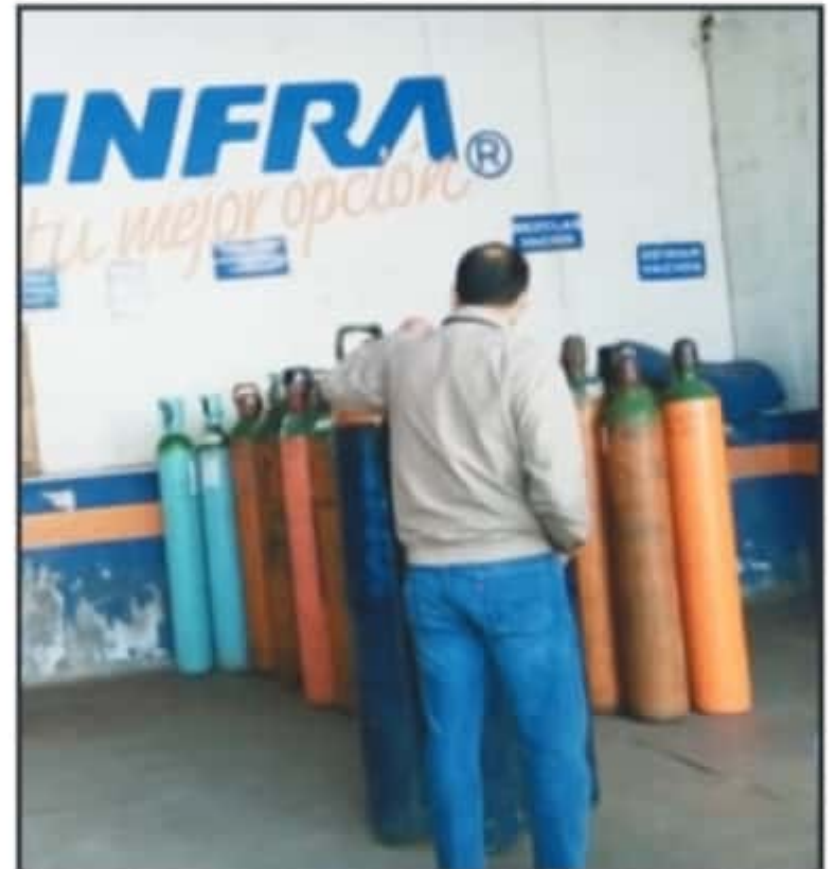
LA PROFECO DESTACÓ QUE PROMOVERÁ LA CAMPAÑA "POR AMOR A LA VIDA, DEVUELVE TU TANQUE" CON EL FIN DE EVITAR MAL USO Y DEVOLVERLOS.