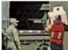
Recepción de las vacunas.

Las autoridades definieron cuáles serán las principales rutas para las dosis anti-Covid que llegarán al país