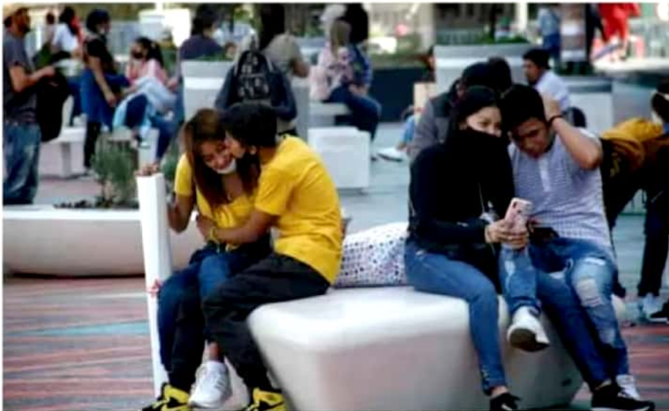
Cuidado. La respuesta inmune es distinta entre pacientes o la inmunidad protectora puede estar incompleta, alertan.