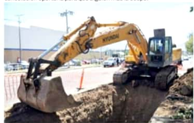
JACONA, MICH.- Con una inversión de más de 2 millones de pesos se avanza en la construcción de Colector Pluvial sobre la Calzada Jacona-Zamora.

El funcionario agregó también la petición para que despachos contables no acaparen las citas y a los contribuyentes les pidió que respeten su cita y en caso de no poder llegar a ella hagan una cancelación oportuna para que alguien más la ocupe.