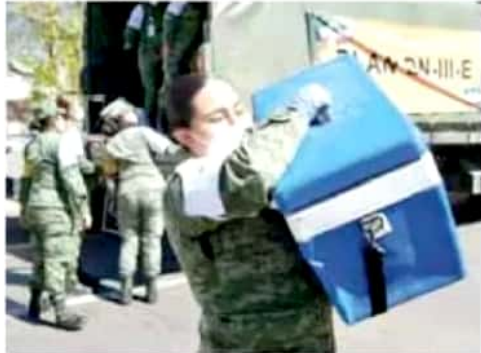
Distribución. Por tierra y aire fueron trasladadas las dosis a los municipios donde se iniciará la vacunación.