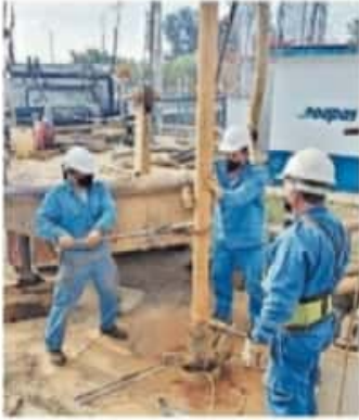
Trabajadores del OOAPAS harán labores de mantenimiento