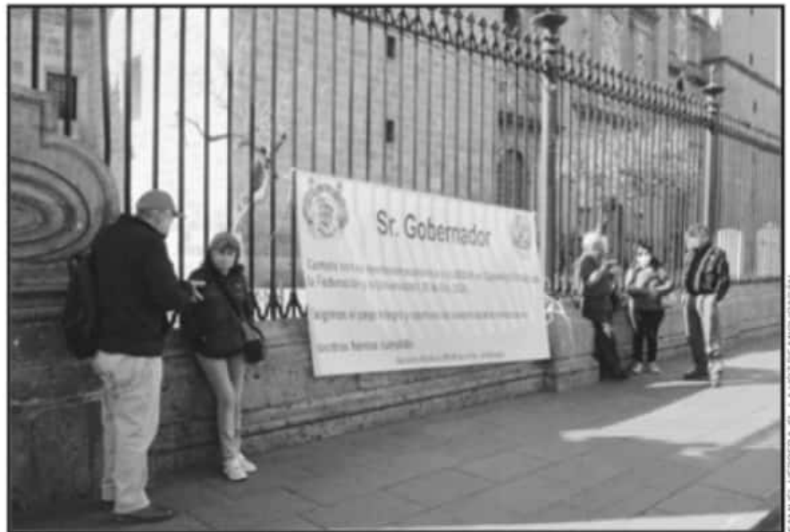
SINDICALIZADOS DE LA UMSNH PREVEN QUE EL EMPLAZAMIENTO A HUELGA PREVISTO SEA PRORROGADO.

75% AGUINALDO les deben a los profesores