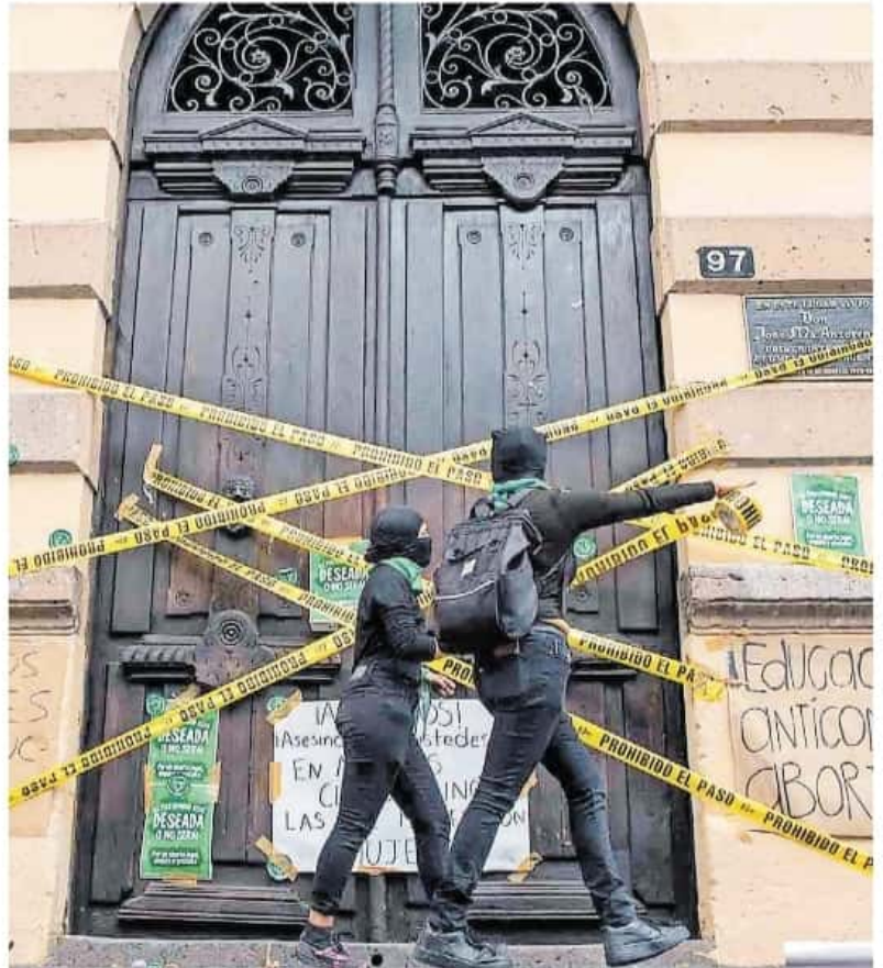
Las feministas ven un propuesta que afectaría también a las mujeres en condiciones marginales

Además, plantea que: "La manifestación de entrega voluntaria durante el embarazo no implica la obligación de la madre a dar en adopción a su hija o hijo una vez nacido. La madre no será presionada,