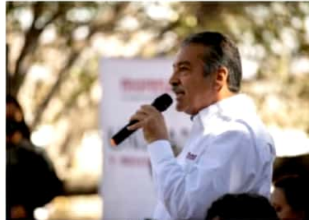
LA PIEDAD, MICH.- Raúl Morón Orozco, en reunión con liderazgos, militantes y simpatizantes del distrito de La Piedad, refrendó que transformar Michoacán en todos sus rincones y brindar a la gente el cambio que demanda, es su objetivo.

El trabajo en equipo, bajo ideales comunes y una visión programática bien definida y alineada al proyecto de nación que encabeza el presidente de México, Andrés Manuel López Obrador, mencionó, son factores importantes que han permitido a su movimiento, sumar adeptos en cada distrito y, aseguró que la responsabilidad es el capitalizar estas ventajas para conseguir el triunfo.