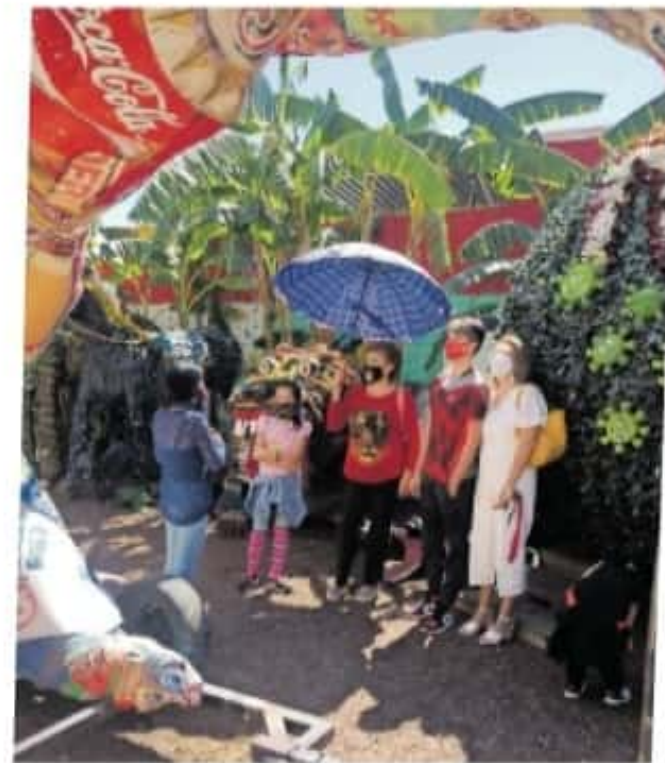
Antes recibían por día de dos a tres escuelas por día

que en estos momentos ya se está trabajando en una nueva escultura que en los próximos meses se mostrará al público y se colocará en uno de los tres escenarios con los que cuenta el museo. El tema que pretenderá abordar será el de la salud.