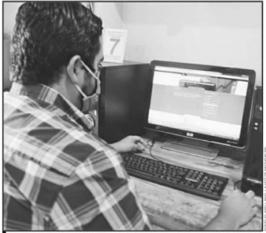
EL SNTE DIÓ SU AVAL AL PLIEGO NACIONAL DE DEMANDAS 2021, QUE POSTERIORMENTE SE ENTREGARÁ A DELFINA GÓMEZ.

Los dirigentes refrendaron su reconocimiento al presidente de la República, Andrés Manuel López Obrador, por su lider