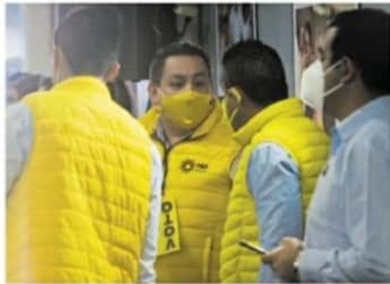
Aprobaron las candidaturas a la gubernatura, diputaciones y ayuntamiento