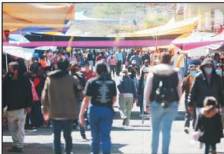
TRAS DIÁLOGO CON TIANGUISTAS, LA DIRECCIÓN DE MERCADOS CEDIÓ PERMISO PARA OPERAR POR SER 14 DE FEBRERO