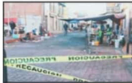
A PRIMERA HORA LOS MERCADOS SOBRE RUEDAS SE ESTABLECIERON Pese A LA NEGATIVA DE AUTORIDADES.