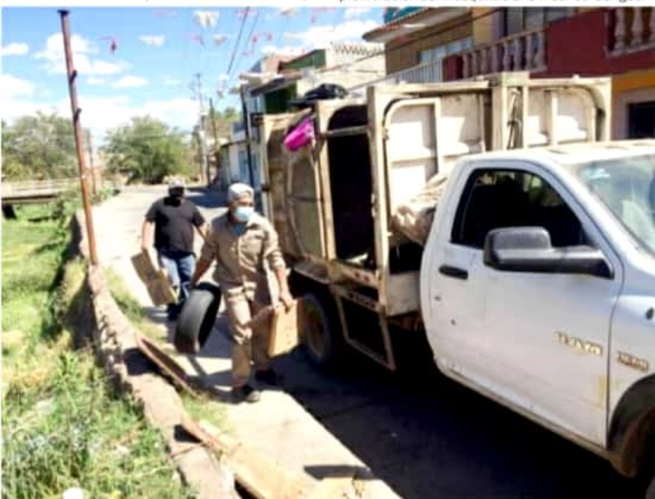
JACONA, MICH.- El gobierno municipal realizó la primera jornada de descacharrización en la colonia Buenos Aires, a fin de evitar la acumulación de cacharros en patios de las casas y evitar la proliferación larvaria del mosquito transmisor del dengue.

Es importante que la ciudadanía haga equipo con el gobierno para que el tema del dengue no rebase las cifras de infectados, ya que la prioridad para el Ayuntamiento es la salud de los ciudadanos y actuando anticipadamente se podrá controlar la proliferación del mosquito transmisor del dengue.