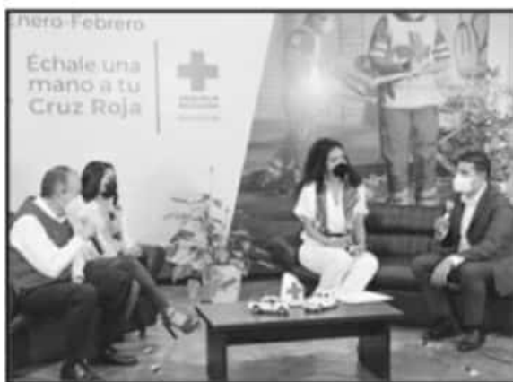
EL CONGRESO DEL ESTADO SE SUMA A LA COLECTA ANUAL 2021 DE LA CRUZ ROJA, LA CUAL SE DETERMINÓ COMO "ÉCHALE UNA MANO A LA CRUZ ROJA".

la protección de las condiciones laborales y salariales de los trabajadores de la educación, inclusive en la crisis provocada por la pandemia". El líder nacional del magisterio cerró la sesión con un reconocimiento a la unidad y solidaridad que mantienen los agremiados del SNTE.