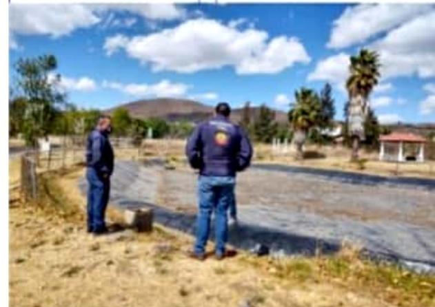
MORELIA, MICH.- En el acceso de Villas del Pedregal se instalará la tercera Estación de Bomberos de Morelia. El objetivo, la atención inmediata a los eventos al poniente de la ciudad.