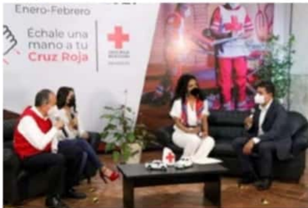
El presidente del Congreso del Estado de Michoacán, reconoció la labor humanitaria que desempeña la Cruz Roja Mexicana a nivel nacional y en Michoacán.

El diputado local manifestó que en esta LXXIV legislatura se ha trabajado por darle mayores garantías a este tipo de instituciones que se dedican a una labor humanitaria y que ayudan a todos sin distinción alguna.