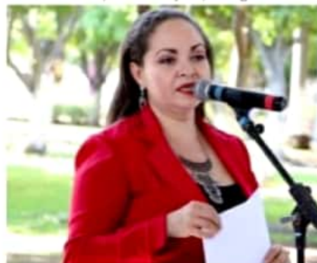
APATZINGÁN, MICH.- El Instituto Municipal del Mujer Apatzinguense amplió la convocatoria para la entrega de la Preselección Amalia Solórzano Bravo.

Expuso que la entrega de la Preselección "Amalia Solórzano Bravo", en un evento que se realizará a puerta cerrada el 8 de marzo de 2021 y se transmitirá a través de la página de Facebook del Instituto Municipal de la Mujer Apatzinguense.