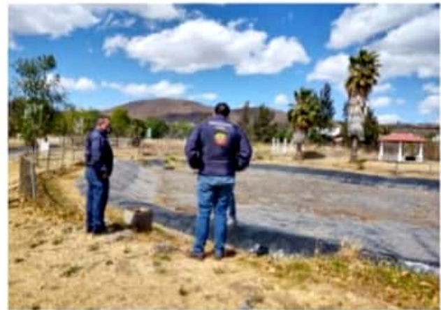
MORELIA, MICH.- En el acceso de Villas del Pedregal se instalará la tercera Estación de Bomberos de Morelia. El objetivo, la atención inmediata a eventos al poniente de la ciudad.