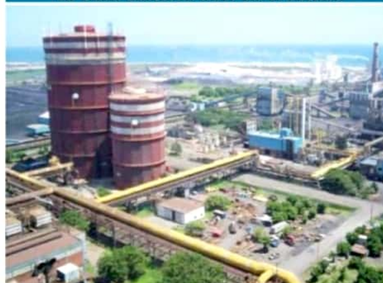
CD. LÁZARO CÁRDENAS, MICH.- Al día de hoy, son tres dueños que ha tenido la aceria de Lázaro Cárdenas, originalmente costada su construcción por la federación, un logro del ya desde entonces expresidente de México, Lázaro Cárdenas del Río que buscaba en la siderúrgica rescatar el mineral de Las Truchas.