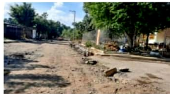
CD. LÁZARO CÁRDENAS, MICH.- Como resultado del convenio de colaboración suscrito entre Congregación Mariana Trinitaria y el gobierno de Lázaro Cárdenas, se alista un programa de pavimentación en e

Es de aclarar que Congregación Mariana Trinitaria es una agrupación sin fines de lucro que opera programas alimentarios de materiales, migración, entre otros, en coordinación con autoridades de gobierno.