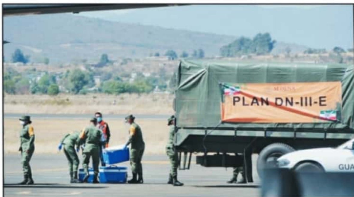
EN MICHOACÁN EL PLAN DE VACUNACIÓN EN CONTRA DE LA COVID-19 INICIARÁ EN 25 MÓDULOS DE 7 MUNICIPIOS, CON A VACUNA ASTRAZENECA.

Sin embargo, el esquema ha generado polémica, pues se atenderá primero las comunidades más alejadas, lo que significa la que menos movilidad presentan y que, de acuerdo con los mismos análisis epidemiológicos de las autoridades sanitarias, presentan una cantidad mínima de casos activos y un menor riesgo de conta-