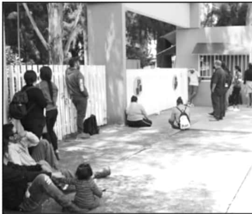
LUEGO DE DOS SEMANAS PARALIZADAS LAS UNIDADES DE LA UPN, ESTE LUNES SE REANUDARÁN LAS ACTIVIDADES

recontratación de personal docente interino en el semestre que recién inicia.