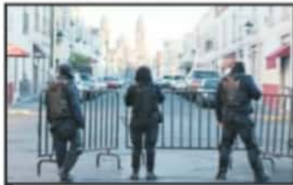
ELEMENTO DE LA POLICÍA RESGUARDARON ALGUNAS CALLES PARA EVITAR QUE LOS PUESTOS SE PUSIERAN

De acuerdo con datos de la Dirección de Mercados de la Secretaría de Servicios Públicos Municipales, los líderes tianguistas mantuvieron una reunión con autoridades estatales y municipales en las que se concedió permiso para que laboraran este 14 de febrero cumpliendo medidas como mantener una ocupación menor al 50 por ciento, reducir el número de entradas a la zona de venta, seguir un uso obligatorio de cubrebocas y guardar mayor distancia