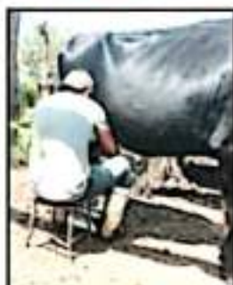
TRABAJO SE HACE RUSTICAMENTE