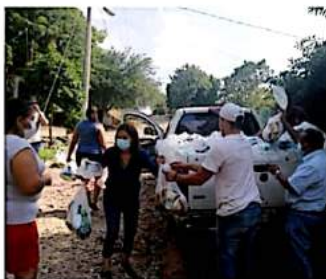
CD. LÁZARO CÁRDENAS, MICH.- Para ayudar a familias afectadas por las recientes lluvias, por tercera ocasión en este municipio se hizo entrega de 500 despensas en distintas colonias y comunidades.