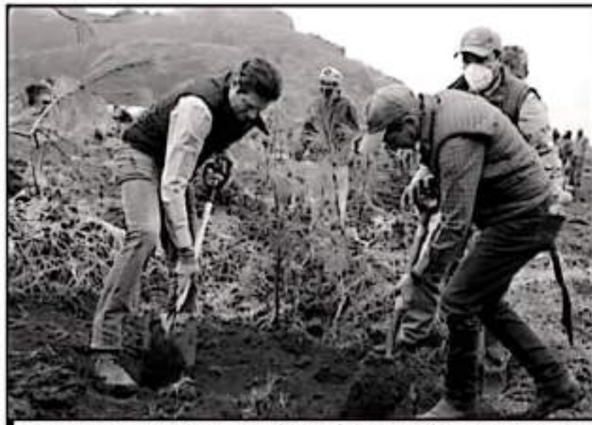
EL PRESIDENTE MUNICIPAL, ALFONSO MARTÍNEZ, INICIÓ LA CAMPAÑA DE REFORESTACIÓN EN ÁREAS VERDES DE MORELIA.

ciones que se intensen en realizar acciones de restauración y reforestación puedan producir su propia planta y con ello fomentar la conservación de la biodiversidad forestal de Michoacán", manifestó el funcionario estatal en el arranque de la jornada de reforestación 2021.