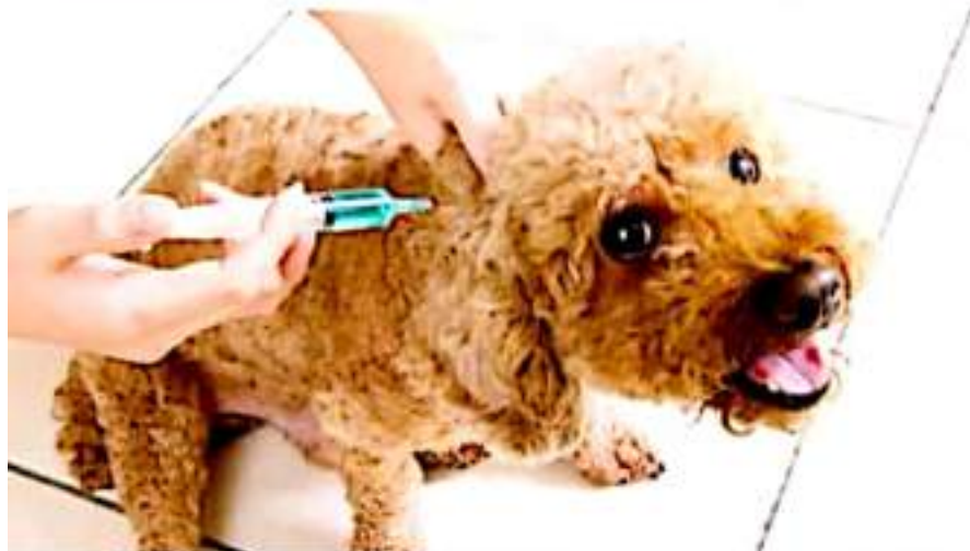
APATZINGÁN, MICH.- De acuerdo a la información brindada, las metas son de 11 mil 500 vacunas durante la próxima semana, por lo que también trasladarán el servicio a las tenencias y comunidades del municipio.

Las autoridades destacaron que quienes desean vacunar a sus mascotas, deben acudir al puesto de vacunación con cubrebocas y respetar la sana distancia.