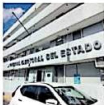
Se acumularon dos meses y medio sin depósitos de la SAF.

Lo que corresponde al presupuesto del 2021 ya tiene hasta el momento un adeudo importante que se vislumbra pueda extenderse al 30 de septiembre, a decir de diversos trabajadores, tal como le sucede al Poder Judicial.