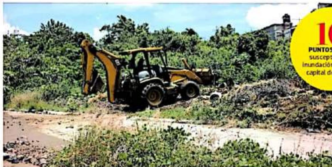
En Morelia también hay zonas con fallas geológicas, proximidad de líneas de alta tensión y vas ferreas. / IAN AGUIAR