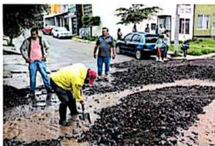
En 2018 se registró un deslave en fraccionamientos desarrollados a las faldas del cerro del Quinceo.

El funcionamiento municipal destacó que en riesgo de deslave se identificaron las