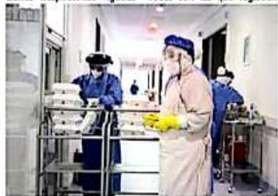
Reporte la SSM ocupación del 52.85% camas COVID en LC.

Se mantiene a disposición de la ciudadanía la línea 800-123-2890, en la que se brinda orientación sobre COVID-19, así como la referencia a las unidades médicas más cercanas con disponibilidad para atención de pacientes con complicaciones respiratorias.