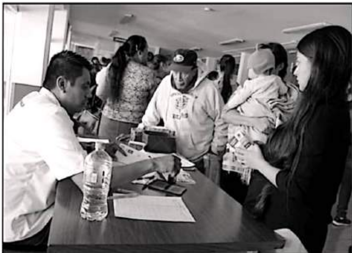
ASISTENTES DEL CENTRO DE SALUD LEAMAN A LA CIUDADANA A REESTABLIR CUIDADOS ANTE EL AUMENTO DE ENFERMEDADES POR EL TIEMPO DE Lluvias.

Incluso, existe otro riesgo que se refiere a la proliferación de mosquitos transmisores del