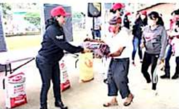
URUAPAN, MICH.- La diputada local entregó esta semana apoyos a familias que habitan en la zona oriente, que resultaron más perjudicadas con las recientes lluvias.