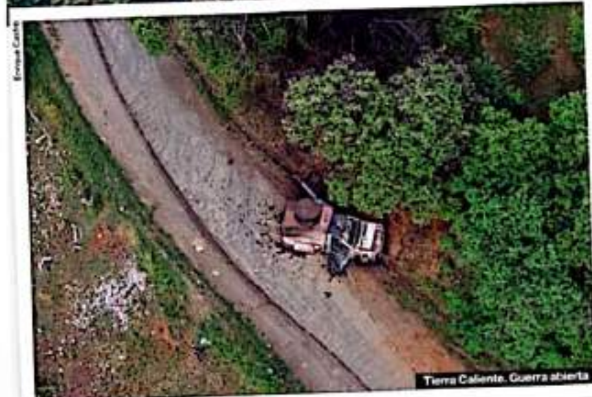
Tierra Caliente. Guerra abierta

En efecto, para apoderarse de este municipio de más de 42 mil habitantes —según el censo 2020—, el CJNG viene avanzando en círculos concéntricos, cuyo núcleo central es la cabecera municipal, a donde llegan la mayor parte de los despla-