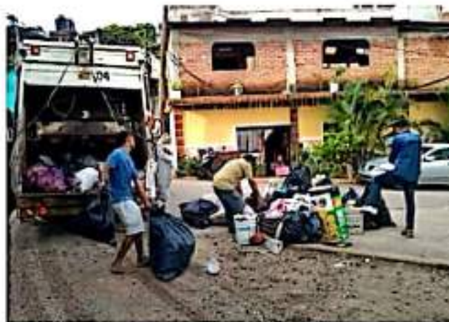
CD. LÁZARO CÁRDENAS, MICH.- Personal del departamento de Aseo Público realizan trabajos arduos en la recolección de basura en distintas colonias del municipio.