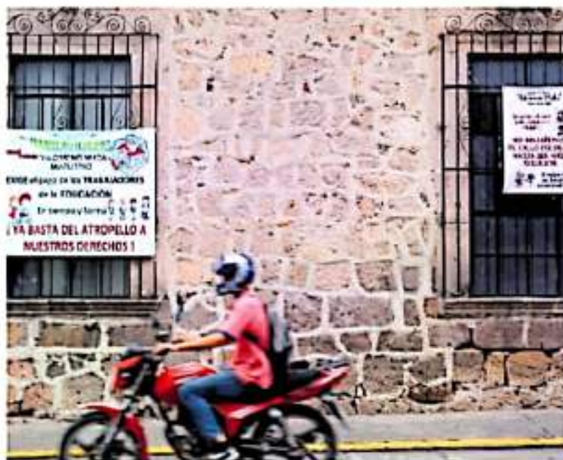
A la fecha no se ha bajado el recurso para pagar a los maestros