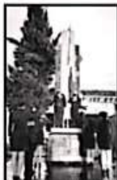
LA BANDERA PERMANECIÓ A MEDIA ASTA EN URUAPAN.