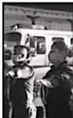
EN SER PRIMERA HERIA SE REALIZAN GRUPOS DE RESCATE.

Estas actividades se llevaron a cabo en el marco del Día Nacional de la Protección Civil, que recuerda a la población estar mejor preparados para enfrentar una contingencia derivada de la fuerza de la naturaleza, con el esfuerzo a que las corporaciones de auxilio presentes replaquen este mensaje.