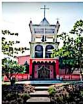
El templo de El Bejuco no fue dañado

El religioso afirmó que son miles los desplazados de pequeñas localidades en el municipio, quienes han buscado refugio en