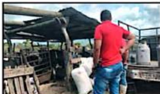
LA PRODUCCIÓN LECHERA ENFRENTA UNA DIFÍCIL SITUACIÓN EN JUQUPAN