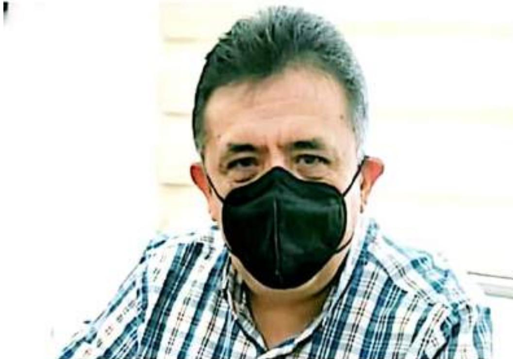
APATZINGÁN, MICH.- Es que tanto el gobierno municipal como la Jurisdicción Sanitaria, hacen un esfuerzo de responsabilidad social y colectiva, para concientizar a la población.

Esto ya provocó que quienes habitan en el fraccionamiento se manifestaran y destacaran, a pesar, a través de pancartas y bloqueos a la carretera en espera de una solución, en tanto, decidieron tomar acciones por sus propias manos para evitar que sus casas se sigan inundando.