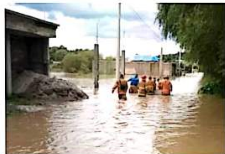
FOTO HISTORIA Lluvias causan afectaciones en 300 casas en Maravatío

Agregó que también El Aguaje, Charo, El Limón entre otros, se han visto afectados. MARCO SANTO