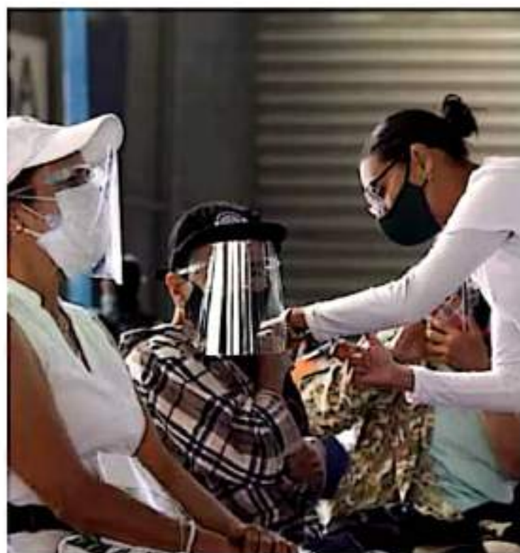
Vacunas. La factura para inmunizar a la población se disparó 42.23%, y México todavía debe 44% de los 50 mil mdp que costarán los biológicos, reveló la Secretaría de Hacienda.

dosis, que permitirían inmunizar a 116 millones de personas en nuestro país.