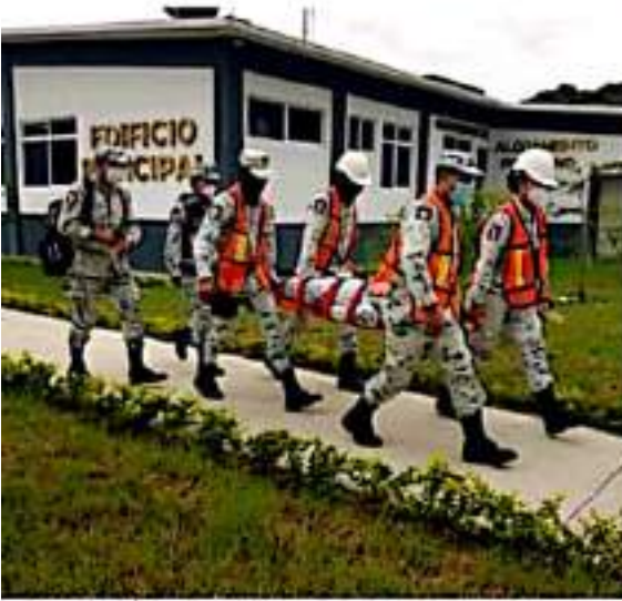
CD. LÁZARO CÁRDENAS, MICH.- Este domingo se realizó el segundo mega simulacro nacional, para conmemorar los 36 años del terremoto de 1985 y 4 años del terremoto de 2017.

Durante el simulacro nacional, también participaron varias dependencias, entre las que destacan la Guardia Nacional y la Secretaría de la Defensa Nacional (Sedena), quienes iniciaron en el horario establecido la evacuación de sus instalaciones.