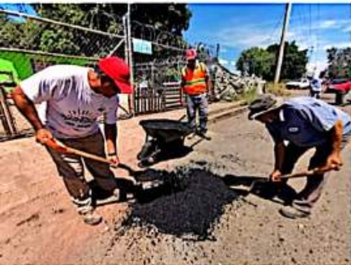
ZAMORA, MICH.- Los trabajos que se realizan serán continuos para evitar un mayor deterioro de la cinta asfáltica y de esta manera hacer más fácil la circulación de los automóviles.

El funcionario municipal señaló que cuentan con el material suficiente para poder realizar acciones de bacheo de manera permanente en toda la ciudad y con esto atender de manera oportuna al llamado que han realizado los zamoranos.