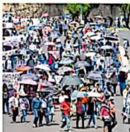
Se exhorta a la ciudadanía a tomar precauciones / AGO MENDOZA

Se han constituido más de 8 mil 75 Comités de Participación en Salud Escolar y se han brindado capacitaciones a 237 mil figuras educativas en materia de protocolos para la nueva convivencia, cuidado de la salud y prevención de contagios en los centros escolares, entre docentes, directivos, madres y padres de familia.