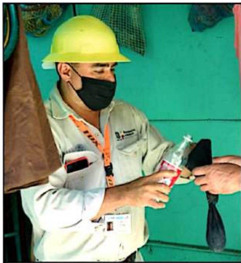
EL DENEGUE SE PUEDE EVITAR SI SE APLICAN LAS MEDIDAS PARA ELIMINAR LOS CRÁTEROS DE MOSQUITOS EN CASA

En caso de declararse el brote epidémico, no existe en el municipio la infraestructura necesaria en el Sector Salud por lo que los infectados tendrían que ser trasladados a Zamora o La Balsa, en el estado de Jalisco ya que, incluso, el Hospital Regional de Sahuayo en la actualidad se encuentra saturado a más de que la mayoría de las acciones y recursos tanto humanos como de insumos están destinados a atender la pandemia de COVID-19 aunque son pocos los casos que se han confirmado.