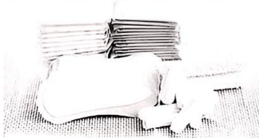
ARCHIVO LA VOZ DE MICHOACÁN