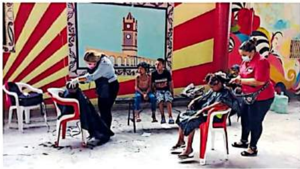
El DIF municipal implementó talleres para los desplazados de las rancherías