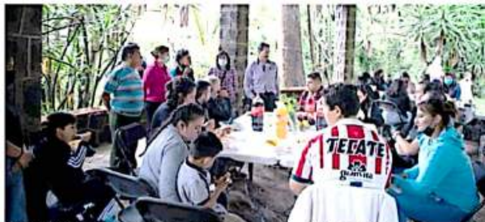
URUAPAN, MICH.- Comerciantes del Interior del Parque Nacional "Barranca del Cupatitzio" y autoridades municipales se reunieron para acordar trabajar coordinadamente en la solución a los problemas que les atañen a ambos.