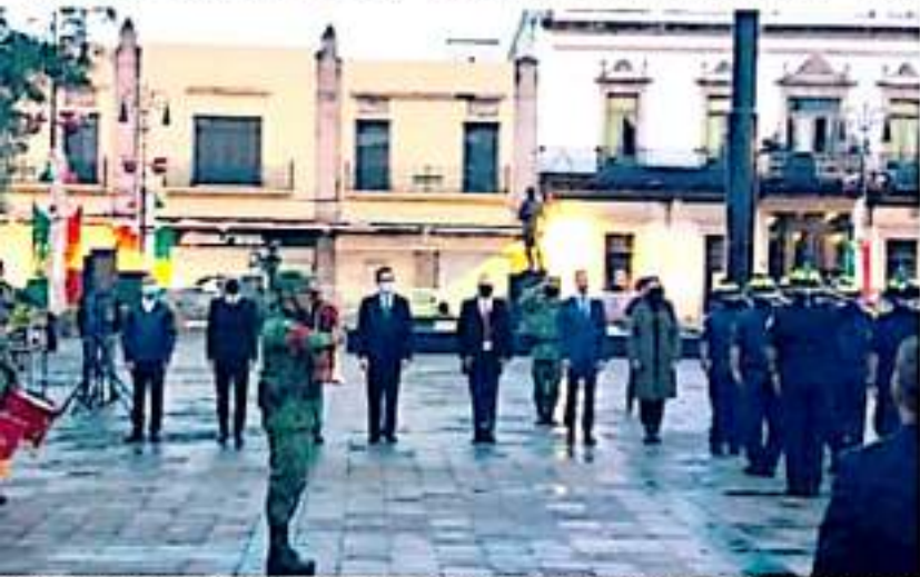
MORELIA, MICH.- Las autoridades de los tres niveles de gobierno, conmemoraron a las víctimas de los sismos de 1985 y 2017 en ceremonia solemne en esta capital.

víctimas de los sismos ocurridos en 1985 y 2017, asimismo homenajearon a los rescatistas que participaron en esta contingencia.