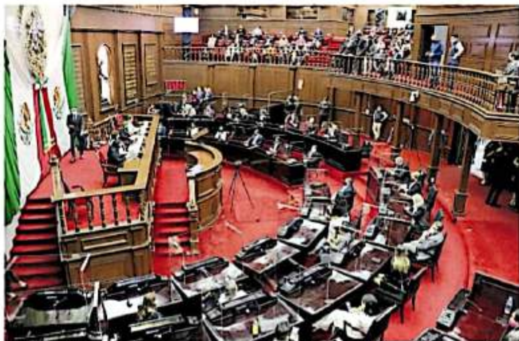
La distribución de servicios parlamentarios, finanzas, contraloría, comunicación social, biblioteca deben ser antes del 15 de octubre.