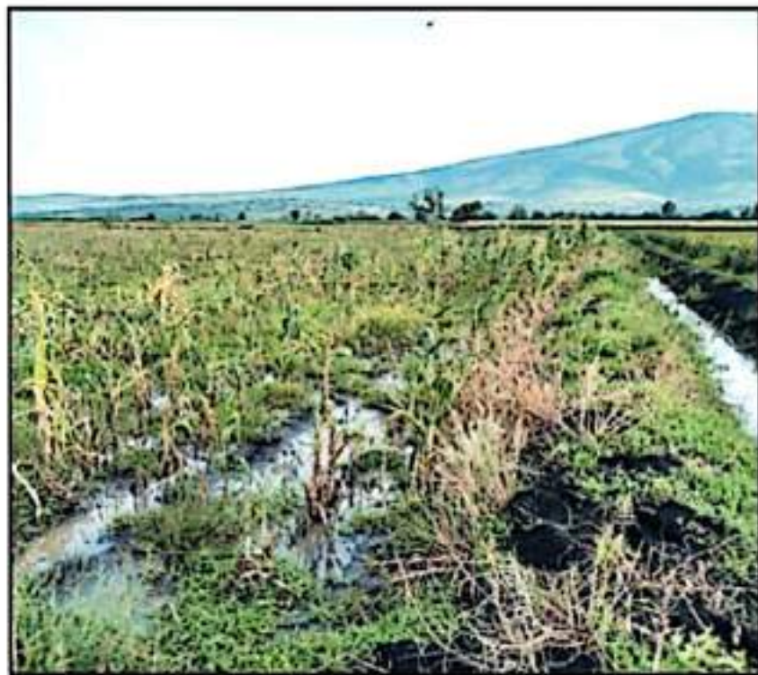
En los terrenos de siembra, ya se ven los encharcamientos que pueden afectar la producción este año

En lo que respecta al municipio de Sahuayo, se reactivan los protocolos de atención a través de la Comisión Intersectorial, que aglutina a varias dependencias municipales y representaciones estatales y federales, además de asociaciones civiles, para comenzar con los trabajos de travesa del exceso de aguas a la Laguna de Cha-