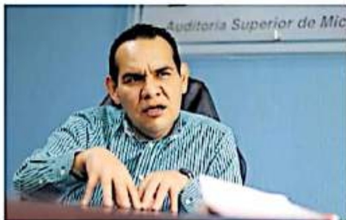
No todos los ayuntamientos demuestran ante la ASM los pendientes financieros que heredan.