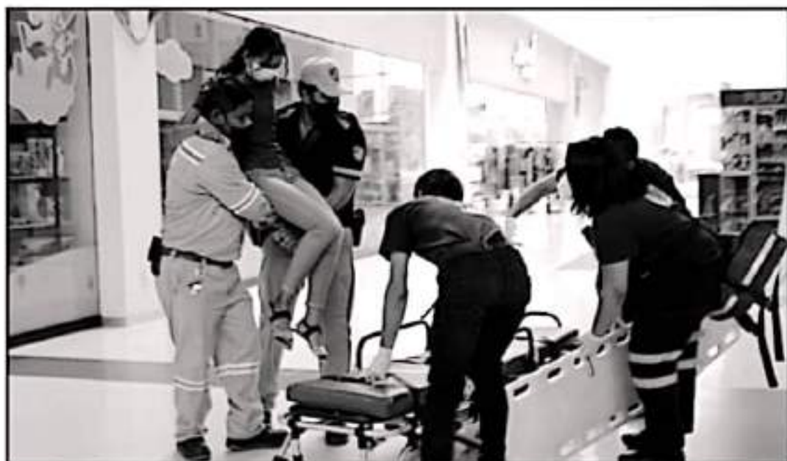
EDUARDO PARTI DE LA CONVOCATORIA DE LOS SISMOS DE 1985 Y 1997. EL PUERTO MICHOACANO REALIZÓ VARIAS ACTIVIDADES PARA FOMENTAR LA PREVENCIÓN.

los trabajadores de la super tienda quienes les indicaban colocarse en el punto de reunión lo que muy pocos clientes hicieron.