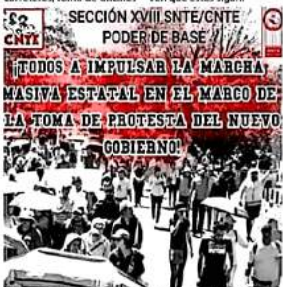
CNTE alista manifestaciones en contra del gobierno de Alfredo Ramírez Bedolla, una vez que este tome posesión el próximo primero de octubre.

lizaciones como bloqueo de carreteras, toma de oficinas y marchas masivas, y prevén que estas sigan.