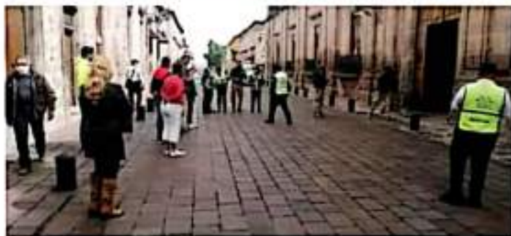
Alerta. Se conmemoraron aniversarios de los sismos de septiembre de 1985 y 2017. JARED AYALA

En el Centro Histórico de Morelia, la mañana de este