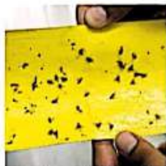
Los tiraderos propician la plaga de la mosca de vinagre / ERIKA AGUILAR

Sumado a las lluvias en fechas anteriores, es frecuente nutrirse los riesgos de plaga por mosca de vinagre que emerge del manejo de los desechos de mango y alimentos procesados como el brócoli, desperdicios que no siempre son reciclados en los rellenos sanitarios y terminan en lotes baldíos.