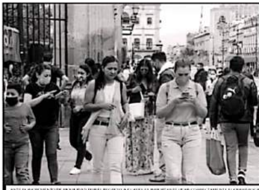
ANTE EL AUMENTO DE MOVILIDAD POR EL REGRESO A CLASES ES IMPORTANTE LEER CORRECTAMENTE EL EMBUDOCA.

tevan entre 70 y 79 años, con mil 661 decesos.