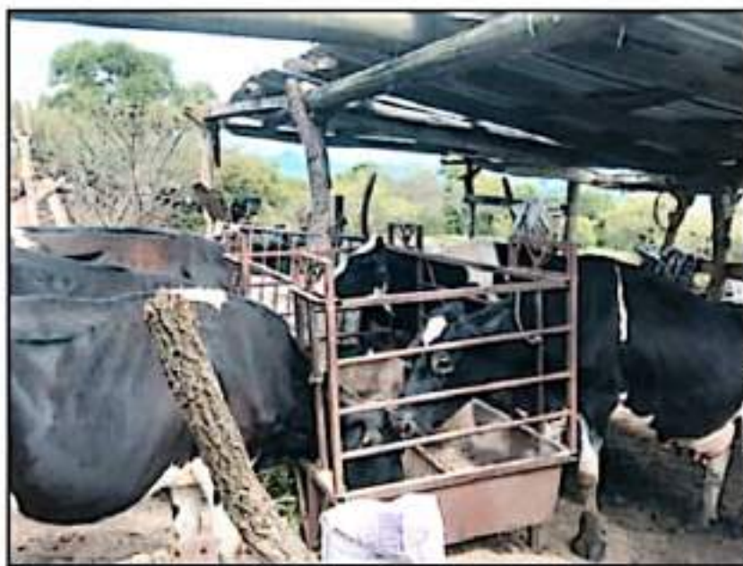
EL MANTENIMIENTO DE LOS ANIMALES RESULTA, A VECES, MÁS CARIOSO QUE LA PRODUCCIÓN OTENIDA, DICEN GANADEROS

120-SSA-1993", de hecho, esta revisión arrojó la existencia de puntos críticos que podrían representar riesgos para la salud del consumidor.