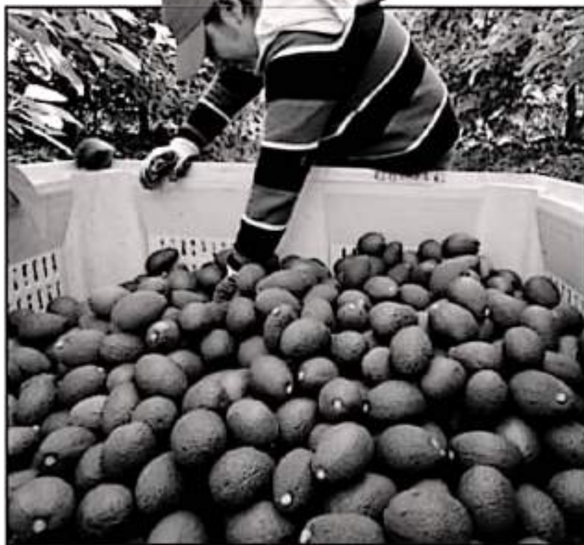
EN MICHOACÁN HAY 44 MUNICIPIOS CERTIFICADOS SANTARÁBAMBI, ENTÓ POR AUTORIDADES MEXICANAS Y EUA.

De acuerdo con lo reportado por el USDA, a través de su representante en México, en las violaciones estuvieron involucradas las empacadoras Uruapan Produce, Acopora y Aguacates Campos Sano y La Bonanza, esta