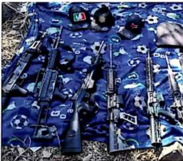
Histórico. De 2012 a la fecha van cerca de 9 mil averiguaciones por violación de la Ley Federal de Armas de Fuego.