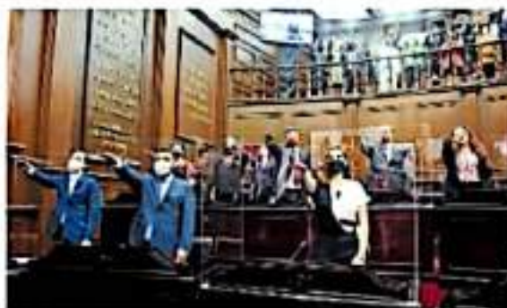
La coalición PAN-PRD-PRD presidirán un año la Mesa Directiva

Pese a que Morena perdió curules tres periodos de la legislatura pasada, y su alianza con el Partido del Trabajo cobró suma 15 diputados, ya busca encabezar la Junta de Coordinación Política frente a las 21 dipu-