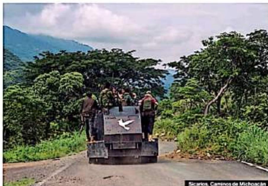
Sicarios. Caminos de Michoacán

Tan sólo en la cabecera de Coalcomán, el religioso tiene registrado el arribo de más de 230 familias, provenientes principalmente de localidades como Las Nueces, Las Parotas, El Aguacate, Los Laureles, Ticutlucan, La Limonera, El Puerto de las Cruces, Las Rosas, Piedras de Lumbre, El Salitre, Las Pilas, Maruata y Masuatilla.