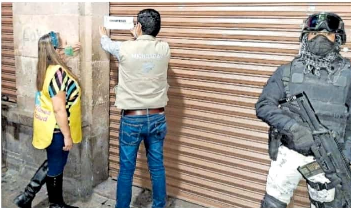
Este fin de semana, Guardianas de la Salud clausuraron algunos locales en Morelia.

Michoacán les solicitaron que se colocaran el cubrebocas, pero se negaron a utilizarlo, indicó la SSP.