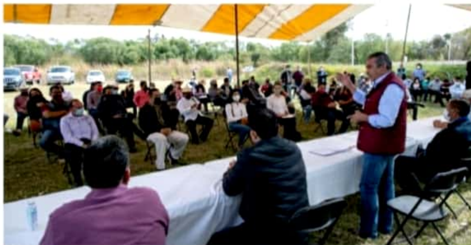
MARAVATÍO, MICH.- Raúl Morón, se reunió con liderazgos de las mencionadas regiones, a quienes les recalco la importancia de trabajar para alcanzar el máximo objetivo.

Indicó, que las elecciones de este año son un impulso fundamental para la Cuarta Transformación, por lo cual el trabajo a realizar a nivel territorial debe ser intenso, para refrendar ante la población los ideales y valores que la rigen y que con su aplicación en Michoacán, se dará una solución a sus causas, además del combate a la corrupción y la impunidad. En consenso, los liderazgos expresaron su confianza en que Raúl Morón es el perfil adecuado para gobernar la entidad y generar el desarrollo que demandan los michoacanos y afirmaron su redoble de esfuerzos para que esta estrategia sea conocida y compartida por toda la sociedad.