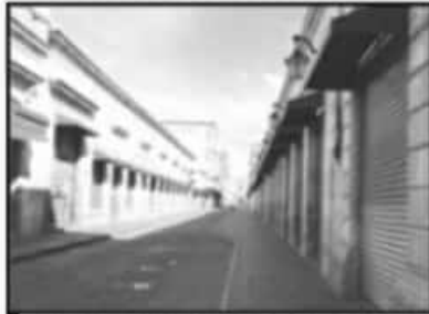
LOS NEGOCIOS DEL CENTRO BAJARON CORTINAS.

En esta concurrida zona de la capital, únicamente se observó el incumplimiento de algunos establecimientos pequeños en calles laterales, así como unos cuantos vendedores ambulantes, que ofrecían papas fritas, cubrebocas u otros productos a través de carritos, rejillas o tendidos sobre la avenida Lázaro Cárdenas. Sin embargo, tan solo se contaban unos cuantos peatones que se de-