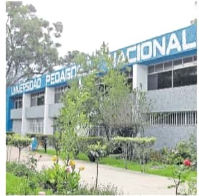
Los profesores no regresarán a las aulas hasta que se reparen ciertas negligencias

Sin embargo, en noviembre pasado la Dirección de Gestión de Personal y nómina se negó a procesar los contratos