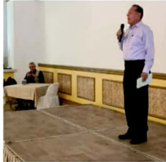
CD. LAZARO CÁRDENAS, MICH.- Dos planillas independientes para presidencia municipal y dos de diputación local, fueron las aprobadas por el IEM, en sesión extraordinaria.

A partir de ahora, los aspirantes deberán iniciar con el proceso de recolección de firmas ciudadanas. Preciso el IEM, que tendrán que reunir del 24 de enero al 12 de febrero, un total de 2,775 firmas.