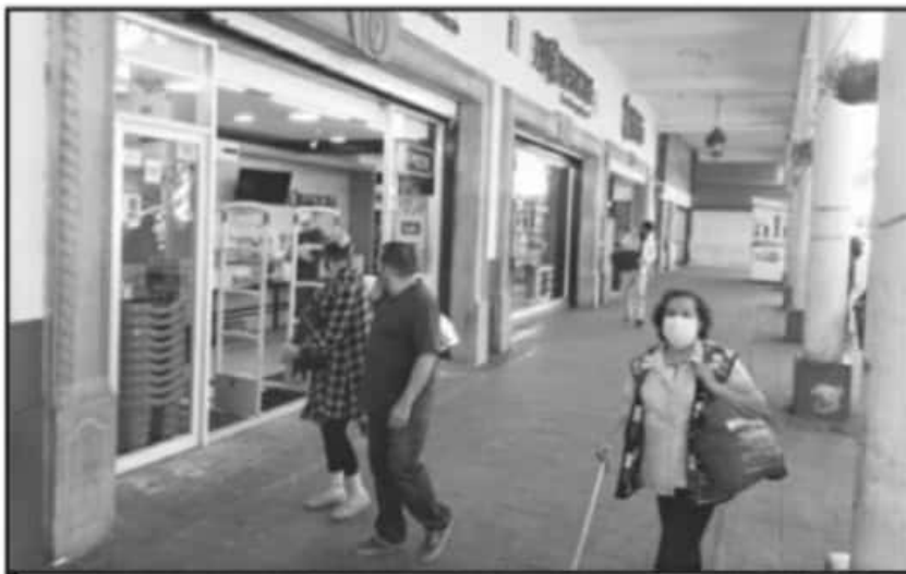
A DIFERENCIA DE LA SEMANA PASADA, ESTA VEZ BASTANTES COMERCIOS MANTUVIERON LAS CORTINAS ARRIBA.

18 MIL negocios hay en todo el municipio