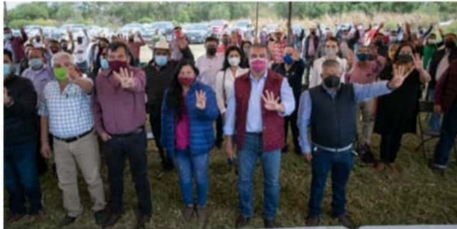
El coordinador estatal en Defensa de la Cuarta Transformación, refrendó que su objetivo es llevar a buen puerto las causas sociales y priorizar el desarrollo de Michoacán.