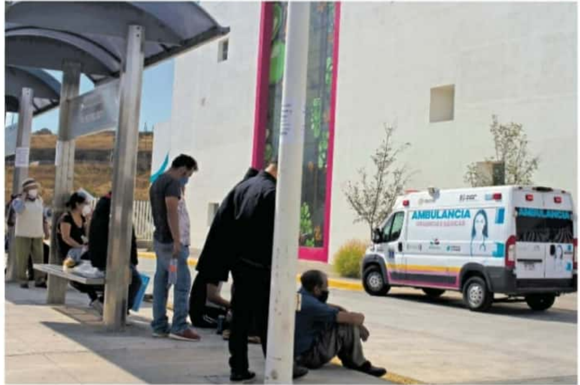
El Hospital del Instituto Mexicano del Seguro Social (IMSS) de Charo reportó un 85 por ciento. RADIO JIMÉNEZ

nos, mientras que, en el municipio de Ario de Rosales, el Hospital IMSS Bienestar está en 89 por ciento; región occidente encabeza la lista el municipio de Apatzcingán con dos hospitales (ISSSTE y Militar, el primero tiene 86 y el otro 75 por ciento), de acuerdo con los datos de la Red de la SSa.