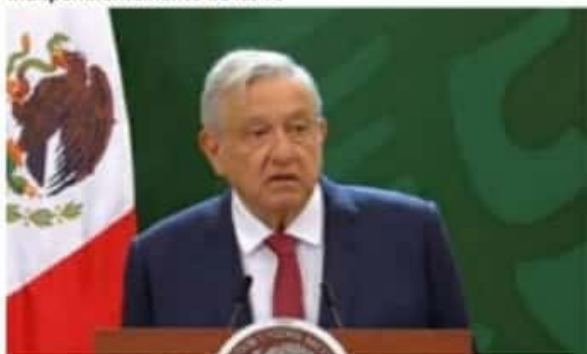
El presidente AMLO informó ayer que dio positivo a COVID-19, aunque dijo, tenía síntomas leves y ya estaba siendo atendido médicamente.

López Obrador no usa cubrebocas en sitios públicos y sólo se le ha visto llevarlo cuando viaja en avión. (Con información de Quadratin y El Universal Online).