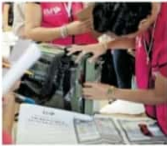
Prep publicará resultados a las 20:00 horas del domingo 6 de junio