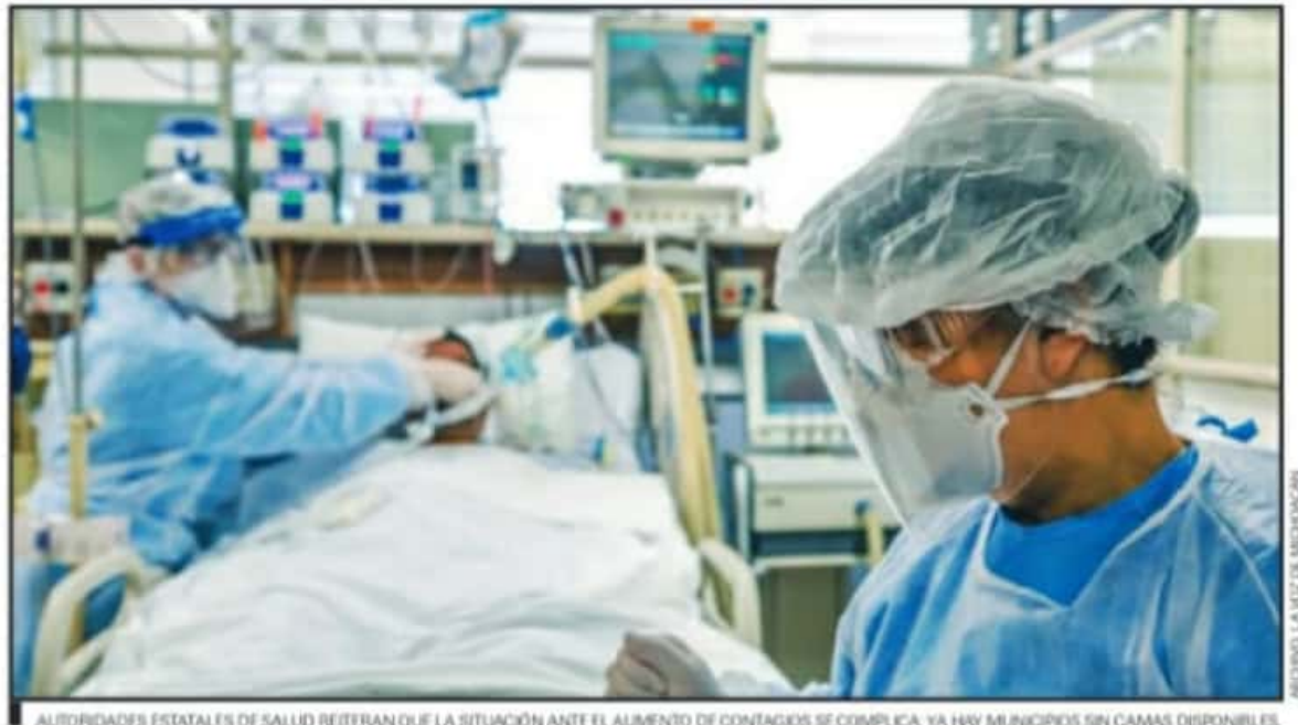
AUTORIDADES ESTATALES DE SALUD REITERAN QUE LA SITUACIÓN ANTE EL AUMENTO DE CONTAGIOS SE COMPLICA, YA HAY MUNICIPIOS SIN CAMAS DISPONIBLES.

“El total de las camas reconvertidas para la atención de Infecciones Respiratorias Agudas Graves (IRAG) de este nosocomio se encuentran totalmente ocupadas, por lo que se exhorta a la población a llamar al 911 o al 800 123