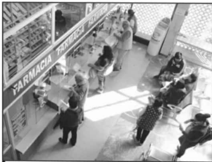
LA FALTA DE MEDICAMENTOS ES OTRA DE LAS PROBLEMÁTICAS QUE SE ENFRENTA EN PLENA PANDEMIA.