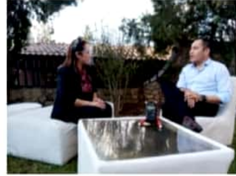
MORELIA, MICH.- El precandidato del PRD y PAN a la gubernatura afirmó que hoy lunes se presentará también ante el CEN del PRI.

Por el presidente de México, López Obrador, expresó respeto y anticipó que, de llegar a ser gobernador, buscará conciliar con el mandatario, encontrando "lo que nos une".