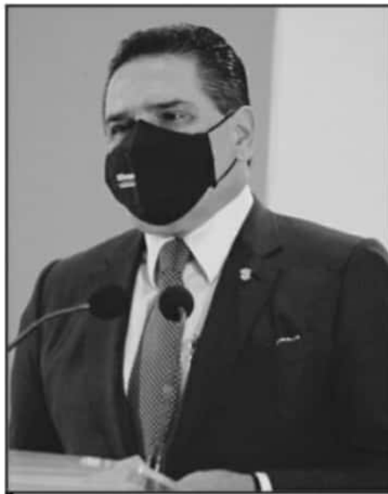
SE ACABA LA ERA DE SILVANO AUREOLES, EL GOBERNADOR QUE RECUPERÓ MICHOACÁN PARA EL PARTIDO DE LA REVOLUCIÓN DEMOCRÁTICA.

Silvano Aureoles Conejo es hoy el último y único gobernante del PRD en una época de transformación, el primer triunfo del PRD fue en el Distrito Federal, Cuauhtémoc Cárdenas superó el 40 por ciento de los votos, fue el primer jefe de Gobierno de la ciudad electo democráticamente; ese mismo año en el Congreso de la Unión el PRD se colocó como la segunda fuerza política por de-