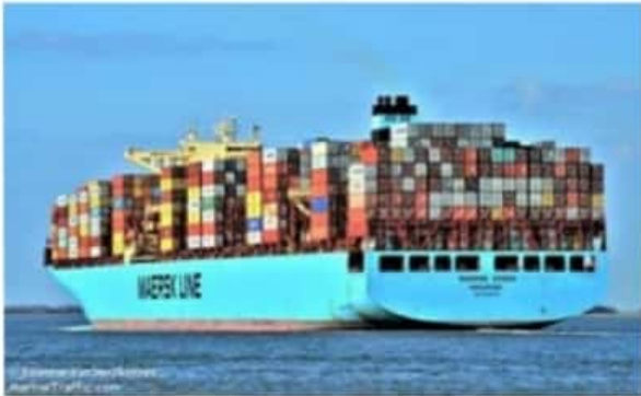
Tras perder unas 750 por fuertes marejadas, en alta mar, donde actualmente nave, el carguero Maersk Essen, arribará a LC el 29 de enero, mide 366.45 de largo y tiene capacidad para poco más de 13 mil contenedores.