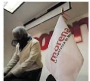
Morena buscará reconstruir el convenio de coalición con el PT / ARCHIVO

Si se llegase a considerar la propuesta de Morón, explicó, "un candidato del PT podrá representar a Morena, y viceversa", con base en los resultados se reordenará la distribución de candidaturas en la coalición "Juntos Haremos Historia".