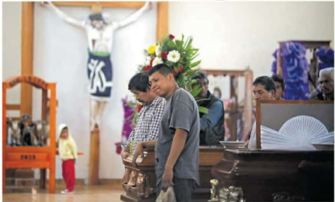
Cuatro personas fallecidas; el derecho humano a la vida fue violado.