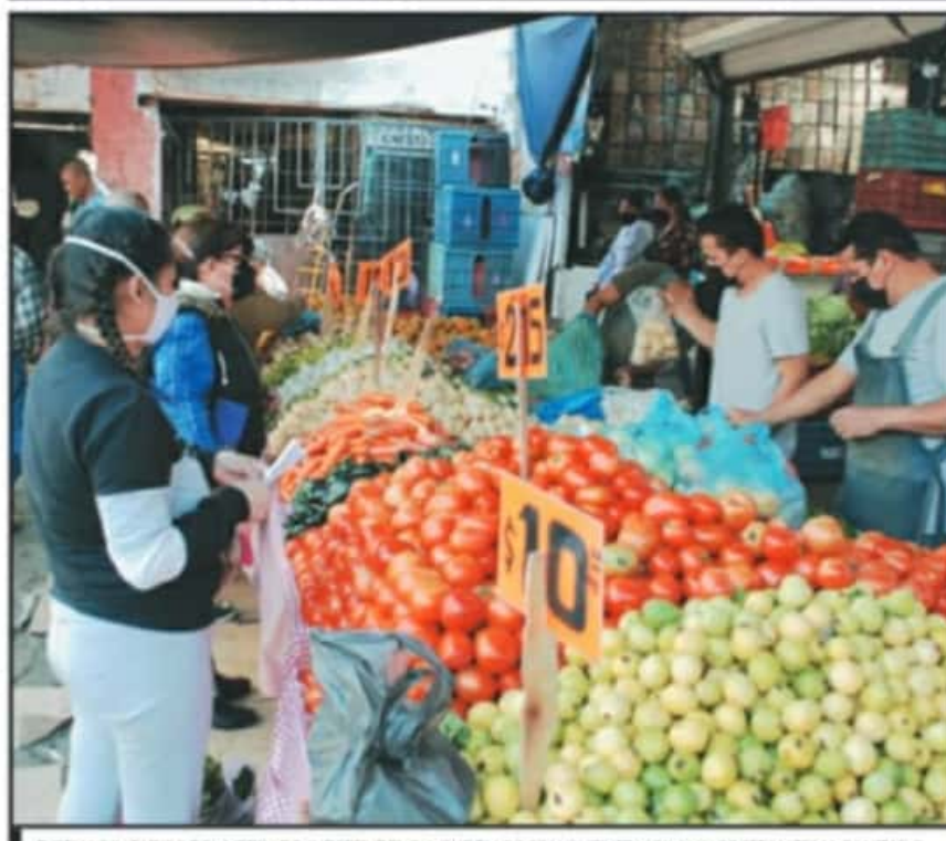
DICEN LOCATARIOS DEL MERCADO INDEPENDENCIA QUE ELLOS SON QUIENES VIGILAN Y COSTEAN TEMA SANITARIO.