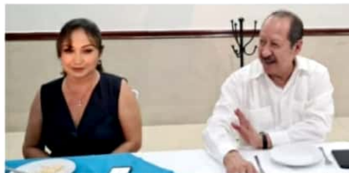
CD. LÁZARO CÁRDENAS, MICH.- El exgobernador Leonel Godoy Rangel, manifestó interés por debatir desde la Cámara de Diputados con los expresidentes Felipe Calderón y Vicente Fox Quesada.