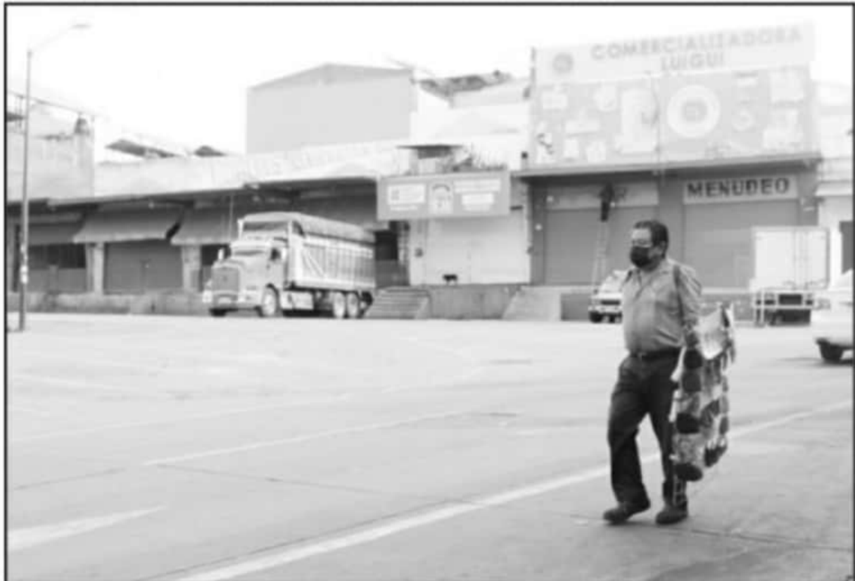
POR PRIMERA OCASIÓN, LA CENTRAL DE ABASTOS DE MORELIA ACATÓ LA RECOMENDACIÓN Y EN DOMINGO, UN DÍA DE PLAZA, SE VIO SIN ACTIVIDAD COMERCIAL.

tenían a observar cuando algún producto les interesaba.