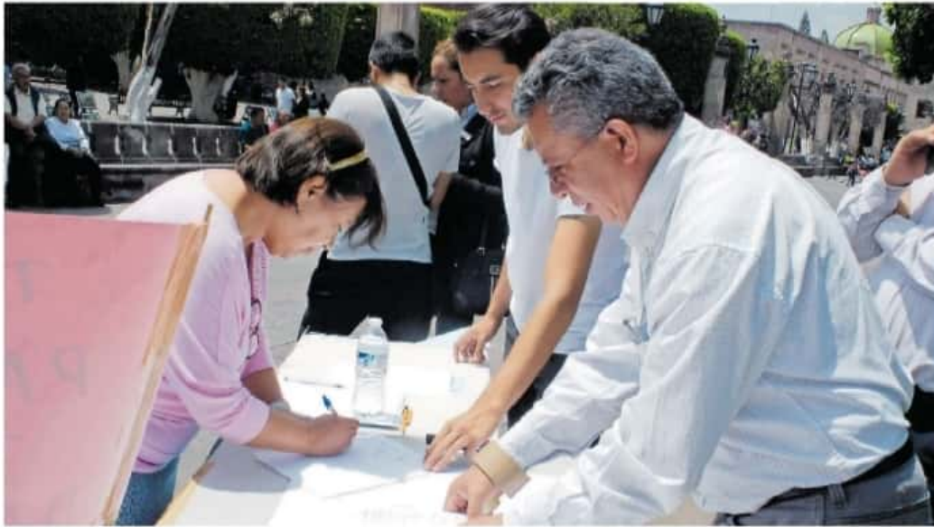
Quién aspire a la reelección no deberá de participar en la obtención del respaldo ciudadano