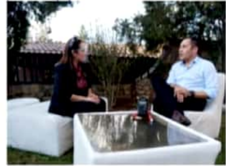
MORELIA, MICH.- El precandidato del PRD y PAN a la gubernatura afirmó que hoy lunes se presentará también ante el CEN del PRI.

Por el presidente de México, López Obrador, expresó respeto y anticipó que, de llegar a ser gobernador, buscará conciliar con el mandatario, encontrando "lo que nos une".