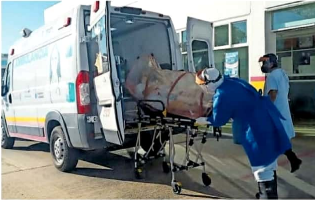
Por el alto riesgo de contagio, Pátzcuaro se mantiene en Bandera Amarilla, acumulando mil 499 casos.