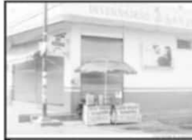
ALGUNOS AMBULANTES NO ACATARON LA NORMA.