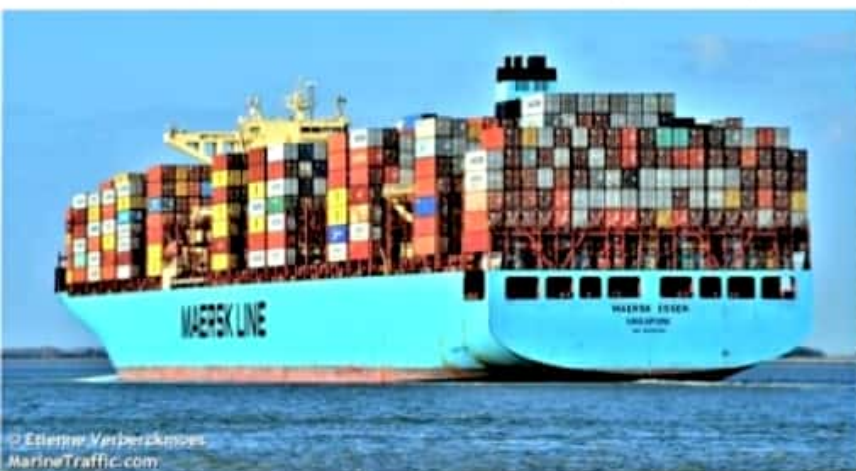
CD. LÁZARO CÁRDENAS, MICH.- El buque Maersk Essen, perdió 750 contenedores esto tras enfrentar marejadas en aguas del Pacífico Norte.

Reiteró la importancia de la unidad del partido, por ello en caso de no ser favorecido por la mayoría en la encuesta, respetará el resultado y se sumará a trabajar con quien resulte ganador y sea el candidato.