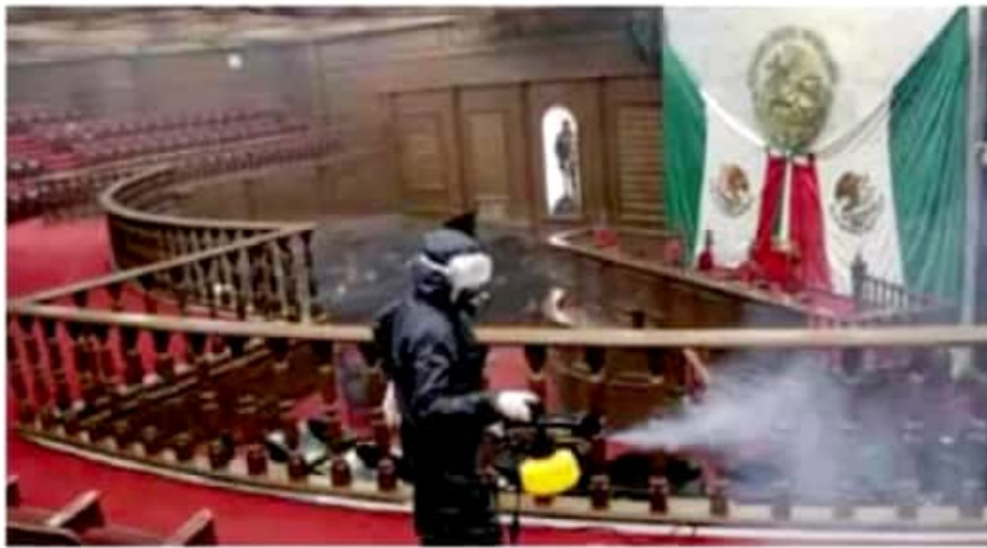
2021. Quienes aspiren a participar en una elección consecutiva están obligados a separarse de su encargo 90 días naturales previos al día de los comicios.