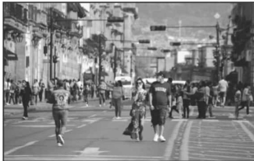
DE CONTINUAR ESTE ESCENARIO, EL COMITÉ DE SEGURIDAD EN SALUD PODRÍA DECLARAR CONFINAMIENTO OBLIGATORIO.

confinamiento obligatorio en el estado, debido a que la cantidad de contagios no se detiene y ya no hay camas que alcancen. En La Piedad, Uruapan y Pátzcuaro también hay una situación de alarma pues los nosocomios ya están al 100 por ciento de su capacidad.