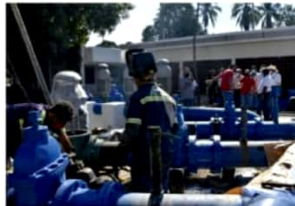
CD. LAZARO CÁRDENAS, MICH.- Concluyó la instalación de las ocho bombas nuevas en la planta del Capalac, cuya inauguración oficial será en los próximos días.

Las ocho bombas se instalaron de manera paulatina en poco más de cinco meses, a efecto de evitar afectaciones en la prestación del servicio a los usuarios.