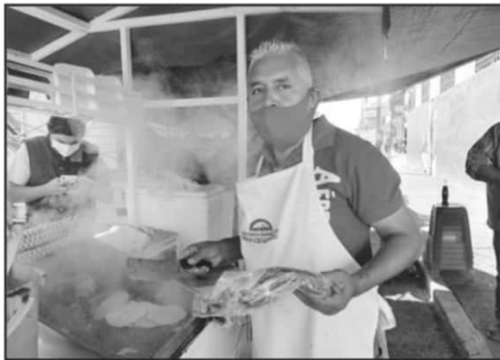
CON EL FIN DE FRENAR CONTAGIOS, AUTORIDADES PROMUEVEN EL USO DEL CUBREBOCAS Y RESPETO A LAS NORMAS.

En cuanto a lo recaudado por este concepto, las autoridades municipales crearán un fondo para la compra de cubrebocas para beneficio de la ciudadanía.