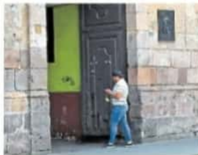
En cada alojamiento hay en promedio 50 alumnos