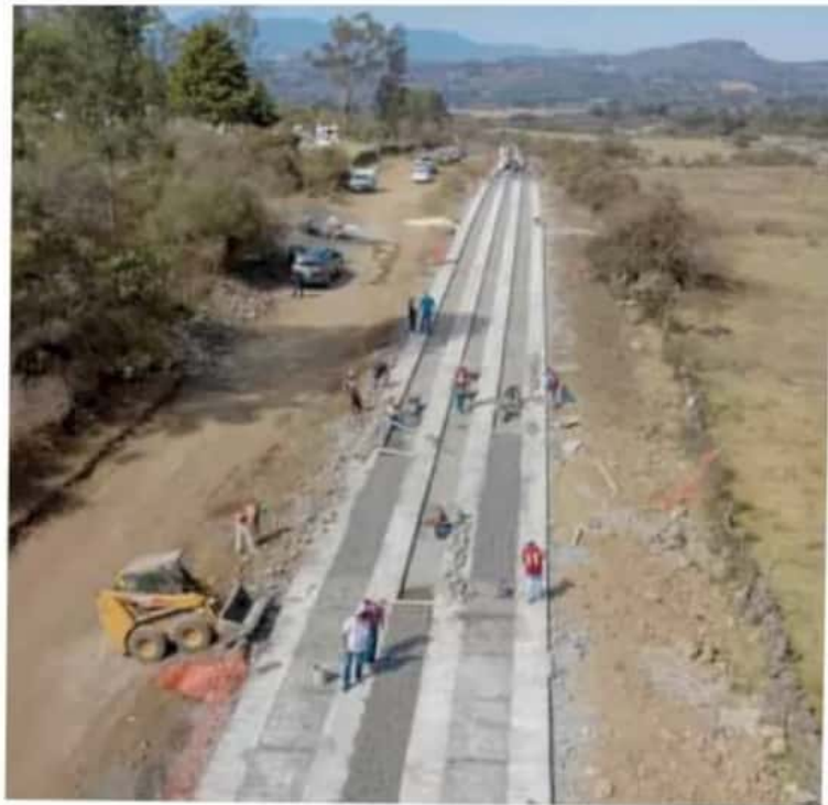
Obras. Entre los proyectos a ejecutar se encuentra la rehabilitación de caminos rurales.

Asimismo, el documento precisa la autorización para la construcción de la parte norte de la ciclovia de Acueducto, que se edificará con recursos del Fondo de Aportaciones Estatales para la Infraestructura