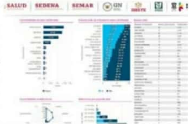
Las contagios de COVID-19 no bajan en el municipio de LC. El sábado registró 20 y ayer domingo 10 además de 2 decesos el sábado y uno más el domingo.

Lázaro Cárdenas con un fallecimiento en cada lugar, sumando en este aspecto el municipio porteño 337 personas muertas a consecuencia del contagio de este virus.