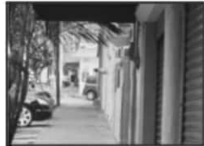
NEGOCIOS CERRADOS Y MUY POCOS GENTE SE VIO.