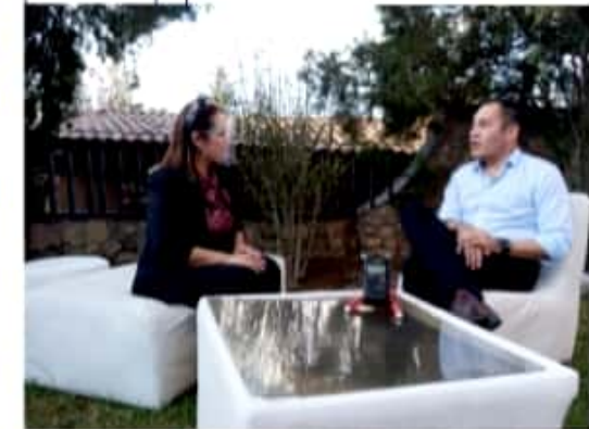
MORELIA, MICH.- El precandidato del PRD y PAN a la gubernatura afirmó que hoy lunes se presentará también ante el CEN del PRI.

Por el presidente de México, López Obrador, expresó respeto y anticipó que, de llegar a ser gobernador, buscará conciliar con el mandatario encontrando "lo que nos une".