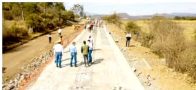
MORELIA, MICH.- Se han visitado 900 espacios públicos, entre los cuales se encuentran centros religiosos, oficinas municipales y estatales, etc.

Con estas acciones, el Gobierno de Morelia, reitera su compromiso por generar condiciones óptimas para el desarrollo de actividades esenciales, asimismo continúa invitando a la población a respetar las medidas preventivas contempladas dentro de la #NuevaNormalidad, tales como el uso de cubrebocas, lavado constante de manos y sana distancia, con las cuales podremos disminuir la curva de contagios en nuestro municipio.