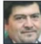
Silvano Aureoles, GOBERNADOR DE MICHOACÁN

“La ocupación hospitalaria crece contundentemente; se reconvierten más camas hospitalarias”