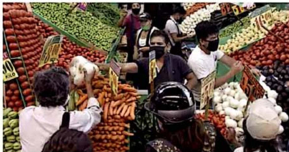
Disminución. El consumo de frutas y verduras se redujo hasta 14% por las alzas. JEANROSCURO

Impactos. Los consumidores también redujeron la cantidad neta de alimentos que llevan a casa; prefieren los de marca libre o productos a granel