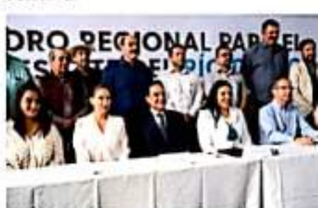
ZAMORA, MICH.- El evento tuvo lugar en el Centro Regional y de las Artes (GRAM) sitio al que fueron llamadas 13 presidentes municipales, diputado

Al mismo tiempo, invitó a todos los presentes a seguir erigiéndose como una organización que permite representar dignamente las necesidades de toda la ciudadanía.