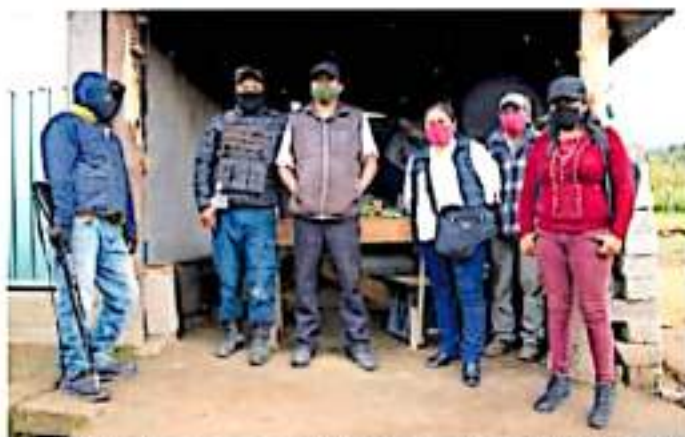
Los ejidatarios formaron una guardia forestal para proteger sus territorios del crimen organizado - Luis Prioste

den a la parte boscosa, arbolado que han ido incrementando por la perseverancia y esfuerzo de los comuneros, ya que las administraciones que han pasado por Zitácuaro nada invierten en la plantación o el cuidado del medio ambiente. Contrario a ellos protegen a los talamontes y en los últimos años a grupos de linchamientos que han llegado a las poblaciones con el propósito de controlar la región, hecho que han impedido pese a la desagravación o