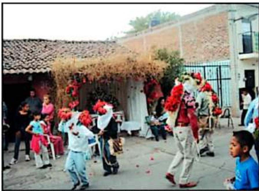
COMO MEDIDA SANITARIA, EL EVENTO SE TRANSMITIRÁ EN LA PÁGINA FACEBOOK DE TELEVISIÓN UNIVERSITARIA DE LA CIÉNEGA.

También uno de los elementos a analizar en este encuentro biocultural será lo referente a los procesos de mercantilización de las fiestas populares, como el caso de los carnavales en Corrientes, Argentina, entre 1960 y la actualidad al cual será parte de la participación del país del sur del continente. En tanto que las tradiciones populares serán también parte de este encuentro a través del análisis de las danzas de los Reboceros y de las Amazonas de esta ciudad, ambas, tradiciones y ritos ya perdidos en la antigua Huasteca.