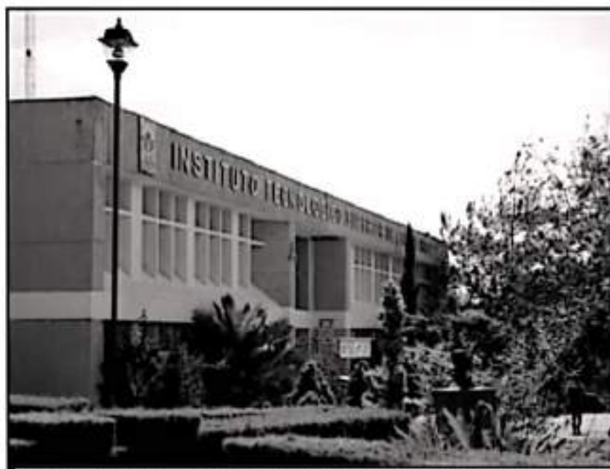
EL TEC DE CIUDAD HIDALGO ESTÁ ENVUELTU EN UNA PROBLEMÁTICA GRANDE CON SUS EGRESADOS REZAGADOS

existe la preocupación porque se darán las cédulas estatales que en términos prácticos no son aceptadas en otros estados, "sabemos que en otros estados entregan cédulas estatales y federales, acá no se planteamos".