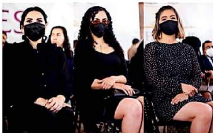
YADIRA DEL ROCÍO RAMÍREZ DIRECTORA DEL DIF MUNICIPAL