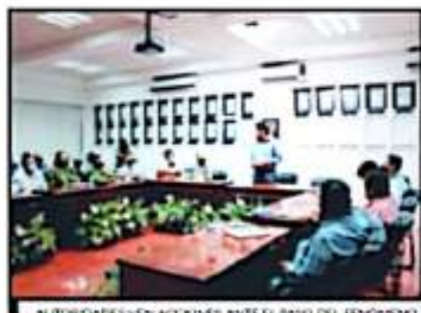
AUTORIDADES VEN ACCIONES ANTE EL PASO DEL FENÓMENO

CLIMA SE PREPARAN EN COSTA ANTE IMPACTO DE HURACÁN