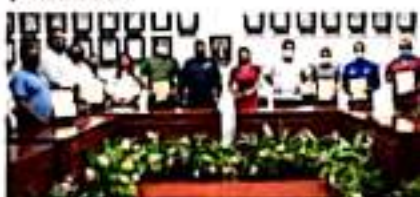
CD. LÁZARO CÁRDENAS, MICH.- El gobierno municipal firmó un convenio de colaboración entre la Dirección de Seguridad Pública Municipal y organismos de los tres niveles de gobierno, sociedad civil e iniciativa privada, para que infractores puedan ser canalizados y recibir tratamiento o realizar

También se está cumpliendo con la certificación de los jueces que forman parte de sistema de justicia cívica.