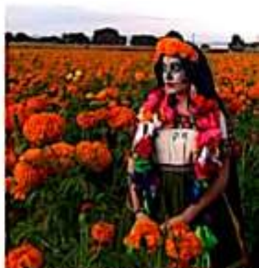
MORELIA, MICH.- Debido a una serie de fotografías que se han viralizado de los campos de cultivo de flor para Día de Muertos, muchas agencias de turismo ofrecen recorridos por los campos de cempasúchil.

Al momento no se cobra por entrar a la plantación pero se solicita a los visitantes tener cuidado con la flor para que no signifiquen pérdidas económicas para ellos.