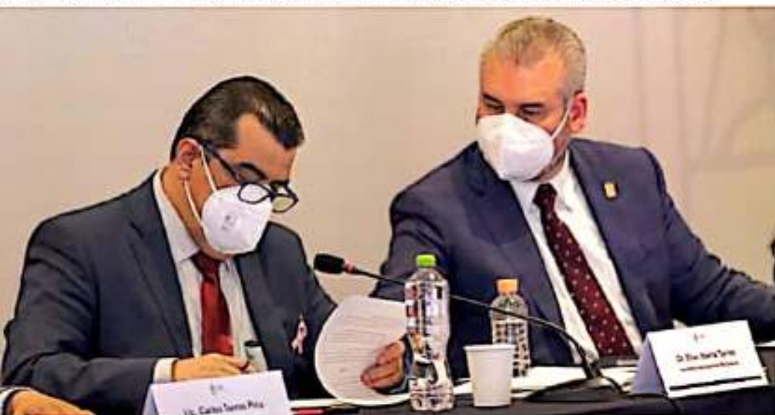
MORELIA, MICH.- Estas acciones forman parte de la estrategia de desarrollo que promueve el gobernador Alfredo Ramírez Bedolla para fortalecer rubros prioritarios.

Con los recursos extraordinarios que el Insabi radicará a Michoacán, será posible reforzar el abasto de medicamentos en el primer y segundo nivel de atención médica en los 27 hospitales y 364 centros de salud del sistema estatal. Estas acciones forman parte de la estrategia de desarrollo que promueve el gobernador Alfredo Ramírez Bedolla para fortalecer rubros prioritarios, con mayor demanda y rezago en servicios para la población,