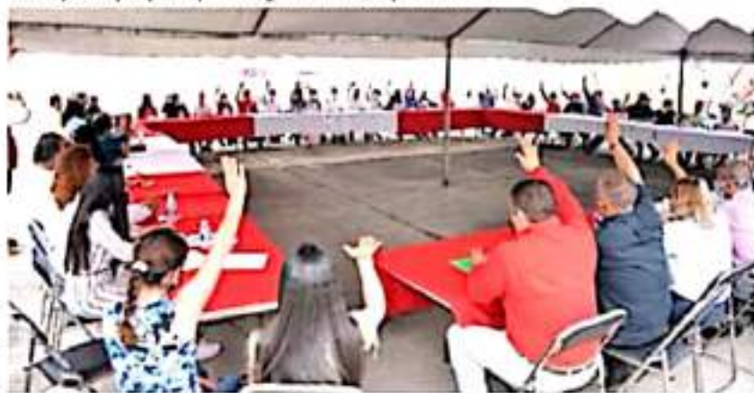
Se realizó la primera Asamblea Municipal por agrupación de municipios, en la que se eligieron a los delegados que participarán en la Asamblea Estatal.