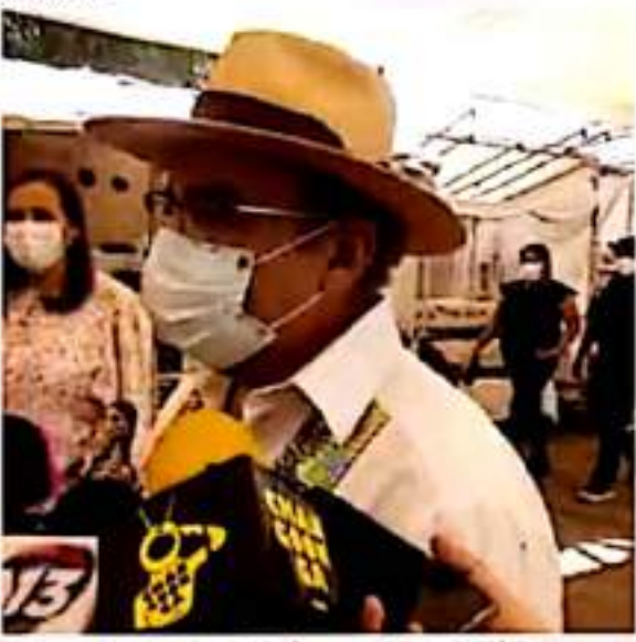
MORELIA, MICH.- Felipe Calderón, ex presidente de México.

nivel nacional, que lo hagan; es injustificado pero que lo hagan. Hoy tenemos en México el triple de homicidios de los que había cuando yo era presidente", finalizó Felipe Calderón.