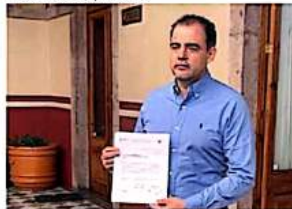
El legislador ya presentó la propuesta a la Mesa Directiva del Congreso y favorecerá a motociclistas y automovilistas del servicio particular y público.

"Este programa ya se aplicó y fue bien recibido por la población, es por ello que presentó esta propuesta. Con las licencias permanentes ayudamos a la población a que regularice su situación como conductores y favorecemos la recaudación estatal. Estamos conscientes de la posición que guarda el estado en materia financiera, por ello debemos brindar desde el Congreso de Michoacán, las herramientas necesarias para que el Gobernador Alfredo Ramírez Bedolla, pueda lograr una mayor y efectiva percepción de recursos", puntualizó Gaona García.