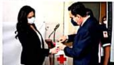
ZAMORA, MICH.- El alcalde detalló que hoy más que nunca se requiere la participación de toda la comunidad, para que la corporación de auxilio pueda seguir ofreciendo sus servicios y salvando vidas.