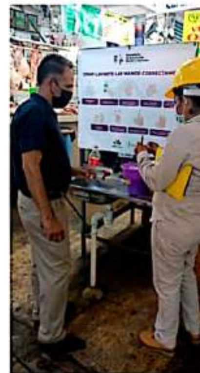
CD. LÁZARO CÁRDENAS, MICH.- Personal del Departamento de Mercados y Panteones realizó la Campaña de Descacharrización en el

Cabe señalar que la descacharrización es una de las acciones más importantes, ya que con la eliminación de los objetos inservibles se reduce enormemente los puntos para que se reproduzca este mosco y con ello los contagios