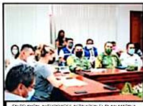
EN REUNIÓN, AUTORIDADES ACTIVARON EL PLAN MARINA