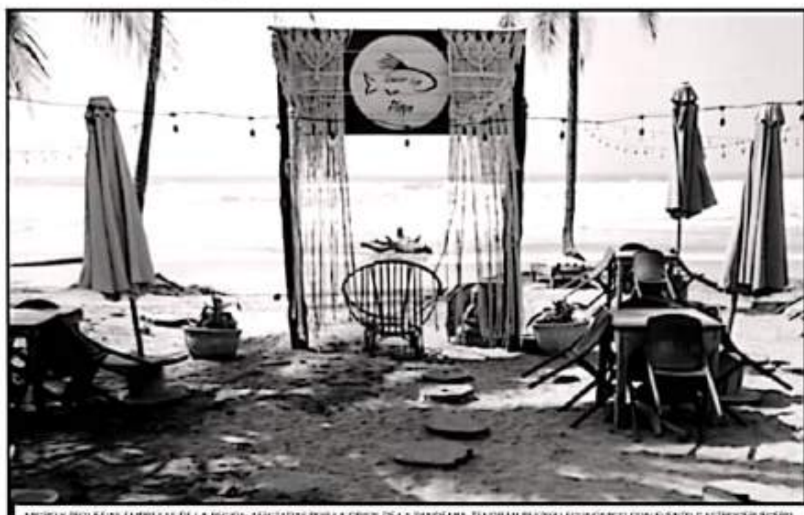
MICRO Y PEQUEÑAS EMPRESAS DE LA REGIÓN AFECTADAS POR LA CRISIS DE LA PANDEMIA, TENDRÁN RESPALDO ECONÓMICO CON EVENTO GASTROCERVECERO.

El evento reunirá más de 80 etiquetas de cervezas diferentes de todo el mundo, incluidas por supuesto las cervezas artesana-