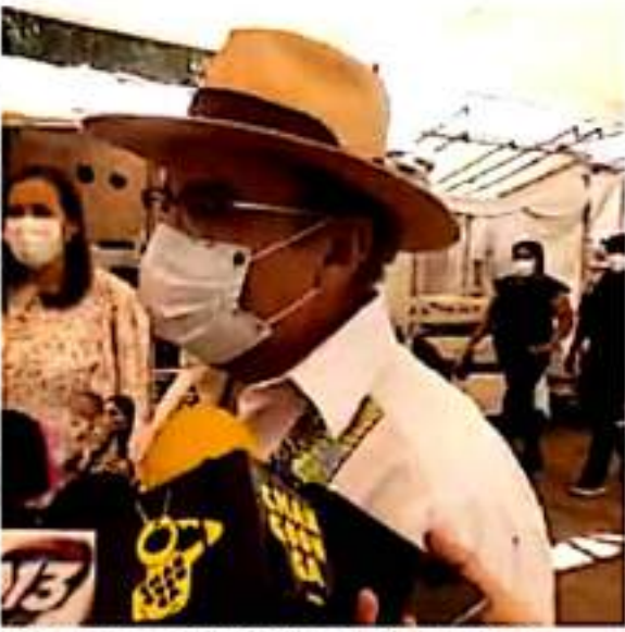
MORELIA, MICH.- Felipe Calderón, ex presidente de México.

nivel nacional, que lo hagan; es injustificado pero que lo hagan. Hoy tenemos en México el triple de homicidios de los que habla cuando yo era presidente", finalizó Felipe Calderón.