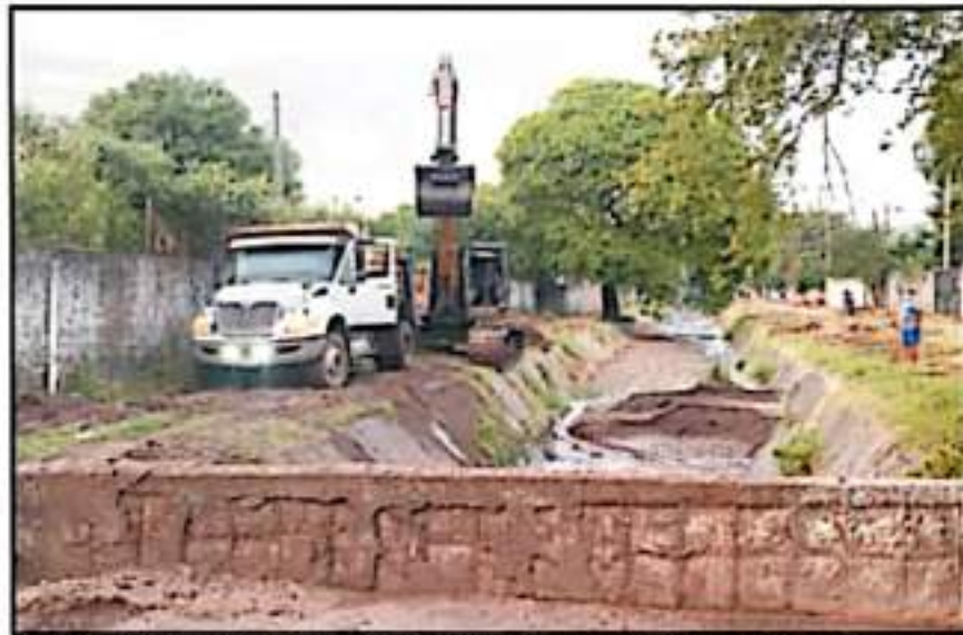
PERSONAL DE OBRAS PÚBLICAS LLEVO A CABO EL DESACTIVACIÓN DEL CANAL DE LAS GUACAMAYAS, PARA REDUCIR RIESGOS

El comando naval notifica que se encuentra preparado con perso-