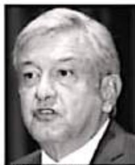
Andrés Manuel López