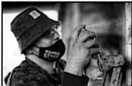
EL PROGRAMA DE LIMPIEZA INCLUYÓ QUITAR LA PLAGUICIDA Y LOS GRABES PARA DAR NUEVA IMAGEN A LOS PUENTES DE LA CIUDAD.

50 mil METROS cuadrados los que se pintarán