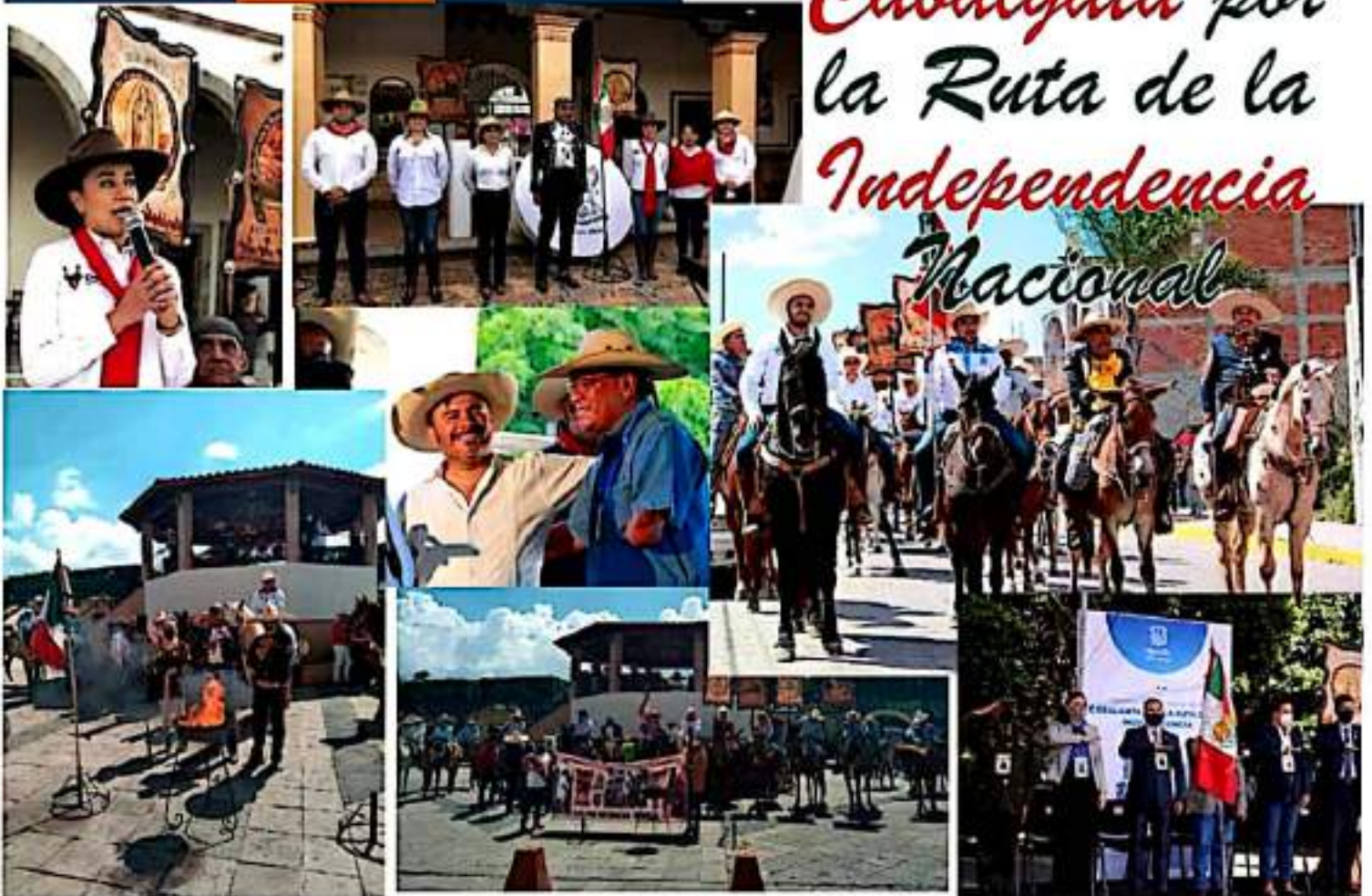
La Cabalgata por la Ruta de la Independencia Nacional cuenta con más de mil kilómetros de caminos que recorrió el Ejército Insurgente dirigido por Miguel Hidalgo y Costilla. Presentamos algunas imágenes de su paso por Morelia, Charo, Indaparapeo, Queréndaro y Zinapécuaro.