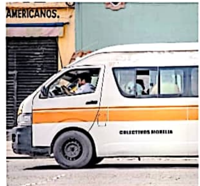
El gremio confía en que el panorama mejore con la reactivación de clases presenciales