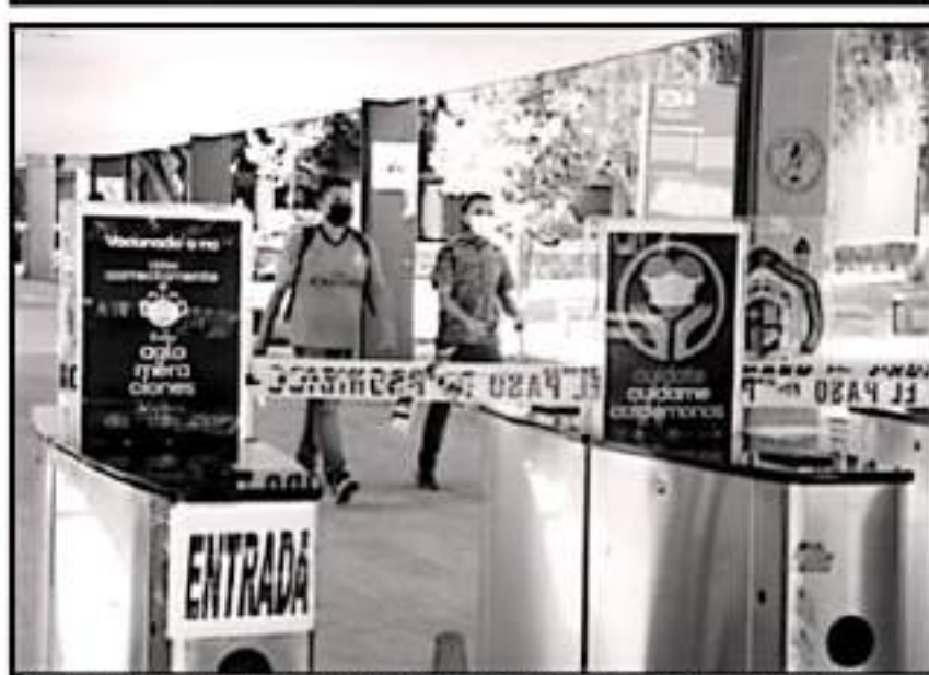
LA MÁXIMA CASA DE ESTUDIOS OFICIALIZA EL REGreso A CLASES PRESENCIALES EN TODAS SUS FACULTADES.