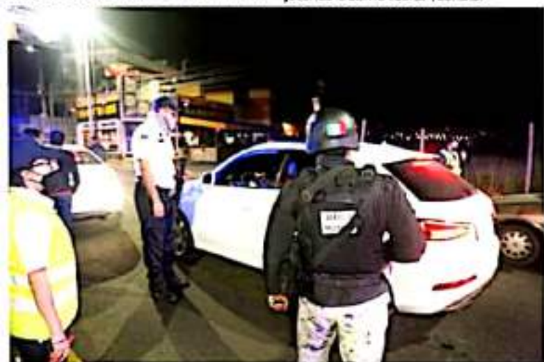
MORELIA, MICH.- Derivado de la revisión a 18 establecimientos levantaron sólo 6 infracciones levantadas la cuales radicarán en cuestiones de protección civil.