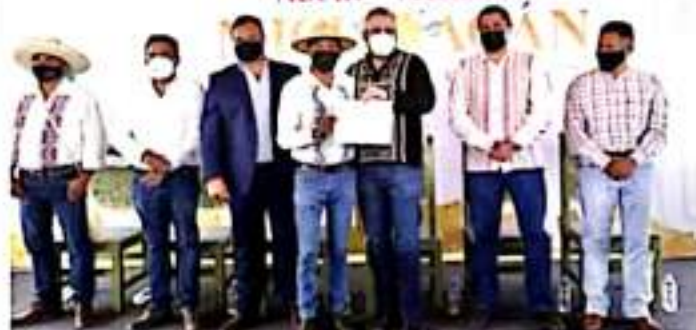
Gobierno. El gobernador del estado celebró que las comunidades permitan el acceso a una de las tradiciones más representativas del estado. FICOMORA