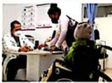
MORELIA, MICH.- En el Hospital General Regional No. 1 Morelia Charo, se registró un alcance de 175 personas de este grupo.

Cabe recordar que en el Coeva participan de manera conjunta la Secretaria de Salud de Michoacán, el Instituto Mexicano del Seguro Social (IMSS) y el Instituto para la Seguridad y Servicios Sociales de los Trabajadores del Estado (Issste), entre otras instancias.