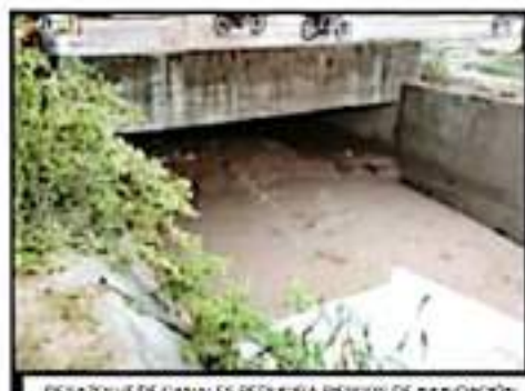
DESACTIVACIÓN DE CANALES REDUCE RIESGOS DE INUNDACIÓN