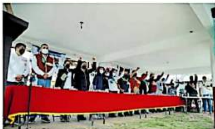
La ceremonia encabezada por consejeros, fue en la plaza principal

ción de mil 688 personas que se manifestaron a favor del gobierno propio y de administrar sus recursos de manera directa mientras que nadie fue en contra de ello.