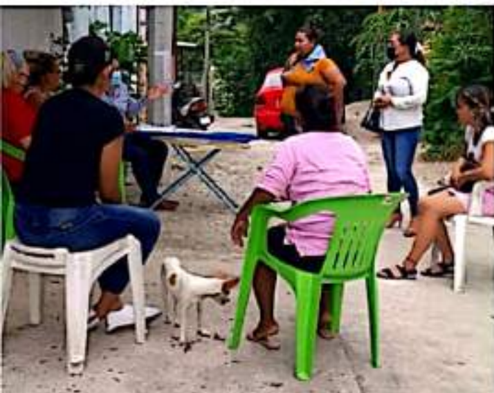
CD. LÁZARO CÁRDENAS, MICH.- El Gobierno Municipal oferta de manera gratuita la atención psicológica y la asesoría jurídica a las mujeres de Lázaro Cárdenas.

El Inspector y Contralor General de la Secretaría de Marina, destacó que se trabajará con eficacia, honestidad y compromiso reanudando la eficiencia de los puertos. Tras dar a conocer la visión estratégica y las acciones específicas de la Secretaría de Marina, se resolvieron dudas e inquietudes del personal, dejando un claro mensaje de apertura y confianza respetando las condiciones y derechos laborales de cada trabajador.