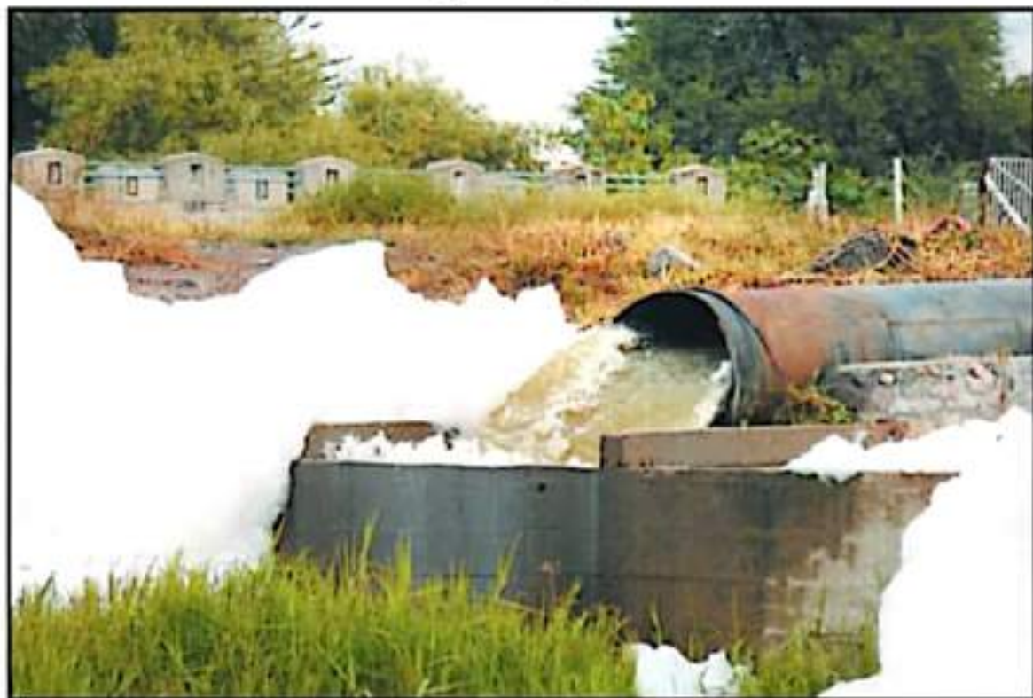
EL MÓDULO DE RIEGO LA PALMA YA SE ENCUENTRA EN SITUACIÓN COMPLICADA ECONÓMICAMENTE, HAY RIESGO DE CONTINUAR CON SUS LABORES

Ante esto, dijo, es urgente que los municipios estén enterados de que al Módulo de Riego La Palma le resulta imposible enfrentar con sus propias finanzas el gasto generado, aclara que el módulo a su cargo no está