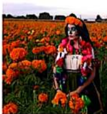
MORELIA, MICH.- Debido a una serie de fotografías que se han viralizado de los campos de cultivo de flor para Día de Muertos, muchas agencias de turismo ofrecen recorridos por los campos de cempasúchil.

Al momento no se cobra por entrar a la plantación pero se solicita a los visitantes tener cuidado con la flor para que no signifiquen pérdidas económicas para ellos.