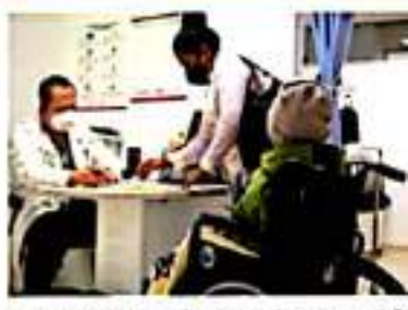
MORELIA, MICH.- En el Hospital General Regional No. 1 Morelia Charo, se registró un alcance de 175 personas de este grupo.

El presidente del Tribunal rechazó que puedan enfrentar complicaciones por cumplir con las prestaciones de fin de año "podría afirmar categóricamente que no tendremos complicaciones precisamente por el uso prudente del presupuesto que nos fue entregado", insistió al recordar que algunas de las prestaciones que lograron cubrir fue gracias a los ahorros que se generaron en el Poder Judicial.