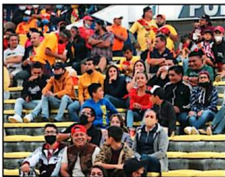
PESE A QUE LOS PROTOCOLOS PERSISTEN NO SE CUMPLEN CUESTIONES COMO SANA DISTANCIA Y USO DE CUBREBOCAS

Todavía a las 18:30 horas, cuando se actualizó el reporte diario de la evolución de la pandemia en Michoacán, en que se registraron 79 nuevos contagios en 30 municipios y 4 defunciones por COVID-19 en igual número de demarcaciones, aun se reportaban en Bandera Amarilla Morelia, Lazaro Cárdenas y Uruapan, mientras que con Bandera Verde aparecieron Patzcuaro, Agatzingán, Zamora, Zitacuaro, Zacapu y Buenavista.