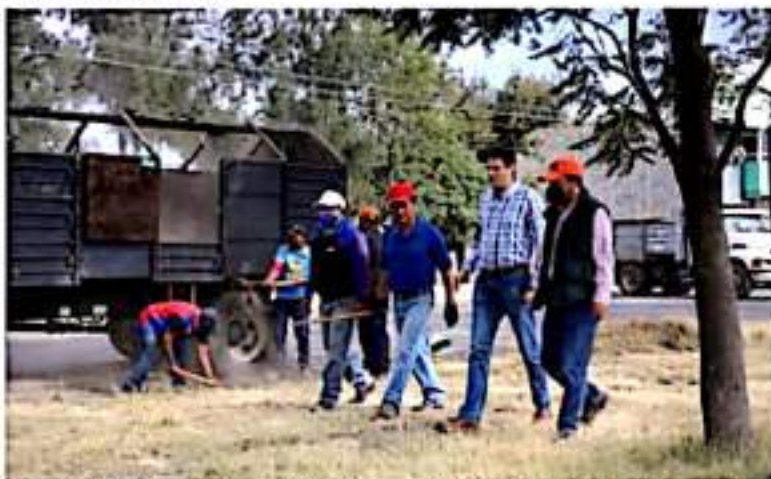
MORELIA, MICH.- De esta forma, el alcalde supervisó la jornada de limpieza de este domingo del acceso a Ciudad Industrial a la glorieta ubicada en la salida a Charo.

pintaron guarniciones, además de que se bachearon vialidades aledañas que presentaban daños en este importante acceso a la capital.