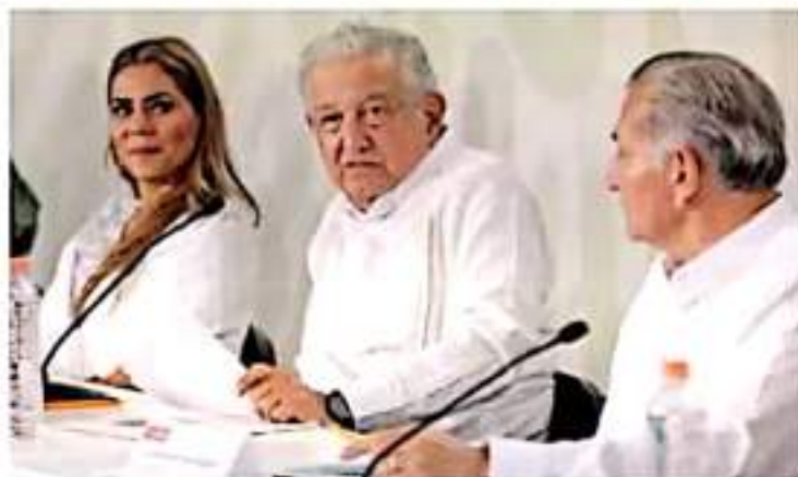
Guerrero. AMLO acompañó a la nueva gobernadora, Evelyn Salgado Pineda.

Añadió que en La Montaña, en Guerrero, y en todo México, existe lo que llamó "una gran reserva de valores en el México profundo para regenerar la vida pública", subrayó.