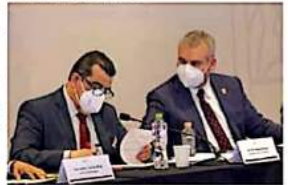
El gobernador Alfredo Ramírez Bedolla, anuncia que con el apoyo federal se fortalecerá el abasto de medicamentos en sector salud en Michoacán.