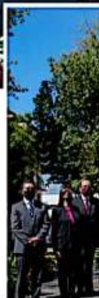
Gobernador Alfredo Ramírez Bedolla y alcalde Ignacio Campos Equihua presiden 156 aniversario luctuoso de los Mártires de Uruapan.

El galardón fue entregado por el gobernador del estado, Alfredo Ramírez Bedolla y el presidente municipal, Ignacio Campos Equihua, dentro del marco del 156 aniversario luctuoso de los Mártires de Uruapan. Se trata de una distinción al mérito ciudadano que otorga el H. Ayuntamiento 2021-2024 de Uruapan, con el objetivo fomentar los valores cívicos entre la población y reconocer la participación ciudadana en áreas de propiciar el desarrollo de este municipio, ya sea en el ámbito económico, ambiental, deportivo, cultural, artístico, científico, cívico o social.