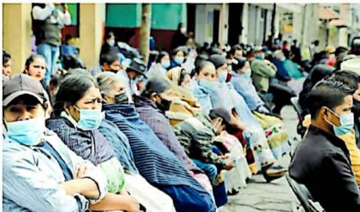
Se registraron mil 781 personas y votaron mil 688