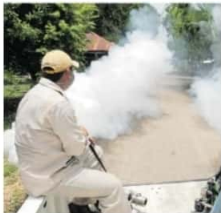
Los municipios con mayor incidencia son Lázaro Cárdenas, Zitácuaro, Uruapan y Pátzcuaro / CHIARITOSGORDO

Manifiesto que su decisión colectiva mantiene entre sus causas, "la deuda histórica del Estado mexicano con las comunidades indígenas, esto sin importar el color o filiación política del partido en el poder, por el contexto de pobreza, marginación, represión, criminalización, discriminación y despojo de los pueblos originarios que aún viven y porque los partidos políticos dividen comunidades y sólo se acuerdan de los pueblos en tiempos electorales". Con información de Yelitza Mendoza