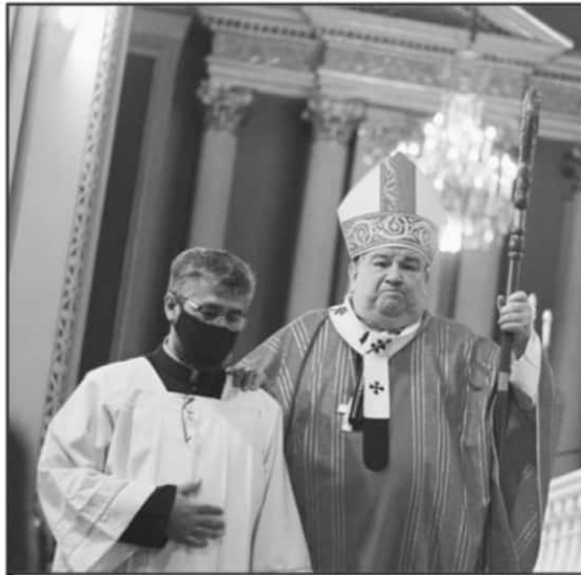
EL ARZOBISPO CARLOS GARFIAS PIDE A LAS AUTORIDADES ACCIONES PARA LOGRAR UN PROCESO ELECTORAL EN PAZ.

Es importante recordar que esta declaración se dio después de que en Michoacán se han regis-