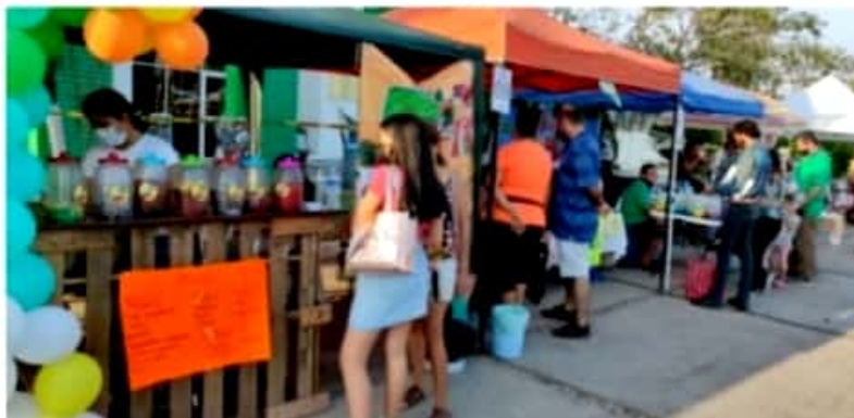
CD. LÁZARO CÁRDENAS, MICH.- Con la participación de 45 expositores locales se llevó a cabo el Emprende Fest LZO, contando con las medidas sanitarias por el Covid-19.

Recordó que el Emprende Fest LZO, es un evento que busca promover los artículos y alimentos elaborados localmente, con lo cual se busca fortalecer la economía local.