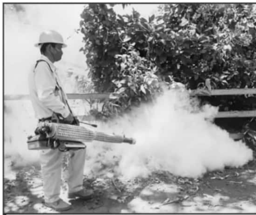
EN UN 56 POR CIENTO HAN DESCENDIDO LOS CASOS DE DENGUE EN MICHOACÁN, CONFIRMAN AUTORIDADES DE SALUD.

Además de que Michoacán descendió varias posiciones en el listado de los estados con mayor número de casos, también es des-