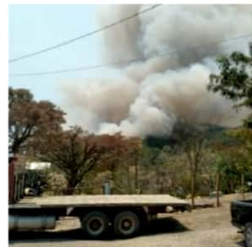
MORELIA, MICH.- El municipio de Morelia registraba el día de ayer incendios forestales activos en el cerro del Águila, Quinceo y San Miguel del Monte, así como en la comunidad de Tumbisca, al sur de Jesús del Monte.