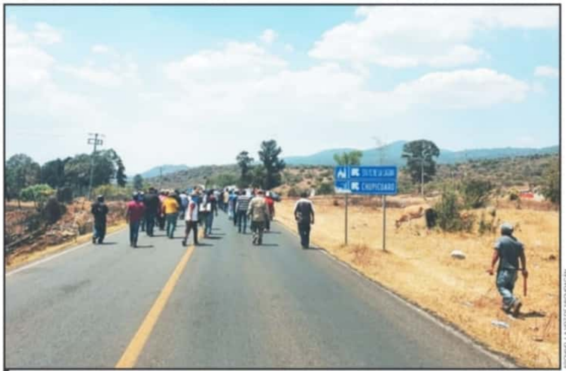
DESPUÉS DE LA DENUNCIA PENAL CONTRA EL VOCERO DE SANTA FE DE LA LAGUNA, SE ESPERAN NUEVAS MOVILIZACIONES POR PARTE DE LOS COMUNEROS.

compromete a desistir de interponer una denuncia penal en contra de cualquier comunera y/o comunero", señalan en el documento. Es de mencionar que días previos a la firma del documento, los manifestantes llegaron al Palacio Municipal, haciendo destrozos en las oficinas y patio del edificio.