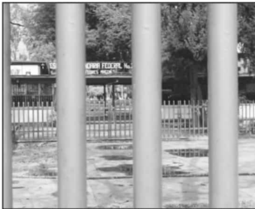
RECHAZA EL SNTE EN EL ESTADO QUE PADRES DE FAMILIA SANITICEN AULAS PARA REGreso A CLASES PRESENCIALES.

no tiene baños adecuados, se tiene que revisar mucha de la infraestructura de las escuelas para retomar las actividades de manera presencial; por ello el énfasis en este tema", insistió el dirigente de gremio docente en Michoacán.