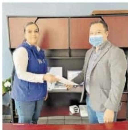
El nuevo secretario general del PAN se comprometió a impulsar los trabajos del partido