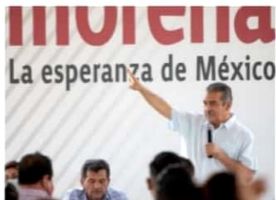
MORELIA, MICH.- Raúl Morón Orozco, durante un acercamiento con las bases políticas que defenderán la consolidación de la Cuarta Transformación en Morelia, afirmó que la continuidad de la 4T en la capital michoacana sigue en marcha mientras se fortalece la estructura que acompaña a este proyecto.

Bajo estos argumentos, Raúl Morón denotó confianza en que el proyecto de la Cuarta Transformación se mantendrá vigente en Morelia, posterior a las elecciones del próximo 6 de junio, fecha en que, aseguró, este proyecto terminará de consolidarse a lo largo y ancho del territorio michoacano.