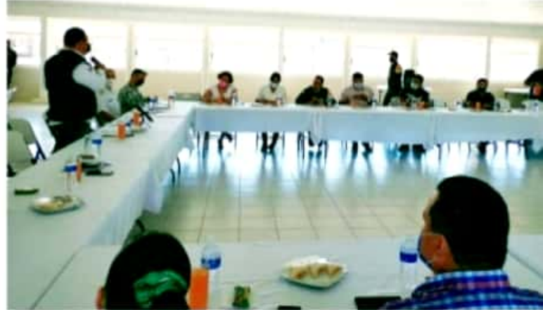
CD. LÁZARO CÁRDENAS, MICH.- El Comité Jurisdiccional de Seguridad en Salud, sostuvo una reunión con representantes de partidos políticos, los cuales se comprometieron a respetar los protocolos sanitarios para este proceso electoral.

Además, cada semana se reunirán con el comité de salud para conocer la estadística en salud con respecto a la pandemia y así mismo participar en las estrategias para evitar el aumento de los casos. El Comité Jurisdiccional de Seguridad en Salud reiteró el llamado a todos los partidos políticos de manera general y sus candidatos a los diferentes puestos de elección popular, a respetar los acuerdos tomados y ser responsables en sus reuniones, evitando con ello las reuniones masivas, asimismo ser transmisores del mensaje de cuidado para con los ciudadanos y que estos adopten las medidas sanitarias recomendadas por las autoridades de salud.