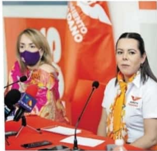
Apoyarán el derecho de las mujeres a decidir y no ser criminalizadas

materia de seguridad en las colonias Villas del Pedregal, El Durazno, Emiliano Zapata y San Juanito Itzicuaru, consideradas las más peligrosas de Morelia para niñas y mujeres.