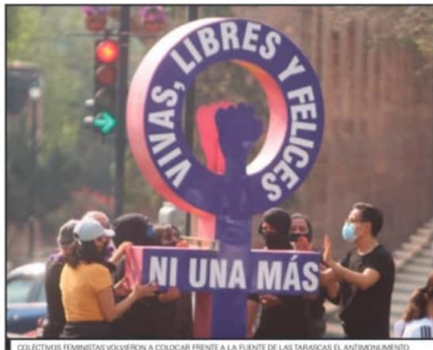
COLECTIVOS FEMINISTAS VOLVIERON A COLOCAR FRENTE A LA FUENTE DE LAS TARASCAS EL ANTIMONUMENTO.

"Efectivamente, cuando hay un aumento de violencia en lo general, social, y que ahorita sabemos que se está dando por este pleito entre grupos organizados, también hay un aumento de violencia hacia las mujeres, o sea que no nos escapamos. No dudo que efectivamente el dato en cuanto a número sea grave, siempre se han dado situaciones de violencia sexual", explicaba.