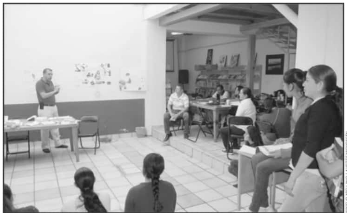
AUTORIDADES REGIONALES Y MAESTROS SE COORDINAN PARA CENSAR A TODOS LOS PROFESORES QUE PODRÁN SER VACUNADOS A PARTIR DE MAYO.

faltan para inicio de vacunación a docentes