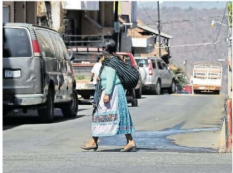
El CSIM informó al INE de dicha determinación, la cual se basa en la libre autodeterminación política / FERNANDO MALDONADO

El pasado 16 de abril el Consejo Supremo