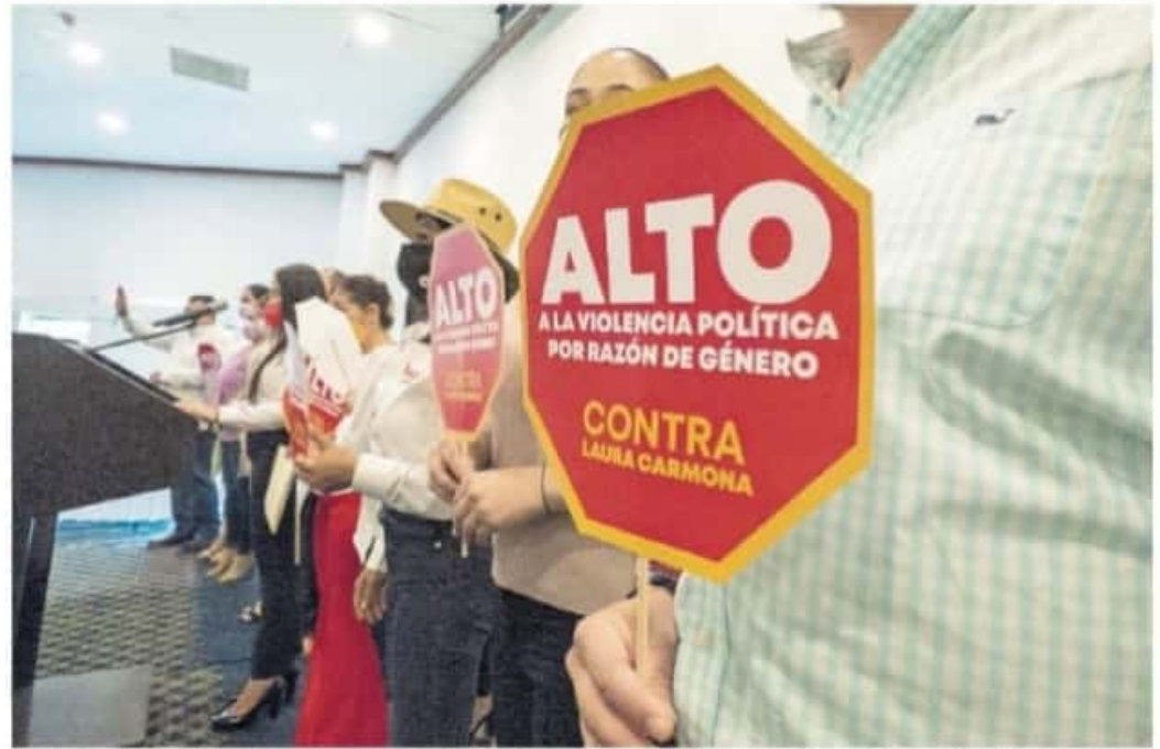
Diputados y dirigentes exigieron que se haga efectivo el derecho a la participación de las mujeres en la política

"ALUDEN A MI CUERPO, A MI ÁMBITO ÍNTIMO", SEÑALA