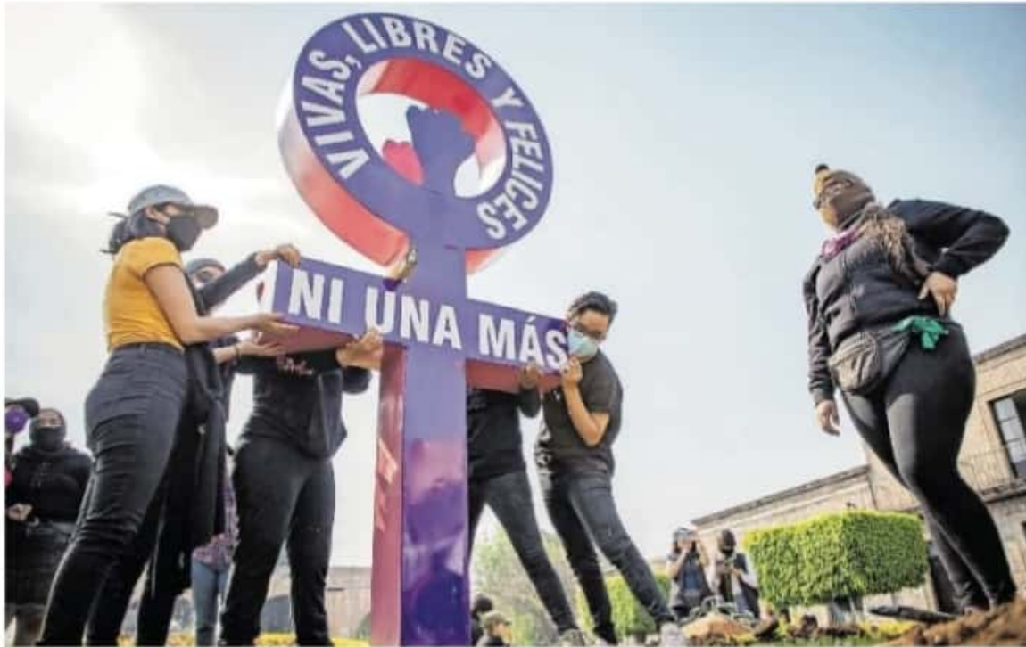
"La vamos a colocar tantas veces como sea necesario", dijo Stamatio, integrante de la Asamblea / CARMEN HERNÁNDEZ