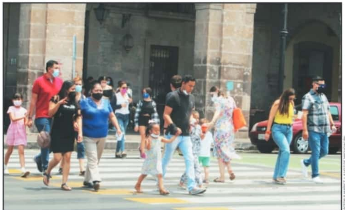
EN LAS PLAZAS PÚBLICAS Y CALLES DEL CENTRO LA AGLOMERACIÓN DE PERSONAS HA AUMENTADO; LOS GUARDIANES DE LA SALUD YA NO HACEN RONDAS.

de letalidad del coronavirus en la entidad