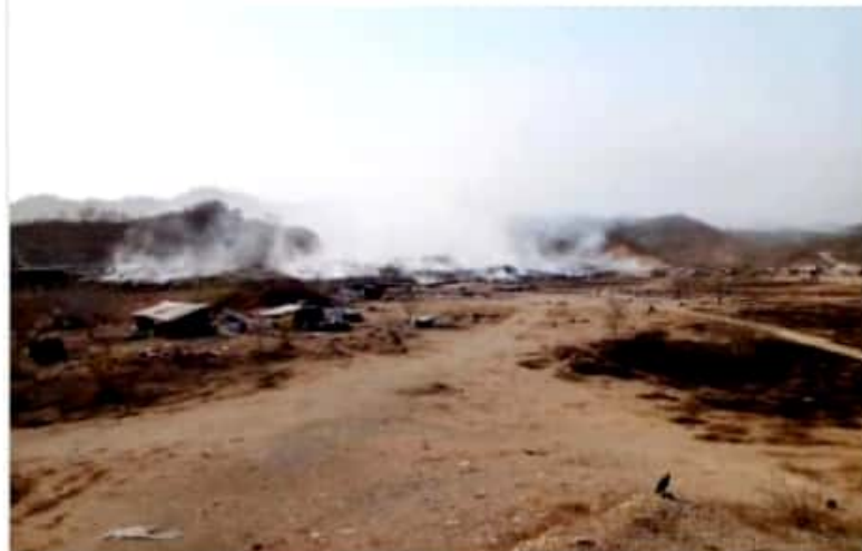
CD. LÁZARO CÁRDENAS, MICH.- El humo del incendio del relleno sanitario de San Juan Bosco continúa esparciéndose por los alrededores, provocando daños en la salud de la población.

Por lo anterior, exhortan a las autoridades de salud para que intervengan en el caso y den a conocer a la población las medidas preventivas que deben de tomar para evitar inhalar el humo que emana el relleno sanitario.