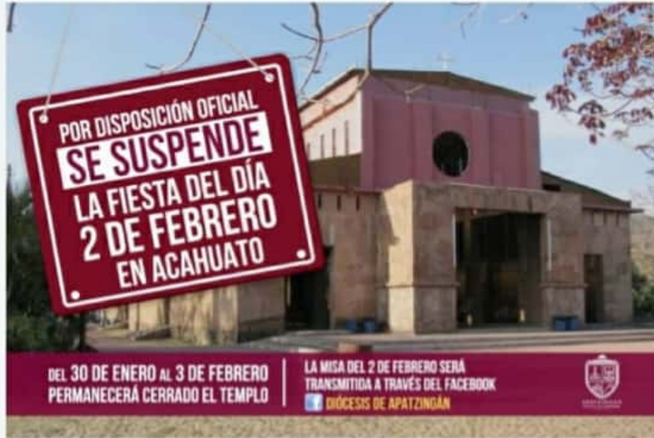
APATZINGÁN, MICH.- La cifra récord de casos de contagio puso en alerta al gobierno municipal, así como a las autoridades eclesíásticas.

Con los 44 casos de Covid-19 registrados ayer domingo, suman ya 1,027 en total dentro del municipio, lo que significa una alerta máxima ante la cual hay que extremar medidas.