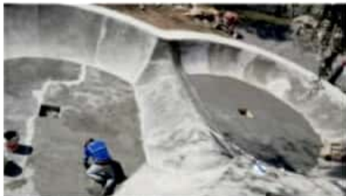
CD. LÁZARO CÁRDENAS, MICH.- Lzc Skatepark 2.0 está por finalizar, para beneficio de los aficionados al deporte extremo.

■ Preparan convocatoria para la pinta de murales