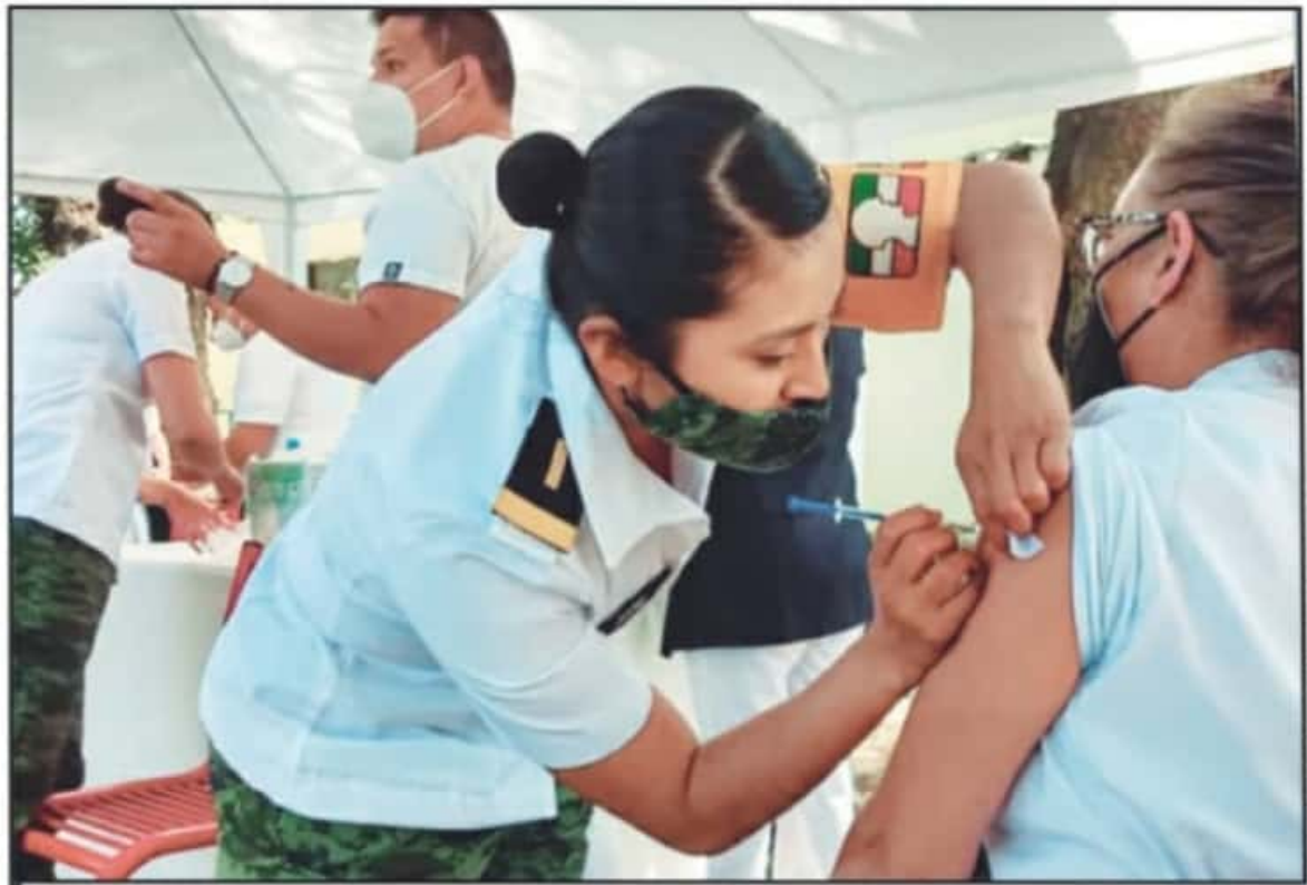
LAS AUTORIDADES ELECTORALES EN EL ESTADO DE MICHOACÁN VEN DE VITAL IMPORTANCIA QUE SE LLEVE A CABO EL PROCESO DE VACUNACIÓN CONTRA COVID-19.

se requiere capacitación, pero en esta primera etapa, la aplicarán a todos los médicos. Que en teoría esto debe de terminar en lo que resta de enero y febrero para que a partir de marzo se empiece a vacunar a los adultos mayores", manifestó.