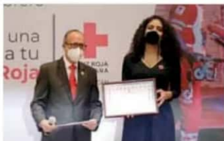
Donativos. La colecta se llevará a cabo del 11 de enero al 13 de febrero. / CORTESIA

En este último punto es importante recordar que en días pasados las cámaras empresariales externaron su molestia, pues aseguran que no fueron tomados en cuenta en la toma de la decisión.