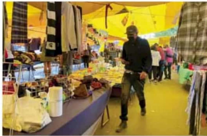
Desacato. Este domingo, al menos cuatro tianguis se instalaron en la ciudad.

Recordó que tan sólo en 2020 se realizaron 90 mil servicios y se atendieron 7 mil 800 casos de emergencia, además de que se dio asistencia a 70 mil personas, 350 de las cuales presentaron síntomas de Covid-19. ANED AYALA