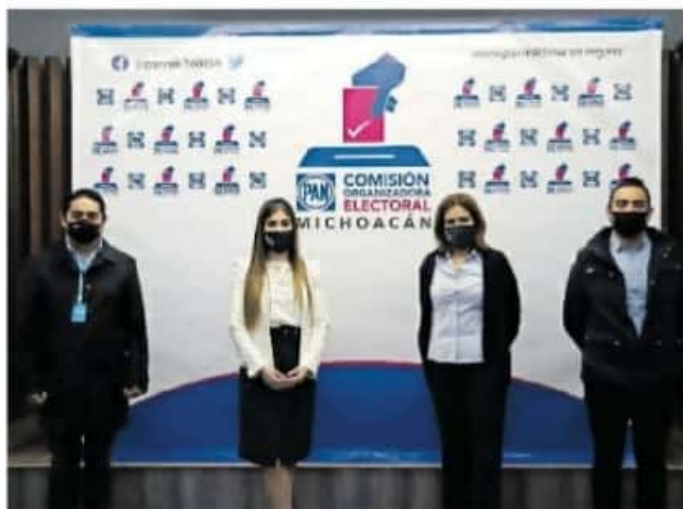
El 9 de enero concluyó de forma oficial el periodo de recepción de documentación

TACÁMBARO, SANJAYO, Hidalgo, Jacona, Maravatío, Los Reyes, Nahuatzen, Tangamandapio, Quiroga, La Piedad, Peribán, Cotija, Zinapécuaro, Ecuandureo, Zamora, Morelia y Santa Ana Maya son los municipios para los que los aspirantes mostraron su interés de participar.