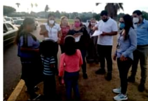
CD. LÁZARO CÁRDENAS, MICH.- El Sistema DIF Municipal, en coordinación con otras corporaciones, encabezó un operativo en diferentes cruceros de la cabecera municipal con la finalidad de detectar casos de explotación infantil.

El rango de edad de los menores es de los 6 a los 14 años, aunque también se detectó a una bebé de nueve meses de nacida.