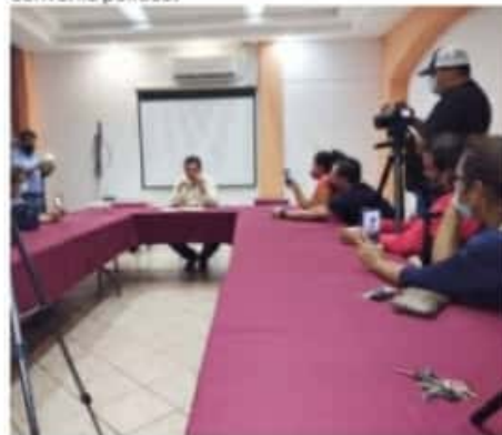
APATZINGÁN, MICH.- Dijo que el acuerdo de que sea una mujer surgida del PT la candidata a la alcaldía apatzinguense, es una argucia para beneficiar a una sola familia.