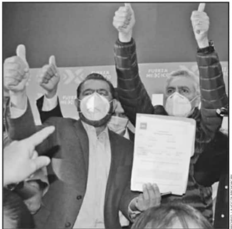
EL SENADOR CRISTÓBAL ARIAS SOLÍS ES EL PRECANDIDATO ELEGIDO POR EL PARTIDO FUERZA POR MÉXICO.

Cristóbal Arias, ASPIRANTE DE FUERZA POR MÉXICO