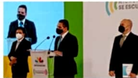
MORELIA, MICH.- El pasado domingo, Morelia registró 134 nuevos contagios, para un total de 8,567 casos confirmados.

Cabe señalar que durante el pasado fin de semana fueron también desactivados 35 eventos como jaripeos, peleas de gallos, bailes y fiestas familiares con alta concentración de personas, en 15 municipios de la entidad.