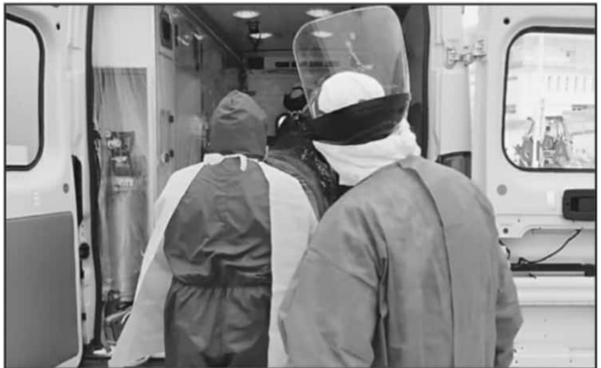
MORELIA NO HA SIDO EL ÚNICO MUNICIPIO DONDE LA CANTIDAD DE CAMAS COVID SE AUMENTÓ, TAMBIÉN ES OCURRÓ EN SU MOMENTO EN ZAMORA Y LA PIEDAD

Dicha previsión para atender a pacientes del Nuevo coronavirus se informó después de que More-