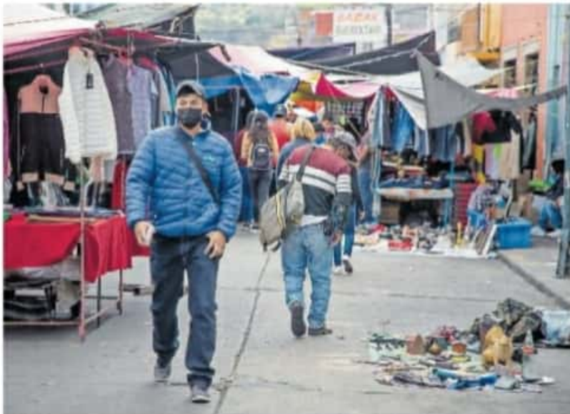
El fin de semana fueron supervisados tianguis para verificar que se ajustaran al límite de afluencia permitida

Con Información de ZUHEY MEDINA, ARMANDO GUTIÉRREZ, YELITZA MENDOZA E IVAN IBARRA