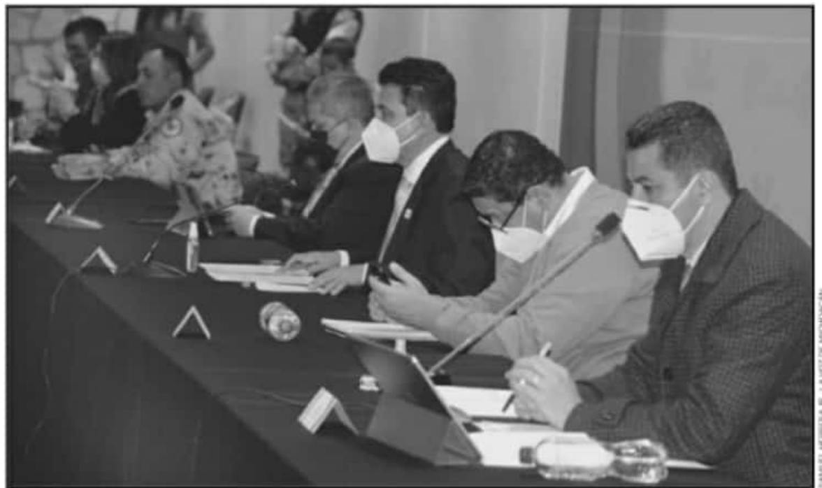
ANTE LOS COMICIOS, EN LUGAR DE MODIFICAR LAS FECHAS SE OPTÓ POR IMPLEMENTAR UN PROTOCOLO PARA PROTEGER A LA CIUDADANÍA COMO A LOS POLÍTICOS.

Fundamentalmente se abordó el protocolo de salud; cómo de manera coordinada, las