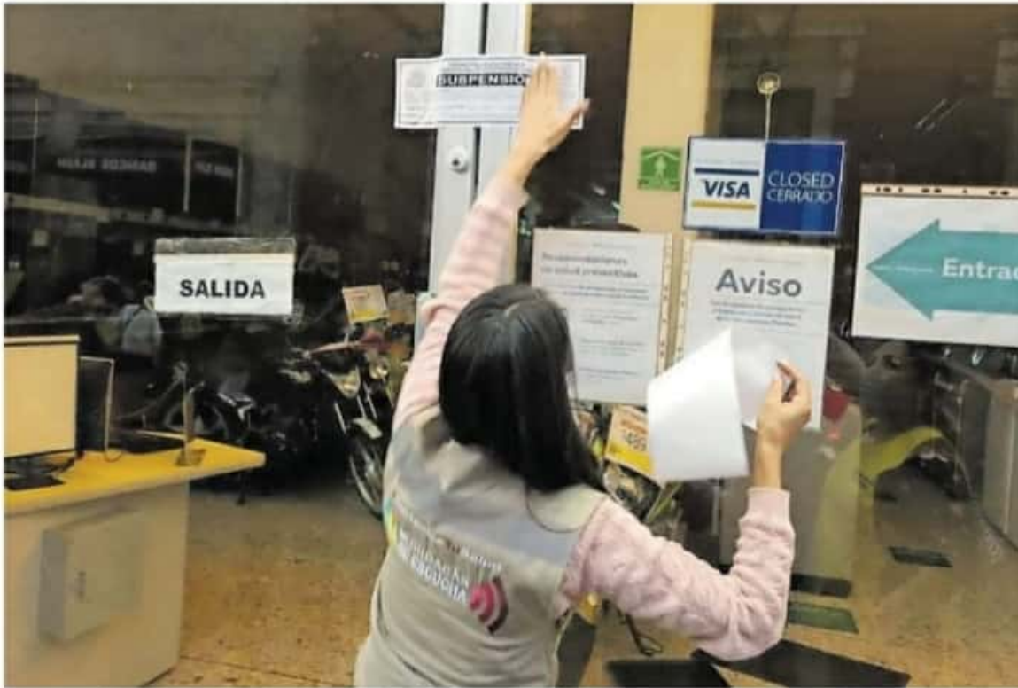
Una sucursal de la cadena Coppel y una más de Elektra fueron suspendidas durante un operativo realizado el domingo 10 de enero en Morelia