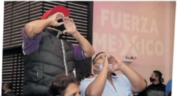
Los manifestantes no dejaron de gritarle al candidato

candidatos respecto a meses pasados, el ejercicio estadístico aplicado el pasado 4 de enero coloca al morenista Raúl Morón como el candidato mejor posicionado con un 27.6%, seguido de Carlos Herrera Tello (presumible candidato de la alianza PAN-PRI-PRD) con el 21.4%, mientras que en tercera posición aparece Arias Solís con el 9.4%.