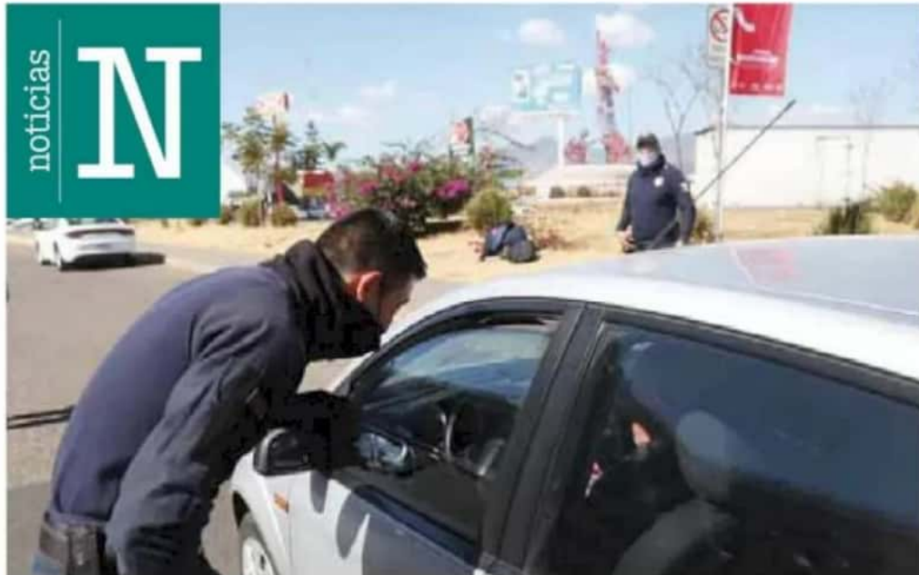
SSP. A través de filtros preventivos, policías reiteran el llamado a la población a respetar las medidas sanitarias.