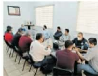
Acumula mil 027 contagios confirmados

31 de enero en los municipios donde se presentaron diferentes aspirantes a candidaturas para presidencia municipal. Mientras que el periodo de precampaña para las y los precandidatos a presidentes municipales será a partir de la publicación de procedencia de su registro y hasta el 30 de enero de 2021.