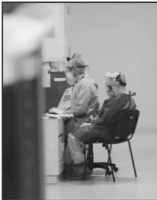
AUTORIDADES DE SALUD RESALTARON QUE CON LAS NUEVAS MEDIDAS SE BUSCA NO SATURAR LOS SERVICIOS HOSPITALARIOS EN LA REGIÓN.