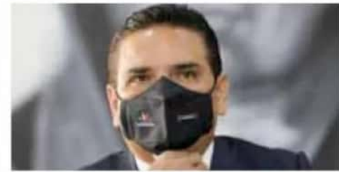
Gobernador. Silvano encabezó la reunión de coordinación para iniciar con la vacunación en la entidad.

A partir de esta semana se aplicará la primera fase de la vacuna a los profesionales de la salud de la primera línea de batalla contra el coronavirus