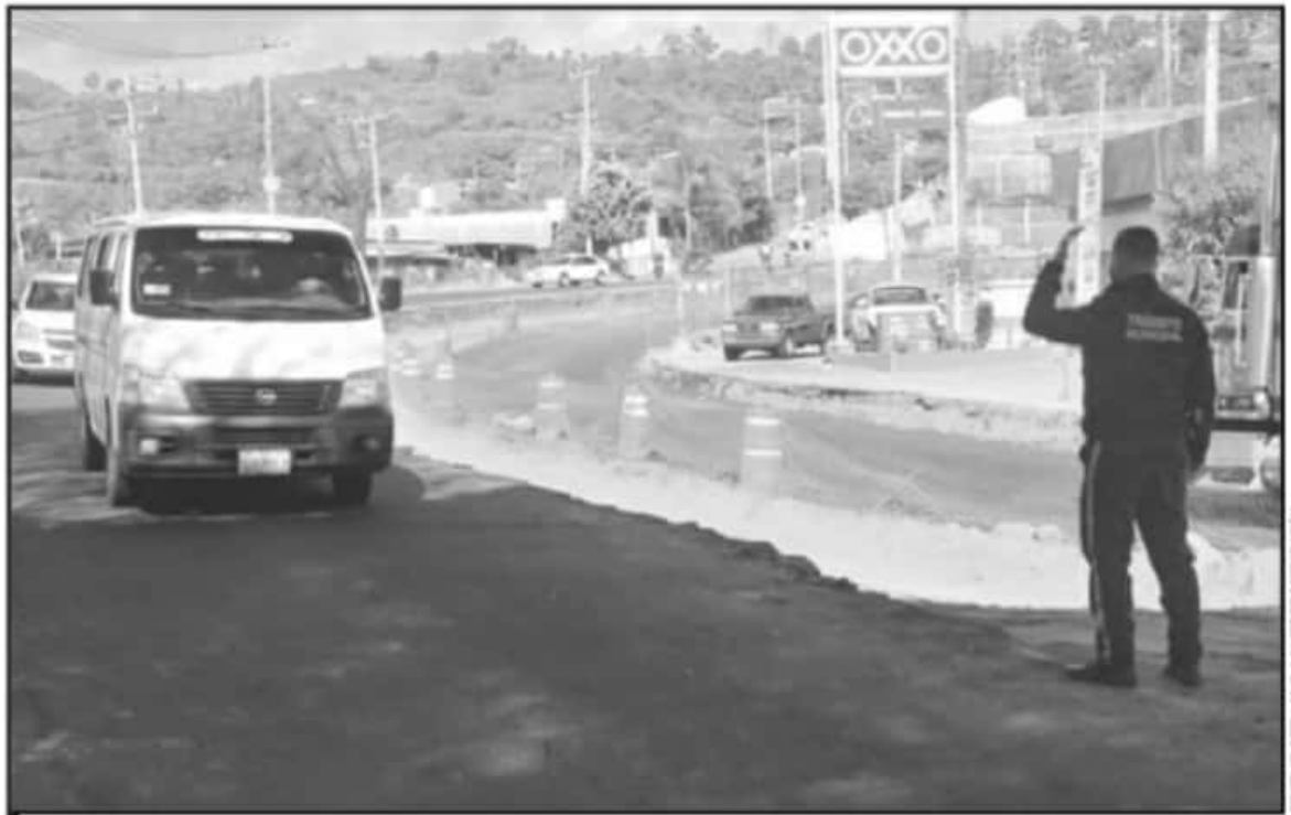
SE PRIORIZAN LOS TRABAJOS EN ARAS DE ELEVAR LA CALIDAD VIDA DE LAS FAMILIAS, SOBRE TODO EN ZONAS DONDE SE REGISTRA ALGÚN GRADO DE MARGINACIÓN.