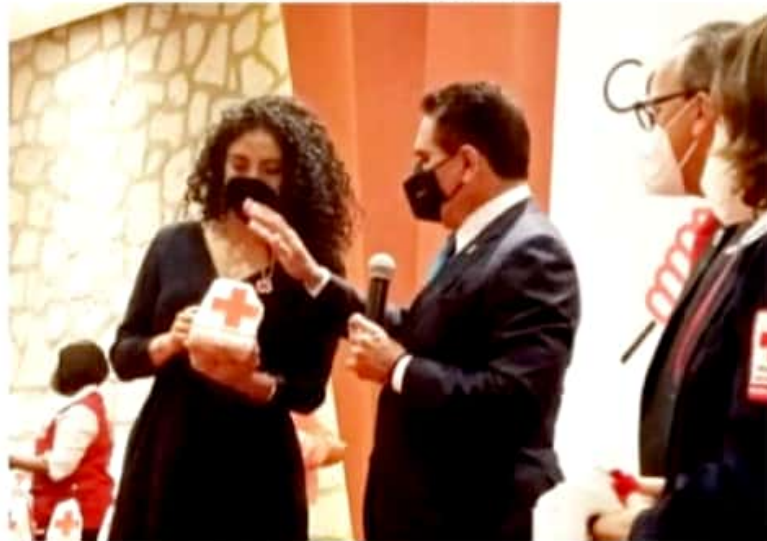
MORELIA, MICH.- Ya sea a través de internet o transferencias bancarias, los michoacanos podrán contribuir a esta dinámica de donativos.

El arranque de la Colecta estuvo encabezado por el gobernador de Michoacán, Silvano Aureoles Conejo, quien aportó la cantidad de 10 mil pesos.