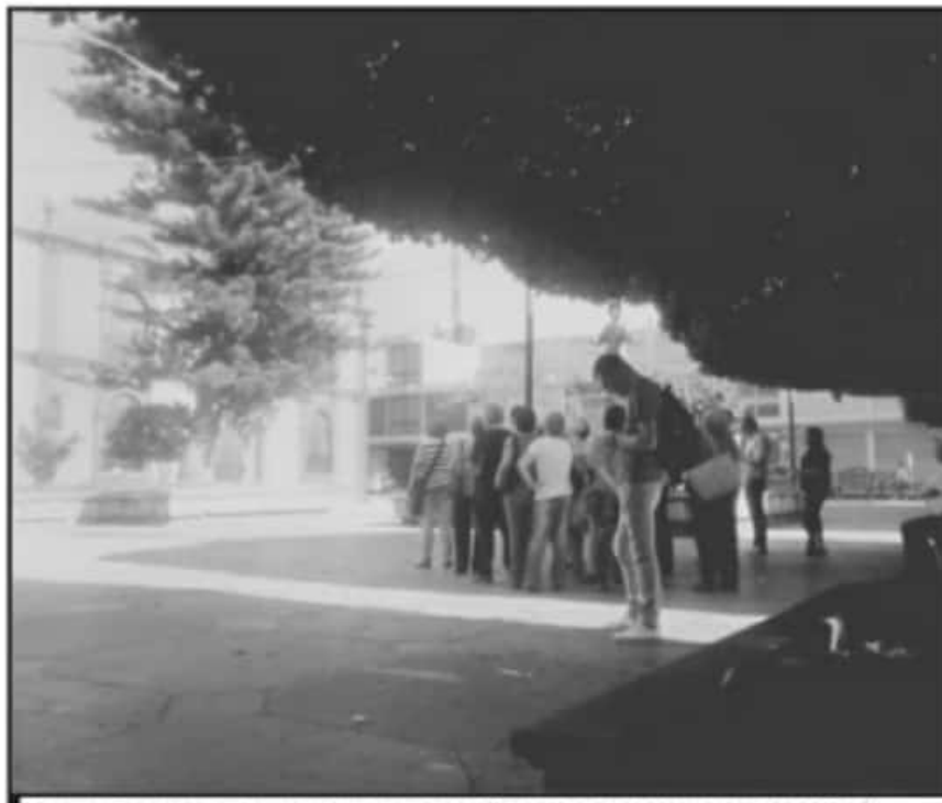
DICEN COMERCIANTES QUE SI LAS IGLESIAS Y PLAZAS ESTAN ABIERTAS, ELLOS DEBEN PODER ABRIR TAMBIÉN.

tólica o de cualquier otra religión, abren el próximo domingo se va a exigir a la autoridad que los cierre o que nos dejen abrir a los comerciantes también".