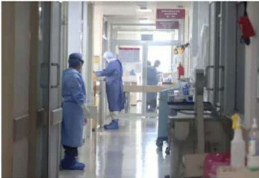
Lázaro Cárdenas, Zamora, Pátzcuaro y Uruapan se suman a La Piedad y Zitácuaro, a Bandera Amarilla