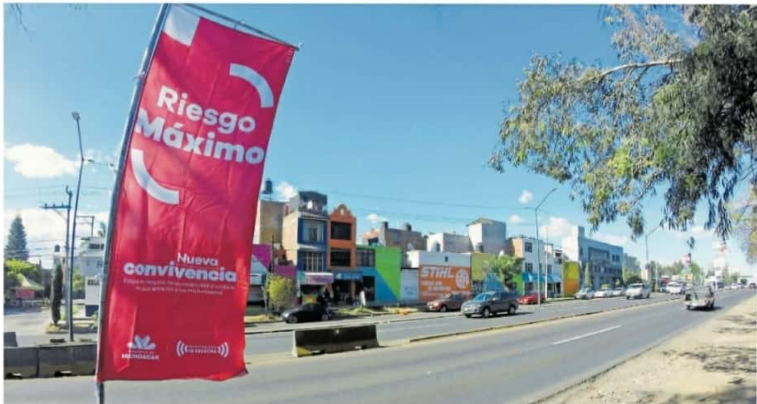
Morelia pasó a bandera epidemiológica roja a nivel estatal por sus altos niveles de contagio de Covid-19, con 575 casos activos en los últimos 20 días