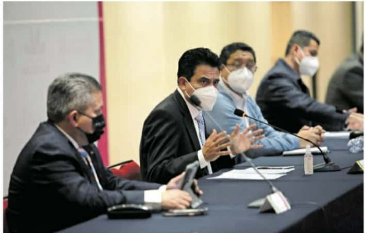
La próxima reunión de las mesas electorales está programada para el próximo 25 de mayo. IVÁN ABAS