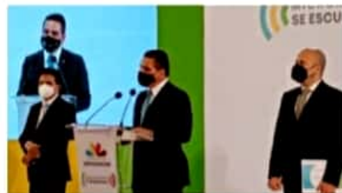
MORELIA, MICH.- El pasado domingo, Morelia registró 134 nuevos contagios, para un total de 8,567 casos confirmados.

Cabe señalar que durante el pasado fin de semana fueron también desactivados 35 eventos como jaripeos, peleas de gallos, bailes y fiestas familiares con alta concentración de personas, en 15 municipios de la entidad.