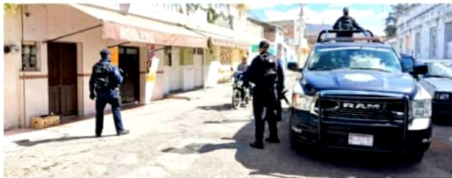
IXTLÁN, MICH.- Elementos policíacos vigilaron en esta demarcación que se cumplieran las nuevas medidas de movilidad.