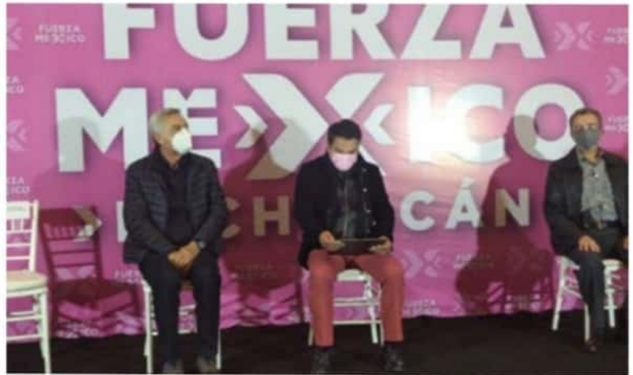
Durante el anuncio de su registro como candidato a gobernador el partido Fuerza por México, el senador Cristóbal Arias Solís, objeto de gritos y consignas en su contra.

"Es una agresión claramente orquestada. Puede venir de la vieja casona de la calle Allende o de cualquier otra, pero el objetivo es claro: intentar golpear y evitar que no llegue", aclaraba el senador, que dejó Morena con la herida abierta. (Quadratin).