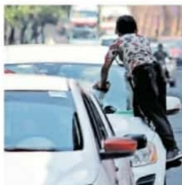
Algunos niños realizaban malabares o venta de dulces

Al término del recorrido, dos menores de edad se pusieron en resguardo del DIF municipal al estar en una situación vulnerable que afectaba sus derechos, por lo que la Subprocuraduría Regional Especializada en la Protección de Niñas, Niños y Adolescentes fue la dependencia encargada de realizar la denuncia correspondiente ante la Fiscalía General del Estado de Michoacán (FGE).