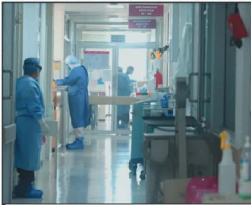
EN LA CAPITAL MICHOACANA, DONDE LA PANDEMIA POCO A POCO VA COLAPSANDO EL SISTEMA HOSPITALARIO.

sando a la cifra que de manera sostenida se venía registrando en Michoacán durante los últimos días. Este repunte es ocasionado por los contagios que se consumaron durante las fiestas de fin de año, lo peor es que el pronóstico de la Secretaría de Salud es que esa incidencia siga durante las próximas horas.