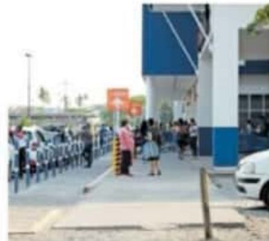
Se realizaron operativos para informar a la gente sobre las medidas preventivas.

En el caso de los comercios que abrieron sábado y domingo, como sucedió con unas taquerías que fueron reportadas por ciudadanos, Itzé Camacho comentó que estos sitios no fue-