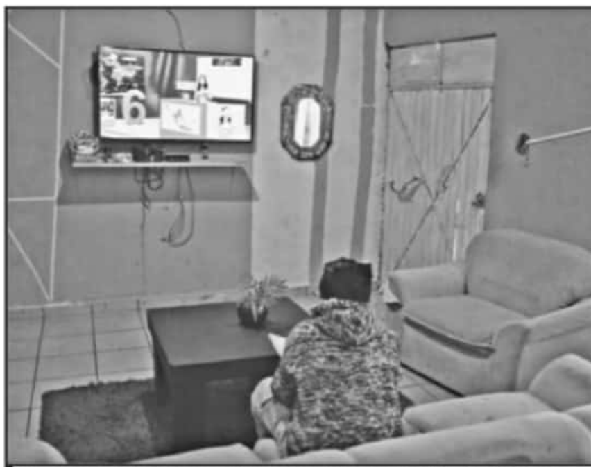
OTRO SEMESTRE CON CLASES A DISTANCIA, LA MAYORÍA DE LOS ALUMNOS NO HA TENIDO BUEN SEGUIMIENTO.