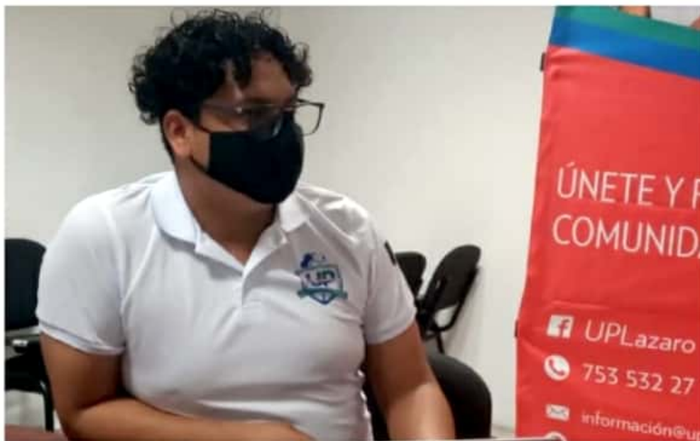
CD. LÁZARO CÁRDENAS, MICH.- La Universidad Politécnica presenta proyecto para descontaminar aguas negras.