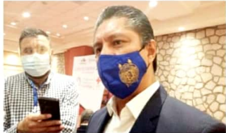
MORELIA, MICH.- No se regresa al cien por ciento, y tampoco se estima que se puedan regresar a las aulas de manera presencial, tal como se había previsto.

"Como universitarios tenemos que ser conscientes para cuidar a nuestra comunidad universitaria y crear medidas que sean ejemplo para el resto de la sociedad", concluyó.