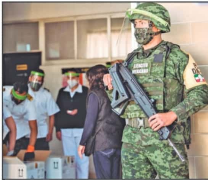
VACUNACIÓN TIENE CALENDARIO. SE INICIARÁ CON PERSONAL MÉDICO EN ESTOS PRIMEROS DOS MESES DEL AÑO.

taria de Salud de Michoacán es la lista de personal médico, nosotros tendremos 16 mil en la lista de personal listo para la vacunación, 16 mil compañeros y compañeras que trabajan en los hospitales en atención COVID. Te hablo de personal del servicio de salud pública, la parte privada es otra cosa", ahondó el mandatario.