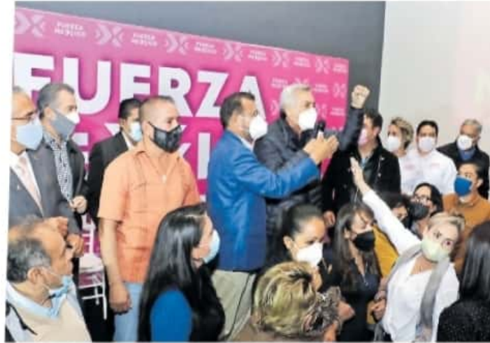
El anuncio de Cristóbal Arias no agradó a varios de los simpatizantes