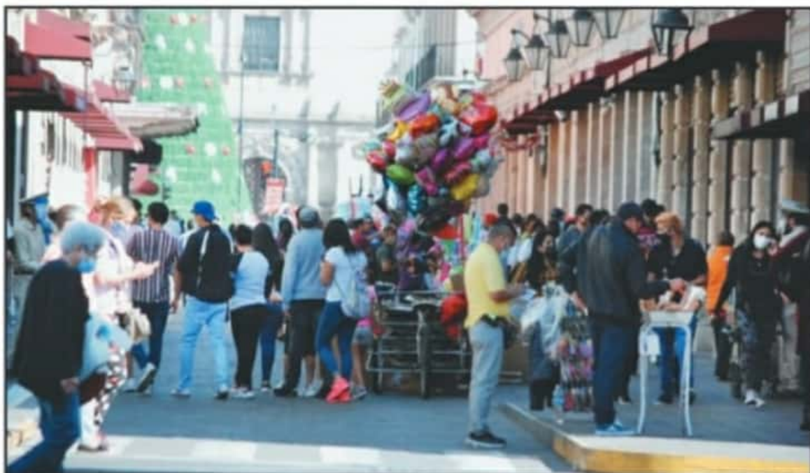
CERRADA DE SAN AGUSTÍN ES UNO DE LOS ESPACIOS PÚBLICOS DONDE SE HA DETECTADO EL MAYOR DESORDEN POR PARTE DE VENDEDORES AMBULANTES.