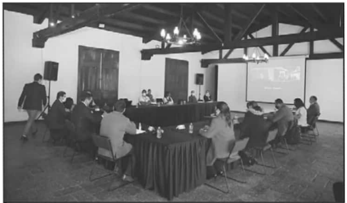
ESTE LUNES SE REUNIERON INTEGRANTES DE LA MESA DE SEGURIDAD, DESDE DONDE INTENTAN COORDINAR ACCIONES PARA ABATIR LA DELINCUENCIA.

10 REGIONES con mayor rezago en formación policial