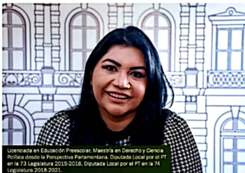
Licenciada en Educación Preescolar, Maestría en Derecho y Ciencia Política desde la Perspectiva Parlamentaria. Diputada Local por el PT en la 73 Legislatura 2015-2018, Diputada Local por el PT en la 74 Legislatura 2018-2021.