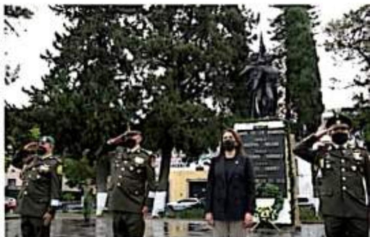
MORELIA, MICH.- En este evento cívico, autoridades municipales, federales y castrenses, recordaron la defensa de la nación realizada por los 6 cadetes del Heroico Colegio Militar ante tropas estadounidenses.

En este acto, se realizó el pase de lista de los Niños Héroes: Juan de la Barrera, Agustín Melgar, Fernando Montes de Oca, Francisco Márquez, Juan Escutia y Vicente Suárez, quienes fueron conmemorados al responder al unísono "Muñó por la patria" y dar paso a los disparos de salvas de fusilería que se ofrece en su memoria.