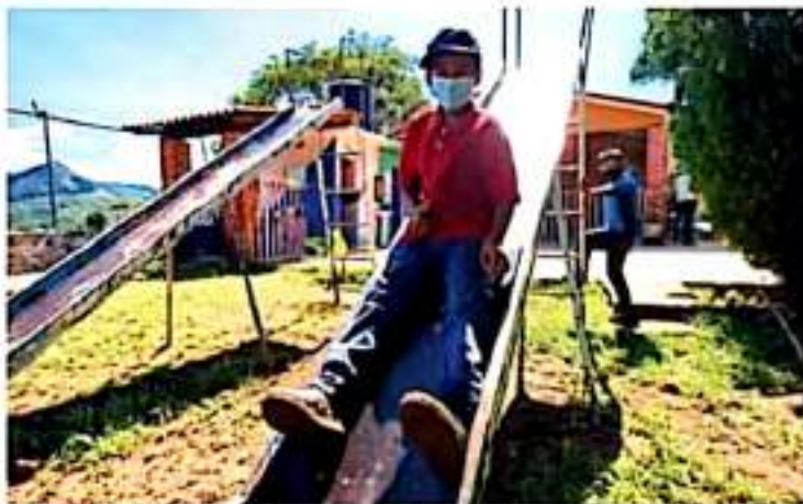
Cuicatlan. En ocasiones el contagio de Covid en menores se confunde con una gripe común.

SARS-CoV-2. Desde el inicio de la pandemia, el mes pasado se registraron cuatro muertes de menores de 19 años; este mes van dos