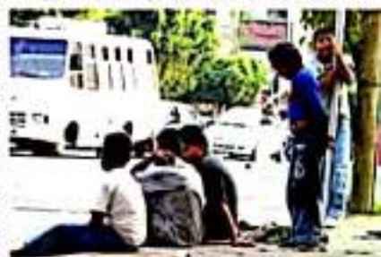
ZAMORA, MICH.- La pandemia misma y la preocupación de los padres de familia, ha orillado a que muchos niños y jóvenes hayan optado junto a sus padres o tutores, abandonar las clases.

Es de comentar que también muchos padres y madres, ante el desempleo, como estrategia de sobrevivencia sumarían a sus hijos e hijas al trabajo en calle.