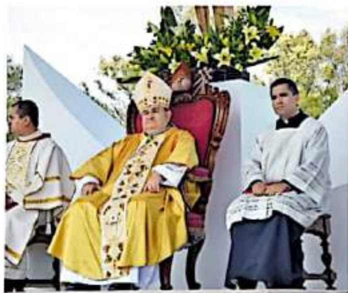
Aún no hay una fecha para que pueda ser dado de alta.

Luisa María Calderón puntualizó que Zamora ha sido muy generosa con ella, por lo que aceptó la invitación.