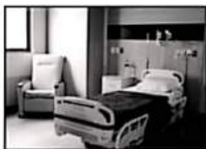
EL HOSPITAL SE MANTIENE ACCESIBLE PARA LA POBLACIÓN.

Explica que era posible que tomara la decisión de venir a Morelia por su contacto con migrantes en Estados Unidos que le comentaron la situación en el país, donde se instala finalmente en contexto de los efectos de la Revolución Mexi-