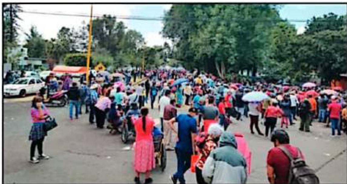
SERÁN LAS SECRETARÍAS DE SALUD DE LOS GOBIERNOS FEDERAL Y ESTATAL LAS QUE GESTIONEN NUEVAS DOSIS PARA LA ATENCIÓN A REZAGADOS.