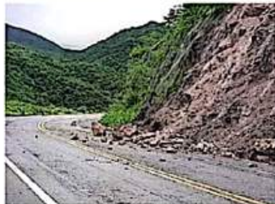
La GN reportó otro derrumbe de talud en la Siglo XXI, cerca de Infemillo.

Por otro lado, se informó del deslave de un talud con caída de rocas en esta autopista, a la altura del kilómetro 257 más 600, que comprende el tramo de Infemillo a Feliciano, tapando el carril en el sentido hacia Lázaro Cárdenas, por lo que se dio aviso a la concesionaria de la autopista, para proceder a retirar ese otro derrumbe, en tanto que personal de la GN abanderaba y daba indicaciones a los usuarios para tomar precauciones al circular por la zona.