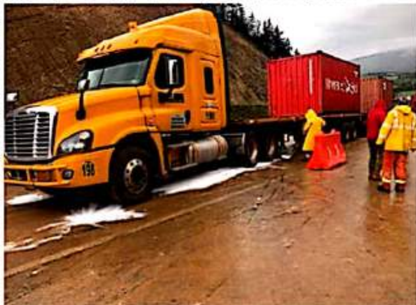
Este tracto camión con doble remolque se atascó al querer pasar por el sitio, todavía fangoso, de la curva pista Siglo XXI.