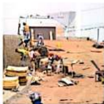
Con 50% de avance, el gobernador dejará pendiente esta obra. | AGO 18/2021

"Concluimos el tramo que va de Morelia a Huetamo de la línea de neocarros del Teatro Matamoros después de 15 años de abandono y se concluyen se entregarán 8 cuarteles para la estancia y desarrollo de la Policía Michoacana", añadió.