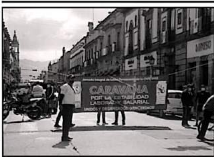
LOS PROFESORES SE HAN MOVILIZADO EN MORELIA Y OTROS PUNTOS DEL ESTADO MANIFESTANDO SU PREOCUPACIÓN

Subrayó que los trabajadores de la educación estatal tendrán certidumbre cuando el gobierno estatal tenga los 3 mil 822 millones de pesos que compromete la Federación.