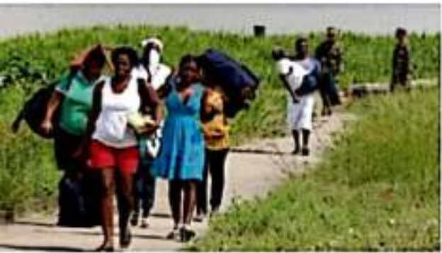
APATZINGÁN, MICH.- Exhortan ofrecer atención humanitaria a los desplazados por grupos del crimen organizado, de los municipios de Coahuacán, Aguililla y Tepalcatepec.

En estas reuniones se busca establecer esquemas de colaboración con las autoridades del federales y estatales y sus corporaciones armadas para alcanzar objetivos comunes, como son fortalecer las instituciones de gobierno con base en la participación ciudadana, construir confianza entre la población y las instituciones de justicia, y resguardar los derechos fundamentales que dotan de dignidad a la vida humana, para propiciar la prosperidad material y espiritual de la gente, que es la mayor y verdadera riqueza de esta región michoacana.