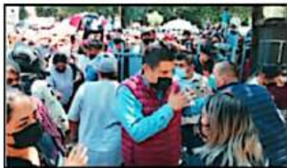
LAS AUTORIDADES OPTARON POR SUSPENDER JORNADA DE VACUNACIÓN.