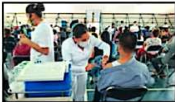
SE EMBRAN LAS MÁS DE MIL 500 DOSIS QUE SE DEJARON DE APLICAR.

De esta forma en este municipio se habrá atendido con esquemas completos a unos 170 mil habitantes mayores de 18 años de edad, de una población superior a los 354 mil residentes, de los cuales más de 200 mil son mayores de 18 años, de acuerdo al Ins-