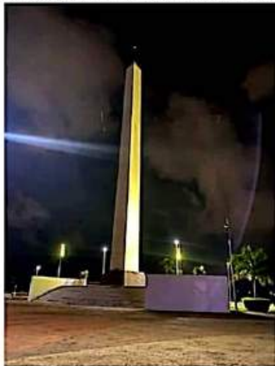
Para concientizar sobre el cáncer, la Apliac, iluminó de dorado el obelisco

Septiembre, es un mes para expresar apoyo y solidaridad, e igual, crear conciencia de que a toda persona le puede ocurrir en cualquier momento y hay que estar alerta para detectar los signos y síntomas de sospecha de cáncer infantil. Las mayores posibilidades de curación se dan cuando se diagnostica la enfermedad en etapas tempranas.