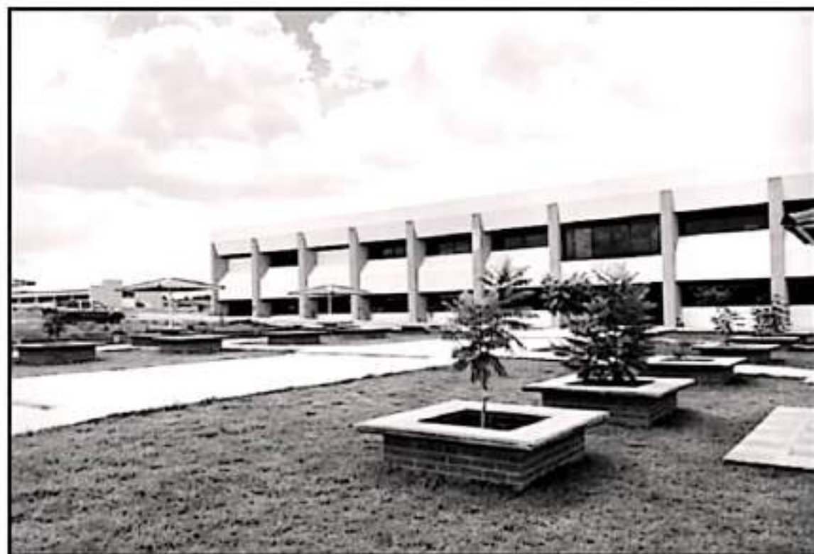
LA UTOM NUEVAMENTE ES CENTRO DE UN CONFLICTO CON LA BASE TRABAJADORA, ESTAVEZ POR PRESUNTOS DESPIDOS INJUSTIFICADOS

Manifiesto que está sazonado temas que ya han denunciado con anterioridad como la falta de pago de prestaciones desde que inició trabajos la pro-