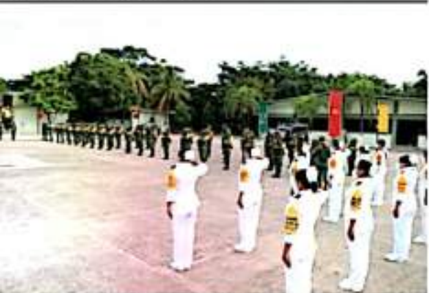
APATZINGÁN, MICH.- Juan Escutia, Juan de la Barrera, Agustín Melgar, Vicente Suárez, Fernando Montes de Oca y Francisco Márquez, quienes se