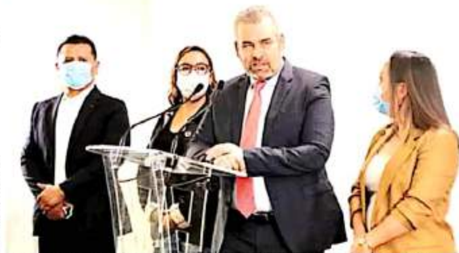
2021-2022. Bedolla pidió a los maestros trabajar juntos para superar los problemas de déficit presupuestal.

En la conferencia de prensa que ofreció este lunes, el monemista subrayó que, de ese monto, la administración de Silvano Aureoles recibió mil 440 millones de pesos para su ejercicio por los canales insti-