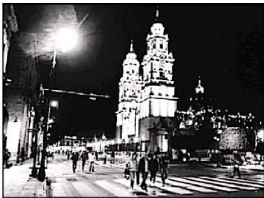
A PESAR DE ESTAR EN BANDERA AMARILLA, EL CENTRO HISTÓRICO NO CONTARÁ CON LOS FESTEJOS PATRIOS.