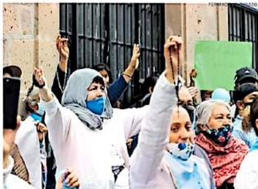
Con pancartas y lonas con frases como "No al Aborto, sí a la vida", rezaron un rosario, previo a su salida.

Michoacán registra 13 carpetas de investigación posicionándose entre los primeros 10 lugares del listado, aunque los estados que más concentran este tipo de delitos son