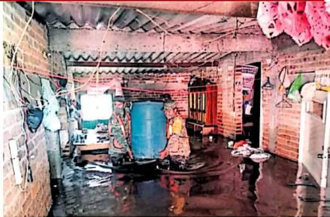
En Artega dentro de familias resultan afectadas por el desbordamiento del río Tescano. Sedena activó el Plan DN-III.