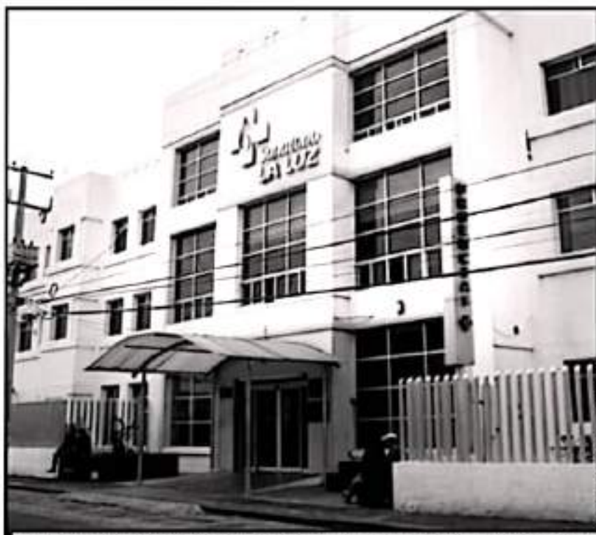
EN ESTE LUGAR SE CONVIERTIÓ UNA MANZANA EN LA COLONIA CHAMPULTEPEC NORTE, DONDE CONSTRUYERON EL HOSPITAL.