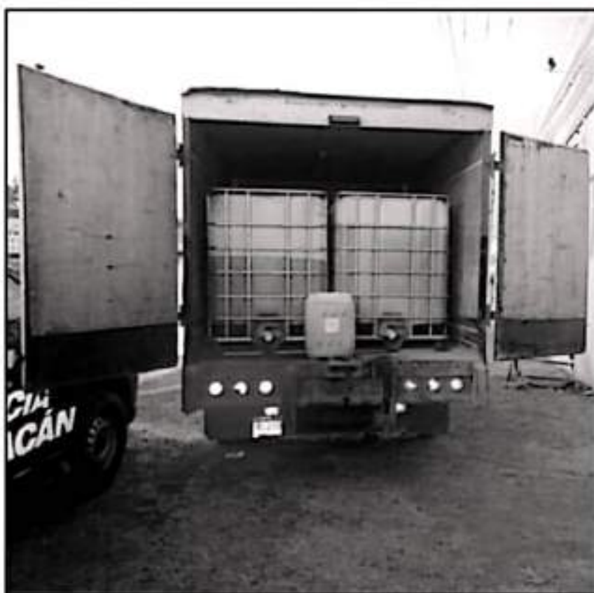
CADA 30 HORAS SE DETECTA UNA NUEVA TOMA CLANDESTINA EN LOS DUCTOS DE COMBUSTIBLE DE MICHOACÁN.

clandestinas detectadas en el primer semestre