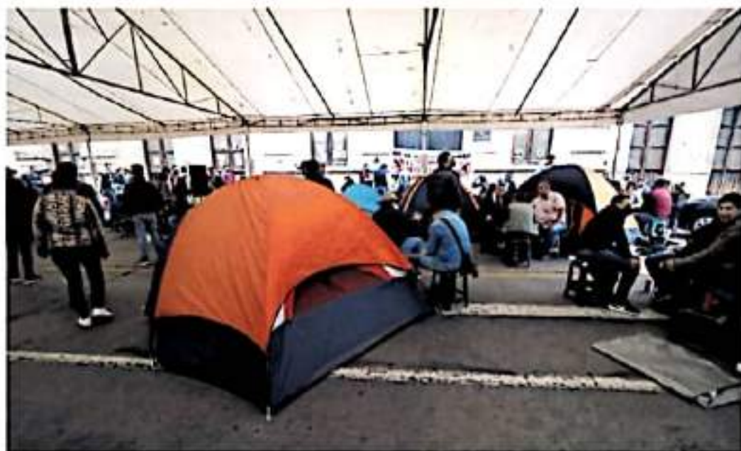
Militancia de Morena y PT mantiene el bloqueo en las inmediaciones del Poder Legislativo.

A 48 HORAS DE QUE CONCLUYA LA LXXIV LEGISLATURA