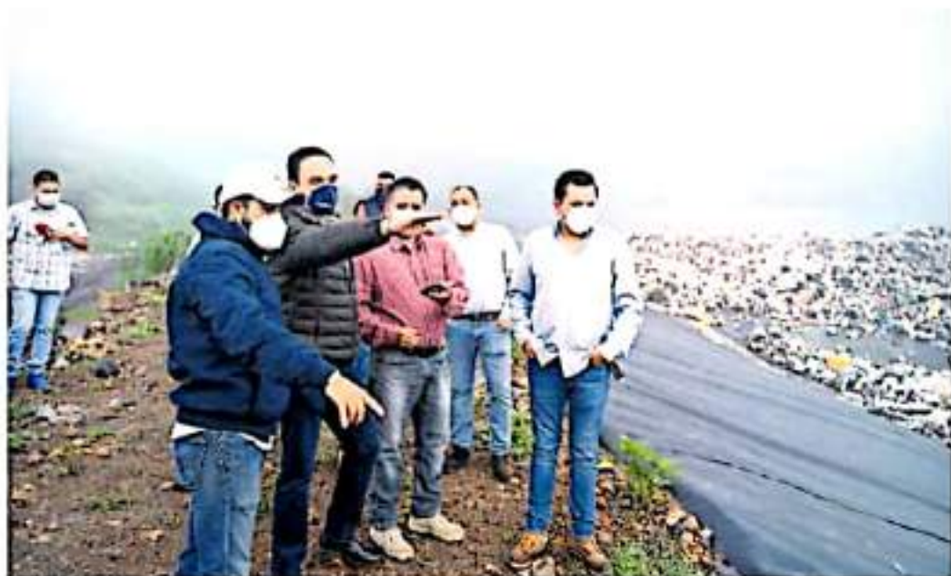
En diciembre es el tiempo de entrega del centenar de proyectos.

Se cancelaron por un año los huertos de los que provenían... MÁS MÁS