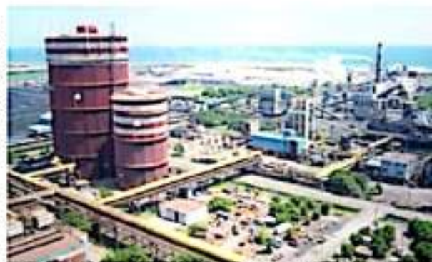
CD. LÁZARO CÁRDENAS, MICH.- El sector manufacturero emplea a 180 mil 982 personas, de las cuales, la siderúrgica emplea directa e indirectamente al 7.88% de trabajadores de este rubro.

Respecto a las emisiones de carbono, el informe sustentía que las emisiones de gases por combustión son monitoreadas y controladas para asegurar la eficiencia en el uso de combustible, cumpliendo