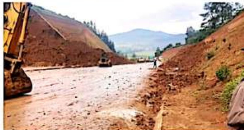
CD. LÁZARO CÁRDENAS, MICH.- El sector transporte de carga pesada aclaró que aún no hay paso por la autopista Siglo XXI, ya que aún se realizan trabajos de limpieza en el tramo afectado por un deslave.

Advertió que los reportes de daños siguen llegando, por lo cual las cifras cambian conforme se emiten los dictámenes con el apoyo de los colegios de ingenieros y arquitectos.