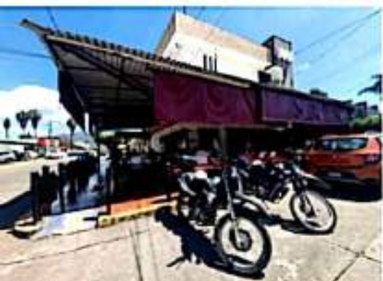
URUAPAN, MICH.- Autoridades municipales notificaron a los propietarios de este restaurante que deben retirar las sillas y mesas que colocan fuera de las banquetas en la banqueta.

En los diversos comentarios hechos en redes sociales, la mayor parte son en el sentido de que la autoridad debe ser "pareja con todos".