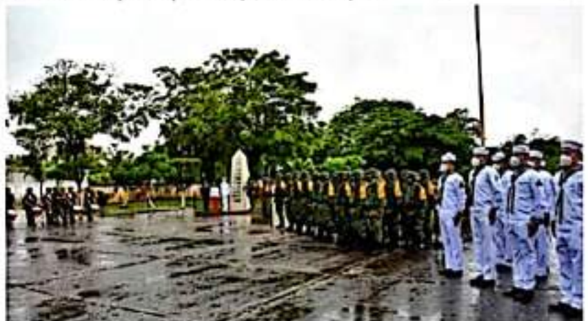
Elementos del 82 Batallón de Infantería y del 20 de la Décima Zona Naval, fueron los únicos que participaron ayer en la breve ceremonia a los Niños Héroes en este lugar.