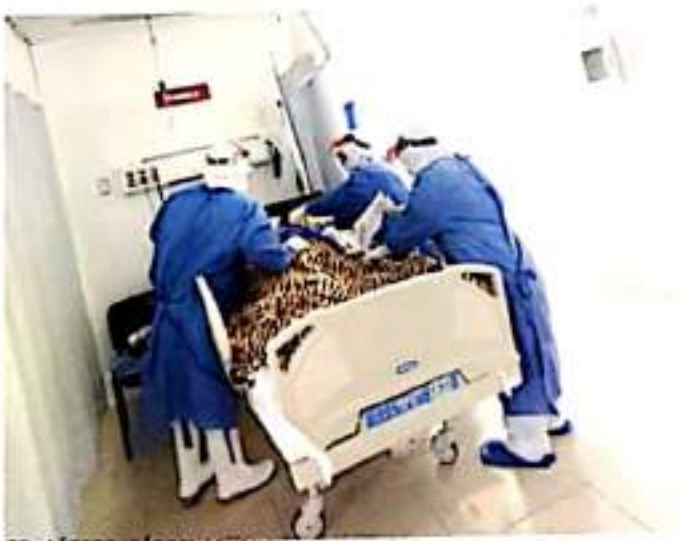
CD. LÁZARO CÁRDENAS, MICH.- Los hospitales del municipio con camas reconvertidas para la atención de pacientes COVID-19 registran una ocupación del 43.85 por ciento.