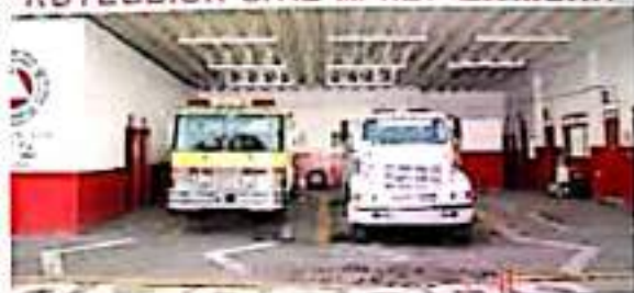
ZAMORA, MICH.- La corporación realizó supervisiones a todos los inmuebles de gobierno, así como a escuelas, hospitales, casa de descanso y orfanatorios.