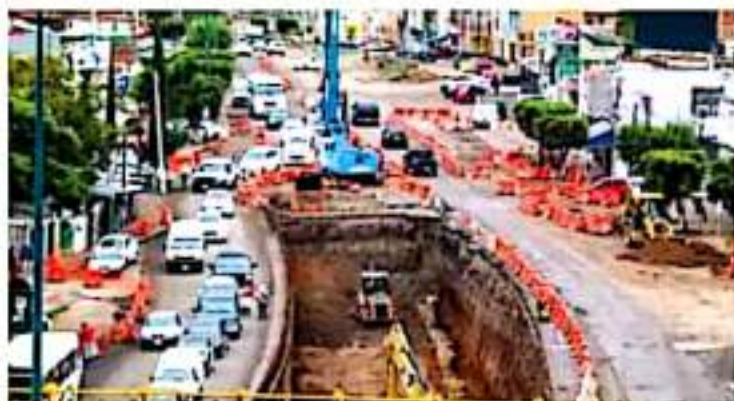
2021. El gobernador dijo que hace seis años la infraestructura estaba abandonada.