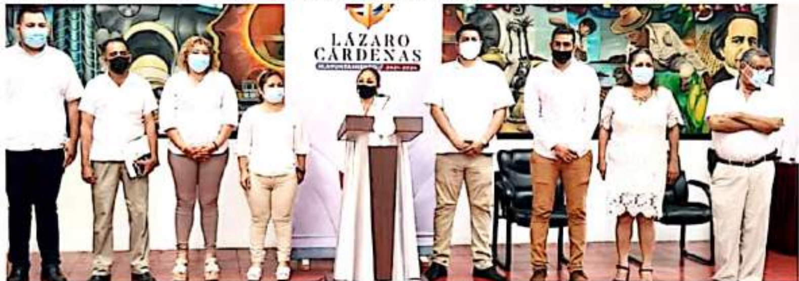
CD. LÁZARO CÁRDENAS, MICH.- Las Fiestas Patrias se celebrarán de manera virtual en Lázaro Cárdenas, informaron las autoridades municipales.