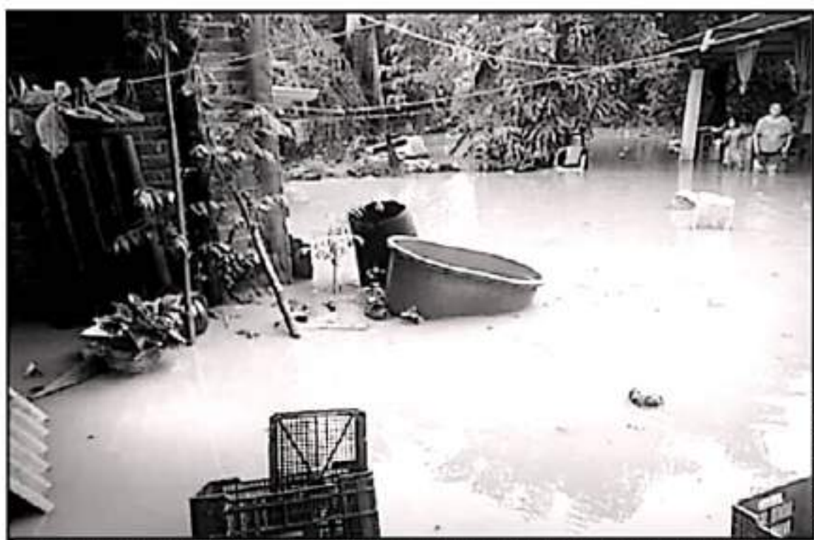
LOS MUNICIPIOS AFECTADOS PODRÁN ACCEDER A LOS RECURSOS DEL PROGRAMA PARA LA ATENCIÓN DE EMERGENCIAS POR AMENAZAS NATURALES.

Es de mencionar que previo a esto, el gobernador Silvano Aureoles Corona, mediante el oficio DGEM/041/2021, fechado el 30 de agosto y con la presentación del acta de sesión extraordinaria del Comité Estatal de Emergen-