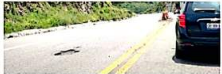
ZIHUATANEJO, GRO.- Necesario rehabilitación en las carreteras que conectan a Guerrero con Michoacán.

Hasta ahora personal contratado por la Secretaría de Comunicaciones y Transportes (SCT), únicamente realiza reparaciones menores con una mezcla de asfalto y tepetate, la cual es muy fácilmente arrastrada por las lluvias.