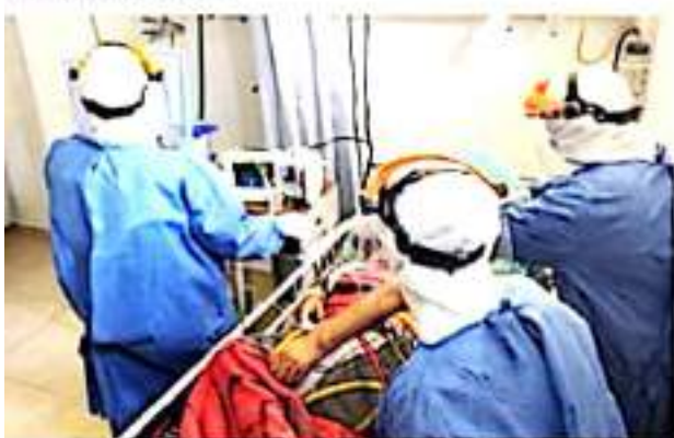
CD. LÁZARO CÁRDENAS, MICH.- Con máximo riesgo de contagio por Covid-19 para la población, Lázaro Cárdenas y Uruapan son los municipios que permanecen en Bandera Roja.

La autoridad sanitaria reitera el exhorto a no relajar las medidas preventivas indistintamente del color de la bandera en que se encuentre su municipio, como lo es el uso de cubrebocas, sana distancia y lavado frecuente de manos, así como el evitar lugares cerrados y concurridos.