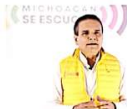
MORELIA, MICH.- "La visión con la que siempre se ha trabajado en esta administración es la de impulsar y construir obras que beneficien a las michoacanas y los michoacanos", afirmó el gobernador Silvano Aureoles Conejo.

"Estoy convencido de que este tipo de obras, bien valen la espera, dejaremos un estado fuerte en infraestructura y con grandes obras que quedarán como legado para todas y todos", concluyó.