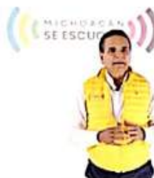
Durante seis años se ha trabajado con la visión de impulsar y construir obras que beneficien a las michoacanas y los michoacanos: SAC.

"Estoy convencido de que este tipo de obras, bien valen la espera, dejaremos un estado fuerte en infraestructura y con grandes obras que quedarán como legado para todas y todos", concluyó.