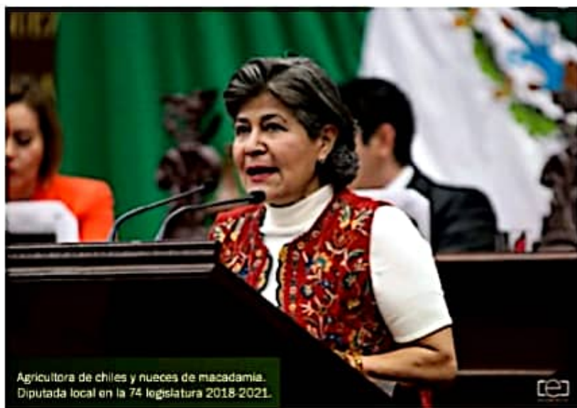
Agricultora de chiles y nueces de macadamia. Diputada local en la 74 legislatura 2018-2021.