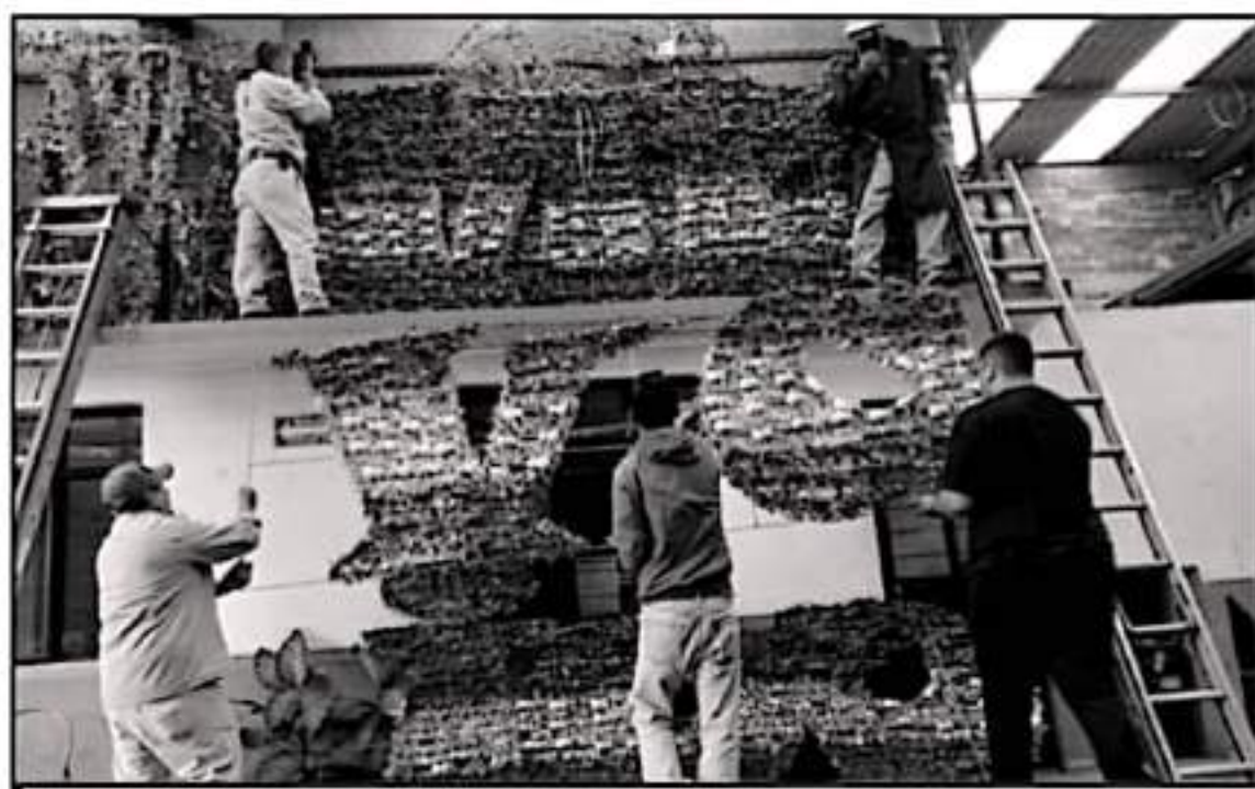
SE CESTARÁ EL TIEMPO PARA EL PRÓXIMO AÑO LA SITUACIÓN EN LA CIUDAD Y EN DIFERENTES SE CESTARÁN LOS MÁS Y MEJORES ADORNOS CON SU RESPECTIVA ILUMINACIÓN

Por otra parte, empleados operativos de esa dependencia municipal señalaron que de los poco más de doce espectáculos que debían existir en bodega, solamente se lograron rescatar cuatro hasta este lunes, en tanto el resto