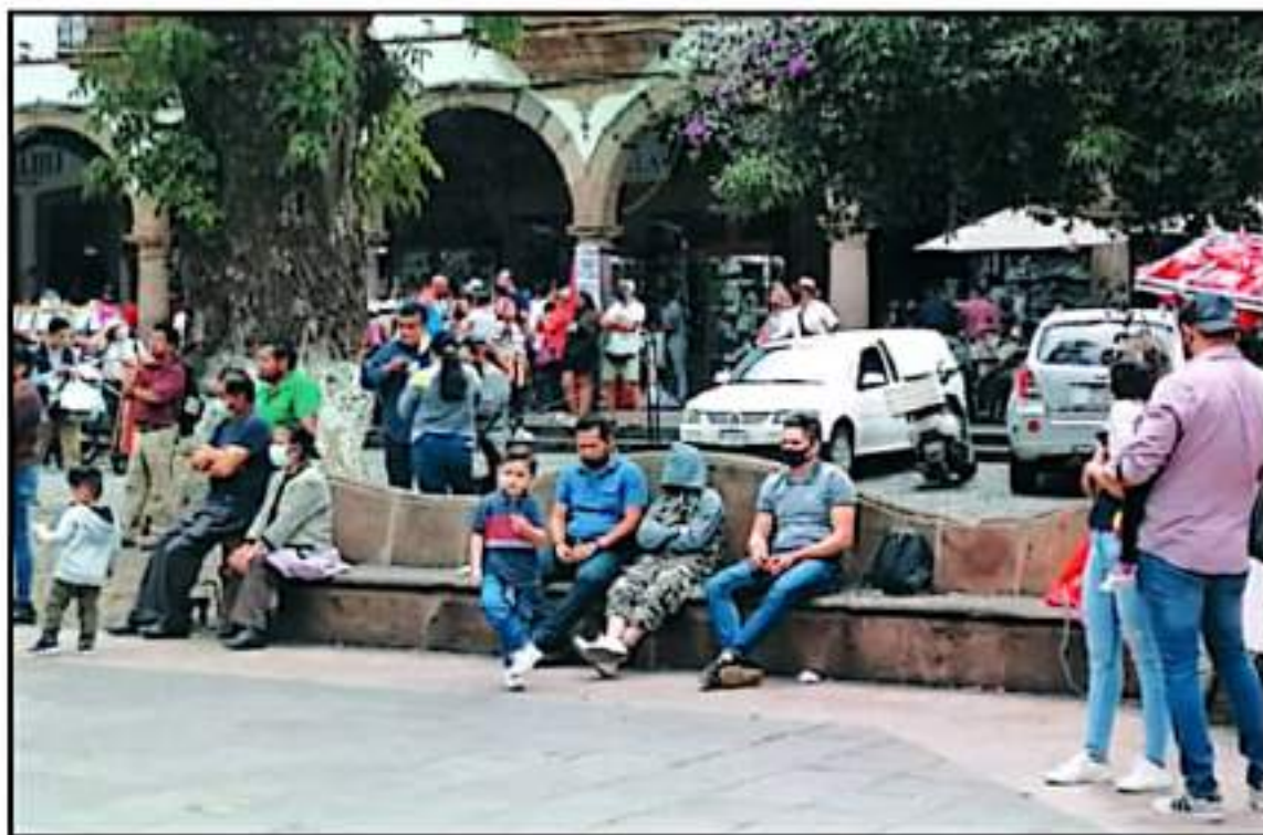
POR VARIAS SEMANAS PÁTZCUARO SE COLOCÓ ENTRE LOS CUATRO MUNICIPIOS CON MÁS CONTAGIOS DE CORONAVIRUS EN EL ESTADO DE MICHOACÁN.

En este contexto, la semana pasada, quedó conformado el Comité de Salud Municipal, donde diversas áreas del Ayuntamiento como la Dirección de Salud, regidores de las comisiones administrativas, además de las direcciones del IMSS, PMSSE, Hospital Regional, Jurisdicción Sanitaria 4, además de profesores, abogados, encargados del orden, representantes del sector transporte, años de tenencias, titulares de asociaciones civiles y fundaciones, comerciantes, directivos de instituciones educativas, representantes de co-