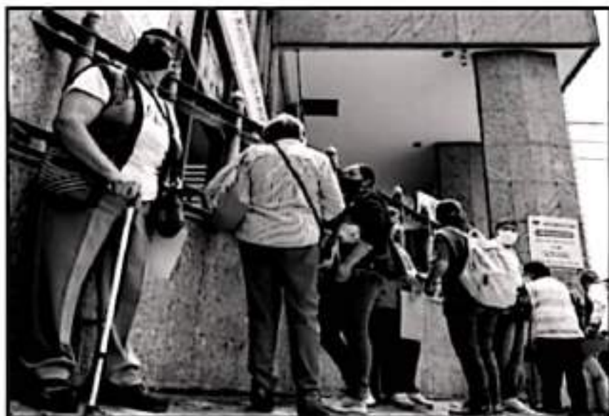
EL GOBIERNO DE LA REPÚBLICA DE AMLO APUESTA A UN PLAN PRESUPUESTAL Y GASTO PÚBLICO PRAGMÁTICO.

nuevos, sino en apuntalar lo ya establecido, por ejemplo, un gasto de 360 mil 299 millones para 8 de los programas sociales ya existentes, lo que significa un incremento del 36% a lo asignado para 2021, principalmente por el aumento del presupuesto de las Pensiones para Adultos Mayores.