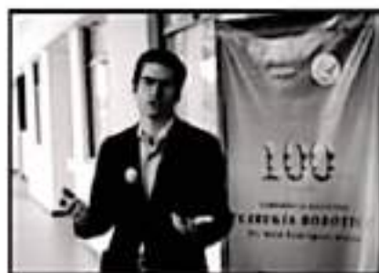
EL DIRECTOR PRESIDENTE CAMARÓN DE LA INSTITUCIÓN.