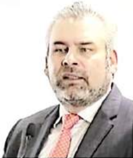
MORELIA, MICH.- El gobernador electo en Michoacán, Alfredo Ramírez Bedolla.

Los bonos que se van a pagar son por el orden de los 651 millones de pesos que es lo que se adeuda desde 2020 se estarían cubriendo, y finalmente se cubrirían 677 millones de pesos para pagar quincenas que se adeudan de agosto, y 475 millones de