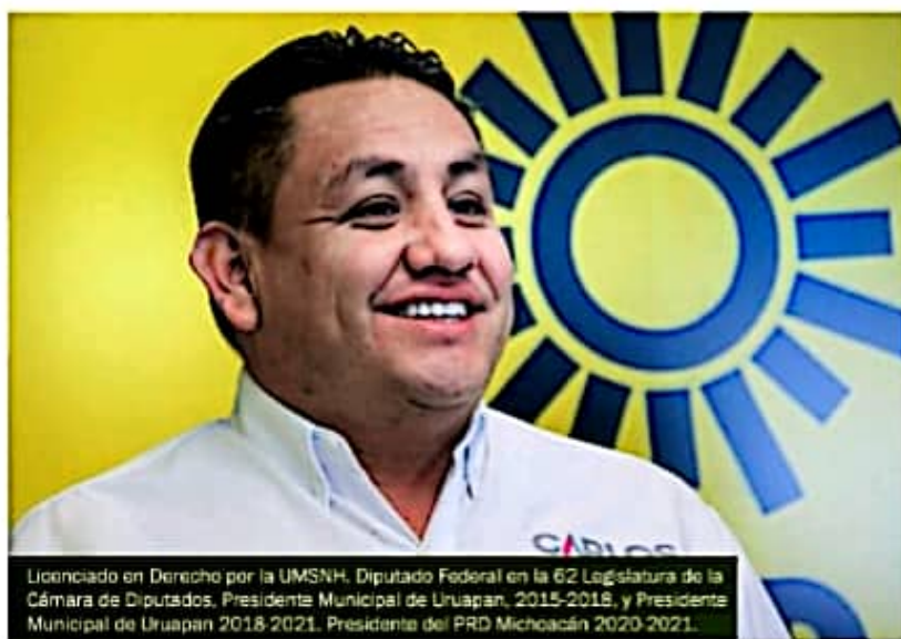
Licenciado en Derecho por la UMSNH, Diputado Federal en la 62 Legislatura de la Cámara de Diputados, Presidente Municipal de Uruapan, 2015-2018, y Presidente Municipal de Uruapan 2018-2021, Presidente del PRD Michoacán 2020-2021.