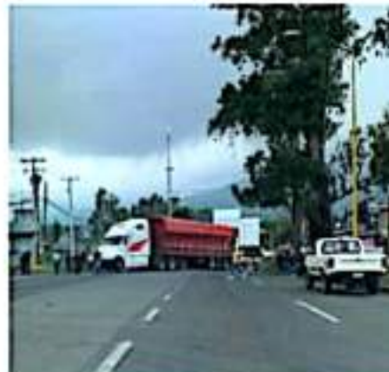
URUAPAN, MICH.- Integrantes de "Poder de Base" bloquearon ayer durante dos horas el Boulevard Industrial.

Cabe señalar que la mañana de este lunes, el gobernador electo de Michoacán, Alfredo Ramírez Bedolla, anunció que se gestionará ante la Federación más de 3,800 millones de pesos, de los cuales, 1,400 serán ejercidos por la administración saliente para el pago de quincenas atrasadas y bonos que se adeudaron desde el 2020.