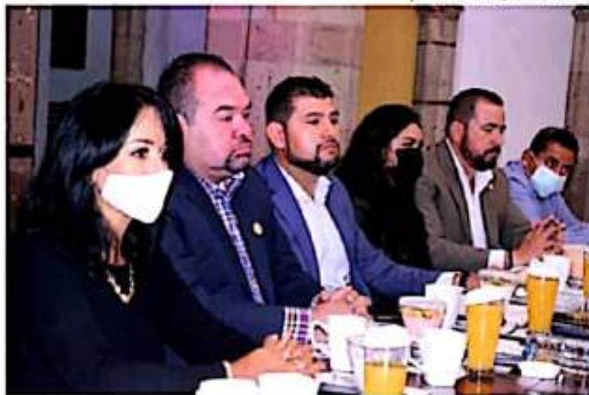
Integrantes del Grupo Parlamentario del PRD en la 74 Legislatura de Michoacán.

Viene de la Pág. 1 y con las mismas actitudes de siempre, solo que aquí hay que ver, porque es y va a seguir siendo muy controversial hay quienes le aplauden y también hay quienes la critican, ojalá y con esa experiencia adquirida en estos tres cortos años, nos calle la boca a muchos, depende de ella seguir en la jugada política, porque ya ve este patrón, que los costejitos michoacanos somos bien fijados, por cierto, ya sabe este quién todavía sigue entripado con el triunfo de los morenistas? Se lo dejo de tarea y en la próxima lo comentamos ¡vay! Cuidense mucho y hasta la próxima. Yo descansaré unos diyitas je-jeje.