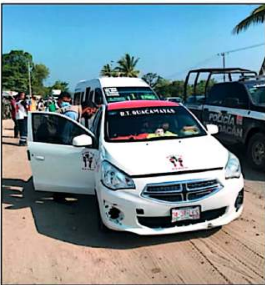
AL INICIAR LA SEMANA, LAZARO CARDENAS MUESTRA BUENAS EXPECTATIVAS EN MATERIA DE CORONAVIRUS.