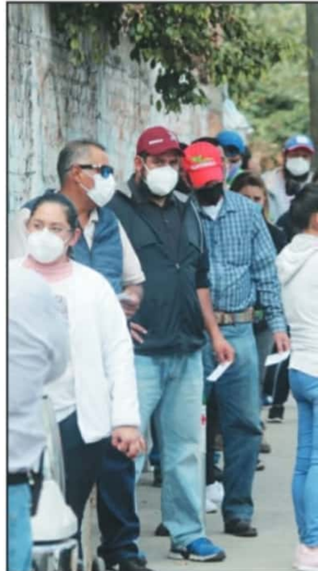
UNA ESCENA QUE NOS MUESTRA LA REALIDAD DEL AVANCE DE LA PANDEMIA. LA

menor. Un tanque lleno puede llegar a costar hasta 2 mil pesos la recarga, mientras que los más pequeños, mismos que duran poco menos de una semana en condiciones relativamente estables, tienen un costo de 800 pesos. A lo anterior, se tiene que sumar el costo de renta de los tanques, válvulas y otros medicamentos para los convalecientes de las vías respiratorias.