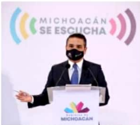
MORELIA, MICH.- El mandatario destacó que en el presente mes van registrados 4 mil 600 casos de Covid-19, lo que supera los de diciembre.

Indicó que, aunque los gobiernos y comités municipales comienzan a entender la situación de emergencia que se vive y son ya 69 municipios los que se han sumado a las medidas de la nueva movilidad y a