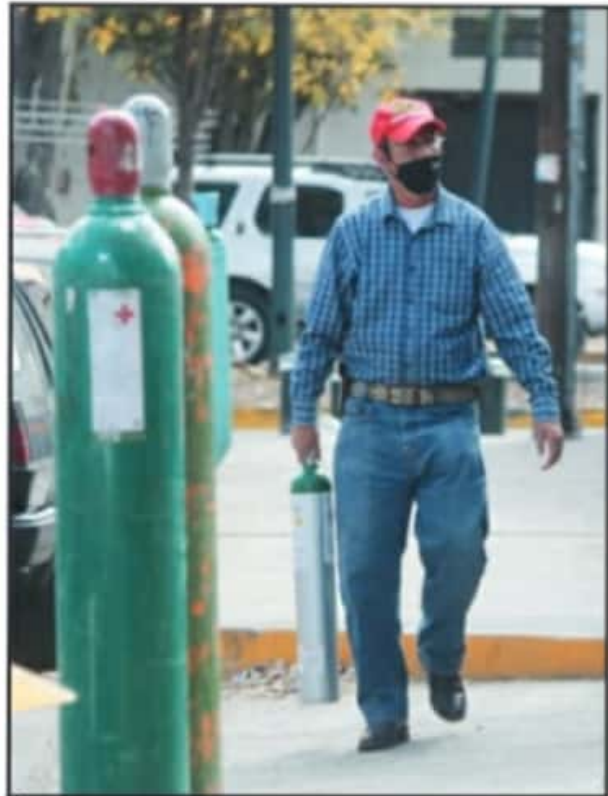
LA GENTE TIENE QUE LLEGAR CON SU PROPIO EQUIPO PARA SER RELLENADO.