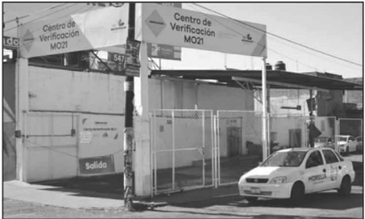
2004, CUANDO SE ESTABLECIÓ EL PROGRAMA SE ENTREGARON UN APROXIMADO DE 130 CONCESIONES, CON EL PASO DE LOS AÑOS LA CIFRA SE FUE ENCOGIENDO.

La respuesta fue la misma en todas las sedes, se teme que sea hasta el mes de febrero cuando puedan iniciar a laborar con normalidad y con apego a las normas sanitarias por la COVID 19 a los ya