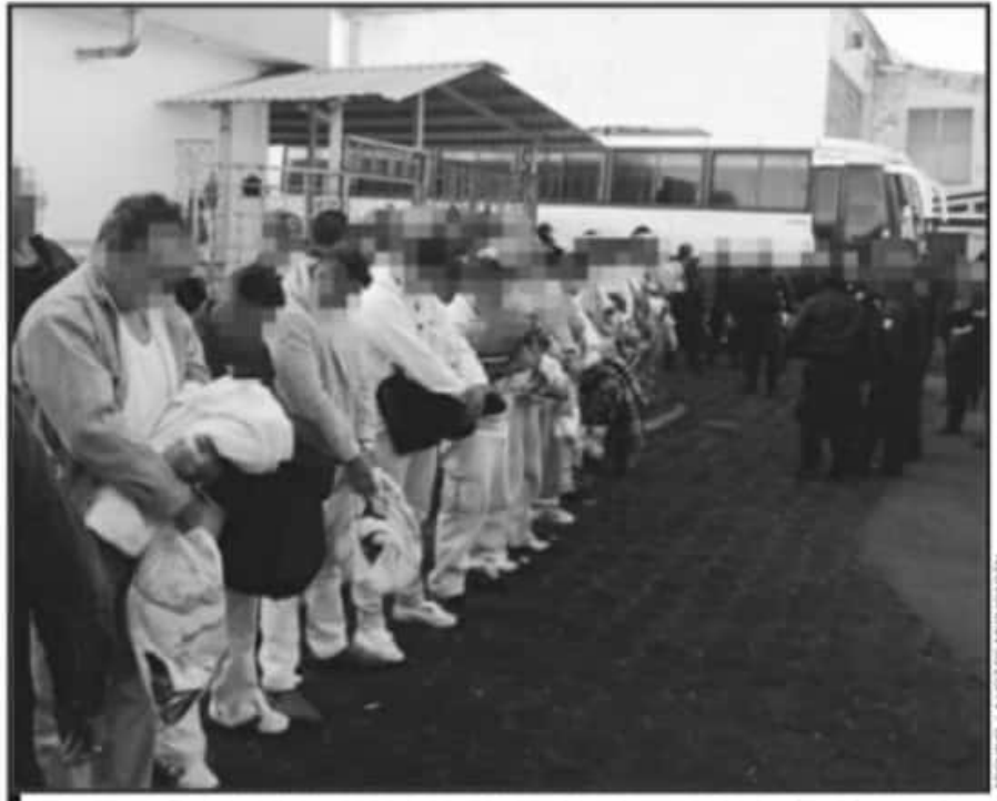
ANTE EL CIERRE DE CEFERESOS, MICHOACÁN SE HA CONVERTIDO EN DESTINO DE PRESOS DE ALTA PELIGROSIDAD.

En julio del año pasado, en un hecho sin precedentes, la Tierra Caliente michoacana se convirtió en una extensión del Penal de Puente Grande; más de 380 reos del penal de máxima seguridad fueron trasladados al Centro Federal de Readaptación Social (Cefereso) en el municipio de Buenavista Tomatlán, con lo que varios de los criminales de alto