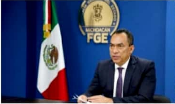
MORELIA, MICH.- López Solís, aportó que previo a la instalación, de cada 100 homicidios se aclaraban 11; actualmente se resuelven 55.

En el caso de las regiones, puntualizó que se está avanzando para lograr tener 35 por ciento de efectividad en este tipo de delito que consideró es el que mayormente impacta y vulnera la tranquilidad de los michoacanos.