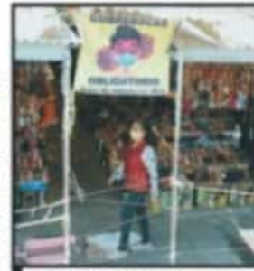
HAY LETREROS CON EXHORTOS.

comentó que sí ha habido desacuerdos cercanos a la violencia física, por lo cual se ha optado por publicar anuncios sobre el uso de cubrebocas en las inmediaciones del mercado, para que los compradores sean más sensibles al momento de encontrarse en la puerta de entrada.