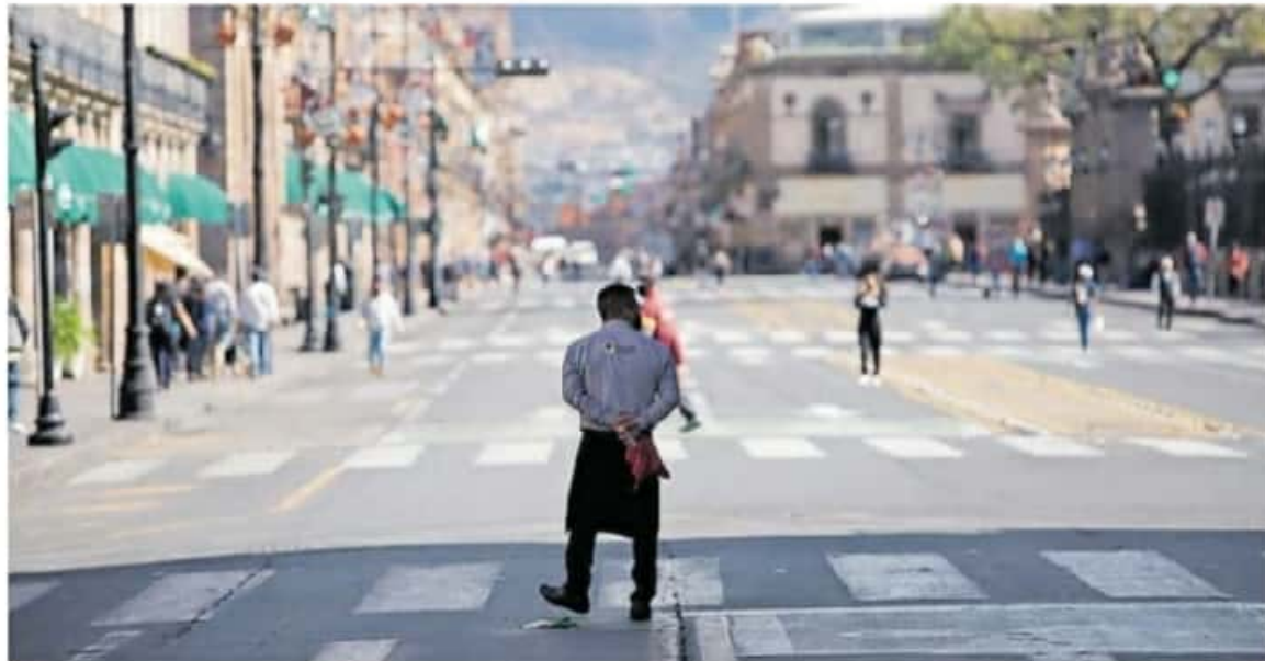
Ya se analiza el cierre total de negocios de jueves a domingo a nivel estatal. JUAN ARBAS