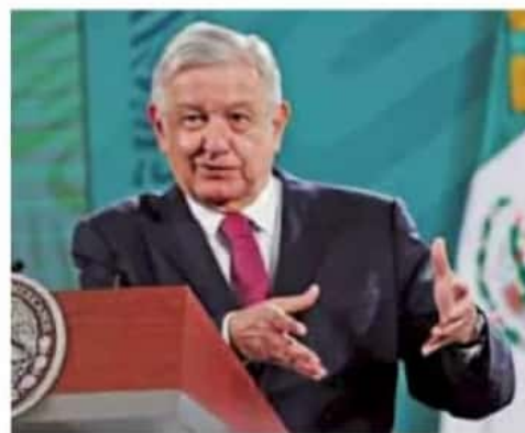
Reanudación. De acuerdo con las estimaciones, el 8 de febrero se retomaría la entrega de vacunas.

“Pfizer está replanteando sus entregas. Se tenía contemplado que para mañana (martes) iban a llegar otras 400 mil dosis, pero las quiere limitar a la mitad. Esto lo están haciendo en todo el mundo (...) para que la ONU pueda ofrecer vacunas a países que tienen más dificultad para contar con las vacunas”, indicó.