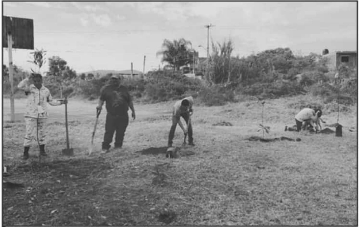
CON LA PARTICIPACIÓN DE ELEMENTOS DE LA GUARDIA NACIONAL, EL PASADO DOMINGO FUERON SEMBRADOS DE ARBOLITOS, DONADOS POR CLUB ROTARIO.

Así mismo, añadió que estos avances los motivan a seguir adelante prácticamente en solitario por la poca participación de los tres órdenes de gobierno, sin embargo, valoramos mucho cuando se suman, como ocurrió este domingo con la participación de elementos de la Guar-