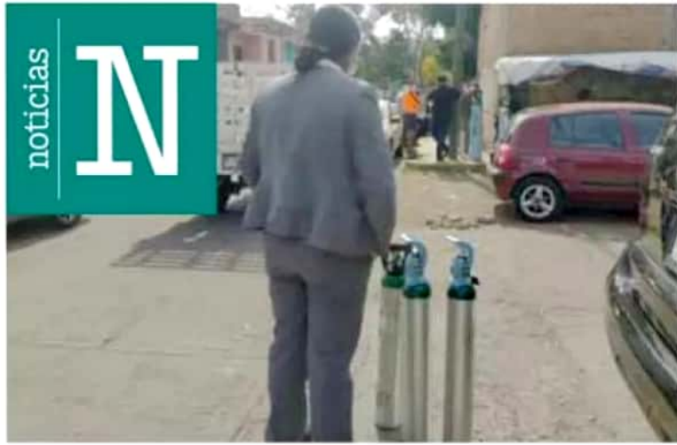
Gastos. El relleno de un tanque de oxígeno puede costar 2 mil pesos.