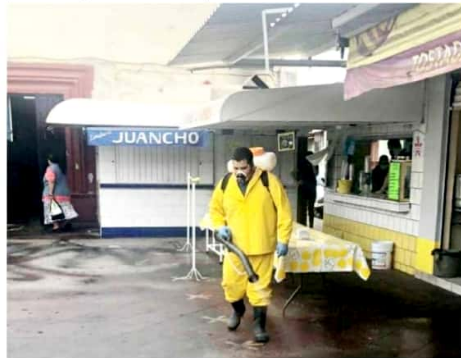
ZAMORA, MICH.- El viernes pasado inició el operativo de desinfección en los espacios públicos como mercados, accesos de bancos, mercados calles y corredores.

Así mismo, se cerraron establecimientos con venta de alcohol en domingo, y se recuerda que no hay permisos ni licencias para fiestas o reuniones sociales de ningún tipo.