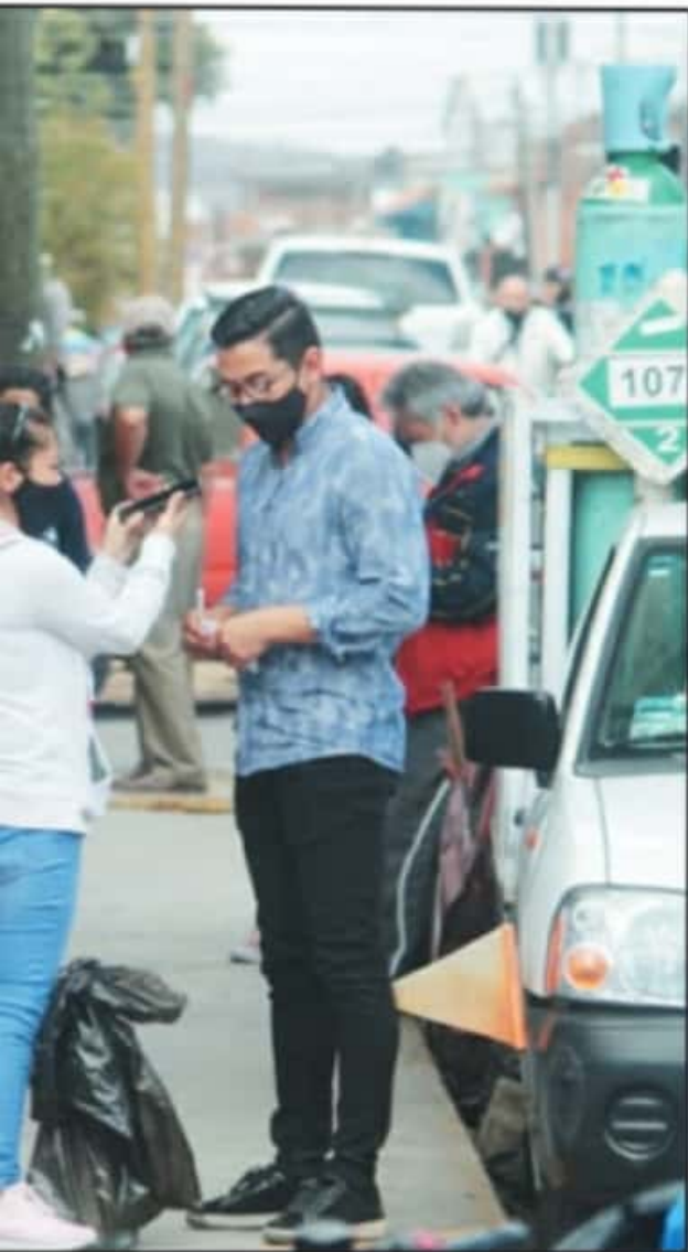
NECESIDAD DE RECARGAR TANQUES DE OXÍGENO MÉDICO LO DICE TODO.