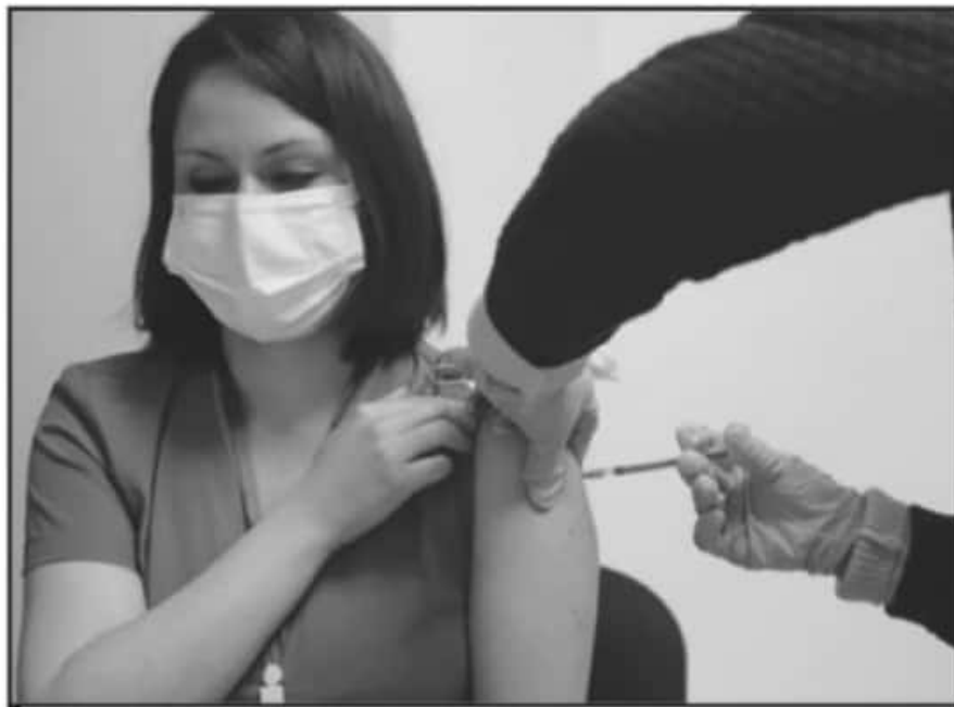
PARA CUMPLIR CON LA SEGUNDA ETAPA DE VACUNACIÓN, SE ESPERA ARRIBEN AL ESTADO MÁS DE 7 MIL NUEVAS DOSIS.

autoridad estatal en cuanto a un supuesto déficit del biológico que finalmente arribó a Michoacán, y las acusaciones de que indebidamente personal de la Federación se había vacunado pese a no estar contemplados originalmente.