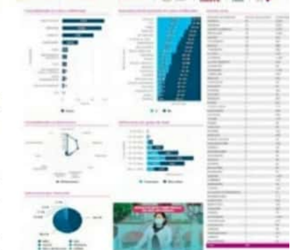
Ayer el CESS reportó 19 nuevos casos positivos de COVID-19 para el municipio de LC.