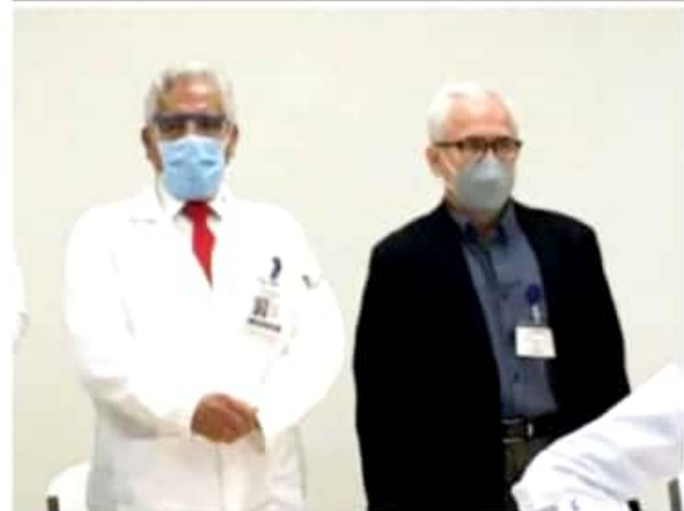
APATZINGÁN, MICH.- El galeno es nativo de esta ciudad e hizo sus estudios