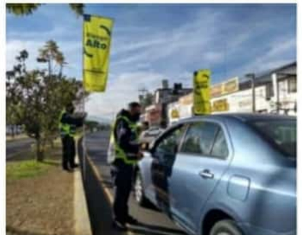
La Piedad, Lázaro Cárdenas, Pátzcuaro, Uruapan, Zamora y Zitácuaro son los municipios que se encuentran en riesgo alto de contagio del virus.

El Gobierno del Estado pone a disposición de la población el 800-123-2890 con 11 líneas para resolver todas sus dudas, así como el micrositio bit.ly/MichCOVID-19 , donde encontrarán toda la información disponible sobre COVID-19.