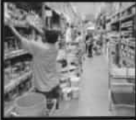
LA VOZ DE BOGOTÁ