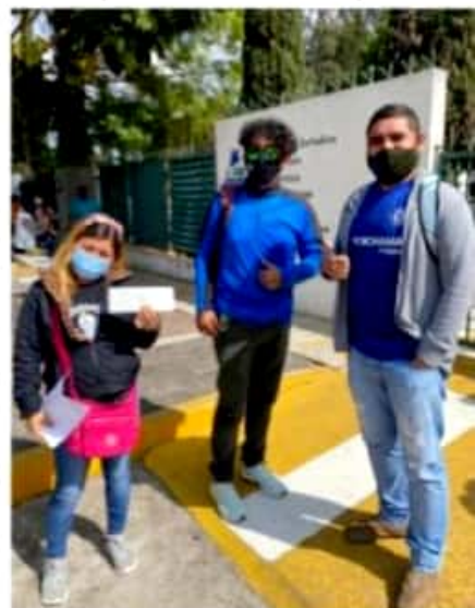
CD. LÁZARO CÁRDENAS, MICH.- Profesores eventuales adscritos a la CNTE en los municipios de Lázaro Cárdenas, Arteaga, Aquila y Coahuayana, recibieron el pago de salarios devengados desde hace un año y medio.

Según cálculos de la CNTE, para los 1,200 eventuales del estado, se destinaron 55 millones de pesos.