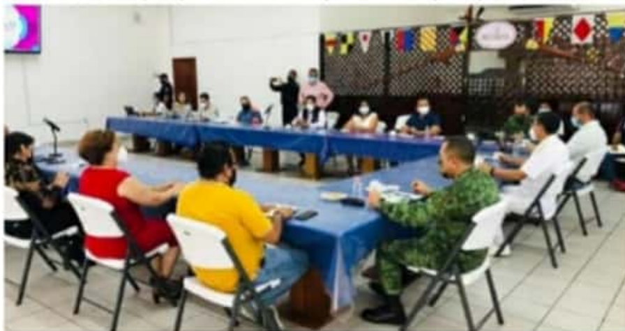
Cierre parcial de establecimientos no esenciales de jueves a sábados, fue uno de los acuerdos que tomó ayer el Consejo de Salud Jurisdiccional de este lugar.

A fin de proteger la salud de los habitantes, el personal operativo mantiene las labores de proximidad social en los municipios mencionados, exhortando a la población a utilizar cubrebocas en espacios públicos, transporte y comercios, ➡ 6