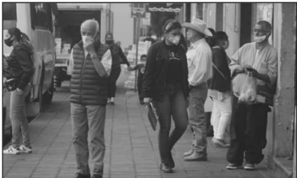
DE SEGUIR CON EL INCREMENTOS DE CASOS, EL GOBIERNO DEL ESTADO NO DESCARTA UN CIERRE TOTAL DE JUEVES A DOMINGO DURANTE EL PRESENTE MES

"Enero está siendo demasiado difícil para la contención de la epidemia, por el elevado número de contagios y, desafortunadamente, de muertes. En más de 10 meses de epidemia, el pasado sábado 16 de enero fue el día con mayor número de casos positivos de COVID en el estado, un total registrado de 568 solo en un día y el número registrado hasta lo que va del mes de enero es que llevamos 4 mil 641, esto supera todos los que se registraron en el mes de diciembre".