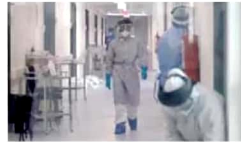
Día negro. El 16 de enero se registraron 568 casos.

El gobernador reiteró el llamado a la población a tomar conciencia sobre la gravedad de la situación, ya que tan sólo la semana pasada se desactivaron 21 eventos masivos