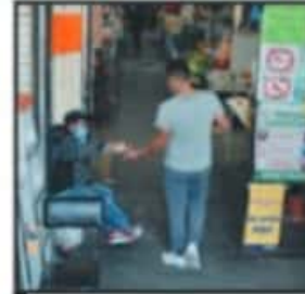
EXISTEN FILTROS SANITARIOS.