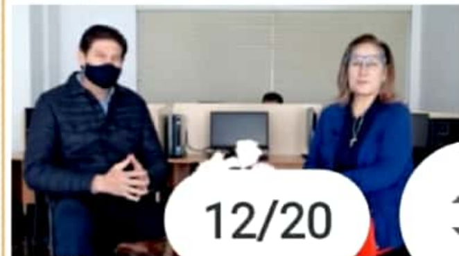
MORELIA, MICH.- Ni el candidato de Morena ni el del otro partido son el contrincante más fuerte, consideró el exalcalde independiente.

Finalmente, prometió que, en caso de ganar, la próxima administración será distinta "y aún mejor" que la vez pasada, con el apoyo de partidos aliados en el Congreso del Estado para ayudarlo a construir mejores presupuestos para la ciudad más importante del estado.