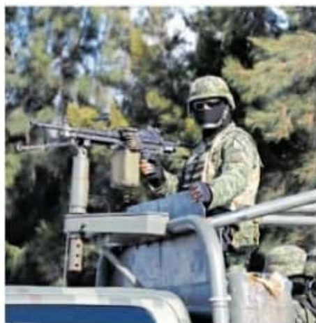
La SSP desmintió rumores sobre la presunta desaparición de los elementos federales.

También al inicio del año, el 4 de enero, los cuerpos maniatados de dos mujeres fueron localizados tirados en la vía pública en Uruapan. Las víctimas presentaban heridas por proyectil de arma de fuego y rastros de tortura.