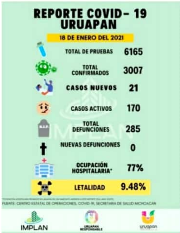
URUAPAN, MICH.- El municipio de Uruapan rebasó este lunes los tres mil casos confirmados de contagio de Covid-19.

Recalcó que durante estas entregas se cumplieron estrictamente las medidas preventivas, como el uso de cubrebocas, aplicación de gel sanitizante de manos y sana distancia.