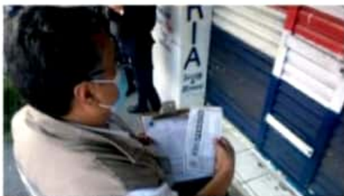
MORELIA, MICH.- Las actividades de vigilancia y fomento sanitario, se han llevado a cabo en 209 mil 756