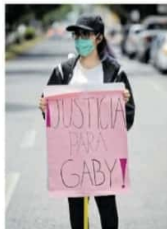
La fecha del juicio se conocerá después //FERNANDO MALDONADO

Cabe recordar que esta audiencia intermedia iba realizarse el 6 de agosto de 2020, pero se pospuso porque se presentó una propuesta de reparación del daño, el segundo intento fue el 6 de octubre, pero