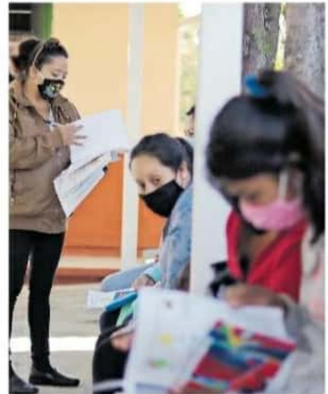
Cerca del 60 por ciento del magisterio está laborando por diferentes plataformas

Es de manera presencial con los adultos exclusivamente, no podemos arriesgar a los niños", dijo al precisar que también se trabaja en un "comité de seguridad