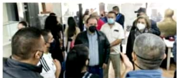
ZAMORA, MICH.- El mandatario local les señaló que como autoridad se trabaja para cuidar la salud de la población.

En ningún caso la intención es afectar al sector comercial, por ello se debe tener este tipo de acuerdos, donde tanto las autoridades como la ciudadanía deben trabajar coordinados, y que quede claro que el presidente tiene toda la disponibilidad y voluntad, pero primero se debe cuidar la salud de la población en general.