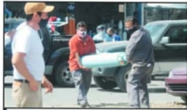
DESDE TEMPRANA HORA ACUDEN DECENAS DE PERSONAS A HACER FILA.

No obstante, la cantidad de pacientes y el ritmo de contagios sí podrían ocasionar una problemática de desabasto en un futuro no tan lejano.