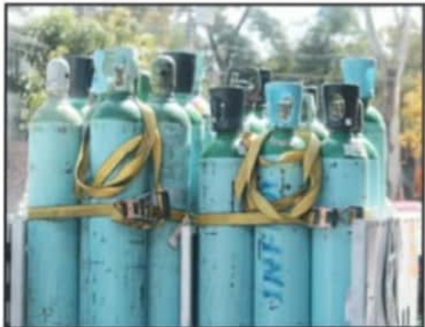
LA COMPAÑÍA ASEGURA QUE YA NO TIENE CILINDROS PARA VENDER O RENTAR.

cuidando y ser conscientes", explicó el hombre en la fila a La Voz de Michoacán.