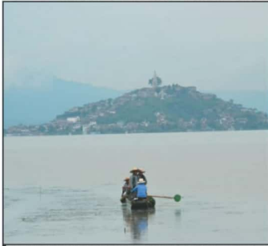
EN LOS PRÓXIMOS DÍAS EL ARRIBO DEL TURISMO EN LA ISLA SERÁ PARCIAL Y DURANTE LOS DOMINGOS NO PODRÁ PASAR.

De tal manera, que, haciendo uso de las redes sociales dieron a conocer que por cuestiones de la "enfermedad SARS-covid 19 (Corona virus) (sic), la asamblea comunal de la isla de Janitzio a determinado no solo el cierre los próximos 3 domingos, si no el cierre parcial al turismo durante los próximos 15 días, esperando su comprensión y esperando también