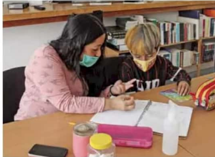
Rezago. El programa Aprende en Casa no llega a todos los alumnos de educación básica y media superior, lo cual incrementa la brecha de aprendizaje en el país.

Esto, debido a que continúa la inequidad y exclusión. Pues aunque los contenidos se