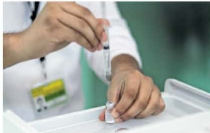
Las vacunas se aplicarán al sector Salud "para cubrir las necesidades que quedaron pendientes".

Con respecto a este plan de vacunación, el titular del Ejecutivo estatal criticó que el gobierno federal haya considerado en esta primera fase a los Servidores de la Nación, "que además son voluntarios, no