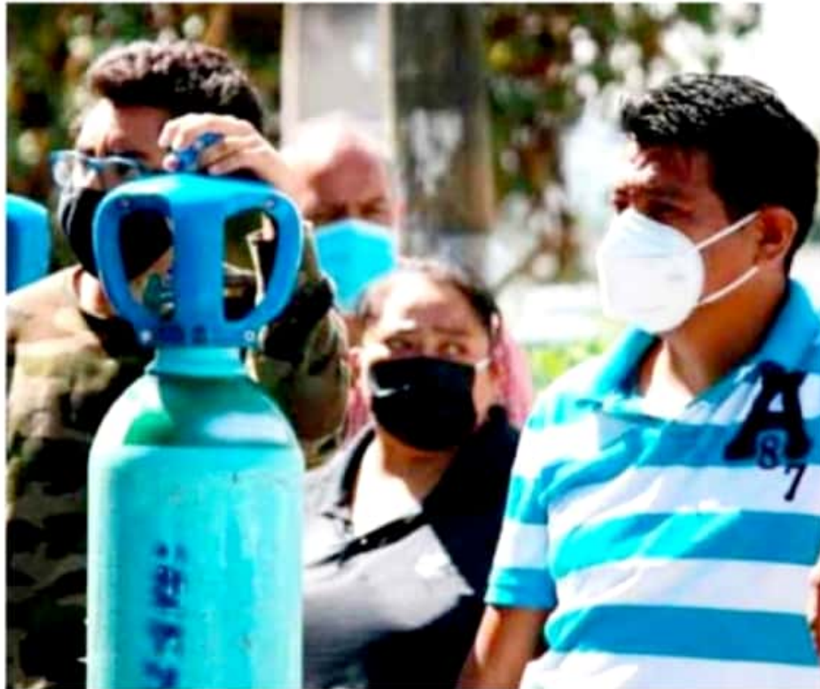
APATZINGÁN, MICH.- En la región se han agotado los recipientes de oxígeno medicinal debido al crecimiento de casos de Coronavirus en los cuales se requiere de ventilación artificial.

Recalcó que el problema de desabasto no es por falta de oxígeno, sino por falta de cilindros suficientes ante el creciente número de casos de Covid-19, pues la cifra de enfermos ha superado ampliamente el stock de los envases en circulación.