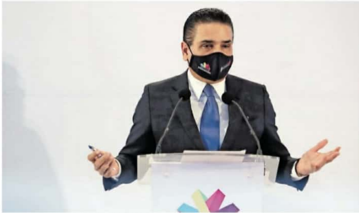
Silvano Aureoles criticó que el gobierno federal haya considerado en esta primera fase a los Servidores de la Nación.