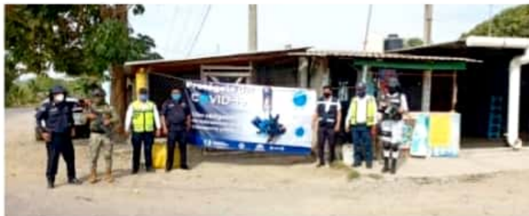
CD. LÁZARO CÁRDENAS, MICH.- Operativos arrojan buenos resultados para inhibir casos positivos del Covid-19.

Durante esta jornada se detectó que eran los choferes y pasajeros de las unidades que van rumbo a La Mira, los que más anomalías registraban por el incumplimiento de las medidas sanitarias.