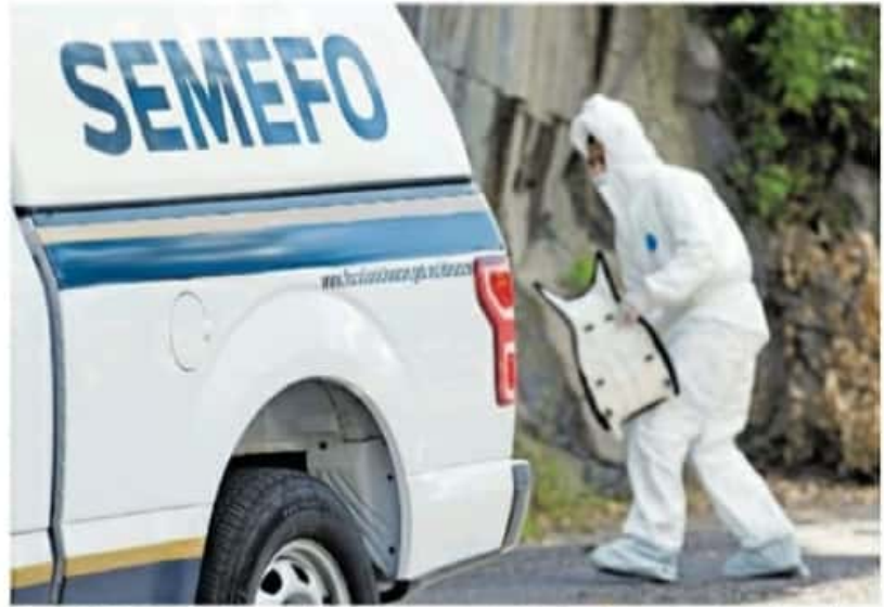
El pasado 29 de diciembre autoridades de los tres niveles de gobierno anunciaron la implementación de la Operación Conjunta Michoacán. JAGO JIMÉNEZ