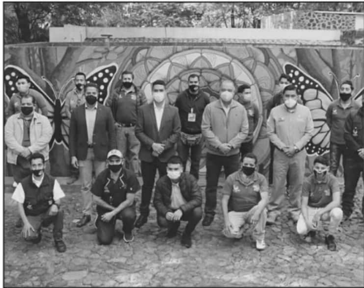
A NUEVA ADMINISTRACIÓN TOMA AL PARQUE EN UN PERÍODO COMPLEJO, TANTO POR LA PANDEMIA COMO POR EL TEMA AMBIENTAL EN LA REGIÓN.

De esta forma la misión del nuevo funcionario municipal, se argumentó, deberá enfocarse en dar continuidad al rescate y mejoramiento a este espacio que en su área de montaña