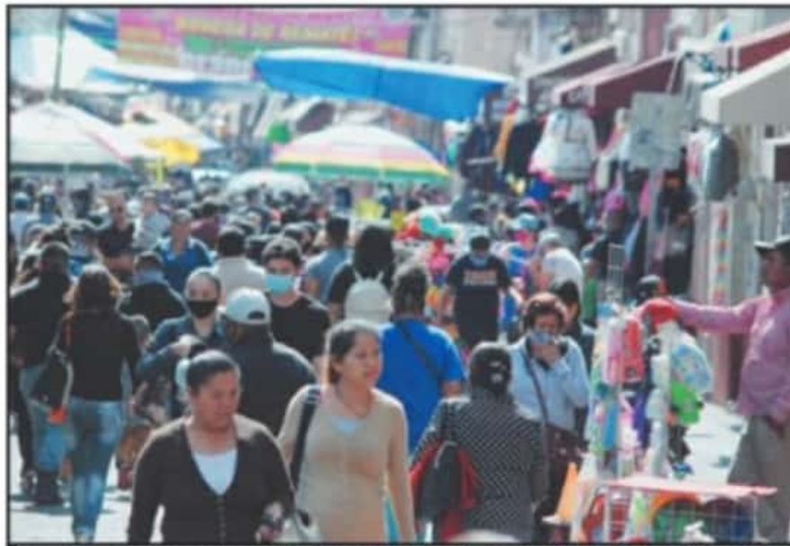
A LAS PERSONAS QUE LLEGAN INGRESAR AL MERCADO INDEPENDENCIA SIN CUBREBOCAS SE LES INVITA A PORTARLO.