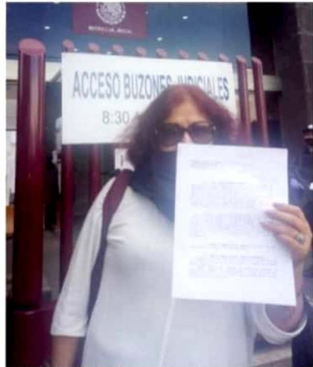
APATZINGÁN, MICH.- Los simpatizantes inconformes presentaron ante el juez siete copias y dos anexos.

Los inconformes recibirán una respuesta respecto a la solicitud de amparo, el próximo jueves 21 de enero, externó Zepeda Ontiveros.