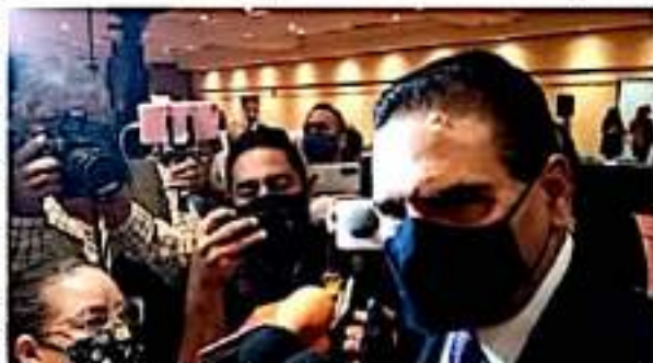
MORELIA, MICH.- El mandatario estatal declaró que el otro tema que lo llevó a la capital del país es la revisión el tema de los recursos, toda vez que, "sólo anuncian y no llega nada de dinero".

Por otro lado, al cuestionarle si recibió al presidente de México, Andrés Manuel López Obrador, en su visita a Michoacán, programada para el próximo 30 de septiembre en el marco de la conmemoración del natalicio de José María Morelos, día en que concluye su mandato, indicó que no cuenta con notificación alguna.