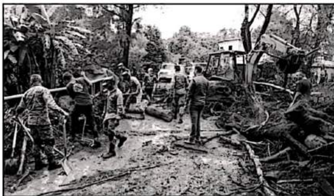
EN PERIBÁN UNO QUE SOBREVIVÍ LA ARMADA MEXICANA PARA LANZAR EL PLAN D E III E TRAS EL DESBORDE DEL RÍO Y DAÑOS A VARIAS VIVIENDAS

El reporte de la Coordinación Estatal de Protección Civil señaló daños en cuatro colonias de Maravatío, entre las que se destacaron Lazaro Cárdenas Francisco I. Madero, San Miguel Paragta y Nue-