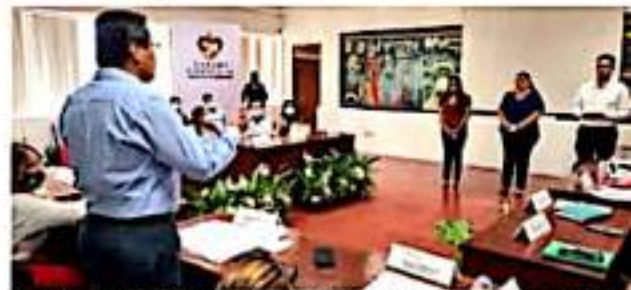
CD. LÁZARO CÁRDENAS, MICH.- El Cabildo portañero aprobó por unanimidad a los tres Jueces Cívicos que estarán impartiendo justicia dentro de la Seguridad Pública Municipal.

Se tomó protesta en la sesión ordinaria Cabildo