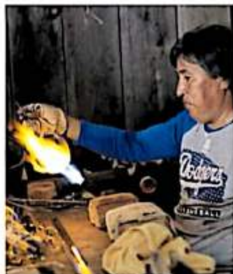
En la edición del pasado 2020 solo se contó con la presencia de 50 artesanos.

También en Peribán la lluvia causó daños y el desbordamiento de un río ubicado en la comunidad de Los Pastores, por lo que la Secretaría de Defensa Nacional (Sedena) ordenó la aplicación del plan de emergencia DN III en el municipio. Además, se solicitan viveres y ayuda material para los afectados de la comunidad Los Pastores.