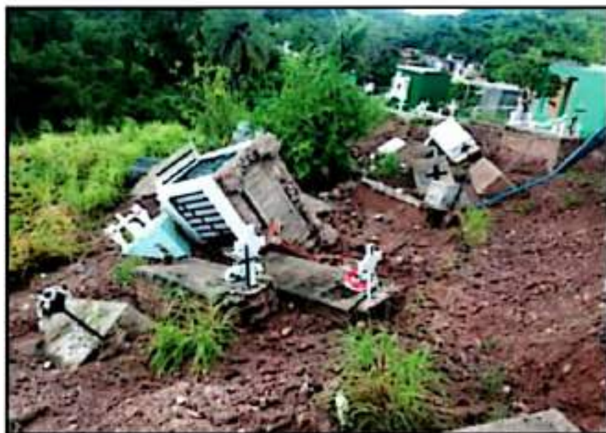
TRAS LAS LLUVIAS SE REBLANDECIÓ EL SUELO. MEDIA CENENA DE TUMBAS FUE AFECTADA POR LAS TORMENTAS

Las constantes precipitaciones pluviales han ocasionado que los suelos se reblandezcan, ocasionando riesgos de deslaves, como lo aconteció en el Panteón San Pedro y otras zonas costeras en las tenencias de Lázaro Cárdenas, Águila y Coahuayana.