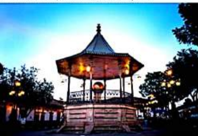
MORELIA, MICH.- Será fundamental dar continuidad a los programas exitosos que ponen en el mapa internacional a Michoacán.

Sin embargo, dijo que "el plan de la Nueva Convivencia puesto en marcha por el gobierno del estado y el alto compromiso de corresponsabilidad del sector turístico y la ciudadanía nos han llevado por un buen camino hacia la recuperación y la reactivación en el mes de junio a partir de la apertura económica con