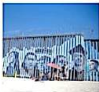
La UNSMNH organiza las mesas de trabajo. / GUERRERO

Las propuestas y trabajos en extenso se están recibiendo a través de la siguiente