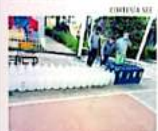
Una de las escuelas beneficiadas fue la secundaria federal 5.

Los Comités de Participación de Seguridad en Salud son los que realizarán el manejo y la repartición del gel entre las y los alumnos, así como también en los filtros sanitarios que serán colocados a la entrada de cada una de las instituciones educativas ya mencionadas.