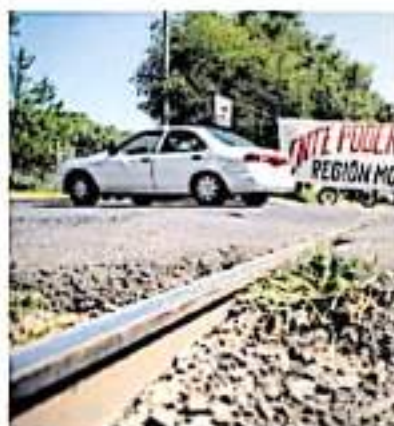
Este miércoles se rompió el récord de tiempo de bloqueos. (ALBERTO RAMÍREZ)