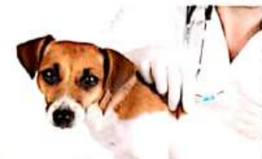
APATZINGÁN, MICH.- Entre los requisitos a cubrir está que el perro o el gato a esterilizar tenga más de dos meses de edad, bañarlo un día antes de la esterilización, sin garrapatas ni pulgas, con doce horas de ayuno.