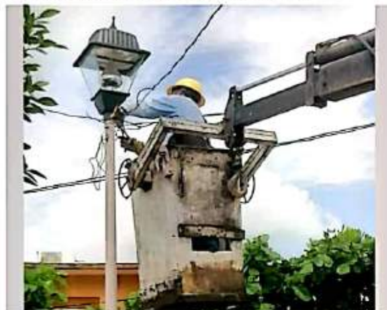
CD. LÁZARO CÁRDENAS, MICH.- El Departamento de Alumbrado Público, llevó a cabo la colocación

Asimismo, indicó que en coordinación con Tránsito Municipal se encuentran trabajando en la reparación de los semáforos de Lázaro Cárdenas.