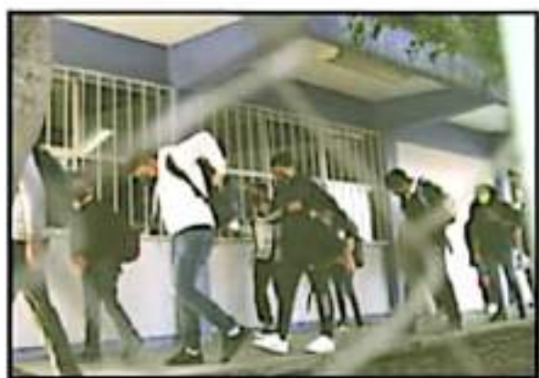
LOS JUVENES DE SICHUJANA PSEPT TAMBÉN EN SU ESCUELA LA SANA DISTANCA