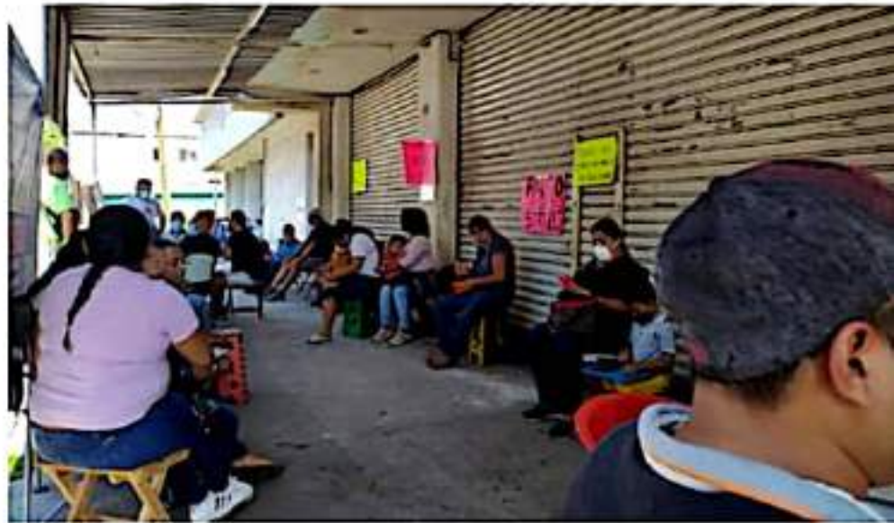
CD. LÁZARO CÁRDENAS, MICH.- Profesores de la CNTE, retomaron la toma de oficinas recaudadoras del gobierno del estado, como protesta de los adeudos salariales pendientes.

Cabe señalar que en la capital del estado, el grupo radical de Poder de Base bloqueó por un par de horas las vías del tren, mientras que, en Uruapan, desde el 23 de agosto se mantiene el bloqueo.