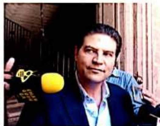
MORELIA, MICH.- "Se los llevaron como pateando un bote los de la administración anterior", sentenció el edil.