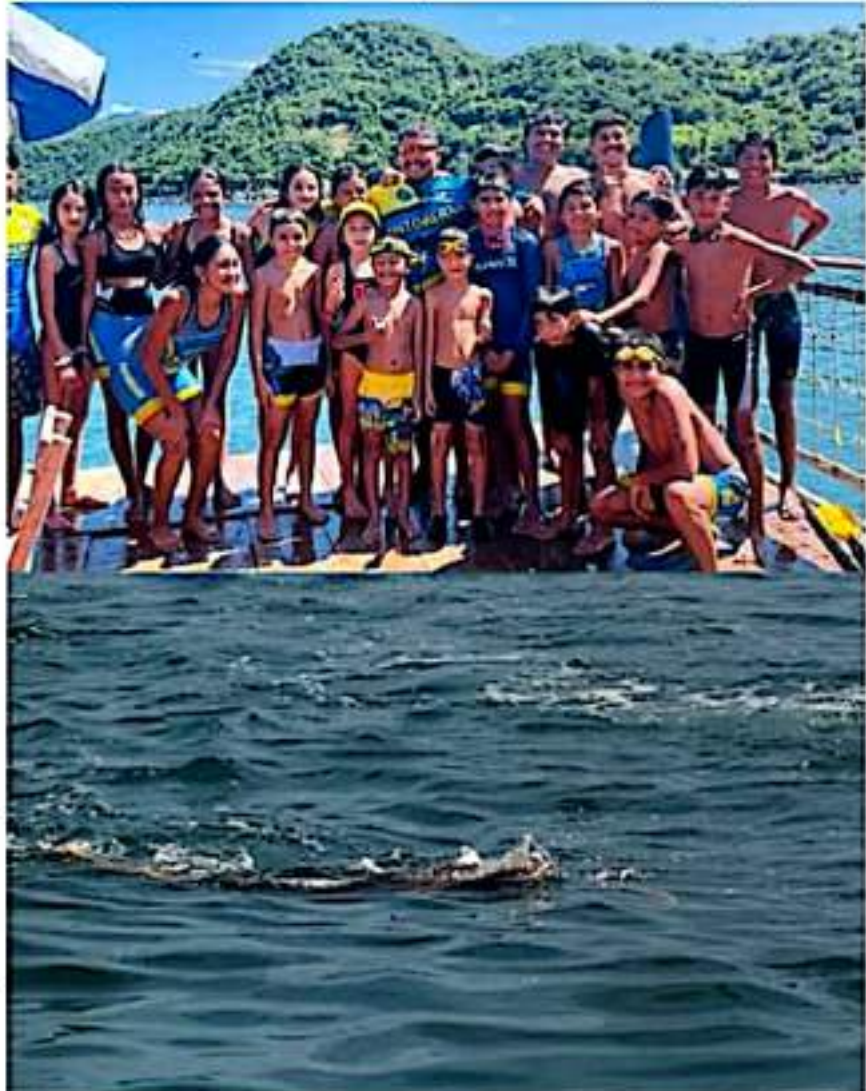
En esta gráfica algunos de los integrantes del Club IMSS Tintoreras y en la otra gráfica, durante su participación en la competencia de natación en mar abierta.