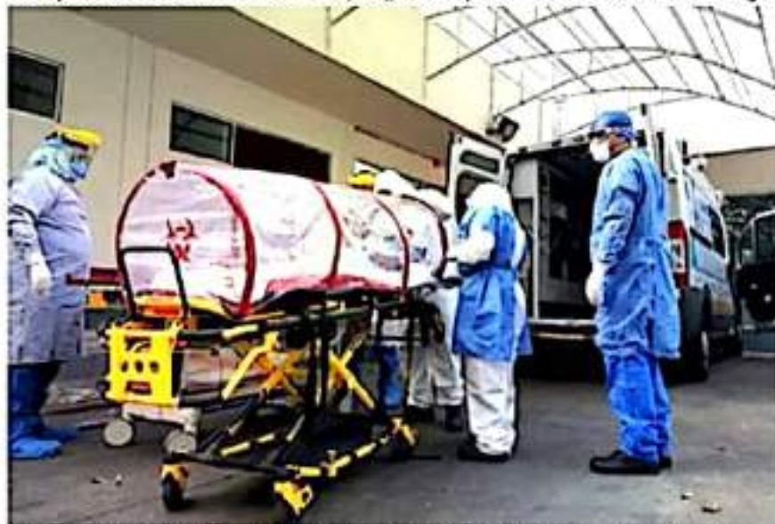
Exhorta la SSM a la población a vacunarse contra COVID-19, Influenza y Neumococo llegado el momento.

Morelia, Michoacán, a 20 de septiembre de 2021.- La Secretaría de Salud de Michoacán (SSM), estima que en los próximos meses ocurrirá una cuarta ola de contagios