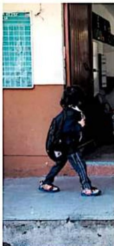
Los niños saben de medidas higiénicas como:

"El acuerdo del pleno estatal es que mientras no se paguen los salarios devengados no habrá un regreso a clases virtuales ni presenciales. Unos han comentado que hay presencia de movimiento en algunas escuelas, pero la mayoría que mi-