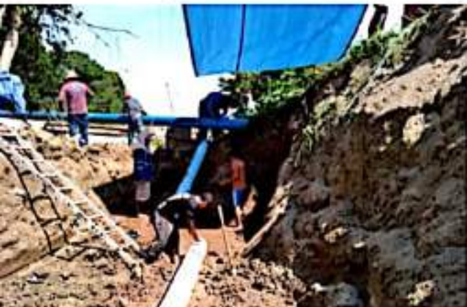
CD. LÁZARO CÁRDENAS, MICH.- Este lunes, las colonias de Loma Benita, Respuesta Social y Parotilla, volvieron a tener el servicio de agua, esto tras culminar los trabajos de rehabilitación de la red, tras los daños que dejó el huracán "Nora".

No obstante, en el caso de La Mira, se pidió la comprensión de los habitantes, ya que los trabajos de rehabilitación se siguen realizando, mientras tanto, el abastecimiento de agua se realiza a través de pipas y esperan que en los próximos días se restablezca el servicio.