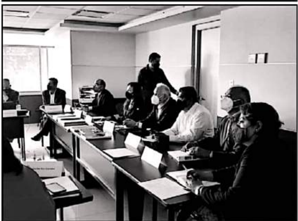
QUEDÓ FORMALMENTE INSTALADA LA MESA DE TRABAJO PARA LA ENTREGA-RECEPCIÓN CONSTITUCIONAL DE LA SECRETARÍA DE EDUCACIÓN EN EL ESTADO

que se mantengan como parte del orden administrativo.