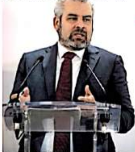
Si se logra la federalización, de nómina educativa se evitarán conflictos presupuestales, asegura. VMA/INTE