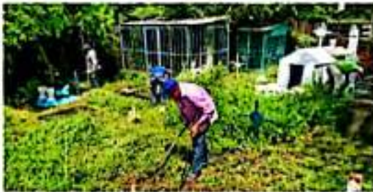
CD. LÁZARO CÁRDENAS, MICH.- Ante los avances de los trabajos de reubicación de las tumbas afectadas por las recientes lluvias en el panteón San Pedro, autoridades municipales piden a familiares ponerse en contacto, ya que no han podido localizarlos para agilizar este proceso.

En el panteón San Pedro, se realizan los trabajos de reubicación de las tumbas afectadas por las recientes lluvias, por lo que nuevamente se pide a familiares ponerse en contacto con los encargados del Departamento de Mercados y Panteones, ya que no han podido localizarlos para agilizar este proceso.