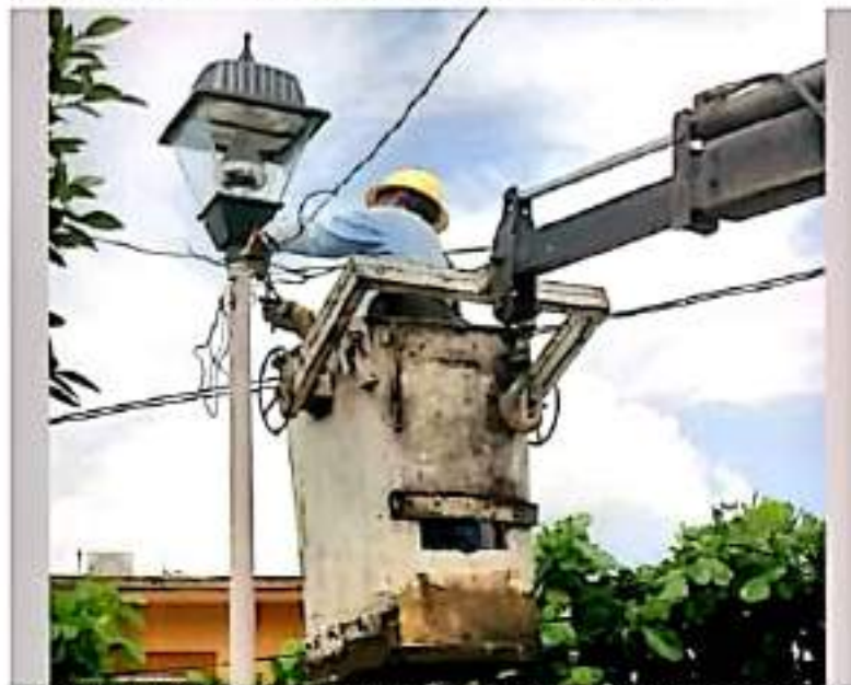
CD. LÁZARO CÁRDENAS, MICH.- El Departamento de Alumbrado Público, llevó a cabo la colocación de 400 lámparas de 40, 50 y 70 watts de tecnología LED en diversas colonias del municipio.

Asimismo, indicó que en coordinación con Tránsito Municipal se encuentra trabajando en la reparación de los semáforos de Lázaro Cárdenas.