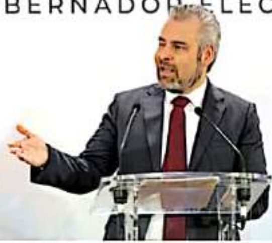
MORELIA, MICH.- El gobernador electo por Michoacán, Alfredo Ramírez Bedolla.