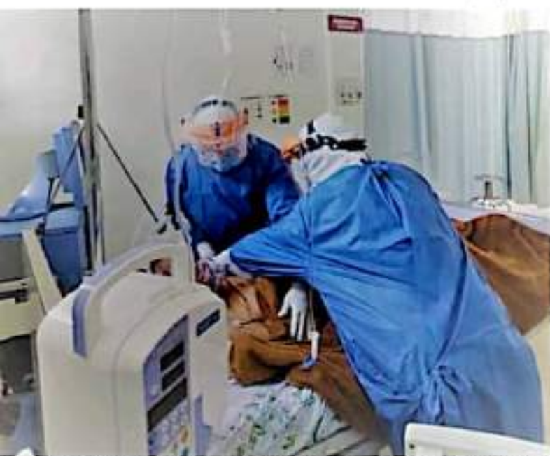
CD. LÁZARO CÁRDENAS, MICH.- La ocupación hospitalaria de camas para pacientes Covid-19 en Lázaro Cárdenas se encuentra al 50.35 por ciento.