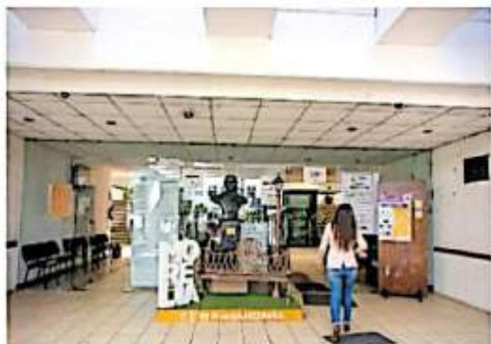
Los servidores del ayuntamiento estaban desconectados por recomendación de la Policía Cibernética.

En ese tenor, en lo que va del 2021 poco más de 2 mil 600 michoacanos que buscaban refugio en Estados Unidos han sido devueltos a México. La mayoría busca huir de la violencia que los grupos del crimen organizado mantienen en Tierra Caliente.