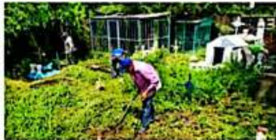
CD. LÁZARO CÁRDENAS, MICH.- Ante los avances de los trabajos de reubicación de las tumbas afectadas por las recientes lluvias en el panteón San Pedro, autoridades municipales piden a familiares ponerse en contacto, ya que no han podido localizarlos para agilizar este proceso.

En el panteón San Pedro, se realizan los trabajos de reubicación de las tumbas afectadas por las recientes lluvias, por lo que nuevamente se pide a familiares ponerse en contacto con los encargados del Departamento de Mercados y Panteones, ya que no han podido localizarlos para agilizar este proceso.