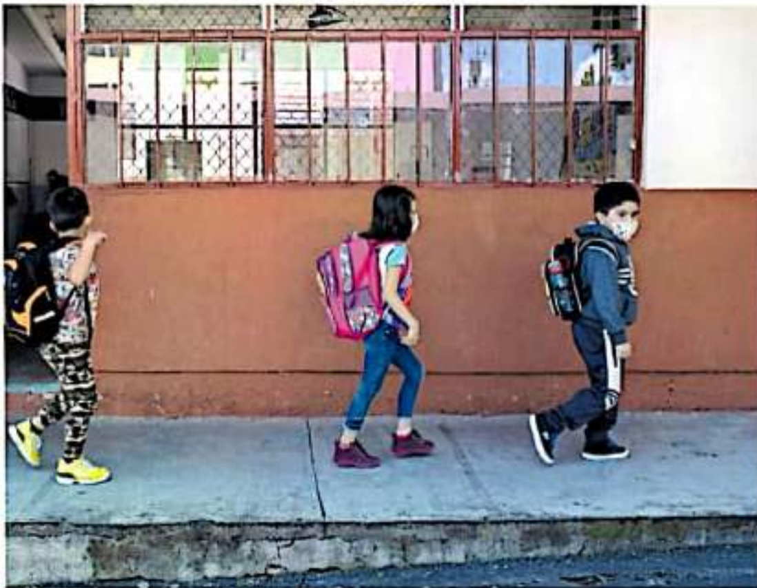
Uso de cubrebocas y gel en las escuelas / IMA AVAL