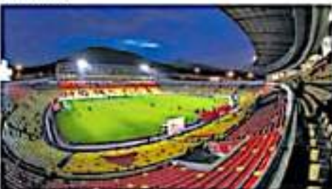
MORELIA, MICH.- El Club Atlético Morelia participa en la Liga de Expansión MX, de la segunda categoría del fútbol mexicano.

Asimismo, la directiva del Club Atlético Morelia fue enfática al señalar el compromiso de la institución rojiamarilla con la sociedad michoacana, "por lo que en todo momento se reforzarán y se aplicarán los protocolos sanitarios que hemos desarrollado desde el año pasado con la Liga MX y la Secretaría de Salud".