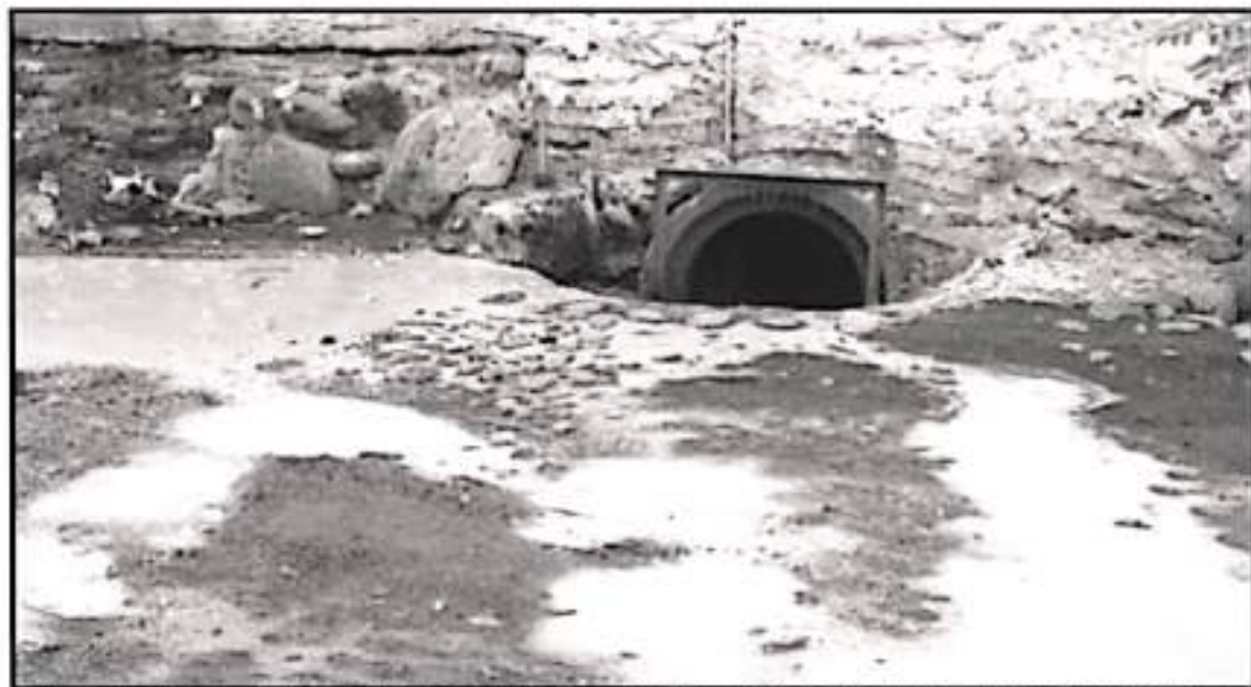
VECINOS DE ESTE MUNICIPIO HAN VENIDO DENUNCIANDO ANTE LAS AUTORIDADES A LA EMPRESA TEQUILERA DE GENERAR CONTAMINACIÓN EN DREÑES Y ARROYOS

La empresa productora de tequila se encuentra en el ojo del huracán de la ciudadanía debido a sus cuestionables prácticas ambientales pues se le relaciona con la contaminación registrada en los drenes de la colonia Cuauhtémoc al norte de la población a donde vierten sus desechos residuales al