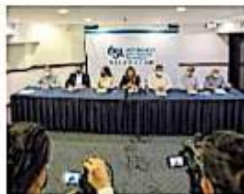
La propuesta la harán de manera conjunta PRD y PAN / PAN/ANAS