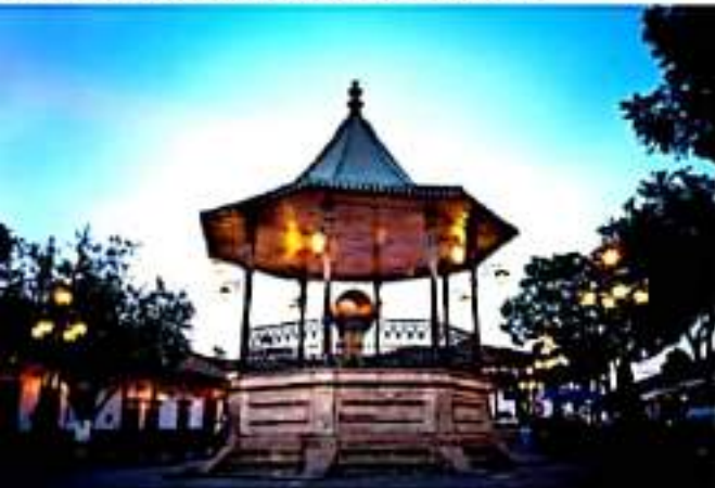
MORELIA, MICH. - Será fundamental dar continuidad a los programas exitosos que ponen en el mapa internacional a Michoacán.

Sin embargo, dijo que "el plan de la Nueva Convivencia puesto en marcha por el gobierno del estado y el alto compromiso de corresponsabilidad del sector turístico y la ciudadanía nos han llevado por un buen camino hacia la recuperación y la reactivación en el mes de junio a partir de la apertura económica con