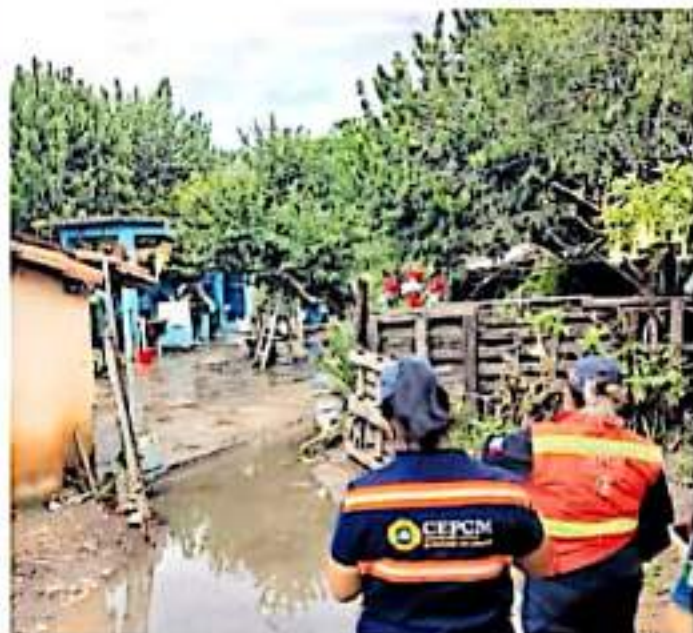
A través del sistema DIF brindarán viveres y enseres para los afectados.

por 300 casas damnificadas, cifra que fue rectificada por PC Michoacán horas después. En estas actividades de rescate y socorro participó PC del estado y del municipio, así como el Cuerpo de Bomberos Voluntarios de Maravatío y Ziraquero y La Cruz Roja.