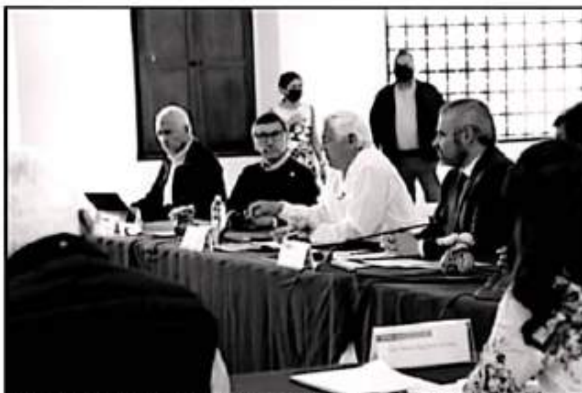
FUNCIONARIOS DE LA CUARTA TRANSFORMACIÓN A NIVEL FEDERAL SE REUNIERON CON EL GOBERNADOR ELECTO

(SNICS), permite a los productores generar valor agregado a sus alimentos e incursionar en más y mejores mercados nacionales e internacionales.