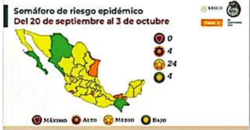
Del 20 de septiembre al 03 de octubre, Michoacán permanecerá en el semáforo epidemiológico Amarillo.

Persistentes, agradecen a todos los atletas, salvavidas y familias del equipo por el apoyo en este y en cada uno de los eventos. Los invita a seguir practicando deporte con las medidas de sanidad correspondientes para evitar más contagios.