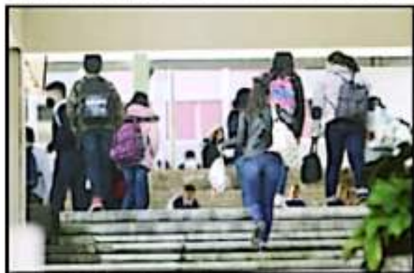
FUERON ALY TÓCAS LAS ESCUELAS QUE INICIARON ACTIVIDADES PRESENCIALES.