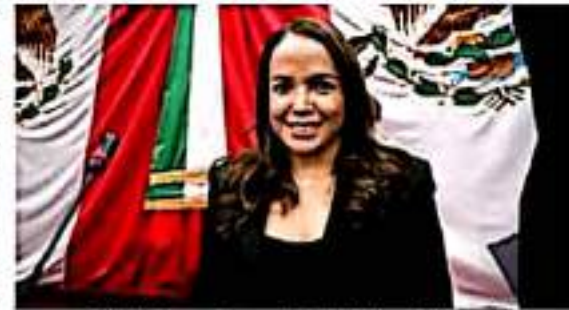
Andrea Villanueva Cano, diputada local por el distrito 11.