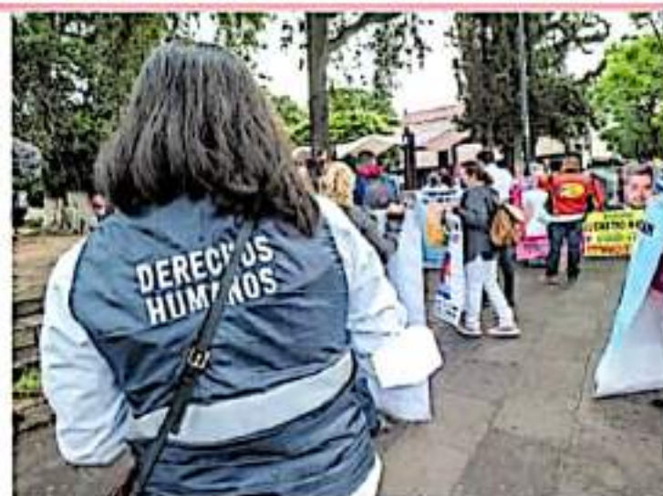
Realizarán una estrategia de atención integral a las víctimas

Además, exhortó a las autoridades estatales y municipales a realizar a la