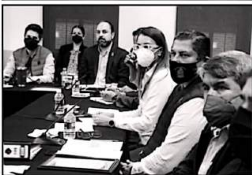
SE REUNIRÁN ESTE LUNES PARA PRESENTAR Y AJUSTAR EL PLAN CON QUE TRABAJARÁ EL MUNICIPIO