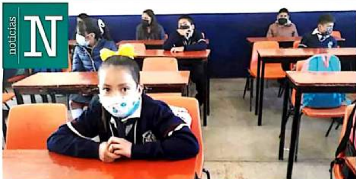
Alumnos. En las escuelas públicas el número de alumnos que volvieron a las aulas fue mucho menor, aunque aún no se tiene la cifra oficial. J. Cornejo