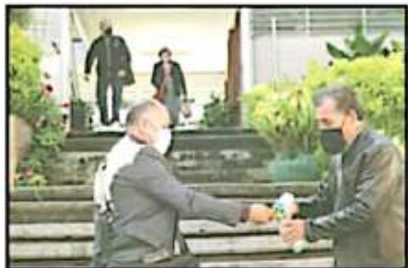
EN LAS INSTITUCIONES EDUCATIVAS SE ACATARON LOS PROTOCOLOS DE SALDO