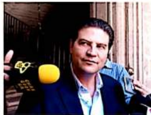
MORELIA, MICH. - "Se lo llevaron como pateando un bote los de la administración anterior", sentenció el edil.