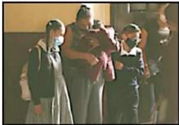
POÉN A PADRES DE FAMILIA QUE DESDE SUS HOGARES SE CUIDEN LAS MEDICAS