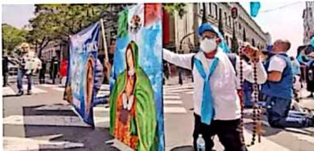
Manifestación. Un centenar de simpatizantes provida se manifestaron afuera de la Corte durante la discusión.

Por lo que los ministros aprobaron limitar esta figura a casos