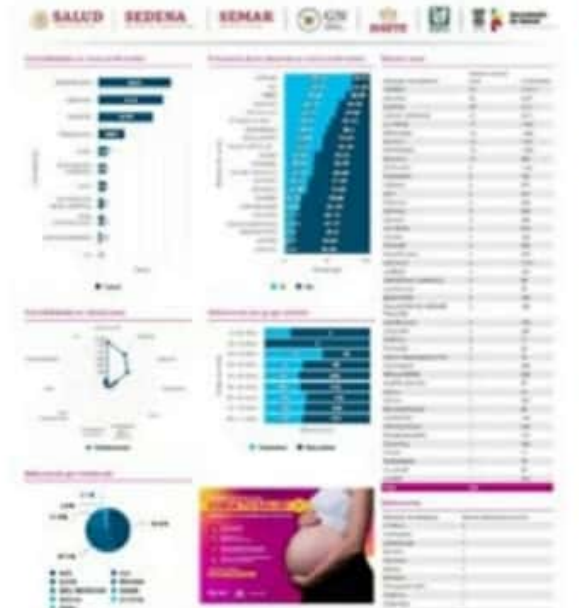
El CESS reportó en el inicio de la última semana de febrero, que en el municipio de LC ocurrieron otros 21 nuevos casos positivos de COVID-19, para llegar a un acumulado de 5,811.