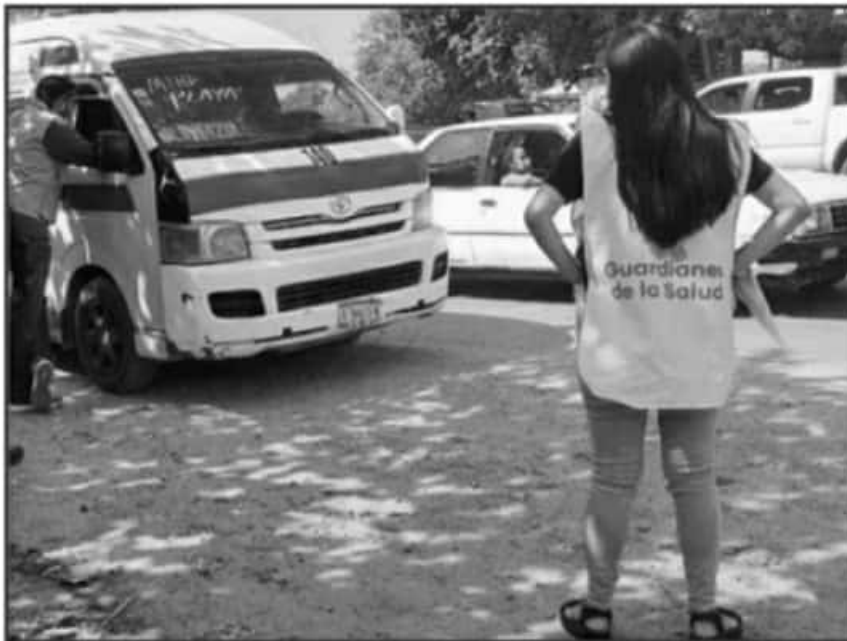
LOS FILTROS SANITARIOS SE MANTIENEN POR EL SECTOR SALUD EN COORDINACIÓN CON REGLAMENTOS MUNICIPALES.

Son autobuses de la Línea, la Estrella de Oro y la Estrella Blanca donde están viajando muchas personas de otros estados hacia el puerto de Lázaro Cárdenas