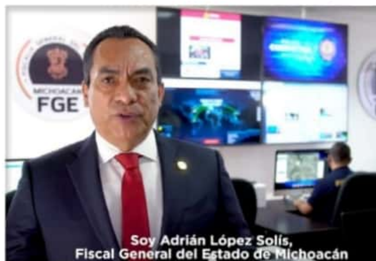
Soy Adrián López Solís, Fiscal General del Estado de Michoacán

En cuanto al archivo temporal, a donde se van las carpetas que no tienen investigaciones completas, re-