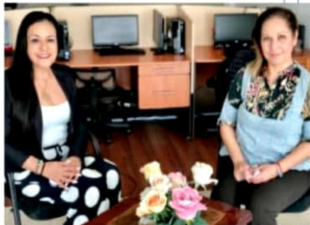
MORELIA, MICH.- La secretaria afirma que aún cuando ya se lograron los avances en lo escrito y en las leyes, en el terreno social sigue limitando el tema cultural.

Se manifiesta orgullosa de ser parte de los logros históricos que han permitido llegar al 60-40% de representación en candidaturas; después al 50-50 y ahora pasar a la paridad total en todo el país.