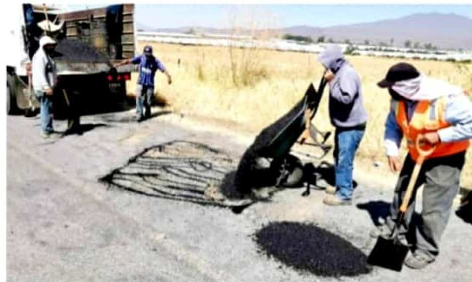
ZAMORA, MICH.- La cuadrilla de bacheo procedió a aplicar un promedio de 5 metros cúbicos de carpeta asfáltica en caliente y 150 litros de emulsión.