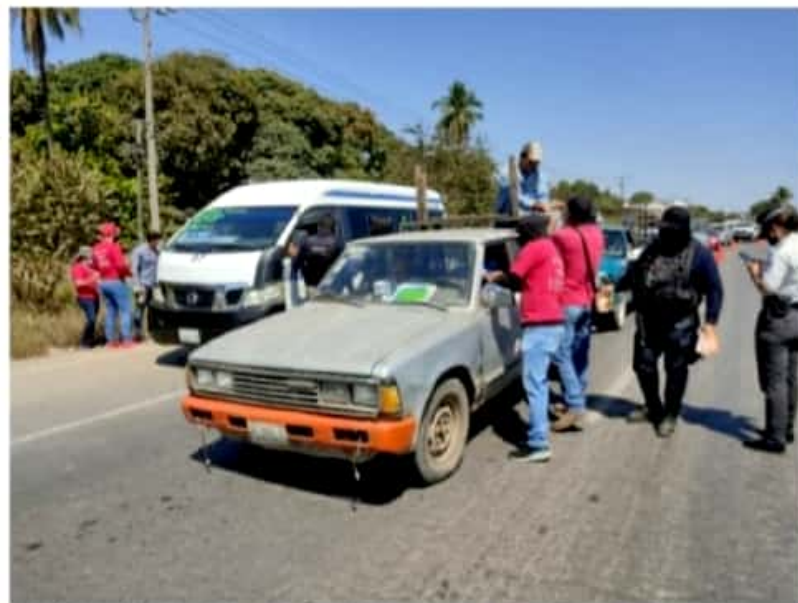
CD. LÁZARO CÁRDENAS, MICH.- El Comité Jurisdiccional de Seguridad en Salud detectó en cuatro puntos de Lázaro Cárdenas un incremento en la movilidad urbana.

Eduardo CHÁVEZ CD. LÁZARO CÁRDENAS, MICH.-