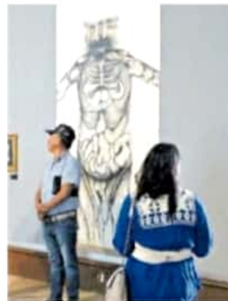
La comisión de Cultura señaló que el informe tenía datos insuficientes

En asuntos migratorios, los legisladores destacan que el gobierno estatal sólo cumplió con 4 de las 9 prioridades que el mismo marcó para el estado, lo que indica "un esfuerzo limitado en beneficio de la comunidad migrante". También el documento señala que no se especificó cómo se utilizaron 7 mil 165 millones 67 mil 652 pesos.