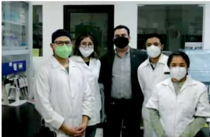
Casa de Hidalgo. Científicos nicolaítas avanzan en diferentes investigaciones para beneficio de la sociedad ante la pandemia.

Destacó que lo importante de una vacuna es que enseña al sistema inmune a defenderse, y en este caso, con el biológico en proceso de formulación buscan