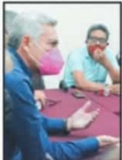
CANDIDATO QUIERE GANARSE LA CONFIANZA DE LA GENTE.

Explicó que el rescate que busca es para lograr cambios de transformación profunda, de bienestar, de desarrollo y de progreso, a través de la mayor unidad y organización estatal y no de la confrontación.