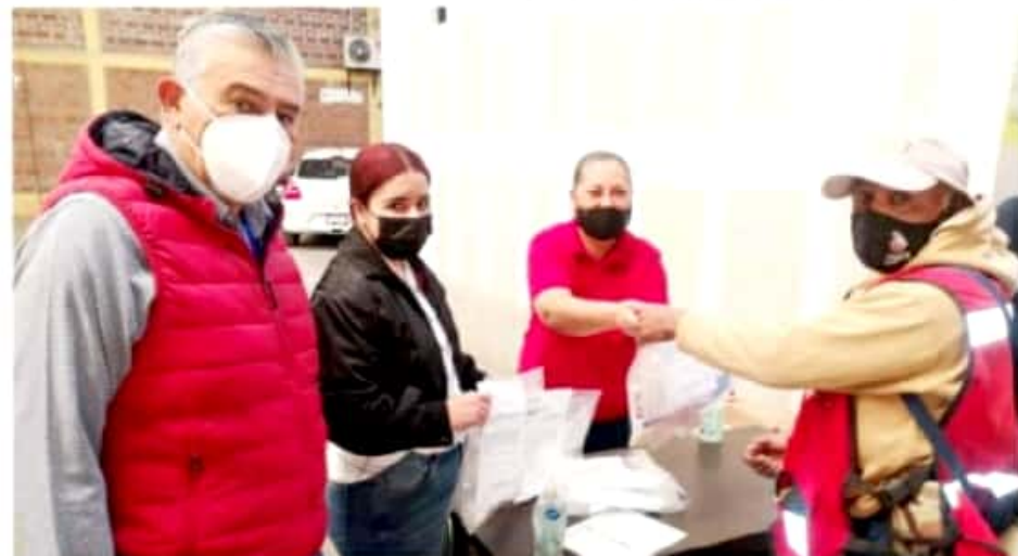
ZAMORA, MICH.- Personal entregó estos paquetes de prevención a 65 trabajadores del área operativa.

Estos paquetes incluyen careta, mascarilla y líquido sanitizante, además se les explicaron las medidas y recomendaciones que deben seguir para adoptar un comportamiento responsable y así prevenir la propagación del virus no sólo en sus lugares de trabajo sino también en sus hogares.