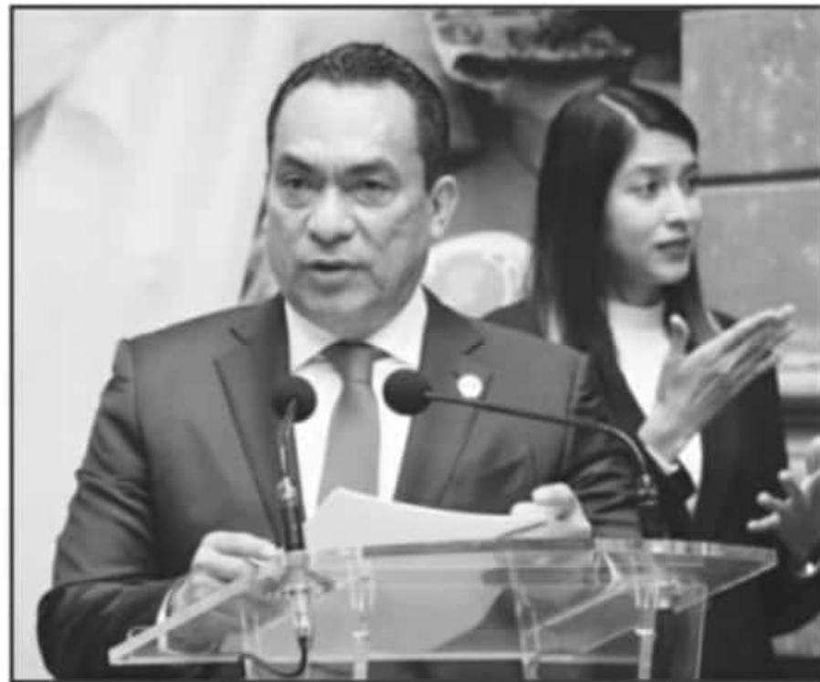
APOYO PSICOLÓGICO, RELACIONES FAMILIARES SANAS Y TRATAMIENTO DE ADICCIONES SE PROMUEVEN, ASEGURA FISCAL.

Entre los delitos mediados por la FGE, un total de 1 mil 395 fueron amenazas; 1 mil 271 lesiones;