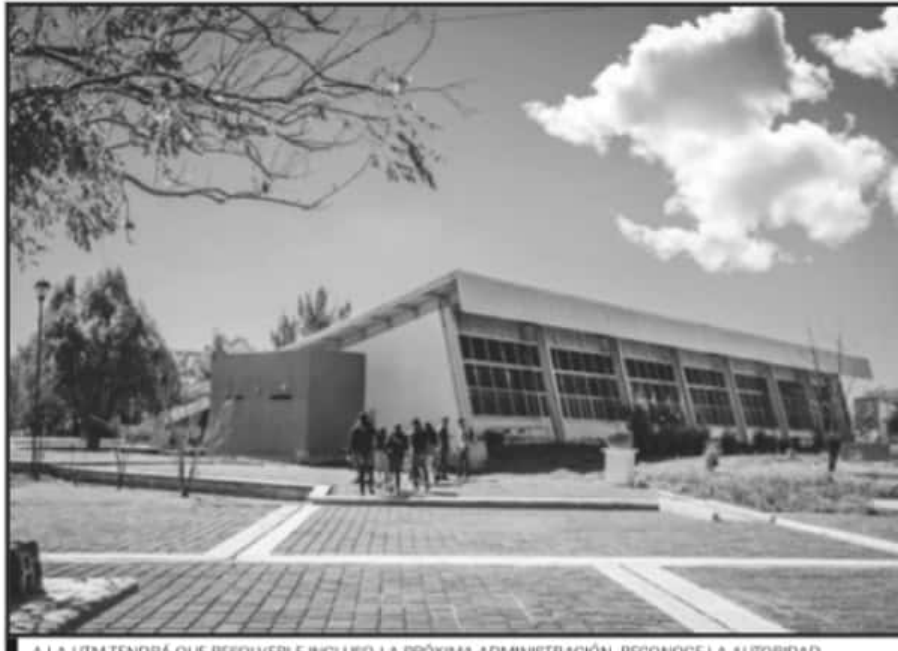
A LA UTM TENDRÁ QUE RESOLVERLE INCLUSO LA PRÓXIMA ADMINISTRACIÓN, RECONOCE LA AUTORIDAD.

"Creemos que los compañeros del CECyTEM tienen razón en estar en huelga y que es de puertas abiertas, porque hubo mucho tiempo esperando que las autoridades atendieran las demandas, pero al final no lo hubo", dijo.