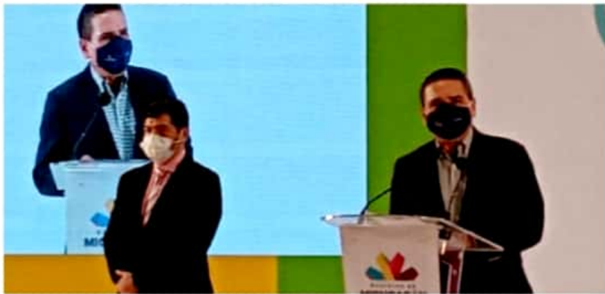
MORELIA, MICH.- Destacó que la demanda en camas para pacientes con Infecciones Respiratorias, va la baja.

En ese sentido agradeció la corresponsabilidad social de los empresarios, las iglesias, comerciantes, dueños de negocios, trabajadores y familias, quienes han contribuido a evitar que el estado pase a semáforo rojo, pese al complicado inicio de año.