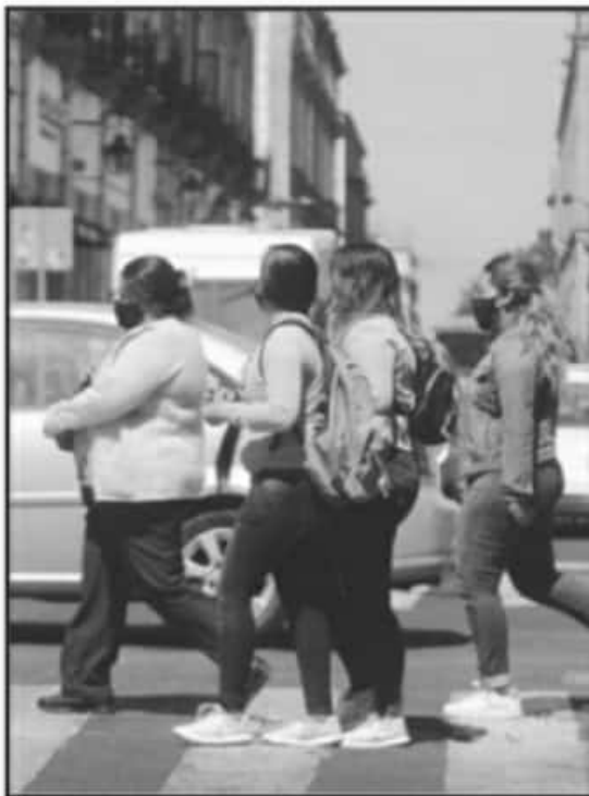
PESE QUE EL CORONAVIRUS SIGUE CONTAGIANDO EN EL ESTADO, LA MOVILIDAD EN EL CENTRO DE LA CAPITAL MICHOACANA SIGUE SIENDO ALTA.

"La ocupación hospitalaria ha ido a la baja en las últimas dos semanas, el cinco de febrero la ocupación hospitalaria era del 64 por ciento y al día de ayer fue del 37 por ciento. Respecto al número de contagios en esta tercera semana de febrero, tuvimos dos mil 653