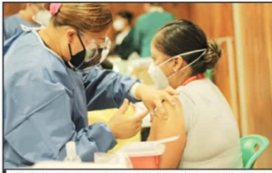
SE RESALTÓ QUE EL OPERATIVO DE VACUNACIÓN SE LLEVA A CABO EN COORDINACIÓN CON LOS TRES ÓRDENES DE GOBIERNO.

Se resaltó que el operativo de vacunación se lleva a cabo en coordinación con los tres órdenes de gobierno, con el apoyo de las fuerzas armadas, a cargo del teniente coronel, médico militar