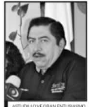
ASTUDILLO VE GRAN ENTUSIASMO.

El médico abundó que durante los días en que se instalaron los filtros se estuvo compartiendo información con 5 mil 900 personas y se hizo la entrega de 605 cubrebocas. Respondió que ante la situación de movilidad de personas provenientes de otros estados es que se pone atención, pero se mantiene la apertura de negocios con las reglas establecidas.