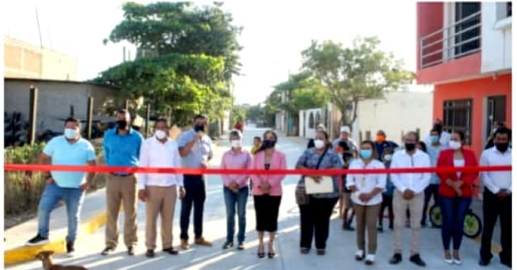
CD. LÁZARO CÁRDENAS, MICH.- El gobierno municipal de Lázaro Cárdenas entregó una obra de pavimentación en la tenencia de Las Guacamayas.