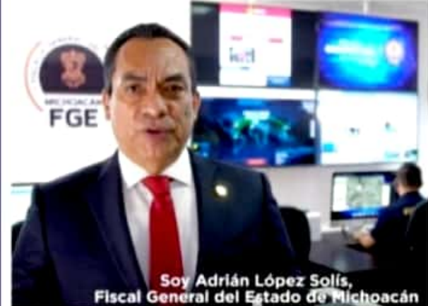
Soy Adrián López Solís, Fiscal General del Estado de Michoacán

MORELIA, MICH.- El fiscal general, destacó que la deuda con todas las víctimas sigue siendo un gran pendiente.