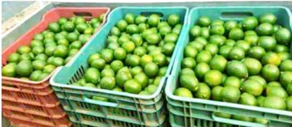
APATZINGÁN, MICH.- Ochoa Vázquez informó que se espera que el valor del limón se mantenga hasta después de la Semana Santa.

Expuso que no es el mismo caso para los productores de jitomate, quienes ya en el norte del país, han comenzado a tirar su cosecha porque el mercado interno se encuentra saturado; es una situación lamentable la que se vive entre los jitomateros".