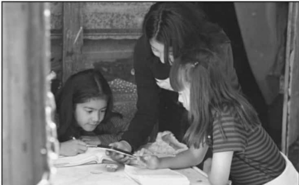
MEXICANOS PRIMERO LLAMA A ANALIZAR LOS AVANCES Y RETROCESOS QUE EXISTEN A UN AÑO DE RECIBIR CLASES EN CASA A CAUSA DE LA PANDEMIA.

Agregó que en ella deberían de poder participar directamente la sociedad civil, los maestros, los padres de familia y los estudiantes, o al menos, a través de sus representantes legislativos locales, de tal forma que sea un auténtico ejercicio de apertura y de rendición de cuentas, donde se conozca detalladamente la operación de la Secretaría de Educación.