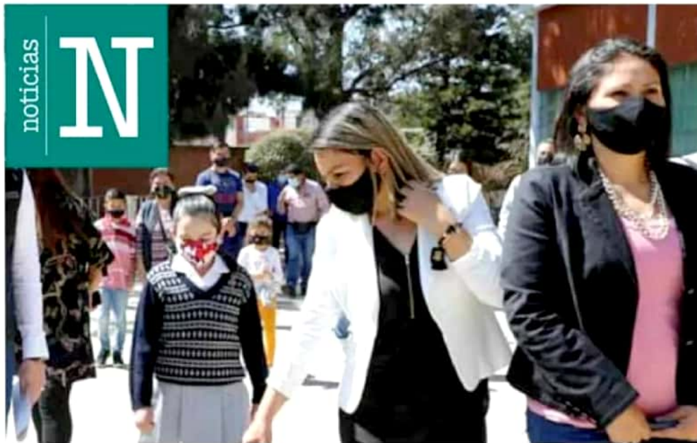
Escuelas. Las medidas aplicarían para escuelas públicas y privadas de todos los niveles educativos.