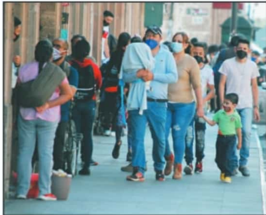
MORELIA ES EL EPICENTRO DE LA PANDEMIA EN EL ESTADO DE MICHOACÁN, SITUACIÓN QUE NO BAJA LA MOVILIDAD.