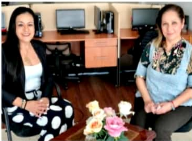
MORELIA, MICH.- La secretaria afirma que aún cuando ya se lograron los avances en lo escrito y en las leyes, en el terreno social sigue limitando el tema cultural.

Se manifiesta orgullosa de ser parte de los logros históricos que han permitido llegar al 60-40% de representación en candidaturas; después al 50-50 y ahora pasar a la paridad total en todo el país.