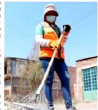
ZAMORA, MICH.- Los grupos de trabajadores fueron apoyados por personal de Prevención del Delito y Sapaz para realizar las limpiezas.

El funcionario municipal señaló que hay algunas personas que son reuentes a la aplicación de abate y descacharrización en la colonia, por lo que los invitó a permitir realizar esas importantes funciones por el bien de todos.