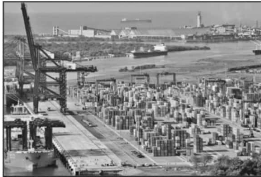
LAS NEGOCIACIONES EXTRANJERAS EN EL ESTADO REPORTARON UN DESCENSO; SE PREVÉ REPUNTE PARA ESTE 2021.

En cuanto al escenario nacional, si bien hubo estados como Jalisco y San Luis Potosí que tuvieron repuntes por encima del 30 por ciento, la mayoría de entidades federativas presentó caídas, superiores al 10 por ciento. De ahí que el 'tropezón' de Michoacán no sea tan mayúsculo como en otras latitudes ni como el promedio nacional.