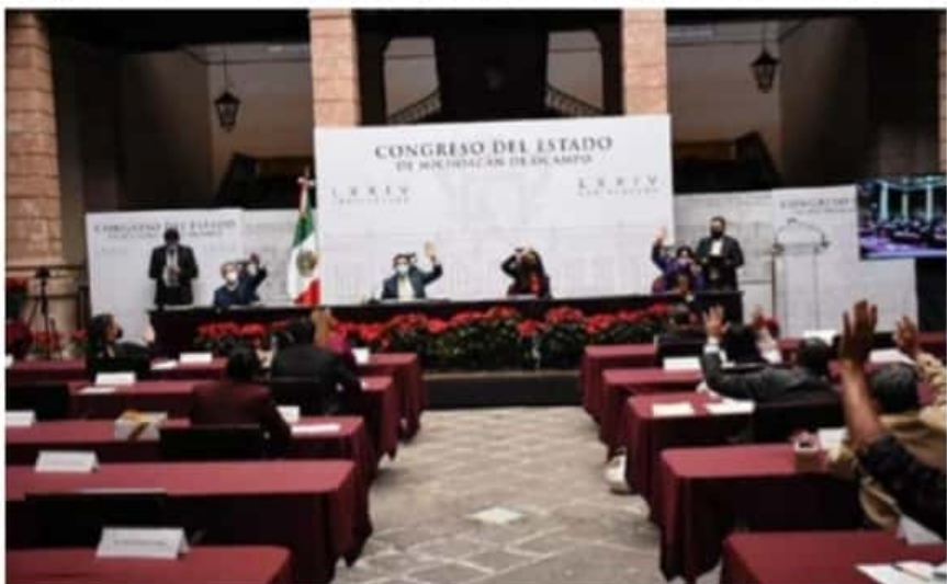
Municipios michoacanos ahora cuentan con un marco jurídico actualizado que les permitirá convenir con autoridades estatales y federales para potenciar su desarrollo económico.

Lo anterior, en concordancia con lo dispuesto en la Ley de Deuda Pública Estatal, así como en la Ley de Disciplina Financiera de las Entidades Federativas y los Municipios; brindando así las facilidades para que los ayuntamientos obtengan recursos que podrán destinarse a financiar el costo de inversiones públicas productivas.