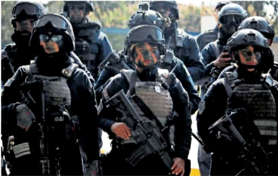
También se pedirá el cumplimiento del seguro de vida para todos los elementos policíacos del estado