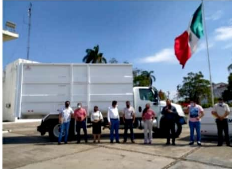
CD. LÁZARO CÁRDENAS, MICH.- El gobierno municipal de Lázaro Cárdenas hizo entrega de un nuevo camión recolector al Departamento de Aseo Público.