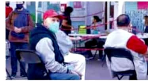
Registro. Los módulos estarán en funcionamiento hasta el 7 de marzo.