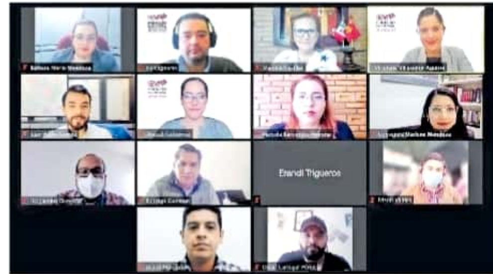
Los partidos de reciente creación podrán postular candidaturas para elección consecutiva

Además, quedará prohibido que en las casas de gestión y enlace se utilicen para actividades proselitistas, y no podrá prometer o condicionar programas sociales, servicios u otro trámite ante instancias gubernamentales ni podrá intervenir en facilitar u obstaculizar ningún tipo de trámite en la demarcación por la que contendie.