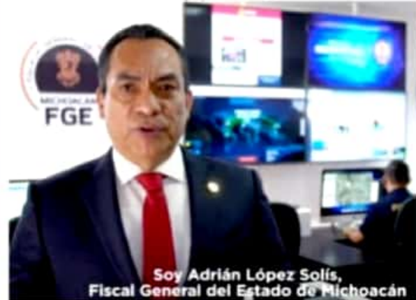
Soy Adrián López Solís, Fiscal General del Estado de Michoacán

MORELIA, MICH.- El fiscal general, destacó que la deuda con todas las víctimas sigue siendo un gran pendiente.