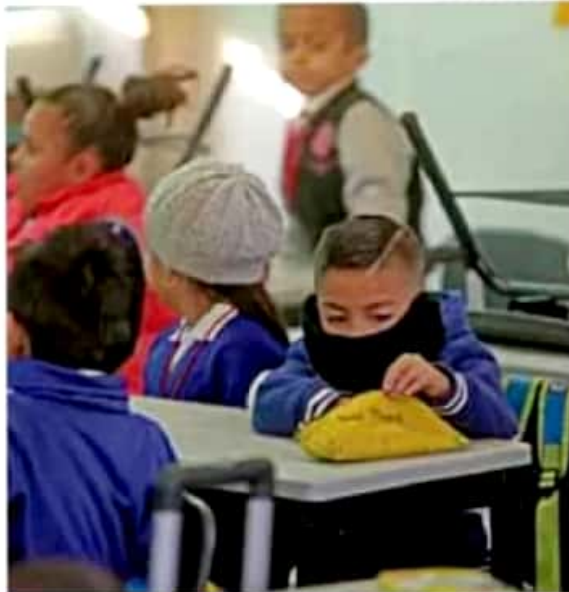
Incógnita. Se desconoce cuántos alumnos regresan.