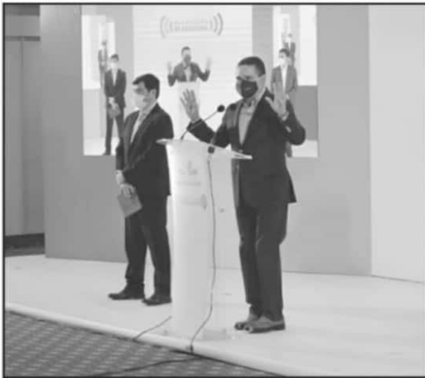
EL GOBERNADOR URGIÓ QUE SE CUENTE CON UNA AUDITORÍA AUTÓNOMA QUE FUNCIONE SIN PRESIONES POLÍTICAS.