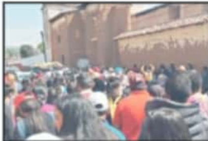
RUMBO A LA FUNERARIA HUBO PERSONAS QUE NO RESPETARON LA SANA DISTANCIA Y NO TRAÍAN CUBREBOCAS.

ELEMENTOS de auxilio también los buscaron