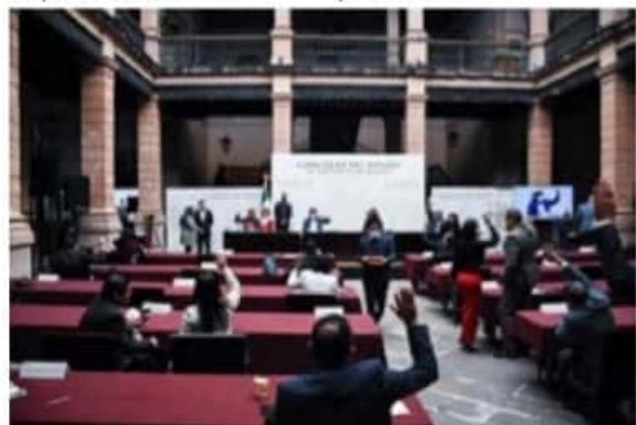
Con la nueva Ley Orgánica Municipal, diputados locales respaldaron la creación de Instancias Municipales para la Atención de las Mujeres de ma-

Es de esta manera que el Congreso de Michoacán, reafirma su convicción de instaurar marcos legales que coadyuven en la prevención y atención de la violencia contra las mujeres por razón de género, creando condiciones que les permitan una plena incorporación a la vida económica, política, social y cultural de nuestra sociedad.