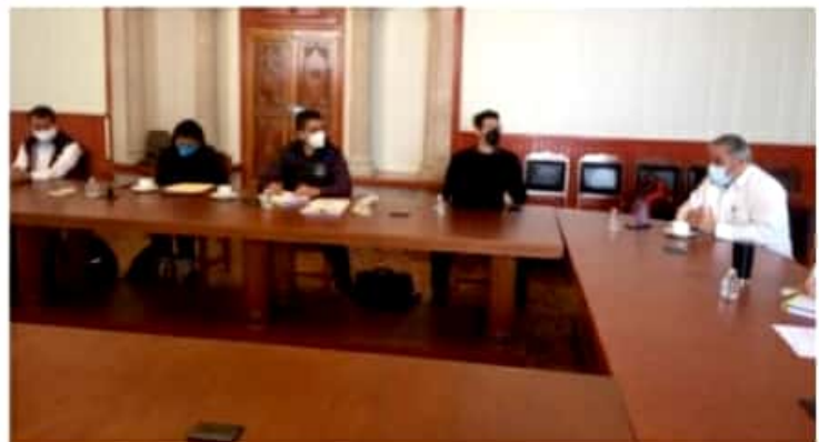
CD. LÁZARO CÁRDENAS, MICH.- Sin solución y sin avances, las negociaciones por solucionar el conflicto que impera en planteles del Cecytem.