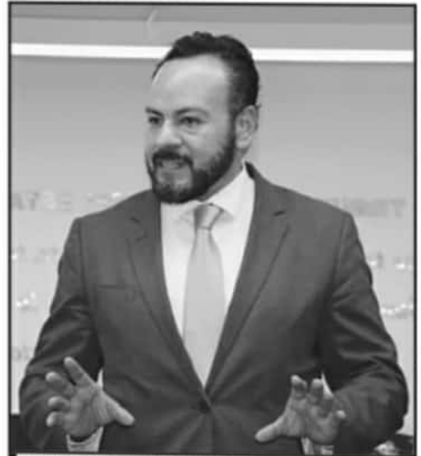
SALVADOR ALEJANDRO PÉREZ ASEGURÓ QUE EL RECIENTE CASO SENTARA UN PRECEDENTE PARA SANCIONAR A POLÍTICOS QUE SE ADELANTAN EN TIEMPOS.

Por otra parte, el magistrado del TEEM subrayó que los mayores desafíos del actual proceso electoral son la organización de los comicios en medio de una pandemia y la materialización del principio constitucional de la paridad en las candidaturas.