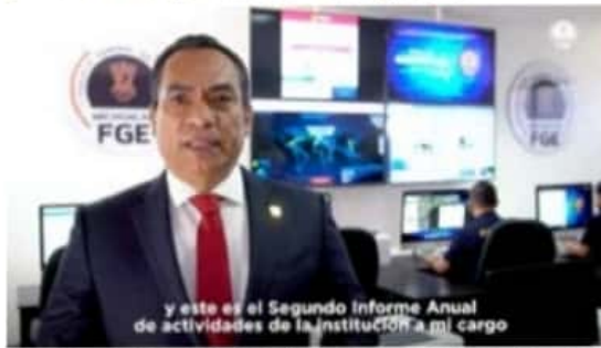
Ante la pandemia Covid-19, el Fiscal General del Estado, Adrián López Solís, presentó de manera virtual su segundo informe anual para rendir cuenta a los michoacanos.

López Solís, dijo que se está capacitando a todo el personal de la Fiscalía para que estén preparados, sean profesionales y respetuosos en su trabajo. Ello para que la atención que reciban las víctimas sea como debe de ser y a fin de que se resuelvan de mejor forma las investigaciones.