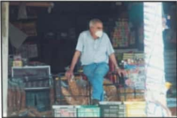
EL IMPACTO MÁS FUERTE EN EL MERCADO DE ABASTO HA SIDO PARA QUIENES TIENEN QUE HACER PAGOS LOS LUNES Y NO VENDEN LO SUFICIENTE ENTRE SEMANA.

Lo malo es que no nos pudimos prevenir porque pasaron a dejar una circular el día sábado a las 2:00 de la tarde, entonces no tuvimos tiempo y sí nos afectó un poco la venta Anónimo, VENDEDOR