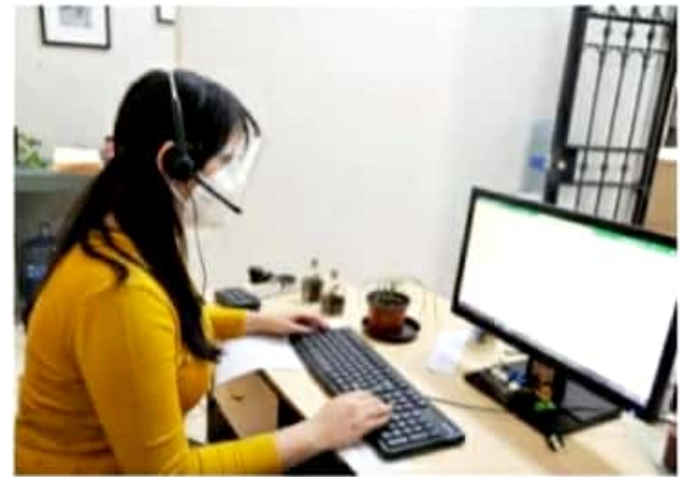
JACONA, MICH.- Las llamadas serán atendidas por especialistas en la enfermedad, así como psicólogos que atenderán los casos de ansiedad o depresión.

Además, es importante mantener la sana distancia, el lavado frecuente de manos, así como el uso de cubrebocas y gel antibacterial.