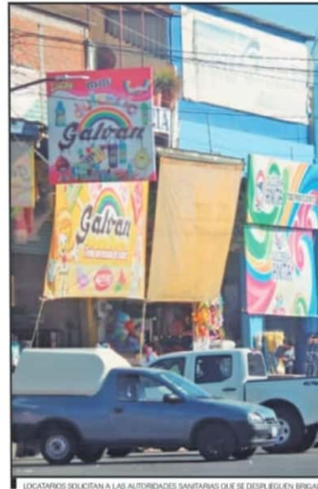
LOCATARIOS SOLICITAN A LAS AUTORIDADES SANITARIAS QUE SE DESPLIEGUEN BRIGADAS

Sobre las afectaciones que han tenido con el cierre de actividades, el encargado de una bodega, quien no quiso dar su nombre, reconoció que a ellos no les ha afectado tanto, ya que los productos que ellos venden no son perecederos a corto plazo, sino que tienen una vida útil de hasta un año. El impacto más fuerte ha sido que, como hay muchos pagos que tienen que hacer cada lunes, sus finanzas se complican ante la imposibilidad de no vender en el que ha sido el mejor día: los domingos. "Lo malo es que no nos pudimos prevenir porque pasaron a dejar una circular el día sábado a las 2:00 de la tarde, entonces no tuvimos tiempo y sí nos afectó un poco la