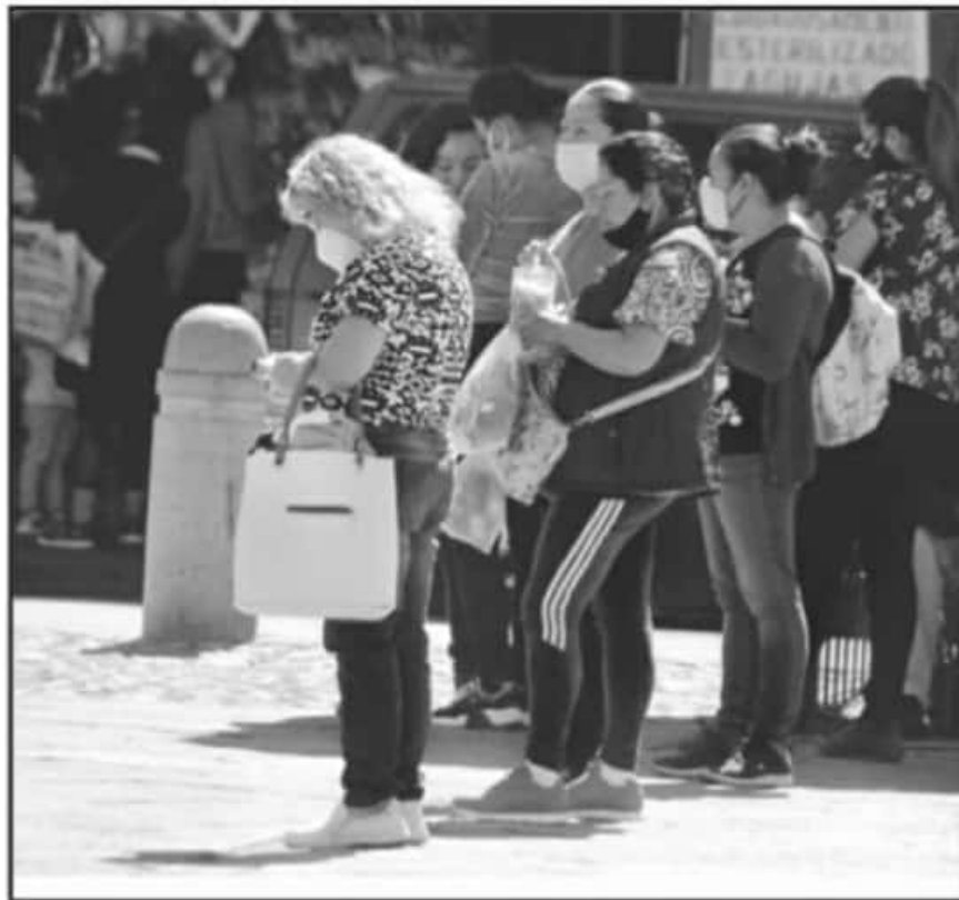
A PESAR DEL INCREMENTO DE CONTAGIOS, EN LA CAPITAL MICHOACANA LAS PERSONAS SIGUEN AGLOMERÁNDOSE.

nen la epidemia activa durante los últimos 21 días, en la entidad hay 4 mil 211, de los cuales, 714 se encuentran en Morelia, 208 en Pátzcuaro, 199 en Uruapan, 186 en Apatzingán, 166 en Zamora y La Piedad; 154 en Lázaro Cárdenas, 146 en Maravatío, 122 en Tacámbaro, 119 en Zacapu, 113 en Yurécuaro y 110 en Zitácuaro.