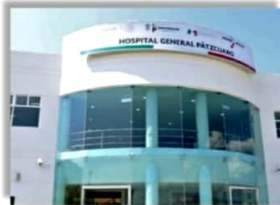
Se llena Hospitales que tienen camas Covid-19.

Vacunación, bajo criterios técnicos y no políticos. Este año, uno de los mayores retos del país, es implementar un plan de vacunación contra COVID-19, basado en un análisis objetivo de la epidemia en México"... ENFATIZAN que "la escasez mundial obliga a que las vacunas que el Gobierno Federal está adquiriendo con el dinero de los mexicanos, se apliquen con la máxima seguridad, transparencia, eficacia y cobertura". Incluso, los 10 gobernadores advierten "los riesgos que presenta el Plan Federal de Vacunación, presentado por el gobierno de la República" y precisan que en primer lugar les preocupa que ese plan "no tenga una visión de Salud Pública integral, que permita continuar con las medidas de mitigación y contención de la epidemia en el país, considerado a grupos prioritarios"... Preocupan, agregan, "que tampoco haya sido presentado ante el Consejo