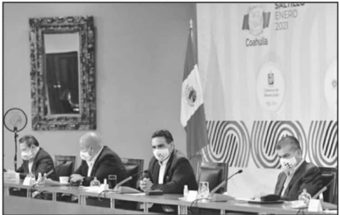
EN SU MOMENTO, LOS GOBERNADORES DE LA ALIANZA FEDERALISTA SOLICITARON LA AUTORIZACIÓN FEDERAL PARA COMPRAR VACUNAS CONTRA EL CORONAVIRUS.

Sin embargo, también adelantó que los estados de la Alianza Federalista seguirán con los trámites para la adquisición de la vacuna en conjunto con el sector privado y con la orientación de instancias federales de salud.