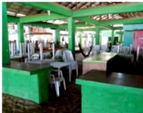
CD. LÁZARO CÁRDENAS, MICH.- Comerciantes de Caleta de Campos se adaptan a nuevas medidas sanitarias del 2021.

Finalmente precisó que tanto la población, como la propia jefatura de tenencia, se suman al nuevo llamado del mandatario estatal con el fin de erradicar al virus que azota al país y la economía de su gente, a través de seguir al pie de la letra las nuevas restricciones, cierres y nuevos horarios establecidos por las autoridades sanitarias.