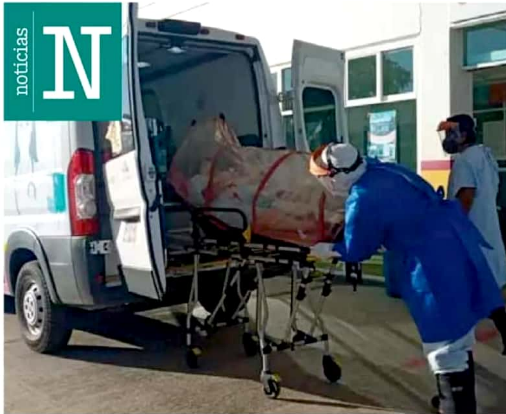
Saturados. Las ambulancias tienen que esperar horas afuera de los hospitales por la falta de camas Covid-19.