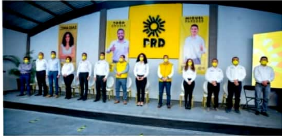
URUAPAN, MICH.- Los precandidatos del PRD en Uruapan están decididos a ser ejemplo de unidad, disciplina, respeto e interés en la población a la que aspiran representar.

Hoy, en plena campaña interna para definir candidatos a diputado federal, diputados locales y ayuntamiento, no existen las intrigas ni las descalificaciones entre los precandidatos. Hoy, los doce aspirantes a alguna de las candidaturas que irán a la cabeza, coinciden en afirmar que lo verdaderamente importante es la ciudadanía, que tiene el