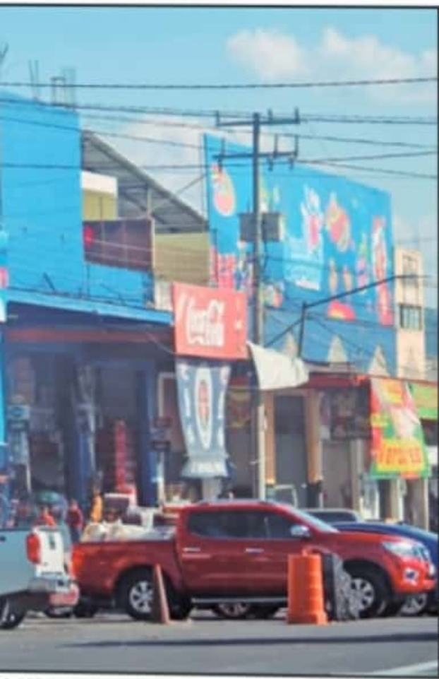
ALGUNOS SIGUEN ADELANTE EN LA PANDEMIA, YA QUE HAY CLIENTES QUE SE AGLOMERAN EN ALGUNOS NEGOCIOS.