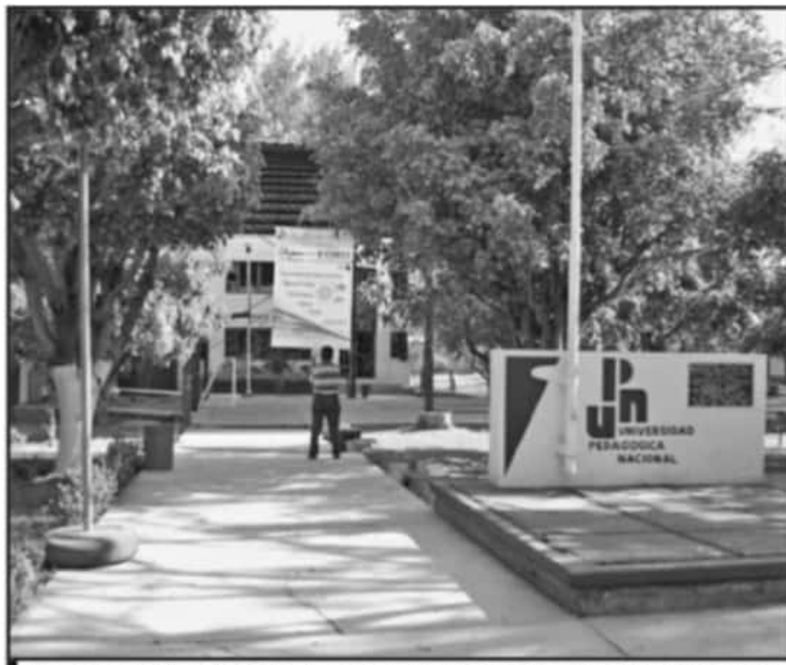
HACE POCO TIEMPO QUE RECIBIERON LA NOTIFICACIÓN DE LA SEE EN TORNO A QUE NO PAGARÍAN LOS INTERINATOS.