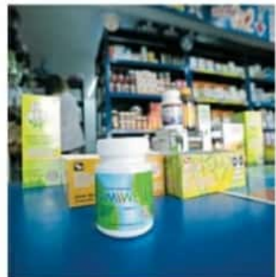
La vitamina C tiene una alta demanda en las farmacias particulares

Entre los beneficios de la vitamina C se encuentra que tiene efectos antioxidantes; es im-