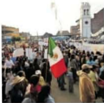
Solicitan que se le dé importancia a los usos y costumbres.

"Resulta interesante porque es una dinámica distinta a la que veníamos traba-