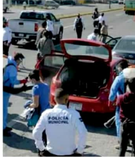
Medidas. El operativo inició este lunes en las salidas a Salamanca y Charo.

Para el programa, que de inicio se tiene contemplado que se realice durante tres meses, se hará una inversión de 150 mil pesos por mes, y este podría extenderse de acuerdo con los resultados, aunado a que en cada acceso habrá al menos dos personas del ayuntamiento de Morelia en apoyo a la empresa privada contratada, además del acompañamiento de la policía Morelia en cuanto a la vialidad.