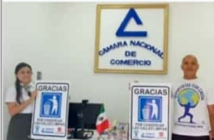
CD. LÁZARO CÁRDENAS, MICH.- Deportistas con Causa inician 2021 concientizando y sumando voluntades para mantener una ciudad limpia.