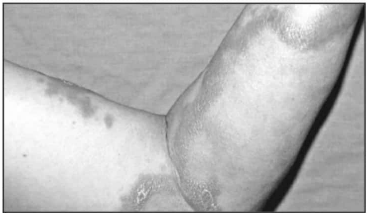
LA ENFERMEDAD PUEDE LLEVAR A TOMAR HASTA 2 AÑOS CON MEDICAMENTOS Y CUIDADOS CONSTANTES, COSA QUE NO LLEGAN A CUMPLIR MUCHOS PACIENTES.

llegar a durar un tratamiento para lepra