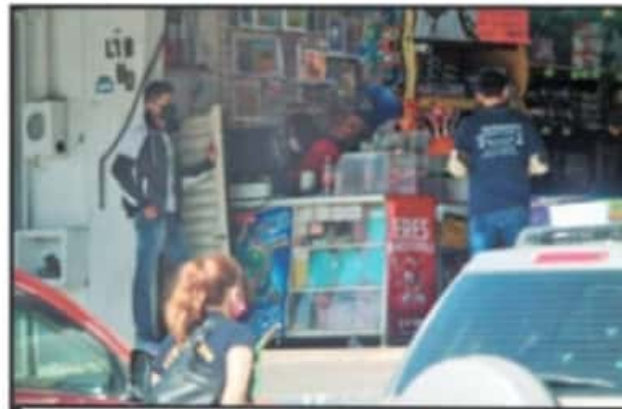
ALGUNOS LOCATARIOS SI HAN EXTERNADO PÉRDIDAS ECONÓMICAS, SOBRE TODO PORQUE SU DÍA MÁS FUERTE EN VENTAS ERAN PRECISAMENTE LOS DOMINGOS.

Además, recalco que el Mercado de Abasto, por su arquitectura y dinámicas propias, es un lugar seguro "porque estamos en áreas muy espaciales y el servicio se brinda al aire libre, donde se puede permitir la sana distancia y hay personas que vienen y escogen su producto, pero tenemos un horario amplio de venta. El mercado empieza a funcionar desde las 2:00 de la mañana, y aunque pudiéramos cerrar a las 2:00 de la tarde, decidimos expandirlo un poco más porque si compactamos el horario, obligamos a la gente a que venga a una hora específica. Además, sabemos que la alimentación con productos naturales ayuda a prevenir enfermedades, y si estamos bien alimentados, se puede