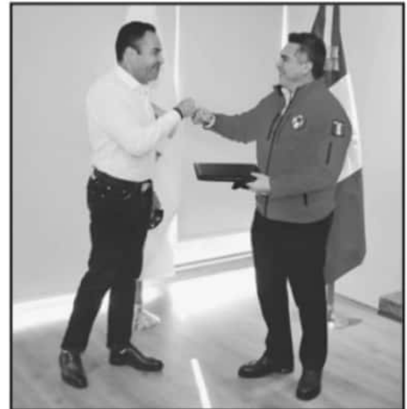
EL PERREDISTA BUSCA LOGRAR UNA UNIÓN TRIPARTITA Y LOGRAR ABANDONARSE PARA CONTENDER POR LA GUBERNATURA DEL ESTADO DE MICHOACÁN.