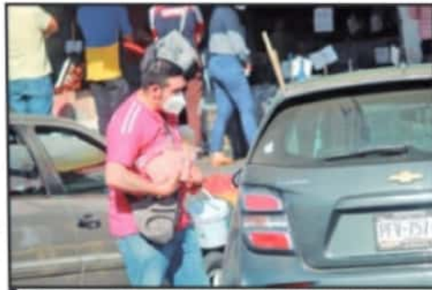
LA CLIENTELA, SABRIENDO DE QUE EL DOMINGO ESTARÁ CERRADO, ACUDEN EN MAYOR CANTIDAD LOS DÍAS SÁBADO PARA ADQUIRIR SUS PRODUCTOS.