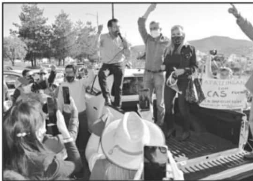
EXISTEN PROTOCOLOS QUE HAN SIDO ROTOS DESDE FINALES DEL AÑO PASADO EN CASI UNA CENTENA DE OCASIONES.

"Tenemos claro que en marzo va a estabilizarse el caso de los contagios y si otra vez soltamos, vamos a regresar a donde estamos ahorita y tenemos que ser muy cuidadosos en las actividades y las (medidas las) tienen que acatar todas y todos, porque es el mismo bien del desarrollo de las campañas y la salud de los actores. Imagínate que en plena campaña se enfermen los candidatos, tendrían que encerrarse 15 días y si de por sí las campañas se redujeron mucho tiempo", manifestó el mandatario michoacano.