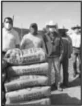
APOYA EL AYUNTAMIENTO A OBRAS EN VARIAS COMUNIDADES