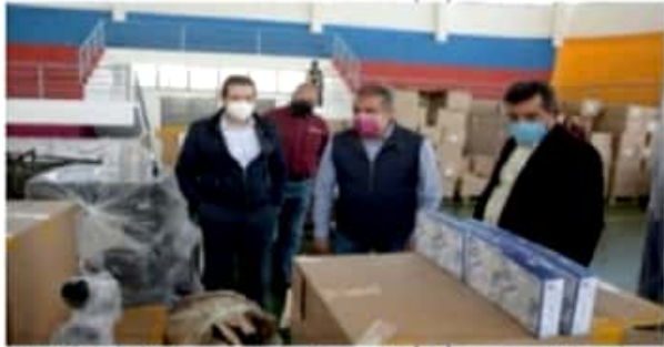
MORELIA, MICH.- La fundación Versatilidad Internacional de Cooperación Oportuna realizó importante donación con la que se fortalecerán los servicios de las 38 unidades médicas del municipio.

El donativo, consistió en 12 camas y colchones para pacientes, 12 mesas de exploración, biombos, bancos, escritorios y biombo, así como 15 mil cubrebocas KN95.