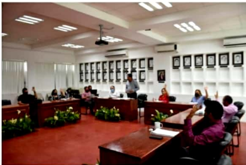
CD. LÁZARO CÁRDENAS, MICH.- En sesión ordinaria de Cabildo, el Órgano de Gobierno autorizó por unanimidad de votos al Capalac, otorgar subsidios en la tarifa del servicio de suministro del vital líquido a diversos sectores de la población.