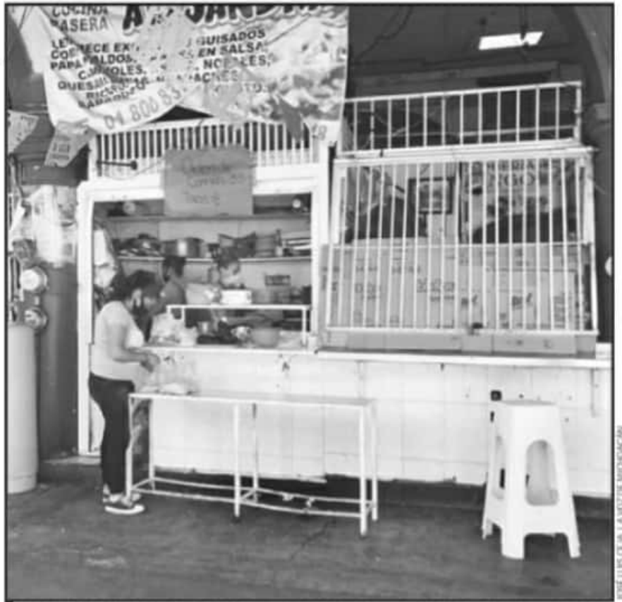
CON LA FINALIDAD DE EVITAR MÁS DAÑOS A LOS BOLSILLOS, DECENAS DE LOCATARIOS PIDEN REABRIR SUS NEGOCIOS.

Entre otros, los comerciantes sustentaron su petición en el argumento de que