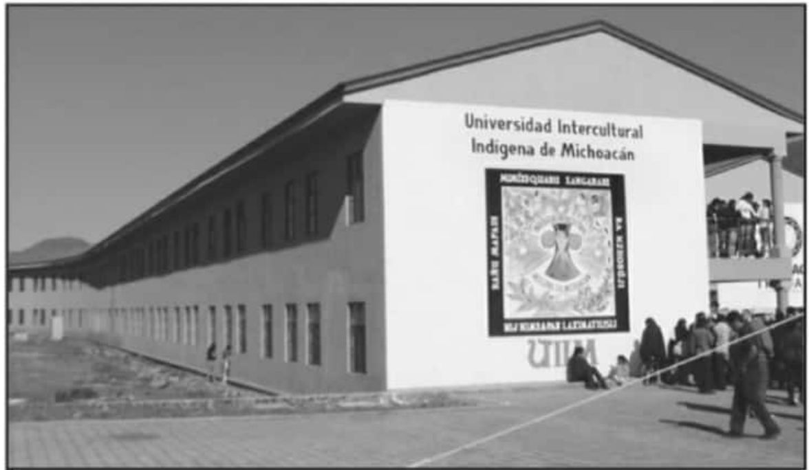
LOS ALUMNOS EGRESADOS DE TODOS LOS CAMPUS DE LA UNIVERSIDAD INTERCULTURAL INDÍGENA DE MICHOACÁN EXIGEN AGILIDAD EN TRÁMITES DE TÍTULOS

Señalaron que, frente a todo ese escenario de desatención, incluso se llegó a decir que estaban afectados "por la COVID-19" los encargados del departamento de