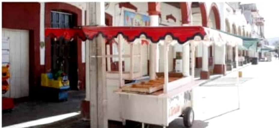
IXTLÁN DE LOS HERVORES, MICH. - Los negocios no esenciales cerraron durante los días jueves, viernes y sábado, en punto de las 19:00 horas.

Finalmente, se recomienda a las y los ciudadanos que en caso de presentar síntomas de Covid-19, como fiebre superior a los 37.5 grados, tos seca, dificultad para respirar, cansancio o debilidad, no debe automedicarse y acudir inmediatamente al Centro de Salud para su atención.