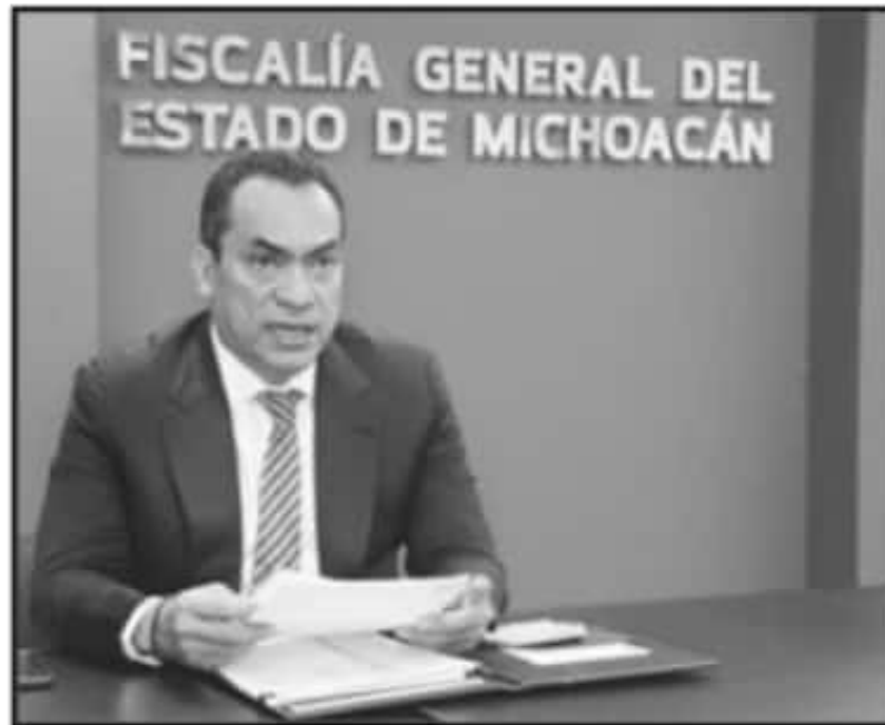
EL TITULAR DE LA FGE LLAMÓ AL PERSONAL A TRABAJAR COORDINADAMENTE, COMO UNA SOLA INSTITUCIÓN, Y CON RESPETO A LOS DERECHOS HUMANOS.

En el marco de la reunión operativa realizada ayer lunes, el funcionario resaltó la importancia de trabajar como una sola