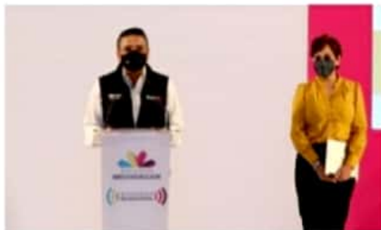
MORELIA, MICH.- El mandatario destacó la importancia de no dejar de lado el cumplimiento de las medidas sanitarias para impulsar la recuperación de los negocios.

Destacó que los protocolos están disponibles para su consulta en la página https://www.nuevoturismo-michoacan.com que en el mes de junio, el Consejo Mundial de Viajes y Turismo (WTTC siglas en inglés) los aprobó y otorgó el sello SafeTravels.