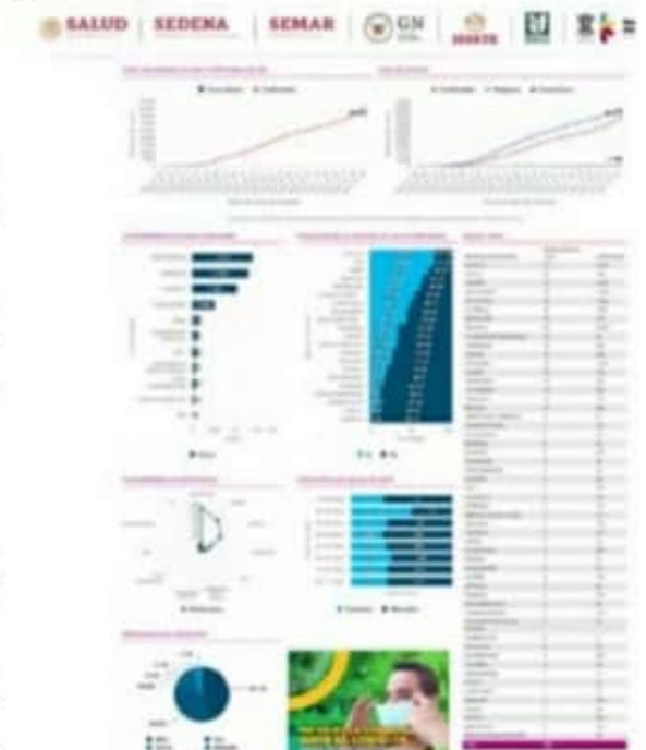
De acuerdo al reporte técnico del CESS, el municipio de LC inició la última semana de enero con cero nuevos casos positivos de COVID-19. Tampoco se reportó ningún nuevo deceso.