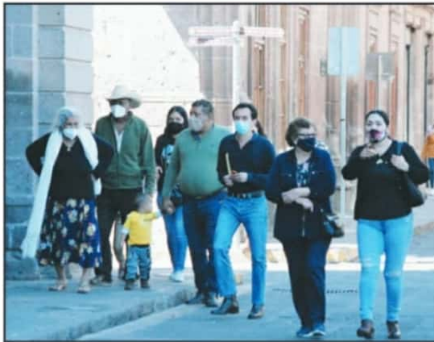
LOS PRIMEROS DÍAS DE ENERO COMENZARON CON UNA MOVILIDAD A PIE 20 POR CIENTO MAYOR A LA HABITUAL.