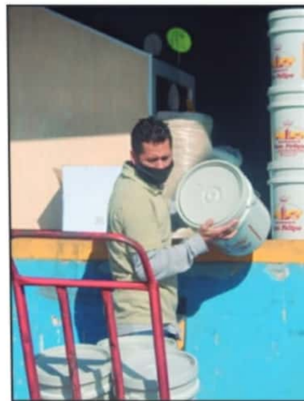
HAY PERSONAS QUE VAN DE BODEGA EN BODEGA BUSCANDO SUS PRODUCTOS, SIN AGLOMERARSE Y UTILIZANDO SUS CUBREBOCAS, PERO HAY OTROS QUE NO.

Luego de que se decretara el cierre de actividades comerciales y no esenciales los días domingo en el estado de Michoacán, locatarios del Mercado de Abasto señalan que, aunque necesario, el mantener sus cortinas abajo los días domingos sí ha tenido impactos negativos en sus negocios.