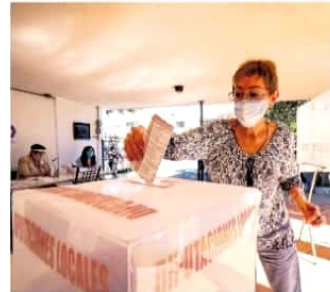
El proceso electoral del 6 de junio es un reto para el que se está preparando el IEM.

Hasta el momento, los comités distritales y municipales han tenido tres sesiones: el 18 de diciembre para la instalación formal; el 28 de diciembre para designar el espacio que ocupará la bodega electoral, y, entre el 16 y 17 de enero, la revisión de las adecuaciones de seguridad para las bodegas.