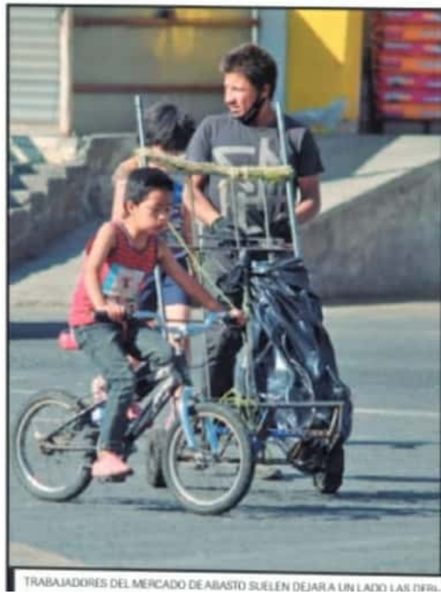
TRABAJADORES DEL MERCADO DE ABASTO SUELEN DEJAR A UN LADO LAS PRECAUCIONES.