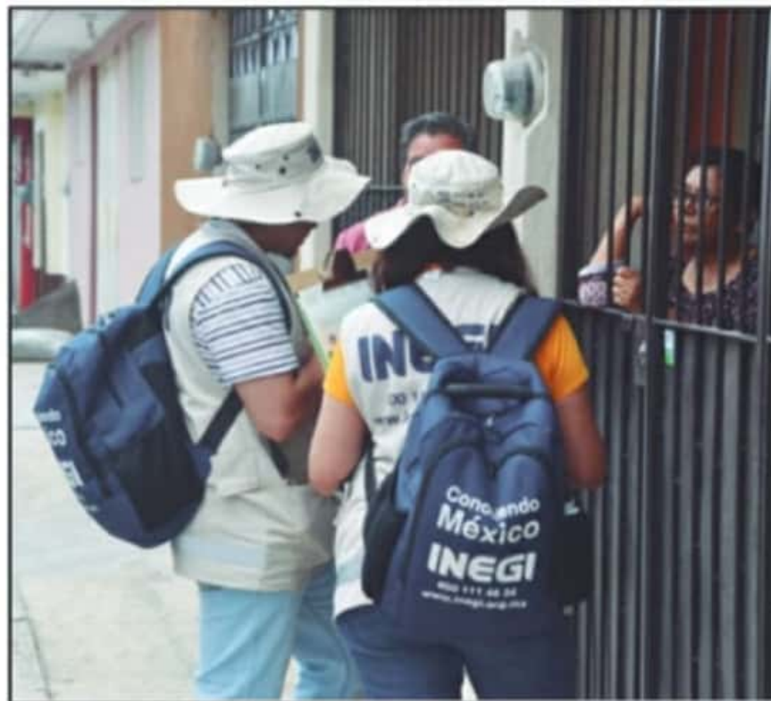
LA INFORMACIÓN FUE RECABADA POR EL INEGI DURANTE EL MES DE MARZO DEL AÑO PASADO, AL LLEGAR LA PANDEMIA.

un incremento del 22.5 por ciento con respecto al Censo de hace una década, cuando se reportaron 729 mil 279 morelianos.