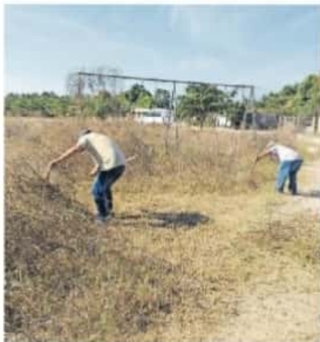
Se espera que, a más tardar, en julio terminen con las áreas restantes

"Es complejo llegar y que las mujeres quieran hablar, nos costó mucho hacer las baterías de preguntas. A ellas les da mucho miedo enfrentarse para decir la realidad", sentenció la titular de esta dependencia.