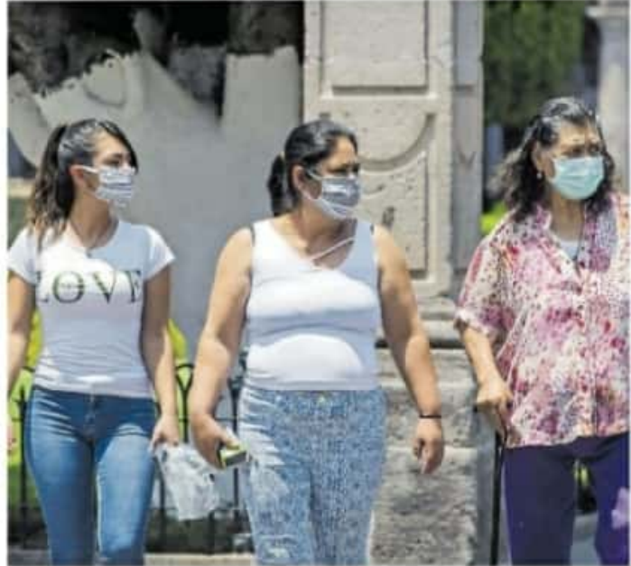
Son 102 las alcaldías que cuentan con un instituto municipal dedicado a la atención del sector

Declaró que en Gabriel Zamora se tenía la intención de desaparecer esta dependencia desde el pasado mes de noviembre, mientras que en diciembre y enero "nos reportaron algunas cancelaciones de las instancias para dar continuidad al trabajo", aunque la funcionaria señaló que será en los próximos días que pueda brindar el listado de los municipios que continuarán con estos institutos.