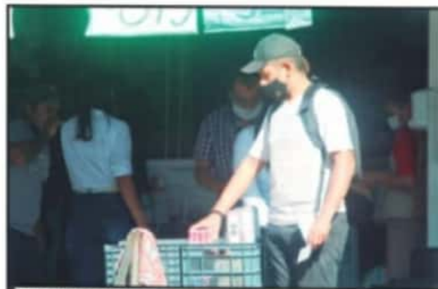
PARA EVITAR QUE ALGUNOS PRODUCTOS SE ECHEN A PERDER, LOS LOCATARIOS HAN TENIDO QUE METER REFRIGERADORES, AUNQUE ESO REPRESENTA MÁS PAGOS.