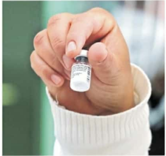
El gobernador mencionó que difícilmente la administración a su cargo accedería a realizar una compra del medicamento.

En caso de poder acceder a la vacuna, Aureoles Conejo subrayó que su aplicación será priorizada en los sectores más vulnerables, entre ellos ciudadanos con enfermedades crónico degenerativas, adultos mayores y personas con discapacidad.