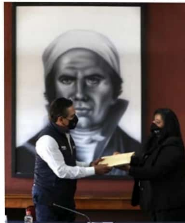
Michoacán se mantiene en lugar número 9 a nivel nacional por su número de habitantes: SAC.

De acuerdo a los indicadores evaluados por el INEGI, el 53.4 por ciento de los hogares cuenta con televisión, el 42.4 por ciento con un horno de microondas, el 21.7 utiliza la bicicleta como medio de transporte, el 18.3 posee una motocicleta o motoneta, el 11.7 por ciento paga por servicios de películas, música o video por internet y el 7.9 por ciento de las viviendas dispone de consola de videojuegos.