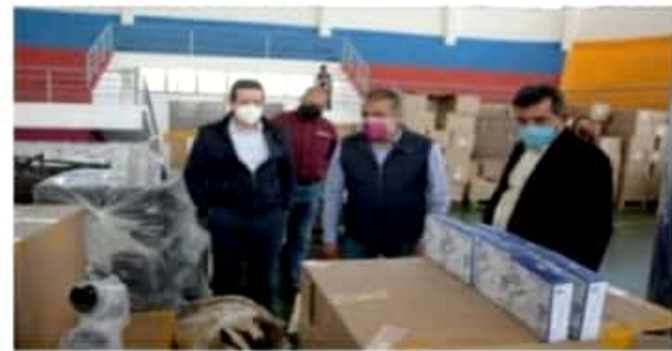
MORELIA, MICH.- La fundación Versatilidad Internacional de Cooperación Oportuna realizó importante donación con la que se fortalecerán los servicios de las 38 unidades médicas del municipio.

El donativo, consistió en 12 camas colchones para pacientes, 12 mesas de exploración, biombos, bancos, escritorio y biombos, así como 15 mil cubrebocas KN95.