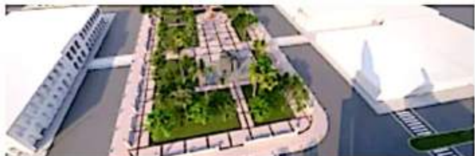
APATZINGÁN, MICH.- Será una obra que cambiará totalmente la imagen del municipio y estará en sintonía con los espacios que recién se remodelaron a un costado del parque infantil "Amanecer".

Expuso que al municipio de Apatzingán le corresponde del tramo carretero de la glorieta a Chando hasta Las Colonias Cenobio Moreno y ante el aplazamiento de la obra, el gobierno municipal iniciará labores de bacheo en la vía, ya que se trata de una zona industrial y en la que se mueve gran parte de la comercialización del limón.