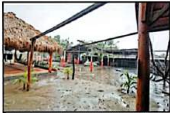
PERSONAL DE PROTECCIÓN CIVIL DESTACADO ALLÍ DURANTE SUS PEDRIDOS POR TODA LA REGIÓN COSTERA LINCAMENTE ENCONTRARON DAÑOS MATERIALES.

ESTRAGOS HURACÁN OCASIONA FALLAS ELÉCTRICAS Y EN TELEF