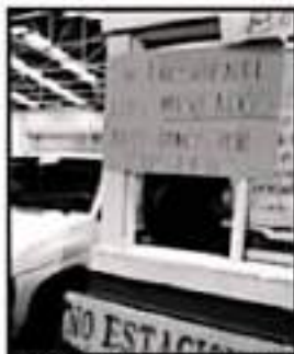
SE BUSCA EL APOYO DEL ALCALDE.

Sobre lo que respecta a la explanada del Mercado de Independencia, el acuerdo es que los sinamos se establecerían puentes y