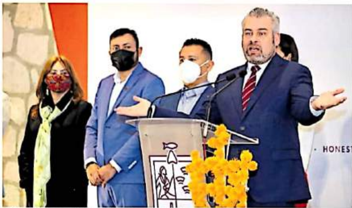
El gobernador Alfredo Ramírez Bedolla estará a la espera de que el Congreso apruebe la propuesta. FERNANDO BALDADO