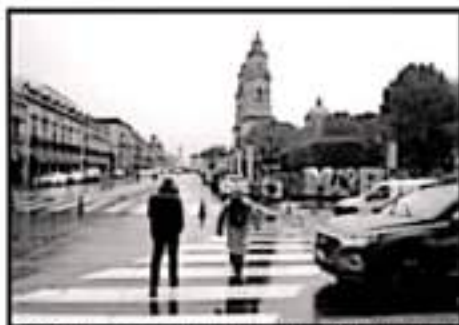
EN MORELIA LA LLUVIA COMENZÓ DESDE TEMPRANA HORA.