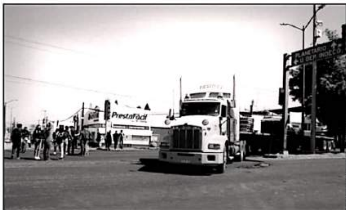
ALREDEDOR DE LAS 11:00 HORAS ALREDEDOR DE 300 DOCENTES RETORNARON TRES VEHÍCULOS DE TRANSPORTE DE CARGA PARA EL BLOQUEO DE LA VIALIDAD.

Manifiesto que en el caso específico de secundarias los funcionarios que no los atendieron son los responsables de que se haya suscitado la movilización desde el lunes pasado con el bloqueo de vialidades ya que como organización siempre han privilegiado primero el diálogo y luego las acciones de presión.