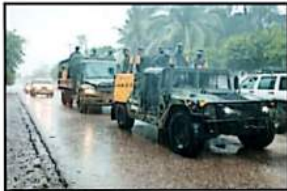
APAREJEREN LAS SECRETARÍAS DE SEGURIDAD PÚBLICA, DE LA DEFENSA NACIONAL Y DE LA MARINA, ASÍ COMO DE LA GUARDIA NACIONAL Y DE PROTECCIÓN CIVIL.