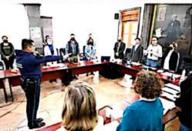
ZAMORA, MICH.- Trascendió que para tal efecto se citó a junta de cabildo extraordinaria, donde los regidores y regidoras votaron de manera secreta.