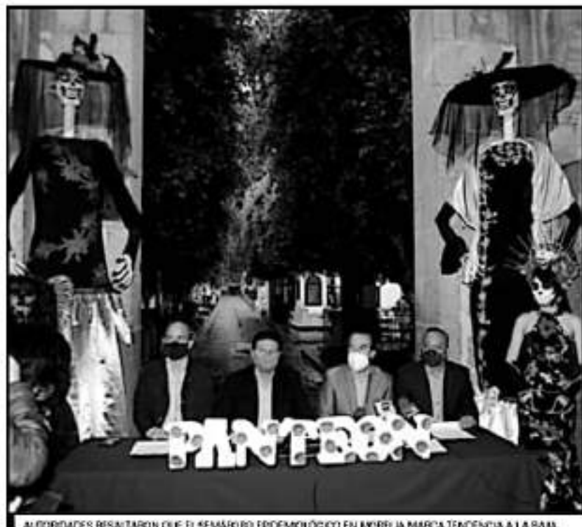
AUTORIDADES RESALTARON QUE EL SEMÁFORO EPIDEMIOLÓGICO EN MORELIA MARCA TENDENCIA A LA BAJA.