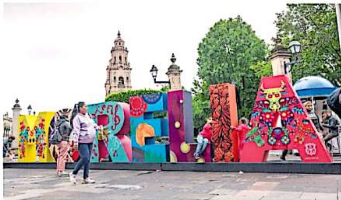
El año 2019 fue el mejor para el turismo en Michoacán con un 98% de ocupación. (IVER QUIROGA)