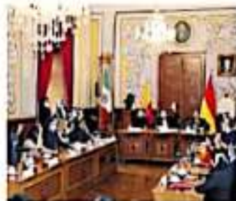
Se sesión para anunciar la estrategia CORTEVA AYUNTAMIENTO DE MORELIA

Los embajadores en México de los países en cuestión fueron recibidos por el Cabildo como "hospedes distinguidos de la ciudad", bajo ese escrutinio, lo que se pretende es aprender de estas naciones sobre cómo superaron la pandemia en los rubros antes mencionados, incluyendo la cuestión sanitaria y la forma de recuperación.