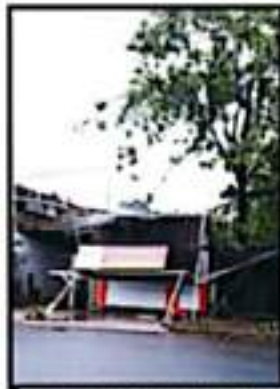
MIS DAÑOS SE DEJABAN VER EN VARIOS ESTABLECIMIENTOS DE LA COSTA.