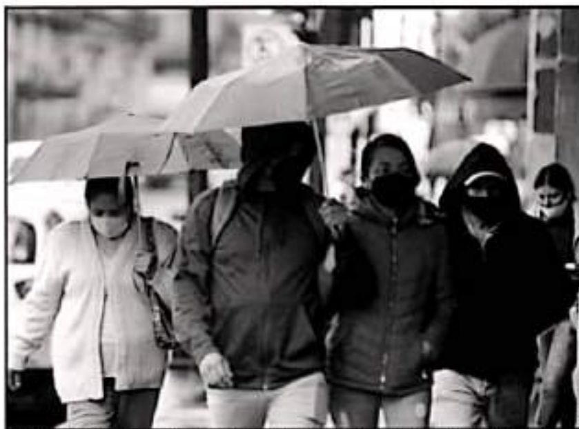
EN MORELIA, SI BIEN NO HUBO FUERTES TORMENTAS SE LLEVÓ DURANTE VARIAS HORAS HASTA ENTRADA LA TARDE.

blación. En dicho municipio se encuentran 40 personas en uno de los albergues temporales, mismas que ya están siendo auxiliadas por personal del Sistema DII municipal.