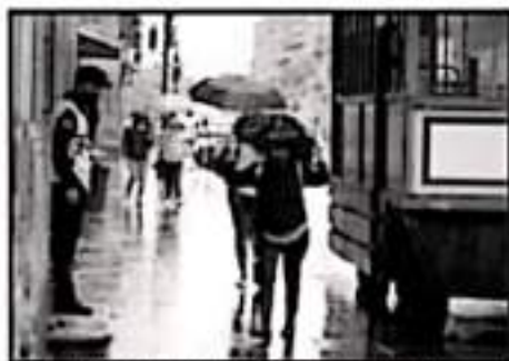
LA AUTORIDAD LLAMA A MANTENER LA FRECUENCIA.