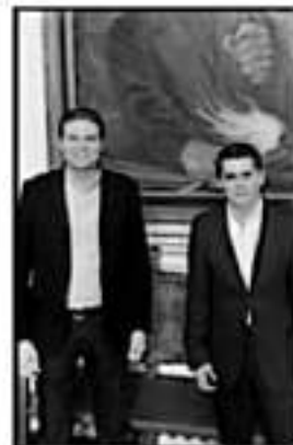
EN REUNIÓN SE RESALTO LA IMPORTANCIA DE TRABAJAR DE LA MANO.

Con estas medidas, el Gobierno municipal hizo un llamado a toda la ciudadanía de Morelia a programar su visita a los panteones, y atender en todo momento las indicaciones de las autoridades para que esta celebración transcurra en orden.