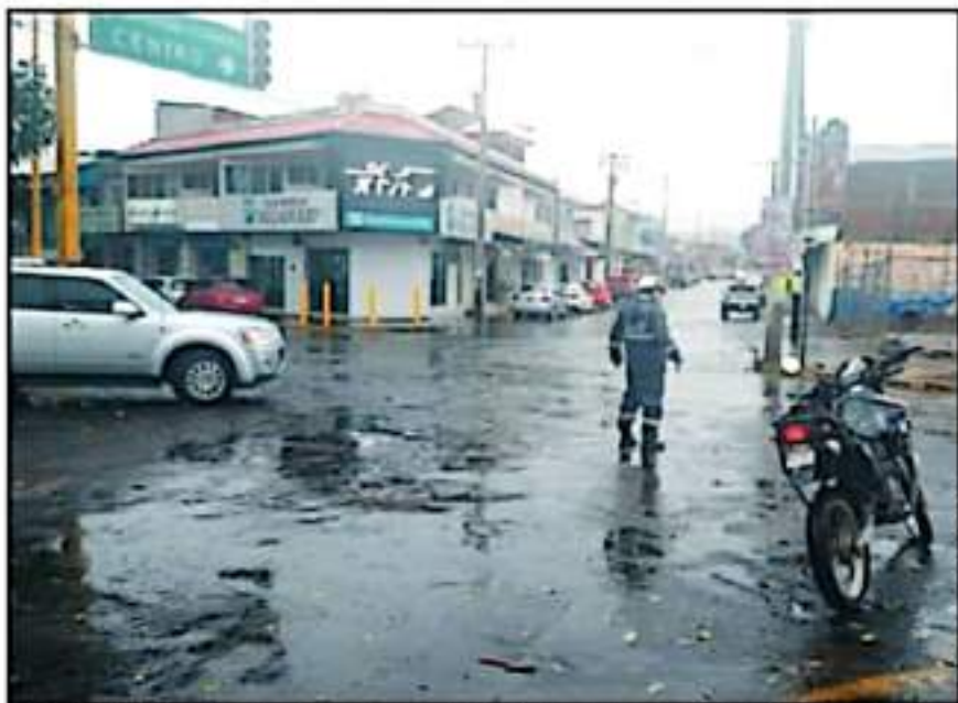
CORPORACIONES DE AUXILIO DELAYENTE HAN ATENDIDO ENCHARCAMIENTOS, ENTRE OTRAS CONTINGENCIAS MENORES

Los informes oficiales precisas que hasta ayer por la tarde, oficialmente el huracán Rick se había degradado a tormenta tropical, lo que permite pronosticar que, para las próximas horas, concretamente este martes, las precipitaciones pluviales habrán disminuido considerablemente y se estará en condiciones de desactivar el estado de alerta.