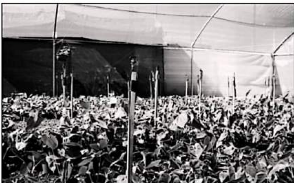
¡FÓRMES RECABADOS SEÑALAN QUE EXISTE TAMBIÉN LA PRESENCIA DE ESTE INSECTO EN HUERTAS DE LA REGIÓN DEL MUNICIPIO DE VENUSTIANO CARRANZA

más en alerta, por la presencia del insecto