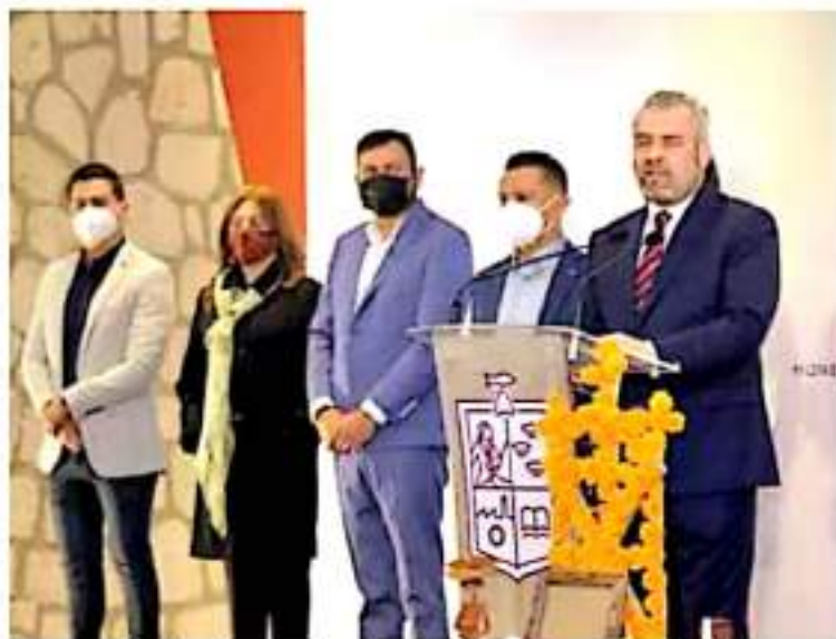
Adeudos vehiculares. Beneficiará también a transportistas, aseguró el gobernador. Josimar Lara

En conferencia de prensa, el mandatario detalló que son alrededor de 200 mil vehículos particulares de los cuales los dueños no han hecho trámites de ningún tipo de 2012