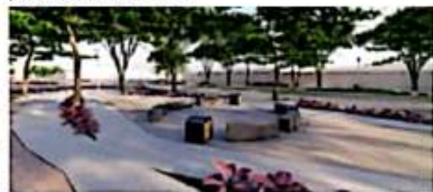
APATZINGÁN, MICH.- De acuerdo con las autoridades de la Secretaría de Comunicaciones y Obras Públicas (SCOP), el proyecto iniciará el próximo año.