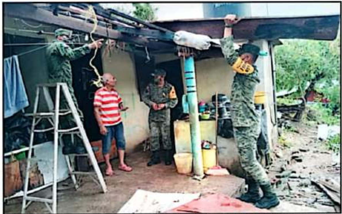
PERSONAL MILITAR BRINDÓ APOYO A CIUDADANOS QUE SUFRIERON DAÑOS EN SUS TECHOS, DONDE ALGUNOS SE VIERON ABAJO Y OTROS QUEDARON CON CRISTALES ROTOS.

En otros lugares de Lázaro Cárdenas fue la caída de árboles la