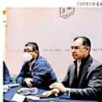
Titulares de secretarías sostuvieron un encuentro con integrantes del IEM.

emitir un acta que será el responsable de recibir el recurso, además de considerarse como personas jurídicas para poder abrir una cuenta bancaria para depositar los recursos en el SAT y una serie de requisitos que van siendo acompañados desde el principio hasta el final por esa mesa.