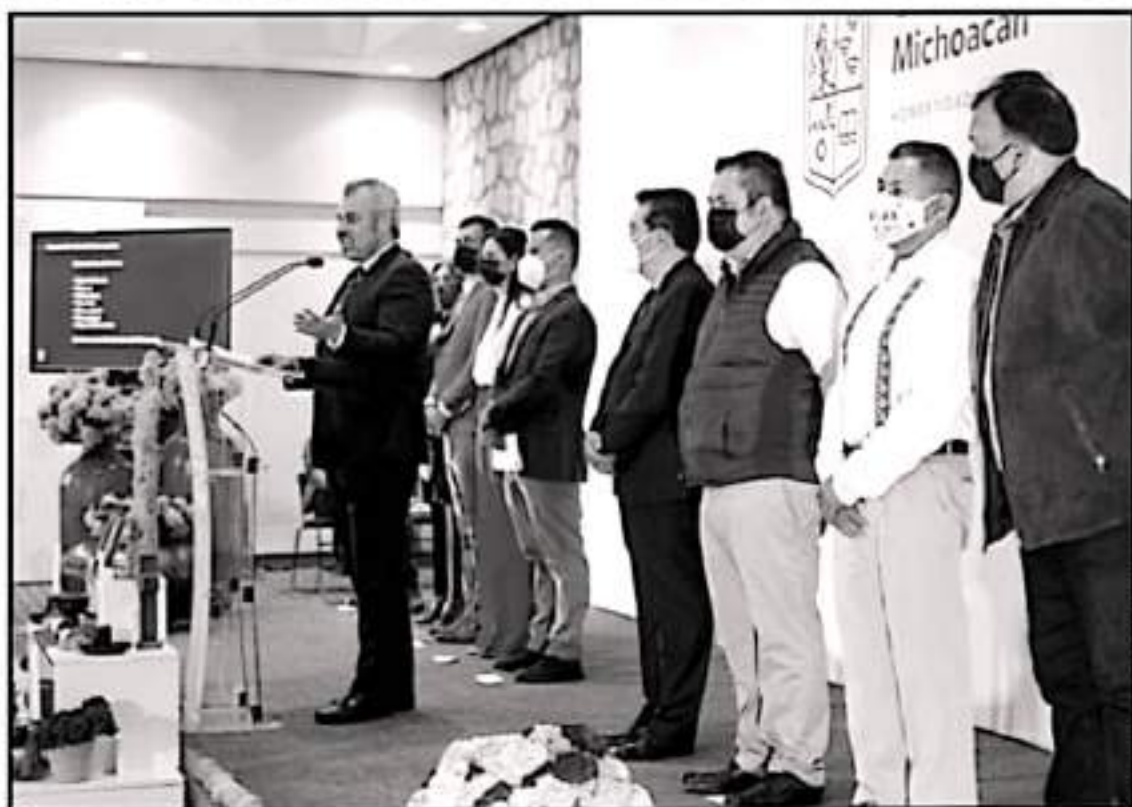
ALFREDO RAMÍREZ BEDOLLA RECORDÓ QUE EL INCIDENTE QUE SE ENVAJÓ CON LOS MAESTROS ES UNA DEUDA HEREDADA POR LA ADMINISTRACIÓN ANTERIOR

Ramírez Bedolla recordó que el pendiente que tienen aun con los maestros es una deuda heredada por la administración anterior, pero hacia el futuro en la gestión de los recursos. Recordó que el gobierno saliente refirió que fue precisamente la Federación la que no liberaba el recurso, problemática a la que se enfrenta