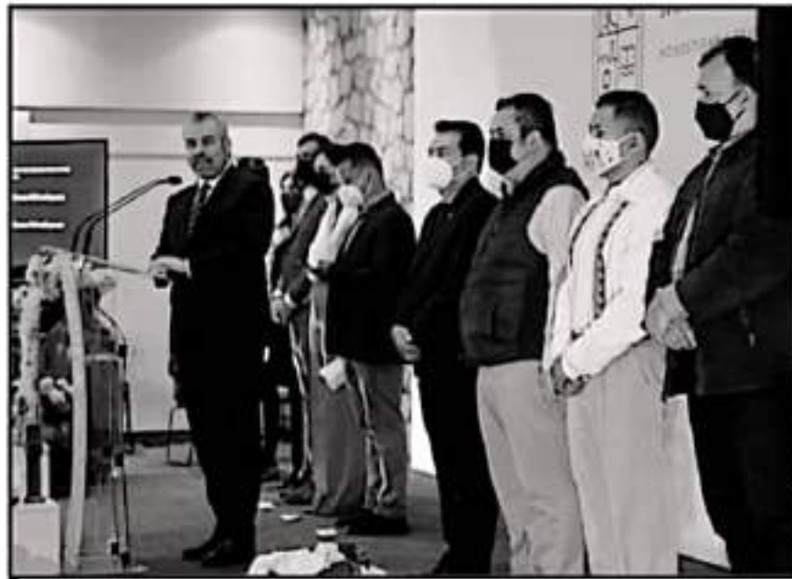
EN UNA REUNIÓN DE PRENSA, EL GOBIERNADOR, ALFREDO RAMÍREZ BEDOLLA, COMENTÓ LOS DETALLES DEL DÍA DE MUERTOS

Durante el anuncio oficial, el gobernador Alfredo Ramírez Bedolla agregó que era importante retomar esta "gran festividad", y se pudo hacer, justificó, debido a que Michoacán pasó a Semáforo Verde en el mapa epidemiológico nacional. Vale la pena destacar que las tres regiones más visitadas: Uruapan, Morelia y Pátzcuaro se