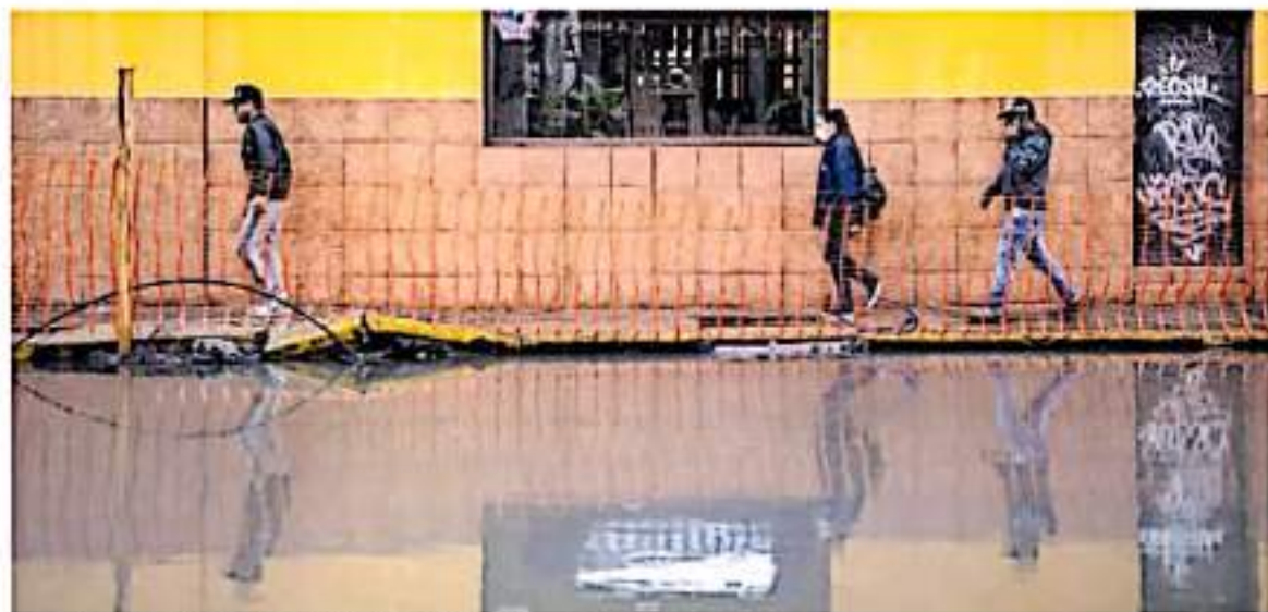
En Puararán se registraron 15 viviendas inundadas.