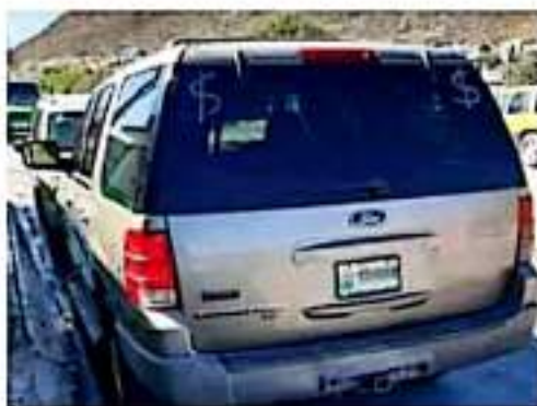
Michoacán. El gobernador anunció que solicitarán a la SHCP que el estado sea contemplado en el programa. Josimar Lara

Dijo que en ese programa de regularización sólo se incluye a Baja California, Sonora, Chihuahua, Coahuila, Nuevo León, Tamaulipas y Baja California Sur, pero argumentó que Michoacán, al ser segundo lugar en captación de remesas y tener mayor presencia de migrantes en Estados Unidos, es una entidad que también cuenta con