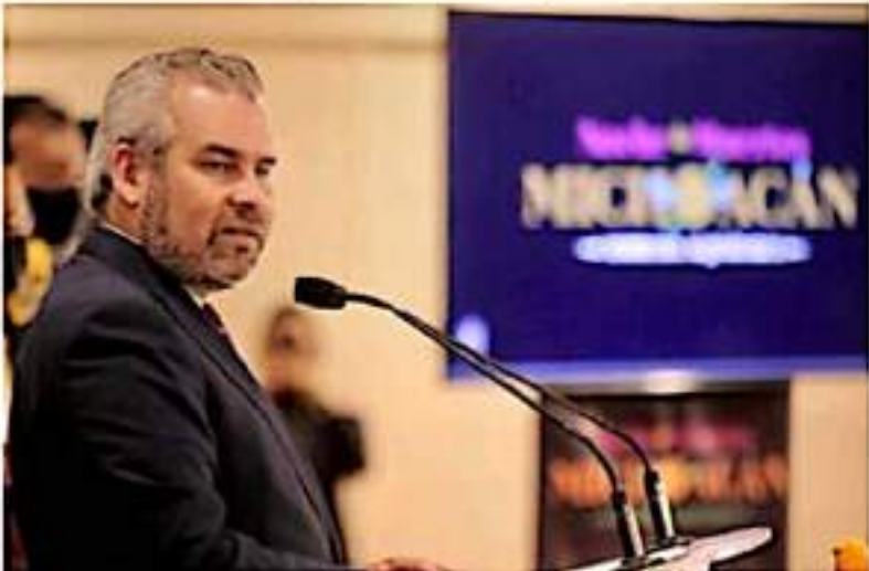
MORELIA, MICH.- En apoyo a la economía local y para alcanzar la estabilización fiscal del estado, el gobernador Alfredo Ramírez Bedolla presentó un ambicioso programa.

MORELIA, MICH.- Alfredo Ramírez Bedolla, gobernador de Michoacán, presentó un programa de estabilización fiscal y apoyo a la economía local, para cerrar el año porque el estado sufre una emergencia financiera por el déficit de más de 12 mil millones de pesos. El gobernador precisó que el boquete financiero que sufre el estado es muy grande y se requiere de ayuda para cerrarlo para ello enviará al congreso el proyecto de estabilización fiscal con el que pretende recaudar 466 millones de pesos.