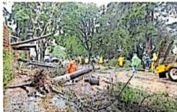
En Ario de Rosales reportaron la caída de cuatro árboles.

El personal militar del sexto grupo de Infantería Motorizada participó junto a las autoridades de Seguridad Pública (SSP) y Protección Civil (PC), para remover el lodo y arena de las viviendas, así como para pro-