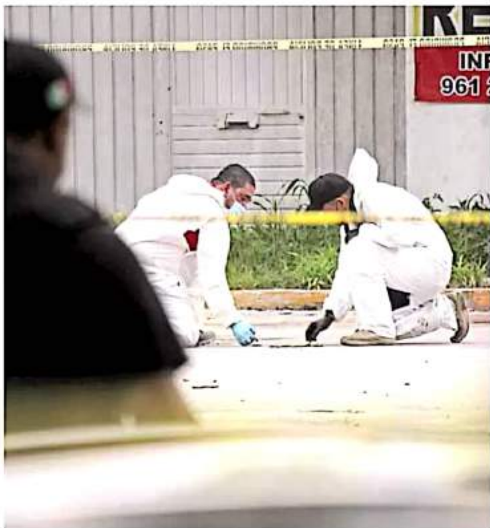
Pandemia. La crisis sanitaria agravó el problema para garantizar justicia en el país. JUAN CARLOS

Una de cada tres averiguaciones previas y carpetas de investigación iniciadas por las procuradurías y fiscalías generales de justicia de los estados en 2020 se registró con