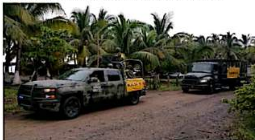
CD. LÁZARO CÁRDENAS, MICH.- Elementos del Ejército Mexicano aplicaron el Plan DN-III-E en su Fase Prevención en el municipio de Lázaro Cárdenas.

refrenda su responsabilidad y compromiso de servir al pueblo de México en cualquier condición, lugar, de forma ininterrumpida, fin de realizar actividades para proteger la integridad física de la población.