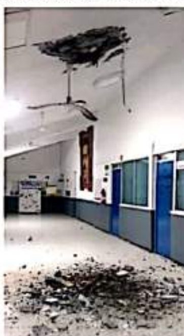
CD. LÁZARO CÁRDENAS, MICH.- El Hospital General de Lázaro Cárdenas, sufrió daños tras el colapso de un árbol al interior del

Hasta ahora los autoridades estatales, federales y municipales siguen trabajando en la logística de retiro de árboles y en el recuento de daños generados por