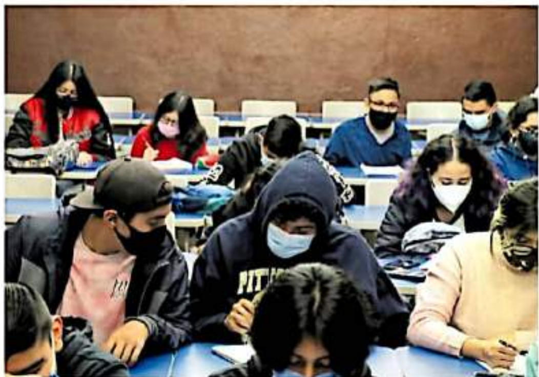
Regreso a clases presenciales en el Colegio de San Nicolás

NECESITAN 650 MDP PARA CONCLUIR AÑO FISCAL