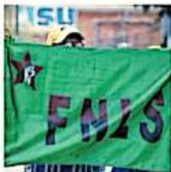
Afirmar que el Frente nunca pidió la mitad del subsidio