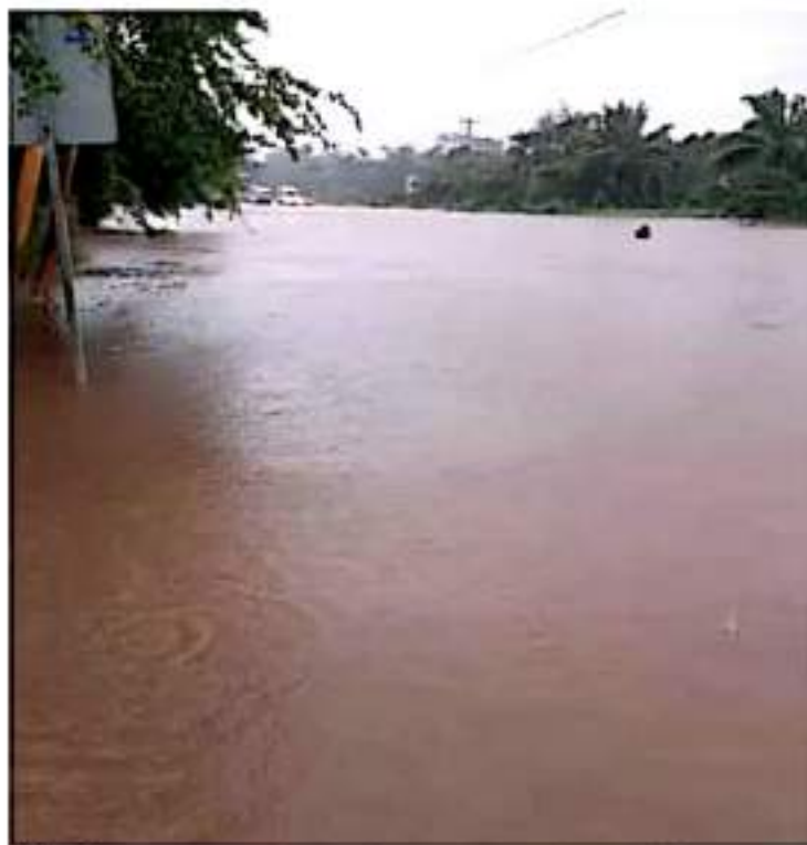
Vigilancia. Cuerpos de emergencia se mantienen atentos, ya que siguen las lluvias. Comersia

De igual manera, en la cabecera municipal de Lázaro Cárdenas se registraron daños menores en algunos inmuebles, la caída de árboles, de anuncios espectaculares,