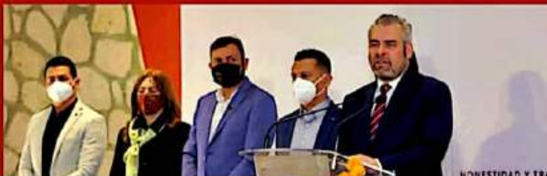
HONESTIDAD Y TRA

Por otra parte, el gobernador agregó que se solicitará a la Secretaría de Hacienda y Crédito Público incluir a Michoacán en la regularización de automotores usados procedentes del extranjero, luego de que el pasado 18 de octubre se publicó en el Periódico Oficial de la Federación el acuerdo de importación definitiva.