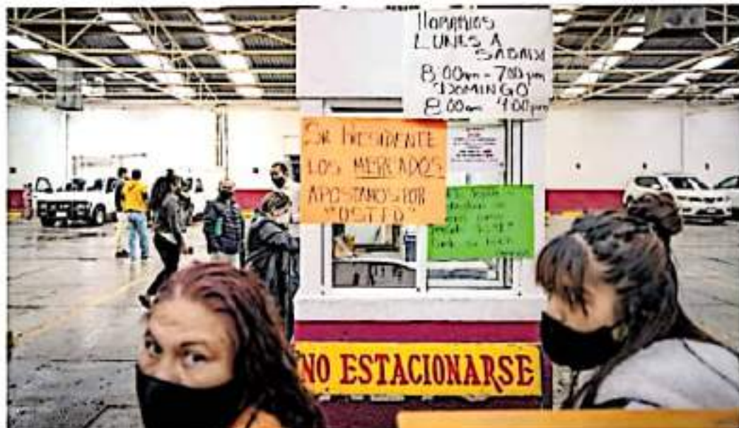
Piden que se dignifique la situación de los 750 locatarios del mercado