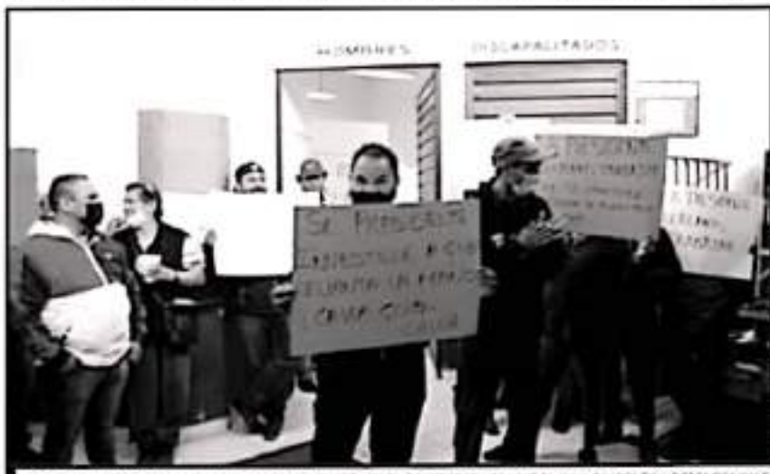
AFIRMAN LOCATARIOS QUE CUESTAN CON LA FUERZA PARA PROTESTAR Y TOMAR EL AYUNTAMIENTO Y DEPENDENCIAS.

domingos únicamente. No obstante, toda la semana estos espacios se encuentran completamente llenos de puestos de diferentes tipos comerciales que no siquiera se encuentran armonizados con los locatarios y otros comerciantes y ya nada al inmueble ubicado al sur del Centro Histórico, buscando vitalidad y acceso.