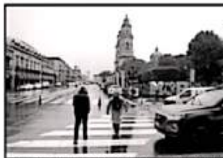
LA TEMPERATURA BAJO ESTE LUNES EN LA CIUDAD CAPITAL.

■ LLUVIAS ■ ATIENDEN LOS DAÑOS DEL HURACÁN RICK