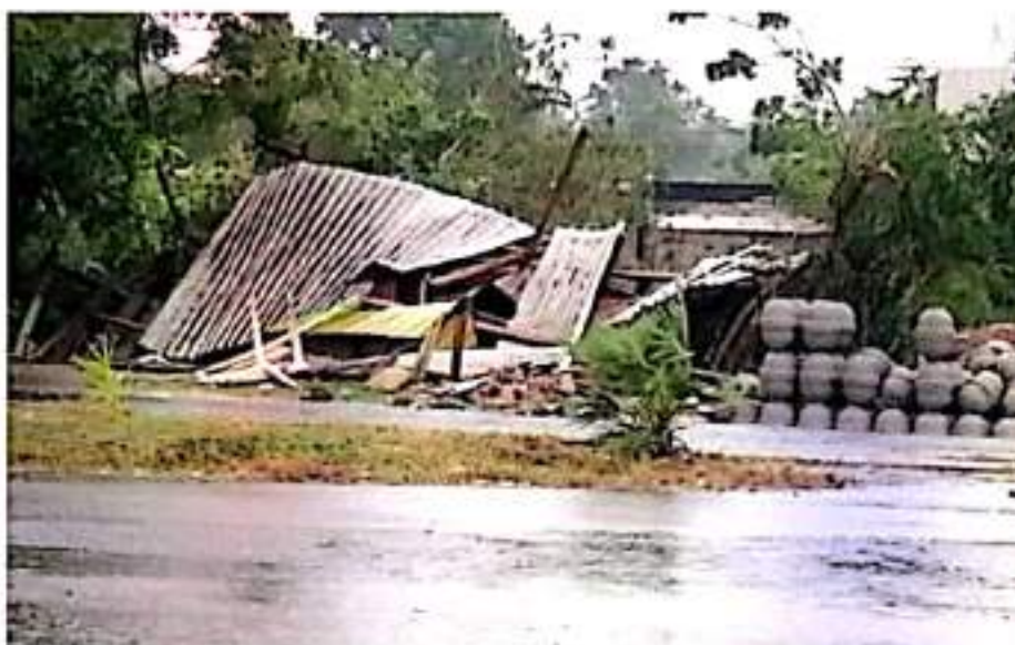
CD. LÁZARO CÁRDENAS, MICH.- La Coordinación Estatal de Protección Civil de Michoacán afirmó que hubo saldo blanco en la región, pues no hubo pérdidas humanas.

"Rick", que se convirtió en tormenta tropical, ahora se dirige al estado de Jalisco, y en Michoacán restará trabajar en el recuento de los daños y mantenerse en alerta ante otro posible fenómeno climático.