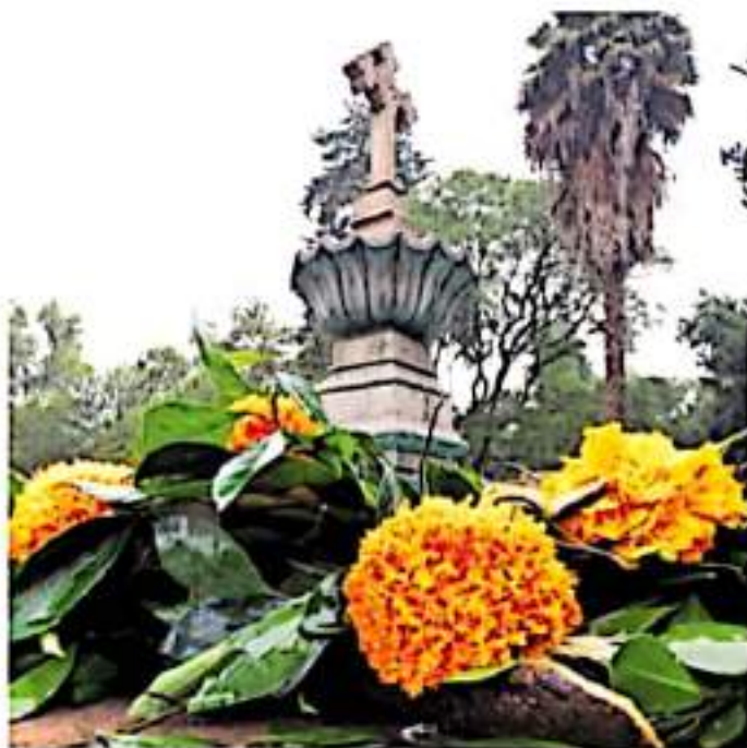
En Morelia hay 44 panteones.