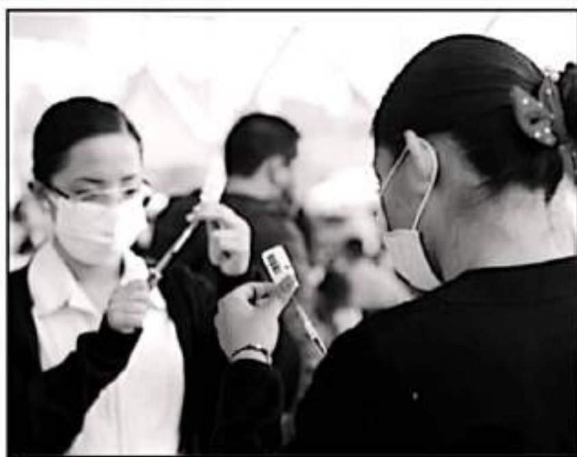
SE RÁ DURANTE LA PRIMERA SEMANA DE NOVIEMBRE CUANDO EN MORELIA SE BRINDA LA DOSIS A LOS REZAGADOS

Desde hace al menos un mes, trascendió que sólo en Morelia se tiene un estimado de más de 90 mil personas que no alcanzaron a vacunarse por diferentes motivos, principalmente ante la problemática y logística implementada.