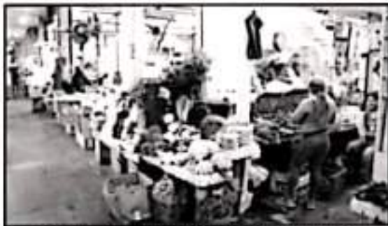
LOCATARIOS ABANDONADOS QUE SON ACOSADOS POR LOS AMBULANTES.